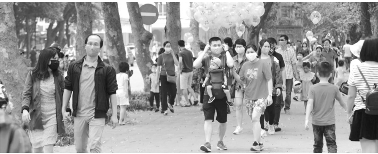
● Ảnh minh họa.

Ngành du lịch lại một lần nữa chao đảo do ảnh hưởng của dịch Covid-19. Không ít công ty lữ hành, khách sạn phá sản, nhân sự ngành du lịch thất nghiệp phải tìm công việc tạm kiếm sống.