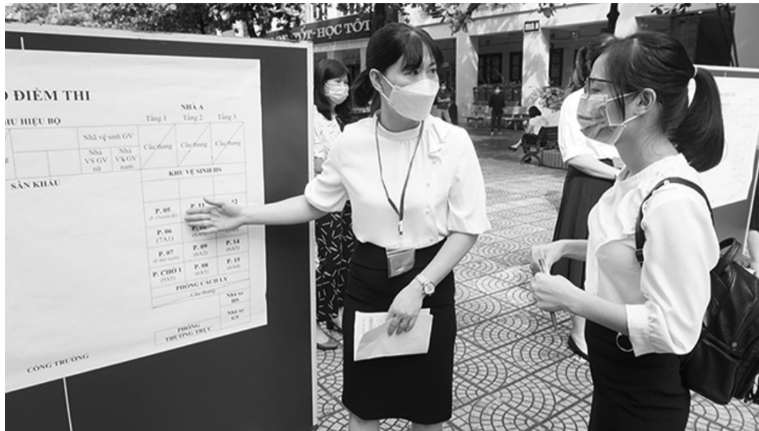
● Diễn tập hướng dẫn thí sinh vào phòng thi ở điểm thi vào lớp 10 tại Trường THCS Thái Thịnh (quận Đống Đa, Hà Nội).

Đây là kỳ thi rất nhiều áp lực với học sinh và phụ huynh Thủ đô khi chỉ trên 60% học sinh có cơ hội đỗ vào trường trung học phổ thông công lập trên địa bàn thành phố. Thí sinh cũng được khuyến cáo thực hiện nghiêm các biện pháp phòng chống dịch, hạn chế tiếp xúc với người ngoài gia đình. Cũng do dịch