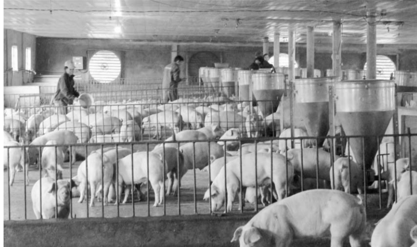
● Theo dự kiến, đến cuối quý III năm nay sẽ công bố vaccine dịch tả lợn châu Phi.

Từ hiệu quả mang lại của chính sách và thực tế sản xuất hiện nay, nhiều đại biểu ở các địa phương cho rằng, cần tiếp tục có các chính sách hỗ trợ chăn nuôi nông hộ bên cạnh phát triển chăn nuôi trang trại quy mô lớn. Theo đó, chính sách cần cụ thể và có tính