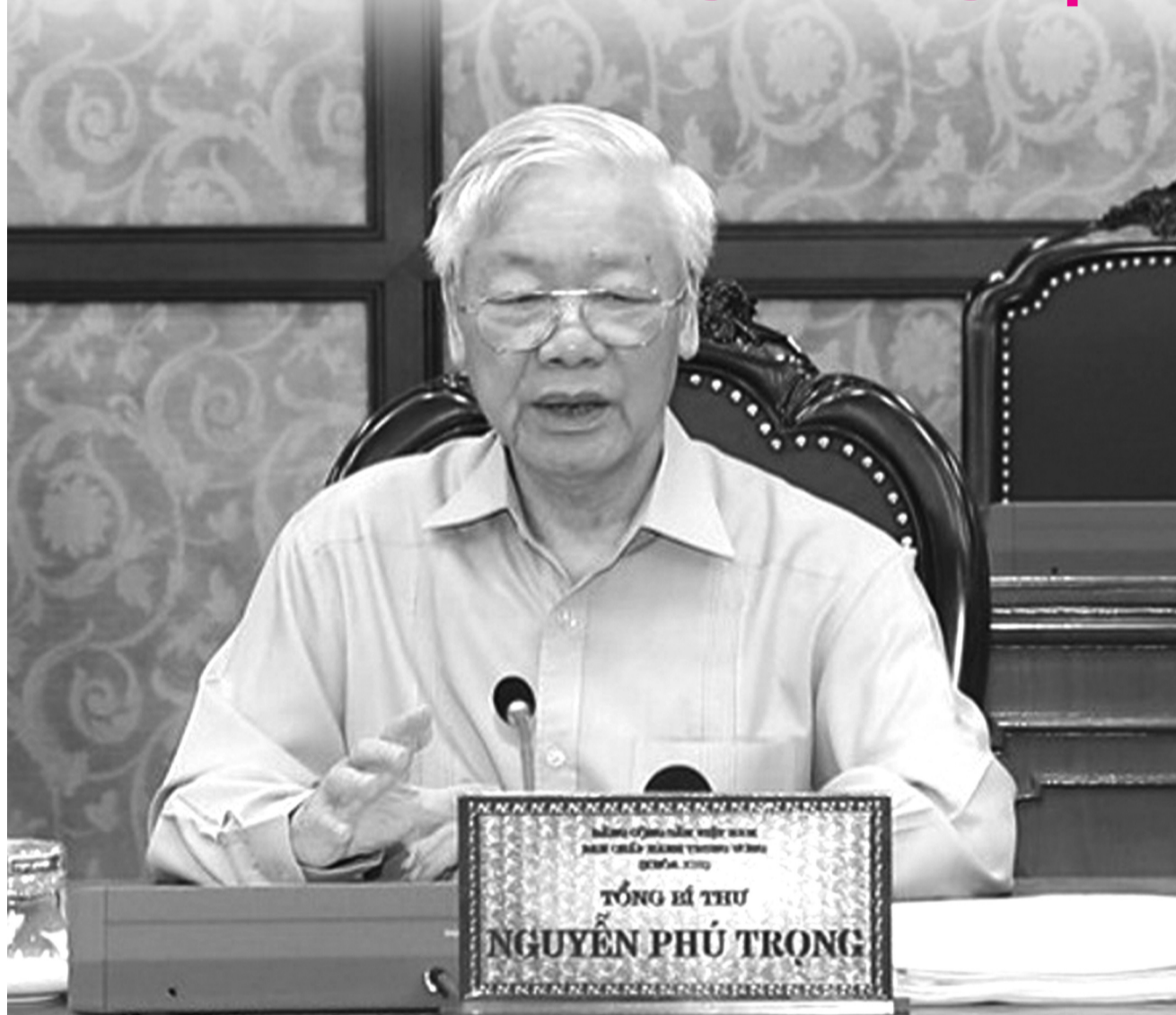
● Tổng Bí thư Nguyễn Phú Trọng phát biểu tại cuộc họp.

Tổng Bí thư Nguyễn Phú Trọng nhấn mạnh yêu cầu trên khi chủ trì cuộc họp Bộ Chính trị cho ý kiến về tình hình phòng, chống dịch Covid-19 diễn ra hôm qua (11/6).