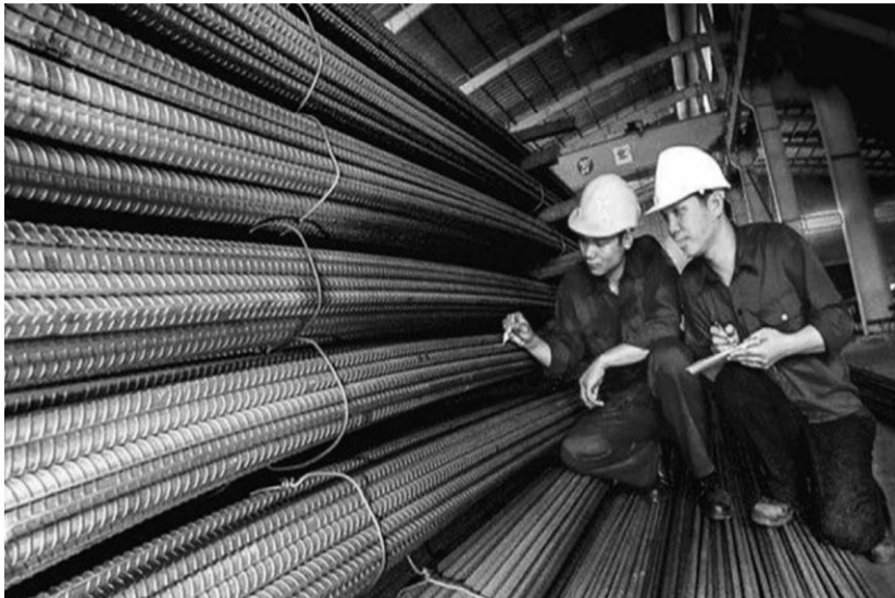
● Nhiều ý kiến cho rằng Bộ Công Thương cần xem xét lại mức thuế tự vệ đối với phôi thép và thép dài.

Nhiều doanh nghiệp (DN) cho rằng biện pháp phòng vệ thương mại (PVTM) này là một trong những nguyên nhân đẩy giá thép trong nước lên cao. Chia sẻ với PLVN, một lãnh đạo VINA-CONEXT cho rằng, muốn giải quyết vấn đề giá thép tăng cao như hiện nay cần giải quyết từ gốc rễ. Biện pháp PVTM trên của Bộ Công Thương chính là một phần gốc rễ của vấn đề. Theo vị