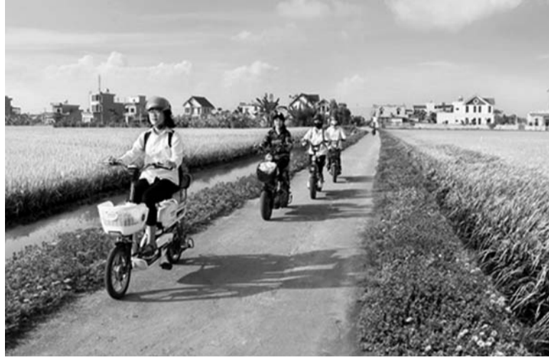
● Ảnh minh họa.

Đề tiếp tục đẩy mạnh, thực hiện có hiệu quả Chỉ thị 40 trong thời gian tới, tích cực góp phần