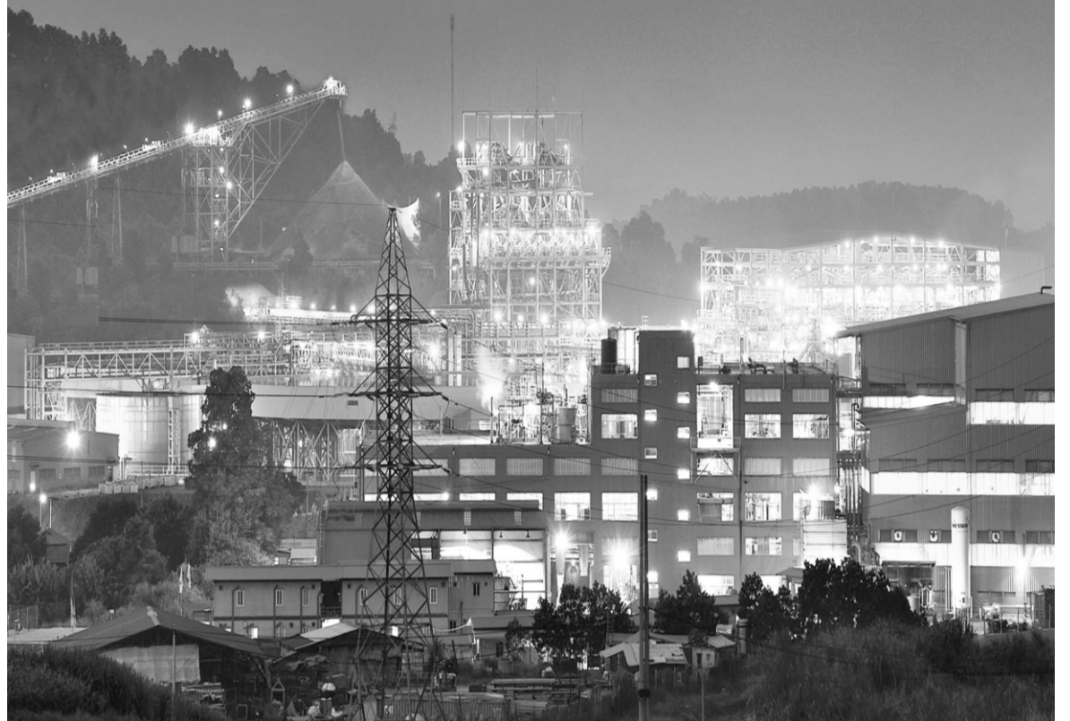
● Dây chuyền nhà máy chế biến hiện đại tại mỏ đa kim Núi Pháo - Việt Nam.

- Tại Masan High-Tech Materials ở Việt Nam, cụ thể tại mỏ Núi Pháo, nước thải được xử lý đạt quy chuẩn tại Trạm xử lý nước thải tập trung, đồng thời tăng cường tái sử dụng nguồn nước. Năm 2020, Công ty tái sử dụng gần 7,7 triệu m 3 nước thải, chiếm 75% tổng lượng nước sử dụng. Chất thải được phân loại tại nguồn thành chất thải sinh hoạt, chất thải thông thường và chất thải nguy