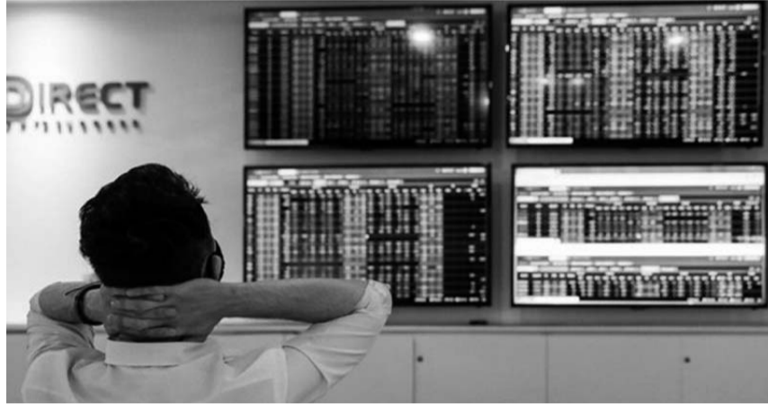
● Nhà đầu tư bức xúc trước tình trạng nghẽn lệnh trên HoSE chưa được cải thiện.