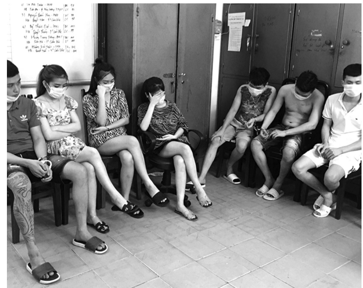
Một số đối tượng trong vụ án.