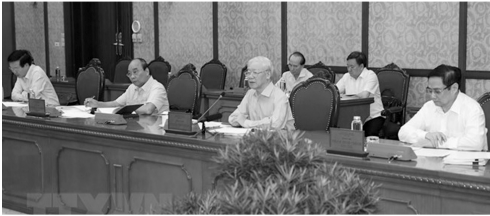
● Tổng Bí thư Nguyễn Phú Trọng phát biểu tại cuộc họp.

Sau khi nghe Ban Cán sự Đảng Chính phủ báo cáo về tình hình dịch Covid-19, nhiệm vụ, giải pháp trong thời gian tới và ý kiến của đại diện các cơ quan liên quan, Tổng Bí thư Nguyễn Phú Trọng nêu rõ, kể từ đầu năm 2020, khi xảy ra dịch Covid-19 đến nay, lãnh đạo Đảng, Nhà nước, Ban Chỉ đạo Quốc gia phòng, chống dịch Covid-19 đã chủ động chỉ đạo sát sao, quyết liệt, huy động cả hệ thống chính trị vào cuộc và thực hiện các biện pháp mạnh mẽ, tích cực để ngăn chặn dịch bệnh. Trước diễn biến dịch Covid-19 có mức độ