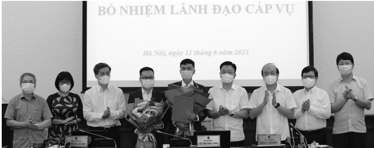
● Lãnh đạo Bộ Tư pháp chúc mừng 2 Phó Tổng Biên tập vừa được bổ nhiệm.