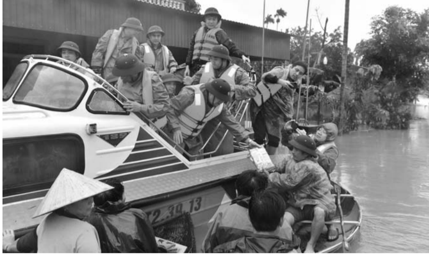
● Ảnh minh họa.

Thiết bị phục vụ chỉ đạo điều hành tại cơ quan, đơn vị được quy định gồm: Thiết bị thu ảnh mây vệ tinh phục vụ phân tích thiên tai; thiết bị thu và vẽ bản đồ thời tiết, thiên tai;