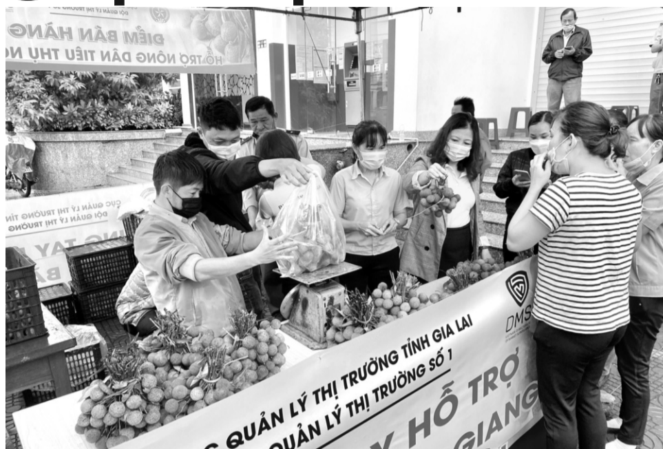
● Chiến dịch tiêu thụ vải thiều lớn xuất hiện ngay trong cao điểm dịch Covid-19.

“Ngay từ đầu năm 2021, Cục XTTM đã trao đổi các thông tin liên quan đến tình hình năng suất mùa vụ để nắm rõ số lượng, sản lượng tiêu thụ. Đặc biệt năm nay có sự vào cuộc của rất nhiều đơn vị trong Bộ như Vụ Thị trường trong nước, Cục Thương mại điện tử (TMĐT) và Kinh tế số, kể cả lực lượng quản lý thị trường nữa. Chúng tôi chuẩn bị cả một chuỗi các