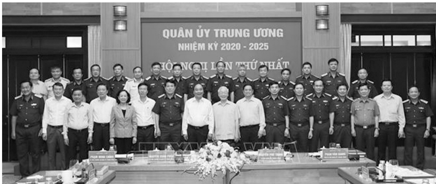
● Các đại biểu dự Hội nghị.

Phát biểu tại Hội nghị, Tổng Bí thư Nguyễn Phú Trọng khẳng định, trong nhiệm kỳ 2015-2020, QUTU luôn gương mẫu, đoàn kết, thống nhất, giữ vững nguyên tắc, có nhiều đổi mới, sáng tạo, quyết tâm cao, tập trung lãnh đạo, chỉ đạo toàn quân thực hiện thắng lợi Nghị quyết Đại hội Đảng bộ Quân đội lần thứ X và các mục tiêu, chủ trương lớn về quân sự, quốc phòng mà Đại hội lần thứ XII của Đảng đã đề ra với nhiều thành tựu nổi bật. Cụ thể, QUTU đã thực hiện tốt chức năng tham mưu với Đảng, Nhà nước về quân