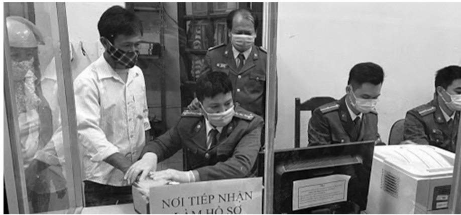
● Lực lượng công an tích cực làm căn cước công dân gắn chip cho người dân.

Thủ tướng Chính phủ cũng giao Bộ Tư pháp chủ trì đẩy nhanh tiến độ xây dựng Cơ sở dữ liệu về hộ tịch, kết nối với CSDLQG về dân cư; chủ trì phối hợp với Bộ Công an, các bộ, địa phương