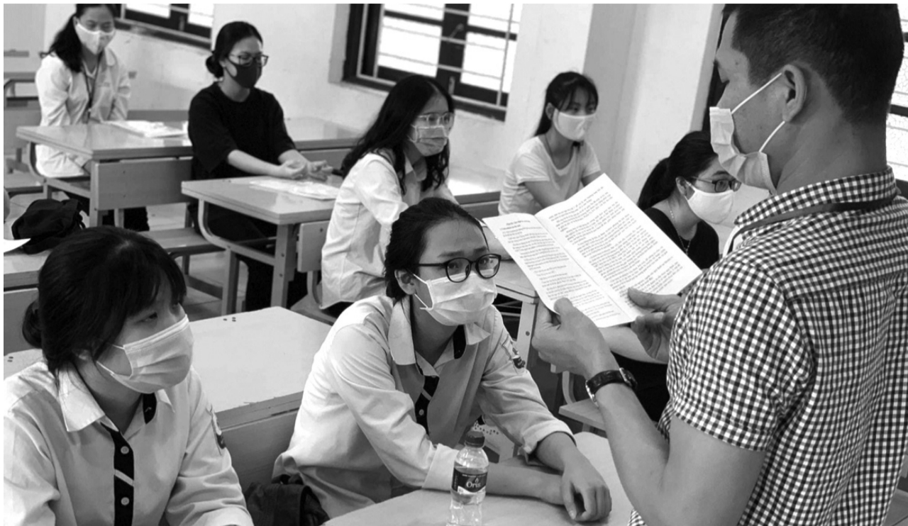
● Sẽ không có “điểm mờ”, “khoảng trống” trong thanh tra thi. (Ảnh minh họa)

Theo kế hoạch, kỳ thi tốt nghiệp trung học phổ thông năm 2021 sẽ diễn ra từ ngày 6-9/7. Hiện các địa phương rất ráo chuẩn bị cho kỳ thi.