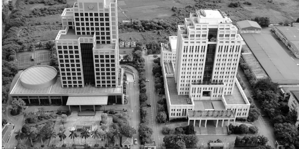
● Trụ sở mới của Bộ Nội vụ và Bộ Tài nguyên và Môi trường.

Hiện, nhiều đơn vị sau khi đã chuyển đến địa chỉ mới nhưng vẫn “ôm” đất ở trụ sở cũ, không chịu “nhả” lại cho Hà Nội để thực hiện các công trình công cộng, cây xanh theo tinh thần chỉ đạo của Chính phủ. Cụ thể, trong 9 cơ quan đã được bố trí đất, chuyển trụ sở (gồm các Bộ: Công an, Ngoại giao, Nội vụ, Tài nguyên và môi trường (TN&MT), Khoa học và Công nghệ, Viện kiểm sát nhân dân Tối cao, Tòa án nhân dân Tối cao, Thanh tra Chính phủ, Ủy ban Dân tộc) thì 7 đơn vị vẫn tiếp tục giữ trụ sở cũ, trong đó có các Bộ: TN&MT, Khoa học và Công nghệ... Bộ Nội vụ đã