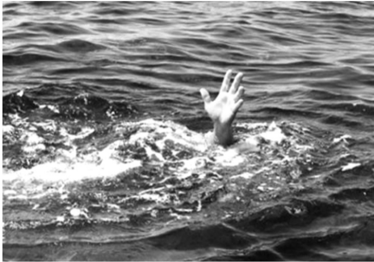
● Ảnh minh họa.

Về vấn đề này, theo quan điểm của ông Đặng Hoa Nam thì các gia đình không thể chỉ coi việc cho trẻ đi học bơi là mấu chốt giải quyết mọi vấn đề liên quan đến đuối nước ở trẻ. “Đối với trẻ, biết bơi chỉ là điều kiện đủ để trẻ tự bảo vệ bản thân. Trẻ cần phải có kỹ năng an toàn trong môi trường nước như khi đang bơi bị chuột rút thì phải làm gì. Nhiều trẻ dù biết bơi, bơi quen ở một số khu vực nhưng vẫn bị đuối nước.