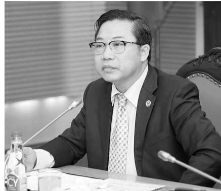
● Đại biểu Quốc hội Lưu Bình Nhưỡng.