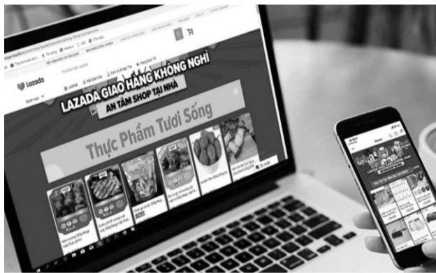
● Từ 1/8/2021, sàn thương mại điện tử sẽ phải khai, nộp thuế thay cho người bán.

Từ 1/8/2021, theo Thông tư 40/2021/TT-BTC của Bộ Tài chính, các tổ chức là chủ sở hữu sàn giao dịch thương mại điện tử sẽ thực hiện việc khai thuế thay, nộp thuế thay cho cá nhân theo lộ trình của cơ quan thuế.