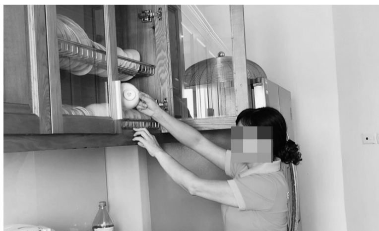
● Ảnh minh họa.

Việt Nam là một trong số ít các quốc gia trong khu vực đưa lao động giúp việc gia đình vào phạm vi điều chỉnh của pháp luật lao động. Bộ luật Lao động 2019 và Nghị định số 145/2020/NĐ-CP đi kèm quy định lao động gia đình phải có hợp đồng bằng văn bản, đáp ứng