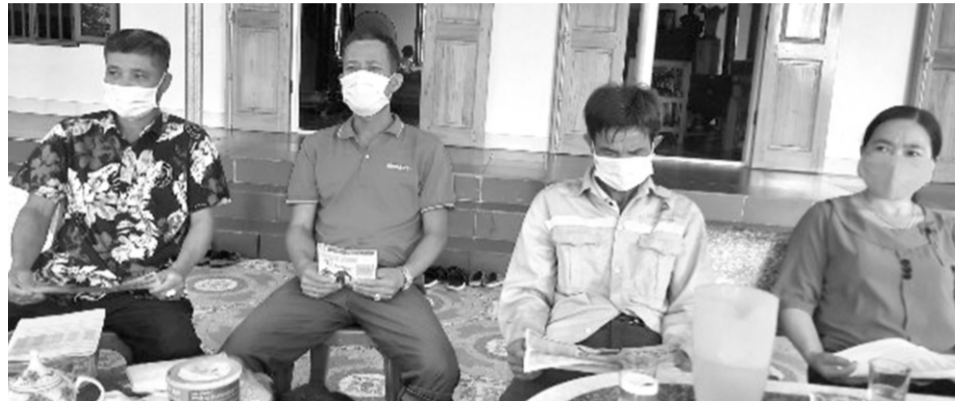
● Người dân Yên Tập trong buổi tuyên truyền về bảo hiểm xã hội tự nguyện.

Công tác phát triển đối tượng tham gia bảo hiểm xã hội tự nguyện tại xã Yên Tập (huyện Cẩm Khê, tỉnh Phú Thọ) đã có bước nhảy vọt trong 2 năm qua. Kinh nghiệm phối hợp giữa cơ quan bảo hiểm xã hội - lãnh đạo xã - nhân viên đại lý thu là mô hình quý cho các địa phương khác áp dụng