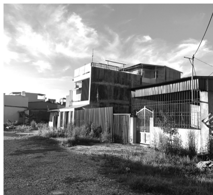
● Công trình xây dựng trái phép trong khu vực cưỡng chế.

Một lần nữa, tôi mong người dân cần bình tĩnh, tỉnh táo không để bị xúi giục, kích động gây mất an ninh trật tự; chấp hành nghiêm các chủ trương, kế hoạch của TP và của UBND quận Hải An trong việc giải quyết, xử lý các tồn tại trên khu đất. Chính quyền địa phương đề nghị người dân tự giác tháo dỡ, di chuyển tài sản, vật nuôi, bàn giao diện tích đất đã vi phạm để tránh bị thiệt hại khi cưỡng chế.