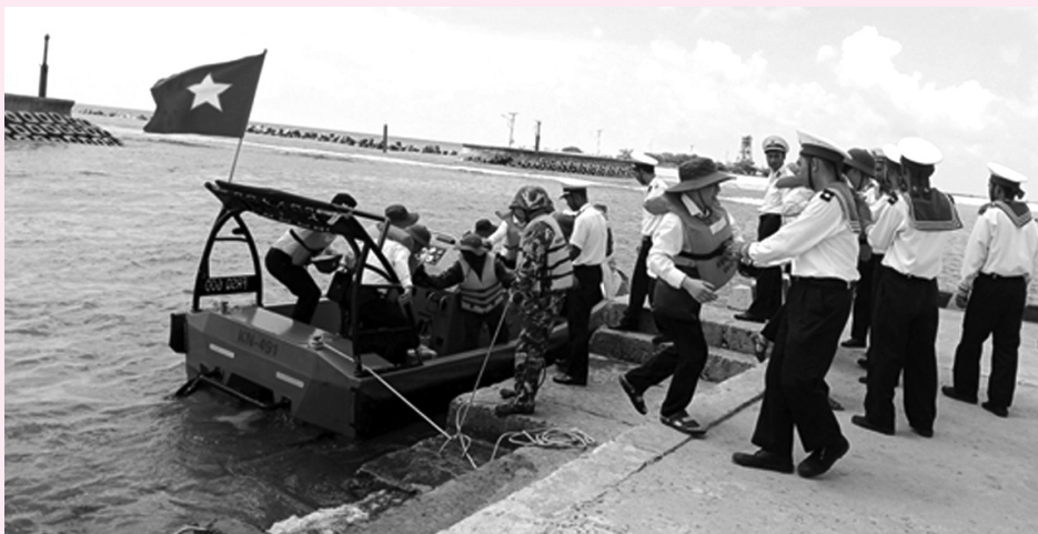
● Những tình cảm nóng ấm của cán bộ, chiến sĩ huyện đảo Trường Sa khi đón Đoàn công tác.