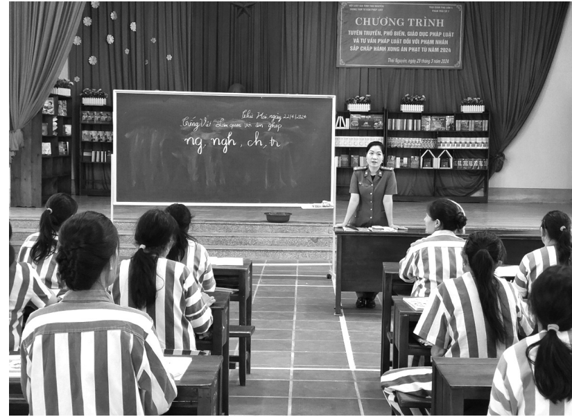
● Lớp học xóa mù chữ tại Trại giam Phú Sơn 4.

Ban đầu, vì không đủ chiều cao nên chị bị loại ở vòng sơ tuyển khi thi vào ngành Công an. Sau đó, chị thi đậu vào Trường Đại học Sư phạm Thái Nguyên, dạy học ở một trường trung học cơ sở tại huyện Đại Từ. Năm 2007, một lần đi chơi với một người bạn vào thăm anh trai đang cải tạo tại Trại giam Phú Sơn 4, cô gái xao xuyến với một sĩ quan công an công tác tại đây. Hai người thư từ, nhắn tin qua lại rồi nên duyên vợ chồng vào 2009. Chồng chị quê Thái Bình, công tác tại Phân trại số 4 từ 2005 đến 2015 thì chuyển về Phân trại số 2.