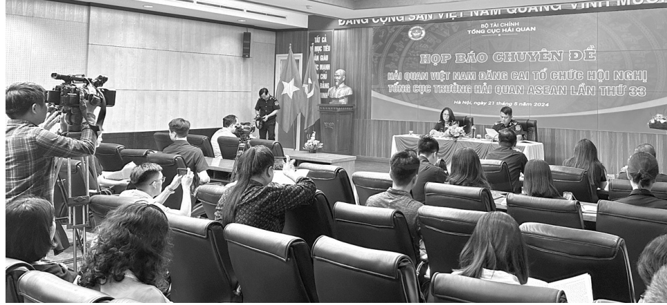
● Quang cảnh buổi họp báo.

Bên cạnh đó, Hội nghị cũng là diễn đàn để Hải quan ASEAN tăng cường đối thoại, tham vấn với các đối tác đối thoại của ASEAN nhằm thực hiện các mục tiêu phù hợp với tình hình phát triển kinh tế trong