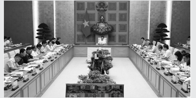
● Các ý kiến tại cuộc họp đã trao đổi, thống nhất phương án tiếp thu, chỉnh sửa, bổ sung ở những điều, khoản, mục cụ thể trong dự thảo Nghị định bảo đảm chặt chẽ, thông suốt, khả thi.