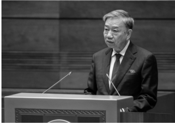
● Đại tướng Tô Lâm, Ủy viên Bộ Chính trị, Bộ trưởng Bộ Công an được Trung ương giới thiệu để Quốc hội khóa XV bầu giữ chức Chủ tịch nước.

Liên quan đến công tác nhân sự, đầu phiên họp chiều 21/5, với 468/469 đại biểu QH tham gia biểu quyết tán thành, QH đã thông qua việc điều chỉnh chương trình Kỳ họp thứ 7, QH khóa XV. Theo đó, QH nhất trí bổ sung chương trình Kỳ họp nội dung phê chuẩn đề nghị của Thủ tướng về việc miễn nhiệm chức vụ Bộ trưởng Bộ Công an; bố trí QH tiến hành nội dung này cùng với nội dung về công tác nhân sự tại phiên họp chiều 21/5 và sáng 22/5.