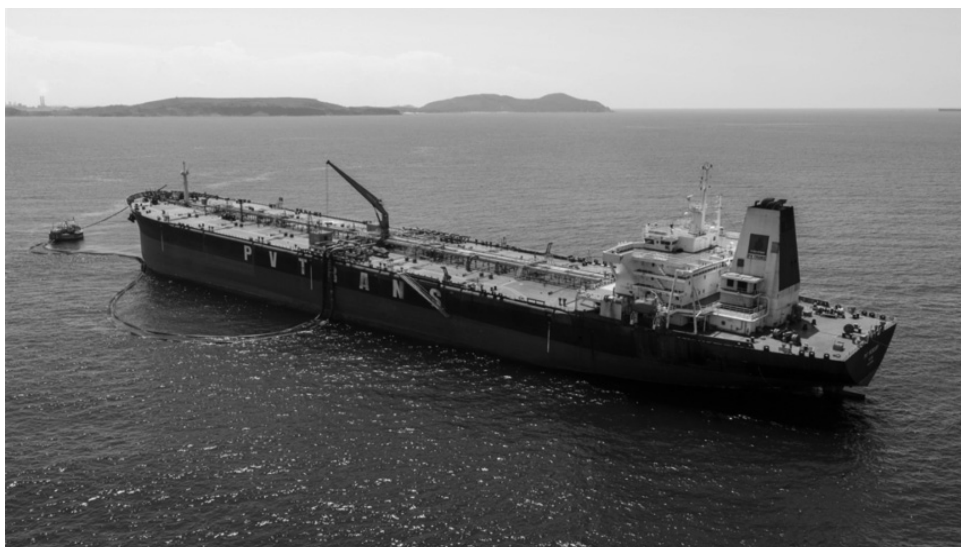
● Tàu nhập dầu thô VGO của BSR.

Nhà máy lọc dầu (NMLD) Dung Quất được thiết kế để vận hành 100% dầu thô từ mỏ Bạch Hổ. Tuy nhiên, trữ lượng và sản lượng của mỏ này ngày càng sụt giảm, không đáp ứng đủ nhu cầu của Nhà máy. Đứng trước thách thức này, giới chuyên gia đã cải tiến công nghệ, nhập thêm loại nguyên liệu mới để Nhà máy chạy công suất lên tới hơn 111%.