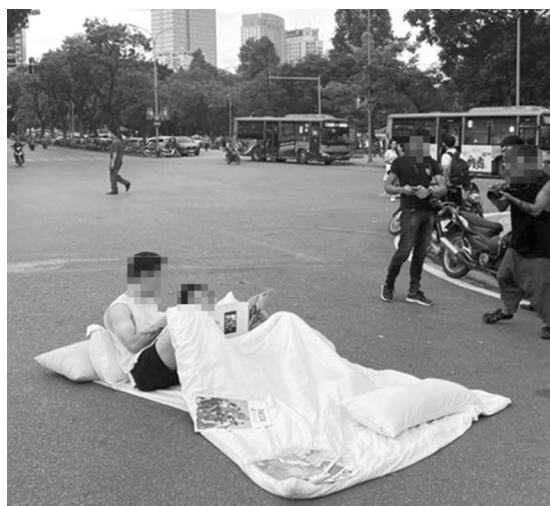
● Tập yoga, chụp ảnh cưới ngay giữa lòng đường. (Ảnh minh họa)

Những ngày vừa qua, trên một số Fanpage mạng xã hội Facebook xuất hiện hình ảnh một nhóm phụ nữ mặc áo sát nách và quần bó nhiều màu sắc, nằm trên những chiếc thảm ở giữa đường trong tư thế tập yoga. Điều đáng nói là nơi nhóm phụ nữ này “biểu diễn” được xác định là ở giữa đường nhánh QL37 trên địa bàn TT Thanh Nê, huyện Kiến Xương, tỉnh Thái Bình, xung quanh ô tô, xe máy vẫn đang di chuyển. Được biết, ngày 18/5/2024, Công an thị trấn Kiến Xương đã mời nhóm người trên lên trụ sở Công an thị trấn để làm việc và lập biên bản vụ việc. Chủ tịch UBND thị trấn Kiến Xương đã ra quyết định xử phạt vi phạm hành chính đối với 14 người trong số trên về hành vi tập trung đông người trái phép, nằm, ngồi trên đường bộ gây cản