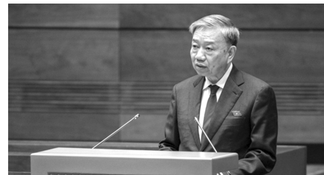
● Đại tướng Tô Lâm, Ủy viên Bộ Chính trị, Bộ trưởng Bộ Công an được Trung ương giới thiệu để Quốc hội khóa XV bầu giữ chức Chủ tịch nước.

Chiều 21/5, tiếp tục quy trình nhân sự, Ủy ban Thường vụ Quốc hội trình Quốc hội danh sách đề cử để Quốc hội bầu Chủ tịch nước. Chiều cùng ngày, Quốc hội thảo luận tại Đoàn về danh sách đề cử để Quốc hội bầu Chủ tịch nước.