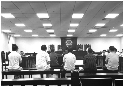
● Dự kiến tòa tuyên án trong hôm nay (22/5).

trước dịp 1/5/2016 và khoảng 1,3 tỷ đồng cho Thuận. Tuy nhiên, Hải khai không có việc đưa tiền trên. Do không có tài liệu chứng minh nên lời khai này của Thành là không có căn cứ.