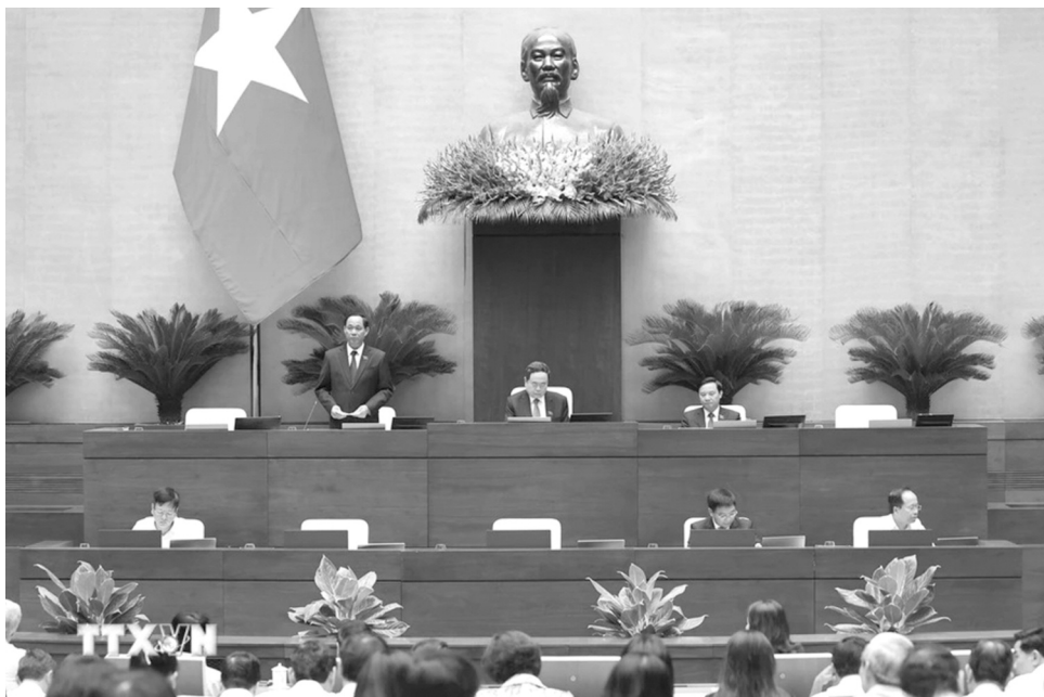
● Phó Chủ tịch Quốc hội Trần Quang Phương điều hành nội dung cuộc họp sáng 21/5.

Theo quan điểm của Đại biểu, mô hình này mang lại nhiều lợi ích cho xã hội, vì nó