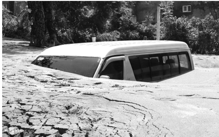
● Một ô tô bị cát vùi lấp.

Cách đó khoảng 8km, tại đoạn trước nhà hàng VietnamHome trên đường Nguyễn Đình Chiểu (phường Hàm Tiến), cát tràn xuống trên một đoạn dài hơn 300m. Lớp cát dày hơn nửa mét, đặc quánh bùn đỏ dính cứng trên đường, gây ách tắc giao thông trong khu vực. Hai xe tải và một ô tô bị cát vùi, dính bánh tại chỗ, không thể di chuyển. Một nhà dân ven đường bị cát tràn vào, vùi lấp 10 xe máy, song trong nhà vắng người nên không xảy ra thương vong. UBND TP Phan Thiết, Sở GTVT đã điều các phương tiện đến hiện trường dọn dẹp.