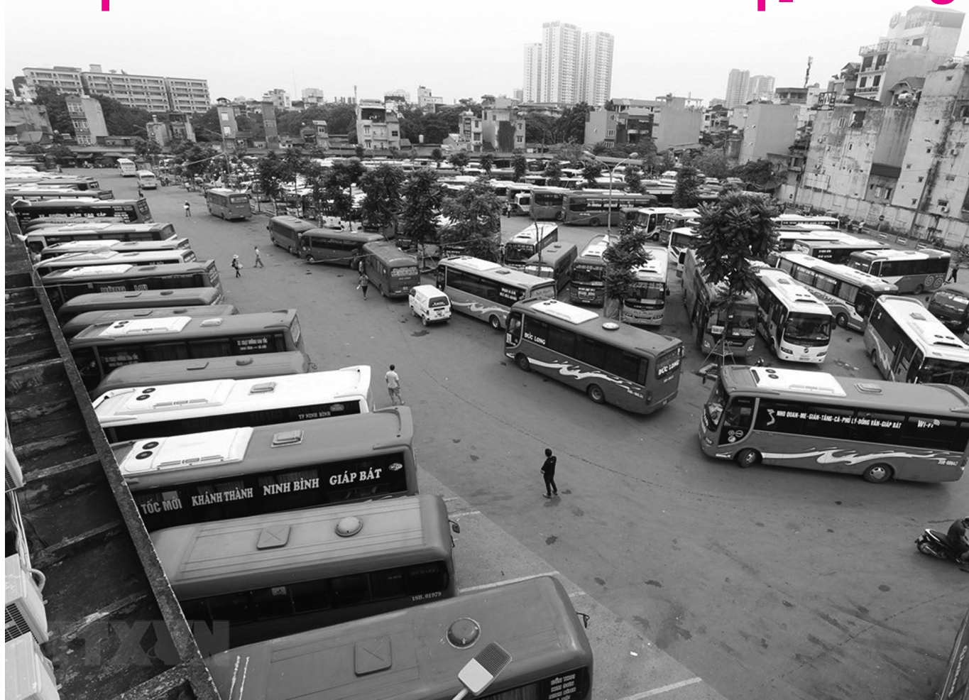
● Ảnh minh họa: VGP/Vinh Hoàng