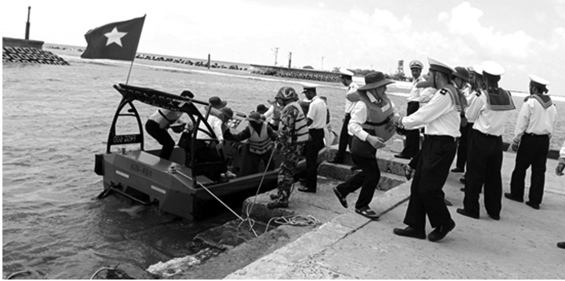
● Những tình cảm nồng ấm của cán bộ, chiến sĩ huyện đảo Trường Sa khi đón Đoàn công tác.