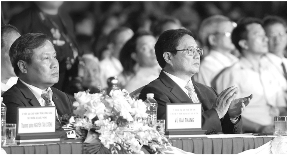
● Thủ tướng Phạm Minh Chính dự Lễ kỷ niệm 420 năm hình thành tỉnh Quảng Bình; 75 năm ngày Quảng Bình quật khởi và 35 năm ngày tái lập tỉnh.

Ngày 2/6, trong chương trình công tác tại Quảng Bình tham dự Lễ kỷ niệm 420 năm hình thành tỉnh Quảng Bình, 75 năm ngày Quảng Bình quật khởi và 35 năm ngày tái lập tỉnh, Thủ tướng Phạm Minh Chính đã kiểm tra, khảo sát, động viên, đôn đốc các lực lượng đang thi công trên công trường các công trình, dự án hạ tầng kinh tế - xã hội trên địa bàn tỉnh Quảng Bình.