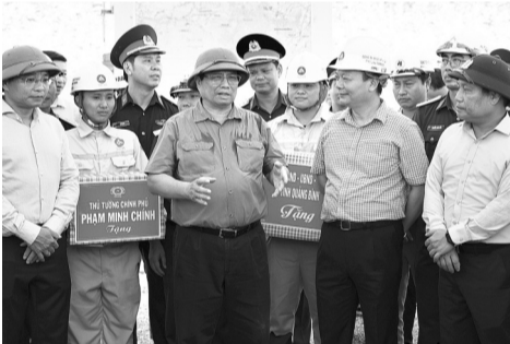
● Thủ tướng Phạm Minh Chính giao nhiệm vụ cho các đơn vị thi công dự án Đường bộ cao tốc Bắc - Nam phía Đông, đoạn qua tỉnh Quảng Bình.

Dâng hương tưởng niệm Đại tướng Võ Nguyên Giáp, Thủ tướng Phạm Minh Chính cùng các đại biểu bày tỏ lòng thành kính trước anh linh của Đại tướng Võ Nguyên Giáp, vị tướng huyền thoại của dân tộc, người học trò xuất sắc, gần gũi của Chủ tịch Hồ Chí Minh, người Anh cả của Quân đội nhân dân Việt Nam, người con ưu tú của quê hương Quảng Bình và cùng tri ân, tưởng nhớ công lao to lớn của Đại tướng đối với sự nghiệp cách mạng vẻ vang của Đảng và dân tộc ta.