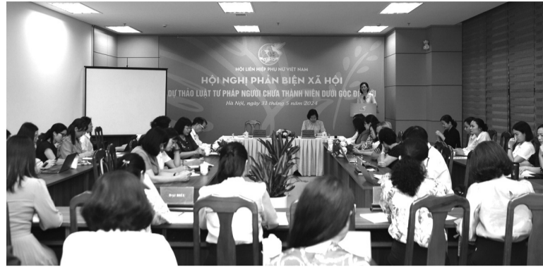
● Hội LHPN Việt Nam đã tổ chức hội nghị phản biện xã hội dưới góc độ giới với dự thảo Luật Tư pháp người chưa thành niên. (Nguồn: PV)

cấp tài sản (18,9%); Tội gây rối trật tự công cộng (15,38%)... Tuy nhiên, đa số phạm tội lần đầu (chiếm 98,66%); tỷ lệ tái phạm là 1,28%; tái phạm nguy hiểm chiếm tỷ lệ thấp (0,06%).