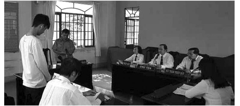
● Một phiên tòa thân thiện dành cho người chưa thành niên được VKSND quận 8, TP HCM phối hợp với TAND quận 8 tổ chức xét xử vụ án trộm cắp tài sản với bị cáo chưa đủ 18 tuổi. (Ảnh minh họa)

“Cần rà soát bổ sung, nhấn mạnh rằng tư pháp người chưa thành niên quan tâm bảo vệ quyền con người, nhân phẩm con người, nghiêm cấm kỳ thị, không phân biệt đối xử, đặc biệt là phân biệt đối xử theo giới. Các dịch vụ hỗ trợ tư pháp người chưa thành niên cần đáp ứng nhu cầu giới và người thực hiện bảo vệ tư pháp người chưa thành niên, đặc biệt là nhu cầu giới thực tế, nhu cầu giới chiến lược. Đặc biệt là cần thúc đẩy vai trò, trách nhiệm của nhà