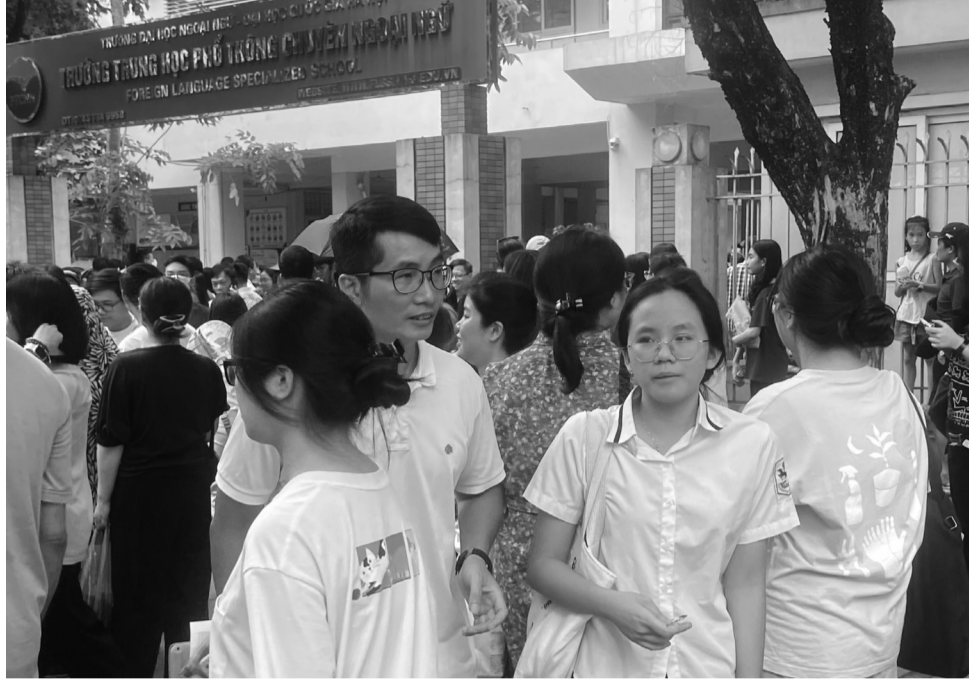
● Phụ huynh "chạy số" cùng học sinh đến các điểm thi lớp 10 chuyên ở Hà Nội trong 2 ngày 1 - 2/6.