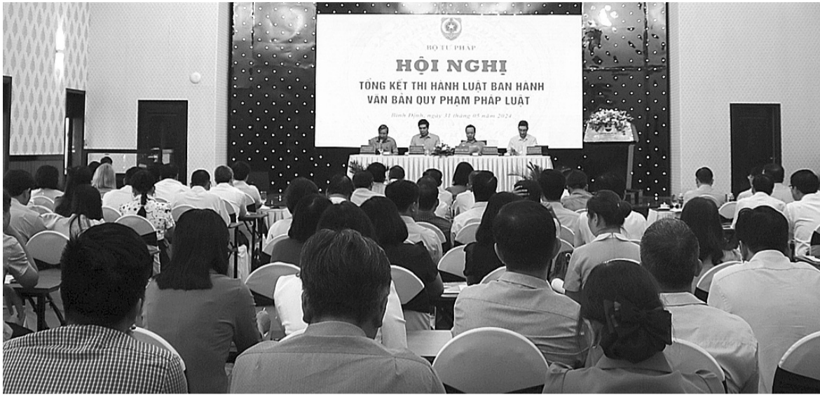
● Quá trình triển khai thi hành Luật Ban hành VBQPPL cho thấy, Luật cần được nghiên cứu sửa đổi để đáp ứng các yêu cầu phát sinh từ thực tiễn.