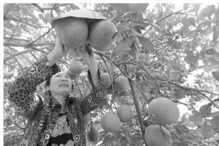
● Nhiều chủ nhà vườn nâng cao hiệu quả sản xuất do được tiếp cận nguồn vốn vay ưu đãi của NHCSXH.

Hiện nay, Hưng Yên chỉ còn 0,86% tỷ lệ hộ nghèo và cũng là một trong 3 địa phương đầu tiên của cả nước về đích nông thôn mới, đặc biệt có 108 xã đạt nông thôn mới nâng cao; 34 xã đạt nông thôn mới. Thành quả đó có sự đóng góp thiết thực, hiệu quả của NHCSXH trên địa bàn đã nỗ lực thực hiện tốt Chỉ thị 40 trong công tác huy động các nguồn lực, truyền tải đầy đủ, kịp thời nguồn vốn tín dụng chính sách của Nhà nước đến đúng đối tượng thụ hưởng, giúp dân xóa nhanh hết nghèo khó, làm giàu chính đáng tại đồng đất quê nhà.