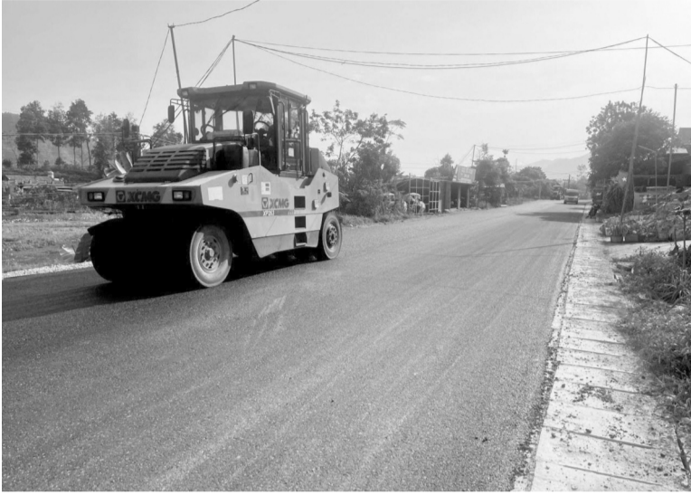
● Dự án nâng cấp, mở rộng tuyến đường từ Km 31 (Quốc lộ 3) đến di tích ATK Định Hóa góp phần phát triển du lịch, thúc đẩy chuyển dịch cơ cấu kinh tế, phát triển kinh tế xã hội cho các xã vùng ATK Định Hóa. (Ảnh trong bài: Lê Hanh)

Công tác thống kê GPMB: Tổng chiều dài tuyến là 12.368,5 km đi qua địa phận 02 xã Phú Đình (7 xóm) và xã Diễm Mặc (04 xóm). Trong đó, tổng diện tích đất dự kiến thu hồi của toàn