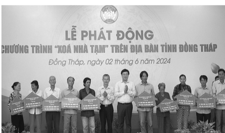
●Lãnh đạo tỉnh Đồng Tháp trao kinh phí xây nhà đại đoàn kết cho các hộ dân xã Long Khánh A, huyện Hồng Ngự.