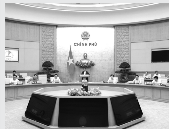
● Quang cảnh phiên họp.