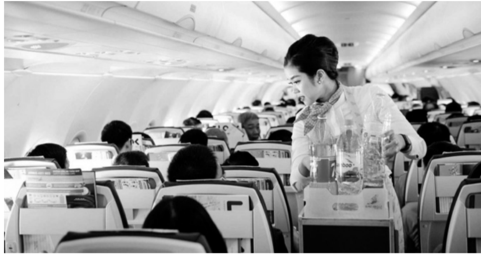
● Cục Hàng không Việt Nam có trách nhiệm thẩm định phương án giá, báo cáo Bộ GTVT ban hành văn bản định giá các dịch vụ.

Dịch vụ hàng không được định khung giá: Dịch vụ cho thuê sân đậu tàu bay; Dịch vụ cho thuê quầy làm thủ tục hành khách; Dịch vụ cho thuê băng chuyền hành lý; Dịch vụ cho thuê cầu dẫn khách lên, xuống máy bay; Dịch vụ phục vụ kỹ thuật thương mại mặt đất trọn gói tại các cảng