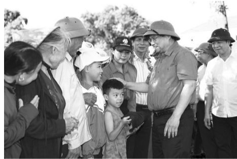
● Thủ tướng Phạm Minh Chính với người dân xã Mỹ Thủy, huyện Lệ Thủy.

Chiều cùng ngày, Thủ tướng Phạm Minh Chính khảo sát dự án đường ven biển và cầu Nhật Lệ 3 - là 2 dự án trọng điểm của tỉnh Quảng Bình. Đánh giá cao việc Quảng Bình đổi mới tư duy trong phát triển hạ tầng, vừa tăng kết nối phục vụ phát triển kinh tế - xã hội, bảo đảm an ninh, quốc phòng, vừa tạo ra không gian phát triển mới, Thủ tướng Phạm Minh Chính lưu ý tỉnh phải làm tốt công tác giải phóng mặt bằng, tái định cư cho người dân, với nguyên tắc bảo đảm lợi ích hợp pháp, chính đáng của người dân, bảo đảm sinh kế và phải bảo đảm nơi ở mới của người dân tốt hơn, ít nhất là bằng nơi ở cũ.