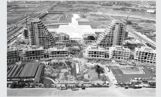
● Dự án Trung tâm Chính trị - Hành chính thành phố Hải Phòng.