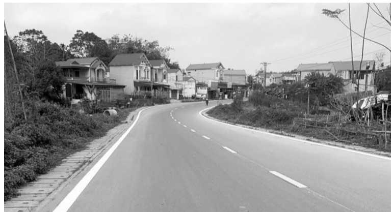
● Dự án do Ban Quản lý dự án đầu tư xây dựng các công trình giao thông tỉnh Thái Nguyên làm chủ đầu tư.

Hiện tại đối với khu đất này địa phương và các phòng ban chuyên môn đã rà soát, xác định nguồn gốc sử dụng đất của các hộ dân có đủ điều kiện được bồi thường hỗ trợ theo quy định và đã có quyết định phê duyệt số 6491/QĐ/UBND phương án bồi