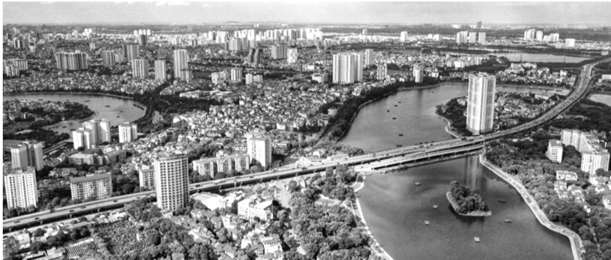
● Định hướng phát triển không gian của Thủ đô Hà Nội là phát triển mạng lưới đa trung tâm theo mô hình đa cực.

Tại phiên họp toàn thể của Ủy ban Kinh tế của Quốc hội, cho ý kiến về Quy hoạch Thủ đô Hà Nội thời kỳ 2021 - 2030, tầm nhìn đến năm 2050 (Quy hoạch Thủ đô) và Đồ án điều chỉnh Quy hoạch chung Thủ đô đến năm 2045, tầm nhìn 2065 (Đồ án điều chỉnh Quy hoạch chung Thủ đô) mới đây, một số ý kiến đề nghị làm rõ nguồn lực để thực hiện mục tiêu quy hoạch, đề xuất cơ chế đặc thù phát triển để bảo đảm tính khả thi.