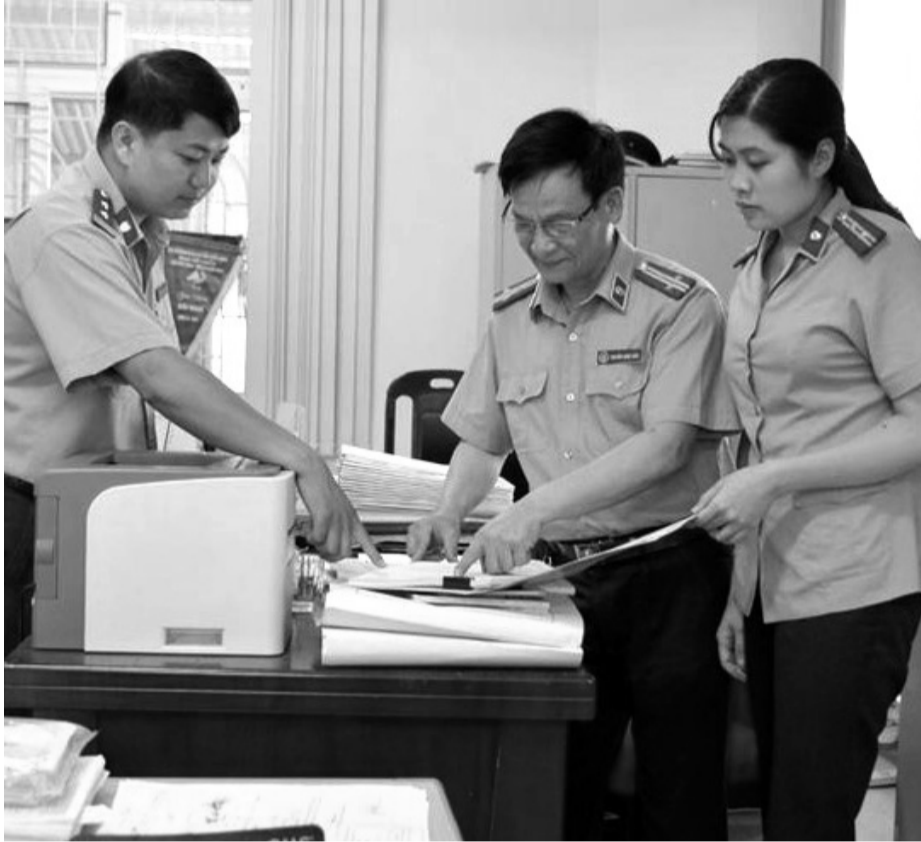
● Trao đổi nghiệp vụ thi hành án dân sự. (Ảnh minh họa - THADS)

Bên cạnh đó, công tác phối hợp giữa cơ quan THADS và các cơ quan, ban, ngành liên quan trong quá trình xử lý tài sản bảo đảm chưa kịp thời, có vụ việc còn chậm. Một số cơ quan, ban, ngành ở địa phương chưa nhận thức sâu