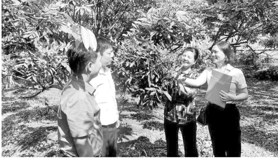
● Cán bộ tín dụng NHCSXH thăm hộ vay vốn làm vườn giỏi ở huyện Văn Giang.

Hết thảy nguồn vốn lớn gần 4.400 tỷ đồng đó từ Trung ương chuyển về, do hệ thống NHCSXH tỉnh tự huy động và nguồn vốn ngân sách của địa phương ưu