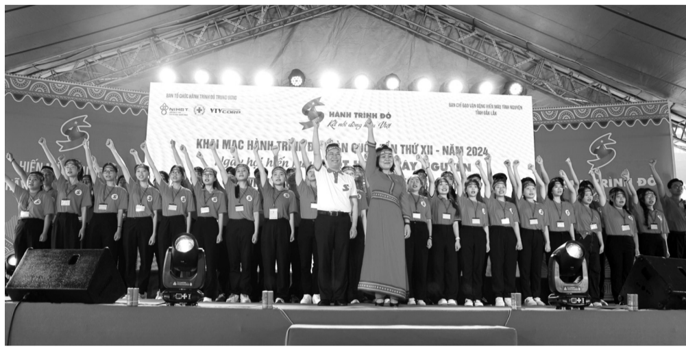
● Nghi thức hô khẩu hiệu truyền thống của Hành trình đò, khởi động chương trình.

Năm 2024, Hành trình Đò phấn đấu tuyên truyền và tư vấn cho 1 triệu lượt