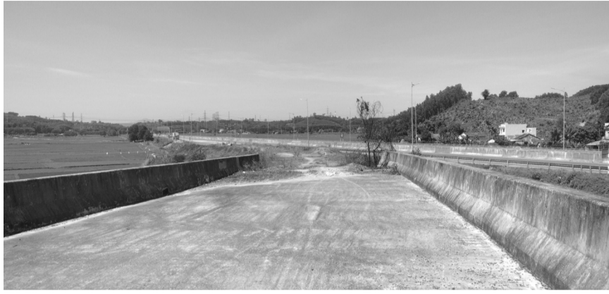
●Hiện trạng nút giao đã dừng thi công từ lâu, hiện vẫn chưa khớp nối.

Từ 2018, tuyến cao tốc Đà Nẵng - Quảng Ngãi đã hoàn thành đưa vào sử dụng, tuy nhiên nút giao Dung Quất - Trì Bình kết nối từ Khu kinh tế (KKT) Dung Quất với tuyến cao tốc này vẫn dở dang hơn 5 năm qua.