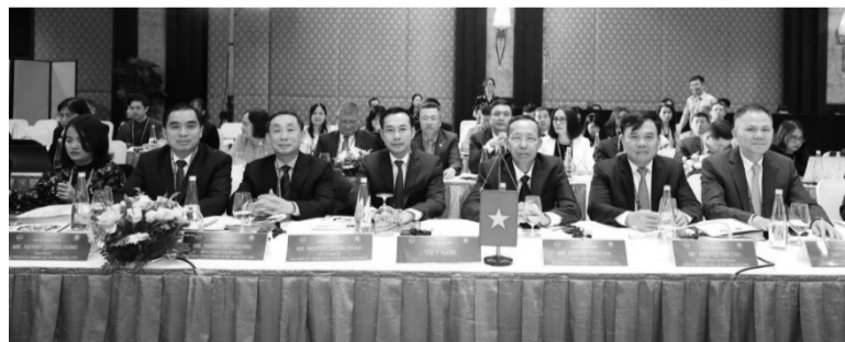
● Các đại biểu tham dự Hội nghị Tổng cục trưởng Hải quan ASEAN lần thứ 33.

thành quả của Hội nghị lần thứ 32 tổ chức tại Thái Lan. Các nội dung chính bao gồm Danh mục biểu thuế chung ASEAN; Cơ chế một cửa ASEAN; Hệ thống Quá cảnh Hải quan ASEAN; Thỏa thuận công nhận lẫn nhau về Doanh nghiệp ưu tiên ASEAN và các chiến dịch, sáng kiến hợp tác đấu tranh chống buôn lậu và gian lận thương mại chung của ASEAN. Hội nghị cũng sẽ bàn bạc và định hướng hợp tác hải quan trong thời gian