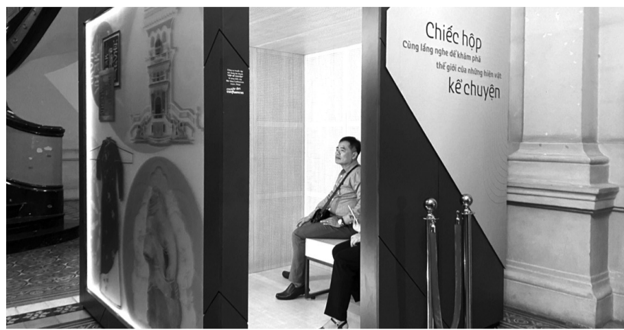
● Chiếc hộp kể chuyện ở Bảo tàng TP HCM.