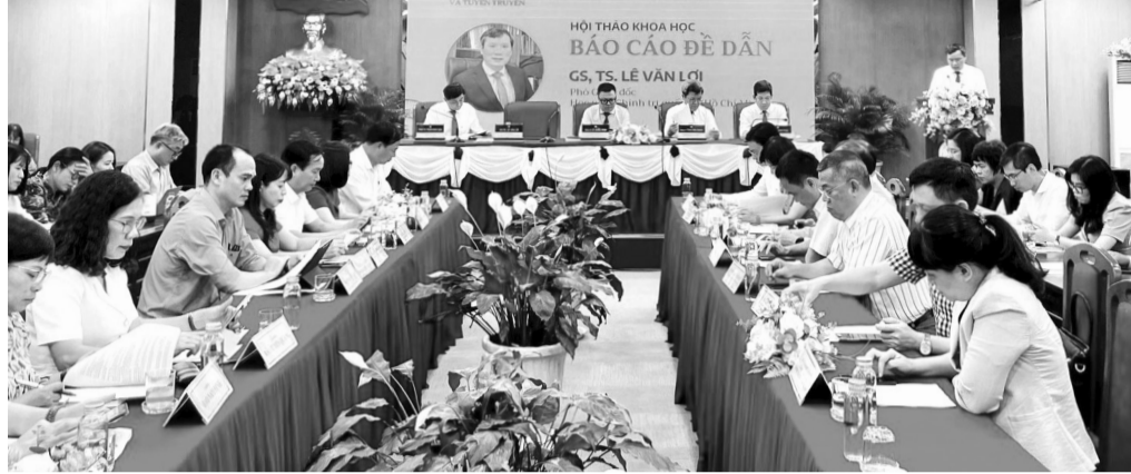
● Hội thảo đã nhận được 62 bài tham luận cũng như các ý kiến phát biểu tâm huyết, trách nhiệm của các đại biểu.

Hội thảo đã nhận được 62 bài tham luận cũng như các ý kiến phát biểu tâm huyết, trách nhiệm của các đại biểu nhằm đưa ra những giải pháp để xây dựng nền báo chí