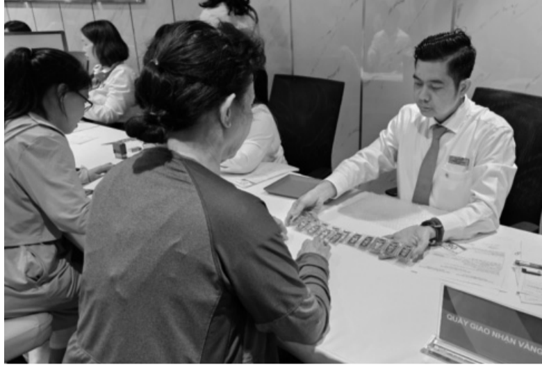
● Nhiều chuyên gia cho rằng, giá vàng miếng sẽ tiếp tục giảm?

Mặc dù vậy, theo ghi nhận của PV, ngày hôm qua tại Hà Nội, hàng dài người dân vẫn xếp hàng mua vàng, bất chấp cơn mưa rất lớn vào lúc sáng sớm. Điều này, theo đánh giá của nhiều chuyên gia cũng là bình thường vì giá vàng đang diễn biến hiện nay là phù hợp với kỳ vọng của người dân nên họ muốn mua vào để bảo đảm tài sản của họ trong điều kiện lãi suất ngân hàng thấp, bất động sản “đóng băng”.