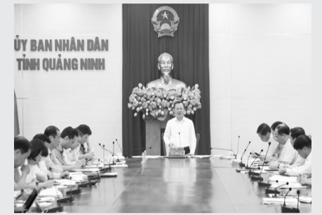
● Chủ tịch UBND tỉnh Quảng Ninh Cao Tường Huy phát biểu tại cuộc họp.

Ngày 5/6, tại TP Hạ Long, Chủ tịch UBND tỉnh Quảng Ninh Cao Tường Huy, Trưởng Ban Chỉ đạo tăng cường điều hành ngân sách tỉnh chủ trì cuộc họp kiểm điểm tình hình thực hiện dự toán ngân sách nhà nước (NSNN) 5 tháng đầu năm và triển khai nhiệm vụ những tháng cuối năm.