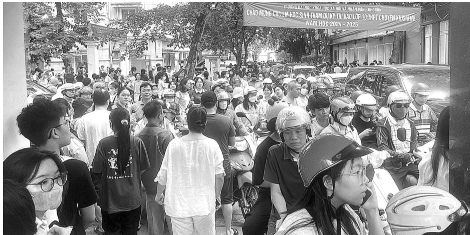
● Giao thông ùn tắc tại điểm thi Trường THPT Chuyên Khoa học Xã hội và Nhân văn.

Theo ghi nhận của phóng viên, ngày 2/6 tại điểm thi trường THPT Chuyên Khoa học Xã hội và Nhân văn và THPT Chuyên Khoa học Tự nhiên - Đại học Quốc gia Hà Nội, tình hình giao thông trước, trong và sau khi diễn ra buổi thi khá lộn xộn. Ngay từ sáng sớm, rất đông thí sinh và phụ huynh đã có mặt tại trường làm thủ tục thi và bước vào kỳ thi lớp 10 chuyên. Đoạn đường Nguyễn Trãi (Thanh Xuân, Hà Nội) kẹt cứng do phụ huynh dừng, đỗ xe máy, ô tô tràn xuống lòng đường để con em xuống điểm thi. Đền khi buổi thi bắt đầu, tình hình giao thông vẫn không khá hơn là bao.