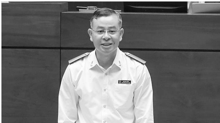
● Tổng Kiểm toán Nhà nước Ngô Văn Tuấn trả lời tại phiên chất vấn.

Nhấn mạnh hoạt động của KTNN là ở đơn vị chủ đầu tư và ban quản lý dự án, ông Ngô Văn Tuấn cho biết, trong quá trình kiểm toán, KTNN đã thực hiện cả 3 nội dung là đánh giá xác nhận tính đúng đắn, trung thực của báo cáo tài chính; đánh giá, xác nhận việc tuân thủ pháp luật trong đấu thầu, đầu tư xây dựng cơ bản và xác nhận tính hiệu quả trong đầu tư tài chính công, tài sản công. “Trong quá trình kiểm toán, chúng tôi đã chỉ ra được những sai sót, có kiến nghị xử lý, từ xử lý tài chính đến hoàn thiện văn bản và đặc biệt xử lý trách nhiệm của tổ chức, cá nhân có liên quan”, Tổng KTNN cho hay.