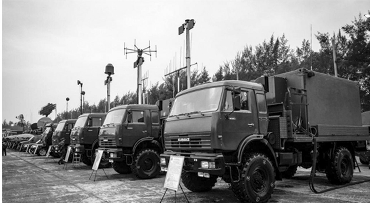
● Hệ thống đài ra đa VRS-2DM được Viettel nghiên cứu, thiết kế, sản xuất.

Dự thảo Luật Công nghiệp Quốc phòng, An ninh và Động viên công nghiệp (CNQP, AN&ĐVCN) dự kiến trình Quốc hội xem xét, thông qua tại Kỳ họp thứ 7, Quốc hội khóa XV; được kỳ vọng sẽ có nhiều chính sách, quy định mới, mang tính đặc thù, vượt trội, tạo nền tảng xây dựng CNQP, AN chủ động, tự lực, tự cường, lưỡng dụng, hiện đại, thực hiện ĐVCN rộng khắp.