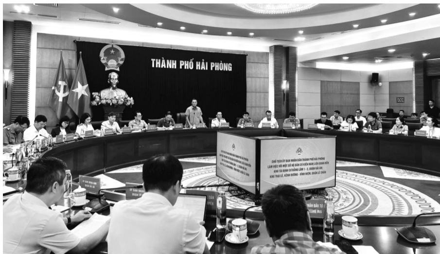
● Quang cảnh buổi làm việc.

Tại buổi làm việc, đại diện UBND quận Hải An báo cáo việc chủ đầu tư dự án đề xuất cho các hộ được mua thêm đất tại các Khu TĐC. Tuy nhiên, qua rà