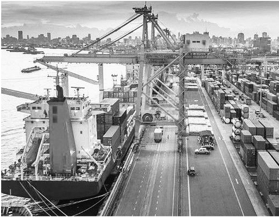
● Nhập siêu trở lại sau 22 tháng. (Ảnh minh họa - Nguồn: chinhphu.vn)