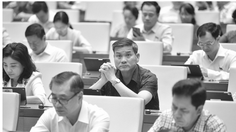
● Các đại biểu rất quan tâm đến phần trả lời chất vấn của Tổng Kiểm toán Nhà nước.

Chiều 5/6, QH tiến hành phiên chất vấn và trả lời chất vấn nhóm vấn đề thứ tư thuộc lĩnh vực Văn hóa, Thể thao và Du lịch (VH,TT&DL). Nêu quan điểm về mối quan hệ giữa bảo tồn phát triển di sản văn hóa và phát triển kinh tế - xã hội, Bộ