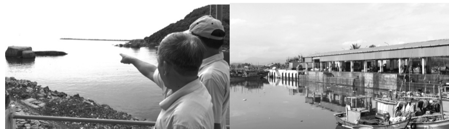
● Trước đây, luồng lạch ra vào cảng Mỹ Á sâu 4m, hiện tại chỉ còn khoảng 1,8m, vào chiều tối chỉ còn 0,5m.

giá đến nhiều tỷ đồng. Vì vậy, ngư dân địa phương mong muốn tỉnh sớm bố trí kinh phí nạo vét thông luồng cửa biển Cổ Lũy, triển khai giai đoạn 2 dự án Khu neo đậu tránh trú bão cho tàu cá kết hợp cảng cá Cổ Lũy, tạo điều kiện thuận lợi cho tàu thuyền ra vào cửa biển khai thác thủy sản.