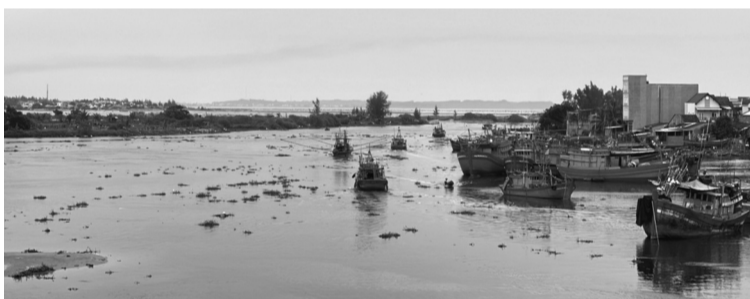
● Không có bóng dáng tàu cá công suất lớn tại cửa biển Cổ Lũy.

Báo cáo của Ban Quản lý cảng cá Mỹ Á cho thấy, do luồng ra vào cảng neo trú tàu thuyền và cửa biển bị bồi lấp, nên số lượng tàu cá ra vào cảng mỗi năm giảm dần. Năm 2023, tàu cá ra vào giảm 1.116 lượt so với 2022. Trong 5 tháng đầu năm 2024, chỉ có hơn 1.500 lượt tàu cá ra vào. Riêng tàu cá công suất lớn, khai thác xa bờ, hầu như không vào cảng. Các cơ sở hậu cần nghề cá tại khu vực cũng chịu chung cảnh điêu hiu.