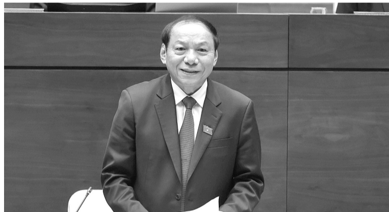
● Bộ trưởng Bộ Văn hóa, Thể thao và Du lịch Nguyễn Văn Hùng trả lời chất vấn.

trưởng Nguyễn Văn Hùng khẳng định, quan điểm chung là phải bảo tồn, phát huy giá trị các di sản, biến các di sản thành tài sản. Di tích, di sản khi được công nhận, tôn vinh không chỉ để đó mà cần được khai thác, biến thành tài sản; xây dựng được các sản phẩm gắn liền với di tích, di sản có tính văn hóa. Bộ trưởng nhấn mạnh yêu cầu tôn trọng, thực hiện nghiêm các cam kết, phương án bảo vệ di tích, di sản sau khi được công nhận, không để xảy ra tình trạng lợi dụng, khai thác, làm xấu đi hình ảnh của di tích, di sản.