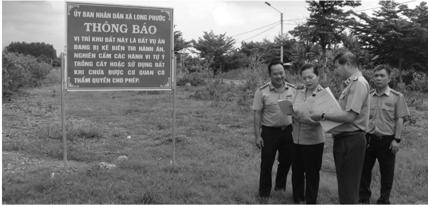
● Kiểm tra thực địa một tài sản ở huyện Long Thành.