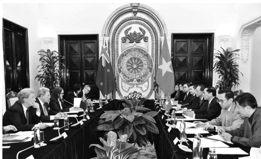
● Hình ảnh tại Hội nghị.

Cũng trong chiều 5/6, tại Trụ sở Chính phủ, Thủ tướng Chính phủ Phạm Minh Chính đã tiếp Phó Thủ tướng, Bộ trưởng Ngoại giao New Zealand Winston Peters đến chào nhân dịp thăm chính thức Việt Nam và đồng chủ trì Hội nghị Bộ trưởng Ngoại giao Việt Nam - New Zealand lần thứ 2.