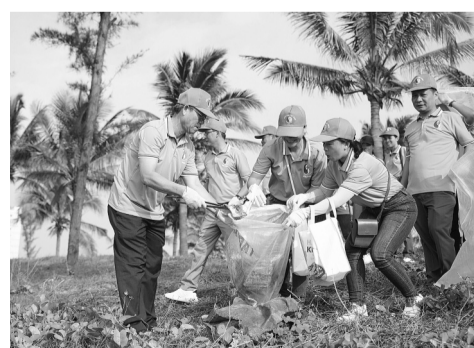
● Các đại biểu ra quân làm sạch bờ biển.