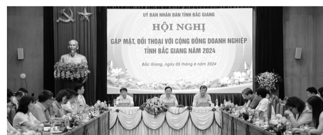
● Hội nghị là dịp UBND tỉnh trực tiếp lắng nghe các kiến nghị của cộng đồng DN để có những giải pháp chỉ đạo hiệu quả, thiết thực hơn nữa.

Nhằm tháo gỡ khó khăn cho doanh nghiệp (DN) trong hoạt động sản xuất kinh doanh, ngày 5/6, UBND tỉnh Bắc Giang tổ chức Hội nghị gặp mặt, đối thoại với cộng đồng DN trên địa bàn tỉnh.