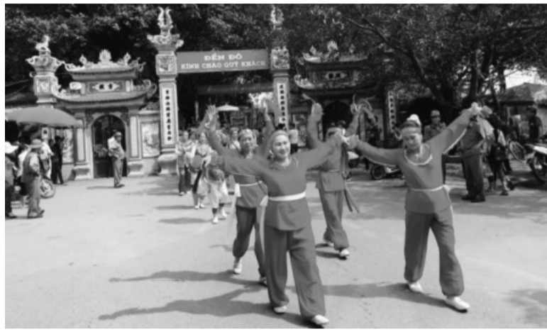
● Phân cấp nhiệm vụ quản lý nhà nước về tôn giáo, tín ngưỡng.

Thông tư 03/2024/TT-BNV quy định, việc phân cấp nhằm đáp ứng yêu cầu cải cách hành chính của Chính phủ và bảo đảm sự quản lý thống nhất, toàn diện, hiệu lực, hiệu quả trong quản lý nhà nước về tín ngưỡng, tôn giáo của Bộ Nội vụ trên phạm vi toàn quốc. Đồng thời, tăng cường công tác thanh tra, kiểm tra đối với trách nhiệm của cơ quan, tổ chức được phân cấp; xác định rõ nhiệm vụ, quyền hạn, khả năng thực hiện nhiệm vụ và phát huy