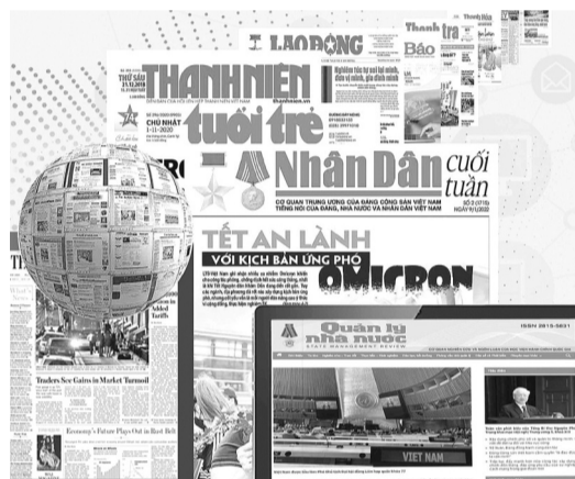
● Một số cơ quan báo chí đang chuyển mình để bắt kịp thời đại chuyển đổi số. (Ảnh minh họa)

Cuối cùng, bản thân mỗi nhà báo phải tích cực tu dưỡng, rèn luyện đạo đức nghề nghiệp, giữ gìn phẩm giá của người làm báo. Đồng thời, mỗi nhà báo cũng phải tự nâng cao, trau dồi bản lĩnh chính trị, bồi dưỡng về lý luận chính trị, nghiệp vụ báo chí cho người làm báo, đặc biệt là đội ngũ cán bộ lãnh đạo các cơ quan báo chí cần nêu cao tính tiên phong gương mẫu. Bên cạnh đó, mỗi nhà báo phải không ngừng học hỏi, nâng cao trình độ tiếp cận các loại hình báo chí hiện đại 4.0, đa phương tiện, kiến thức sâu rộng trên mọi lĩnh vực,... để ngày càng có nhiều sản phẩm báo chí đặc sắc, cung cấp những thông tin nhanh chóng, chính xác, có ý nghĩa đến mọi tầng lớp Nhân dân, góp phần vào sự nghiệp cách mạng, xây dựng và bảo vệ Tổ quốc. T.N.H - T.Đ.A