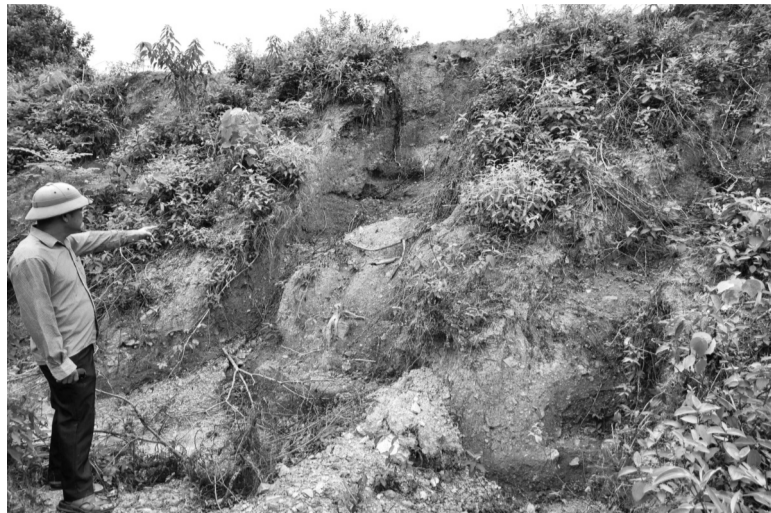
● Thân đập hồ chứa nước Khe Cọi bị xói lở nguy hiểm khi mùa mưa lũ cận kề.

người dân địa phương lo lắng, bất an khi mùa mưa lũ đến gần. Đặc biệt là hiện nay, có ít nhất 30 hộ dân trong thôn sinh sống cách khu vực đập về phía hạ lưu khoảng 300 - 400m”.