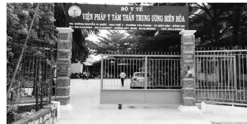
● Viện Pháp y tâm thần Trung ương Biên Hòa.

Trong văn bản gửi Bệnh viện Tâm thần Trung ương 1, Bệnh viện Tâm thần Trung ương 2, Viện Pháp y Tâm thần Trung ương; Viện Pháp y Tâm thần Trung ương Biên Hòa;