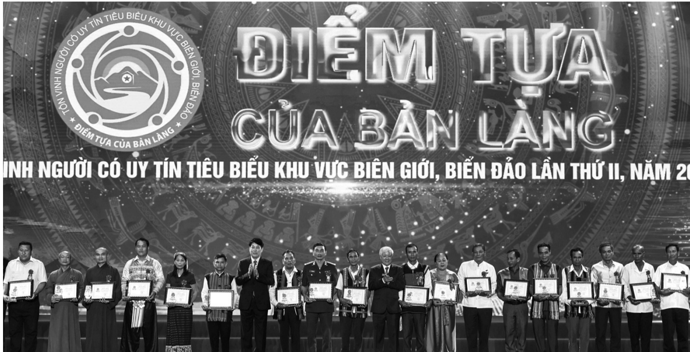
● Tặng Bằng khen cho một số đại biểu tham dự chương trình.

Tối 16/6, tại Hà Nội, Bộ Biên tập Tạp chí Cộng sản, Ban Thường trực Ủy ban Trung ương MTTQ Việt Nam và Bộ Tư lệnh Bộ đội Biên phòng đã phối hợp tổ chức Lễ tôn vinh người có uy tín (NCUT) tiêu biểu khu vực biên giới, biển đảo lần thứ II, năm 2024 với chủ đề “Điểm tựa của bản làng”. Tham dự chương trình có gần 200 đại biểu đến từ 42 tỉnh, thành phố biên giới, biển đảo thuộc 47 dân tộc.