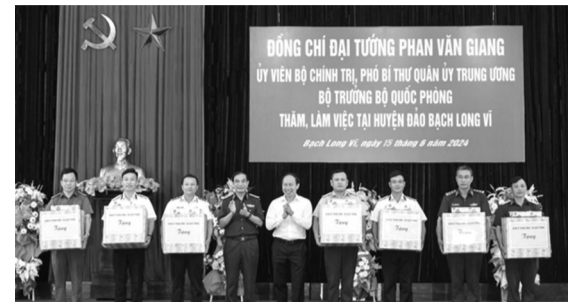
● Trao quà tặng Đảng bộ, chính quyền, đại diện các đơn vị vũ trang trên địa bàn huyện.

Đoàn công tác của Bộ Quốc phòng (BQP) do Đại tướng Phan Văn Giang, Ủy viên Bộ Chính trị, Phó Bí thư Quân ủy Trung ương, Bộ trưởng BQP làm Trưởng đoàn vừa đến thăm và làm việc với huyện đảo Bạch Long Vĩ (TP Hải Phòng).