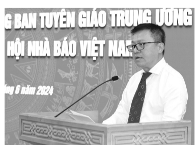
● Bí thư Đảng đoàn, Chủ tịch HNB Việt Nam Lê Quốc Minh.