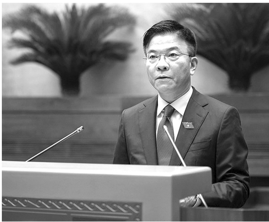
● Phó Thủ tướng Chính phủ, Bộ trưởng Bộ Tư pháp Lê Thành Long trình bày Tờ trình tại phiên họp.

Quy định không bắt buộc tên gọi của VPCC phải được đặt theo họ tên