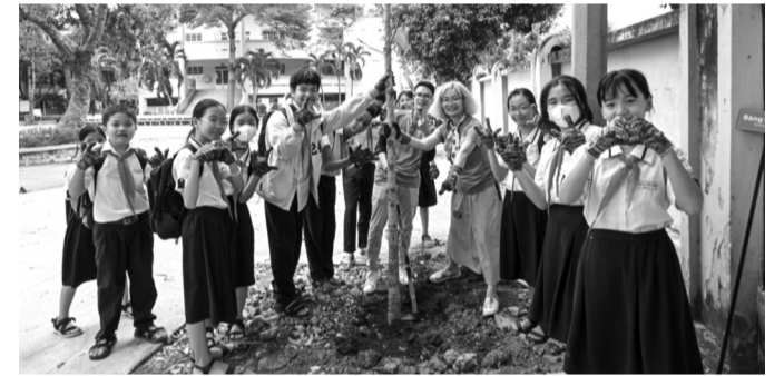
● Chương trình trồng cây trong trường học giúp xây dựng môi trường học tập xanh, khơi gợi tình yêu thiên nhiên và ý thức bảo vệ môi trường ở học sinh.