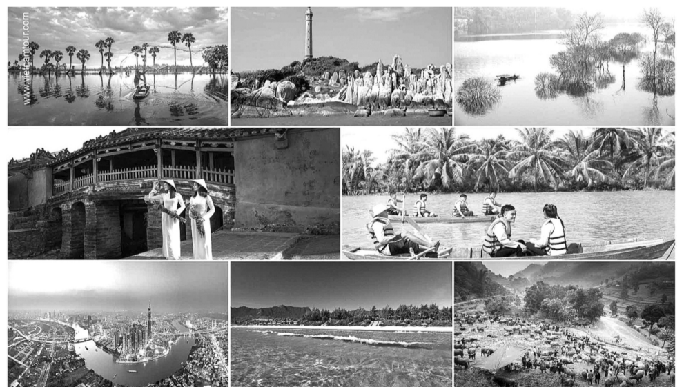
● Để đẩy mạnh phát triển du lịch Việt Nam, rất cần xây dựng môi trường văn hóa ở khu du lịch quốc gia. (Ảnh minh họa - Nguồn: Bộ VH,TT&DL)

Theo Cục Du lịch Quốc gia Việt Nam, Bộ tiêu chí xây dựng môi trường văn hóa ở khu du lịch quốc gia gồm 5 nhóm với gần 50 tiêu chí. Đó là các nhóm tiêu chí liên quan đến: Xây dựng thiết chế văn hóa