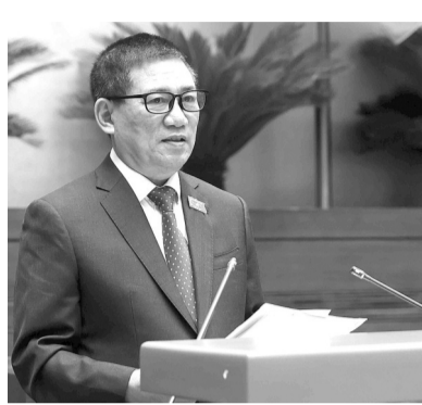
● Bộ trưởng Bộ Tài chính Hồ Đức Phúc trình bày Tờ trình về dự án Luật Thuế giá trị gia tăng (sửa đổi).

Chiều 17/6, tại phiên thảo luận tại tổ của Quốc hội về dự án Luật Thuế giá trị gia tăng (sửa đổi), các đại biểu đề nghị quy định cụ thể vào trong Luật về mức doanh thu bán hàng hóa, dịch vụ không chịu thuế giá trị gia tăng và một số nội dung khác để xác lập căn cứ pháp lý rõ ràng, tạo điều kiện cho việc thực thi trong thực tiễn.