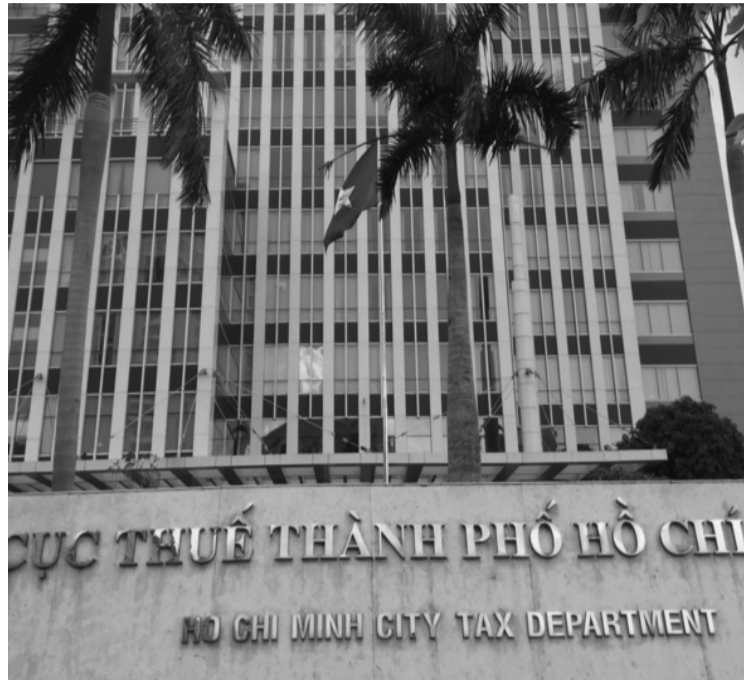
● 5 tháng đầu năm 2024, thu ngân sách nhà nước do Cục Thuế TP HCM quản lý ước đạt 185.104 tỷ đồng.

Cục Thuế TP HCM cũng đã báo cáo một số định hướng tăng cường công tác quản lý thuế (QLT) như: tiếp tục đẩy mạnh công tác triển khai, quản lý việc sử dụng hóa đơn điện tử (HĐĐT), HĐĐT khởi tạo từ máy tính tiền; nâng cao năng lực QLT, chống thất thu thuế đối với hoạt động thương mại điện tử; tăng cường công tác xử lý nợ, thu hồi thuế; tiếp tục triển khai thực hiện Chiến lược cải cách hệ thống thuế giai đoạn 2021 - 2030; kế hoạch