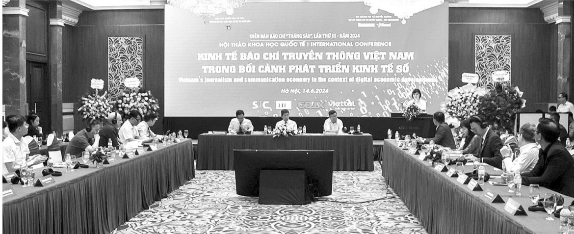
● Hội thảo quốc tế với chủ đề “Kinh tế báo chí truyền thông Việt Nam trong bối cảnh phát triển kinh tế số” diễn ra vào ngày 14/6/2024.

Gần 100 năm qua, báo chí cách mạng Việt Nam đã có những đóng góp tích cực vào sự nghiệp cách mạng của dân tộc. Bước vào giai đoạn phát triển mới, đứng trước nhiều thách thức của thời đại công nghệ 4.0 và xu hướng “thương mại hóa” báo chí, báo chí Việt Nam cần có những giải pháp phù hợp để không chỉ nâng cao hiệu quả hoạt động, phát huy truyền thống vẻ vang, mà còn luôn xứng đáng là lực lượng xung kích trên mặt trận tư tưởng - văn hóa của Đảng.