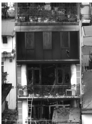
● Phía ngoài ngôi nhà xảy ra cháy. (Ảnh trong bài: Hương Giang)

Nơi xảy ra cháy tại tầng 4 nhưng hàng hóa được chủ nhà xếp từ tầng 1 lên tầng 3, gây cản trở quá trình tiếp cận từ tầng dưới lên. Thêm vào đó, hàng hóa là sơn, cao su, nhựa... nên ngọn lửa cháy lan nhanh và khó dập, dẫn đến công tác chữa cháy mất thêm nhiều thời gian.