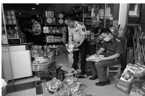
● Lực lượng Quản lý thị trường Lào Cai phối hợp với các lực lượng chức năng kiểm tra, xử lý cơ sở kinh doanh vi phạm.

chi đạo trên, Đội Quản lý thị trường số 5 đã chủ động xây dựng cơ sở dữ liệu quản lý địa bàn theo hướng bám sát, nắm chắc, giao nhiệm vụ giám sát địa bàn cụ thể đến từng kiểm soát viên.