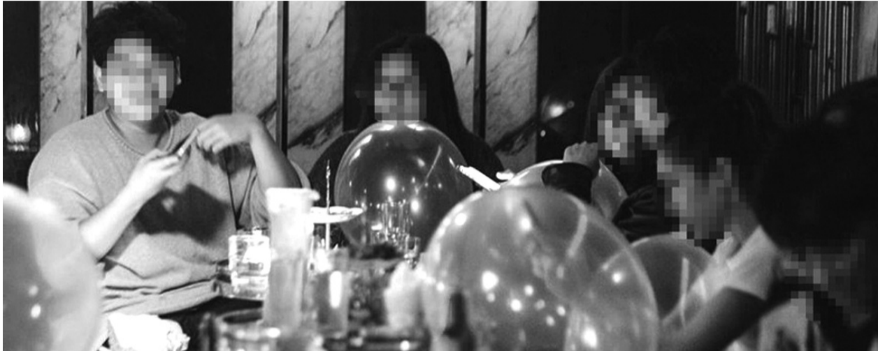
● Thanh niên hút bóng cười tại một tụ điểm giải trí về đêm. (Ảnh minh họa)

Hiện nay, một bộ phận giới trẻ đang sa đà vào nghiện ngập các chất kích thích, chất gây nghiện, ma túy và có những nhận thức lệch lạc về các chất này... Điều này không chỉ ảnh hưởng đến sức khỏe, tương lai người trẻ mà còn đe dọa sự phát triển bền vững của xã hội.