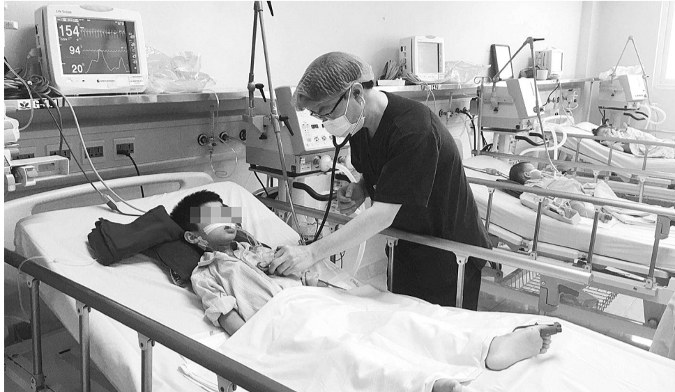
● Một ca mắc viêm não Nhật Bản được điều trị tại Bệnh viện Nhi Trung ương.