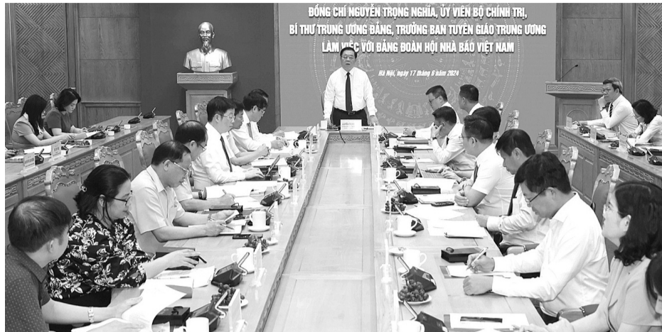
● Trưởng Ban Tuyên giáo Trung ương Nguyễn Trọng Nghĩa đề nghị Đảng đoàn HNB Việt Nam tiếp tục lãnh đạo, chỉ đạo HNB Việt Nam chú trọng giáo dục, bồi dưỡng chính trị, đạo đức cho người làm báo.

Tuy nhiên, theo Trưởng Ban Tuyên giáo Trung ương, hoạt động của HNB