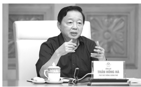
● Phó Thủ tướng Trần Hồng Hà yêu cầu Bộ Xây dựng tiếp tục hoàn thiện các dự thảo Nghị định.

Các dự thảo Nghị định quy định chi tiết thi hành một số điều của Luật Kinh doanh bất động sản (BDS) do Bộ Xây dựng chủ trì soạn thảo. Đối tượng tác động của Nghị