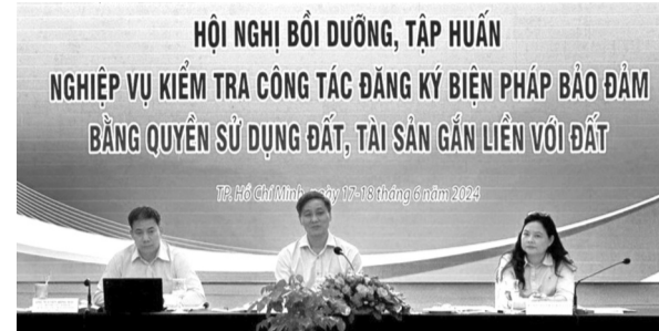
● Thông qua Hội nghị lần này, Bộ Tư pháp mong muốn góp phần nâng cao hiệu lực, hiệu quả quản lý nhà nước về đăng ký biện pháp bảo đảm.

Ngày 17/6/2024, tại TP Hồ Chí Minh đã diễn ra Hội nghị “Bồi dưỡng, tập huấn nghiệp vụ kiểm tra công tác đăng ký biện pháp bảo đảm bằng quyền sử dụng đất, tài sản gắn liền với đất” do Bộ Tư pháp phối hợp Bộ Tài nguyên và Môi trường cùng sự hỗ trợ của Tổ chức hợp tác quốc tế Đức tại Việt Nam (dự án GIZ) tổ chức.