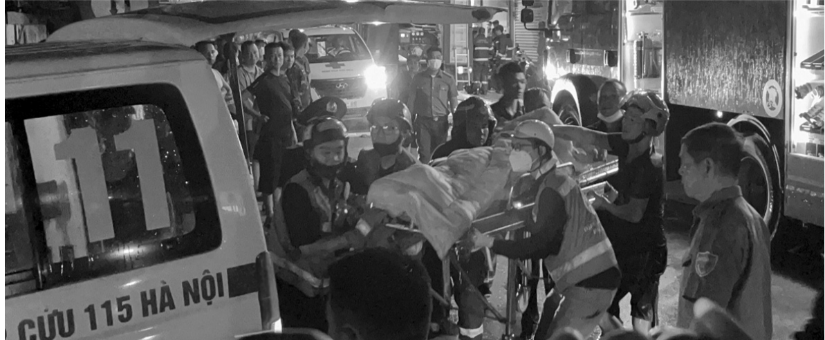
● Có 4 nạn nhân tử vong trong vụ cháy tại Hà Nội.