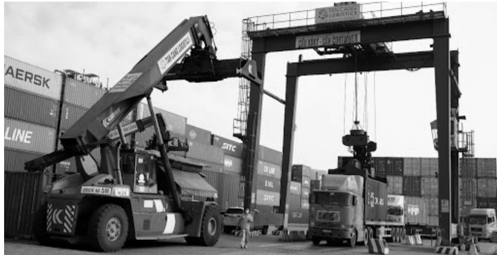
● Chưa có kết luận cuối cùng về việc DN xuất khẩu bị mất hàng. (Ảnh minh họa)

Đại diện Cục HHVN cho biết, từ trước đến nay việc mất hàng ở cảng biển là hi hữu, khó xảy ra, nhất là việc mất hàng diễn ra trong thời gian dài. Đại diện Cục HHVN khuyến cáo các DN cảng cần luôn theo dõi sát sao từng đơn hàng khi xuất nhập khẩu qua cảng biển.