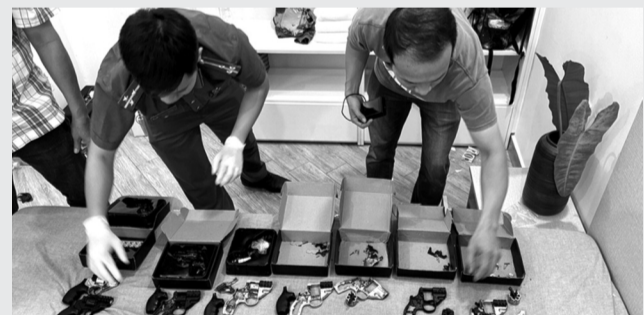
● Tang vật trong vụ án.