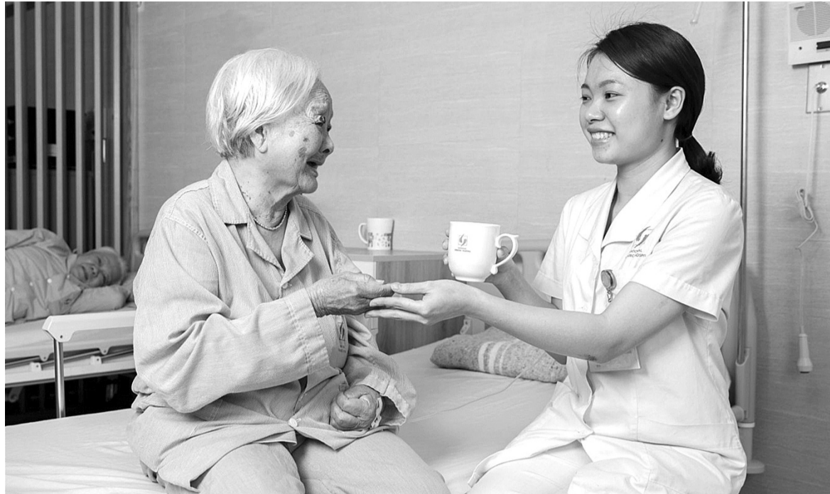
● Người cao tuổi cần được chăm sóc cả về thể chất lẫn tinh thần.