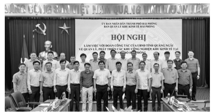
● Đoàn công tác của UBND tỉnh Quảng Ngãi tham dự Hội Nghị.

Ban Quản lý Khu kinh tế Hải Phòng vừa làm việc với Đoàn công tác của UBND tỉnh Quảng Ngãi nhằm trao đổi kinh nghiệm về quản lý, phát triển khu công nghiệp (KCN), khu kinh tế (KKT) tại TP Hải Phòng.