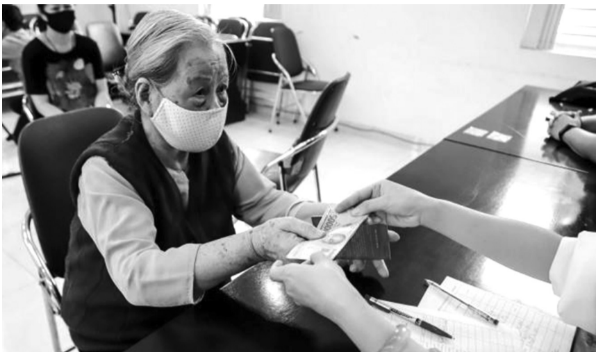
● Đề xuất tăng mức chuẩn trợ cấp xã hội lên 500.000 đồng/tháng từ ngày 1/7.

Nếu phương án này được Chính phủ phê duyệt thì các chế độ, chính sách trợ giúp xã hội quy định tại khoản 1 Điều 6, khoản 2 Điều 11, khoản 1 Điều 13, khoản 1 Điều 14, khoản 1 Điều 19, khoản 1 và 2 Điều 20, khoản 1 Điều 25 Nghị định 20/2021/NĐ-CP của Chính phủ quy