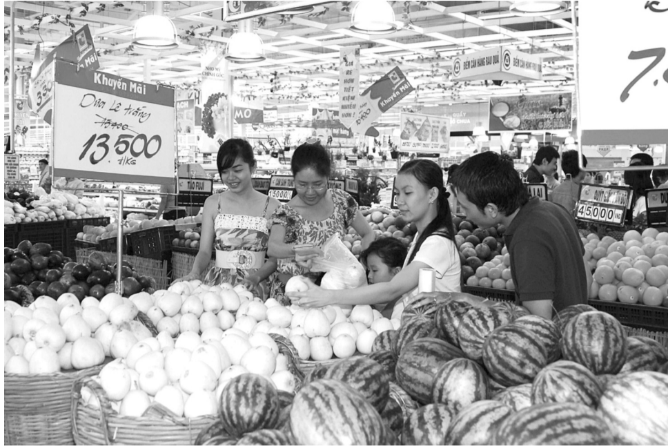
● Hệ thống siêu thị sẽ là kênh "giữ giá" khi lương tăng.