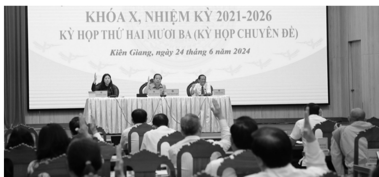
● Các đại biểu HĐND tỉnh Kiên Giang biểu quyết thông qua các dự thảo nghị quyết. (Ảnh: PV)

Trên cơ sở xem xét hồ sơ dự thảo nghị quyết do Ủy ban nhân dân (UBND) tỉnh trình và căn cứ các quy định của pháp luật hiện hành, tình hình thực tế của địa phương, HĐND tỉnh thống nhất biểu quyết thông qua 8 Nghị quyết tại Kỳ họp, gồm: quy định tiêu chí thành lập, tiêu chí về số lượng thành viên tổ bảo vệ an ninh, trật tự và mức chi, mức hỗ trợ, bồi dưỡng cho lực lượng tham gia bảo vệ an ninh, trật tự ở cơ sở; quy định miễn phí bình tuyến, công nhận cây mẹ, cây đầu dòng, vườn giống cây lâm nghiệp, rừng giống khi sử dụng dịch vụ công trực