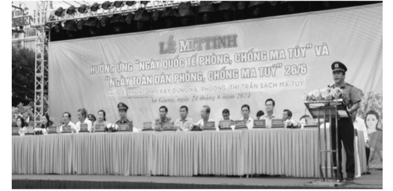
● Quang cảnh Lễ mít tinh.

Sáng ngày 24/6/2024, tại Quảng trường Trung Nữ Vương (phường Mỹ Long, thành phố Long Xuyên), UBND tỉnh An Giang tổ chức Lễ mít tinh hưởng ứng "Ngày Quốc tế phòng, chống ma túy" và "Ngày toàn dân phòng, chống ma túy" (26/6). Hơn 1.200 đại biểu đại diện các sở, ban, ngành, đoàn thể và Nhân dân, thanh niên, học sinh, sinh viên tham dự Lễ mít tinh.