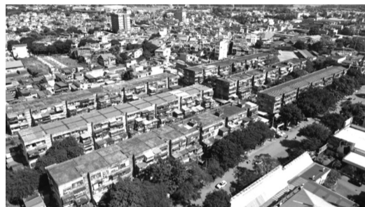
● Cụm chung cư trong tình trạng cấp độ D (nguy hiểm và cần di chuyển cư dân) ở phường Vạn Mỹ.

Cuối năm 2023, UBND TP Hải Phòng đã ban hành văn bản khẩn trương kiểm tra hiện trạng, theo dõi, phát hiện những dấu hiệu bất thường ảnh hưởng đến an toàn của người và công trình tại chung cư cũ Vạn Mỹ, có biện pháp chống đỡ tạm thời, thông báo cho hộ dân di chuyển ra khỏi khu vực nguy hiểm.