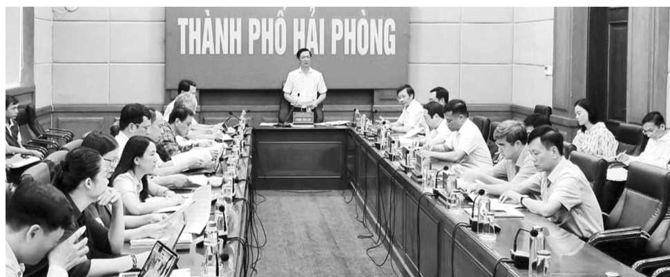
Thường trực HĐND TP Hải Phòng nghe báo cáo về các dự thảo nghị quyết do UBND TP trình kỳ họp. (Ảnh: PV)

Kỳ họp thứ 17 HĐND TP khóa XVI sẽ diễn ra vào ngày 26/6/2024. Tại cuộc họp, đại diện các Ban của HĐND TP báo cáo sơ bộ kết quả thẩm tra các hồ sơ dự thảo nghị quyết và cơ bản thống nhất với nội dung các dự thảo nghị quyết bảo đảm căn cứ, trình tự, thủ tục theo quy định của pháp luật. Sau những lần họp thẩm tra trước, các dự thảo nghị quyết được cơ quan soạn thảo bổ sung, hoàn thiện, bảo đảm chất lượng. Một số ý kiến đề nghị điều chỉnh một số nội dung trong dự thảo nghị quyết, chủ yếu liên quan đến danh mục, số liệu để bảo đảm phù hợp.