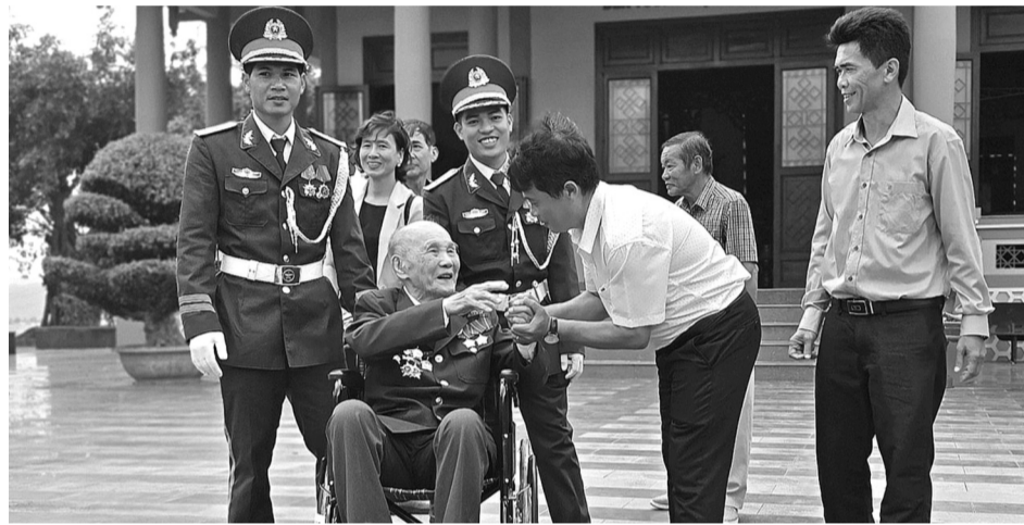
● Một số cựu chiến binh từng tham gia trận đánh đến tham dự buổi lễ.

Cùng với Chiến thắng Điện Biên Phủ, Chiến thắng Đak Pơ đã có tác động tích cực