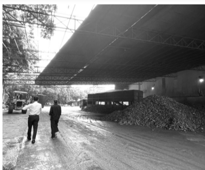
● Một góc Nhà máy Nhựt Phát.

Lẽ ra để xác định Chi nhánh Tây Ninh có "trốn thuế" hay không, phải áp dụng đúng các quy định về thanh tra chuyên ngành, có thể đề xuất Tổng cục Thuế thanh tra. "Việc Chủ tịch UBND tỉnh Tây Ninh ra quyết định thanh tra với trường hợp này là chưa phù hợp. KLLT 987 cũng đã thanh tra nhiều nội dung nằm ngoài phạm vi thuế phải nộp tại Tây Ninh, là vi phạm thẩm quyền", LS Trang nói.