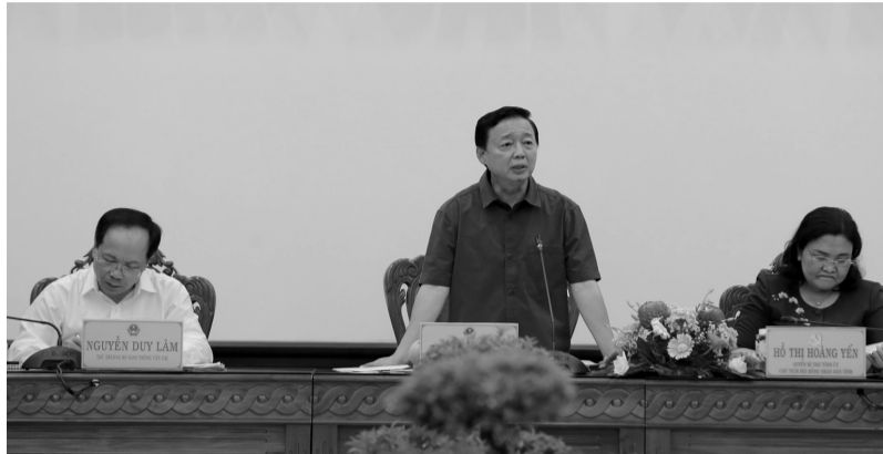
● Phó Thủ tướng Trần Hồng Hà yêu cầu không để thiếu cát cho dự án đường Vành đai 3 TP Hồ Chí Minh.

Chiều 24/6, tại Bến Tre, Phó Thủ tướng Trần Hồng Hà chủ trì cuộc họp với các Bộ, ngành, địa phương về giải quyết nguồn vật liệu san lấp cho các dự án giao thông trọng điểm khu vực phía Nam.