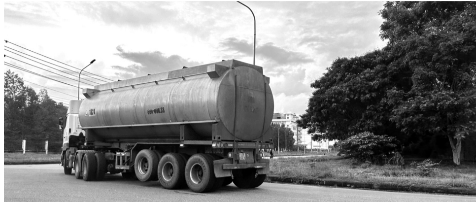
● Nhiều DN thứ cấp trong KCN Mỹ Xuân A2 phải thuê xe bồn, mua nước sạch chở vào nhà máy để phục vụ hoạt động sản xuất.

Theo các DN này, tình trạng thiếu nước sạch trầm trọng đang diễn ra tại KCN Mỹ Xuân A2. Nguyên nhân xuất phát từ việc FIDC nợ Phummy Wasuco nhiều tỷ đồng tiền nước. Do FIDC nợ quá hạn chưa thanh toán nên Phummy Wasuco giảm áp lực và