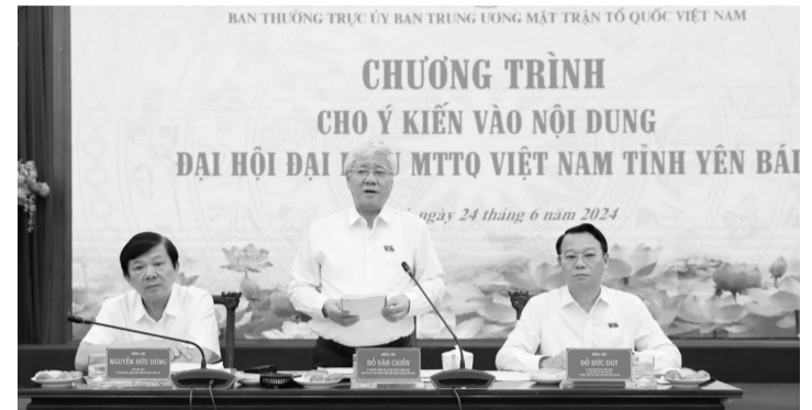
● Ủy viên Bộ Chính trị, Bí thư Trung ương Đảng, Chủ tịch Ủy ban Trung ương MTTQ Việt Nam Đỗ Văn Chiến phát biểu tại cuộc làm việc.

Ngày 24/6, tại Hà Nội, ông Đỗ Văn Chiến, Ủy viên Bộ Chính trị, Bí thư Trung ương Đảng, Chủ tịch Ủy ban Trung ương Mặt trận Tổ quốc (UBTU MTTQ) Việt Nam đã chủ trì cuộc làm việc cho ý kiến vào nội dung Đại hội đại biểu MTTQ Việt Nam tỉnh Yên Bái lần thứ XVI, nhiệm kỳ 2024 - 2029.