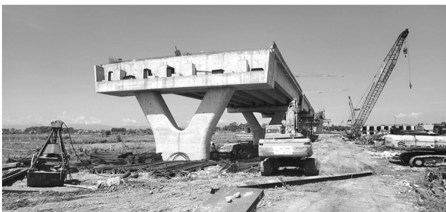
● Các hạng mục khó ở cầu Thạch Hãn 1 (thuộc dự án đường ven biển kết nối hành lang kinh tế Đông - Tây tỉnh Quảng Trị) đã cơ bản xong, nhưng đường dẫn 2 đầu cầu gặp khó về giải phóng mặt bằng.

Để đẩy nhanh tiến độ các dự án, Chủ tịch UBND tỉnh Quảng Trị yêu cầu Sở Giao thông vận tải, Ban Quản lý dự án Đầu tư xây dựng tỉnh tập trung làm tốt công tác chuẩn bị, hoàn thành thủ tục đầu tư, sẵn sàng triển khai thực hiện các dự án khi đủ điều kiện theo quy định của pháp luật. Phân công lãnh đạo đơn vị trực tiếp phụ trách từng dự án cụ thể và cử công chức, viên chức bám sát, theo dõi tiến độ thực hiện các dự án; rà soát tiến độ tổng thể, chi tiết