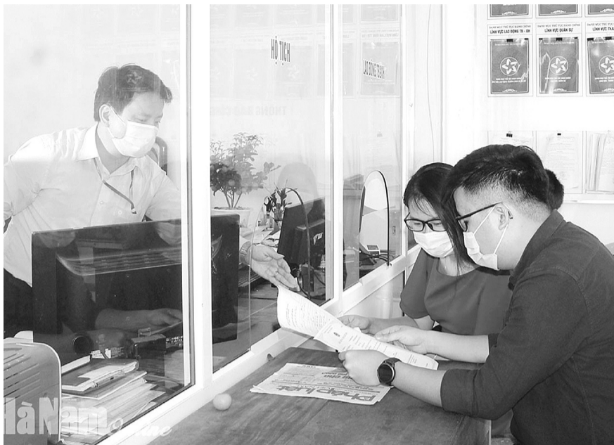
● Công dân thực hiện TTHC tại Bộ phận một cửa UBND thị trấn Vĩnh Trụ, huyện Lý Nhân, Hà Nam.

Dự thảo cũng bổ quy định về xuất trình Giấy chứng nhận kết hôn của