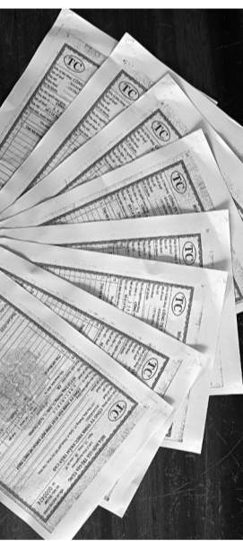
● 41 hóa đơn trong sự việc.

Trong quá trình điều tra, xác định thông qua mạng xã hội, Quốc đã mua số súng và đạn trên, đem xuống TP Long Xuyên định bán lại, nhưng chưa kịp bán thì bị công an bắt quả tang. Số ma túy thu giữ trong phòng là của Quốc, sau khi cả nhóm sử dụng xong, số ma túy còn lại Dung đem cất giấu vào túi xách. KHÁNH THỦY - TIẾN TÂM