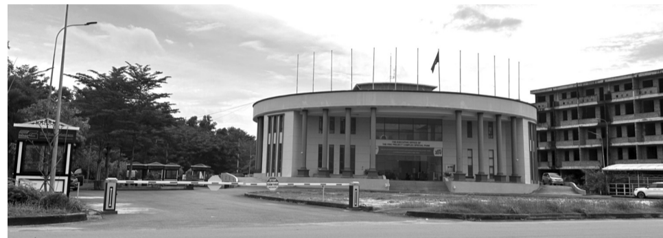
● Trụ sở của FIDC.

lưu lượng nước cấp vào KCN Mỹ Xuân A2 từ ngày 13/6, khiến các DN thứ cấp trong KCN này không đủ nước sạch để bảo đảm hoạt động sản xuất.