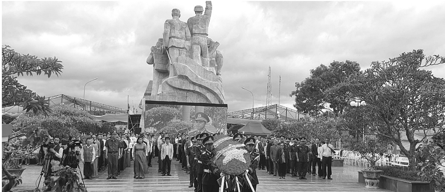
● Dâng hoa trong Lễ kỷ niệm.