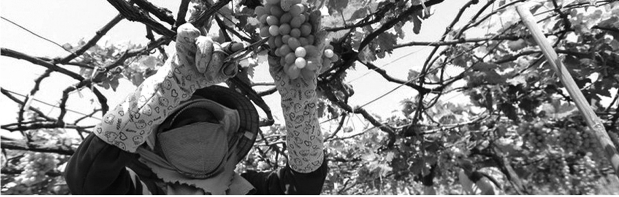
● Nhờ nguồn vốn tín dụng nhiều hộ nông dân vươn lên thoát nghèo.

Vốn là tỉnh khó khăn của khu vực miền Trung, song với việc chủ động thực hiện các chính sách, nghị quyết, chỉ thị của Đảng, Nhà nước về phát triển kinh tế, bảo đảm an sinh xã hội, Ninh Thuận đã có bước chuyển mình tích cực, góp mặt vào nhóm những địa phương có tốc độ tăng trưởng kinh tế, giảm nghèo bền vững ấn tượng của cả nước.