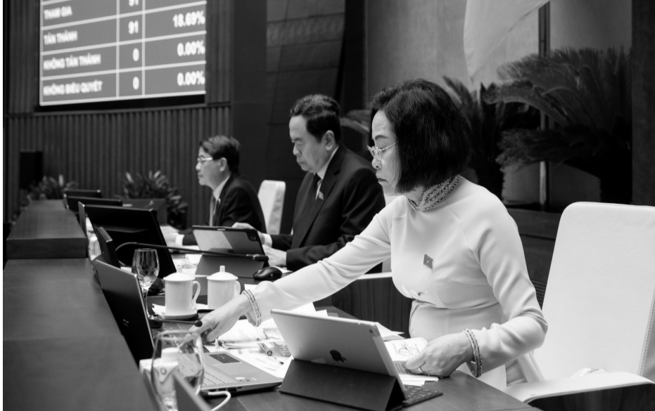
● Lãnh đạo Quốc hội bấm nút biểu quyết thông qua Nghị quyết về phê chuẩn quyết toán ngân sách nhà nước năm 2022.