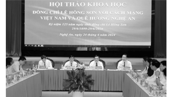
● Quang cảnh Hội thảo.

Sáng 24/6, tại thành phố Vinh, Học viện Chính trị Quốc gia Hồ Chí Minh chủ trì, phối hợp với Tỉnh ủy Nghệ An tổ chức Hội thảo khoa học “Đồng chí Lê Hồng Sơn với cách mạng Việt Nam và quê hương Nghệ An” nhân kỷ niệm 125 năm Ngày sinh đồng chí Lê Hồng Sơn (29/6/1899 - 29/6/2024).