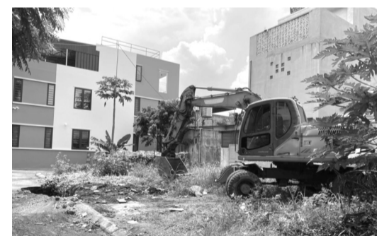
● Hố sụt lún bất thường trên mặt đường tại phường Cẩm Sơn, TP Cẩm Phả, Quảng Ninh.

Ngay sau khi xảy ra vụ việc, để bảo đảm an toàn cho người dân, chính quyền TP Cẩm Phả