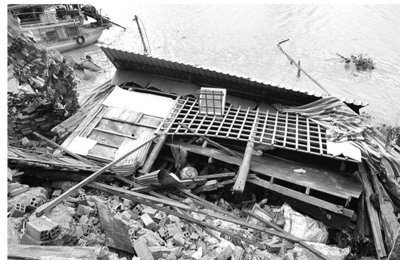
● Một căn nhà bị tuột xuống sông tại Bạc Liêu.

Theo báo của Ban Chỉ huy PCTT&TKCN tỉnh, tính đến 18h ngày 23/6/2024, khu vực sạt lở thuộc khóm 6, phường 5, TP Bạc Liêu có tổng 39 căn nhà bị ảnh hưởng trong phạm vi chiều dài sạt lở 800m. Qua thống kê, rà soát, phải di dời 10 hộ dân có nhà cửa bị ảnh hưởng nặng đến nơi an toàn. Còn 29 hộ dân vẫn ở tại chỗ, cơ quan chức năng đang theo dõi, nếu tình hình phức tạp hơn sẽ tiếp tục di dời người và tài sản đến nơi khác. Qua khảo sát, kiểm tra hiện trường bước đầu nhận định nguyên nhân đoạn bờ sông Cà Mau - Bạc Liêu sạt lở là do hiện nay Cty Cổ phần Giao thông Sài