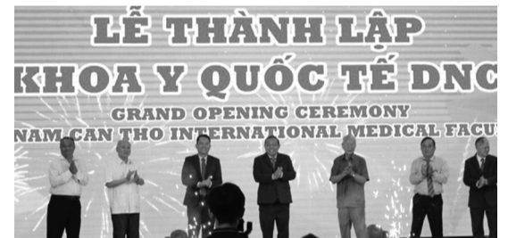
● Các đại biểu thực hiện nghi thức thành lập Khoa Y quốc tế DNC.

Ngày 24/6, Trường Đại học Nam Cần Thơ (TP Cần Thơ) công bố quyết định thành lập Khoa Y quốc tế DNC. Đây sẽ là nơi tiếp nhận đào tạo sinh viên quốc tế từ các nước như Ấn Độ, Srilanka, Nepal, các nước Trung Đông và các quốc gia khác. Việc Trường Đại học Nam Cần Thơ đẩy mạnh công tác đào tạo nguồn nhân lực đủ tầm tham gia thị trường lao động quốc tế, cũng như xây dựng các chương trình thu hút sinh viên nước ngoài đến học tập đã tạo ra luồng gió mới, góp phần nâng tầm vị thế cho ngành Giáo dục tại TP Cần Thơ nói riêng, cả nước nói chung.