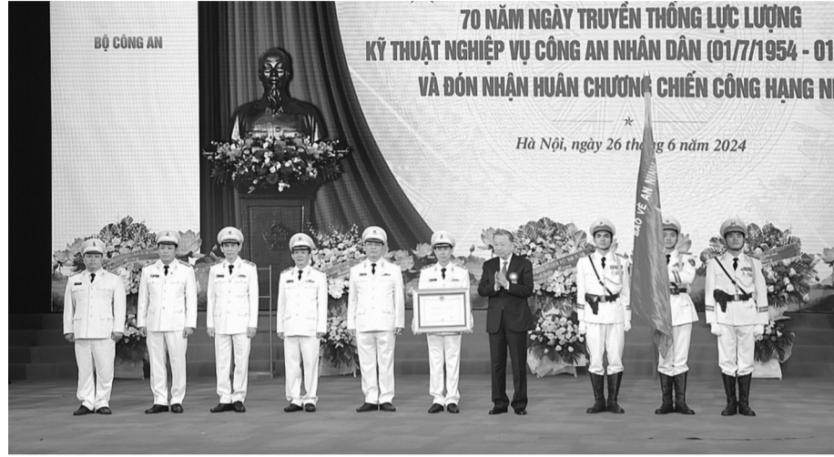
● Chủ tịch nước Tô Lâm trao Huân chương Chiến công hạng Nhì cho lực lượng Kỹ thuật nghiệp vụ CAND.

Trên tinh thần đó, Chủ tịch nước đề nghị lực lượng Kỹ thuật nghiệp vụ thực hiện có hiệu quả quan điểm, chủ trương của Đảng về xây dựng lực lượng CAND, trong đó xây dựng lực lượng Kỹ thuật nghiệp vụ thực sự trong sạch, vững mạnh, chính quy, tinh nhuệ, đến năm 2025 tiến lên hiện đại, đáp ứng yêu cầu