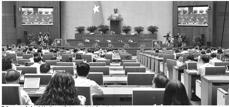
● Quang cảnh phiên họp.

Phân tích lý do, Đại biểu cho biết, hiện nay, chúng ta vẫn đang áp dụng cơ chế quản lý “tiền kiểm” đối với quảng cáo thuốc và các thực phẩm chức năng nhưng thực tế, hoạt động này vẫn tồn tại rất nhiều bất cập. “Thực hiện chế độ “tiền kiểm” mà chúng ta vẫn còn đang vướng, khó quản lý