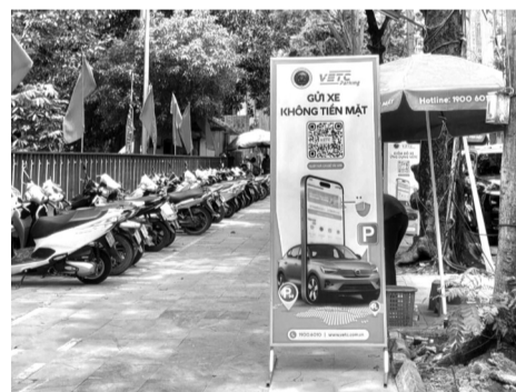
● Việc chuyển đổi sang hình thức không dùng tiền mặt khi gửi xe mang lại nhiều lợi ích.