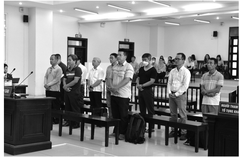
● Các bị cáo tại phiên phúc thẩm.

Vào cuộc điều tra, cơ quan chức năng xác định, chất lượng công trình xây dựng hoàn thành (phần đường) tại các gói thầu không bảo đảm tiêu chuẩn kỹ thuật, yêu cầu thiết kế dự án, gây