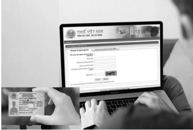
● Số định danh cá nhân thay cho mã số thuế từ ngày 1/7/2025.

Tổng cục Thuế khuyến cáo, trường hợp cá nhân là người có quốc tịch Việt Nam chưa được cấp số định danh cá nhân (ĐDCN) cần liên hệ với cơ quan Công an để cấp số ĐDCN trước khi sử dụng số ĐDCN thay cho mã số thuế (MST), dự kiến từ ngày 01/7/2025.