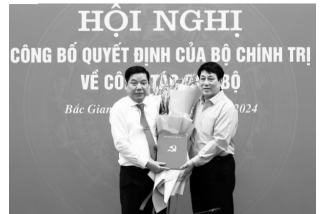
● Thường trực Ban Bí thư Lương Cường (bên phải) trao quyết định và tặng hoa chúc mừng tân Bí thư Tỉnh ủy Bắc Giang Nguyễn Văn Gấu.

Sáng qua (26/6), Tỉnh ủy Bắc Giang đã tổ chức Hội nghị công bố quyết định của Bộ Chính trị về công tác cán bộ. Tại Hội nghị, Phó Trưởng Ban Tổ chức Trung ương Nguyễn Quang Dương đã công bố quyết định của Bộ Chính trị về việc điều động, chỉ định Trung tướng Nguyễn Văn Gấu, Ủy viên Trung ương Đảng, Phó Chủ nhiệm Tổng cục Chính trị QĐND Việt Nam tham gia Ban Chấp hành, Ban Thường vụ, giữ chức Bí thư Tỉnh ủy Bắc Giang nhiệm kỳ 2020 - 2025 và tham gia Đảng ủy Quân khu 1, nhiệm kỳ 2020 - 2025.