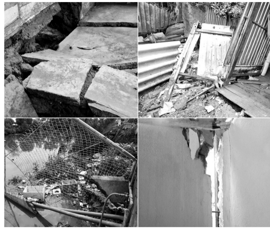
● Hiện trường sau vụ sạt lở vào nửa đêm 20/6 tại khu vực khóm 6, phường 5, thành phố Bạc Liêu (tỉnh Bạc Liêu).

Tính đến chiều tối 23/6/2024 có tổng 39 căn nhà bị ảnh hưởng trong phạm vi chiều dài sạt lở 800 mét (phát sinh 5 căn nhà so với ngày 22/6/2024). Qua thống kê của cơ quan chức năng, phải rà soát di dời 10 hộ dân có nhà bị ảnh hưởng nặng, người và tài sản di đến nơi khác an toàn (thuê nhà trọ, đến nhà người thân), còn 29 hộ dân vẫn ở tại chỗ (các hộ này tiếp tục theo dõi tình hình, nếu tình hình phức tạp hơn sẽ tiếp tục di dời người và tài sản đến nơi khác an toàn).