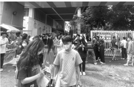
● Thí sinh giữ tâm lý thoải mái, tự tin chuẩn bị ba ngày thi sắp tới. (Điểm thi Trường THCS Nghĩa Tân,)