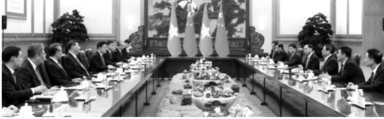
● Thủ tướng Phạm Minh Chính hội kiến Tổng Bí thư Ban Chấp hành Trung ương Đảng Cộng sản Trung Quốc, Chủ tịch nước Cộng hòa nhân dân Trung Hoa Tập Cận Bình.

Chiều 26/6, tại Đại lễ đường Nhân dân ở Thủ đô Bắc Kinh, Trung Quốc, trong chương trình tham dự Hội nghị thường niên các nhà tiên phong lần thứ 15 của Diễn đàn Kinh tế thế giới (WEF) Đại Liên 2024 và làm việc tại Trung Quốc, Thủ tướng Phạm Minh Chính đã hội kiến Tổng Bí thư Ban Chấp hành Trung ương Đảng Cộng sản Trung Quốc, Chủ tịch nước Cộng hòa nhân dân Trung Hoa Tập Cận Bình.