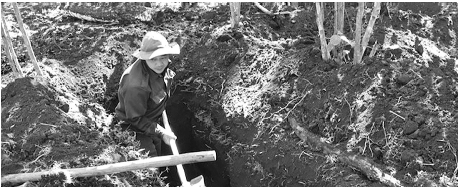
● ĐQT 192 tìm kiếm HCLS tại bản Đông, huyện Lào Ngam, tỉnh SaLaVan.

Với nhiệm vụ tìm kiếm, cất bốc, hồi hương hài cốt liệt sĩ (HCLS) hy sinh trong chiến tranh, những năm qua, cán bộ, chiến sĩ Đội quy tập (ĐQT) 192, Bộ Chỉ huy quân sự (CHQS) tỉnh Thừa Thiên Huế vẫn miệt mài hành quân nơi núi rừng khu vực biên giới hai nước Việt Nam - Lào để tìm kiếm liệt sĩ (LS). Dù gian nan, vất vả, nhưng nếu có 1 thông tin về LS, dù ở bất kỳ vị trí nào, khó khăn đến mấy, ĐQT 192 cũng sẽ tìm đến để tổ chức khảo sát, tìm kiếm, quy tập để đưa LS về với quê hương, về với đất mẹ.