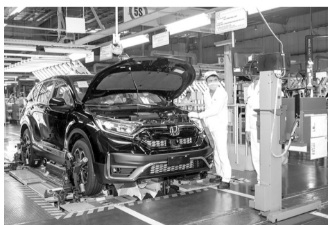
● Đề xuất giảm mức thu lệ phí trước bạ góp phần tạo đà để phục hồi tăng trưởng cho ngành sản xuất, lắp ráp ô tô trong nước.

Do đó, Bộ Tài chính đã dự thảo Nghị định quy định mức thu LPTB đối với ô tô,