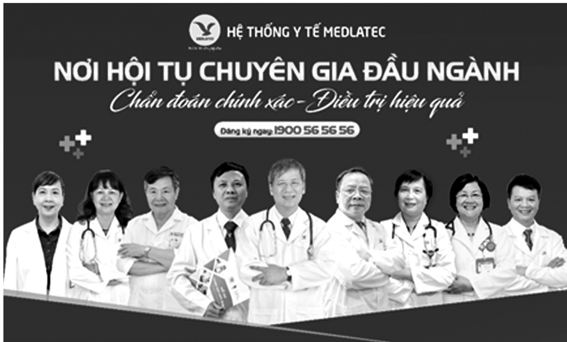
● Tại Hệ thống Y tế MEDLATEC, người dân an tâm được đội ngũ chuyên gia đầu ngành và giàu kinh nghiệm thăm khám, tư vấn tận tâm.

Tuy nhiên, siêu âm có tổn thương gan, xét nghiệm có chỉ số Bilirubin và bạch cầu ái toan đều tăng. Xét nghiệm tìm giun sán cho kết quả dương tính với giun đũa, giun tròn, giun lươn, giun đũa chó, mèo, sán lá gan lớn và sán lá gan nhỏ. Vì vậy, bác sĩ tư vấn chị H. chụp MRI,