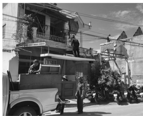
● Người dân dọn nhà nhường mặt bằng cho cao tốc.

Trước áp lực về thời hạn bàn giao mặt bằng từ Trung ương, Tỉnh ủy, UBND tỉnh Quảng Ngãi chỉ đạo quyết liệt và linh hoạt để tháo gỡ nhiều “nút thắt” trong chính sách bồi thường theo hướng có lợi nhất cho người dân vùng dự án. Với yêu cầu trên, UBND huyện Tư Nghĩa đã dừng các cuộc họp không cần thiết và phát động đợt cao điểm “30 ngày đêm giải phóng