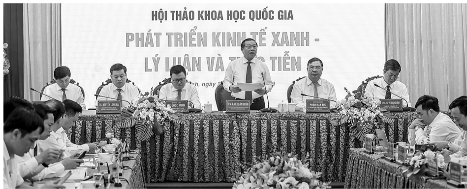
● Toàn cảnh Hội thảo Khoa học quốc gia “Phát triển kinh tế xanh - Lý luận và thực tiễn”.