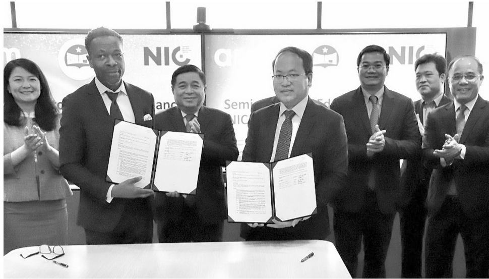
● Lãnh đạo Bộ Kế hoạch & Đầu tư chứng kiến Lễ ký kết biên bản ghi nhớ giữa Công ty ARM và Trung tâm Đổi mới sáng tạo quốc gia.

Chính phủ hiện cũng đang rất quan tâm đến đề án và đặt ra nhiệm vụ “Khẩn trương ban hành và triển khai Chiến lược phát triển ngành công nghiệp bán dẫn, đề án Phát triển nguồn nhân lực bán dẫn; phấn đấu đến năm 2030 có 50 - 100 nghìn nhân lực chất lượng cao cho ngành sản xuất chip bán dẫn”.