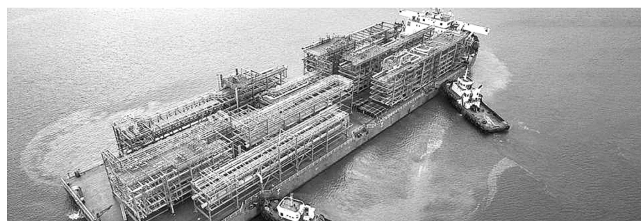
● Xuất khẩu sản phẩm công nghiệp nặng ở Khu kinh tế Dung Quất.

Báo cáo của tỉnh tại buổi làm việc cho thấy, về Nghị quyết số 23, hiện tại Quảng Ngãi đạt được nhiều kết quả quan trọng; vai trò của ngành công nghiệp ngày càng được khẳng định. Cụ thể, tốc độ tăng trưởng lĩnh vực công nghiệp bình quân