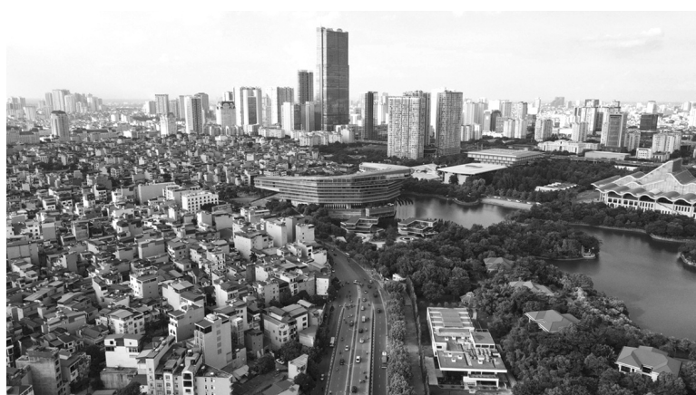
● Quang cảnh TP Hà Nội.