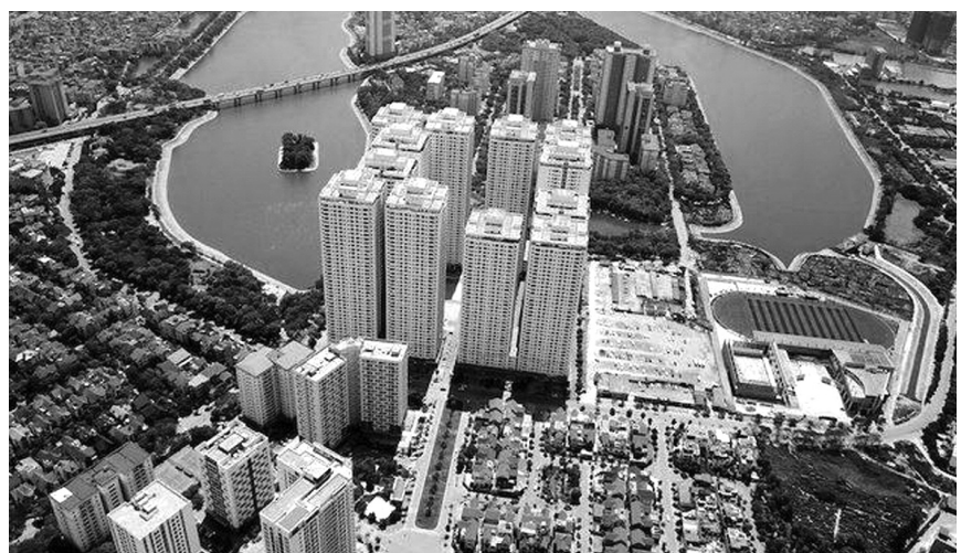
● Quy định về cải tạo, xây dựng lại nhà chung cư phải sát với thực tiễn. (Ảnh minh họa)

Phó Thủ tướng cũng giao Bộ Xây dựng phối hợp với Bộ Tài chính nghiên cứu phương án, cơ chế, nguồn vốn thực hiện quy định hoàn trả hoặc khấu trừ tiền sử dụng đất đối với trường hợp chủ đầu tư đã nộp tiền sử dụng đất, hoặc đang có quyền sử dụng đất để thực hiện dự án nhà ở xã hội. T.HOÀNG