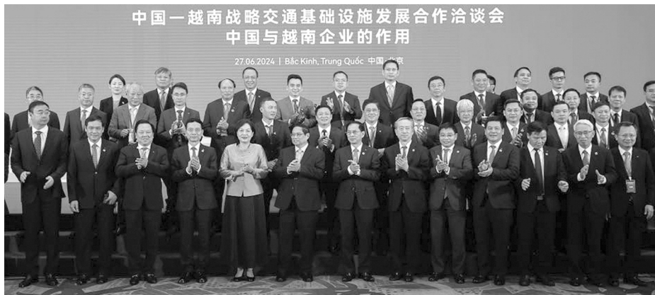
● Thủ tướng Phạm Minh Chính chụp ảnh lưu niệm với các đại biểu dự Hội nghị.

Sáng 27/6, tại Bắc Kinh, phát biểu tại Hội nghị hợp tác Việt Nam - Trung Quốc về phát triển hạ tầng chiến lược giao thông và vai trò của các doanh nghiệp Việt Nam - Trung Quốc, Thủ tướng Phạm Minh Chính mong muốn các doanh nghiệp hai nước đẩy mạnh hợp tác, ngày càng nhiều công trình hợp tác biểu tượng giữa hai nước.