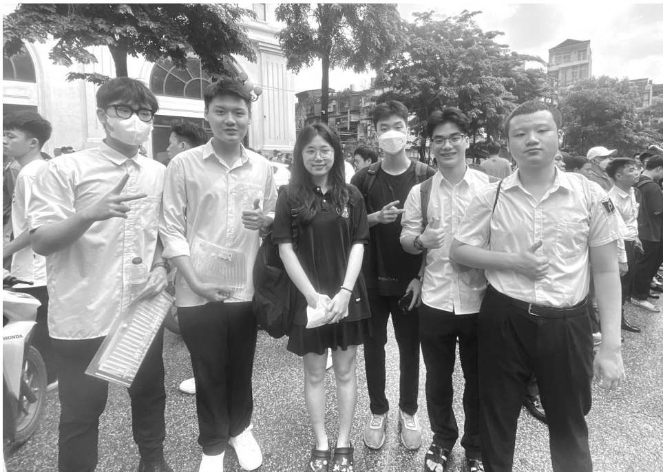
● Thí sinh kết thúc ngày thi đầu tiên.