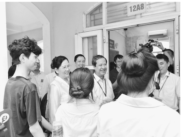
● Bộ trưởng Bộ GD&ĐT Nguyễn Kim Sơn trò chuyện, động viên thí sinh tại điểm thi Trường THPT B Duy Tiên, Hà Nam trước giờ vào phòng thi.

“Lãnh đạo Bộ GD&ĐT đã lưu ý các Sở GD&ĐT trong việc tích cực hỗ trợ cho thí sinh về ôn tập. Quá trình chuẩn bị đề thi cũng lưu ý sao cho phù hợp với nội dung đã được tinh giản trong chương trình dạy và học”, Bộ trưởng cho biết, đồng thời nhấn mạnh, yếu tố quan trọng vẫn là làm sao để thí sinh phát huy được cao nhất năng lực, kỹ năng, kiến thức và thể hiện tốt nhất qua bài thi của mình.