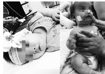
● Hình ảnh cháu bé một lần trước (bên trái) và trong khi được ông Thắng “vật lý trị liệu”.

Ngày 24/5, BV Nhi Đồng 2 có Công văn 1209/BVNĐ2-QLCL báo cáo Sở Y tế. BV cho biết ông Thắng không phải nhân viên BV Nhi Đồng 2. Ông Thắng là điều dưỡng BV Nhi Đồng TP, được gửi qua BV Nhi Đồng 2 thực tập tại