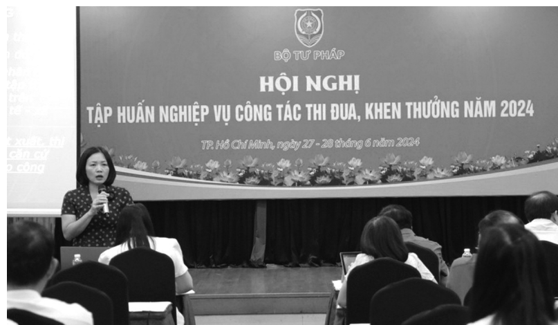
● Hội nghị tập huấn nghiệp vụ công tác thi đua, khen thưởng năm 2024 khu vực miền Nam.