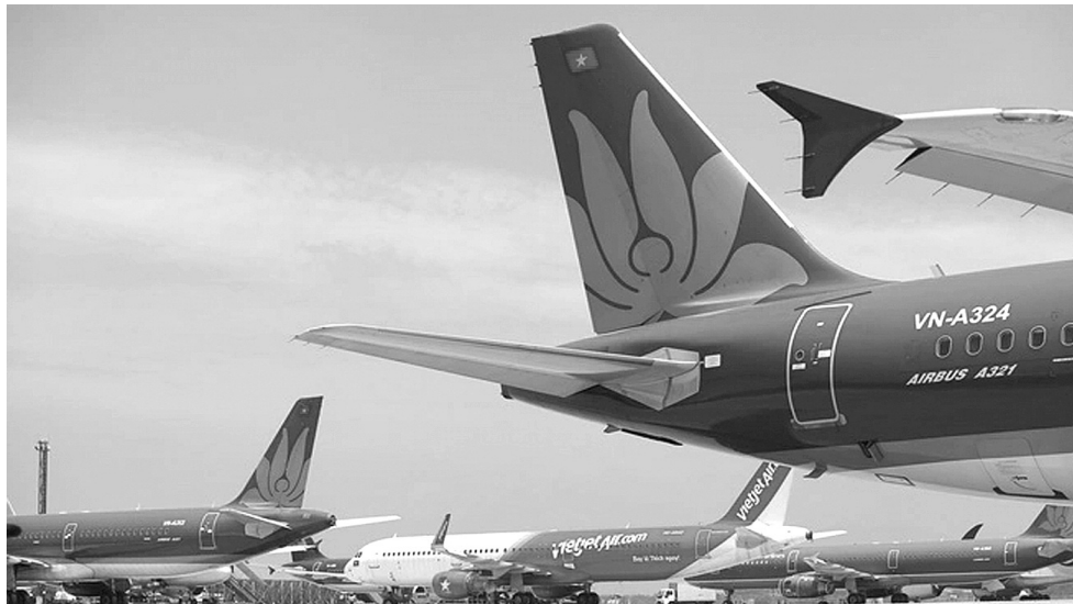
● Vé máy bay cao do nhiều nguyên nhân.

Theo quan sát của PLVN, do giá vé máy bay đi du lịch ở các tỉnh phía Nam tương đối cao nên nhiều người dân Hà Nội và các tỉnh phía Bắc thay đổi thói quen du lịch. Nếu trước đây, du khách thường đi Phú Quốc, Nha Trang, Đà Nẵng... thì mùa hè này, nhiều người đổi địa điểm đi các