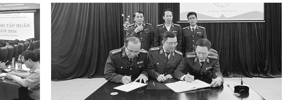
● Cục Thi hành án dân sự TP Đà Nẵng ký giao ước và thi đua năm 2024.

dựng và hoàn thiện Nhà nước pháp quyền xã hội chủ nghĩa Việt Nam trong giai đoạn mới; Chỉ thị số 04-CT/TW ngày 02/6/2021 của Ban Bí thư Trung ương Đảng về tăng cường sự lãnh đạo của Đảng đối với công tác thu hồi tài sản bị thất thoát, chiếm đoạt trong các vụ án hình sự về tham nhũng, kinh tế; Kết luận số 05-KL/TW ngày 03/6/2021 của Ban Bí thư Trung ương Đảng về tiếp tục thực hiện Chỉ thị số 50-CT/TW ngày 07/12/2015 của Bộ Chính trị trong công tác phát hiện, xử lý vụ việc, vụ án tham nhũng... Xác định công tác THADS là trách nhiệm của cấp ủy, chính quyền các cấp, là nhiệm vụ thường xuyên cần tập trung lãnh đạo, chỉ đạo thực hiện, gắn với thực hiện nhiệm vụ phát triển kinh tế - xã hội và bảo đảm an ninh trật tự ở địa phương.