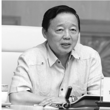
● Phó Thủ tướng Trần Hồng Hà yêu cầu ưu tiên hệ dân tầng 1 khi cải tạo lại chung cư.