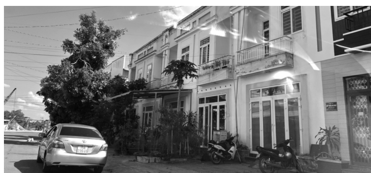
● Một góc dự án KTĐC Phú An.