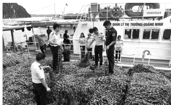
● Số hàng giống bị cơ quan chức năng phát hiện, thu giữ.