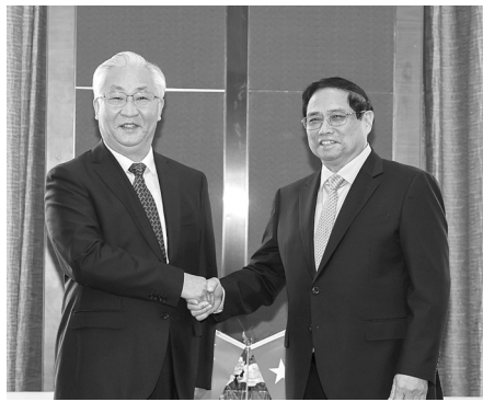
● Thủ tướng Phạm Minh Chính tiếp Ủy viên Bộ Chính trị, Phó Thủ tướng Quốc vụ viện Trung Quốc Trương Quốc Thanh.

Thủ tướng mong muốn các doanh nghiệp tiếp tục thể hiện khí thế cao, quyết