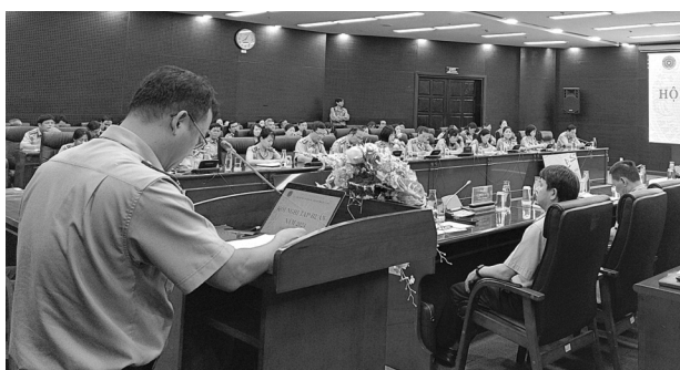
● Cục Thi hành án dân sự TP Đà Nẵng tổ chức Hội nghị tập huấn năm 2024.