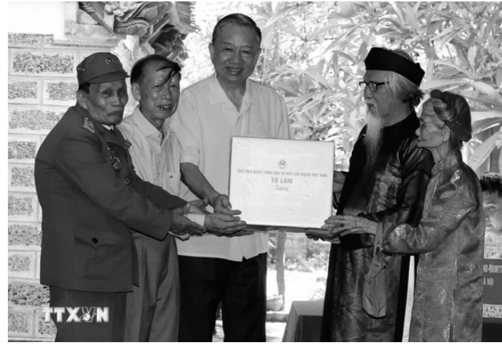
● Chủ tịch nước Tô Lâm tặng quà Nhân dân làng cổ Đường Lâm.

Chủ tịch nước nhấn mạnh, Đảng, Nhà nước luôn chăm lo cho mọi gia đình Việt Nam, nhất quán với chủ trương “không để ai bị bỏ lại phía sau”; đồng thời đánh giá cao chính quyền và Nhân