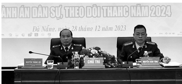
● Cục Thi hành án dân sự TP Đà Nẵng tổ chức Hội nghị triển khai thực hiện chỉ tiêu, nhiệm vụ về công tác thi hành án dân sự, theo dõi thi hành án hành chính năm 2024.