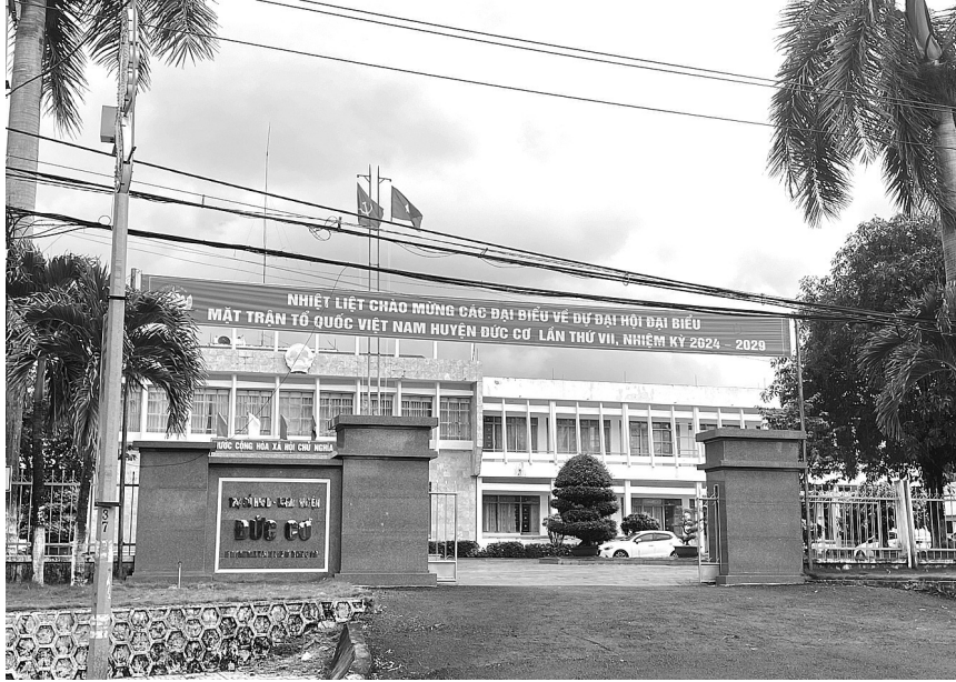
●Trụ sở UBND huyện Đức Cơ.

UBND các xã Ia Đơk, Ia Kriêng, Ia Dom, Ia Pnôn, Ia Lang, Ia Krêr,