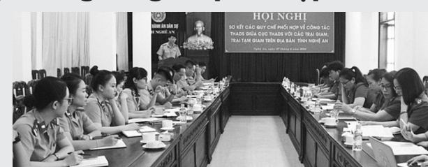
● Toàn cảnh Hội nghị sơ kết quy chế phối hợp giữa Cục THADS Nghệ An và các trại giam, trại tạm giam.

Ngay sau khi các Quy chế phối hợp được thống nhất ký kết và ban hành, các cơ quan THADS hai cấp tỉnh Nghệ An và Trại giam số 3, số 6, Trại tạm giam Công an tỉnh thông qua nhiều hình thức khác nhau đã tập trung làm tốt công tác tuyên truyền, phổ biến và triển khai thực hiện đồng bộ, thống nhất trong hệ thống nội bộ các cơ quan.