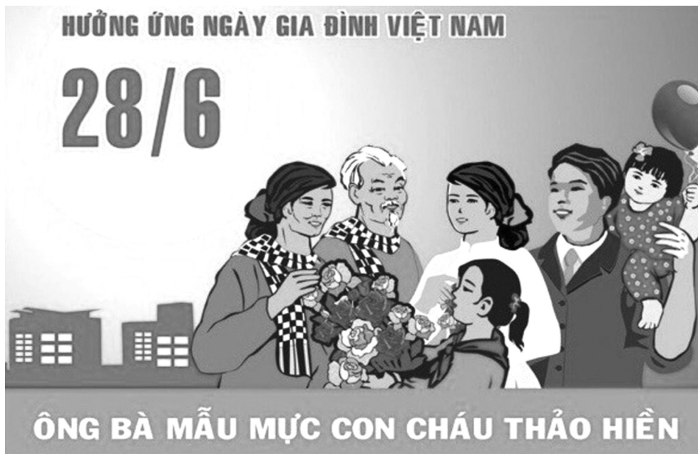
● Từ khi ra đời, Ngày Gia đình Việt Nam đã trở thành một hoạt động thiết thân, quan trọng trong đời sống gia đình Việt. (Áp phích truyền thông về Ngày Gia đình Việt Nam)

Cuộc sống hiện đại, con người chạy theo giá trị vật chất, đôi khi lãng quên đi giá trị gia đình. Trong cơn lốc của đồng tiền, của những cám dỗ, nhiều gia đình đã đánh mất đi ý nghĩa "mái ấm", không còn là "chiếc nôi" nuôi dưỡng nhân cách và tâm hồn con người. Đã có nhiều gia đình hiện