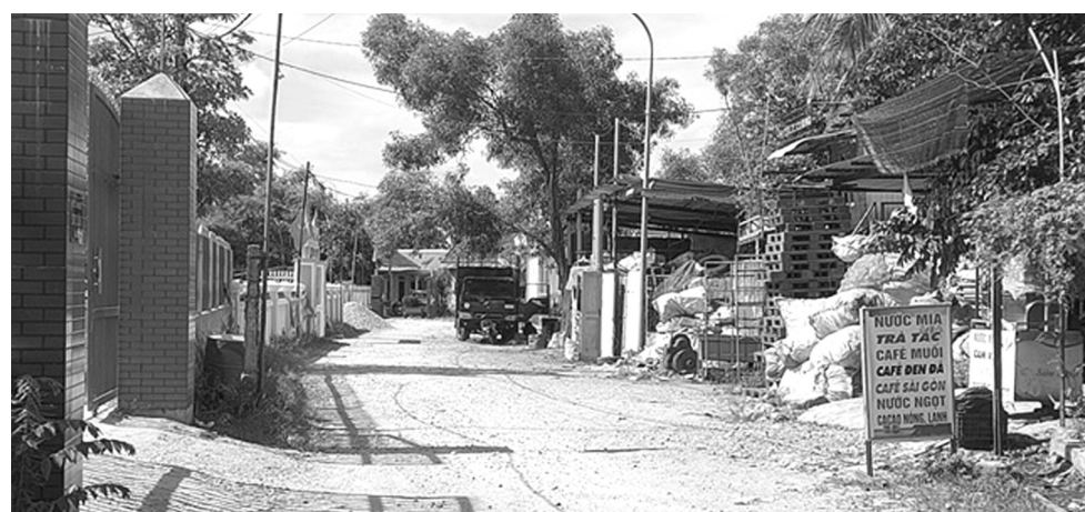
● Một cơ sở thu mua, xử lý phế liệu nằm cạnh Trạm Y tế Thủy Châu đang gây bức xúc cho người dân bởi mùi hôi lẫn tiếng ồn.

Trước những ân họa về nguy cơ cháy, nổ, ô nhiễm môi trường, năm 2016, UBND thị xã Hương Thủy giao UBND phường Thủy Châu làm chủ đầu tư để đầu tư dự án khu hạ tầng kỹ thuật di dời cơ sở kinh doanh ô nhiễm. Tuy nhiên, năm 2018 khi