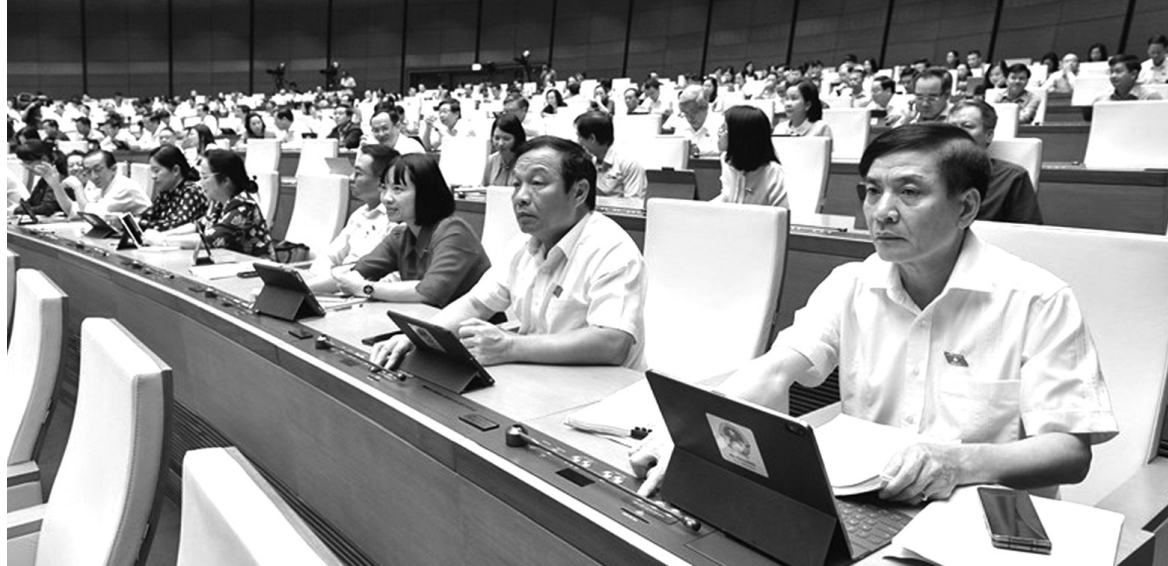
● Quốc hội biểu quyết thông qua Luật Trật tự, an toàn giao thông đường bộ. (Ảnh: Quochoi.vn)

Trong dự thảo Luật này, nếu không tiếp tục quy định tại khoản 6 Điều 5 của Luật Phòng, chống tác hại của rượu, bia năm 2019 sẽ có nguy cơ gia tăng vi phạm trật tự, an toàn giao thông đường bộ, dẫn đến làm tăng hậu quả, thiệt hại do tai nạn giao thông đường bộ gây ra; đi ngược lại những cố gắng, nỗ lực của cả hệ thống chính trị, gây lãng phí công sức, tiền bạc của Nhà nước và Nhân dân trong thời gian qua.