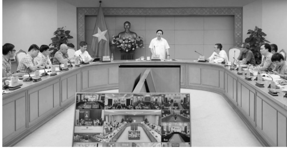
● Phó Thủ tướng Trần Hồng Hà nhấn mạnh mục tiêu là bảo đảm thu nhập, ổn định đời sống cho người trồng lúa trong mọi tình huống.

Cho ý kiến một số vấn đề cụ thể, Phó Thủ tướng yêu cầu cơ quan soạn thảo chỉnh sửa, bổ sung tiêu chí khoa học mang