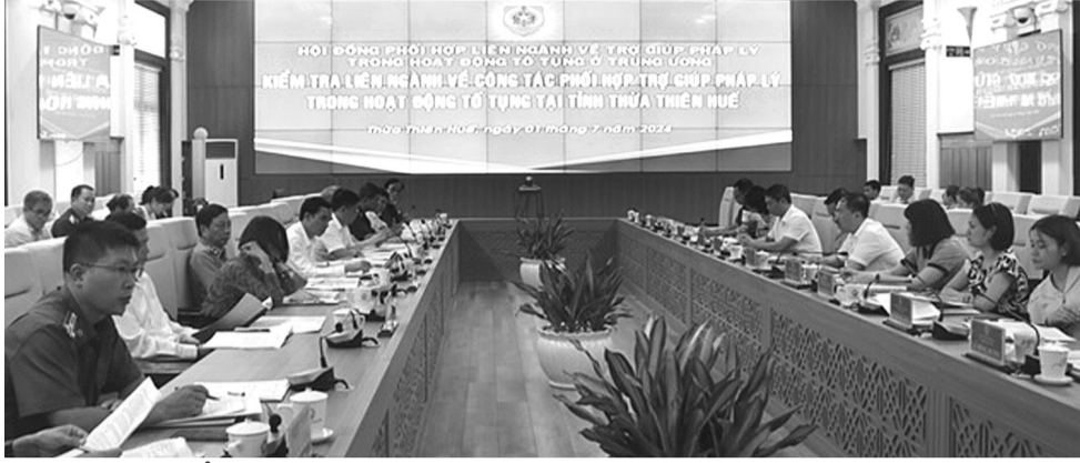
● Quang cảnh buổi làm việc.