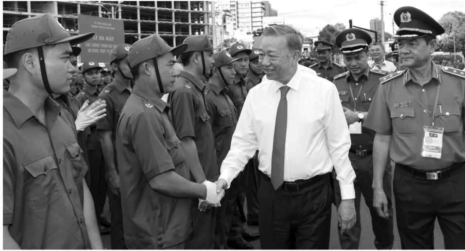
● Chủ tịch nước Tô Lâm động viên lực lượng tham gia bảo vệ an ninh trật tự ở cơ sở của TP Hồ Chí Minh.

Phát biểu tại buổi lễ, Chủ tịch nước Tô Lâm nhấn mạnh, Luật Lực lượng tham gia bảo vệ an ninh, trật tự (ANTT) ở cơ sở chính thức có hiệu lực thi hành từ ngày 1/7/2024 đã đáp ứng yêu cầu thực tiễn khách quan trong công tác bảo đảm ANTT ở cơ sở. Luật được ban hành đã thể chế hóa kịp thời chủ trương quan điểm chỉ đạo của Đảng tại Nghị quyết Đại hội XIII, đó là “Quan tâm xây dựng lực lượng, bảo đảm trật tự, an toàn xã hội cơ sở đáp ứng đòi hỏi của nhiệm vụ giữ gìn ANTT ở cơ sở”, tạo cơ sở pháp lý đầy đủ, tương xứng trong hoạt động quản lý, sử dụng lực lượng tham gia để hỗ trợ công an cấp xã thực hiện các nhiệm vụ, chủ động kịp thời giải quyết ngay tại chỗ, ngay từ cơ sở các vụ việc liên quan đến ANTT.