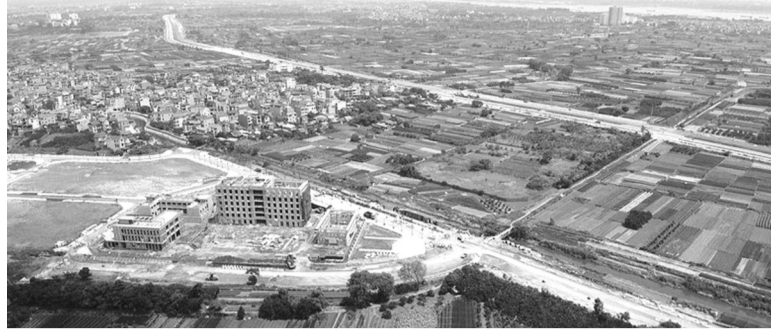
● Nghị định 71/2024/NĐ-CP đã hướng dẫn về bốn phương pháp định giá đất.

Phương pháp so sánh được thực hiện bằng cách điều chỉnh mức giá của các thửa đất có cùng mục đích sử dụng đất, tương đồng nhất định về các yếu tố có ảnh hưởng đến giá đất đã chuyển nhượng trên thị trường, đã trúng đấu giá quyền sử dụng đất mà người trúng đấu giá đã hoàn thành nghĩa vụ tài chính theo quyết định trúng đấu giá thông qua