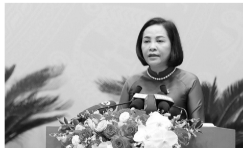
● Phó Chủ tịch Quốc hội Nguyễn Thị Thanh phát biểu tại phiên khai mạc Kỳ họp thứ 17, HĐND TP Hà Nội.

Phó Chủ tịch QH nhấn mạnh việc khẩn trương quán triệt, triển khai thi hành Luật Thủ đô (sửa đổi) và phối hợp với các cơ quan của Chính phủ tiếp thu ý kiến các đại biểu QH tại Kỳ họp để hoàn thiện 2 Quy hoạch quan trọng của Thủ đô, trình Thủ tướng Chính phủ ban hành theo thẩm quyền. Phó Chủ tịch QH Nguyễn Thị Thanh chỉ rõ, Luật Thủ đô (sửa đổi) với những cơ chế, chính sách đặc thù để Hà Nội phát triển đột phá tạo động lực dẫn dắt cả vùng, cả nước, trong đó thể hiện sự phân cấp, phân quyền mạnh mẽ cho chính quyền TP Hà Nội; nhưng cũng đặt ra trách nhiệm