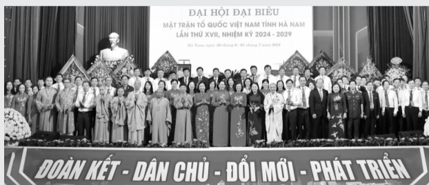
Ủy ban MTTQ Việt Nam tỉnh Hà Nam khóa XVII ra mắt Đại hội.

Chỉ đạo tại Đại hội, Phó Chủ tịch - Tổng Thư ký Ủy ban Trung ương MTTQ Việt Nam Nguyễn Thị Thu Hà biểu dương những kết quả đạt được của Ủy ban MTTQ Việt Nam tỉnh, các tổ chức thành viên các cấp trong tỉnh; đồng thời đề nghị, Ủy ban MTTQ các cấp tỉnh quan tâm bám sát các quan điểm, chủ trương của Đảng, nhất là Nghị quyết số 43-NQ/TW ngày 24/11/2023 của Ban Chấp hành Trung ương Đảng khóa XIII về "Tiếp tục phát huy truyền thống, sức mạnh đại đoàn kết toàn dân tộc, xây dựng đất nước ta ngày càng phồn vinh, hạnh phúc", triển khai đồng bộ, quyết liệt, hiệu quả các nhóm giải pháp nêu trong Nghị quyết phù hợp với tình hình của địa phương. Ủy ban MTTQ tỉnh chú trọng tuyên truyền, vận động Nhân dân thực chất, hiệu quả,