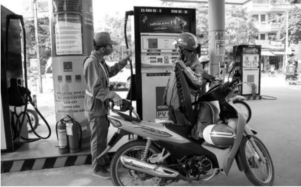
● Một cửa hàng trong hệ thống kinh doanh của PV Oil.