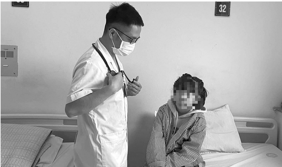
● Ghi nhận nhiều trẻ mắc đái tháo đường tuýp 1. (Ảnh minh họa)

Việt Nam chưa có dữ liệu đầy đủ về dịch tễ đái tháo đường tuýp 1 ở trẻ em, nhưng thông tin từ các bệnh viện tuyến cuối cho thấy bệnh này đang gia tăng trong cả