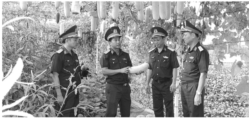
● Cục Hậu cần Quân đoàn 4 kiểm tra công tác tăng gia của Kho Tổng hợp.

Quân đoàn 4 đóng quân ở địa bàn đô thị các tỉnh, thành phố miền Đông Nam Bộ. Đây là khu vực có điều kiện kinh tế và hạ tầng phát triển năng động, với mật độ dân cư cao nên có nhiều thuận lợi trong công tác bảo đảm hậu cần. Tuy nhiên, ngành Hậu cần Quân đoàn vẫn gặp không ít khó khăn, như: Địa hình, thời tiết, khí hậu khu vực