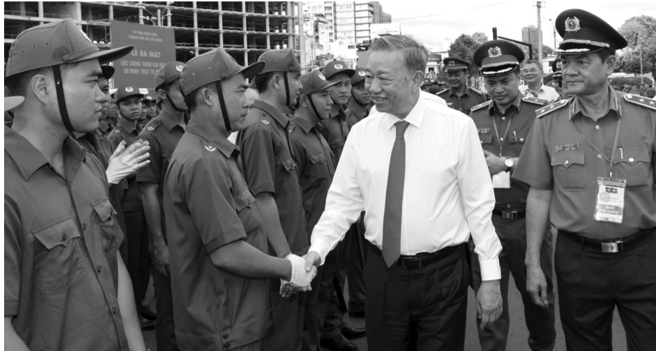
● Chủ tịch nước Tô Lâm động viên lực lượng tham gia bảo vệ an ninh trật tự ở cơ sở của TP Hồ Chí Minh.

Phát biểu tại buổi lễ, Chủ tịch nước Tô Lâm nhấn mạnh, Luật Lực lượng tham gia bảo vệ an ninh, trật tự (ANTT) ở cơ sở chính thức có hiệu lực thi hành từ ngày 1/7/2024 đã đáp ứng yêu cầu thực tiễn khách quan trong công tác bảo đảm ANTT ở cơ sở. Luật được ban hành đã thể chế hóa kịp thời chủ trương quan điểm chỉ đạo của Đảng tại Nghị quyết Đại hội XIII, đó là “Quan tâm xây dựng lực lượng, bảo đảm trật tự, an toàn xã hội cơ sở đáp ứng đòi hỏi của nhiệm vụ giữ gìn ANTT ở cơ sở”, tạo cơ sở pháp lý đầy đủ, tương xứng trong hoạt động quản lý, sử dụng lực lượng tham gia để hỗ trợ công an cấp xã thực hiện các nhiệm vụ, chủ động kịp thời giải quyết ngay tại chỗ, ngay từ cơ sở các vụ việc liên quan đến ANTT.