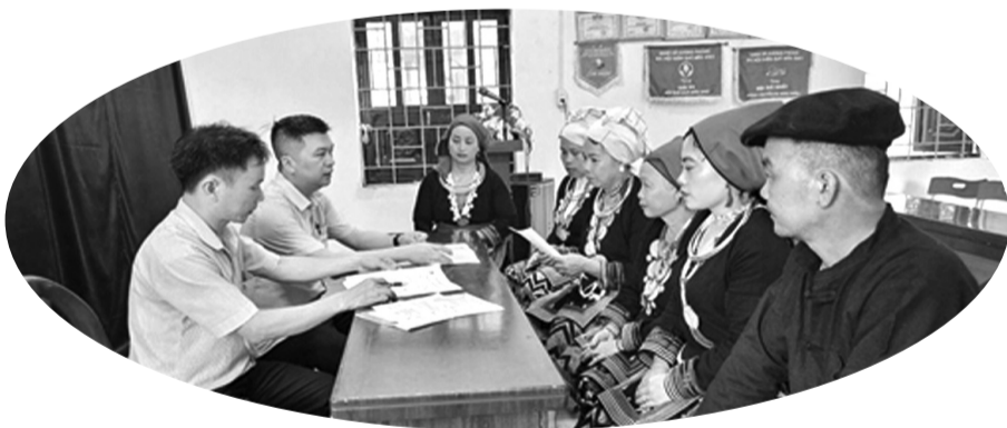
● Điểm giao dịch xã thuộc huyện Pác Nặm.

Công cuộc giảm nghèo bền vững, xây dựng nông thôn mới của tỉnh Bắc Kạn đã đạt được những kết quả ấn tượng. Nguồn vốn tín dụng chính sách đã góp phần quan trọng trong thực hiện công cuộc này suốt 22 năm qua. Thời gian tới, cùng các cấp, các ngành, NHCSXH tỉnh Bắc Kạn vẫn bền bỉ, dốc sức tiếp tục tập trung huy động các nguồn lực, chuyên tải nhanh chóng mọi đồng vốn chính sách về tận bản làng đầu tư đúng và trúng mục tiêu, đối tượng, góp phần thúc đẩy vùng núi cao thêm no đủ, tươi sáng. ĐÔNG DU