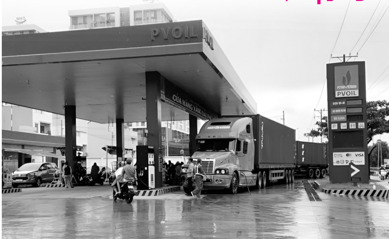
● Một cửa hàng trong hệ thống kinh doanh của PV Oil.