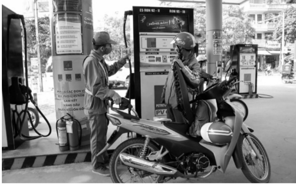
● Một cửa hàng trong hệ thống kinh doanh của PV Oil.