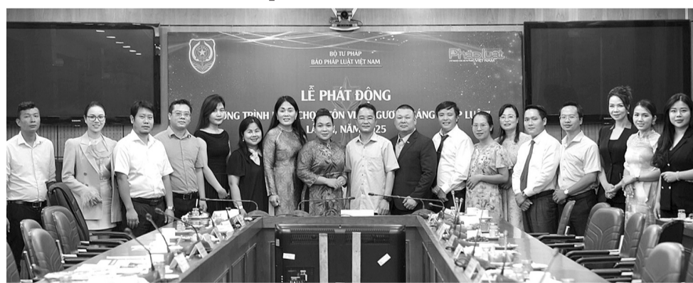
● Lãnh đạo Báo PLVN chụp ảnh lưu niệm cùng các nhà tài trợ.