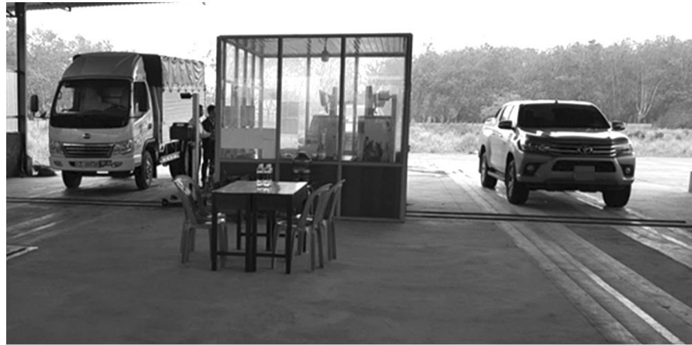
● Hình minh họa.