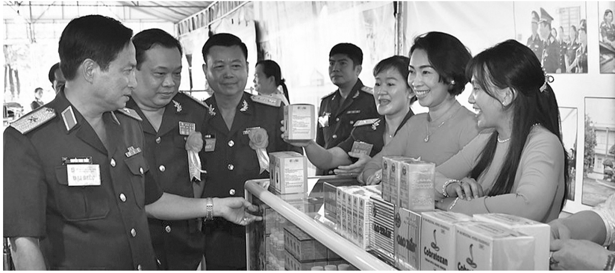
● Các đại biểu tham quan gian trưng bày sản phẩm của Cục Hậu cần Quân khu 9.