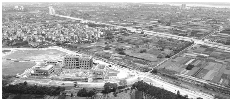
● Nghị định 71/2024/NĐ-CP đã hướng dẫn về bốn phương pháp định giá đất.

Chính phủ vừa ban hành Nghị định 71/2024/NĐ-CP quy định về giá đất, trong đó đáng chú ý là quy định về các yếu tố ảnh hưởng đến giá đất.