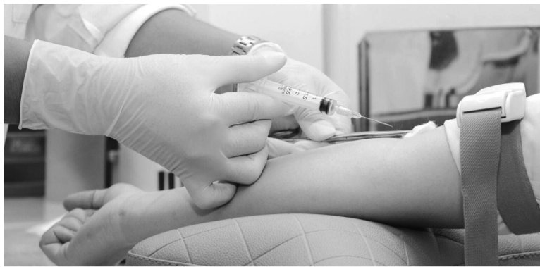
●Người dân cần đến cơ sở y tế chuyên nghiệp, được cấp phép khi có nhu cầu khám, chữa bệnh để tránh các nguy cơ về sức khỏe, tính mạng. (Ảnh minh họa)

Mới đây, Sở Y tế TP Hồ Chí Minh đã phát hiện Công ty TNHH Dịch vụ chăm sóc y tế VMEDI (tại quận Bình Tân) quảng cáo và cung cấp dịch vụ truyền nước biển tại nhà trái quy định. Công ty này mở một “phòng khám dịch vụ” chuyên truyền nước biển, ẩn bên trong một quán cà phê tại phường Tân Định, quận 1. Qua kiểm tra cho thấy, người trực tiếp thực hiện truyền nước biển tại nhà cho người dân tại địa chỉ này là một người phụ nữ 32 tuổi, từng học lớp sơ cấp y 1 năm vào năm 2009, không có chứng chỉ hành nghề và thực hiện dịch vụ truyền dịch tại nhà với số tiền 350 ngàn/khách hàng. Tại cơ sở này, Đoàn kiểm tra phát hiện có túi sơ cấp cứu, máy đo huyết áp, ống