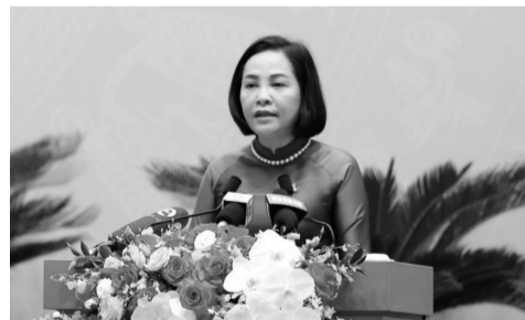
● Phó Chủ tịch Quốc hội Nguyễn Thị Thanh phát biểu tại phiên khai mạc Kỳ họp thứ 17, HĐND TP Hà Nội.

Phó Chủ tịch QH nhấn mạnh việc khẩn trương quán triệt, triển khai thi hành Luật Thủ đô (sửa đổi) và phối hợp với các cơ quan của Chính phủ tiếp thu ý kiến các đại biểu QH tại Kỳ họp để hoàn thiện 2 Quy hoạch quan trọng của Thủ đô, trình Thủ tướng Chính phủ ban hành theo thẩm quyền. Phó Chủ tịch QH Nguyễn Thị Thanh chỉ rõ, Luật Thủ đô (sửa đổi) với những cơ chế, chính sách đặc thù để Hà Nội phát triển đột phá tạo động lực dẫn dắt cả vùng, cả nước, trong đó thể hiện sự phân cấp, phân quyền mạnh mẽ cho chính quyền TP Hà Nội; nhưng cũng đặt ra trách nhiệm