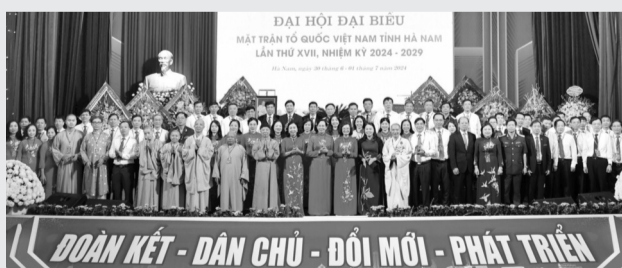
● Ủy ban MTTQ Việt Nam tỉnh Hà Nam khóa XVII ra mắt Đại hội.

Chỉ đạo tại Đại hội, Phó Chủ tịch - Tổng Thư ký Ủy ban Trung ương MTTQ Việt Nam Nguyễn Thị Thu Hà biểu dương những kết quả đạt được của Ủy ban MTTQ Việt Nam tỉnh, các tổ chức thành viên các cấp trong tỉnh; đồng thời đề nghị, Ủy ban MTTQ các cấp tỉnh quan tâm bám sát các quan điểm, chủ trương của Đảng, nhất là Nghị quyết số 43-NQ/TW ngày 24/11/2023 của Ban Chấp hành Trung ương Đảng khóa XIII về "Tiếp tục phát huy truyền thống, sức mạnh đại đoàn kết toàn dân tộc, xây dựng đất nước ta ngày càng phồn vinh, hạnh phúc", triển khai đồng bộ, quyết liệt, hiệu quả các nhóm giải pháp nêu trong Nghị quyết phù hợp với tình hình của địa phương. Ủy ban MTTQ tỉnh chú trọng tuyên truyền, vận động Nhân dân thực chất, hiệu quả,