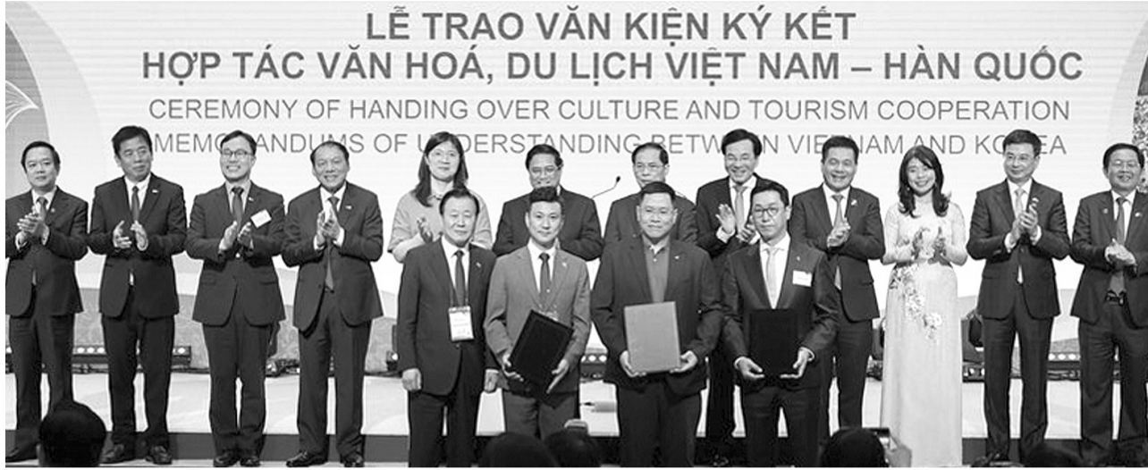
● Thủ tướng Phạm Minh Chính chứng kiến Lễ trao văn kiện ký kết hợp tác văn hóa, du lịch Việt Nam - Hàn Quốc.

Chiều 1/7, trong chương trình thăm chính thức Hàn Quốc, Thủ tướng Phạm Minh Chính đã dự Diễn đàn hợp tác lao động Việt Nam - Hàn Quốc nhằm nâng cao chất lượng hợp tác lao động giữa hai nước.