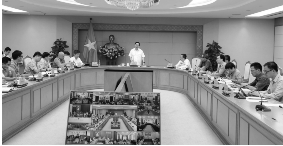
● Phó Thủ tướng Trần Hồng Hà nhấn mạnh mục tiêu là bảo đảm thu nhập, ổn định đời sống cho người trồng lúa trong mọi tình huống.

Cho ý kiến một số vấn đề cụ thể, Phó Thủ tướng yêu cầu cơ quan soạn thảo chỉnh sửa, bổ sung tiêu chí khoa học mang