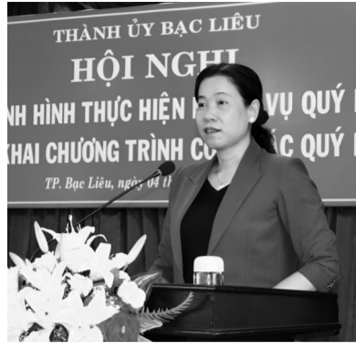
● Bà Tô Việt Thu, Tỉnh ủy viên, Bí thư Thành ủy TP Bạc Liêu.

Đề bảo đảm tiến độ về đích đô thị loại I năm 2025, Bí thư Thành ủy TP Bạc Liêu yêu cầu từng phòng, ban, ngành TP và phường, xã tập trung thực hiện các tiêu chí, tiêu chuẩn đô