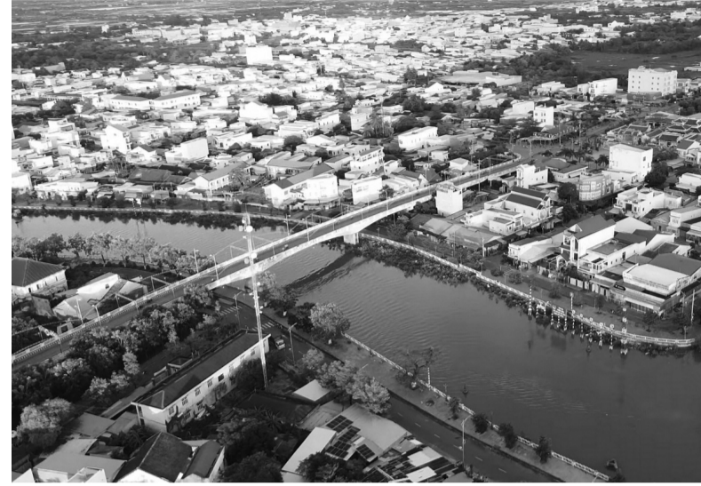
● TP Bạc Liêu đã đẩy nhanh tiến độ các dự án Khu dân cư Trảng An, Khu dân cư Hoàng Phát,... Đến nay, hệ thống hạ tầng thiết yếu các khu dân cư cơ bản được hoàn thiện và nâng cấp, từng bước đồng bộ.

Mới đây, ngày 11/6, Thành ủy TP Bạc Liêu đã tổ chức sơ kết 3