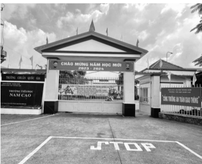
● Trường Tiểu học Nam Cao.

Ngoài ra, UBND huyện Trảng Bom cũng yêu cầu Hiệu trưởng Trường Tiểu học Nam Cao phải hoàn trả số tiền hơn 360 triệu đồng chi sai quy định. Giao Phòng Nội vụ tham mưu UBND huyện tổ chức kiểm điểm, xử lý trách nhiệm đối với tổ chức, cá nhân liên quan theo đúng quy định pháp luật. Giao Thanh tra huyện chuyển nội dung vụ việc trên cho cơ quan Công an huyện để tiếp tục làm rõ theo quy định của pháp luật. TRUNG NGHĨA