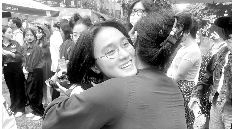
●Niên học 2023 - 2024, điểm chuẩn vào lớp 10 có nhiều biến động bất ngờ.

Ngược lại với một số trường tốp đầu đang hạ điểm chuẩn mạnh, có những trường tụt sau, trường tư thục có mức điểm chuẩn tăng so với những năm trước. THPT Bất Bạt tăng 8 điểm so với năm trước, đây là một điều đáng ngạc nhiên vì THPT Bất Bạt vốn không phải ưu tiên hàng đầu của phụ huynh, học sinh trong vài năm trở lại đây. Hay Trường THPT Thăng Long có điểm chuẩn 42,25, tăng 1,25 điểm và hiện đang lọt vào tốp những trường cấp III có điểm chuẩn cao nhất ở Hà Nội niên học 2024 - 2025.