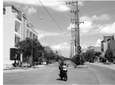
● Đến nay, TP Bạc Liêu đã đạt 46/59 tiêu chuẩn theo quy định đô thị loại I.

“Thời gian tới, cả hệ thống chính trị địa phương càng phải