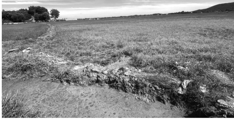
● Hơn 1,5ha lúa của người dân thôn Bình Sơn, xã Gia Hanh, huyện Can Lộc bị chết do sự cố tràn dầu.