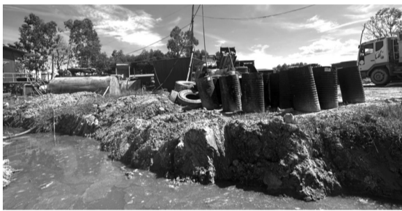
● Bãi chứa nguyên liệu của Cty CP Trường Long ở thôn Bình Sơn.