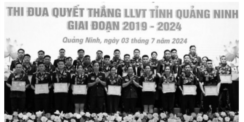
● Nhiều tập thể, cá nhân vinh dự được khen thưởng trong thực hiện phong trào Thi đua Quyết thắng tại Quảng Ninh.

Ngày 3/7, Lực lượng vũ trang (LLVT) tỉnh Quảng Ninh tổ chức Đại hội Thi đua Quyết thắng giai đoạn 2019 - 2024 nhằm đánh giá tổng kết công tác thi đua, khen thưởng và phong trào Thi đua Quyết thắng; tôn vinh, biểu dương, khen thưởng những điển hình tiên tiến; xác định phương hướng, nhiệm vụ, giải pháp giai đoạn 2024 - 2029.