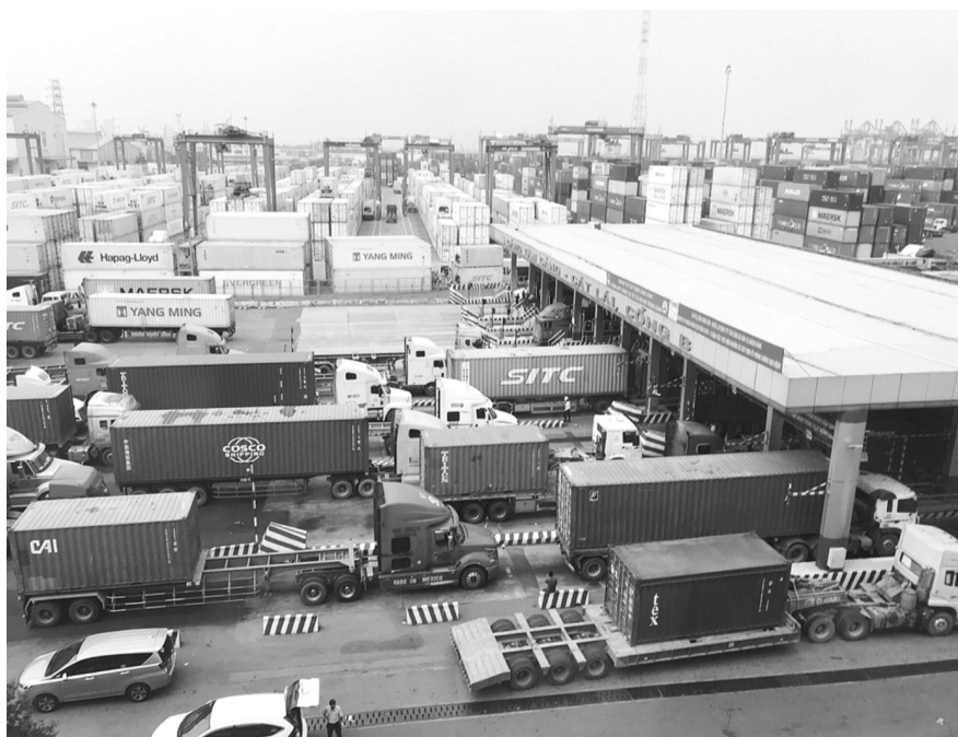
● Hàng hóa ra vào cảng Cát Lái, Tổng Công ty Tân cảng Sài Gòn.