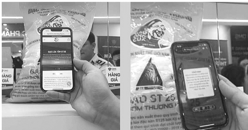
● Cùng một sản phẩm nhưng kết quả xác thực thật - giả lại khác nhau.

Nhân kỷ niệm 67 năm Ngày truyền thống lực lượng Quản lý thị trường (QLTT), sáng qua (3/7), tại Hà Nội, Tổng cục QLTT mở cửa Phòng trưng bày với chủ đề “Nhận diện thực phẩm thật - giả”. Đây là lần thứ 12 Phòng trưng bày của Tổng cục QLTT mở cửa đón khách tham quan tìm hiểu thông tin về sản phẩm, trang bị kiến thức phân biệt hàng hóa thật - giả trên thị trường.