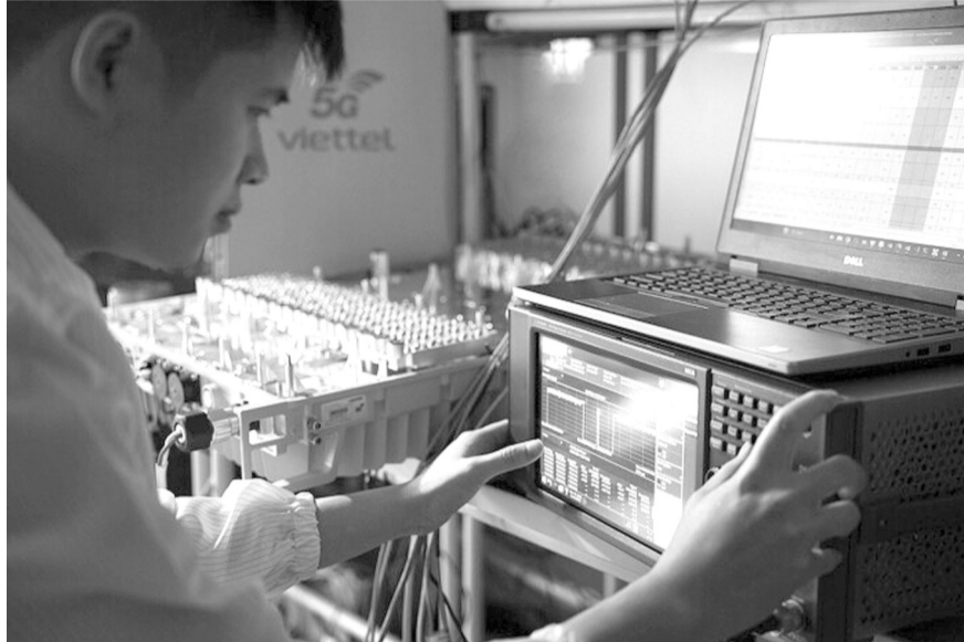
● Viettel đã cung cấp sản phẩm 5G cả phần cứng và phần mềm.

Năm 2023, các DN thuộc BQP đã có nhiều nỗ lực, tiếp tục duy trì hoạt động sản xuất kinh doanh ổn định và tăng trưởng hơn so với các năm trước. Vốn và tài sản của Nhà nước