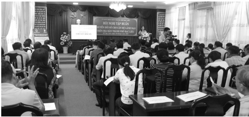
● UBND TP Bạc Liêu đã tổ chức nhiều lớp tập huấn chuyển đổi số và đào tạo phương thức nộp TTHC qua cổng dịch vụ công; thanh toán phí, lệ phí điện tử cho lãnh đạo các đơn vị...

via hè... Cùng với đó, TP cần tập trung vào công tác điều chỉnh quy hoạch, nâng cao chất lượng các điểm du lịch tiêu biểu...”, Bí thư Thành ủy TP Bạc Liêu yêu cầu.