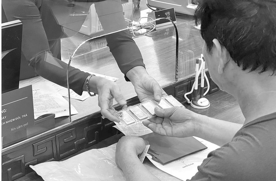
● Khách đăng ký mua vàng online, nhận tại quầy giao dịch Agribank.

Tại các cửa hàng kinh doanh tư nhân cũng không còn tình trạng người dân mua vàng. Thịnh thoảng vẫn có các giao dịch nhưng đa phần là mua các loại vàng trang sức. Đại diện cửa hàng vàng trên phố Trần Nhân Tông (vốn được mệnh danh là phố vàng ở Hà Nội) cho biết, hàng ngày, cửa hàng vẫn đón lượng khách nhất định, có người đến hỏi mua vàng nhẫn nhưng cũng chỉ hỏi để đẩy vì hiện giờ giá vàng nhẫn đã “tiệm cận” giá vàng miếng của Nhà nước.