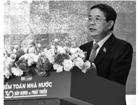
● Phó Chủ tịch Quốc hội Nguyễn Đức Hải phát biểu tại Hội thảo.

Bên cạnh đó, KTNN đã kiến nghị sửa đổi, bổ sung, thay thế, hủy bỏ hơn 2.200 văn bản quy phạm pháp luật, văn bản quản lý sai quy định hoặc không phù hợp với quy định của Nhà nước và thực tiễn, kịp thời khắc phục "lỗ hổng" về cơ chế, chính sách, tránh thất thoát, lãng phí, siết chặt kỷ cương, kỷ luật tài chính, góp phần làm lành mạnh nền tài chính quốc gia. Trong đó có việc đề xuất nhiều ý kiến có giá trị để hoàn thiện một số văn bản quy phạm pháp luật quan trọng như Luật NSNN, Luật Đất đai, Luật Quản lý thuế, Luật Đầu tư công, Luật Phòng, chống tham nhũng, Luật Bảo hiểm xã hội...; kiến nghị cơ quan có thẩm quyền chỉ đạo, tổ chức kiểm điểm trách nhiệm đối với nhiều tập thể, cá nhân có sai phạm theo quy định của pháp luật.