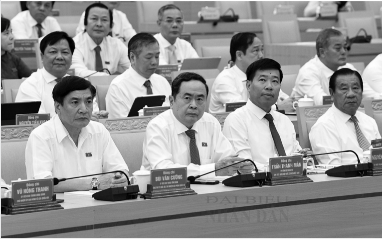
● Chủ tịch Quốc hội Trần Thanh Mẫn (thứ hai từ trái qua) và các đại biểu dự khai mạc Kỳ họp thứ 15, HĐND tỉnh Bình Phước Khóa X.

Ngày 3/7, Chủ tịch Quốc hội Trần Thanh Mẫn dự khai mạc Kỳ họp thứ 15, HĐND tỉnh Bình Phước khóa X, nhiệm kỳ 2021 - 2026.