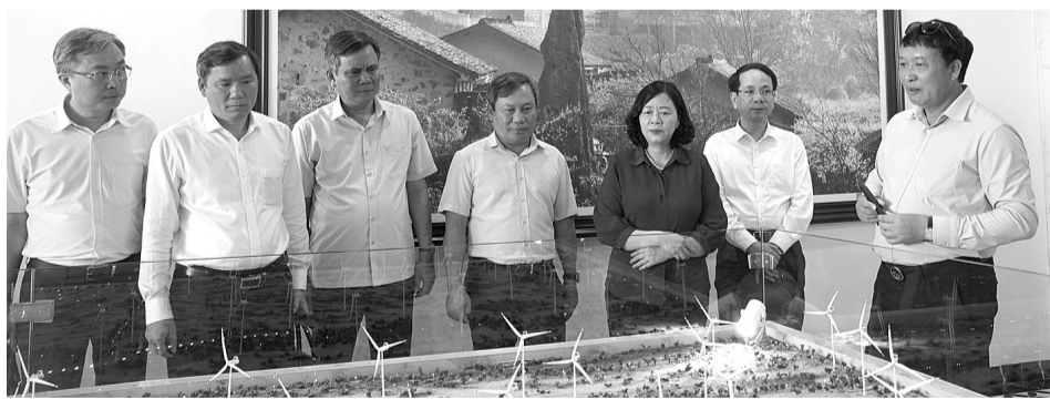
● Trưởng Ban Dân vận Trung ương Bùi Thị Minh Hoài và Đoàn công tác thăm Cụm trang trại điện gió B&T.

Ngày 3/7, Ủy viên Bộ Chính trị, Bí thư Trung ương Đảng, Trưởng Ban Dân vận Trung ương Bùi Thị Minh Hoài và Đoàn khảo sát thuộc Tiểu ban Văn kiện Đại hội XIV của Đảng đã khảo sát thực tế tại Cụm trang trại điện gió B&T, dự án (DA) đường ven biển - cầu Nhật Lệ 3 và làm việc với Ban Thường vụ Tỉnh ủy Quảng Bình.