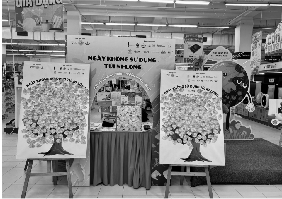
● Hoạt động hưởng ứng “Ngày quốc tế không sử dụng túi ni-lông”. (Ảnh: PV)

Một trong những nhà bán lẻ đi đầu trong việc triển khai các hoạt động xanh phải kể đến Central Retail Việt Nam. Kể từ năm 2019, thương hiệu này đã chủ động tham gia chương trình bảo vệ môi trường thông qua phát động các chiến dịch không dùng túi ni-lông. Trong quãng thời gian 5 năm tham gia, Central Retail Việt Nam đã có nhiều tác động tích cực đến các giải pháp đóng gói sản phẩm từ phía nhà cung