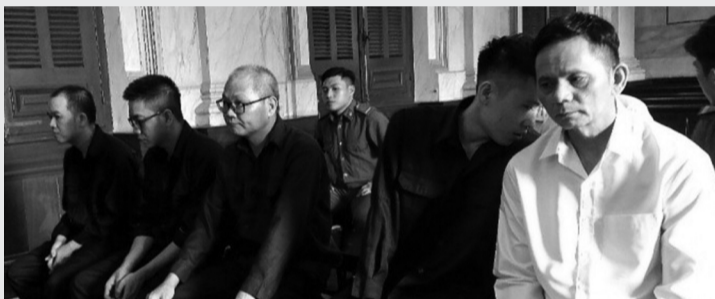
● Các bị cáo tại phiên xử.

Cáo trạng xác định, khoảng tháng 7/2016, ông Phan Công Bình làm giấy đề nghị cùng hồ sơ báo cáo tình hình tài chính gửi ABBank, đề xuất vay 470 tỷ đồng để bổ sung vốn lưu động phục vụ kinh doanh và tài trợ xuất khẩu.