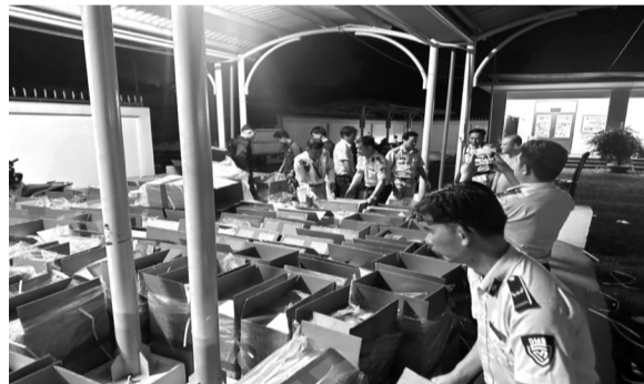
● Tang vật trong sự việc.

Theo Cục QLTT TP, buôn lậu thuốc lá điều qua