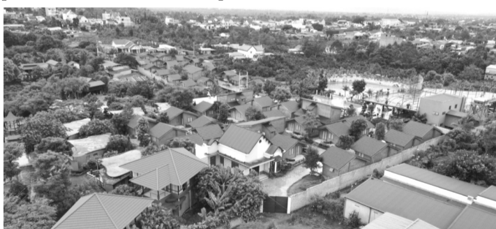
● Thị trường BDS Lâm Đồng còn nhiều khó khăn, vướng mắc cản trở tháo gỡ.

Ngoài ra, có sự thiếu đồng bộ giữa quy hoạch sử dụng đất và quy hoạch xây dựng; công tác bồi thường giải phóng mặt bằng là phương pháp xác định giá đất còn nhiều vướng mắc làm chậm tiến độ bồi thường, hỗ trợ và tái định cư, thỏa thuận thu hồi đất;