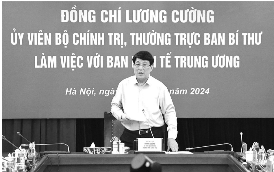
● Thường trực Ban Bí thư Lương Cường phát biểu tại buổi làm việc.

Tại buổi làm việc, Thường trực Ban Bí thư Lương Cường đánh giá cao Ban Kinh tế Trung ương thời gian qua đã bảo đảm tiến độ, chất lượng các nhiệm vụ được giao. Trong đó nổi bật là thực hiện tốt công tác tham mưu chiến lược, góp phần cụ thể hóa các quan điểm, định hướng lớn