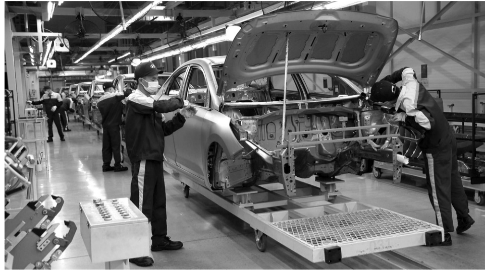
● Tỉnh Ninh Bình xác định công nghiệp cơ khí ô tô hiện đại là động lực của sự phát triển. (Ảnh: PV)