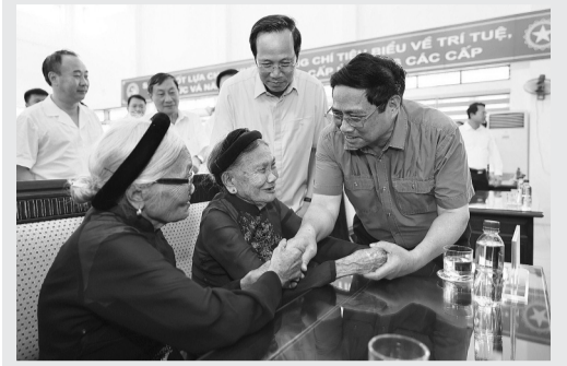
●Thủ tướng Phạm Minh Chính thăm, tặng quà Mẹ Việt Nam anh hùng tại Trung tâm Điều dưỡng người có công Ninh Bình năm 2023.

Với quan điểm, mục tiêu nhất quán của Đảng, Nhà nước đặt chính sách xã hội ngang tầm với chính sách kinh tế, gắn kinh tế với xã hội, tăng trưởng kinh tế với chính sách xã hội, thống nhất chính sách kinh tế với chính sách xã hội, tăng trưởng kinh tế đi đôi với thực hiện tiến bộ và công bằng xã hội trong từng bước, từng chính sách và trong suốt quá trình phát triển. Trong những năm qua, cùng với những thành tựu đạt được trong phát triển kinh tế, chính sách ưu đãi người có công với cách mạng, thân nhân người có công với cách mạng tiếp tục nghiên cứu được sửa đổi, bổ sung và hoàn thiện.