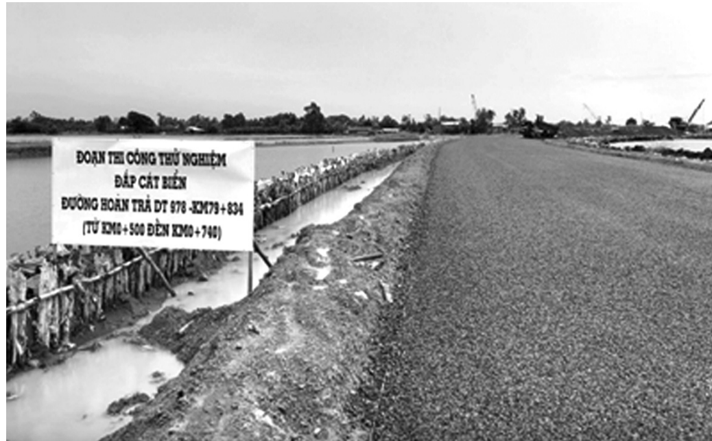
● Tiếp tục thí điểm dùng cát biển làm đường cao tốc.

Trên cơ sở kết quả nêu trên, Bộ GTVT cho rằng chưa thể dùng cát biển xây dựng đường cao tốc một cách đại trà, đề nghị UBND các tỉnh, thành phố căn cứ nhu cầu, điều kiện thực tế triển khai dự án của địa phương để tổ chức triển khai thí điểm mở rộng sử dụng cát biển làm nền đường cho dự án xây dựng công trình giao thông có điều kiện tự nhiên, môi trường tương tự như dự án thí điểm. Trong quá trình triển khai thực hiện, các đơn