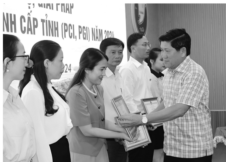
● Ông Lê Văn Sửu - Phó Chủ tịch UBND tỉnh Cà Mau trao Bằng khen của Chủ tịch UBND tỉnh cho các cá nhân tiêu biểu tại Hội nghị triển khai nhiệm vụ, giải pháp nâng cao năng lực cạnh tranh cấp tỉnh (PCI, PGI) năm 2024.

Ông Huỳnh Quốc Việt - Ủy viên dự khuyết BCH TW Đảng, Phó Bí thư Tỉnh ủy, Chủ tịch UBND tỉnh Cà Mau cho biết: “Với kết quả trên cũng là áp lực