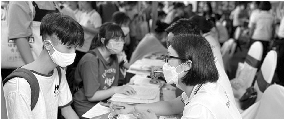
● Thí sinh cần tỉnh táo khi lựa chọn nghề nghiệp. (Ảnh minh họa: PV)