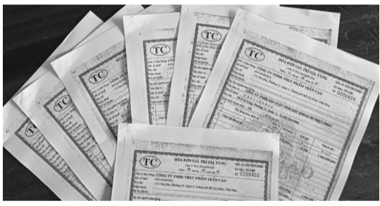
● 41 hóa đơn trong sự việc.

mất hóa đơn GTGT đã phát hành nhưng chưa lập mẫu (số: 01GTKT3/003; ký hiệu hóa đơn: TC/18P từ số 555 đến 1000 - số lượng: 446 số). Chi cục Thuế quận 4 khẳng định việc xử phạt Cty Trần Cao vi phạm về hóa đơn “không liên quan đến 41 hóa đơn GTGT Cty Trần Cao đã xuất bán cho Cty Nhựa Phát”.