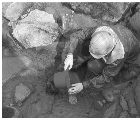
● Cơ quan chức năng lấy mẫu nước, bùn ở khu vực xảy ra hiện tượng cá chết.

Trước đó, tối ngày 30/6, trên mạng xã hội xuất hiện clip ghi lại cảnh dòng suối Bắc chảy qua xã Châu Thành, huyện Quỳnh Hợp xuất hiện màu nước