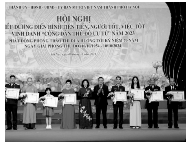
● Lãnh đạo TP Hà Nội biểu dương, trao thưởng các gương người tốt, việc tốt tiêu biểu của thành phố năm 2023.

UBND TP Hà Nội vừa ban hành Kế hoạch số 05/KH/BTC triển khai cuộc thi viết về điển hình tiên tiến, người tốt, việc tốt và công tác phát hiện, tuyên truyền, nhân rộng điển hình tiên tiến trong phong trào thi đua yêu nước TP Hà Nội năm 2025.