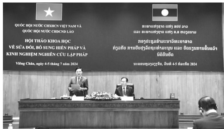
● Phó Chủ tịch Quốc hội Nguyễn Khắc Định trình bày tham luận tại Tọa đàm.

Đặc biệt, sửa đổi Hiến pháp để tiếp tục xây dựng và hoàn thiện Nhà nước pháp quyền XHCN Việt Nam. Theo đó, việc sửa đổi Hiến