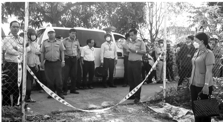
● Cường chế THADS ở Cần Thơ.

Hiện nay, mặc dù Điều 35 Luật THADS đã quy định rõ thẩm quyền của cơ quan THADS cấp huyện, cấp tỉnh, cấp quân khu, đặc biệt quy định “đương sự hoặc tài sản ở nước ngoài hoặc cần phải ủy thác tư pháp về thi hành án” thì thuộc thẩm quyền thi hành án của cơ quan THADS cấp tỉnh. Tuy nhiên, thực tế nhiều vụ việc tại giai đoạn xét xử và tuyên án của Tòa án đương sự đang ở nước ngoài