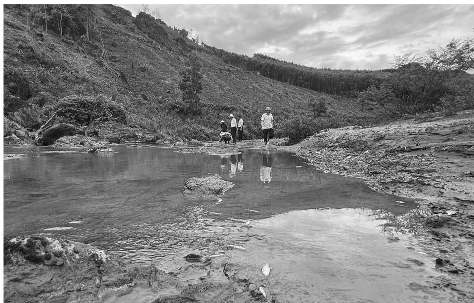
● Cá chết bất thường trên suối Bắc.

Đoàn tiếp tục kiểm tra tại khu vực bể lắng về phía Đông thuộc xã Châu Hồng của Cty này (khu vực 2). Hệ thống bể lắng