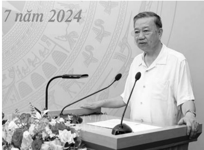
● Chủ tịch nước Tô Lâm đề nghị Đảng ủy Công an Trung ương, Bộ Công an tiếp tục phát huy tinh thần gương mẫu trong phòng, chống tham nhũng, tiêu cực.

Phát biểu chỉ đạo tại Hội nghị, Chủ tịch nước Tô Lâm, Thủ tướng Phạm Minh Chính ghi nhận, biểu dương những thành tích, kết quả nổi bật của Đảng ủy Công an Trung ương, Bộ Công an trong thời gian qua. Định hướng nhiệm vụ thời