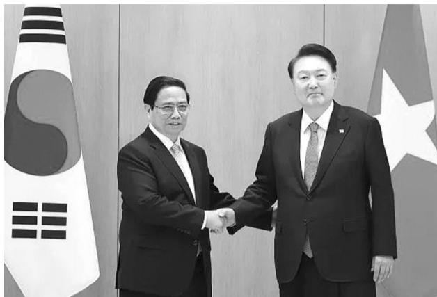
● Thủ tướng Phạm Minh Chính gặp Tổng thống Hàn Quốc Yoon Suk Yeol.