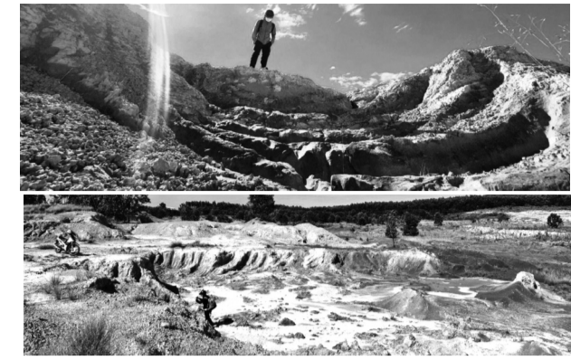
● Sau gần 10 năm thực hiện, dự án vẫn chỉ là bãi đất bị đào xới lấy đất sét mang bán.

10/9/2021. Hết thời hạn nêu trên, chủ dự án không hoàn thành các hạng mục theo như dự án đã được phê duyệt, UBND huyện lập thủ tục đề nghị UBND tỉnh Quảng Nam thu hồi dự án theo đúng quy định pháp luật.