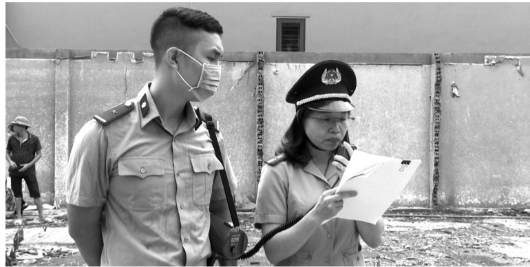
● Chấp hành viên Chi cục THADS huyện Văn Lâm, tỉnh Hưng Yên tổ chức cưỡng chế chuyển giao quyền sử dụng đất.

Nhờ sự phối hợp chặt chẽ với các ngành liên quan, nhiều vướng mắc, khó khăn trong quá trình tổ chức thi hành án trên địa bàn tỉnh Hưng Yên đã được kịp thời tháo gỡ.