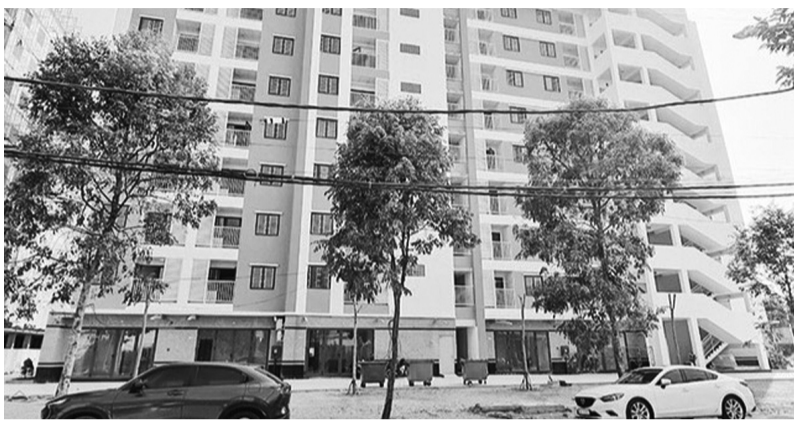
● Là một trong những dự án NOXH tại TP Cần Thơ, hiện dự án chung cư Hồng Loan 5C đã bàn giao được 332/1.036 căn.