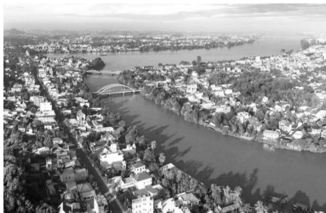
● Một góc TP Biên Hòa, tỉnh Đồng Nai.

Về tầm nhìn đến 2050, tỉnh Đồng Nai phấn đấu trở thành