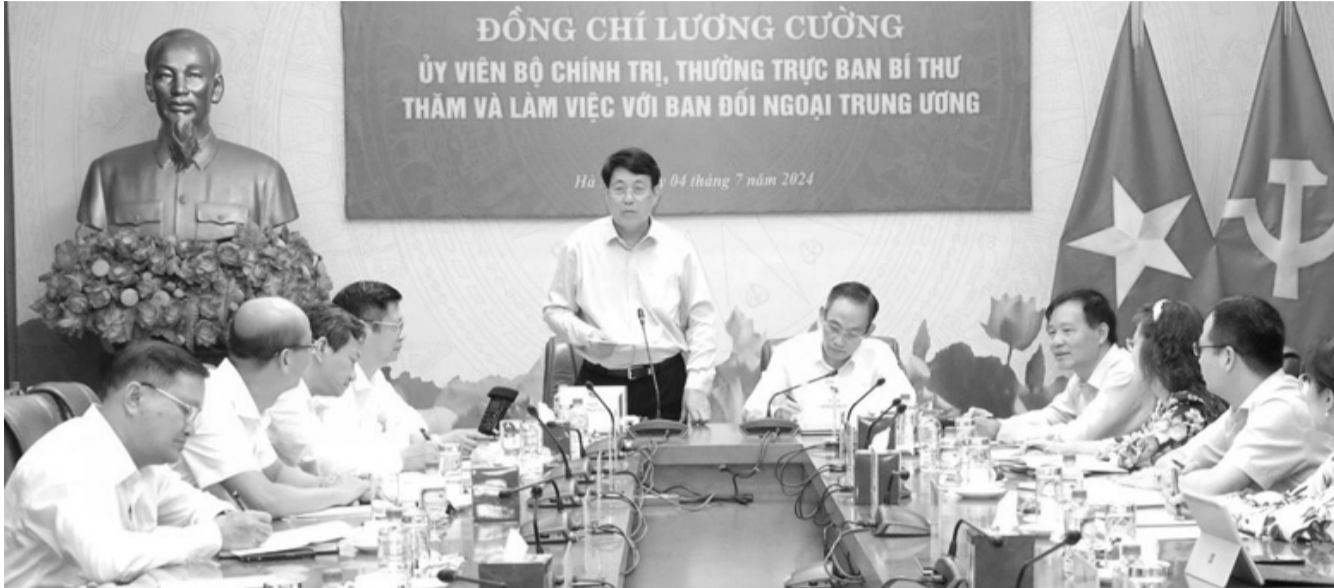
● Thường trực Ban Bí thư Lương Cường làm việc với Ban Đối ngoại Trung ương.

Tinh thần trên được Ủy viên Bộ Chính trị, Thường trực Ban Bí thư Lương Cường nhấn mạnh tại buổi làm việc với Ban Đối ngoại Trung ương về tình hình thực hiện nhiệm vụ từ đầu nhiệm kỳ Đại hội XIII đến nay, diễn ra hôm qua (4/7).