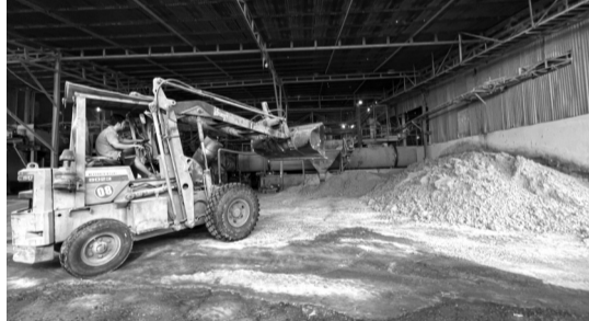
● Một góc Nhà máy Nhựa Phát.

CHI CỤC THADS HUYỆN ĐỨC HÒA, TỈNH LONG AN