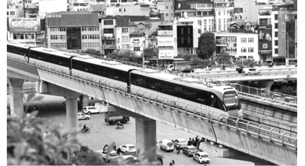
● Đoạn trên cao metro Nhổn - ga Hà Nội.