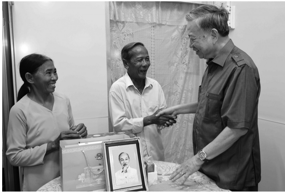
● Chủ tịch nước Tô Lâm thăm gia đình ông Võ Văn Ret, dân tộc Khmer, là hộ nghèo tại khóm 4, thị trấn Châu Thành, huyện Châu Thành, tỉnh Trà Vinh.

Chiều 5/7, trong khuôn khổ chuyến công tác tại Đồng bằng sông Cửu Long, Chủ tịch nước Tô Lâm đã làm việc với lãnh đạo tỉnh Trà Vinh về tình hình quốc phòng - an ninh, cải cách tư pháp, đối ngoại gắn với phát triển kinh tế - xã hội, xây dựng Đảng và hệ thống chính trị của tỉnh; cũng như những nhiệm vụ trọng tâm trong thời gian tới.