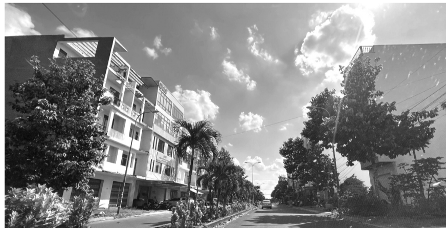
● Một góc dự án KTĐC Phú An.

Công an TP Cần Thơ cho rằng giữa hai bên có hợp đồng môi giới; tuy nhiên theo trình bày của Cty Phúc Thanh Vinh với cơ quan chức năng, thì hiện Cty Phúc Thanh Vinh không có bản gốc hợp đồng môi giới này.