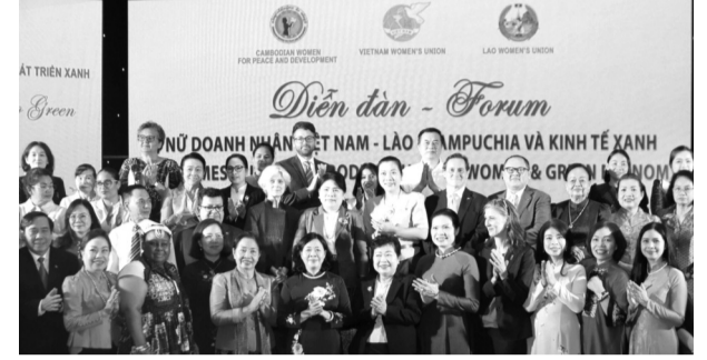
● Bà Bùi Thị Minh Hoài (thứ 5 từ trái sang, hàng đầu), Ủy viên Bộ Chính trị, Bí thư Trung ương Đảng, Trưởng Ban Dân vận Trung ương, cùng các đại biểu tham dự Diễn đàn sáng 5/7/2024.

Sáng 5/7, Diễn đàn kết nối và giao lưu nữ doanh nhân 3 nước Việt Nam - Lào - Campuchia với chủ đề "Nữ doanh nhân và kinh tế xanh" được tổ chức tại Hà Nội, nhằm chia sẻ kinh nghiệm về phát triển doanh nghiệp và đưa ra các đề xuất để phát huy vai trò và kết nối nữ doanh nhân và Hiệp hội Nữ doanh nhân 3 nước Việt Nam, Lào, Campuchia trong phát triển kinh tế xanh; tăng cường sự quan tâm và phối hợp của các cơ quan, doanh nghiệp nữ nhằm thực hiện hiệu quả các cam kết về phụ nữ, bình đẳng giới và phát triển kinh tế xanh.