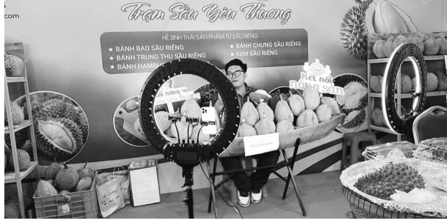
● Tăng cường chế biến và tiêu thụ mạnh tại thị trường nội địa cũng là cách để “giữ giá” cho nông sản được mùa. (Ảnh: Nguyễn Hạnh)

Báo cáo này cũng cho thấy, giá bán hầu hết sản phẩm cây ăn quả tăng với mức tăng bình quân 6 tháng đầu 6,12% so với bình quân cùng kỳ năm trước. Trong đó, phải kể đến cây sầu riêng khi sản lượng tăng mạnh nhưng lại có giá ở