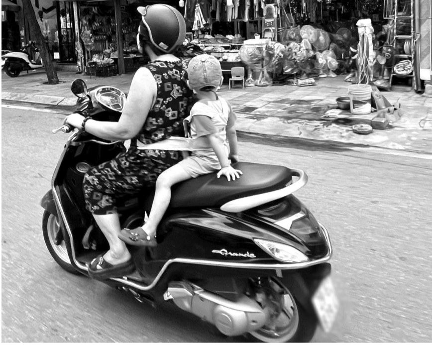
● Luật quy định phải có các biện pháp bảo đảm an toàn tối đa cho trẻ em khi tham gia giao thông.

Luật Trật tự, an toàn giao thông đường bộ, mới được Quốc hội thông qua ngày 27/06, có hiệu lực thi hành từ 01/01/2025, đặc biệt chú trọng đến bảo đảm an toàn giao thông cho trẻ em. Đây là bước tiến quan trọng nhằm phòng tránh tối đa các nguy cơ dẫn đến hậu quả nghiêm trọng cho đối tượng dễ bị tổn thương như trẻ em sau hàng loạt vụ việc đau lòng đã xảy ra thời gian qua.