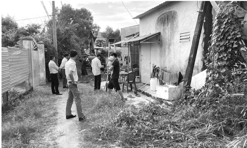
●UBND thị trấn Phú Mỹ kiểm tra hiện trường vào năm 2015.