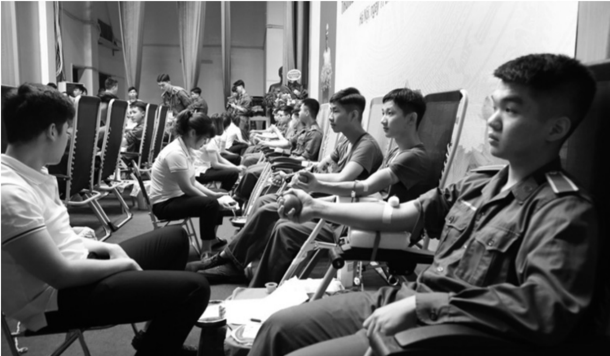
● Lực lượng thanh niên quân đội luôn đi đầu trong hiến máu tình nguyện.

Những năm qua, cán bộ, chiến sĩ toàn quân tham gia hiến máu cứu người với những hình thức đa dạng, cụ thể, thiết thực, tiếp tục đẩy mạnh hoạt động “Hành trình đỏ”, “Ngày Chủ nhật đỏ”, “Kỳ nghỉ hồng”... làm cho nét đẹp văn hóa, giá trị nhân văn sâu sắc của phong trào hiến máu tình nguyện ngày càng được lan tỏa mạnh mẽ và đạt hiệu quả cao.