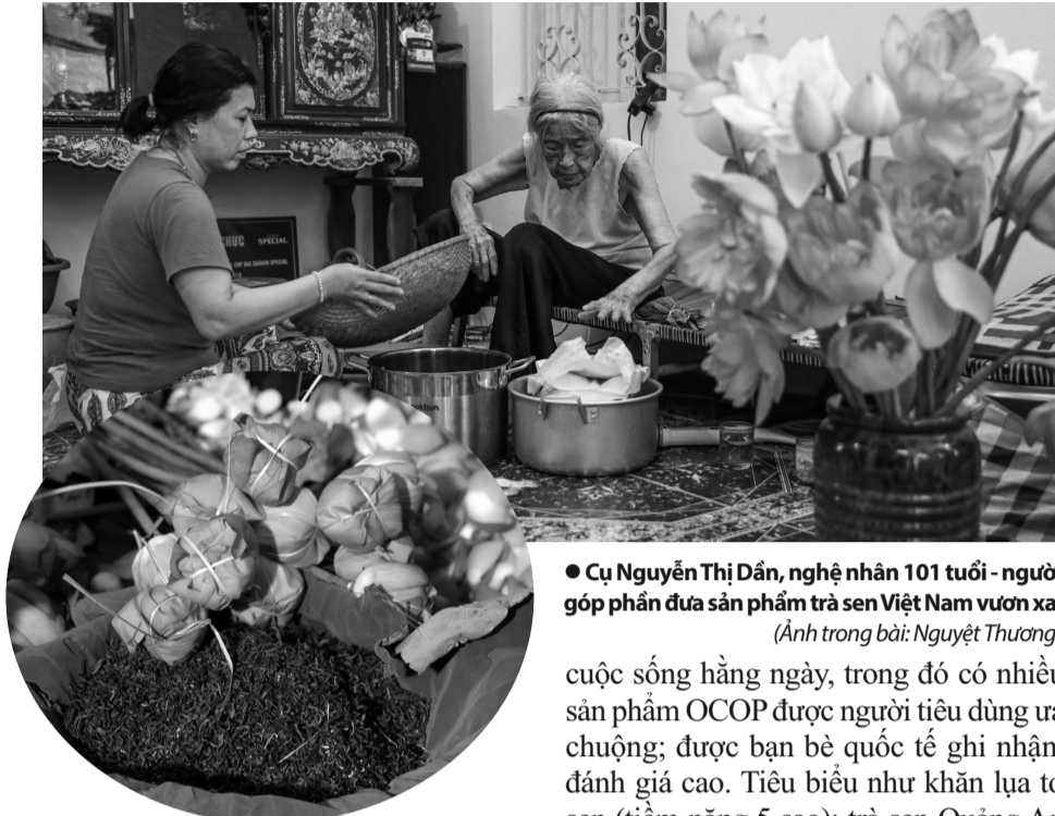
● Sen Việt Nam nói chung và sen Bách Diệp ở Tây Hồ nói riêng đều có tiềm năng lan tỏa hương sắc, vươn tầm quốc tế.