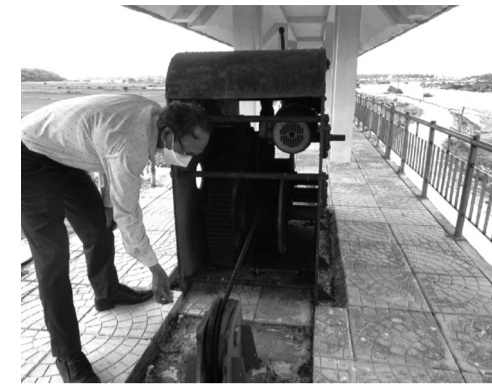
● Công vận hành thủ công dẫn đến công tác chủ động ngăn mặn chưa hiệu quả

kịp. Đó là chưa kể việc này còn có thể là tác nhân gây trở ngại trong nội đồng, gây hại cho cây cối.