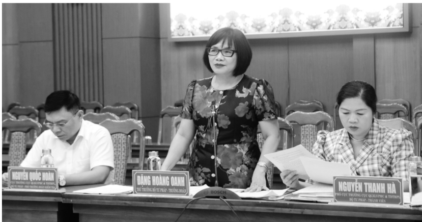
● Thứ trưởng Bộ Tư pháp Đặng Hoàng Oanh phát biểu kết luận buổi kiểm tra.

Ngày 5/7, Đoàn kiểm tra liên ngành của Bộ Tư pháp do Thứ trưởng Đặng Hoàng Oanh làm Trưởng đoàn đã có buổi làm việc với UBND tỉnh Quảng Nam về công tác thi hành pháp luật về xử lý vi phạm hành chính (THPL về XLVPHC) trên địa bàn tỉnh.