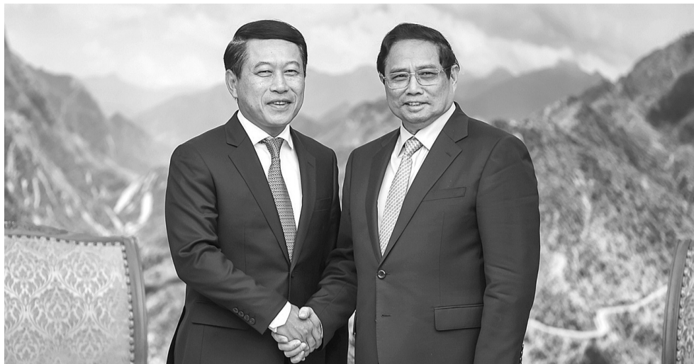
Thủ tướng Phạm Minh Chính tiếp thân mật đồng chí Saleumxay Kommasith, Phó Thủ tướng Chính phủ, Bộ trưởng Ngoại giao nước Cộng hòa Dân chủ Nhân dân Lào.

Ngày 5/7, tại Trụ sở Chính phủ, Thủ tướng Phạm Minh Chính đã tiếp thân mật Phó Thủ tướng, Bộ trưởng Ngoại giao Lào Saleumxay Kommasith đang thăm, làm việc tại Việt Nam.