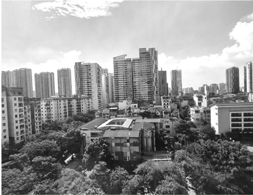
● Nguồn cung chung cư ở Hà Nội hiện không nhiều.

Mặc dù thị trường bất động sản (BDS) được đánh giá là khá ảm đạm trong thời gian qua, nhưng đây vẫn là kênh đầu tư hấp dẫn, sinh lời với các nhà đầu tư thứ cấp, nhất là đầu tư các loại hình như đất nền, chung cư.