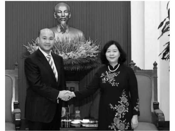
● Trưởng Ban Dân vận Trung ương Bùi Thị Minh Hoài và ông Hun Many, Tổng Thư ký Ban Dân vận Trung ương Đảng Nhân dân Campuchia (CPP), Phó Thủ tướng Chính phủ Campuchia.

Nhận lời mời của Ban Dân vận Trung ương Đảng ta, Đoàn đại biểu Ban Dân vận Trung ương Đảng Nhân dân Campuchia (CPP) do ông Hun Many, Ủy viên Ban Thường vụ Trung ương, Tổng Thư ký Ban Dân vận Trung ương CPP, Phó Thủ tướng Chính phủ, Bộ trưởng Bộ Công tác Công cộng, Chủ tịch Hội Hiệp Thanh niên Campuchia làm Trưởng đoàn, sang thăm và làm việc tại Việt Nam từ ngày 4 đến 7/7. Ngày 5/7, tại Trụ sở Trung ương Đảng, Ủy viên Bộ Chính trị, Bí thư Trung ương Đảng, Trưởng Ban Dân vận Trung ương Bùi Thị Minh Hoài đã tiếp Đoàn.