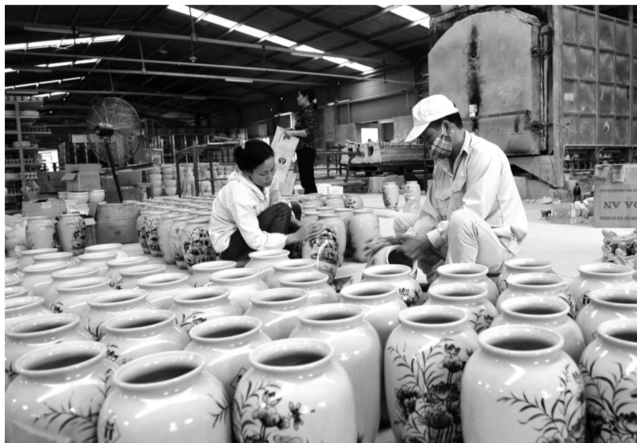
● TP Hà Nội hiện có 1.350 làng nghề và làng có nghề.