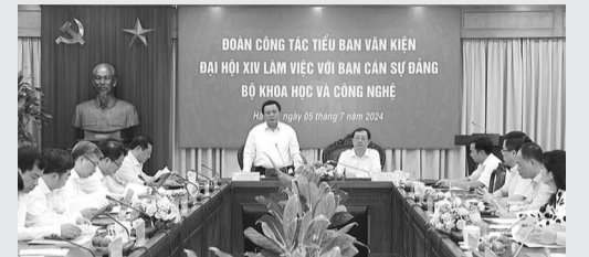
● Đoàn Tiểu ban Văn kiện Đại hội XIV của Đảng làm việc với Ban Cán sự Đảng Bộ KH&CN.

Ngày 5/7, tại Hà Nội, Đoàn Tiểu ban Văn kiện Đại hội XIV do Ủy viên Bộ Chính trị, Chủ tịch Hội đồng Lý luận Trung ương, Giám đốc Học viện Chính trị quốc gia Hồ Chí Minh Nguyễn Xuân Thắng - Thường trực Tiểu ban Văn kiện, Tổ trưởng Tổ biên tập Văn kiện Đại hội XIV làm Trưởng đoàn đã làm việc với Ban Cán sự Đảng Bộ Khoa học và Công nghệ (KH&CN).