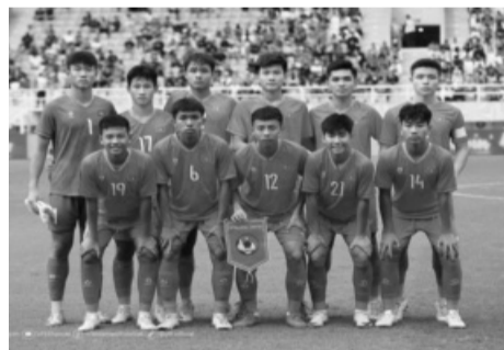
● Đội tuyển U16 Việt Nam thi đấu tại giải U16 Đông Nam Á.