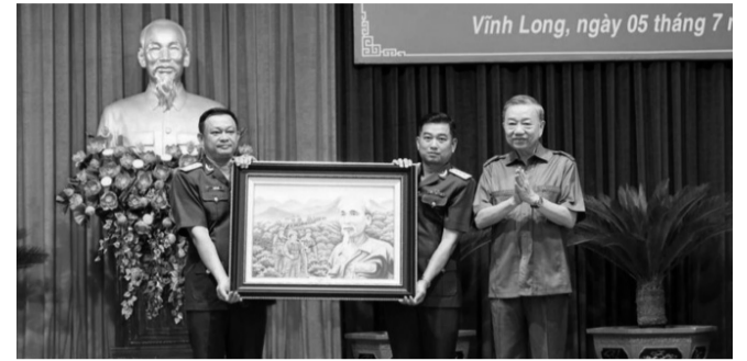
● Chủ tịch nước Tô Lâm tặng bức tranh Bác Hồ cho Lữ đoàn Công binh 25.

Sáng qua (5/7), Chủ tịch nước Tô Lâm đã đến thăm và làm việc tại Lữ đoàn Công binh 25 (Quân khu 9).