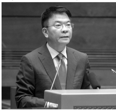
● Phó Thủ tướng Chính phủ, Bộ trưởng Bộ Tư pháp Lê Thành Long phát biểu tại phiên họp.

Phó Thủ tướng, Bộ trưởng Bộ Tư pháp Lê Thành Long nêu rõ, tiếp thu ý kiến của đại biểu Quốc hội, trong thời gian tới, Chính phủ, Thủ tướng sẽ tập trung chỉ đạo khắc phục tình trạng nợ, chậm ban hành văn bản quy định chi tiết, bảo đảm tiến độ, chất lượng các hồ sơ đề nghị dự án luật trình Quốc hội.