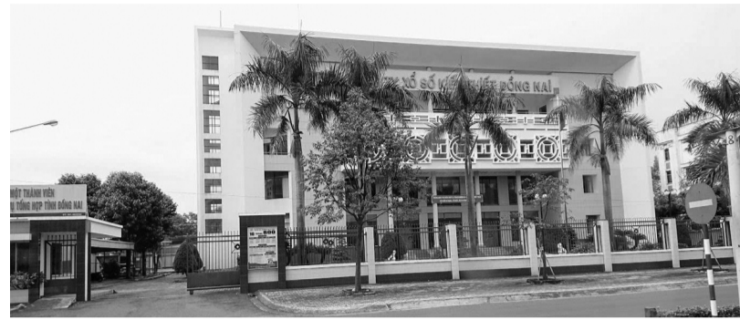
● Xổ số Đồng Nai đầu tư và cho Cty CP Bóng đá Đồng Nai mượn tổng cộng 66 tỷ đồng.

“Hiện tại, Cty CP Bóng đá Đồng Nai dừng hoạt động, đang làm thủ tục giải thể. Do đó, khoản đầu tư tại Cty này không có khả năng thu hồi. Xổ số Đồng