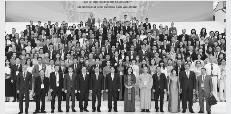
● Thủ tướng Phạm Minh Chính chụp ảnh cùng các đại biểu.

Đây là yêu cầu được Thủ tướng Phạm Minh Chính đưa ra tại phiên khai mạc Hội nghị người Việt Nam ở nước ngoài toàn thế giới lần thứ 4 và Diễn đàn trí thức và chuyên gia Việt Nam ở nước ngoài năm 2024 (sau đây gọi tắt là Chương trình), do Bộ Ngoại giao chủ trì tổ chức ngày 22/8.