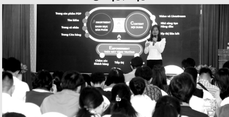
● Các chuyên gia trao đổi với doanh nghiệp, hợp tác xã về kỹ năng kinh doanh trên nền tảng số.

Ngày 22/8, tại Cần Thơ, Cục Xúc tiến thương mại (Bộ Công Thương) phối hợp Sở Công Thương TP Cần Thơ tổ chức khóa Tập huấn "Kỹ năng kinh doanh trên nền tảng số phát triển thương