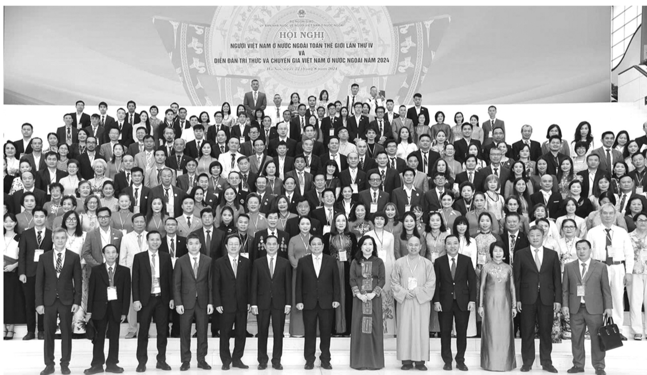
Thủ tướng Phạm Minh Chính chụp ảnh cùng các đại biểu kiều bào từ nhiều quốc gia và vùng lãnh thổ tham dự Hội nghị.