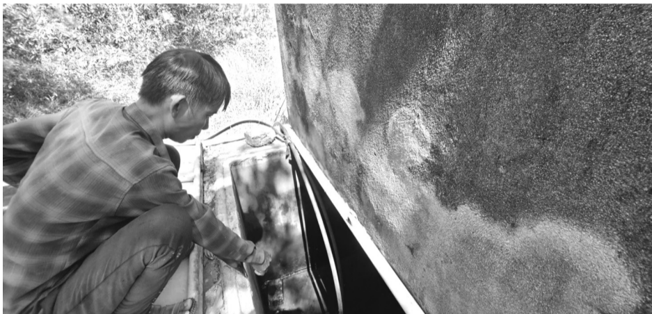
● Những năm qua, nhiều hộ dân khu TĐC thôn 1B phải sử dụng nguồn nước giếng bị nhiễm phèn nặng.

Hơn 7 năm trước, nhiều hộ dân thôn 1B, xã Thủy Phù, thị xã Hương Thủy, tỉnh Thừa Thiên Huế thực hiện di dời nhà cửa đến khu tái định cư (TĐC) bắt đầu cuộc sống mới để bàn giao mặt bằng thực hiện xây dựng nghĩa trang nhân dân phía Nam TP Huế (dự án do Cty Môi trường Công trình đô thị Huế làm chủ đầu tư). Đến nay, người dân ở khu TĐC này vẫn chưa tiếp cận được nguồn nước sạch.