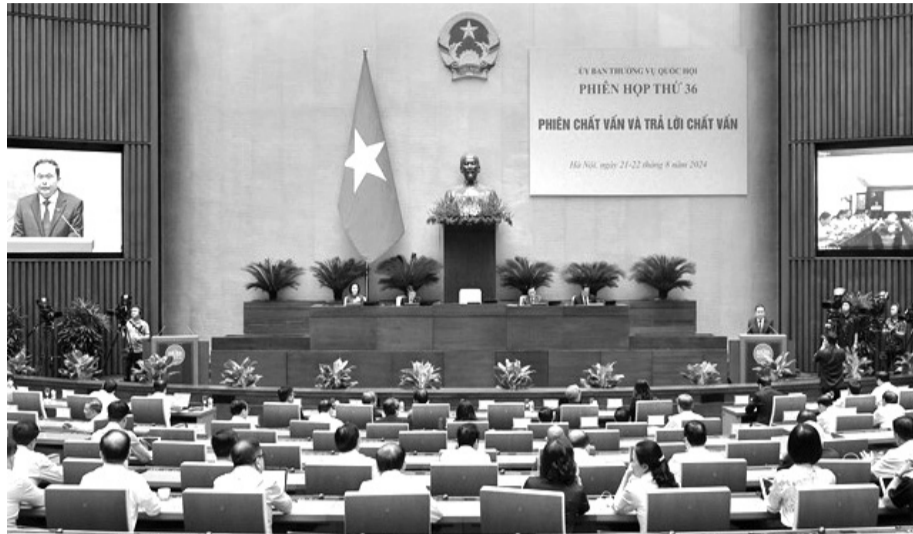
● Quang cảnh phiên họp.

Cung cấp thêm thông tin, về lĩnh vực tư pháp, Phó Thủ tướng, Bộ trưởng Lê Thành Long khẳng định, Chính phủ, Thủ tướng luôn xác định nhiệm vụ xây dựng và tổ chức thi hành pháp luật là nhiệm vụ trọng tâm nhằm kịp thời tháo gỡ những khó khăn, vướng mắc, bất cập, bảo đảm quyền, lợi ích hợp pháp của người dân, tạo điều kiện thuận lợi cho