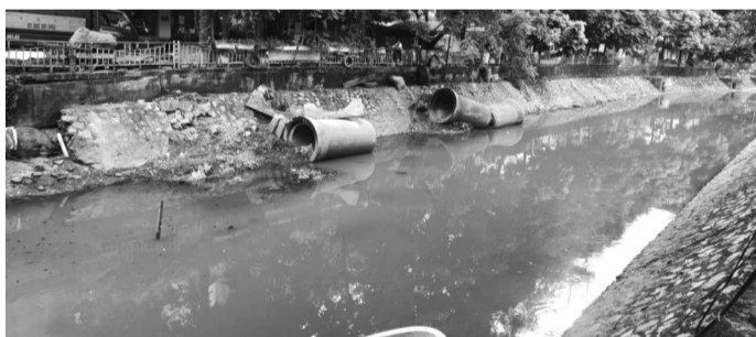
● Bên bờ sông Lừ, một số điểm đã trở thành bãi tập kết rác thải, mất vệ sinh, gây mất mỹ quan đô thị.

Được biết, gói thầu xây dựng hệ thống cống bao cho sông Lừ có tổng chiều dài khoảng 7.662m và 34 giếng. Nhà thầu xây dựng là Liên danh Cty CP Xây dựng thương mại An Xuân Thịnh - Cty CP Sông Đà 9. Thời gian dự kiến thi công 31,5 tháng, từ tháng 2/2020 - 10/2022. Chủ đầu tư là Ban Quản lý dự án (QLDA) đầu tư xây dựng công trình cấp thoát nước Hà