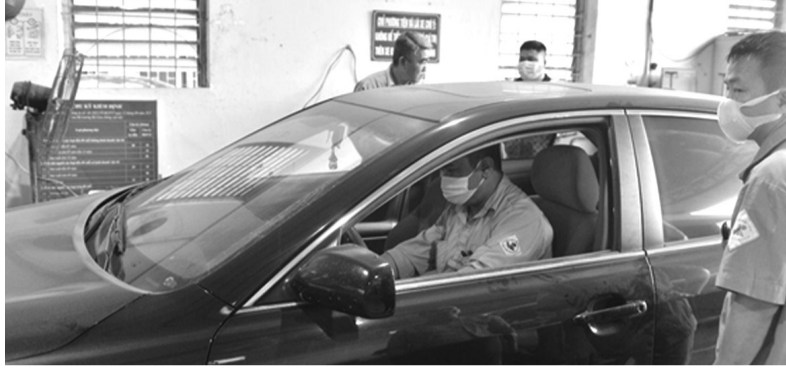
● Hoạt động kiểm định tại một trung tâm đăng kiểm xe cơ giới.

Càng về cuối năm, nguy cơ ùn tắc trong đăng kiểm xe cơ giới càng cao, đặc biệt trong bối cảnh nhân sự của ngành này thiếu hụt nghiêm trọng.