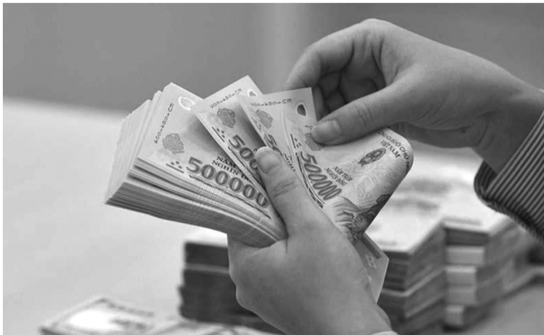
● Nguồn và phương thức chi thực hiện lương cơ sở và chế độ tiền thưởng theo Nghị định 73/2024/NĐ-CP.

Bộ Tài chính vừa ban hành Thông tư 62/2024/TT-BTC hướng dẫn xác định nhu cầu, nguồn và phương thức chi thực hiện mức lương cơ sở và chế độ tiền thưởng theo Nghị định 73/2024/NĐ-CP và điều chỉnh trợ cấp hàng tháng đối với cán bộ xã đã nghỉ việc theo Nghị định 75/2024/NĐ-CP.