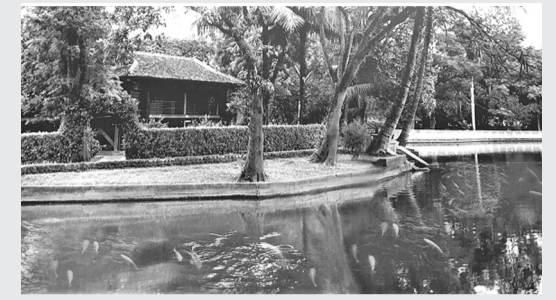
● Khu Di tích Chủ tịch Hồ Chí Minh tại Phú Chủ tịch là di tích lịch sử văn hóa đặc biệt quan trọng của quốc gia.

Ngày 22/8/2024, hướng đến kỷ niệm 55 năm Ngày Chủ tịch Hồ Chí Minh đi xa, 55 năm thực hiện Di chúc thiêng liêng của Người, 55 năm bảo tồn và phát huy giá trị Khu Di tích Chủ tịch Hồ Chí Minh tại Phú Chủ tịch (1969 - 2024) và 70 năm Bác về sống và làm việc tại Khu Phú Chủ tịch (1954 - 2024), ngày 22/8/2024, Khu Di tích Chủ tịch Hồ Chí Minh tại Phú Chủ tịch tổ chức Lễ kỷ niệm và khai mạc Triển lãm “55 năm ngày Bác đi xa, 55 năm bảo tồn và phát huy giá trị Khu Di tích Chủ tịch Hồ Chí Minh tại Phú Chủ tịch (1969 - 2024)”.