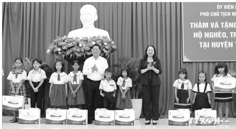
● Phó Chủ tịch nước Võ Thị Ánh Xuân tặng quà cho học sinh nghèo học giỏi của huyện Thuận Nam.

Theo Phó Chủ tịch nước Võ Thị Ánh Xuân, từ một trong những tỉnh nghèo nhất cả nước, Ninh Thuận đã nỗ lực bứt phá, vươn lên trở thành tỉnh có thu nhập trung bình. Song song với phát triển kinh tế, tỉnh Ninh Thuận cũng đã dành nhiều nguồn lực để chăm lo cho các hoạt động an sinh xã hội, nhất là các đối tượng chính sách, người có công; hộ