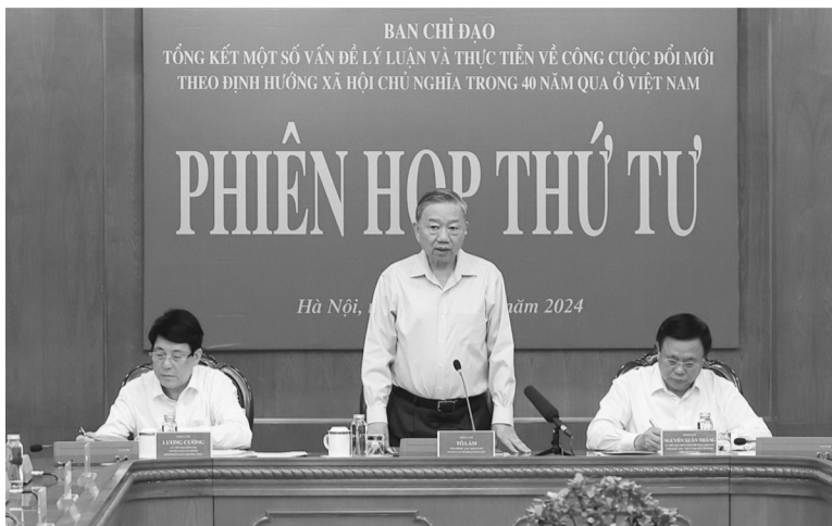
● Tổng Bí thư, Chủ tịch nước Tô Lâm yêu cầu, cần đánh giá chính xác kết quả đạt được, thẳng thắn, khách quan chỉ ra những hạn chế, yếu kém, khuyết điểm và nguyên nhân...

Tinh thần trên được Tổng Bí thư, Chủ tịch nước Tô Lâm, Trưởng Ban Chỉ đạo Tổng kết một số vấn đề lý luận và thực tiễn về công cuộc đổi mới theo định hướng xã hội chủ nghĩa trong 40 năm qua ở Việt Nam (Ban Chỉ đạo) nhấn mạnh khi chủ trì Phiên họp thứ tư của Ban Chỉ đạo, diễn ra ngày 22/8, tại Hà Nội.