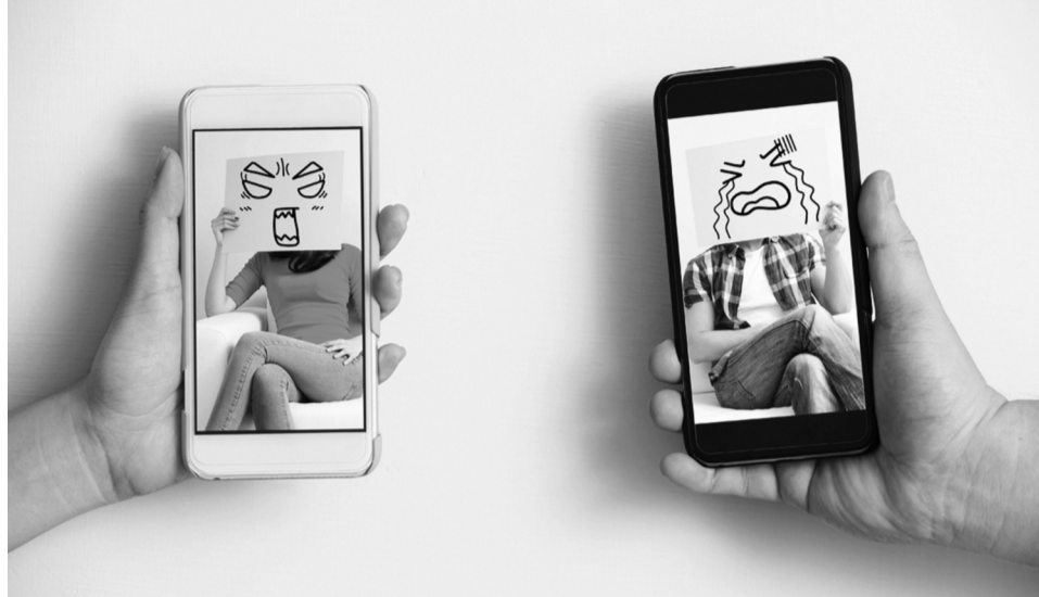
●Cần cân nhắc đến hậu quả khi trước khi quyết định “phơi” chuyện nhà lên mạng. (Ảnh minh họa)

Nhiều người vẫn cho rằng mạng xã hội và sức mạnh của nó chính là một công cụ hữu hiệu có thể giúp giải quyết những câu chuyện khó trong gia đình. Tuy nhiên, mặt trái của nó là sự hủy hoại mái ấm, tiêu tán hạnh phúc và bình yên của các thành viên trong gia đình, thậm chí là vi phạm pháp luật.