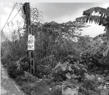
● Khu đất hiện vẫn bỏ hoang, cỏ cây mọc um tùm.

Năm 2023, Thanh tra Chính phủ đã chỉ rõ nhiều vi phạm, thiếu sót trong quá trình thu hồi đất tại xã Di Trạch, huyện Hoài Đức để thực hiện dự án hạ tầng kỹ thuật khu đất dịch vụ. Người dân đề nghị các cơ quan chức năng cần sớm thực hiện các kiến nghị của Thanh tra Chính phủ (TTCP), xử lý dứt điểm vụ việc.