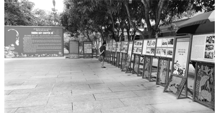
● Triển lãm "Di chúc Bác Hồ - Ngọn đuốc soi đường" tại khuôn viên Khu Di tích quốc gia đặc biệt Kim Liên.

Nhân dịp kỷ niệm 55 năm thực hiện Di chúc của Bác Hồ (1969 - 2024) và 55 năm Bác Hồ gửi bức thư cuối cùng cho Đảng bộ và Nhân dân Nghệ An (21/7/1969 - 21/7/2024), Khu Di tích Quốc gia đặc biệt Kim Liên (huyện Nam Đàn) tổ chức triển lãm chuyên đề: "Di chúc Bác Hồ - Ngọn đuốc soi đường".