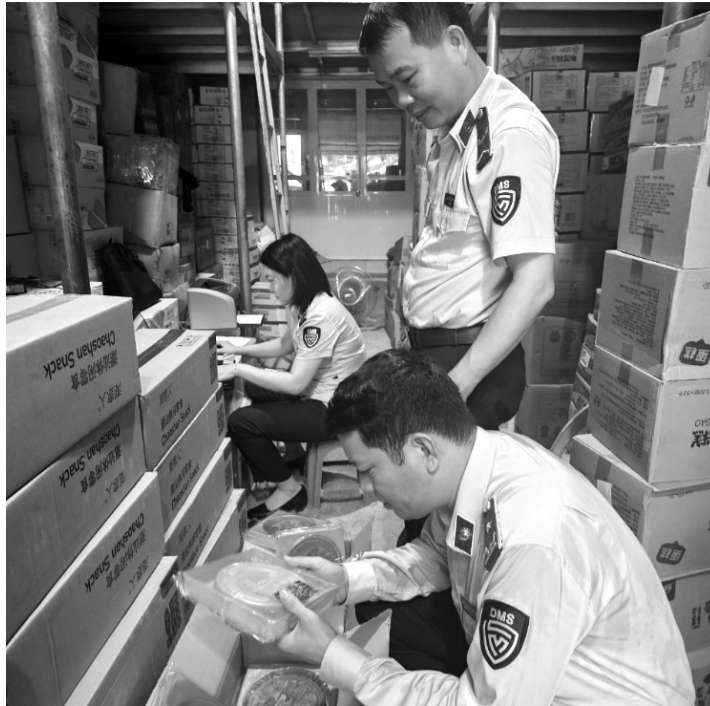
● Bánh nướng loại lớn được Đội QLTT số 24 thu giữ.

Tại Quảng Ninh, qua rà soát môi trường thương mại điện tử và kết quả thẩm tra, xác minh, mới đây, Đội QLTT số 1 (Cục QLTT tỉnh Quảng Ninh) đã tiến hành kiểm tra một hộ kinh doanh sử dụng tài khoản Facebook (có địa chỉ ở TP Hạ Long), phát hiện 229 sản phẩm (quần áo nữ, áo phông nữ, ví cầm tay, dây lưng, dép, kính mắt thời trang) giả mạo nhãn hiệu Adidas, Christian Dior,