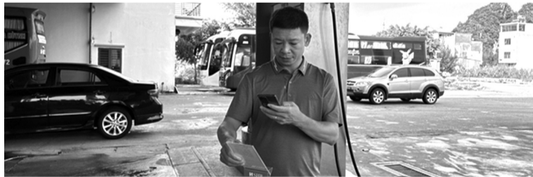
● Người dân đến giao dịch tại Trung tâm Hành chính công TP Uông Bí, thanh toán bằng quét mã QR.

Hiện nay, việc thanh toán không dùng tiền mặt tại Quảng Ninh đã trở thành thói quen tiêu dùng của nhiều người dân từ thành thị đến nông thôn.