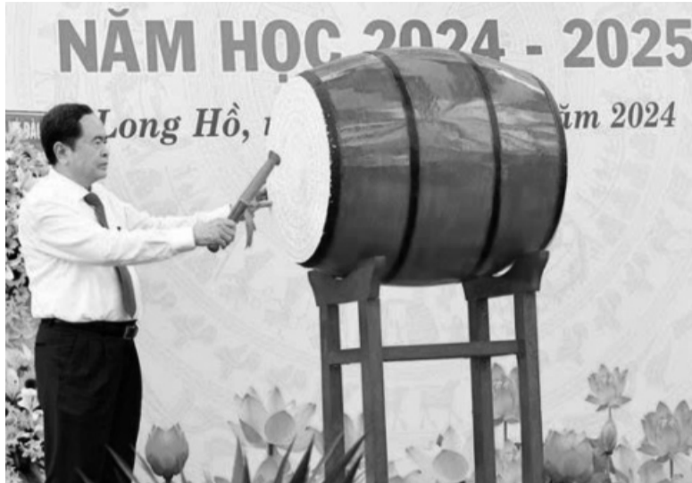
● Chủ tịch Quốc hội Trần Thanh Mẫn đánh trống khai trường.