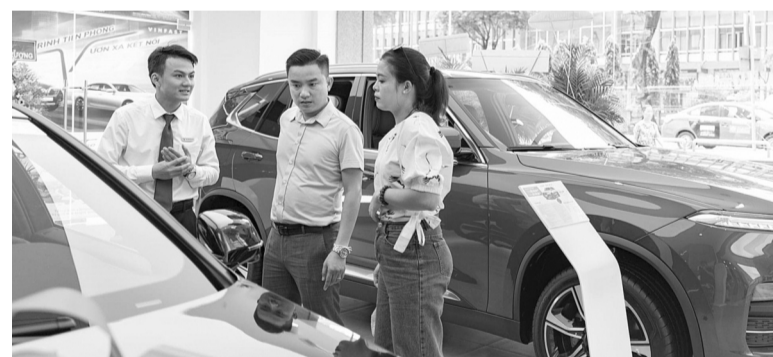
●Việc tiếp tục thực hiện giảm mức thu LPTB đối với xe ô tô sản xuất, lắp ráp trong nước là một trong những giải pháp hỗ trợ tài chính, khuyến khích tiêu dùng.

Theo Bộ Tài chính, việc giảm 50% mức thu LPTB đối với ô tô, sản xuất lắp ráp trong nước khả năng sẽ làm tăng số lượng xe tiêu thụ và đăng ký, nên số thu từ LPTB, thuế TTĐB, thuế GTGT