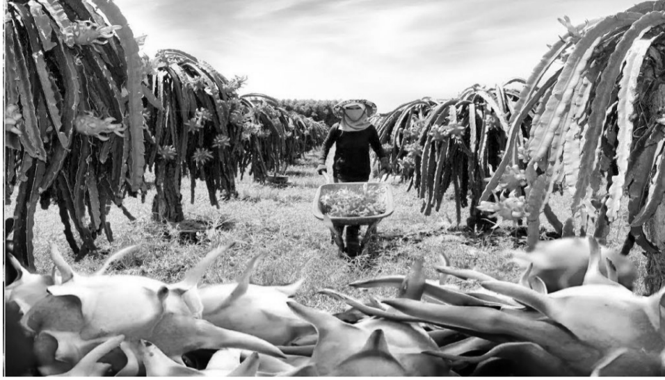
● Sau 8 tháng của năm 2024, xuất khẩu nông, lâm, thủy sản đạt 40,08 tỷ USD. (Ảnh minh họa/VNE)