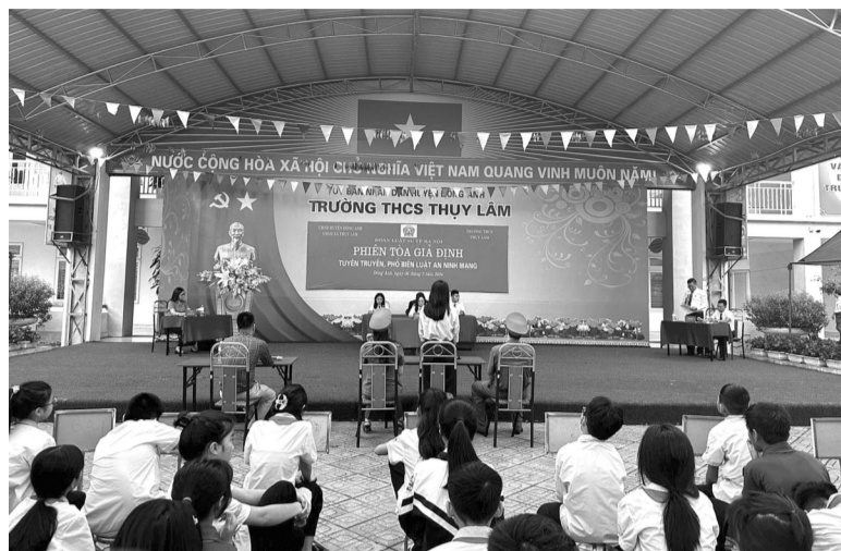
● Học sinh chăm chú lắng nghe các luật sư tuyên truyền, phổ biến pháp luật.