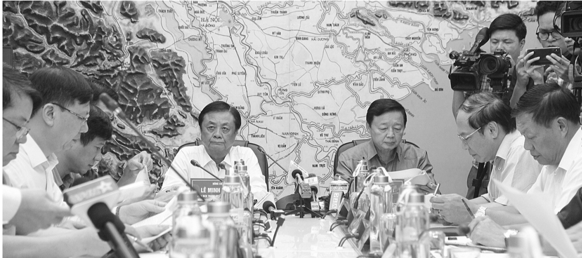
●Phó Thủ tướng Trần Hồng Hà và Bộ trưởng Bộ NN&PTNT Lê Minh Hoan họp trực tuyến với các Bộ, ngành, địa phương để chuẩn bị phương án ứng phó siêu bão YAGI.

Cơn bão số 3 YAGI đã mạnh lên thành siêu bão, được dự báo có cường độ rất mạnh, mức độ rủi ro thiên tai lớn, diễn biến phức tạp. Thủ tướng Chính phủ Phạm Minh Chính đã ký Công điện số 87/CP-TTg chỉ đạo các Bộ, ngành, địa phương tập trung ứng phó khẩn cấp bão số 3 năm 2024.