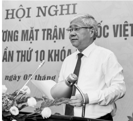
● Chủ tịch UBTTQ Việt Nam Đỗ Văn Chiến phát biểu tại Hội nghị.

Kiến nghị trên được đưa ra tại Hội nghị Ủy ban Trung ương Mặt trận Tổ quốc (UBTTQ) Việt Nam lần thứ 10, khóa IX, nhiệm kỳ 2019 - 2024, diễn ra hôm qua (5/9) tại Hà Nội.