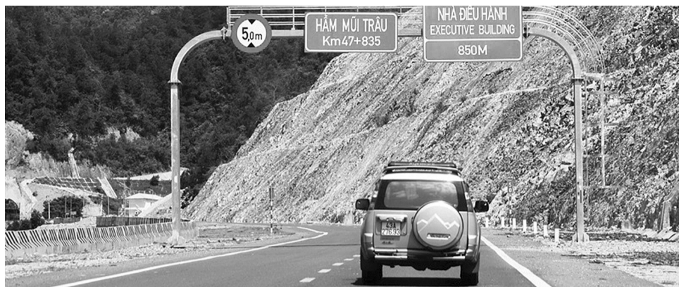
Một đoạn tuyến La Sơn - Hòa Liên.

Cử tri TP Đà Nẵng vừa có phản ánh: Tuyến đường cao tốc đoạn Hòa Liên - La Sơn - Cam Lộ (nối từ Đà Nẵng tới tỉnh Quảng Trị) là tuyến cao tốc chưa hoàn chỉnh, chưa đủ điều kiện để được gọi là "đường cao tốc". Trong thời gian qua, có rất nhiều vụ tai nạn giao thông (TNGT) nghiêm trọng xảy ra trên tuyến đường này.