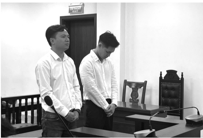
● Hai bị cáo tại phiên xử.

Đại diện gia đình cháu bé yêu cầu Linh bồi thường chi phí điều trị, mai táng và 100 tháng lương cơ sở (tương đương 234 triệu đồng). Ban đầu, bị cáo Linh phân trần hoàn cảnh gia đình khó khăn, nhưng sau khi nghe HĐXX phân tích, giải thích thì bị cáo đồng ý mức bồi thường này. TRAN TIÊN