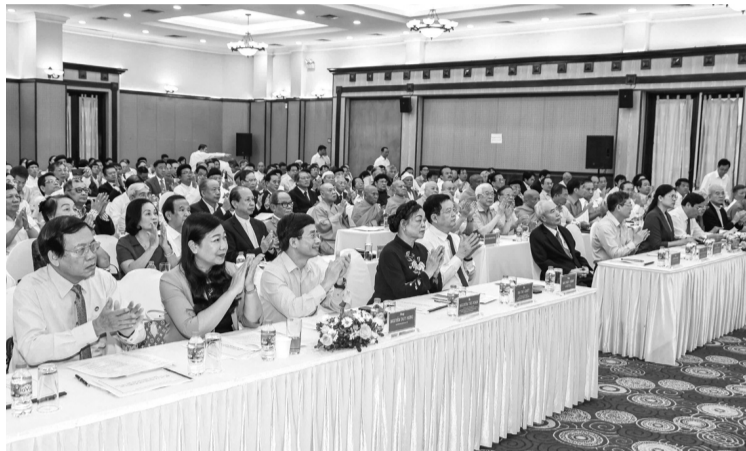
● Các đại biểu tham dự Hội nghị.

Chuyển đổi số cần phải được thực hiện mạnh mẽ hơn, “mạnh mẽ như đường dây 500kV mạch 3” mới có thể tiến sát hơn với các nước khác. Nếu chúng ta tiếp tục làm kinh tế truyền thống thì sẽ tiếp tục xa dần và ngày càng lạc hậu so với thế giới.