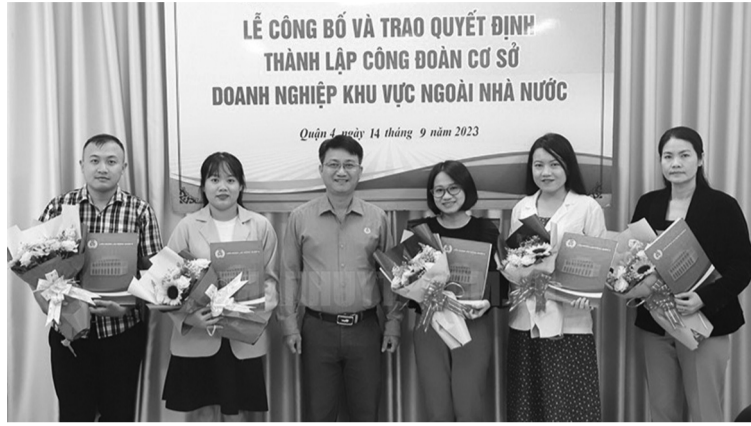
● Chủ tịch LĐLĐ quận 4 (TP Hồ Chí Minh) trao quyết định thành lập 5 CĐCS doanh nghiệp ngoài Nhà nước với tổng số 198 đoàn viên.

Nghị quyết 06/NQ-BCH của Tổng Liên đoàn Lao động Việt Nam đã đề ra mục tiêu đến năm 2028, phấn đấu phát triển đoàn viên tăng thêm trong các doanh nghiệp ngoài khu vực Nhà nước là 3 triệu đoàn viên; thành lập Công đoàn cơ sở ở 100% doanh nghiệp có 25 lao động trở lên.