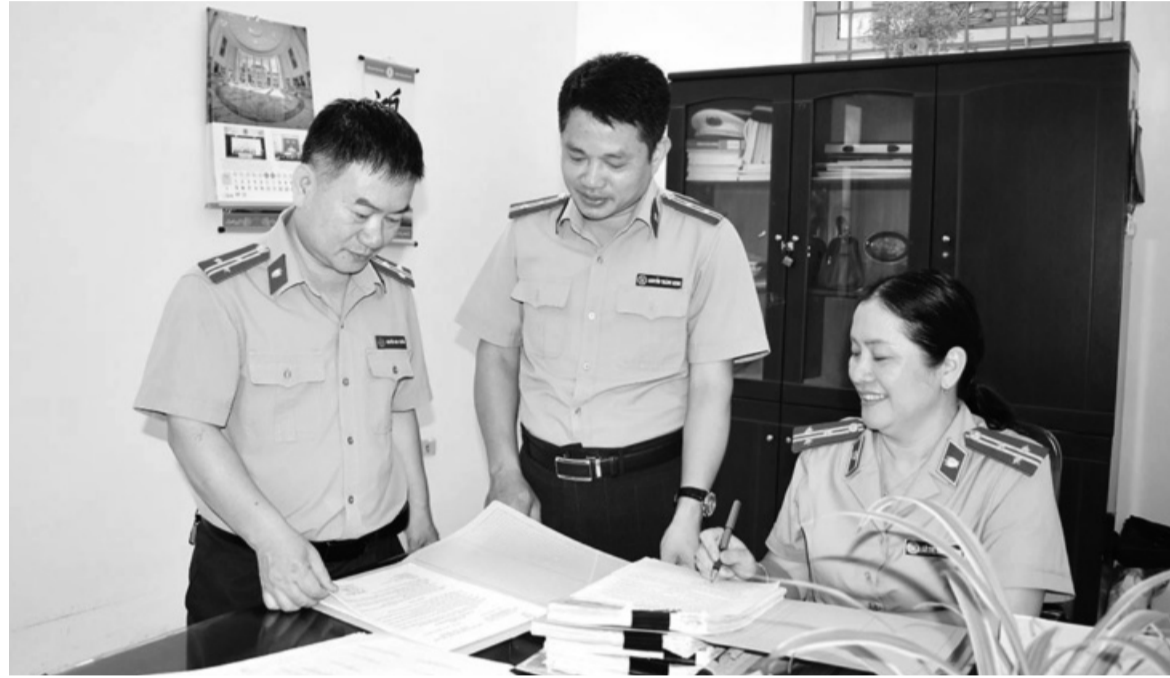
● Công tác vận động, thuyết phục thi hành phần dân sự trong bản án hình sự được cán bộ, chấp hành viên THADS vận dụng sáng tạo, linh hoạt.

Thi hành nghĩa vụ dân sự trong bản án hình sự là điều kiện bắt buộc để được xem xét đặc xá, do vậy để bảo đảm quyền lợi cho các phạm nhân có cơ hội mau chóng trở về với cộng đồng, các cơ quan Thi hành án dân sự (THADS) đã có nhiều giải pháp thúc đẩy quá trình này.