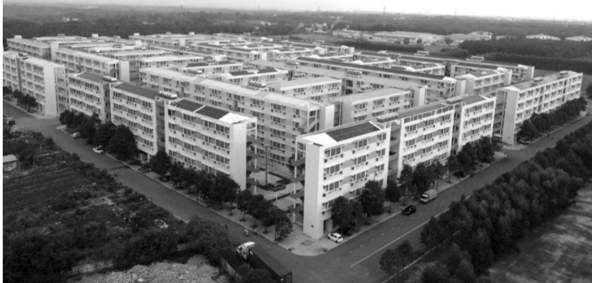
● Tiến độ xây dựng 1 triệu căn nhà ở xã hội đến năm 2030 của Chính phủ đang ở mức thấp so với đề án đưa ra. (Ảnh minh họa)

Bộ Xây dựng vừa báo cáo Thủ tướng về tình hình triển khai đầu tư xây dựng ít nhất 1 triệu căn hộ nhà ở xã hội giai đoạn 2021 - 2030. Theo đó, từ năm 2021 đến nay, cả nước đã hoàn thành khoảng 40.600 căn nhà ở xã hội, trong đó Bắc Ninh, Hà Nội, Bắc Giang, Khánh Hòa, Thanh Hóa, Tây Ninh, Bình Dương... dẫn đầu cả nước. Về kết quả triển khai thực hiện các dự án nhà ở xã hội, theo Bộ Xây dựng, qua tổng hợp báo cáo từ các địa phương, trong giai đoạn từ 2021 đến nay cả nước có 619 dự án nhà ở xã hội được triển khai với quy mô hơn 560.000 căn. Tuy nhiên, mới có 79 dự án nhà ở xã hội hoàn thành, 128 dự án nhà ở xã hội khởi công xây dựng và 412 dự án nhà ở xã hội