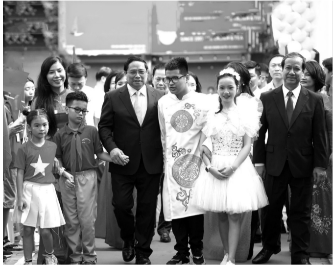
● Thủ tướng Phạm Minh Chính, Bộ trưởng Bộ GD&ĐT Nguyễn Kim Sơn đến dự Lễ khai giảng tại Trường PTCS Nguyễn Đình Chiểu.