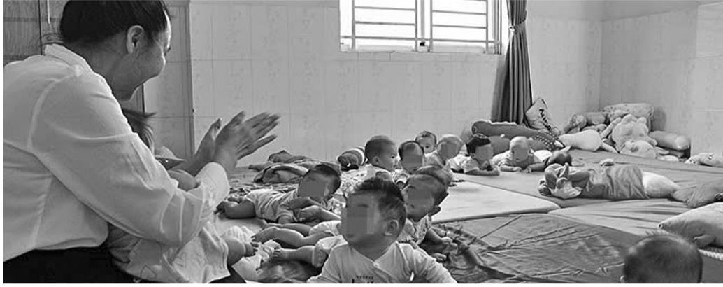
● Vẫn còn những "lỗ hổng" trong hệ thống giám sát và quản lý của chính quyền địa phương đối với các cơ sở chăm sóc trẻ em, cả trong và ngoài công lập. (Ảnh: Trẻ em tại mái ấm Hoa Hồng/VietNamNet)

Vụ việc mái ấm Hoa Hồng hành hạ trẻ em mồ côi đã gây chấn động dư luận. Bên cạnh sự bức xúc, người dân còn đặt ra câu hỏi về những "lỗ hổng" trong hệ thống giám sát và quản lý của chính quyền địa phương đối với các cơ sở chăm sóc trẻ em, cả công lập và ngoài công lập.