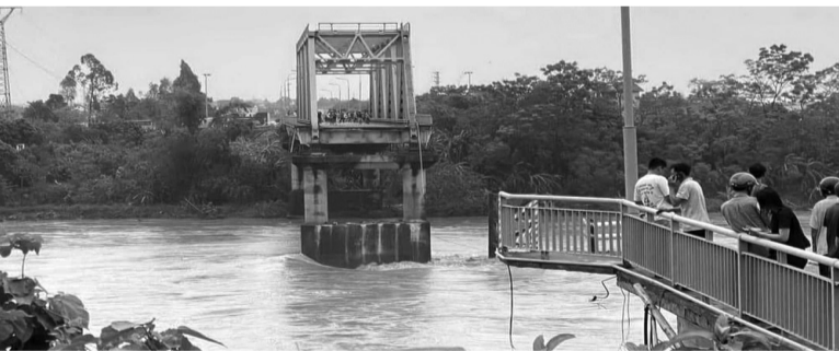
● Cầu Phong Châu (Phú Thọ) bị sập vào sáng 9/9.

Sáng 9/9, ngay sau khi nhận được tin báo về vụ sập cầu Phong Châu, Phú Thọ, Phó Thủ tướng Hồ Đức Phớc đã đến hiện trường chỉ đạo công tác cứu hộ, cứu nạn.