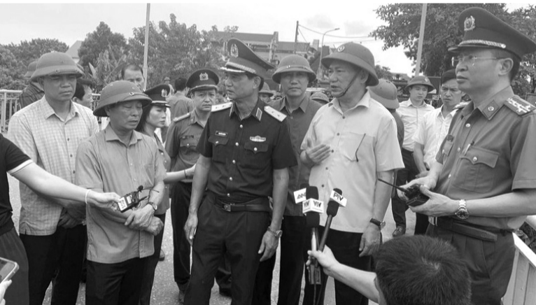
● Phó Thủ tướng Hồ Đức Phớc (thứ 2 từ phải sang) tại hiện trường chỉ đạo công tác cứu hộ, cứu nạn.