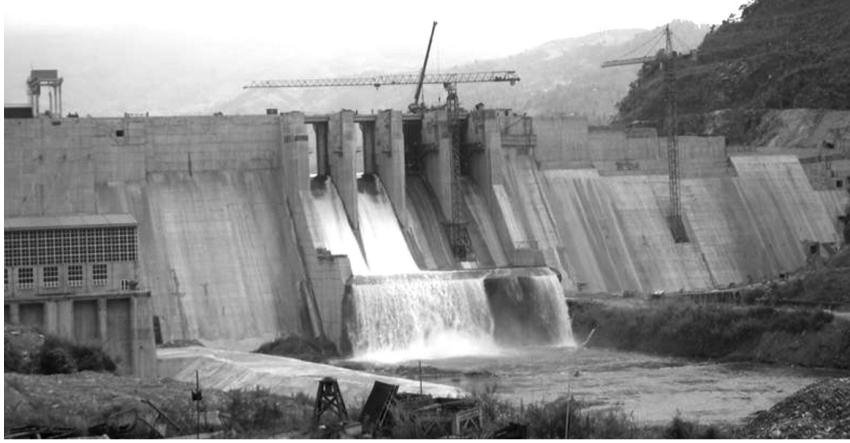
● Bộ Công Thương yêu cầu bảo đảm an toàn trong vận hành các công trình thủy điện.