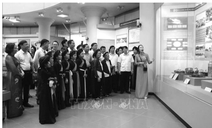
● Các đại biểu tham quan trưng bày.

Trưng bày được bố cục với 3 chủ đề chính: Nguồn gốc và quá trình phát triển của Dân ca Quan họ Bắc Ninh; Dân ca Quan họ Bắc Ninh trường tồn và lan tỏa - giới thiệu sức sống của di sản trong cộng đồng; Bảo tồn và phát huy giá trị Dân ca Quan họ Bắc Ninh - giới thiệu những cơ chế, chính sách của Đảng, Nhà nước và của tỉnh, cùng sự chung tay của cộng đồng trong sự nghiệp bảo tồn và phát huy giá trị Dân ca Quan họ Bắc Ninh hiện nay.