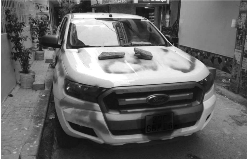
● Một trường hợp xe ô tô đậu trong hẻm nhà dân bị người dân phá xe để cảnh cáo.

Thời gian qua, nhiều hành động phá hoại tài sản đã diễn ra nhan nhản trong cuộc sống hàng ngày. Đáng nói đó không chỉ là cơn nóng giận nhất thời, mà xuất phát từ sự thiếu nhận thức, thiếu hiểu biết về pháp luật của một bộ phận người dân.