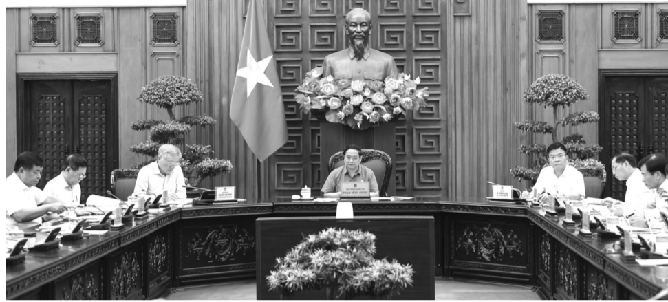
● Thủ tướng Phạm Minh Chính đề nghị tiếp tục đẩy mạnh đổi mới, cải cách thể chế, nhất là thể chế kinh tế thị trường định hướng xã hội chủ nghĩa.

Tại phiên họp, các đại biểu báo cáo, thảo luận việc tiếp thu, giải trình và bổ sung các nội dung đã được Bộ Chính trị cho ý kiến để hoàn thiện thêm một bước đối với dự thảo Báo cáo đánh giá 5 năm thực hiện Chiến lược phát triển KT-XH 10 năm 2021 - 2030, phương hướng, nhiệm vụ phát triển KT-XH 5 năm 2026 - 2030. Trong đó, nêu rõ sự lãnh đạo, quản lý, chỉ đạo, điều hành của Đảng, Nhà nước, Quốc hội, Chính phủ đối với quá trình phát triển KT-XH đất nước; các kết quả đạt được, nhất là các chỉ tiêu chính, điểm nhấn của nhiệm kỳ; những khó khăn, hạn chế; nguyên nhân của cả kết quả và hạn chế; các bài học kinh nghiệm; các nhiệm vụ, giải