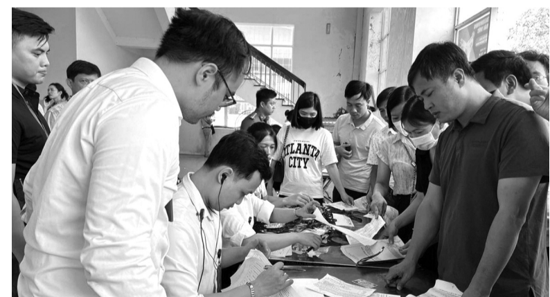
● Một cuộc đấu giá đất tại Hà Nội.

tượng SDD. Số tiền thực hiện nghĩa vụ tài chính sẽ tăng cao đột biến so với khi áp dụng BGD hiện hành của địa phương đó.