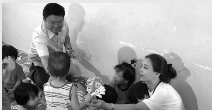
● Các trẻ em ở Mái ấm Hoa Hồng được đưa về chăm sóc ở Cơ sở nuôi dưỡng bảo trợ trẻ em Tam Bình.