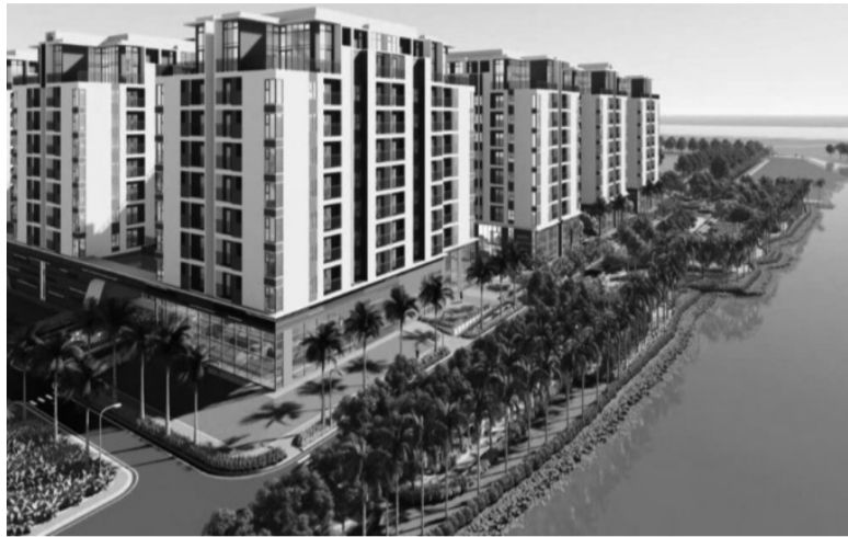
● Dự án NOXH ở quận 2, TP Hồ Chí Minh.