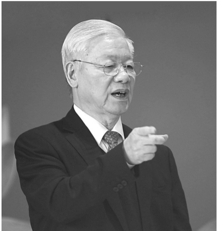
● Cố Tổng Bí thư Nguyễn Phú Trọng.

Những hiểm họa mà các doanh nghiệp “sân sau” gây ra không chỉ làm tha hóa một bộ phận cán bộ, đảng viên, méo mó chính sách, lung đoạn nền kinh tế, mà nghiêm trọng hơn là suy giảm niềm tin của Nhân dân đối với Đảng, Nhà nước. Trong bối cảnh Đảng ta đang đẩy mạnh đấu tranh phòng, chống tham nhũng, tiêu cực, việc chặn đứng hiểm họa từ các doanh nghiệp “sân sau” càng trở nên hệ trọng và cấp thiết.