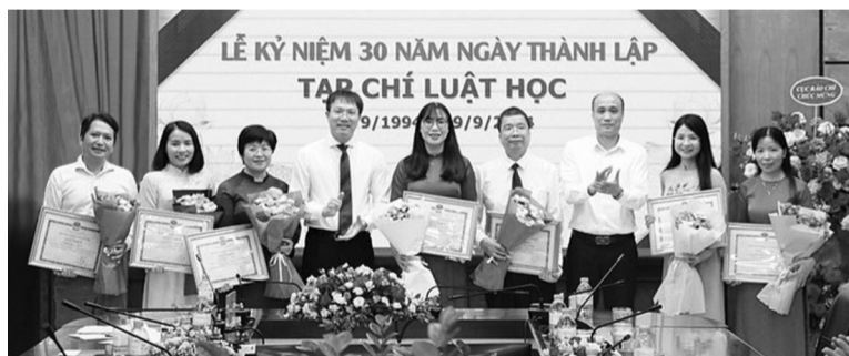
● Lãnh đạo Trường Đại học Luật Hà Nội trao Giấy khen cho lãnh đạo Tạp chí và các đơn vị có đóng góp cho sự phát triển của Tạp chí.

Sáng 9/9, Tạp chí Luật học long trọng tổ chức Lễ kỷ niệm 30 năm Ngày thành lập (9/9/1994 - 9/9/2024).