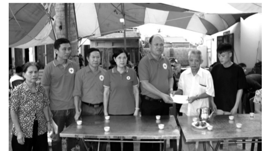
● Hội Chữ thập đỏ TP Hải Phòng thăm hỏi, động viên 2 gia đình nạn nhân thiệt mạng do ảnh hưởng của bão số 3.

Ngày 9/9, Trung ương Hội Chữ thập đỏ Việt Nam quyết định cứu trợ khẩn cấp bước đầu tiên và hàng trị giá hơn 720 triệu đồng trợ giúp khoảng 900 hộ gia đình bị thiệt hại nặng nề do bão số 3 tại tỉnh Quảng Ninh và TP Hải Phòng. Trong đó, hỗ trợ TP Hải Phòng 250 triệu đồng và 250 thùng hàng gia đình, hỗ trợ tỉnh Quảng Ninh 200 triệu đồng và 200 thùng hàng gia đình.