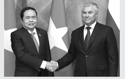
● Chủ tịch Quốc hội Trần Thanh Mẫn và Chủ tịch Duma Quốc gia Quốc hội Liên bang Nga.

Hai Chủ tịch QH nhất trí cho rằng, hiện nay, cơ chế hợp tác của Ủy ban Hợp tác liên Nghị viện giữa QH Việt Nam và Duma Quốc gia QH Liên bang Nga là cơ chế hợp tác đầu tiên và cao nhất của QH Việt Nam với một Cơ quan lập pháp của một quốc gia khác. Hai bên đã tổ chức thành công hai phiên họp. Trong khuôn khổ chuyến thăm lần này, hai bên sẽ cùng chủ trì Phiên họp lần thứ ba nhằm rà soát, hỗ trợ, tháo gỡ vướng mắc để thúc đẩy quan hệ hợp tác này phát triển mạnh mẽ hơn, tương xứng với quan hệ Đối tác chiến lược toàn diện Việt - Nga trong tình hình mới. T.HOÀNG