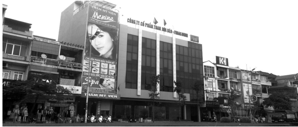
● Trụ sở Cty CP Than Núi Béo - Vinacomin.

Theo kết luận thanh tra (KLTT) của Thanh tra tỉnh Quảng Ninh, Cty CP Than Núi Béo - Vinacomin đã thi công một số hạng mục tại dự án đầu tư khu tái định cư tại phường Hà Phong (TP Hạ Long) dù chưa có giấy phép xây dựng.