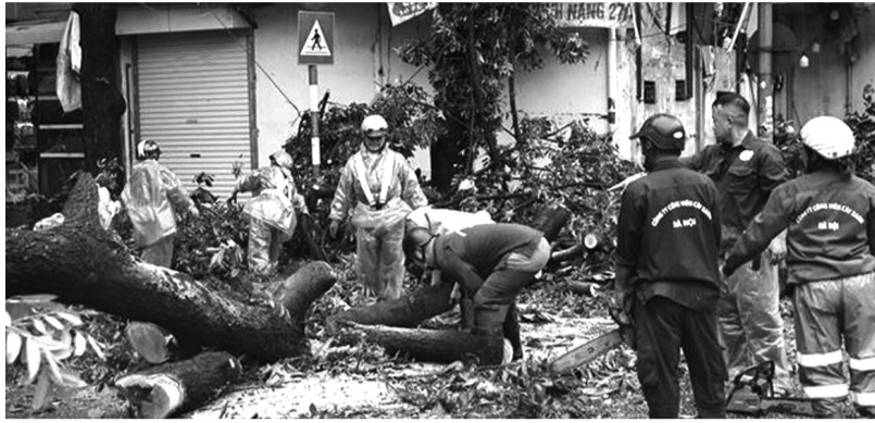
● Lực lượng chức năng khắc phục hậu quả tại phố Đinh Tiên Hoàng, quận Hoàn Kiếm.

Cơn bão số 3 (bão Yagi) đi qua các tỉnh, thành phía Bắc gây ảnh hưởng nghiêm trọng đến hệ thống giao thông. Các đơn vị chức năng ngay lập tức được huy động để nhanh chóng khôi phục hệ thống giao thông.