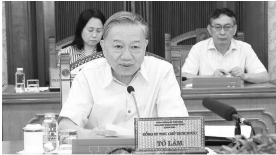
● Tổng Bí thư, Chủ tịch nước Tô Lâm chủ trì cuộc họp của Bộ Chính trị, Ban Bí thư để chỉ đạo việc tập trung khắc phục hậu quả mưa lũ do ảnh hưởng của cơn bão số 3 và chủ động ứng phó với mưa lũ, sạt lở đất trong thời gian tới, chiều 9/9.

Với mục tiêu cao nhất là bảo đảm an toàn tính mạng, tài sản của Nhân dân, khẩn trương ổn định đời sống của người dân bị ảnh hưởng của cơn bão..., Tổng Bí thư, Chủ tịch nước Tô Lâm đề nghị cấp ủy, chính quyền các cấp tập trung cao độ triển khai các kế hoạch, phương án khắc phục hậu quả bão số 3 với 5 mục tiêu như Thủ tướng Chính phủ đã chỉ đạo. Trước