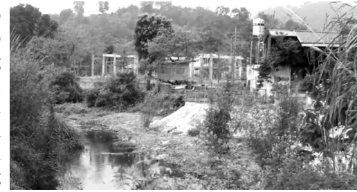
● Hiện trạng Suối Cò bị san lấp.

Báo cáo UBND TP Hà Nội giao UBND huyện Ba Vì chủ trì thuê đơn vị có tư cách pháp nhân lập bản đồ hiện trạng khu đất vi phạm. Xác định diện tích đất, nguồn gốc đất và công trình xây dựng vi phạm, phối hợp với UBND huyện Thạch Thất làm rõ ranh giới, địa giới hành chính và thống nhất đề xuất biện pháp xử lý công trình xây dựng vi phạm theo đúng quy định pháp luật.