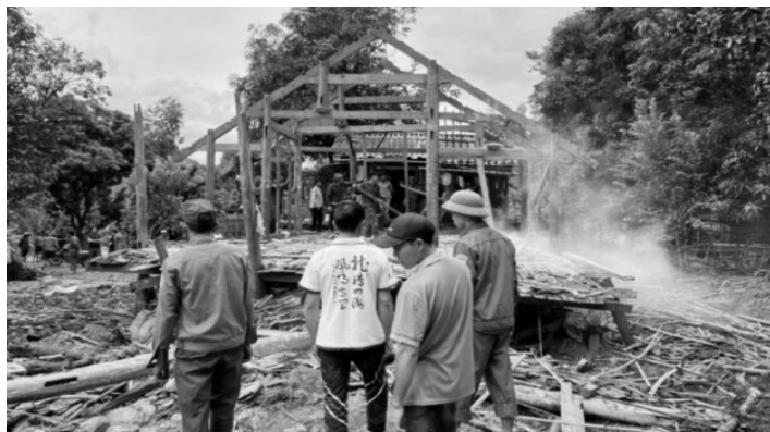
● LLVT Sơn La giúp dân tháo dỡ, di chuyển nhà ra khỏi khu vực nguy hiểm.