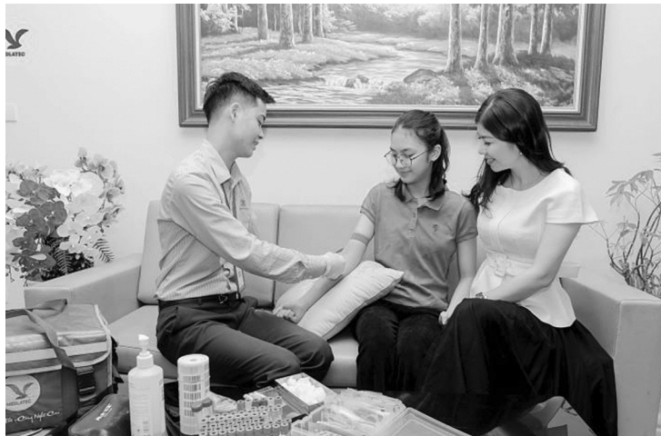
● Gia đình có con nhỏ, phụ nữ mang thai, người mắc bệnh mạn tính giờ đây nhẹ tênh mỗi khi kiểm tra sức khỏe vì được phục vụ lấy mẫu xét nghiệm tận nơi.