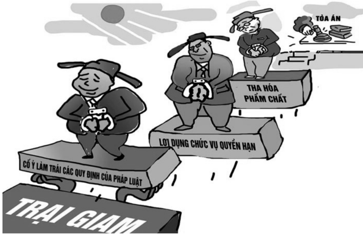
● Các vụ án lớn về kinh tế, tham nhũng vừa qua cho thấy hiệu quả không cao của công tác kiểm soát quyền lực và thực thi pháp luật, làm giảm sút niềm tin của người dân và DN.

Kỳ 3: Nguyên nhân và những hệ lụy Khi người dân và doanh nghiệp giảm niềm tin vào môi trường kinh doanh bình đẳng, họ sẽ giảm đầu tư, giảm tiếp cận công nghệ mới, giảm khả năng cạnh tranh... Thay vào đó, sẽ tăng tần suất sử dụng phong bì và “đánh quả” là chính, từ đó gây lũng đoạn nền kinh tế, tàn phá đất nước.