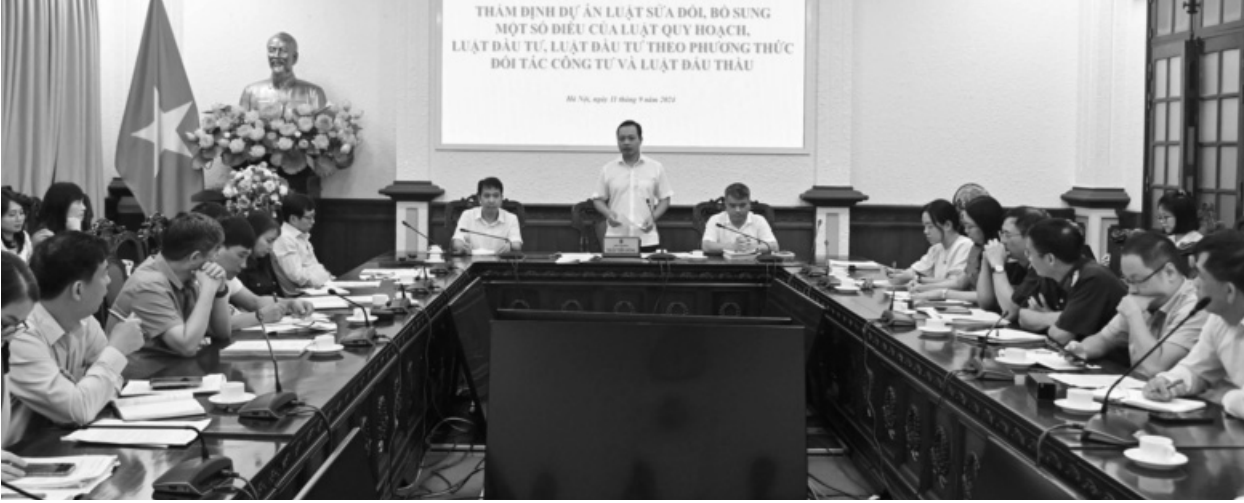
● Thủ tướng Bộ Tư pháp Trần Tiến Dũng kết luận cuộc họp thẩm định.