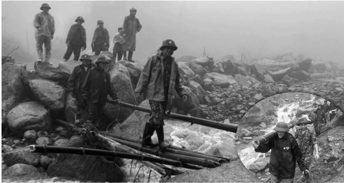
● LLVT cơ động vào khu vực sạt lở tìm kiếm nạn nhân.

Phát huy vai trò nòng cốt, đi đầu trong phòng, chống thiên tai, tìm kiếm cứu hộ, cứu nạn, những ngày qua, cán bộ, chiến sĩ lực lượng vũ trang (LLVT) Quân khu (QK)2 không quản khó khăn, vất vả, luôn có mặt sớm nhất, kịp thời giúp cấp ủy, chính quyền và Nhân dân địa phương khắc phục hậu quả sau bão số 3 với tinh thần nơi nào Nhân dân cần, nơi đó có Bộ đội Cụ Hồ.