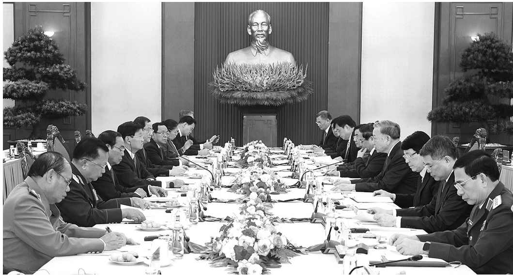
● Cuộc gặp cấp cao giữa Đảng Cộng sản Việt Nam và Đảng Nhân dân Cách mạng Lào.

Các nhà Lãnh đạo của hai Đảng, hai nước nhất trí trong thời gian tới cần tích cực triển khai các định hướng trọng tâm đã được Lãnh đạo hai bên thống nhất, tiếp tục đưa quan hệ chính trị đi vào chiều sâu, là nòng cốt định hướng tổng thể quan hệ hợp tác.