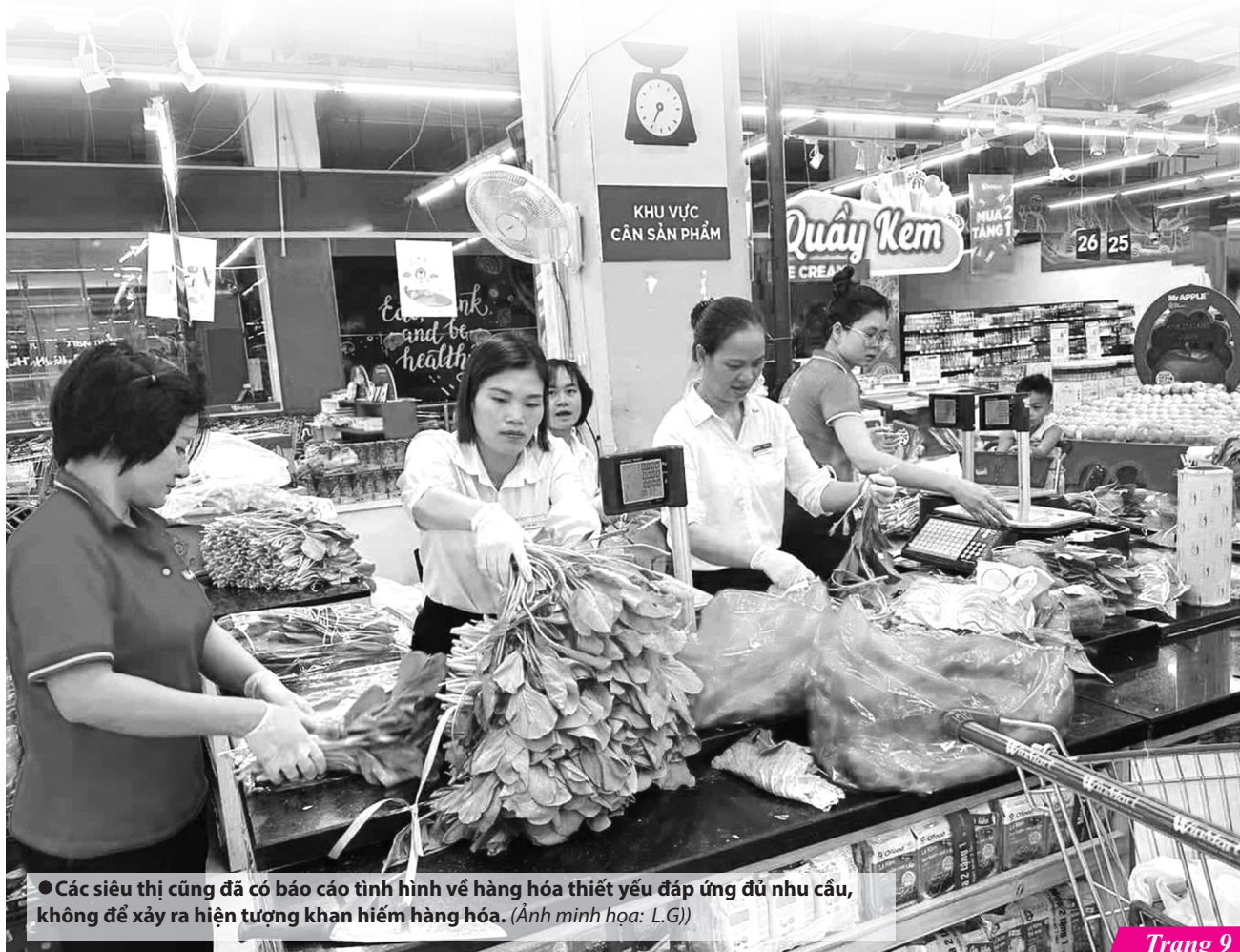
● Các siêu thị cũng đã có báo cáo tình hình về hàng hóa thiết yếu đáp ứng đủ nhu cầu, không để xảy ra hiện tượng khan hiếm hàng hóa. (Ảnh minh họa: L.G)