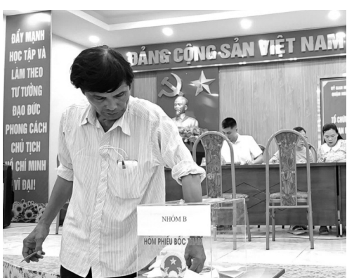
● Các hộ dân tham gia bốc thăm xác định vị trí căn hộ.

Quận Ngô Quyền tổ chức cho 13 hộ dân có từ 5 nhân khẩu trở lên đang thực tế sinh sống tại các chung cư cũ A7, A8 Vạn Mỹ bốc thăm vào 13/24 căn hộ nhóm A có diện tích 59m 2 tại các chung cư 5 tầng Kênh Dương. 74 hộ dân có từ 1 - 4 nhân khẩu đang thực tế sinh sống tại các chung cư cũ A7, A8 Vạn Mỹ bốc thăm vào 74/76 căn hộ nhóm B có diện tích 37m 2 và 49m 2 tại chung cư 5 tầng Kênh Dương. NGUYỄN AN