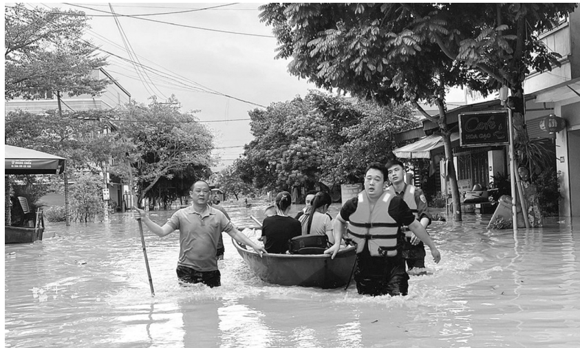
● Tinh thần tương thân tương ái, đùm bọc, hỗ trợ lẫn nhau của người dân Việt Nam nổi bật lên giữa giông bão.

Cơn bão số 3 Yagi đổ bộ vào miền Bắc Việt Nam gây thiệt hại nặng nề về người và tài sản, nhưng tình người đã tỏa sáng trong những hành động nghĩa tình. Hướng về những vùng gặp bão lũ, hàng loạt các cấp, các ngành, cá nhân, tổ chức đã liên tục tiếp sức cả về vật chất lẫn tinh thần cho người dân vùng bão.