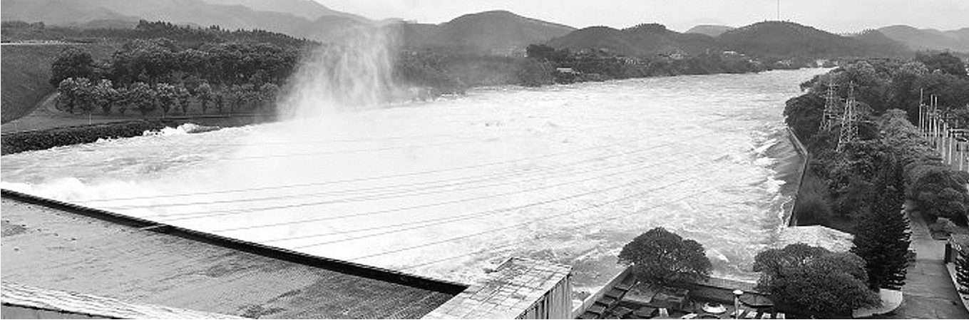
● Hình ảnh hồ Thác Bà chụp ngày 11/9.

Cập nhật từ Tập đoàn Điện lực Việt Nam cho thấy, ngày 11/9, lưu lượng nước về các hồ thủy điện đều có xu hướng giảm tại tất cả các hồ, đặc biệt các hồ được dự báo có nguy cơ gây ra tình huống xấu nhất.