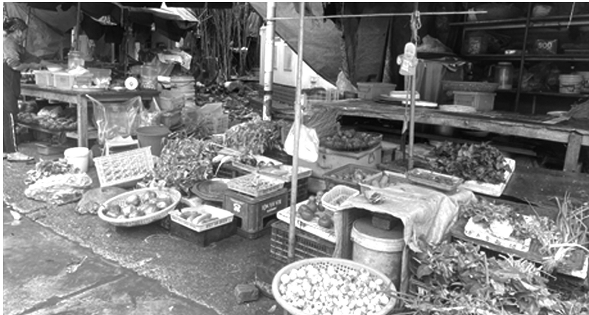
● Rau xanh tại các chợ dân sinh tăng giá.

Hàng hóa rau xanh tại các chợ dân sinh có hiện tượng tăng giá nhưng tại hệ thống siêu thị, cửa hàng nông sản, giá vẫn được giữ ổn định. Các hệ thống đều đã lên kế hoạch vận chuyển rau, củ, quả ra Bắc mỗi ngày trong giai đoạn hiện nay.