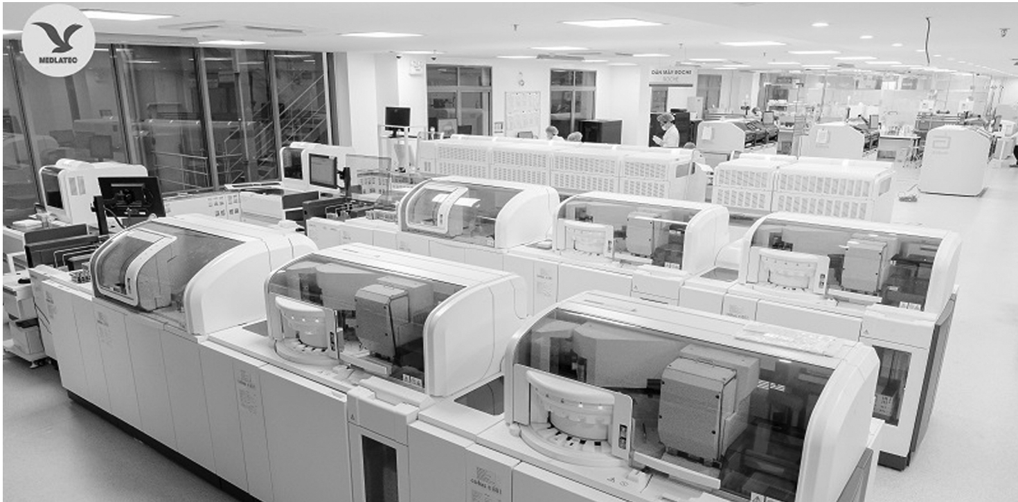
● Kết quả xét nghiệm của MEDLATEC được liên thông tại các bệnh viện đầu ngành và được công nhận tại trên 30 quốc gia trên toàn cầu.

Với đặc điểm bệnh tiến triển kéo dài, dễ tái phát, không chữa khỏi hoàn toàn, không phòng ngừa bằng vaccine... nên khi mắc bệnh mạn tính trở thành ác mộng của nhiều người bệnh. Tuy nhiên, giờ đây người bệnh dễ dàng quản lý, kiểm soát sức khỏe ngay tại nhà chỉ bằng một cái “chạm tay”, thuận lợi, nhanh chóng, chính xác và tiết kiệm chi phí.