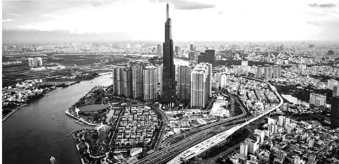
● Một góc TP HCM.

Ban Thường vụ Thành ủy TP HCM vừa có kết luận về chủ trương điều chỉnh và cách thức thực hiện Bảng giá đất (BGĐ) theo Quyết định số 02.