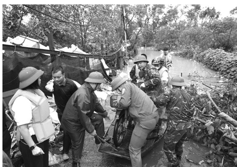
● Quận Tây Hồ huy động lực lượng hỗ trợ di chuyển người, tài sản của người dân đến nơi an toàn.