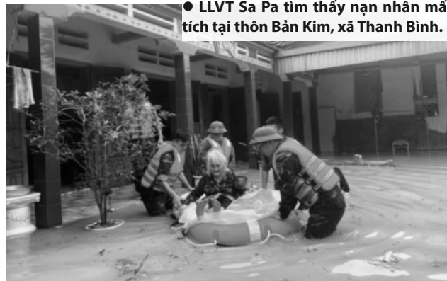
● LLVT Sa Pa tìm thấy nạn nhân mất tích tại thôn Bản Kim, xã Thanh Bình.

Ngày 11/9, các lực lượng thuộc Cục Quân nhu, Cục Vận tải (Tổng cục Hậu cần) đã phối hợp tổ chức tiếp nhận, vận chuyển, cấp phát lương thực cho các QK1, 2, 3 để hỗ trợ Nhân dân các tỉnh trên địa bàn khắc phục hậu quả cơn bão số 3 và mưa lũ sau bão.