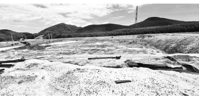
● Dự án sau 6 năm thi công nhưng nhiều hạng mục vẫn dang dở.

hành bãi xử lý rác Hương Bình. Vì vậy, dự án chưa thể hoàn thành theo kế hoạch.