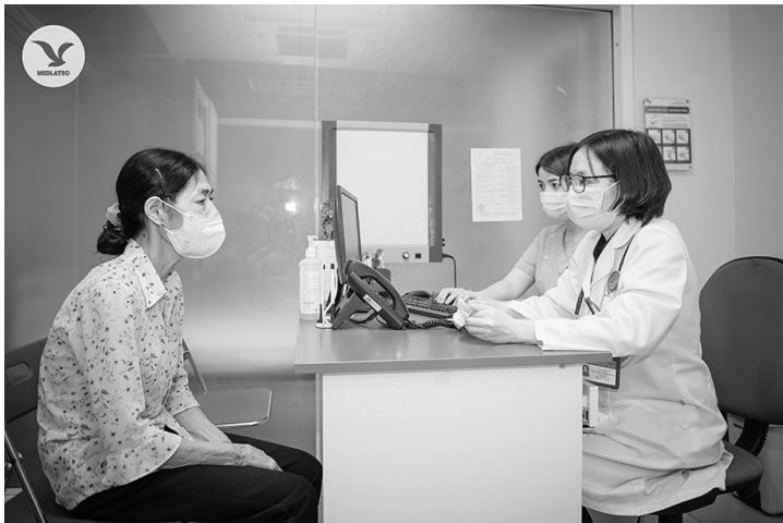
● Kiểm tra sức khỏe định kỳ là cách quản lý sức khỏe tốt nhất, đặc biệt những người mắc bệnh lý mạn tính.