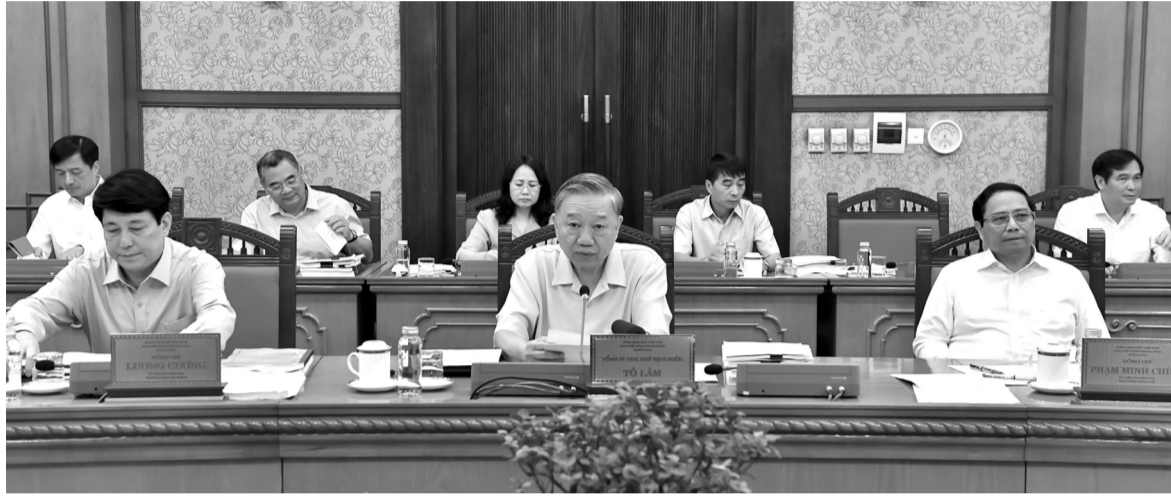
● Tổng Bí thư, Chủ tịch nước Tô Lâm chủ trì họp Bộ Chính trị cho ý kiến về Đề án thành lập thành phố Huế trực thuộc Trung ương.

Ngày 13/9, tại Trụ sở Trung ương Đảng, Tổng Bí thư, Chủ tịch nước Tô Lâm chủ trì họp Bộ Chính trị cho ý kiến về Đề án sơ kết 5 năm thực hiện Nghị quyết số 45-NQ/TW ngày 24/1/2019 của Bộ Chính trị khóa XII về xây dựng và phát triển TP Hải Phòng đến năm 2030, tầm nhìn đến năm 2045 (Nghị quyết 45-NQ/TW) và cho ý kiến về Đề án thành lập TP Huế trực thuộc Trung ương.