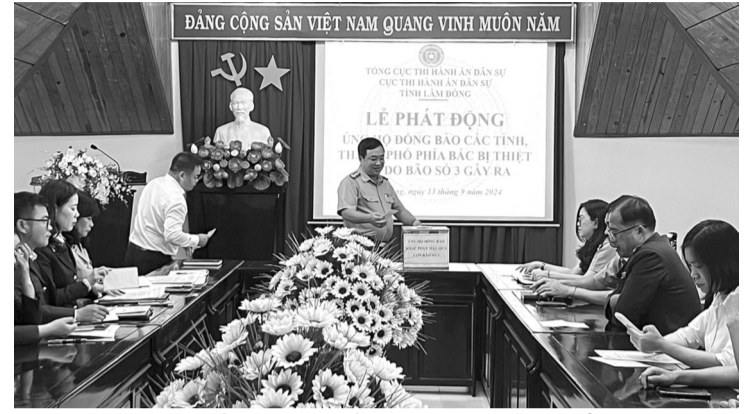
● Cục THADS Lâm Đồng ủng hộ đồng bào các tỉnh phía Bắc bị thiệt hại do cơn bão số 3 gây ra.