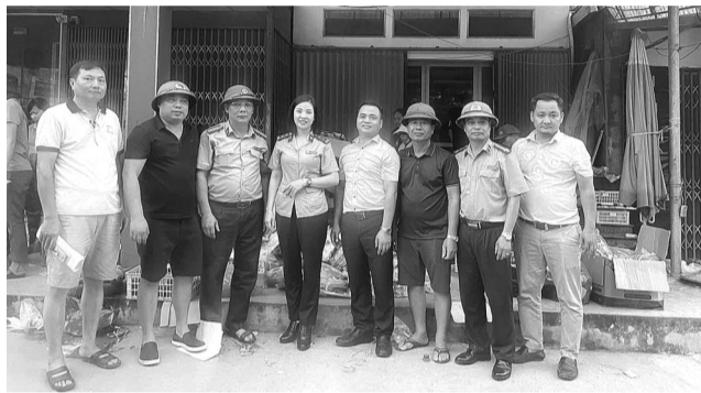
● Cán bộ Chi cục THADS Hà Hòa, tỉnh Phú Thọ thực hiện cứu trợ bà con các xã ngập lụt trong huyện.