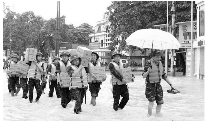
● Bộ đội Quân khu 1 cùng Đoàn công tác vận chuyển lương khô đến với bà con Nhân dân xã Linh Sơn, TP Thái Nguyên.

Sau nhiều ngày căng mình chống bão cứu dân, bảo vệ tài sản, tìm kiếm cứu nạn, cán bộ, chiến sĩ (CBCS) các cơ quan, đơn vị Quân đội và lực lượng dân quân tự vệ vẫn chưa một phút ngơi tay; tiếp tục tìm kiếm nạn nhân mất tích, giúp các địa phương khắc phục hậu quả mưa lũ.