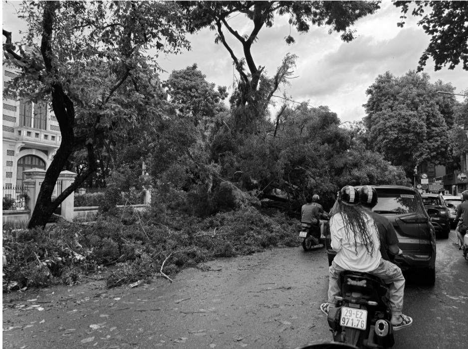
● Bão Yagi gây ảnh hưởng nặng nề đến hạ tầng, mỹ quan đô thị.

Sự kiện cơn bão "lịch sử" với khu vực miền Bắc đã gióng lên hồi chuông cảnh báo về yêu cầu phát triển các đô thị bền vững, có khả năng chống chịu với các tác động của biến đổi khí hậu. Tuy nhiên, đây