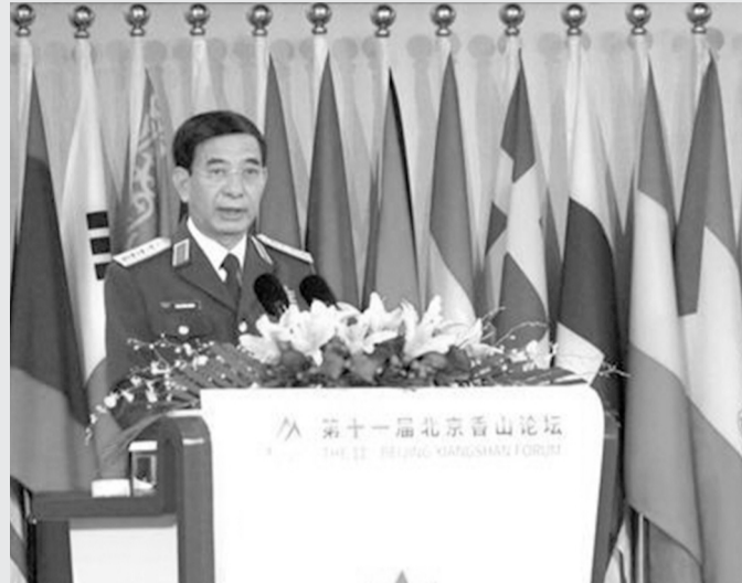
● Bộ trưởng Bộ Quốc phòng Phan Văn Giang phát biểu tại phiên toàn thể 1.

Sáng qua (13/9), Diễn đàn Hương Sơn Bắc Kinh lần thứ 11 đã khai mạc tại Thủ đô Bắc Kinh, Trung Quốc. Đại tướng Phan Văn Giang, Ủy viên Bộ Chính trị, Bộ trưởng Bộ Quốc phòng (BQP) dẫn đầu Đoàn đại biểu cấp cao BQP Việt Nam tham dự và có bài phát biểu quan trọng tại phiên toàn thể 1 với chủ đề “Hợp tác an ninh và sự phồn vinh, ổn định của khu vực châu Á - Thái Bình Dương (CA - TBD)”.