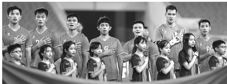
●Đội tuyển Quốc gia dưới thời HLV Kim Sang Sik vẫn là những gương mặt cũ đang xuống phong độ.

những người cũ không thể “sống mãi” với đội tuyển được.