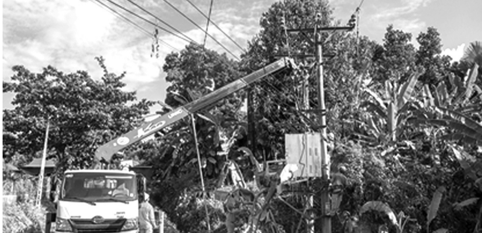
● Công ty điện lực Lào Cai tiến hành thay trạm biến áp bị ngập nước.

Cơn bão số 3 và hoàn lưu sau bão đã ảnh hưởng nặng đến hệ thống điện của 17 tỉnh miền Bắc. Những ngày này, người lao động của điện lực miền Bắc đang nỗ lực từng giờ để sớm cấp điện trở lại cho toàn bộ khu vực bị ảnh hưởng.