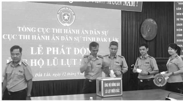
● Cục Thi hành án dân sự tỉnh Đắk Lắk phát động ủng hộ đồng bào bị lũ lụt ở miền Bắc.