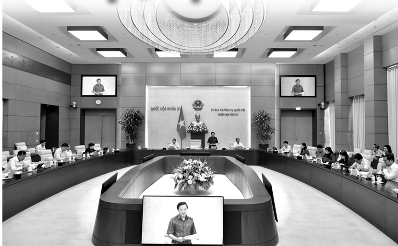
● Phó Chủ tịch Quốc hội Nguyễn Khắc Định điều hành nội dung phiên họp.

Đây là ý kiến được nêu ra tại phiên họp của Ủy ban Thường vụ Quốc hội sáng 13/9, khi cho ý kiến về các báo cáo công tác năm 2024 của Chánh án Tòa án nhân dân tối cao, Viện trưởng Viện kiểm sát nhân dân tối cao; các báo cáo của Chính phủ về công tác phòng, chống tội phạm và vi phạm pháp luật, công tác thi hành án và công tác phòng, chống tham nhũng năm 2024.