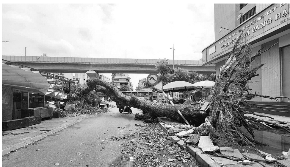
● Cây xà cừ bị đổ bịt lối vào ngõ 10 đường Quang Trung, quận Hà Đông.