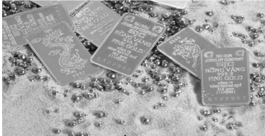
● Giá vàng miếng SJC vẫn đứng im dù giá thế giới tăng mạnh. (Ảnh minh họa)

Trong khi đó, giá vàng miếng SJC vẫn tiếp tục đứng im theo thông báo bán vàng miếng cho các ngân hàng thương mại của Ngân hàng Nhà nước (NHNN) từ ngày 5/9. Theo đó, vàng miếng SJC hiện được các thương hiệu giao dịch quanh vùng giá 78,5 - 80,5 triệu đồng/lượng (mua - bán). Với việc