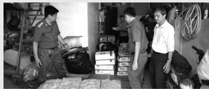
● Lực lượng chức năng kiểm tra lô hàng.

Ngày 13/9, Phòng Cảnh sát kinh tế Công an Bình Thuận cho biết vừa phối hợp cơ quan chức năng kiểm tra một cơ sở kinh doanh, phát hiện và bắt giữ hơn 1 tấn thực phẩm không rõ nguồn gốc.