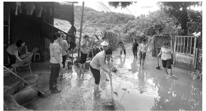
● Cán bộ Cục THADS Lào Cai giúp dân tổ 29, phường Bắc Cường, TP Lào Cai dọn dẹp sau lũ.

Ngày 12/9, Tổng cục THADS phát đi văn bản gửi Thủ trưởng các đơn vị thuộc Tổng cục, Cục trưởng Cục THADS các tỉnh, thành phố trực thuộc Trung ương nêu rõ: Dưới sự chỉ đạo của cấp ủy, chính quyền địa phương, của lãnh đạo Bộ, lãnh đạo Tổng cục THADS, các cơ quan THADS đã kịp thời đề ra các biện pháp nhằm khắc phục một phần các khó khăn, thiệt hại do bão, lũ gây ra. Tổng cục trưởng ghi nhận, cảm ơn, đánh giá cao những nỗ lực của các đồng chí trong việc khắc phục hậu quả, khó khăn, gửi lời thăm hỏi ân cần, chia sẻ sâu sắc với những thiệt hại, khó khăn, vất vả mà các cơ quan THADS, gia đình công chức và người lao động tại các tỉnh bị bão, lũ đang phải gánh chịu. Bộ trưởng Bộ Tư pháp Nguyễn Hải Ninh cũng ghi nhận, đánh giá cao tính chủ động, kịp thời của Hệ thống THADS và gửi lời động viên, chia sẻ tới các cơ quan THADS, gia đình công chức, người lao động của Hệ thống THADS bị thiệt hại, khó khăn, đề nghị các cơ quan THADS tiếp tục khắc phục khó khăn, ổn định công tác và kịp thời đề nghị hỗ trợ trong trường hợp cần thiết.