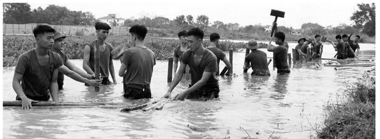
● Cán bộ, học viên Trường Sĩ quan Lục quân 1 đắp kè bờ đê tại TX Sơn Tây, TP Hà Nội.