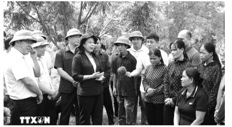
● Phó Chủ tịch nước Võ Thị Anh Xuân thăm hỏi, động viên người dân bị thiệt hại do bão số 3 tại huyện Hữu Lũng, tỉnh Lạng Sơn.

Chiều 13/9, Đoàn công tác do đồng chí Võ Thị Anh Xuân, Ủy viên Trung ương Đảng, Phó Chủ tịch nước làm Trưởng