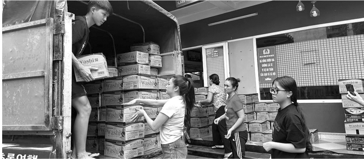
● Diễn viên Kiều Anh (áo trắng) chuẩn bị đồ tiếp tế cho đồng bào vùng lũ.

Những ngày qua, cơn bão Yagi khiến các tỉnh, thành miền Bắc hứng chịu thiệt hại, thương vong do lở đất, lũ quét. Để san sẻ gánh nặng cùng mọi người, nhiều nghệ sĩ đã đóng góp tổng số tiền lên tới hàng tỷ đồng. Hành động của họ không chỉ cho thấy một mặt tích cực của đời sống nghệ thuật mà còn có đóng góp rất lớn trong sự phát triển chung của xã hội.