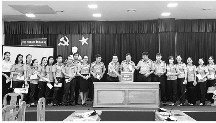
● Cục THADS Hà Tĩnh ủng hộ đồng bào bị thiệt hại do cơn bão số 3.

Những ngày qua, do ảnh hưởng của cơn bão số 3, Hệ thống cơ quan Thi hành án dân sự (THADS) và đội ngũ cán bộ, công chức của các cơ quan này cũng chịu những thiệt hại nặng nề. Ngay sau bão, các cơ quan THADS đã khẩn trương khắc phục hậu quả bão số 3, đồng thời có nhiều hành động thiết thực sẻ chia, giúp đỡ bà con vùng lũ.