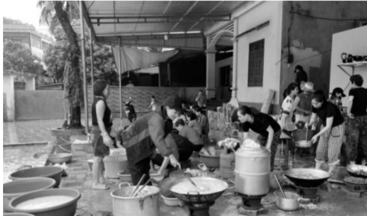
● Nhân dân tổ chức nấu ăn cho CBCS đang thực hiện nhiệm vụ và hỗ trợ người dân bị bão lũ.

Chủ động ứng phó thiên tai, bão lũ, những năm qua Sư đoàn (SĐ) 346 Quân khu 1 đã tổ chức huấn luyện, triển khai có hiệu quả mô hình “dân vận khéo”, góp phần củng cố vững chắc lòng tin của Nhân dân với quân đội, tăng cường mối quan hệ đoàn kết gắn bó máu thịt quân - dân.