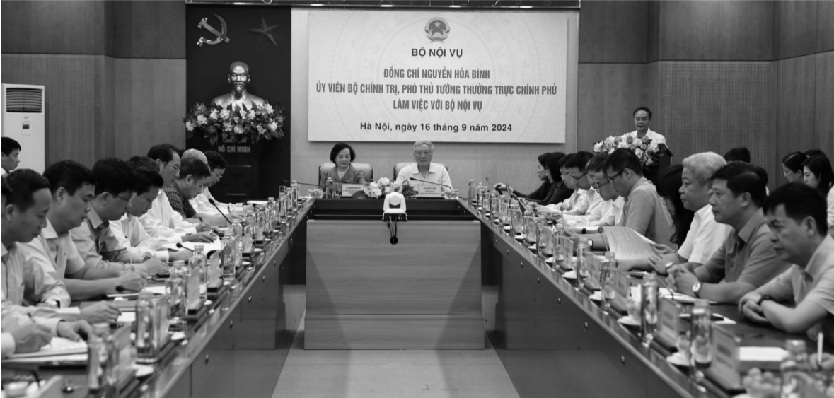
● Quang cảnh buổi làm việc.