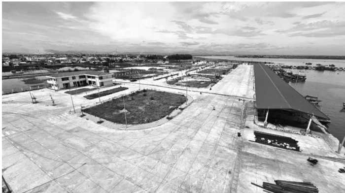
● Dự án cảng cá Thuận An có tổng mức đầu tư 220 tỉ đồng, do Sở Nông nghiệp và Phát triển nông thôn tỉnh Thừa Thiên Huế làm chủ đầu tư.

đến chính quyền địa phương và Ban Quản lý cảng cá Thừa Thiên Huế cùng các đơn vị liên quan đề sớm có giải pháp đưa cảng vào hoạt động, tránh lãng phí.