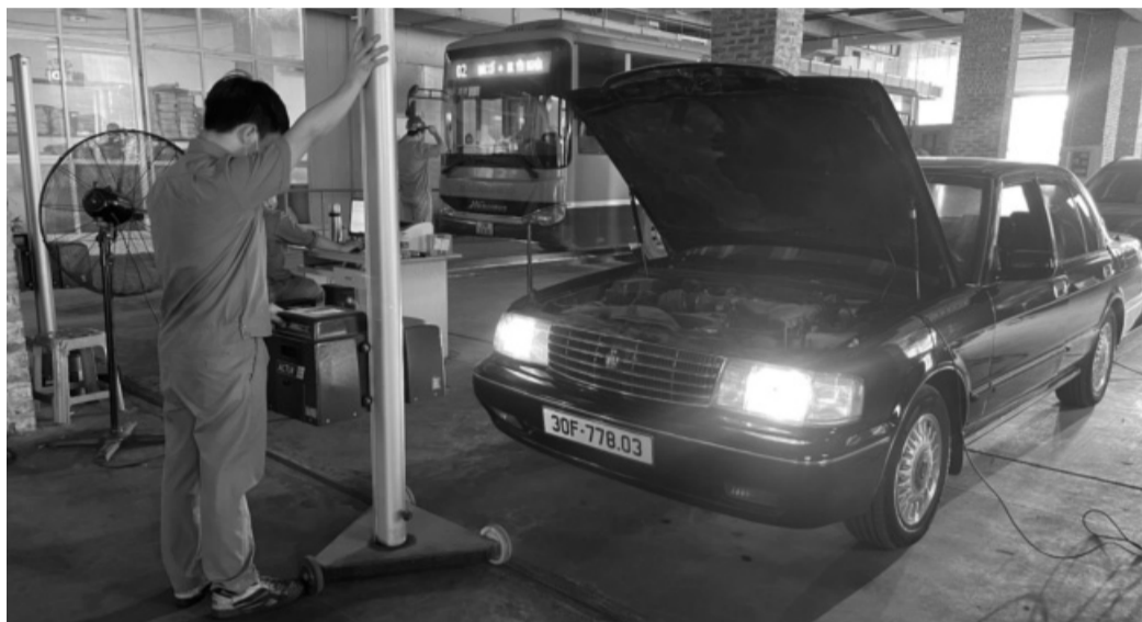
● Trung tâm đăng kiểm xe cơ giới 29-30D.

Bộ Giao thông vận tải (GTVT) đang lấy ý kiến đối với dự thảo Thông tư quy định trình tự, thủ tục cấp mới, cấp lại, tạm đình chỉ hoạt động, thu hồi giấy chứng nhận đủ điều kiện hoạt động kiểm định xe cơ giới của cơ sở đăng kiểm xe cơ giới, cơ sở kiểm định khí thải xe mô tô, xe gắn máy. Trong đó, đề xuất Cục Đăng kiểm Việt Nam và Sở GTVT có trách nhiệm kiểm tra đột xuất cơ sở đăng kiểm nếu phát hiện có dấu hiệu bất thường trong hoạt động kiểm định xe cơ giới.