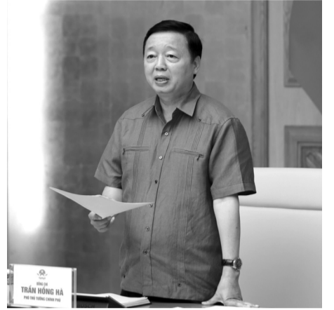
● Phó Thủ tướng Trần Hồng Hà yêu cầu rà soát các dự án còn lại có vướng mắc.