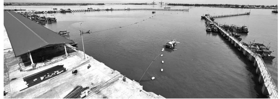
● Hiện dự án chưa thể công bố mở cảng do chưa có quyết định giao đất, giao mặt nước.

Dự án xây dựng nâng cấp hạ tầng nghề cá tỉnh Thừa Thiên Huế do Sở Nông nghiệp và Phát triển nông thôn tỉnh Thừa Thiên Huế làm chủ đầu tư với tổng mức 400 tỷ đồng, từ nguồn vốn bồi thường của Công ty TNHH Gang thép Hưng Nghiệp Formosa Hà Tĩnh liên quan đến sự cố môi trường biển xảy ra tại miền Trung nhiều năm về trước. Trong đó dự án cảng cá Thuận An kết hợp khu neo đậu tránh trú bão có tổng mức đầu tư 220 tỷ đồng là một trong ba dự án thành phần.