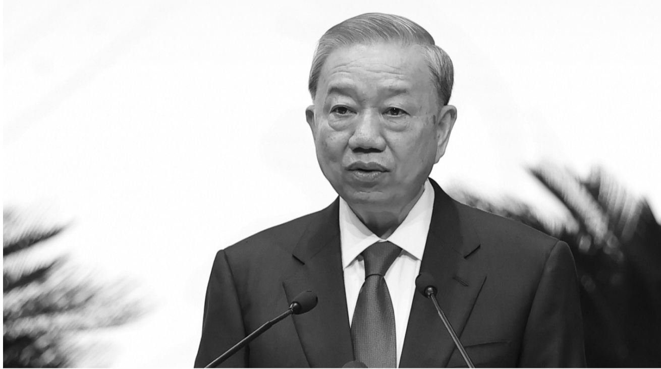
● Tổng Bí thư, Chủ tịch nước Tô Lâm.

Tổng Bí thư Ban Chấp hành Trung ương Đảng Cộng sản Việt Nam, Chủ tịch nước Cộng hòa xã hội chủ nghĩa Việt Nam Tô Lâm vừa có bài viết về “Tiếp tục đổi mới mạnh mẽ phương thức lãnh đạo, cầm quyền của Đảng, yêu cầu cấp bách của giai đoạn cách mạng mới”.