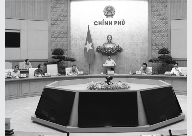
● Thủ tướng Chính phủ Phạm Minh Chính chủ trì cuộc họp với lãnh đạo các Bộ, ban, ngành liên quan.

Ngày 16/9, tại Hà Nội, Thủ tướng Chính phủ Phạm Minh Chính chủ trì cuộc họp với lãnh đạo các Bộ, ban, ngành liên quan, đi sâu đánh giá tình hình triển khai Nghị quyết số 36-NQ/TW về Chiến lược phát triển bền vững kinh tế biển Việt Nam đến năm 2030, tầm nhìn đến năm 2045 và các nội dung liên quan trong Nghị quyết Đại hội XIII của Đảng.