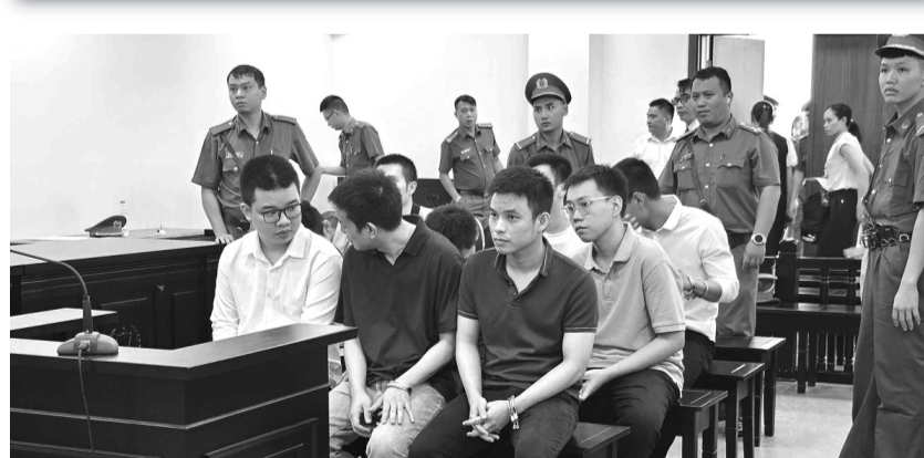
● Các bị cáo tại phiên xử.

Theo cáo trạng, “mã độc” Hiếu viết chỉ sử dụng được khoảng 1 tháng rồi giảm tác dụng hoặc bị vô hiệu hóa do hệ điều hành Windows thường xuyên thay đổi, cải tiến hệ thống bảo mật và các phần mềm diệt virus tác động. Do đó, Anh nói Hiếu thường xuyên nâng cấp, cải tiến “mã độc” để hoạt động hiệu quả nhất, không bị hệ thống bảo mật của hệ điều hành Windows và các phần mềm diệt virus vô hiệu hoá.