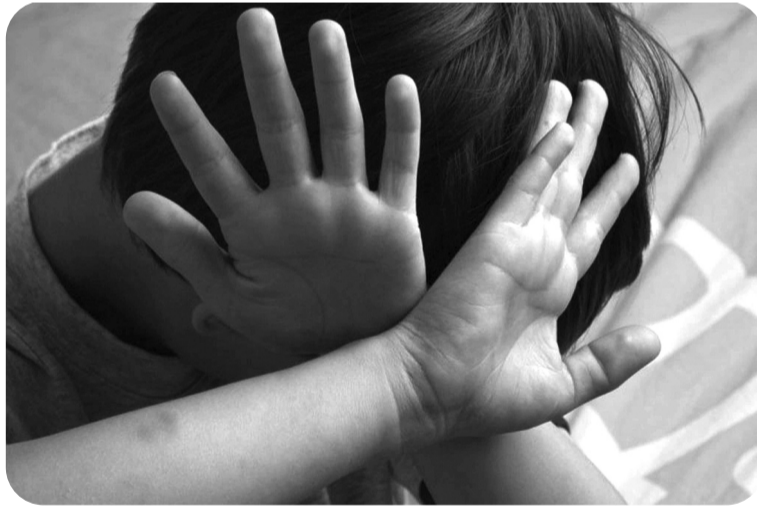
● 8 tháng đầu năm 2024, toàn quốc đã khởi tố, điều tra 1.198 vụ, với 1.419 bị can liên quan đến hành vi xâm hại, bạo hành trẻ em. (Ảnh minh họa - Nguồn: SHT)

Sau sự việc của Mái ấm Hoa Hồng, để chấn chỉnh hoạt động của các cơ sở trợ giúp xã hội trong và ngoài công lập, ngăn ngừa các rủi ro, vi phạm xảy ra, Sở LĐ-TB&XH TP HCM đã công bố kế hoạch thành lập ba đoàn kiểm tra. Các đoàn này sẽ kiểm tra tất cả cơ sở trợ giúp xã hội tại TP HCM ngay trong tháng 9 này.