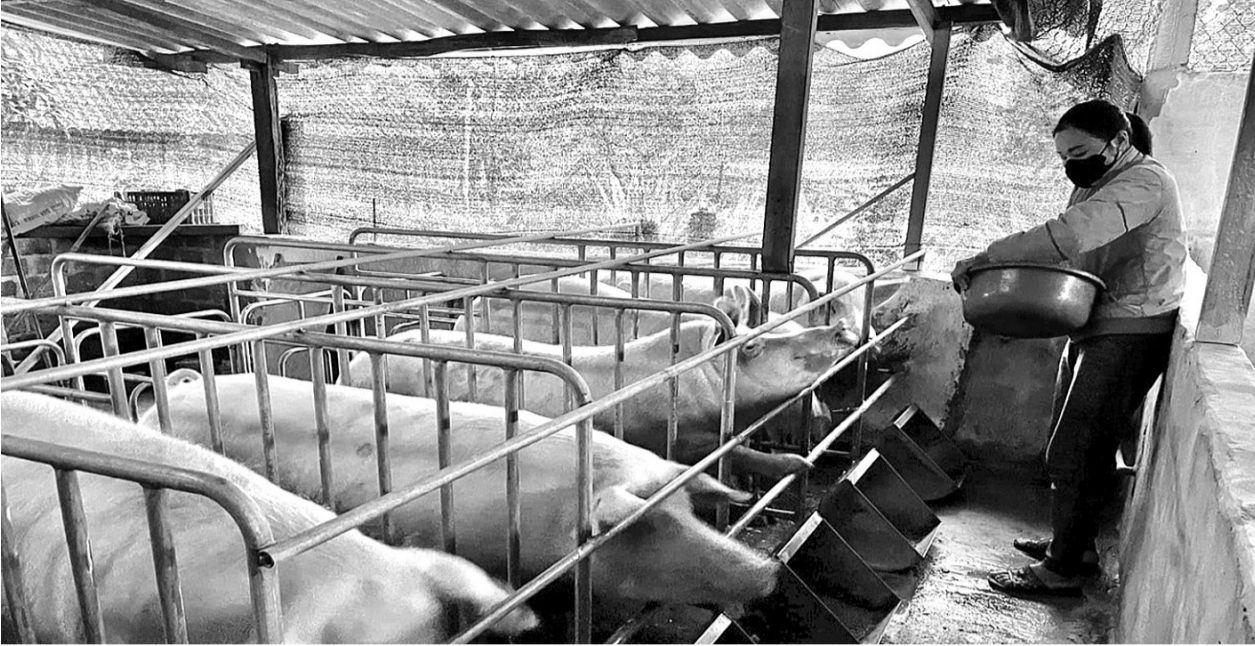
● Nhờ có Chỉ thị số 40-CT/TW ra đời, ngày càng có nhiều người nghèo ở huyện Minh Hóa, Quảng Bình thoát nghèo, ổn định cuộc sống và vươn lên làm giàu.

Sau 10 năm thực hiện Chỉ thị 40-CT/TW của Ban Bí thư Trung ương Đảng về tăng cường sự lãnh đạo của Đảng đối với tín dụng chính sách xã hội, huyện Minh Hóa (Quảng Bình) đã đạt được nhiều thành tựu nổi bật trong công tác tín dụng chính sách. Với hơn 34.000 lượt hộ nghèo và các đối tượng chính sách được vay vốn, tổng doanh số cho vay đã lên đến 1.215 tỷ đồng. Điều này không chỉ góp phần cải thiện đời sống người dân mà còn giúp đẩy mạnh công cuộc giảm nghèo tại địa phương.