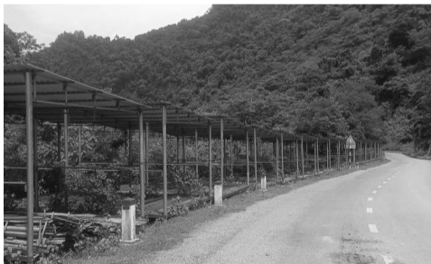
● Những ngôi nhà đã chiến được dựng lên tại xã Mường Típ. (Ảnh: Ngô Toàn)

Hơn 150 căn nhà đã chiến tránh lũ được triển khai trên địa bàn 2 xã Mường Ái và Mường Típ (huyện Kỳ Sơn, Nghệ An) từ 4 năm qua đã phát huy được hiệu quả mỗi khi có mưa lũ.