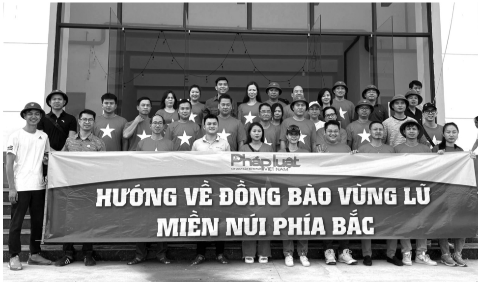
● Đoàn công tác của Báo Pháp luật Việt Nam hướng về đồng bào vùng lũ miền núi phía Bắc.