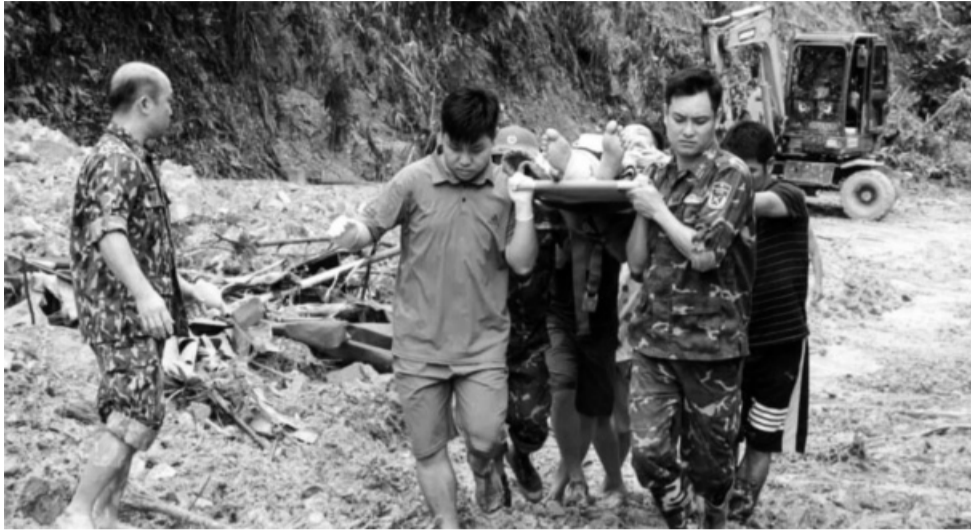
● CBCS SĐ 346 đưa người dân bị thương do sạt lở đất đi cấp cứu.