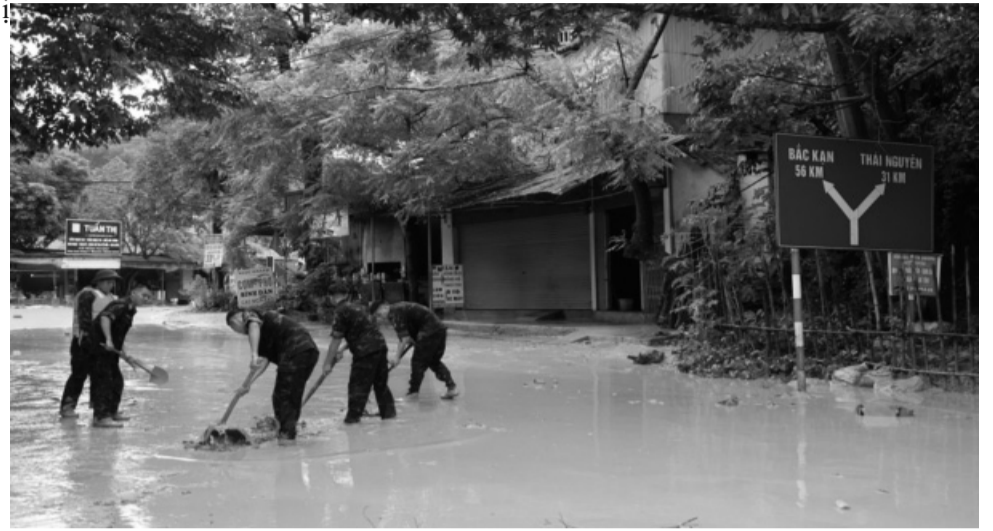
● Bộ đội dọn bùn giúp dân. (Ảnh trong bài: Đặng Văn Thành)

Chủ động ứng phó thiên tai, bão lũ, những năm qua Sư đoàn (SĐ) 346 Quân khu 1 đã tổ chức huấn luyện, triển khai có hiệu quả mô hình “dân vận khéo”, góp phần củng cố vững chắc lòng tin của Nhân dân với quân đội, tăng cường mối quan hệ đoàn kết gắn bó máu thịt quân - dân.