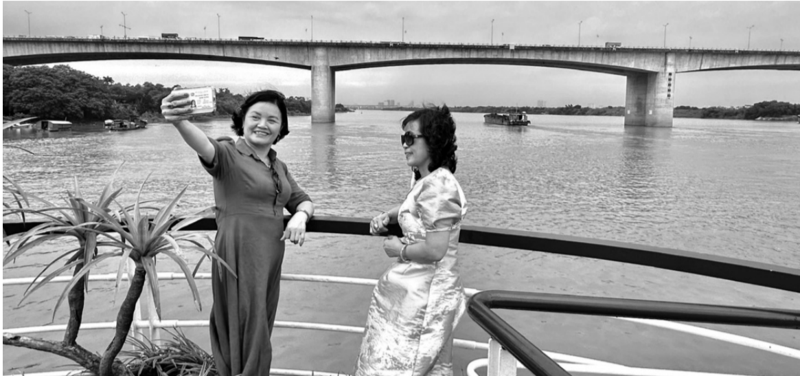
● Du khách trải nghiệm du lịch sông Hồng.