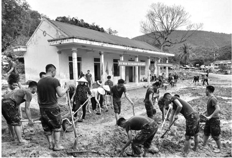
● Bộ đội SĐ 324 giúp dân xây dựng nông thôn mới.