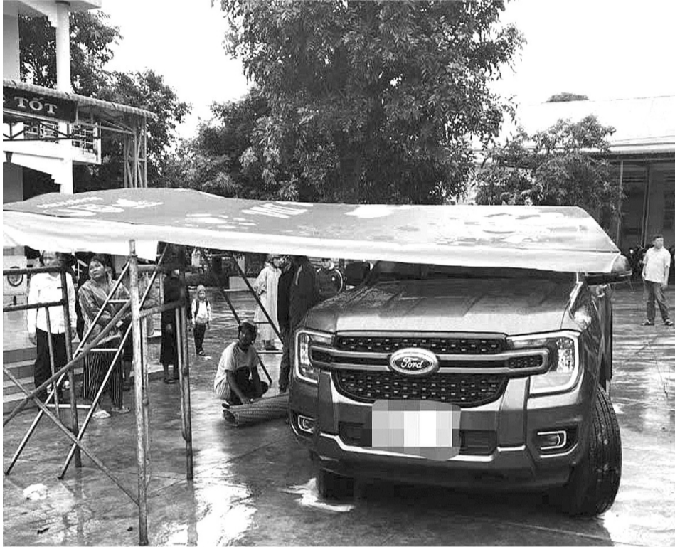
● Hiện trường vụ tai nạn thương tâm ở Đắk Lắk.

Vụ việc phụ huynh lùi ô tô trong sân trường khiến một học sinh tử vong mới đây ở Đắk Lắk đã gióng lên hồi chuông cảnh báo về vấn đề bảo đảm an toàn trong khuôn viên trường học.