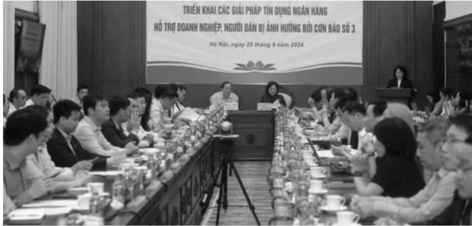
● Hội nghị được tổ chức trực tuyến với 26 tỉnh, thành bị ảnh hưởng bởi cơn bão số 3.

Cùng với đó, NHNN vẫn tiếp tục chỉ đạo các TCTD chủ động tính toán phương án hỗ trợ, thực hiện cơ cấu lại thời hạn, giữ nguyên nhóm nợ, xem xét miễn, giảm lãi vay cho các khách hàng bị thiệt hại, xây dựng các chương trình tín