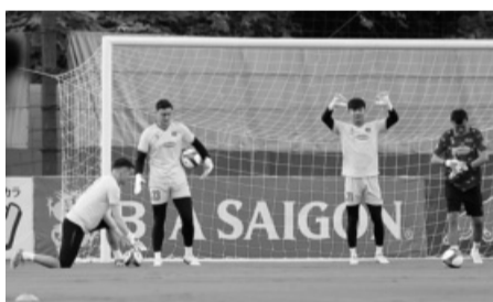
● Thủ môn Đặng Văn Lâm và Filip Nguyễn đang thi đấu cho đội tuyển quốc gia.