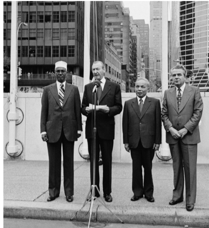
● Bộ trưởng Bộ Ngoại giao Nguyễn Duy Trinh (thứ hai, từ phải sang) dự Lễ thượng cờ Việt Nam tại trụ sở Liên hợp quốc ngày 20/9/1977.

Việt Nam được LHQ và cộng đồng quốc tế đánh giá là một điển hình thành công trong việc thực hiện các Mục tiêu phát triển Thiên niên kỷ và là một quốc gia quyết tâm và nghiêm túc thực hiện Chương trình nghị sự 2030 về phát triển bền vững và Thỏa thuận Paris về biến đổi khí hậu. Việt Nam cũng tích cực thúc đẩy các sáng kiến cải tổ LHQ, đặc biệt được đánh giá là một trong những quốc gia đi đầu triển khai sáng kiến “Thống nhất hành động” của LHQ nhằm tăng hiệu quả hoạt động của LHQ ở cấp độ