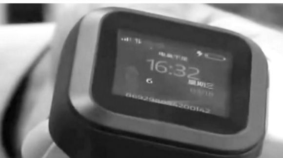
● Một thiết bị GSĐT trong THAHS được một nước châu Á sử dụng.

Khi hết thời gian GSĐT, cơ quan THAHS Công an cấp huyện, cấp quân khu kết thúc GSĐT và thu hồi thiết bị GSĐT.