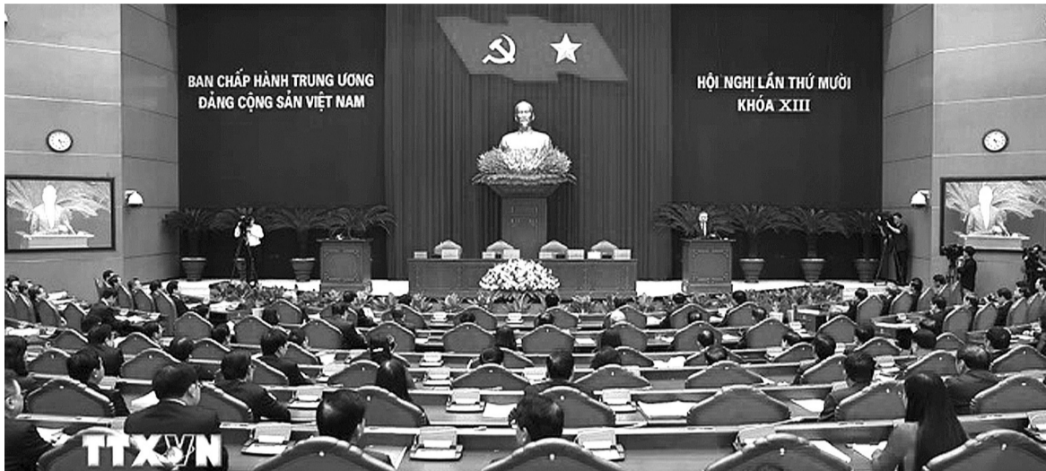
●Phiên bế mạc Hội nghị.

Trung ương yêu cầu cả hệ thống chính trị, trước hết là Chính phủ, người đứng đầu các ban, Bộ, ngành, địa phương phải thực sự quyết tâm, quyết làm, có các giải pháp quyết liệt, dứt điểm, tăng tốc để thực hiện thành công nhiệm vụ phát triển kinh tế - xã hội năm 2025 được Trung ương thông qua.