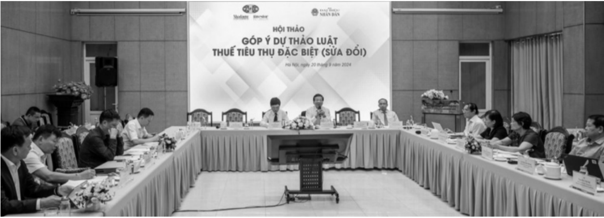
● Toàn cảnh Hội thảo góp ý dự thảo Luật Thuế tiêu thụ đặc biệt (sửa đổi).

Chưa có cơ sở cho rằng việc đánh thuế tiêu thụ đặc biệt (TTĐB) đối với nước giải khát có đường (NGKCĐ) sẽ đặt được mục tiêu hạn chế tiêu dùng, tuy nhiên, chính sách này được cho là “lợi bất cập hại”, cần có sự đánh giá tác động một cách đầy đủ.