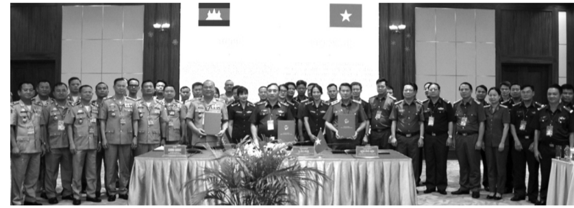
● Bộ Tư lệnh ĐBBP (Bộ Quốc phòng), Bộ Công an Việt Nam và Cục Chống ma túy (Bộ Nội vụ Vương quốc Campuchia) ký biên bản thỏa thuận phối hợp phòng, chống tội phạm ma túy.

Theo Bộ Công an, thời gian qua, công tác hợp tác quốc tế về phòng, chống ma túy (PCMT) đã được thực hiện có chiều sâu, hiệu quả, thực chất.