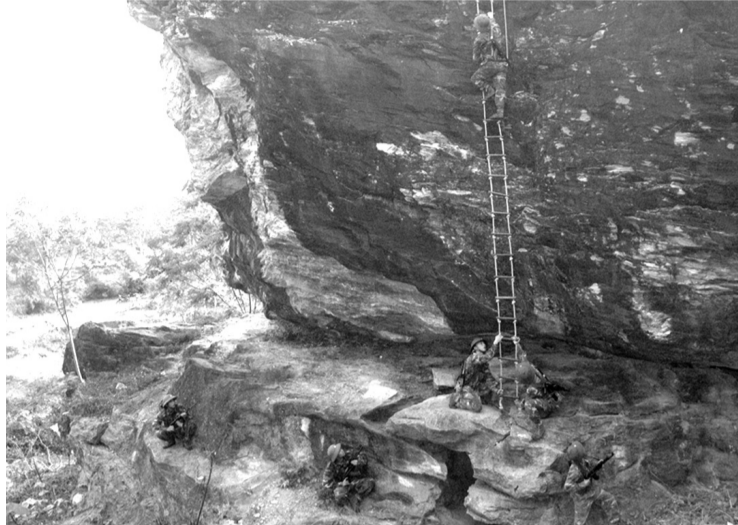
● Huấn luyện để mục “Trung đội bộ binh tập kích địch ở địa hình núi đá” tại Trung đoàn 335, SĐ 324.

Những năm qua, Sư đoàn (SĐ) 324, Quân khu (QK) 4, đơn vị 2 lần được Nhà nước phong tặng danh hiệu Anh hùng lực lượng vũ trang nhân dân luôn hoàn thành tốt nhiệm vụ huấn luyện, diễn tập, sẵn sàng chiến đấu (SSCĐ); xây dựng doanh trại chính quy, quản lý kỷ luật; công tác bảo đảm hậu cần, kỹ thuật đáp ứng kịp thời yêu cầu nhiệm vụ, đời sống cán bộ, chiến sĩ (CBCS) không ngừng được nâng lên; góp phần xây dựng Đảng bộ SĐ hoàn thành xuất sắc nhiệm vụ, SĐ vững mạnh toàn diện “mẫu mực, tiêu biểu”; nhiều năm SĐ được tặng Cờ thi đua của Chính phủ, Bộ Quốc phòng.