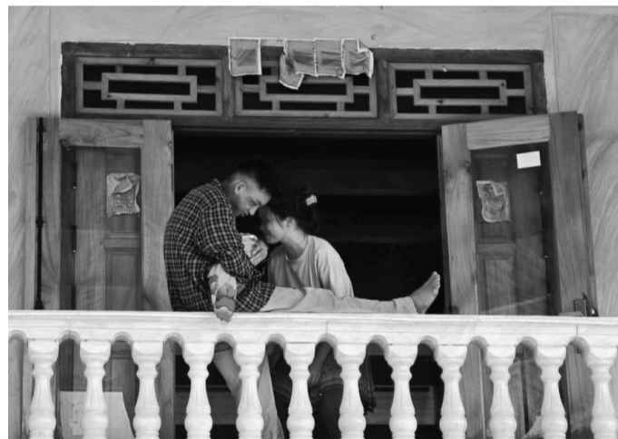
● Khoảnh khắc đẹp tại Nhà lưu trú xã tại Bắc Hà.