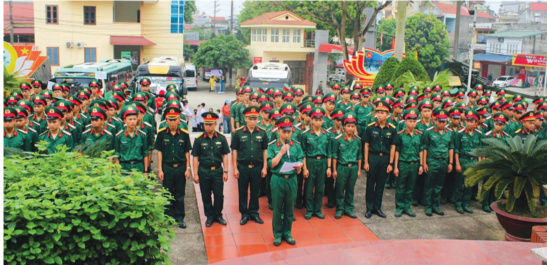
● Lễ báo công trước tượng đài Chủ tịch Hồ Chí Minh.

Vào một chiều mùa thu, trên con đường Hoàng Văn Thụ, TP Thái Nguyên đổ rợp cờ hoa, băng rôn, khẩu hiệu chào mừng 79 năm Cách mạng Tháng 8 và Quốc khánh 2/9, chúng tôi về thăm lại Bảo tàng Lực lượng vũ trang Việt Bắc (LLVT) Quân khu 1, nơi lưu giữ những giá trị lịch sử cách mạng của quân và dân 6 tỉnh Cao Bằng, Bắc Kạn, Lạng Sơn, Bắc Ninh, Bắc Giang, Thái Nguyên.