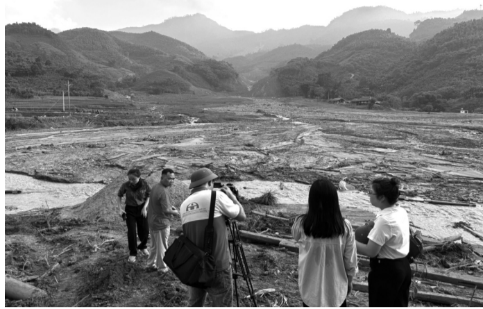
● Nghẹn lòng chiều Làng Nủ

Đã một tuần qua đi mà cảnh tượng vẫn tang thương và âm ảm. Chúng kiến cảnh những