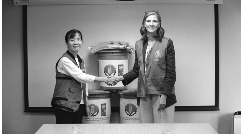
● UNDP góp sức giúp miền Bắc Việt Nam phục hồi sau bão. (Ảnh: UNDP)