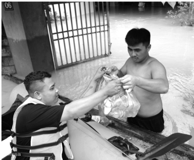
● Một thành viên đoàn thiện nguyện trao thực phẩm cho người dân Thái Nguyên trong cơn lũ.

Có thể khẳng định, việc người dân cả nước chung tay hỗ trợ đồng bào bị thiên tai là việc cần làm, nên làm, là nghĩa cử cao đẹp đáng trân trọng, nhưng quan trọng nhất là cần phải thực hiện một cách có kế hoạch và tổ chức để bảo đảm rằng mọi sự đóng góp đều được đến đúng nơi, giúp đúng người. Chỉ khi đó, hoạt động từ thiện mới thực sự đạt được hiệu quả như mong đợi. TRẦN TRẦN