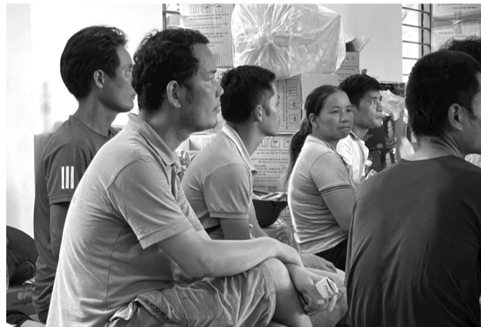
● Những gương mặt chờ đợi tìm người thân Làng Nủ.