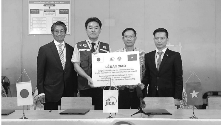
● Hàng viện trợ được chuyển từ kho của JICA về tới sân bay quốc tế Nội Bài tối 14/9.