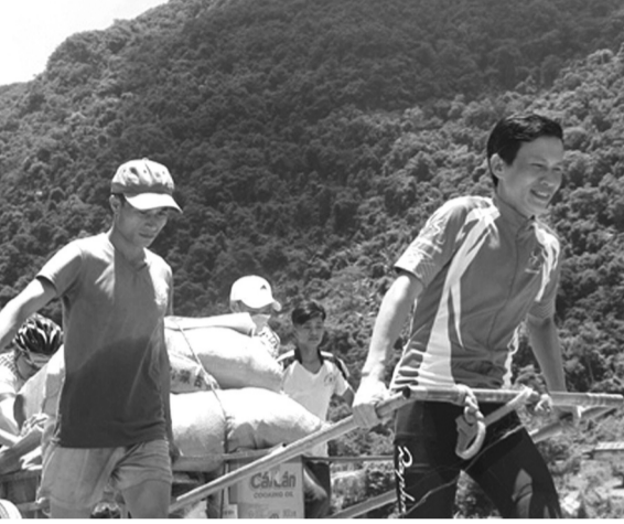
Những con người ở mọi miền của đất nước xích lại gần nhau.