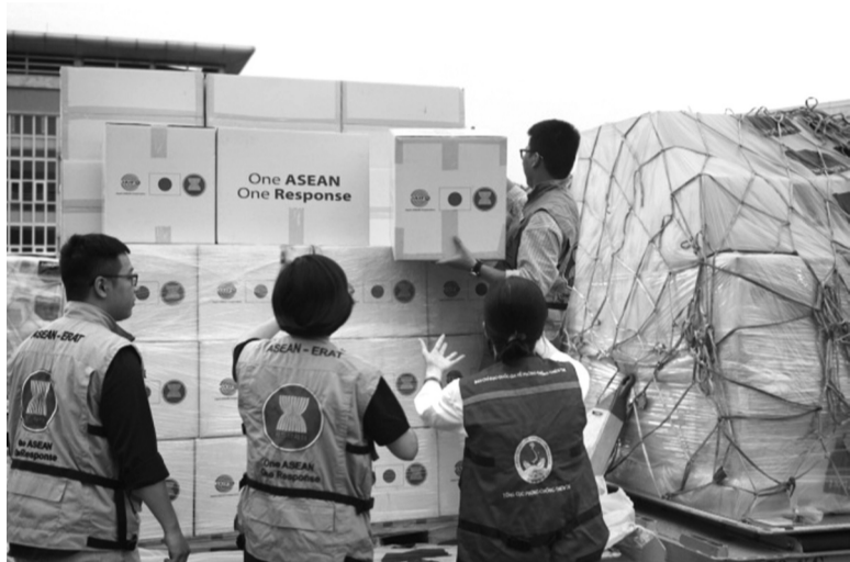
● Đồ viện trợ của Trung tâm AHA tới sân bay Nội Bài ngày 13/9.