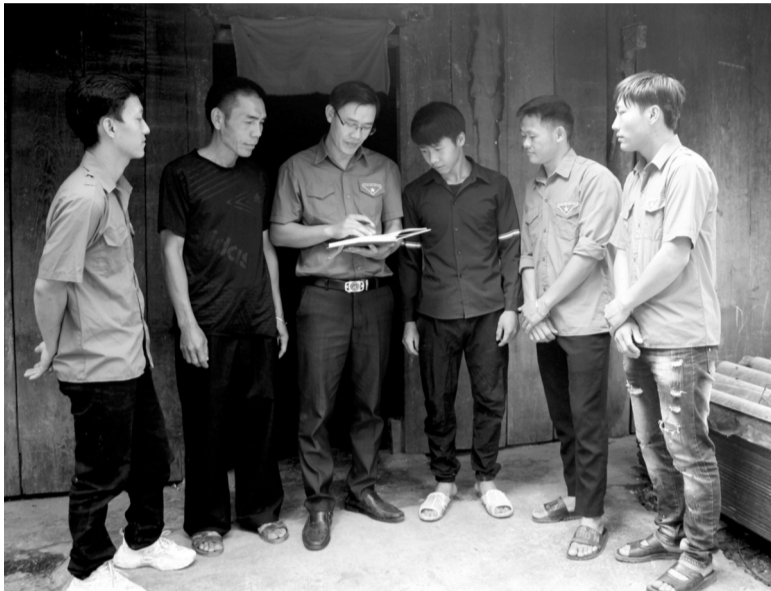
● Đoàn viên, thanh niên xã Cán Tỷ tuyên truyền người dân xóa bỏ hủ tục.

Để có thể xóa bỏ, giảm thiểu các tập tục văn hóa có hại, cần sự chung tay của nhiều cơ quan, ban ngành, tổ chức chính trị, các thành phần trong xã hội. Trong đó, đoàn viên, thanh niên là lực lượng xung kích trong các hoạt động tuyên truyền, vận động nhân dân trên địa bàn.