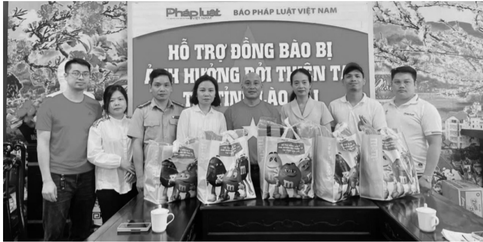
● Đại diện Báo Pháp luật Việt Nam đã bàn giao 380 suất quà, trong đó có 42 suất quà được trao trực tiếp cho người dân xã Thái Giàng Phố.