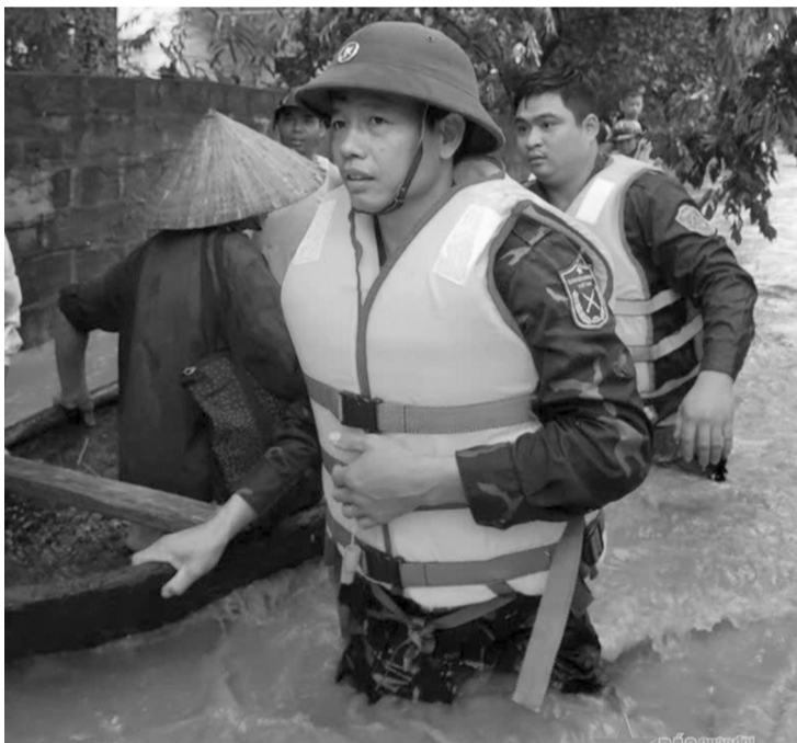
● Lực lượng vũ trang tỉnh Phú Thọ giúp nhân dân khắc phục hậu quả cơn bão số 3.