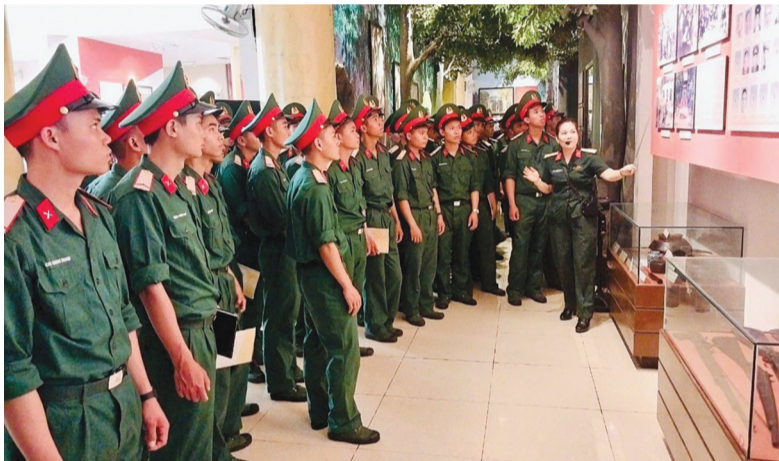
● Hướng dẫn viên Bảo tàng đón tiếp, thuyết minh cho chiến sĩ mới nhập ngũ.