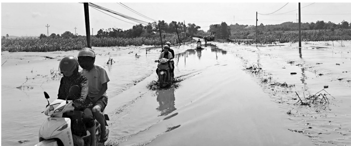
● Những con đường trắng băng nước, ngập úng hoa màu.