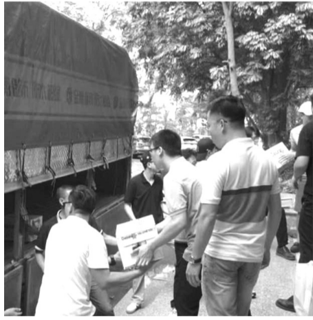
● Những chuyến xe của đoàn công tác đặc biệt Báo PLVN đến với đồng bào miền núi phía Bắc hậu bão số 3

quyết tâm di dời hơn 4.100 hộ gần bờ sông, suối và núi cao. Nếu không di dời thì sạt lở rất nghiêm trọng, do đó chúng tôi kiên quyết, cương chế di dời để bảo vệ người dân... Chúng tôi cảm ơn tất cả những sự quan tâm, giúp đỡ của các cá nhân, tổ chức trên cả nước đối với huyện Trấn Yên" - ông Tuấn nói.