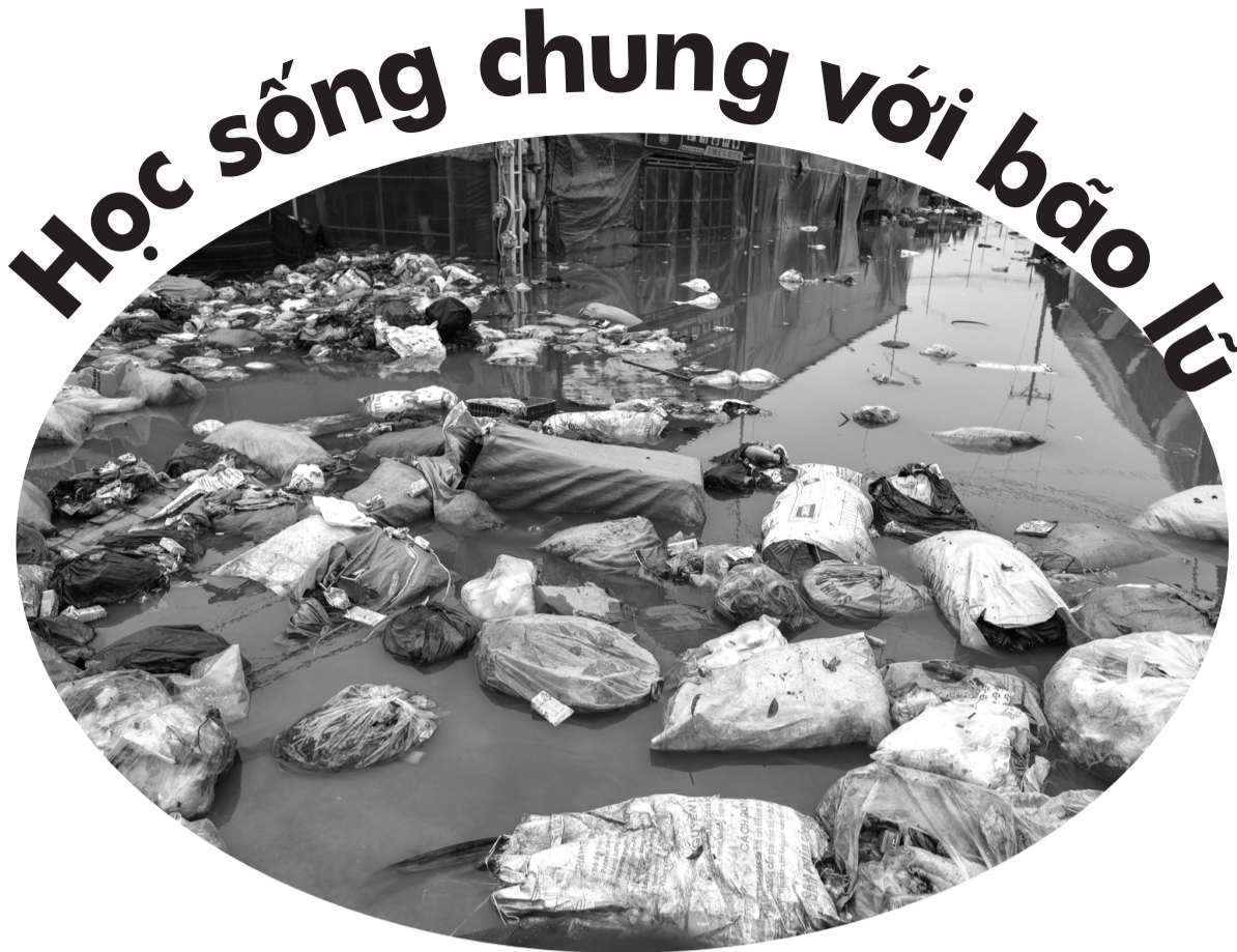
● Lũ lụt mang theo rác, chất thải,... cùng với ô nhiễm môi trường, làm tăng nguy cơ bùng phát dịch bệnh.

(Ảnh chụp Hà Nội ngày 12/9/2024)