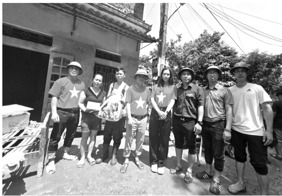
● Những túi quà được trao tận tay bà con vùng "rốn lũ" Trấn Yên (Yên Bái).