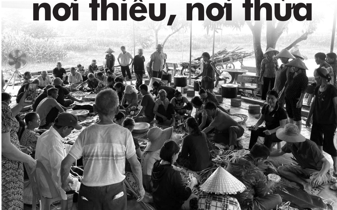
● Người dân xứ Nghệ cùng nhau gói bánh chưng gửi cho Nhân dân miền Bắc chịu ảnh hưởng thiên tai.

Sau những thảm kịch của thiên tai là lúc tinh thần “tương thân, tương ái” của Nhân dân cả nước tỏa rạng qua những hoạt động quyên góp, hỗ trợ các vùng bị ảnh hưởng. Sự đóng góp ấy không chỉ mang ý nghĩa “cứu nguy”, mà còn đem lại hy vọng và động viên cho những người đang gặp khó khăn. Tuy nhiên, việc thực hiện cứu trợ nếu không có kế hoạch và tổ chức tốt, có thể dẫn đến lãng phí và không đạt được hiệu quả như mong đợi.