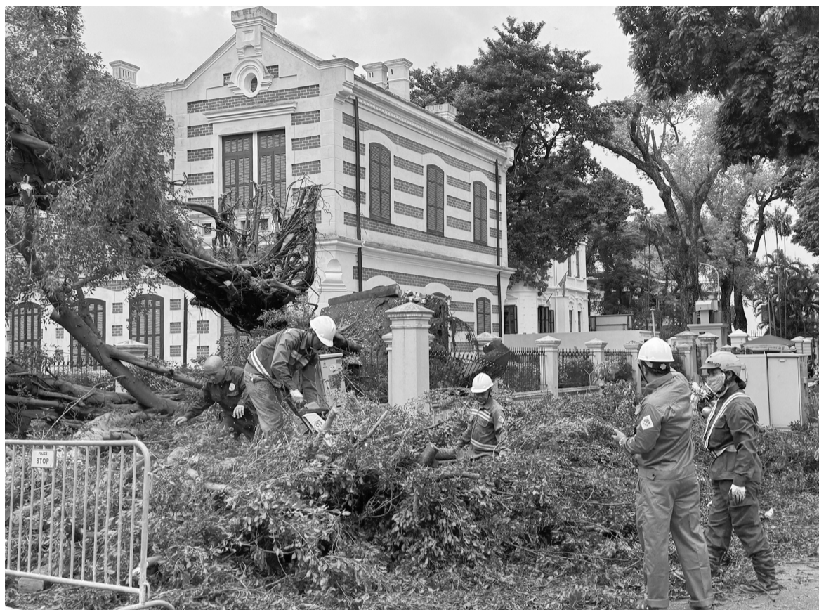
● Con bão số 3 là “tiếng chuông cảnh tỉnh” cho ứng xử của con người với thiên nhiên.

Cơn bão Yagi vừa qua đã minh chứng cho một sự thật rằng, nếu con người quay lưng, đối xử tàn tệ với thiên nhiên, thì sẽ phải gánh chịu những hậu quả khôn lường.