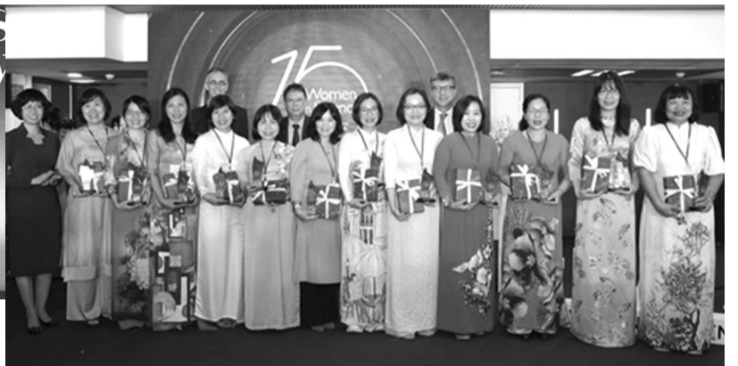
● Trao Kỷ niệm chương và quà cho các nhà khoa học nữ xuất sắc.