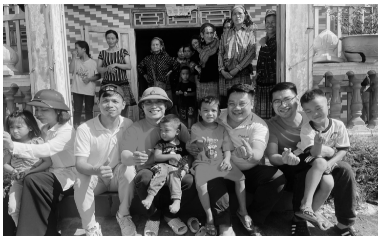
● Cùng các bé ở Nhà lưu trú xã Thái Giàng Phố.