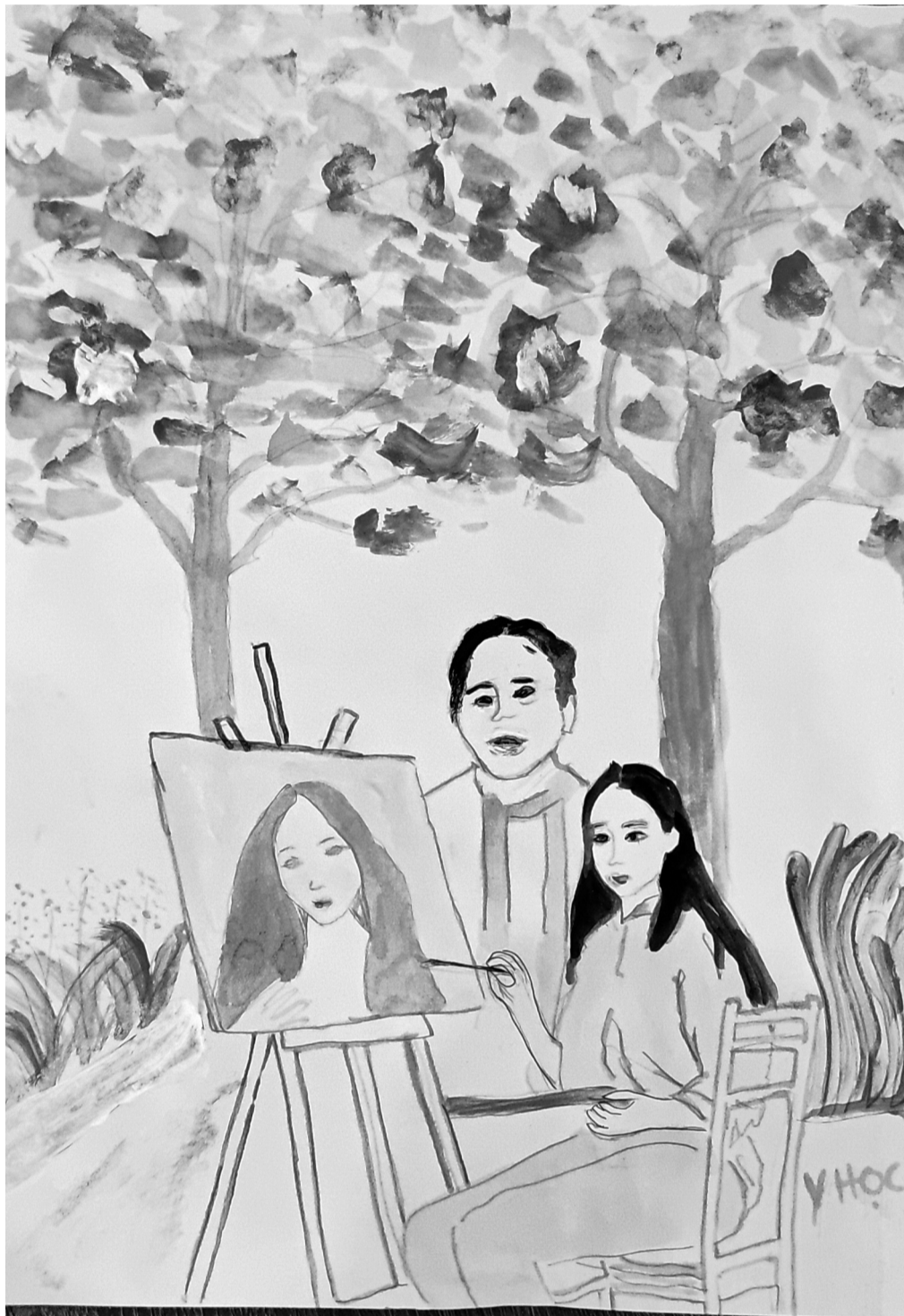
● Tranh minh họa của Văn Học

Nghệ tiếng, tôi biết ông Đức đến tìm bố, nên hờ hững bảo “họa sĩ ở trong phòng”. Tôi phụng phịu quay lại bức tranh đang vẽ dở. Cây khế lúc liu quả và hoa với lịch chích tiếng chim kêu chẳng làm tôi tỉnh tâm được, có lẽ vì thế các bức vẽ chẳng bao giờ ra hồn. Chiều qua bố trúng gió nên có hơi sốt, tôi chỉ mua thuốc rồi đặt lên bàn mà không nói gì. Suốt bao năm qua tôi cứ tự đẩy bố xa khỏi mình.