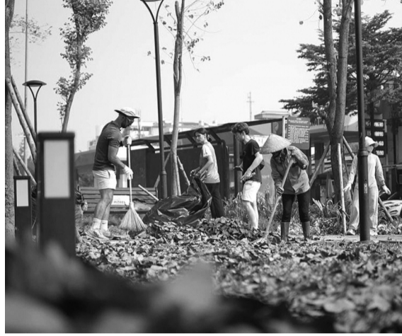
Những du khách nước ngoài luôn xông xáo, nhiệt tình trong việc dọn dẹp đường phố.

Thay vì vui chơi thỏa thích, nghỉ dưỡng ở những khu du lịch sang trọng, tiện nghi, nhiều du khách chọn cách đi du lịch kết hợp làm từ thiện. Đây là cơ hội để du khách vừa chia sẻ khó khăn với những phận đời kém may mắn, vừa có những trải nghiệm thú vị. Nét đẹp, sự nhân văn từ cách làm “hai trong một” này ngày càng được nhiều du khách hưởng ứng.