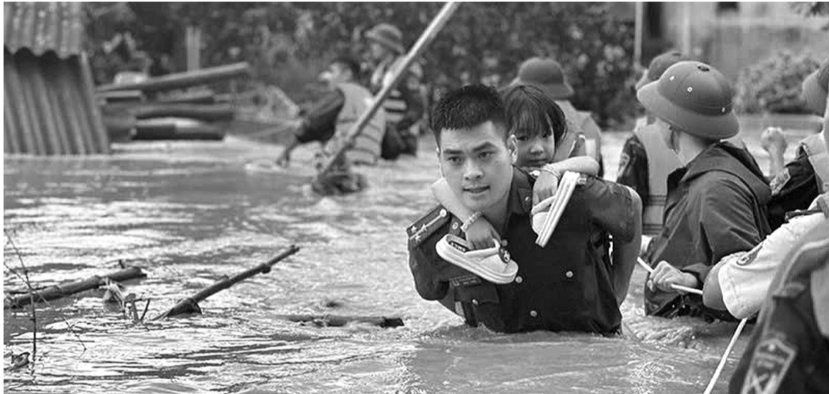
● Hàng nghìn lượt cán bộ, chiến sĩ quân đội, công an, đoàn viên, thanh niên xông pha giúp dân trong lũ lớn.

Sau trận lũ quét do bão Yagi gây ra, toàn bộ hệ thống chính trị từ trung ương đến địa phương đã khẩn trương vào cuộc nhằm khắc phục hậu quả. Sự chỉ đạo mạnh mẽ từ Chính phủ và các cấp lãnh đạo, tinh thần đồng thuận giữa chính quyền địa phương và các lực lượng cứu trợ đều hướng đến mục tiêu quan trọng: Ổn định cuộc sống Nhân dân.