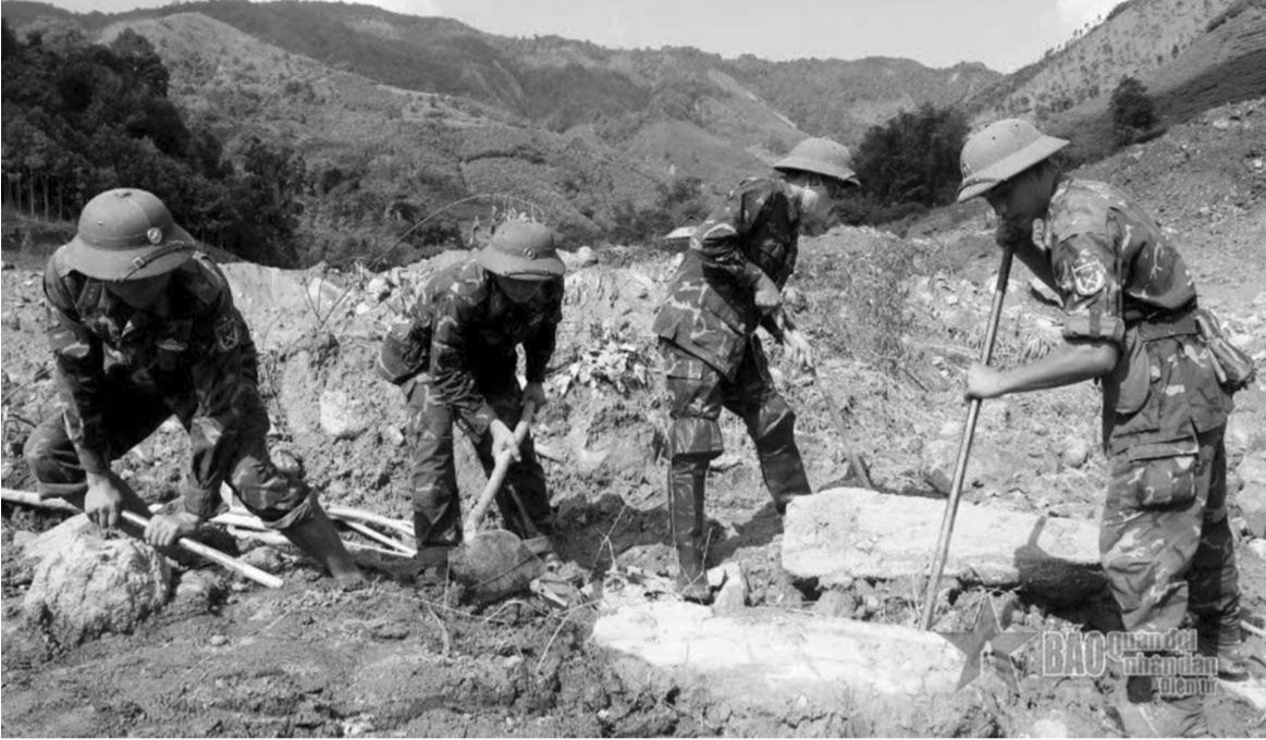
● Chiến sĩ Tiểu đoàn 1, Trung đoàn 254, Bộ CHQS tỉnh Lào Cai lật từng tảng đá tìm kiếm người mất tích ở xóm Bàn Cối, thôn Nậm Tông, xã Nậm Lức, huyện Bắc Hà (Lào Cai).