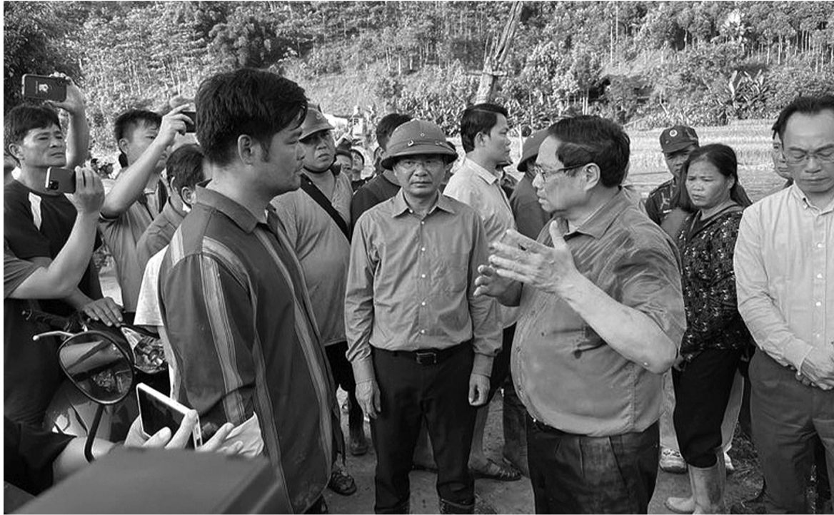
● Thủ tướng Phạm Minh Chính trực tiếp đến thôn Làng Nủ để động viên thăm hỏi sau vụ lũ quét tang thương.