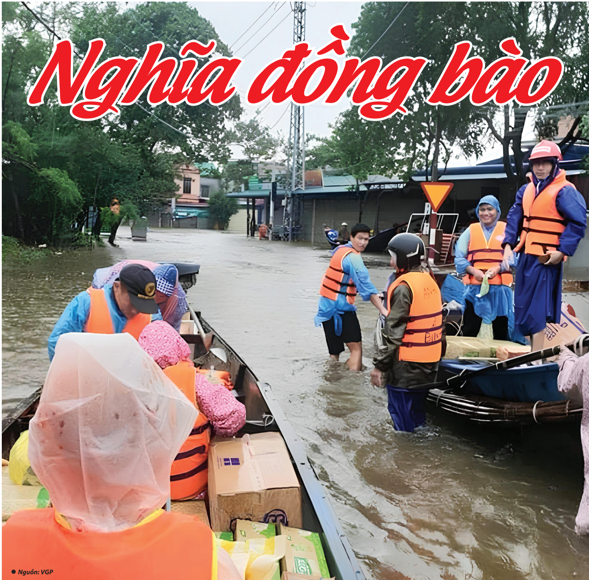
● Nguồn: VGP