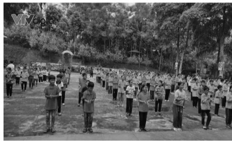
● HS khu trường Làng Nủ đã đi học trở lại từ ngày 16.9.