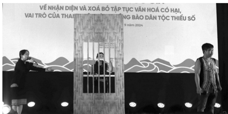
● Một tiểu phẩm tuyên truyền xóa bỏ tập tục văn hóa lạc hậu tại Diễn đàn.