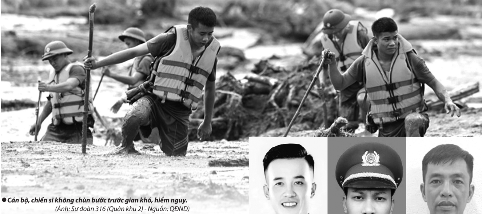
● Cán bộ, chiến sĩ không chùn bước trước gian khó, hiểm nguy.

Trong những khó khăn do thiên tai và bão lũ của bão số 3, tình quân dân lại một lần nữa tỏa sáng, thể hiện phẩm chất “Bộ đội Cụ Hồ” của Quân đội nhân dân, Công an nhân dân. Để có thể bảo vệ an toàn cho người dân, cán bộ, chiến sĩ thời bình đã anh dũng hy sinh, ra đi với tinh thần “Vì nước quên thân, vì dân phục vụ”.