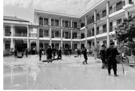
● Sân trường ngập bùn đất tại Trường THCS số 1 Phố Ràng (Lào Cai).