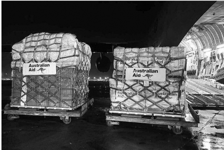
● Hàng viện trợ của Australia.

Trước những mất mát to lớn mà bão Yagi gây ra, cộng đồng quốc tế đã thể hiện tinh đoàn kết và sự quan tâm sâu sắc, đáng quý đối với Việt Nam. Không chỉ viện trợ, kinh nghiệm quốc tế về quản lý nguy cơ, giảm thiểu thiệt hại và hỗ trợ quá trình tái thiết sau thiên tai cũng rất quan trọng, giúp Việt Nam xây dựng các chiến lược dài hạn để ứng phó với biến đổi khí hậu, bảo đảm cuộc sống an toàn, bền vững cho người dân.