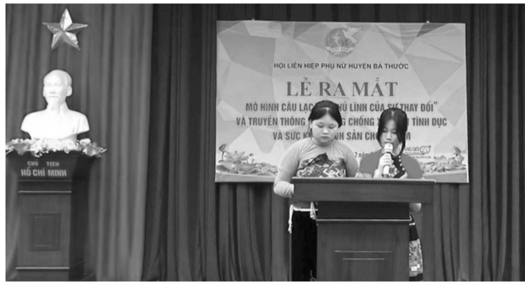
● Các học sinh tham gia CLB Thủ lĩnh của sự thay đổi trường THCS Lương Trung thuyết trình kiến thức về phòng chống xâm hại tình dục.

Tương tự, huyện Quang Bình, Hà Giang có 12 dân tộc cùng chung sống hài hòa, trong đó dân tộc thiểu số chiếm trên 90%. Mỗi dân tộc đều có những tín ngưỡng, tập quán riêng biệt. Tuy nhiên, trong đời sống nhân dân vẫn còn tồn tại một số hủ tục, như: làm đám hiếu dài ngày; mổ quá nhiều gia súc, gia cầm; tục thách cưới quá cao; uống rượu, bia quá nhiều; tảo hôn và hôn nhân cận huyết... ảnh hưởng nặng nề đến kinh tế gia đình. Trước thực trạng đó, với vai trò nòng cốt, xung kích, Huyện đoàn Quang Bình