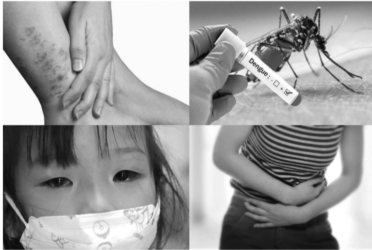
● Sau bão lũ, người dân thường phải đối mặt với nhiều loại dịch bệnh truyền nhiễm.

Trước sự tác động mạnh mẽ của bão lũ đến sức khỏe người dân, việc phối hợp chặt chẽ giữa các cơ quan chức năng và cộng đồng là yếu tố quyết định để triển khai hiệu quả các biện pháp ứng phó. Điều này sẽ giúp bảo vệ sức khỏe cộng đồng và giảm thiểu thiệt hại cho các khu vực bị thiên tai tấn công.