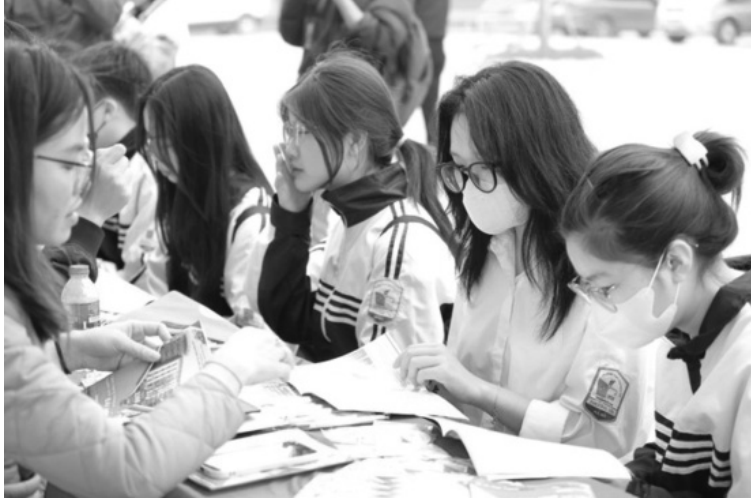
● Học sinh Hà Nội trong Ngày hội hướng nghiệp 2024.

Về tổ chức điểm thi, phòng thi sẽ được sắp xếp theo nguyên tắc hỗ trợ tối đa cho thí sinh không phải di chuyển phòng thi như cho phép trộn học sinh ở các cơ sở giáo dục gần nhau để tổ chức các điểm thi tiện ích cho thí sinh; thí sinh chỉ dự thi tại 1 phòng thi duy nhất trong suốt kỳ thi, ưu