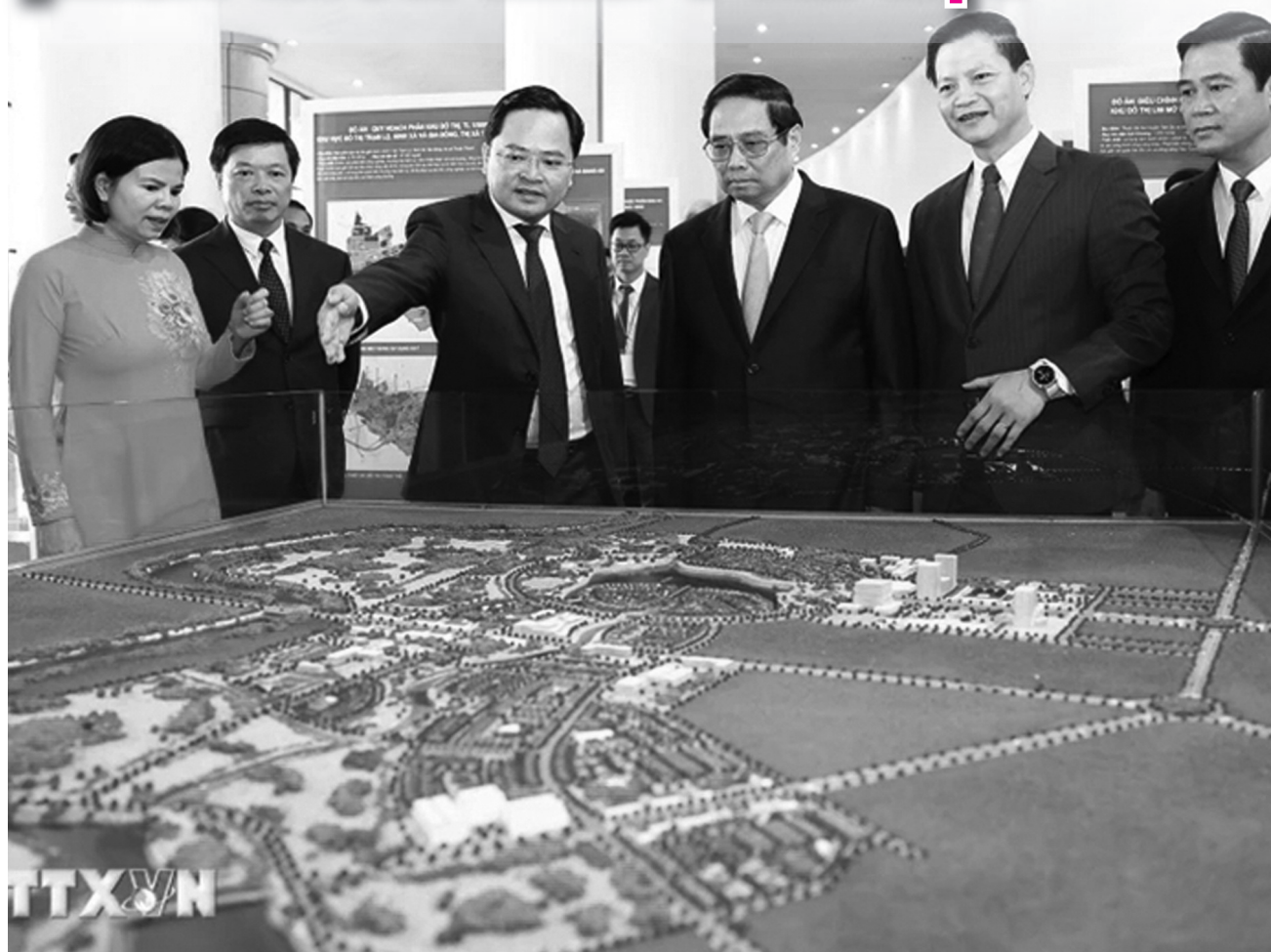
● Thủ tướng Phạm Minh Chính xem mô hình quy hoạch tỉnh Bắc Ninh.

Chiều 22/9, dự Hội nghị công bố quy hoạch và xúc tiến đầu tư tỉnh Bắc Ninh năm 2024, với chủ đề "Bắc Ninh - Kinh Bắc, khởi sắc đầu tư", Thủ tướng Phạm Minh Chính mong muốn Đảng bộ, chính quyền, quân và dân, doanh nghiệp tỉnh Bắc Ninh nỗ lực, phấn đấu "khai phá tiềm năng, khẳng định chính mình, kiên định mục tiêu, kiến tạo thịnh vượng".