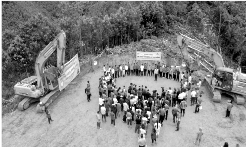
● Toàn cảnh khu vực khởi công xây dựng tái thiết thôn Kho Vàng.