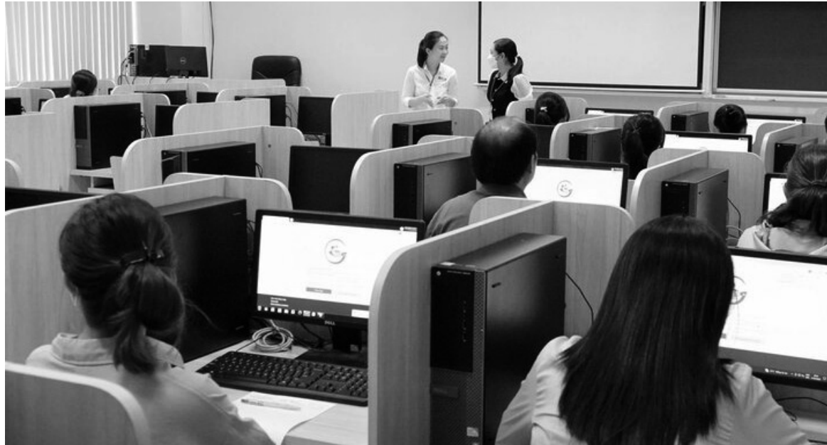
● Kỳ thi tuyển công chức năm 2023 của TP HCM.

Vòng 1: Thi trắc nghiệm trên máy vi tính; nội dung thi gồm 2 phần: Phần I là thi kiến thức chung. Có 60 câu hỏi hiểu biết chung về hệ thống chính trị, tổ chức bộ máy của Đảng, Nhà nước, các tổ chức chính trị - xã