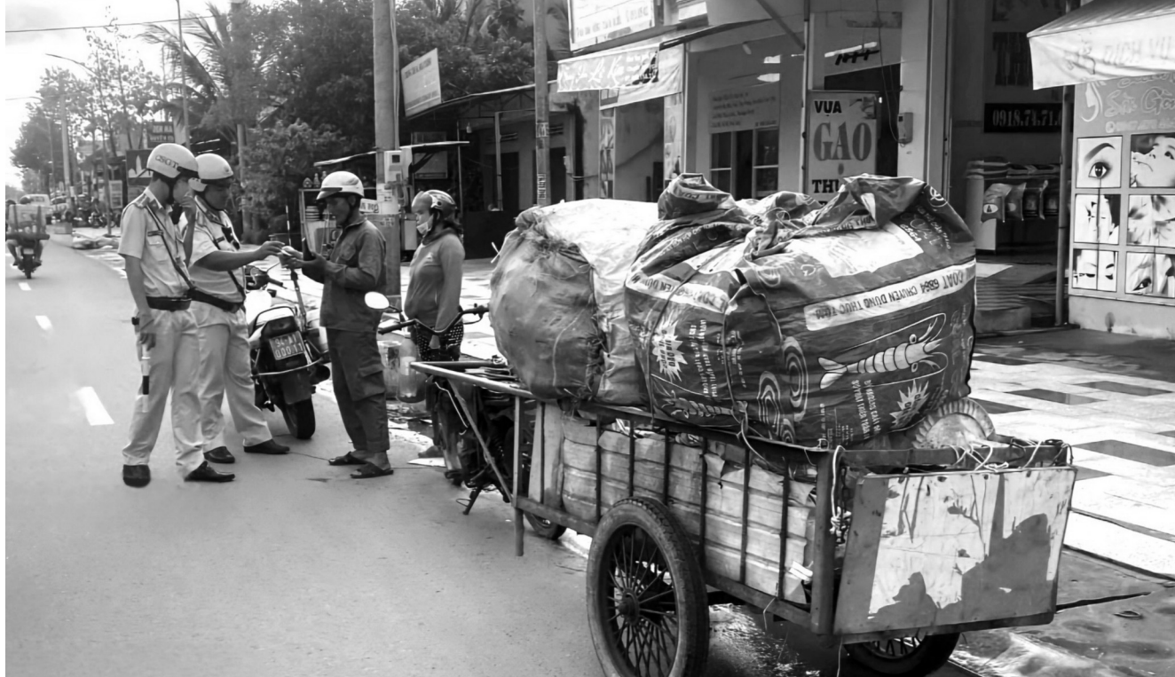
● CSGT Bạc Liêu tuần tra, kiểm soát, xử lý xe kéo.

Công an Bạc Liêu vừa ban hành Kế hoạch về kiểm tra, xử lý chuyên đề xe ba, bốn bánh tự sản xuất, lắp ráp và xe mô tô, xe gắn máy kéo theo xe khác, vật khác vi phạm trật tự, an toàn giao thông (TTATGT). Qua đó, góp phần phòng ngừa, kiểm chế các vụ tai nạn giao thông (TN&MT).