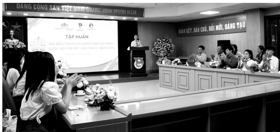
● Ngày 17/8, Hội đồng Đội Trung ương tổ chức tập huấn đại biểu tham gia phiên họp giả định “Quốc hội trẻ em” lần thứ II - năm 2024 theo hình thức trực tiếp kết hợp trực tuyến.

Ngày 30/7, Hội đồng Trẻ em tỉnh Bến Tre đã tổ chức kỳ họp Hội đồng Trẻ em