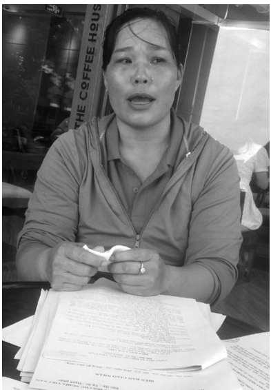
● Bà Trang cho rằng mình bị oan, không thuê mướn hay cung cấp bình xịt hơi cay để người khác đi đánh ghen.

Chăng. Tại tòa, bị cáo Chăng cũng khai tự chuẩn bị đồ (hung khí gây án) và bình xịt hơi cay.