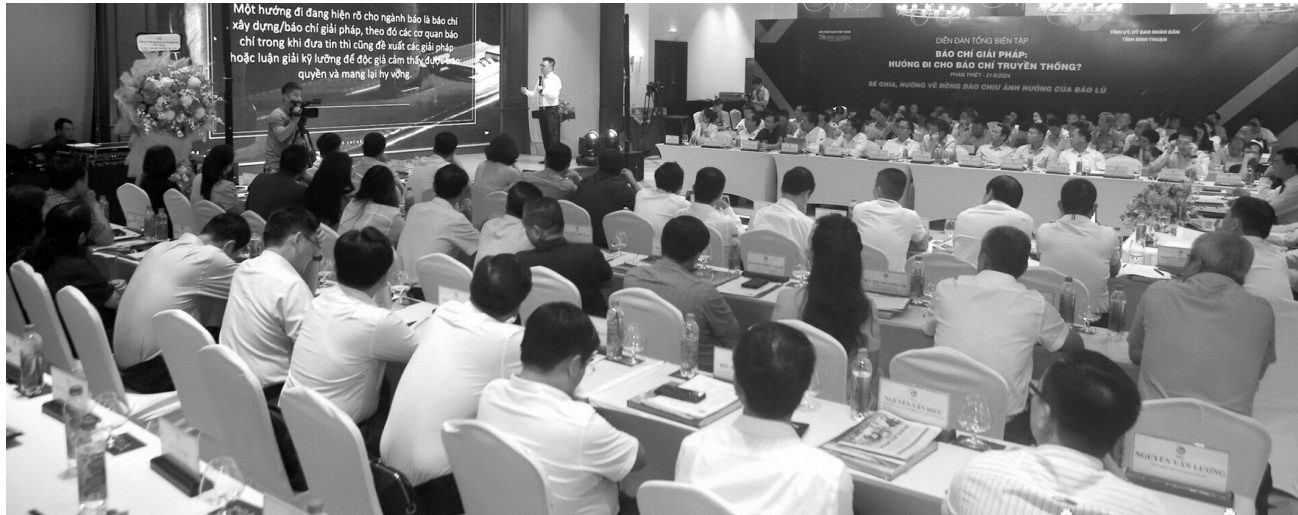
● Quang cảnh Diễn đàn. (Ảnh: Congluan)

Báo chí giải pháp, báo chí kiến tạo khác báo chí truyền thống như thế nào? Các cơ quan báo chí cần phải làm gì để nâng cao vai trò, phát huy thế mạnh, góp phần xây dựng nền Báo chí Cách mạng Việt Nam ngày càng hiện đại, chuyên nghiệp, nhân văn? Đây là những vấn đề được đặt ra tại Diễn đàn Tổng Biên tập 2024: “Báo chí giải pháp - Hướng đi cho báo chí truyền thống?” (Diễn đàn), diễn ra cuối tuần qua.