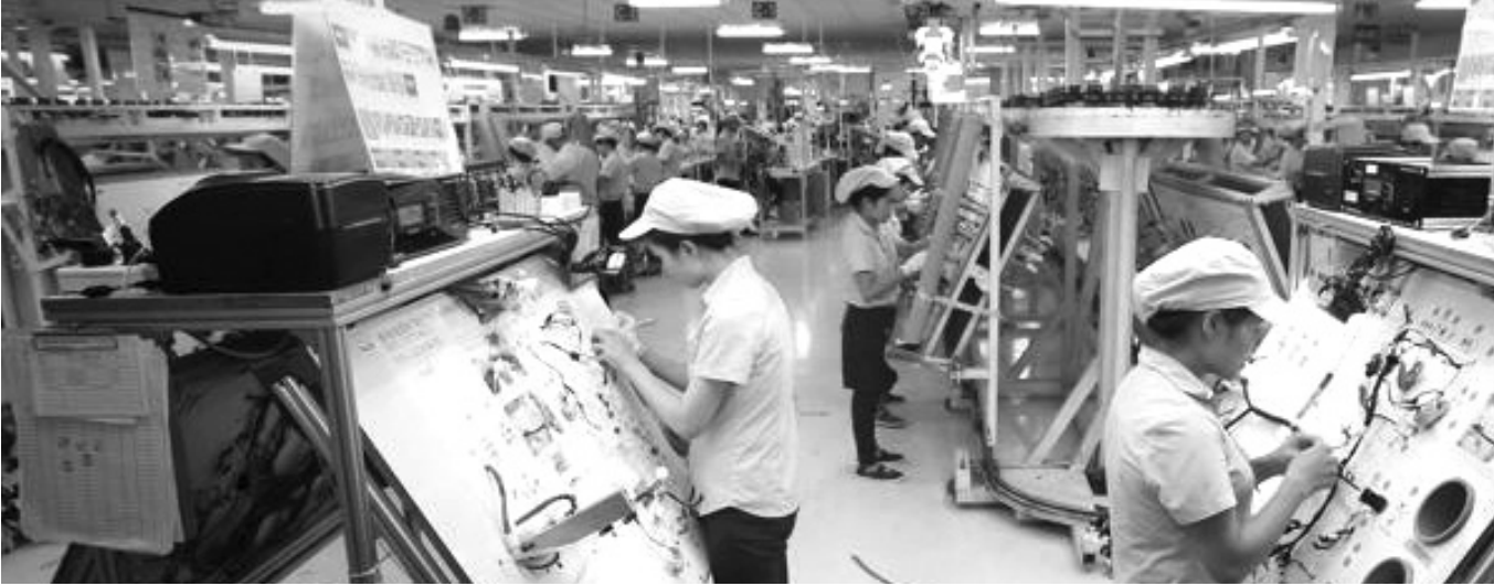
● Cán tạo môi trường kinh doanh bình đẳng cho doanh nghiệp.