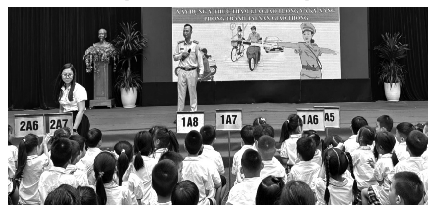
● CSGT tuyên truyền kiến thức ATGT tới học sinh.

Tại chương trình, Đội CSGT số 4 đã tuyên truyền, hướng dẫn học sinh về một số quy định cơ bản khi tham gia giao thông đường bộ như: Cách nhận diện tín hiệu đèn giao thông, biển báo giao thông, cách xử lý tình huống thường gặp khi tham gia giao thông... Buổi tuyên truyền đã cung cấp cho các em học sinh nhiều kiến thức bổ ích về ATGT,