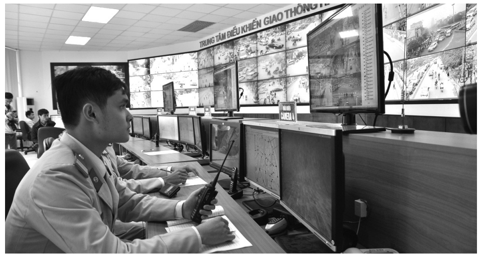
● Trung tâm điều khiển giao thông Hà Nội. (Ảnh: Văn Sơn)

Theo thống kê, trong 9 tháng đầu năm 2024, thông qua hệ thống camera giám sát giao thông (GSGT), cơ quan chức năng Hà Nội đã phát hiện và xử lý hơn 5.600 trường hợp vi phạm.