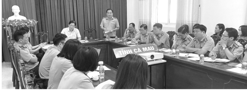
● Buổi kiểm tra chuyên đề của Tổng cục THADS tại Cục THADS tỉnh Cà Mau.

Thời gian tổ chức thi hành án một số vụ việc trên địa bàn tỉnh Cà Mau còn kéo dài, chưa thể thi hành dứt điểm do các cơ quan thi hành án dân sự (THADS) gặp phải nhiều khó khăn, vướng mắc trong kê biên, xử lý tài sản, đặc biệt là trong các vụ án tín dụng, ngân hàng, án tham nhũng, kinh tế.