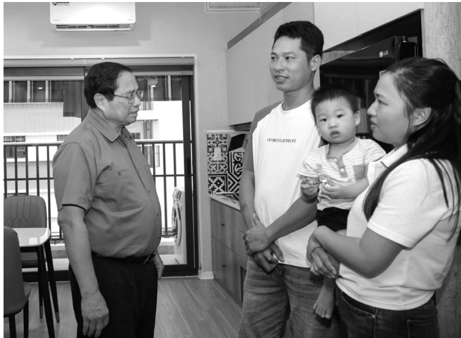
● Thủ tướng thăm hỏi gia đình sống trong khu nhà ở xã hội Thống Nhất tại phường Võ Cường, thành phố Bắc Ninh.

Cùng với đó, Bắc Ninh phải thực hiện tốt 3 nhiệm vụ trọng tâm; 6 khâu đột phá chiến lược đã được xác định. Trong đó, nghiên cứu, đề xuất, triển khai thí điểm một số cơ chế, chính sách mới có tính đột phá, đặc thù; tiếp tục đẩy mạnh phát triển đầu tư hạ tầng chiến