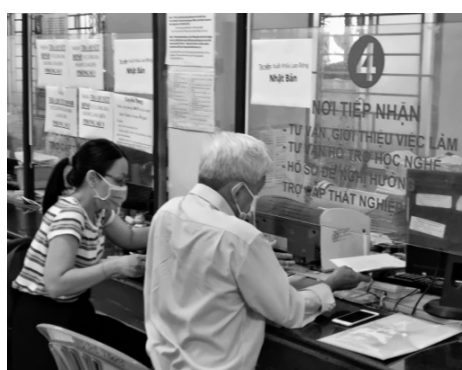
● Trợ cấp thất nghiệp giúp người lao động giảm bớt khó khăn, ổn định cuộc sống trong thời gian chưa tìm được việc làm mới.

Tổng kết Luật Việc làm 2013, Bộ LĐ-TB&XH cho biết, sau hơn 7 năm thực hiện Luật Việc làm, số người tham gia bảo hiểm thất nghiệp (BHTN) tăng qua các năm, bình quân hàng năm tăng 14,3%. Tính đến cuối năm 2022, có 14,3 triệu NLD tham gia BHTN, chiếm 31,18% lực lượng lao động trong độ tuổi. Tuy nhiên, thời gian gần đây, một số vụ việc vi phạm trong lĩnh vực đã được phát hiện ở nhiều địa phương. Cơ quan BHXH đã cảnh báo về 4 hình thức lạm dụng, trực lợi các quỹ bảo hiểm, trong số đó có BHTN. Theo cơ quan BHXH, để người lao động có việc làm (ký hợp đồng lao động chính thức) trong thời gian đang hưởng trợ cấp thất nghiệp nhưng không khai báo với trung tâm dịch vụ việc làm. Sau khi hết thời gian hưởng trợ cấp thất nghiệp, lập hồ