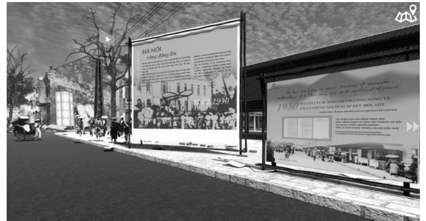
● Không gian "Hà Nội vùng đứng lên" trong triển lãm 3D trực tuyến "Hồi đồng bào Thủ đô!".

Hướng đến kỷ niệm 70 năm Ngày Giải phóng Thủ đô (10/10/1954 - 10/10/2024), UBND quận Hoàn Kiếm phối hợp với Trung tâm Lưu trữ Quốc gia I tổ chức triển lãm 3D trực tuyến "Hồi đồng bào Thủ đô!".