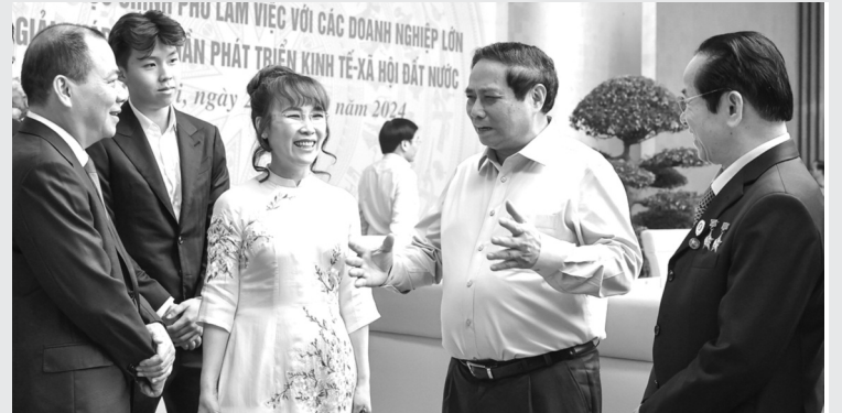
● Thủ tướng Phạm Minh Chính trao đổi với đại diện các doanh nghiệp.