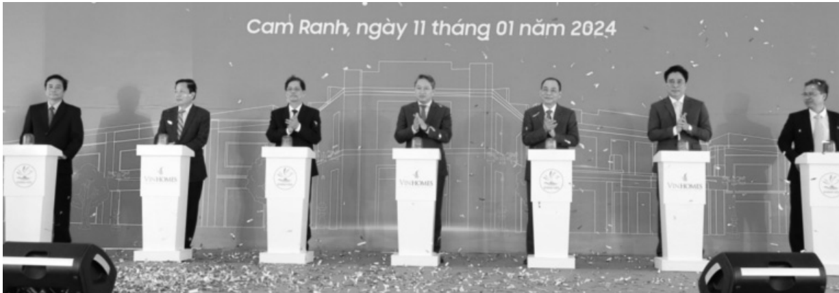
● Tập đoàn VinGroup khởi công dự án Nhà ở xã hội Happy Home tại phường Cam Nghĩa, TP Cam Ranh, Khánh Hòa.