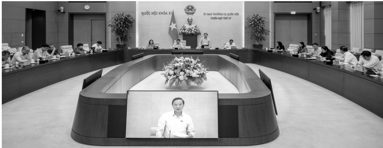
● Phiên họp ngày 26/9 cho ý kiến về báo cáo về tình hình tiếp công dân và giải quyết khiếu nại, tố cáo hành chính.