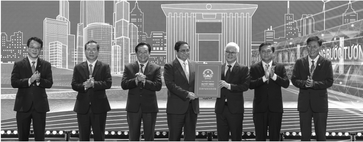
● Thủ tướng trao Quyết định Quy hoạch cho tỉnh Bình Dương.

Sáng 26/9, dự Hội nghị công bố Quy hoạch tỉnh Bình Dương thời kỳ 2021 - 2030, tầm nhìn đến năm 2050, Thủ tướng Phạm Minh Chính đề nghị tỉnh Bình Dương thực hiện 3 “tiên phong” bao gồm kết nối nền kinh tế với vùng, quốc gia, khu vực và quốc tế; số hóa, xanh hóa kinh tế để phát triển nhanh, bền vững và xây dựng các khu công nghiệp thế hệ mới.