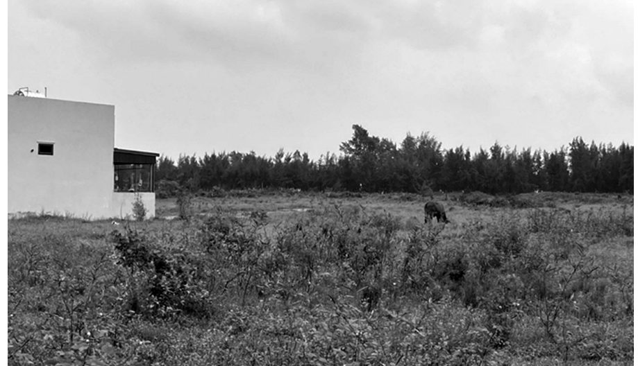
● Một góc dự án đô thị du lịch sinh thái biển Tiên Trang.