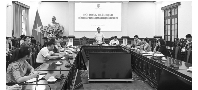
● Thủ tướng Trần Tiến Dũng phát biểu tại phiên họp thẩm định đề nghị xây dựng Luật Năng lượng nguyên tử (sửa đổi) vào ngày 26/9.

Phát biểu tại cuộc họp, đại diện Bộ Khoa học và Công nghệ cho biết, qua 15 năm thi hành, Luật Năng lượng nguyên tử năm 2008 đã phát huy vai trò to lớn trong thúc đẩy ứng dụng năng lượng nguyên tử vì mục đích hoà bình và tăng cường công tác quản lý nhà nước đối với các hoạt động đó. Hành lang pháp lý về năng lượng nguyên tử ngày càng được hoàn thiện.