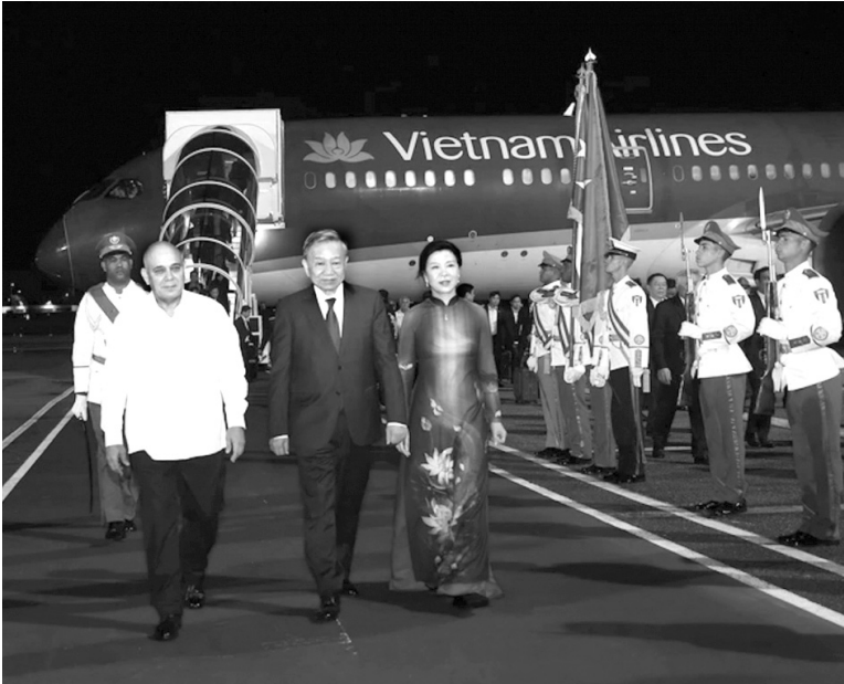
● Ủy viên Bộ Chính trị, Thường trực Ban Bí thư Đảng Cộng sản Cuba Roberto Morales Ojeda đón Tổng Bí thư, Chủ tịch nước Tô Lâm và Phu nhân tại sân bay quốc tế José Martí, Thủ đô La Habana.

Tối 25/9 (theo giờ địa phương, sáng 26/9 giờ Hà Nội), Tổng Bí thư, Chủ tịch nước Tô Lâm và Phu nhân cùng Đoàn đại biểu cấp cao nước ta đã đến sân bay quốc tế José Martí ở Thủ đô La Habana, bắt đầu chuyến thăm cấp Nhà nước tới Cộng hòa Cuba theo lời mời của Bí thư Thứ nhất Ban Chấp hành Trung ương Đảng Cộng sản Cuba, Chủ tịch nước Cộng hòa Cuba Miguel Diaz Canel Bermudez và Phu nhân.