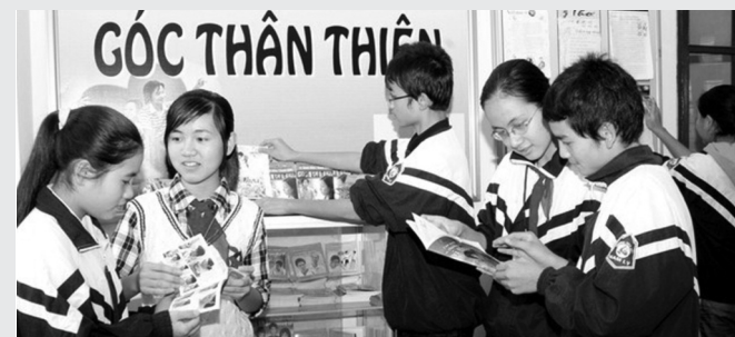
● Giới trẻ cần được truyền thông để hiểu và có trách nhiệm với sức khỏe sinh sản của chính mình. (Ảnh minh họa - Nguồn: SYTHà Tĩnh)

Bên cạnh việc khuyến khích các bạn trẻ nâng cao ý thức, hành động thông minh để bảo vệ sức khỏe sinh sản và tương lai của bản thân, Ngày Trách nhiệm Thế giới cũng hướng đến sự tự chủ của phụ nữ trong chăm sóc sức khỏe bản thân, đặc biệt là sức khỏe sinh sản. Thực tế, theo nghiên cứu “Đánh giá chất lượng dịch vụ kế hoạch hóa gia đình tại Việt Nam” do UNFPA thực hiện năm 2016, khoảng 17,4% phụ nữ cho biết họ đã từng phá thai trong cuộc đời của mình. Trong đó, lý do mang thai ngoài ý muốn chiếm hơn một nửa số ca phá thai (53,6%), lý do sử dụng biện pháp tránh thai nhưng thất bại chiếm 8,9% và lý do phá thai do lựa chọn giới tính thai nhi là 1,6%.