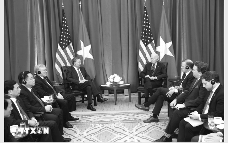
● Hai nhà Lãnh đạo nhất trí hai bên cân tiếp tục phối hợp chặt chẽ triển khai hiệu quả Tuyên bố chung Việt Nam - Hoa Kỳ năm 2023.

Theo tin từ Bộ Ngoại giao, trong khuôn khổ tham dự Hội nghị Thượng đỉnh Tương lai, Đại hội đồng Liên hợp quốc khóa 79, làm việc tại Hoa Kỳ, ngày 25/9 (theo giờ địa phương), Tổng Bí thư, Chủ tịch nước Tô Lâm đã có cuộc gặp với Tổng thống Hoa Kỳ Joe Biden.