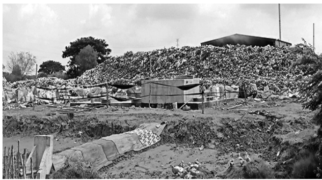
● Rác thải ứ tại bãi rác ở xã Lương Hòa của tỉnh Trà Vinh.