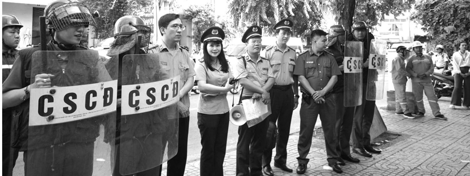
● Các lực lượng chức năng phối hợp thực hiện hoạt động cưỡng chế THADS tại TP Hồ Chí Minh.

Thường trực Ban Bí thư Lương Cường vừa thay mặt Bộ Chính trị ký ban hành Quy định số 183-QĐ/TW ngày 18/9/2024 về bảo vệ cơ quan, tổ chức, người thi hành công vụ trong hoạt động điều tra, truy tố, xét xử, thi hành án.