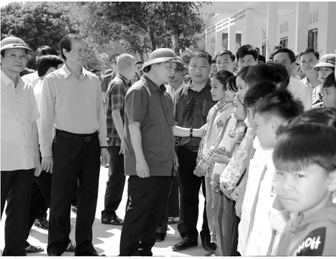
● Phó Thủ tướng Trần Hồng Hà thăm thấy và trò chuyện THCS Lâm Phú, xã Lâm Phú, huyện biên giới Lang Chánh.

Ngày 26/9, Phó Thủ tướng Chính phủ Trần Hồng Hà và Đoàn công tác đã kiểm tra việc khắc phục hậu quả mưa lũ, sạt lở đất từ đầu tháng 9/2024 đến nay tại một số huyện của tỉnh Thanh Hóa.