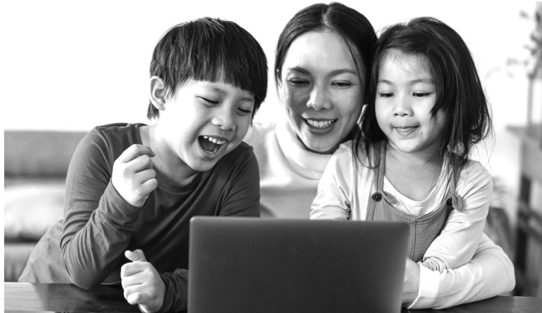
● Phụ huynh cần dành thời gian để cùng con khám phá thế giới giải trí trực tuyến. (Ảnh minh họa)

Theo các chuyên gia tâm lý, để bảo trẻ phải từ bỏ mạng xã hội là điều không thực tế với xu thế của đời sống ngày nay. Thay vào đó, phụ huynh cần phát huy vai trò định hướng, là “bộ lọc” cho con mình, đặc biệt với thực trạng các sản phẩm giải trí độc hại núp bóng “dành cho trẻ em” đang xuất hiện nhan nhản.