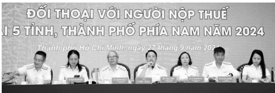
● Quang cảnh Hội nghị.

Ngày 27/09, Tổng cục Thuế tổ chức Hội nghị đối thoại với người nộp thuế (NNT) của 05 tỉnh, thành phố Khu vực kinh tế trọng điểm miền Đông Nam Bộ gồm: TP HCM, Long An, Bình Dương, Đồng Nai, Bà Rịa - Vũng Tàu.