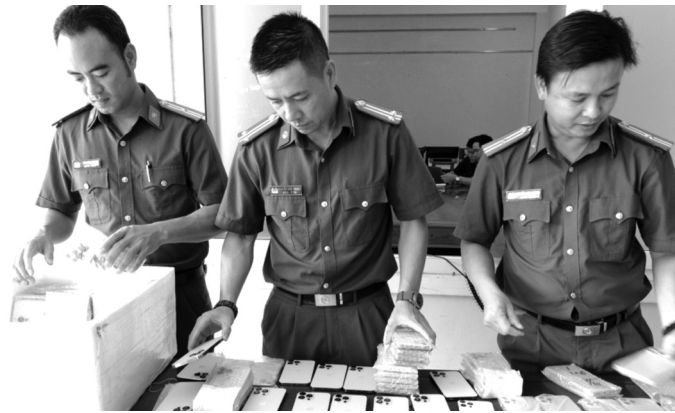
● Một phần tang vật vụ án.

Công an tỉnh Hà Tĩnh cho biết, Công an huyện Thạch Hà vừa khởi tố vụ án, khởi tố 7 bị can về hành vi "Buôn bán hàng giả" và "Làm giả, sử dụng tài liệu giả của cơ quan, tổ chức" tại Hà Tĩnh và TP HCM.