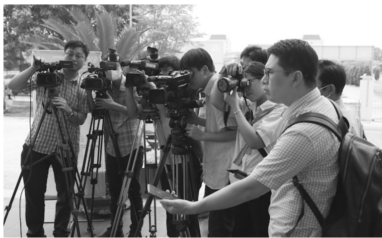
● Tiêu chuẩn xét thăng hạng chức danh nghề nghiệp phóng viên từ 7/11/2024. (Ảnh: Hồng Thương)

Bộ Thông tin và Truyền thông vừa ban hành Thông tư 12/2024/TT-BTTTT quy định tiêu chuẩn, điều kiện xét thăng hạng chức danh nghề nghiệp viên chức chuyên ngành Thông tin và Truyền thông, trong đó có quy định xét thăng hạng chức danh nghề nghiệp phóng viên.