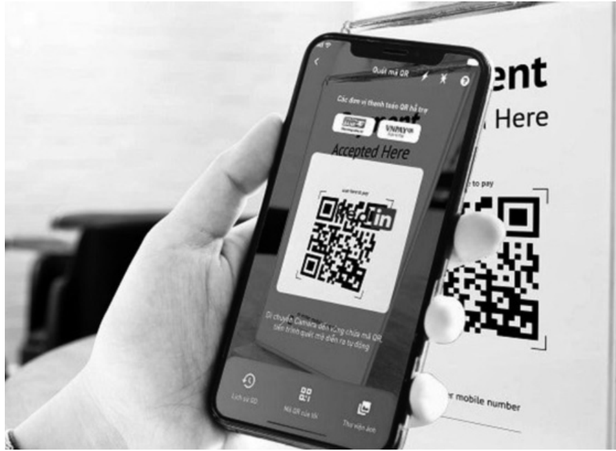
● Thanh toán không dùng tiền mặt đang ngày càng phổ biến.

Ở một số địa phương khó khăn về hạ tầng cũng như cơ sở vật chất, tỷ lệ TTKDTM cũng tăng lên theo mỗi tháng. Ví dụ, ở huyện Mường Tè (tỉnh Lai Châu - một trong những tỉnh được đánh giá là nghèo nhất Việt Nam) cũng đã triển khai hợp tác thanh toán điện tử qua các đối tác thanh toán trung gian, ưu tiên thanh toán tiền điện qua các kênh ngân hàng như Vietinbank, Agribank, LienViet Postbank... và các tổ chức trung gian: Viettel, Payoo, Vnpay, VNPTPay, Momo, Vimo, VN-