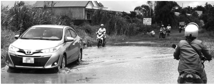
● Một cảnh trên đường liên huyện Đắc R'lấp - Tuy Đức đoạn tiếp giáp QL14.

Nhiều năm qua, người dân thôn 15 đã nhiều lần có ý kiến đề nghị xã, huyện đề xuất sửa chữa nâng cấp 2 tuyến đường trên nhưng đến nay vẫn chưa được giải quyết.