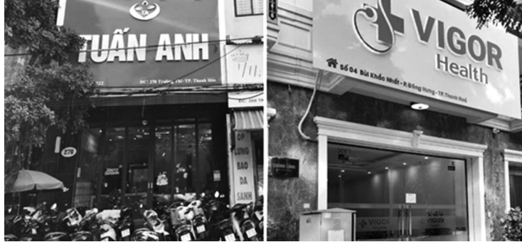
● Hai cơ sở có dấu hiệu vi phạm.

Báo PLVN nhận được phản ánh của bạn đọc về một số cơ sở điều trị nam khoa tại TP Thanh Hóa (tỉnh Thanh Hóa) có dấu hiệu vi phạm, hoạt động không đúng với quảng cáo.