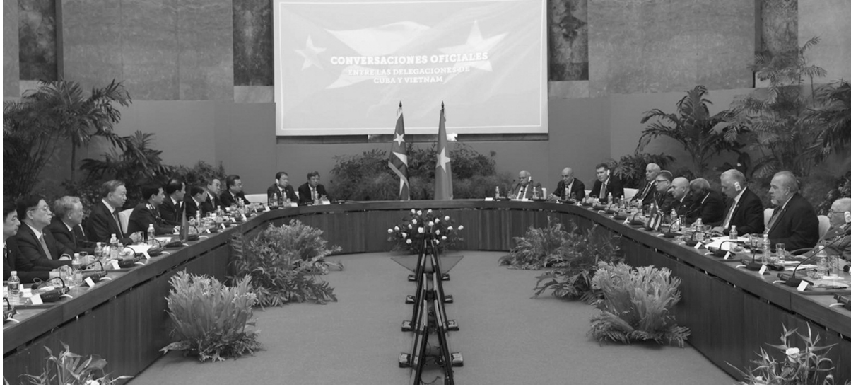
● Tổng Bí thư, Chủ tịch nước Tô Lâm hội đàm với Bí thư thứ nhất Đảng Cộng sản Cuba, Chủ tịch Cuba Miguel Díaz-Canel Bermúdez.

Chiều 26/9 (theo giờ địa phương), ngay sau Lễ đón cấp Nhà nước trọng thể tại Cung Cách mạng ở La Habana, Tổng Bí thư, Chủ tịch nước Tô Lâm đã hội đàm cấp cao với Bí thư thứ nhất, Chủ tịch nước Cuba Miguel Díaz-Canel Bermúdez.