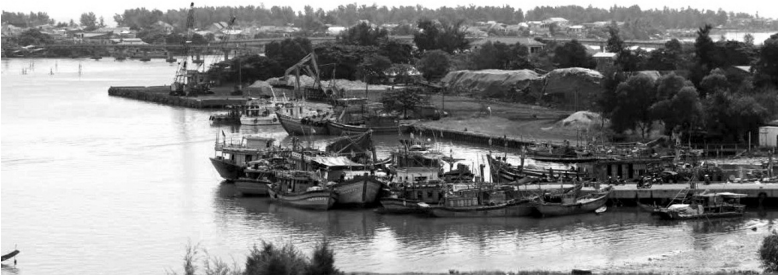
●Thừa Thiên Huế vẫn còn hàng trăm tàu cá chưa đăng ký các thủ tục.

Trong quá trình tổ chức triển khai thực hiện kế hoạch, đại diện Sở Tư pháp đề nghị các đơn vị ký kết phối hợp chặt chẽ, phương pháp tuyên truyền theo hướng tiếp cận sát, đáp ứng nhu cầu của đối tượng, vận dụng linh hoạt nhiều hình thức tuyên truyền như: Tuyên truyền miệng thông qua tổ chức hội nghị, cấp phát tờ gấp, pano, áp phích...; thông qua các phương tiện thông tin đại chúng (báo chí, truyền thanh) để công tác tuyên truyền chống khai thác IUU thực sự có hiệu quả để nâng cao nhận thức, ý thức chấp hành pháp luật trong khai thác thủy sản của chủ tàu cá và ngư dân.