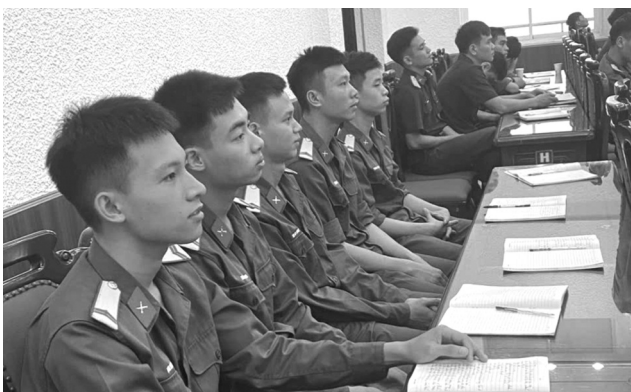
● Các chiến sĩ trẻ ghi chép cẩn thận các nội dung quan trọng.

Phối hợp với các luật sư (LS), trả lời giải đáp nhiều câu hỏi do cán bộ, chiến sĩ (CB,CS) Lữ đoàn (LĐ) 144, Bộ Tổng Tham mưu (BTTM) đặt ra xoay quanh chế tài xử lý các hành vi cá độ, lô đề, đánh bạc, cho vay lãi nặng; hôn nhân và gia đình... chương trình phổ biến, giáo dục pháp luật (PBGDPL) do Trung ương Hội Cựu chiến binh Việt Nam (CCBVN) phối hợp tổ chức đã chuyển tải những nội dung thiết thực, ý nghĩa.