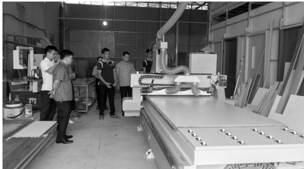
● Nghiệm thu đề án “Hỗ trợ kinh phí đầu tư máy móc thiết bị tiên tiến trong sản xuất đồ gỗ” tại Công ty TNHH Nội thất HT Home.

Mới đây, Trung tâm Phát triển Công Thương tỉnh Vĩnh Phúc phối hợp với Phòng Kinh tế và Hạ tầng huyện Vĩnh Tường tổ chức nghiệm thu đề án “Hỗ trợ kinh phí đầu tư máy móc thiết bị tiên tiến trong sản xuất đồ gỗ” tại Công ty TNHH Nội thất HT Home.