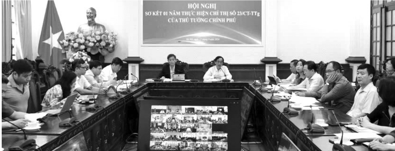
● Quang cảnh Hội nghị.

Sáng 27/9, Bộ Tư pháp tổ chức Hội nghị Sơ kết 01 năm thực hiện Chỉ thị số 23/CT-TTG ngày 09/7/2023 của Thủ tướng Chính phủ về việc đẩy mạnh cải cách thủ tục hành chính cấp Phiếu lý lịch tư pháp tạo thuận lợi cho người dân, doanh nghiệp.