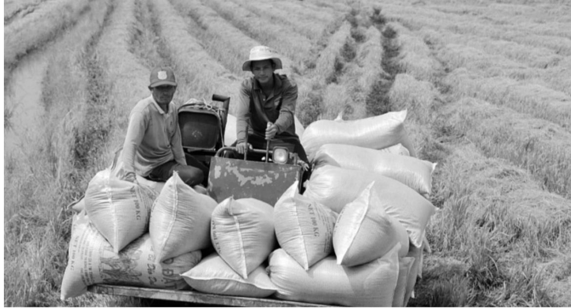
● Giá gạo xuất khẩu của Việt Nam trong thời gian tới có thể sẽ tiếp tục được duy trì ở mức phù hợp.

Giá gạo Việt Nam đã có mức tăng kỷ lục ngay khi Ấn Độ vừa ban hành lệnh cấm xuất khẩu gạo. Vậy mức giá này có bị tác động khi Ấn Độ chính thức cho xuất khẩu trở lại?