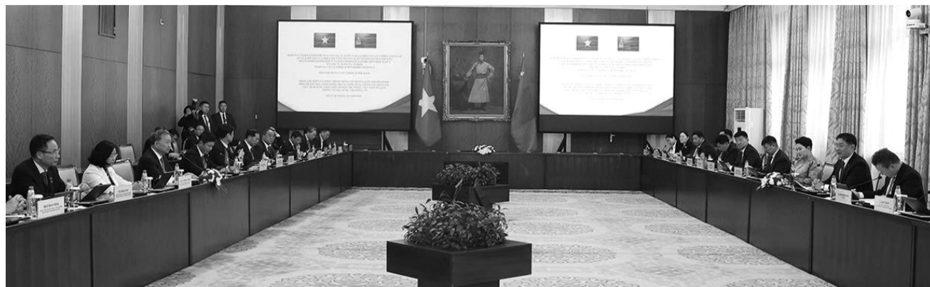
● Tổng Bí thư, Chủ tịch nước Tô Lâm hội đàm với Tổng thống Mông Cổ Ukhnaagiin Khurelsukh.

Nhận lời mời của Tổng thống Mông Cổ Ukhnaagiin Khurelsukh, Tổng Bí thư, Chủ tịch nước Tô Lâm đã tiến hành thăm cấp Nhà nước tới Mông Cổ từ ngày 30/9 - 1/10. Trong khuôn khổ chuyến thăm cấp Nhà nước tới Mông Cổ, ngày 30/9, tại Thủ đô Ulaanbaatar, Tổng Bí thư, Chủ tịch nước Tô Lâm đã có cuộc hội đàm hẹp và tiến hành hội đàm chính thức với Tổng thống Mông Cổ Khurelsukh.