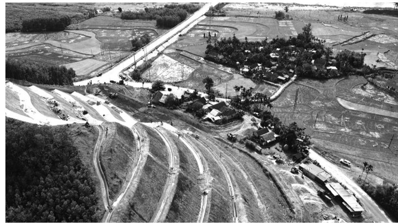
● 5 hộ dân với 24 nhân khẩu sống dưới chân núi Van Cà Vải.

Núi Van Cà Vải ở tổ dân phố Làng Dầu, thị trấn Di Lăng (huyện Sơn Hà, Quảng Ngãi) liên tiếp sạt lở, đe dọa 5 ngôi nhà dân với 24 nhân khẩu dưới chân núi. Để chống sạt lở, UBND huyện đã chi cả chục tỷ đồng phủ bê tông cả quả đồi.