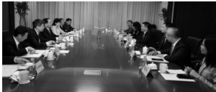
● Cuộc làm việc giữa Bộ trưởng Bộ Công Thương Nguyễn Hồng Diên và Bộ trưởng Bộ Công nghiệp và Công nghệ Trung Quốc Kim Tráng Long diễn ra vào sáng 30/9.

Ngoài ra, Bộ trưởng Diên đánh giá, việc sử dụng công nghệ cao trong hoạt động sản xuất của các công ty chế biến đã đem lại những tín hiệu tích cực cho ngành công nghiệp thực phẩm tại Trung Quốc. Do đó, đề nghị phía Trung Quốc phối hợp tổ chức các hội thảo chia sẻ kinh nghiệm để học