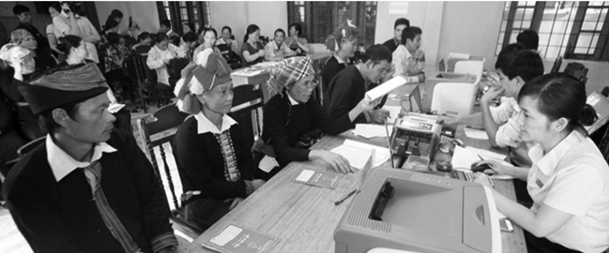
● NHCSXH cho vay hộ nghèo và các đối tượng chính sách khác tại các tỉnh Trung du và miền núi phía Bắc.