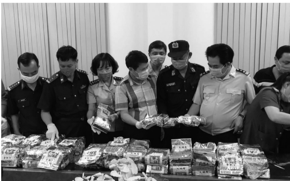
● Lực lượng chức năng phát hiện, thu giữ 40kg ma túy cất giấu trong container tại cảng Cát Lái TP Hồ Chí Minh chuẩn bị đưa sang Hàn Quốc tiêu thụ vào ngày 19/7/2020.