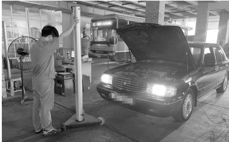
● Quy định mới về giấy tờ cần thiết khi lập Hồ sơ phương tiện và kiểm định xe cơ giới từ 01/10/2024.

Bên cạnh đó, việc khai thác tài sản công tại cơ quan nhà nước