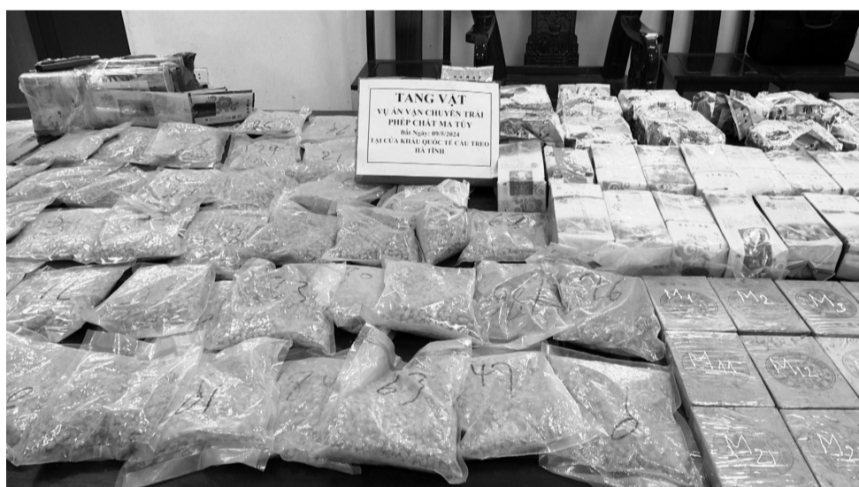
● Tang vật thu giữ 44 bánh heroin, 60.000 viên hồng phiến, 10kg ma túy đá, 10kg ketamin được cất giấu dưới sàn xe... bị lực lượng Bộ đội Biên phòng Hà Tĩnh phối hợp với các lực lượng chức năng bắt giữ ngày 9/5/2024.

Trong 10 năm trở lại đây (từ năm 2014 đến tháng 3/2024), lực lượng Cảnh sát điều tra tội phạm về ma túy, Công an TP Hồ Chí Minh đã phát hiện 16.885 vụ, với 38.536 đối tượng vi phạm pháp luật về ma túy. Tang vật thu giữ trên 7,61 tấn ma túy các loại (gồm: 870,96kg heroin, tương đương 2.640 bánh; 688,18kg cần sa; 5,880 tấn ma túy tổng hợp; 79,46kg cocaine; 49,61kg PSE; hơn 60kg cỏ Mỹ; 32,9kg lá Khát; 19,5kg ma túy khác); 88,8kg tiền chất; 1.900 ống Morphine; 25 quả nổ, lựu đạn; 310 khẩu súng, 3.890 viên đạn; 1.080 cân tiểu ly; hơn 10.500 xe máy; 169 ô tô; hơn 22.500 ĐTDĐ; 70,03 tỷ đồng; 627.000USD cùng hàng trăm nghìn tang vật khác có liên quan.