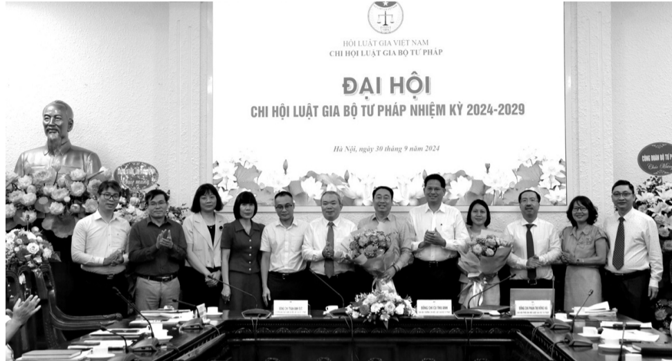
● Ban Chấp hành Chi hội Luật gia Bộ Tư pháp nhiệm kỳ 2024 - 2029 ra mắt Đại hội.