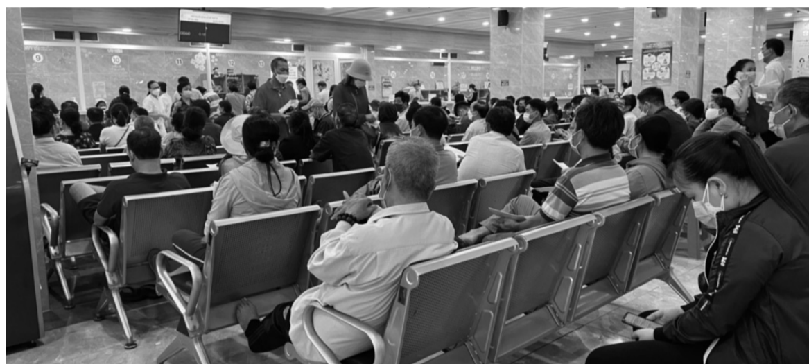
● Cán áp dụng nhiều giải pháp toàn diện nhằm ngăn chặn, phát hiện và xử lý tình trạng NLĐ trực lợi Quỹ BHXH theo chế độ ốm đau. (Ảnh minh họa: Đan Phương)

Gần đây, nhiều vụ việc có dấu hiệu tội phạm liên quan đến việc làm giả và mua bán Giấy chứng nhận nghỉ việc hưởng bảo hiểm xã hội (BHXH) để trực lợi Quỹ BHXH theo chế độ ốm đau đã được cơ quan chức năng phát hiện và xử lý. Nhiều doanh nghiệp (DN) đang phải đối mặt với thực trạng người lao động (NLĐ) lợi dụng chế độ ốm đau để tránh bị xử lý kỷ luật lao động.