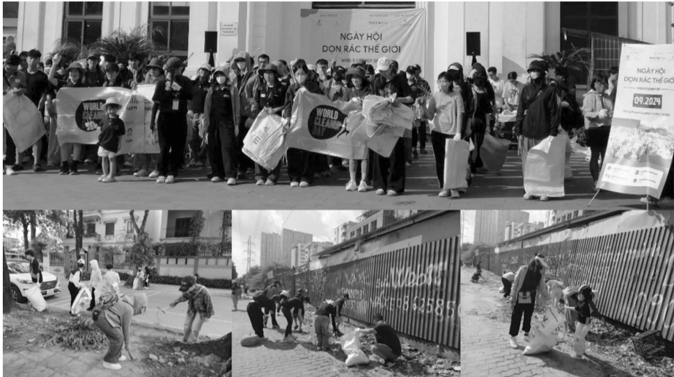
● Hàng trăm tình nguyện viên tham gia dọn rác trong sự kiện Ngày hội Dọn rác Thế giới 2024.

Trong những ngày cuối tuần qua, hàng trăm tình nguyện viên ở đủ các độ tuổi đã tham gia các chương trình bảo vệ môi trường như dọn rác, thu gom, tái chế rác... Những hành động dù nhỏ bé nhưng có ý nghĩa lớn lao, góp phần lan tỏa thông điệp về tình yêu thiên nhiên, thúc đẩy nhận thức cộng đồng và thói quen ứng xử thân thiện với môi trường, vì một Thủ đô xanh.