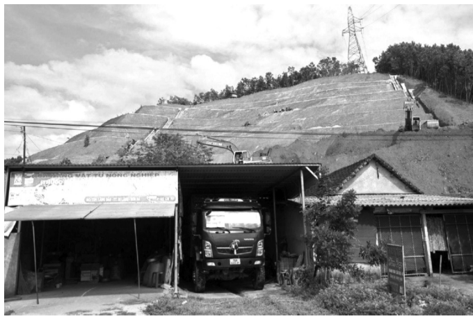
● Huyện Sơn Hà đã chi gần 17 tỷ đồng để thực hiện hai dự án khắc phục tình trạng sạt lở tại khu vực núi Van Cà Vải. (Ảnh trong bài: Vũ Anh)

Ngoài ra, trên đỉnh đồi còn có trụ điện 110kV nằm trong bán kính xử lý sạt lở, nhưng chưa có biện pháp di dời. Mới đây, Cục Quản lý Đê điều & Phòng, chống thiên tai (Bộ NN&PTNT) về kiểm tra tại điểm sạt lở trên, nghe trình bày về giải pháp thiết kế, yêu cầu phải di dời trụ điện nói trên để gia cố sạt lở.