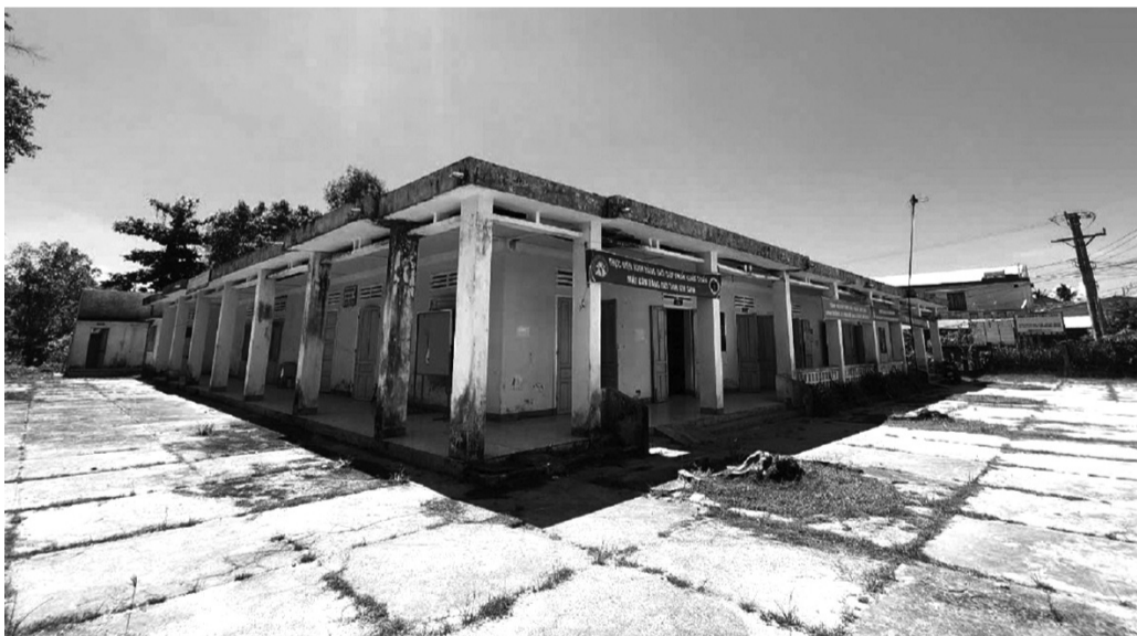
● Một trong những dự án xây mới, nâng cấp, cải tạo 5 trung tâm y tế cấp huyện và 76 trạm y tế tuyến xã triển khai ỉạch.

đang khó khăn, kinh phí cho ngành Y tế hạn chế, đây là trợ lực hết sức quý giá. Nếu dự án không đảm bảo tiến độ, nguồn vốn bị thu hồi, các công trình dở dang, không biết trách nhiệm sẽ thuộc về ai và tỉnh sẽ lấy nguồn kinh phí nào bù đắp cho nguồn vốn thiếu hụt. Những điều này tạo thêm áp lực lên các cơ sở y tế đang được thụ hưởng từ dự án”, ông Mười lo lắng.