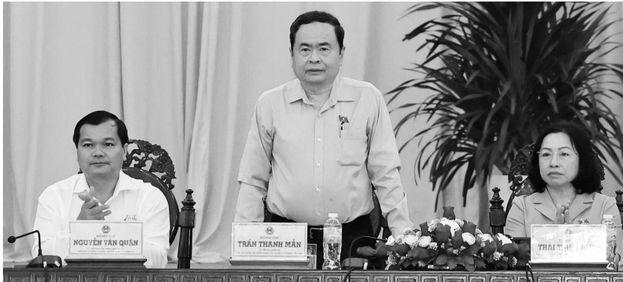
● Chủ tịch Quốc hội Trần Thanh Mẫn và các đại biểu Quốc hội tỉnh Hậu Giang tiếp xúc cử tri.

Ngày 30/9, phát biểu tại cuộc tiếp xúc cử tri tỉnh Hậu Giang, Chủ tịch Quốc hội Trần Thanh Mẫn nhấn mạnh, Quốc hội đã nỗ lực, đổi mới tư duy, đổi mới cách làm luật với tinh thần xây dựng pháp luật phải xuất phát từ thực tiễn, lấy người dân và doanh nghiệp làm trung tâm, chủ thể; kịp thời tháo gỡ khó khăn, vướng mắc cho sự phát triển kinh tế - xã hội, đảm bảo quốc phòng, an ninh của đất nước.