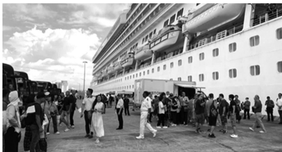
● Du thuyền 5 sao Costa Serena từ Hong Kong cập bến Cảng tàu khách quốc tế Hạ Long.

Sau ảnh hưởng bão số 3, Cảng tàu khách quốc tế Hạ Long đã nhanh chóng khắc phục hậu quả, đảm bảo các điều kiện để đón khách du lịch, trong đó có khách du lịch tàu biển. Dự kiến từ nay đến cuối năm 2024, Cảng tàu khách quốc tế Hạ Long sẽ đón 16