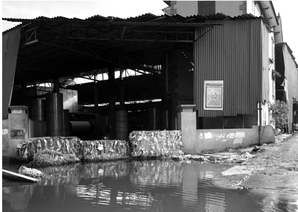
● Một cơ sở sản xuất giấy tại phường Phong Khê, TP Bắc Ninh.

Công an tỉnh phối hợp chặt chẽ các địa phương thực hiện việc trình sát, mở đợt cao điểm xử lý ô nhiễm môi trường tại 3 khu