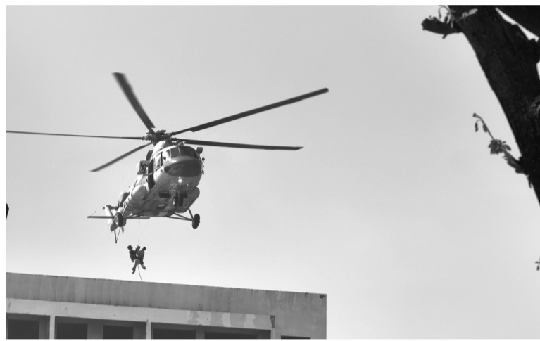
● Quân chủng Phòng không - Không quân điều máy bay cứu hộ, cứu nạn đưa các nạn nhân ở trên cao rời khỏi khu vực nguy hiểm.

Diễn tập khu vực phòng thủ (KVPT) TP Hà Nội diễn ra từ ngày 28/9 đến 2/10 là cuộc diễn tập có quy mô, phạm vi lớn nhất từ trước đến nay. Quân ủy Trung ương (QUTƯ), Bộ Quốc phòng (BQP) đã huy động 16 đầu mối đơn vị cùng tham gia diễn tập, tham gia thực binh bắn chiến đấu hiệp đồng quân, binh chủng cùng nhiều phương tiện, sử dụng nhiều loại vũ khí trang bị hiện đại, ứng dụng khoa học, công nghệ thông tin (CNTT) trong quá trình diễn tập.