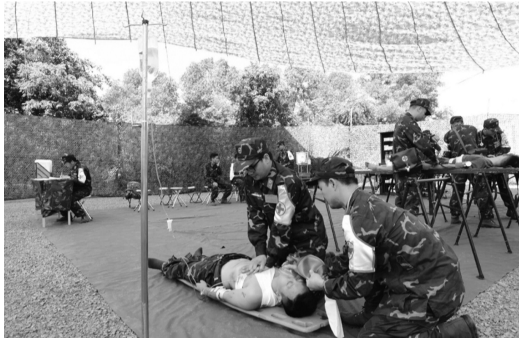
● Quân y cấp cứu nạn nhân tại Bệnh viện dã chiến.