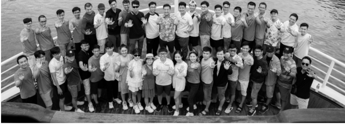
● Du lịch MICE là một “mảnh đất” giàu tiềm năng, đem lại nguồn lợi nhuận cao, giúp ngành Du lịch phát triển bền vững.

Với lợi thế khung cảnh thiên nhiên hấp dẫn, cơ sở vật chất tương đối tốt tại các điểm du lịch, hiện nay, thị trường du lịch MICE (du lịch kết hợp hội nghị, hội thảo, triển lãm, tổ chức sự kiện) ở Việt Nam đang phát triển nhanh chóng. Trong thời gian sắp tới, Việt Nam đang nỗ lực định vị thương hiệu, tạo liên kết trở thành trung tâm du lịch MICE top đầu.