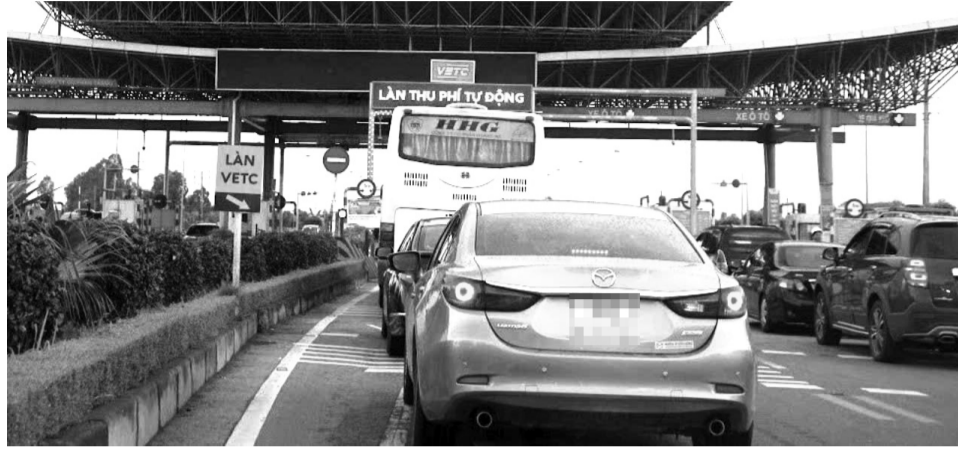
● Các phương tiện lưu thông qua làn thu phí tự động ETC tại Trạm thu phí Mỹ Lộc, Nam Định.

Đồng thời, Nghị định 119/2024/NĐ-CP quy định, thanh toán tiền sử dụng đường bộ được thực hiện theo 2 phương thức gồm: Phương thức mở và phương thức kín. Trong đó, phương thức mở là phương thức thanh toán mà chủ phương tiện phải trả một mức tiền tại trạm thu phí đường bộ không phụ thuộc vào chiều dài quãng đường phương tiện đã đi được trên đoạn đường thanh toán tiền