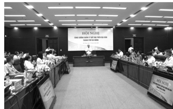
● Toàn cảnh Hội nghị.

Tại Đà Nẵng, hoạt động đấu giá quyền sử dụng đất và cho thuê quỹ đất ngắn hạn của TP chưa được triển khai mạnh mẽ để quản lý tốt đất đai trong thời gian chưa kêu gọi được nhà đầu tư. Vẫn còn tình trạng lấn, chiếm đất, cho thuê, cho thuê lại trái pháp luật, một số khu đất trở thành vị trí tập kết rác thải tự phát của các hộ dân lân cận gây mất mỹ quan đô thị và ô nhiễm môi trường.