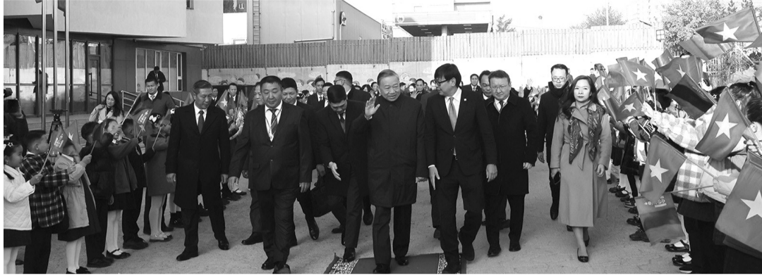
● Học sinh Trường liên cấp số 14 mang tên Chủ tịch Hồ Chí Minh chào đón Tổng Bí thư, Chủ tịch nước Tô Lâm tới thăm.

Sáng 1/10, tiếp tục chuyến thăm cấp Nhà nước tới Mông Cổ, Tổng Bí thư, Chủ tịch nước Tô Lâm cùng Đoàn đại biểu cấp cao Việt Nam đến thăm Đại sứ quán Việt Nam, gặp gỡ, nói chuyện thân mật với cán bộ, nhân viên Đại sứ quán và đại diện cộng đồng người Việt tại Mông Cổ.