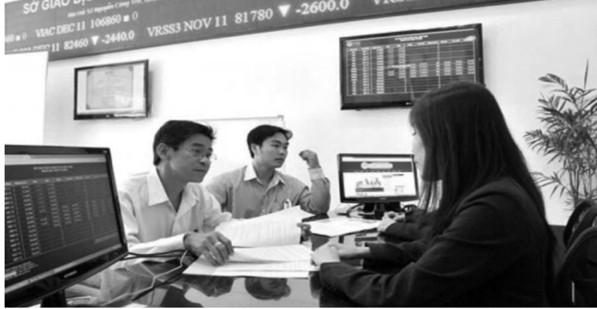
● Về lâu dài, cần nghiên cứu xây dựng một luật riêng về mua bán hàng hóa qua Sở giao dịch hàng hóa.

Điểm d khoản 9 Điều 11 (Hồ sơ đề nghị thành lập Sở giao dịch hàng hóa) còn yêu cầu thêm là Đề án thành lập Sở giao dịch hàng