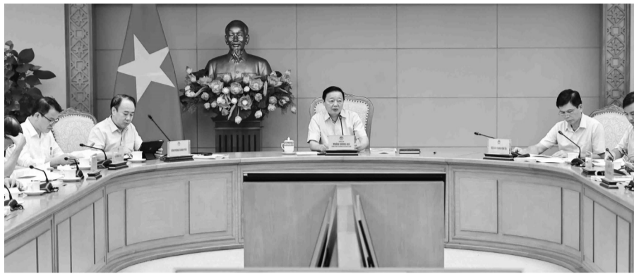
● Phó Thủ tướng Trần Hồng Hà yêu cầu trình thẩm định báo cáo nghiên cứu tiền khả thi dự án đường Vành đai 4 TP Hồ Chí Minh trong tháng 11/2024.

Bộ KH&ĐT đã làm việc với các địa phương có đường Vành đai 4 TP Hồ Chí Minh đi qua và kiến nghị ghép các dự án thành phần qua 5 địa phương thành 1 dự án tổng thể. Thủ tướng Chính phủ sẽ giao một cơ quan nghiên cứu báo cáo tiền khả thi tổng thể trình