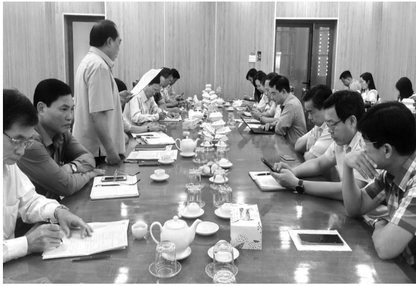
● Ban Chỉ đạo Cuộc vận động “Người Việt Nam ưu tiên dùng hàng Việt Nam” tỉnh Cà Mau triển khai phương hướng, nhiệm vụ trọng tâm thực hiện năm 2024.

Với vai trò Thường trực Ban Chỉ đạo Cuộc vận động “Người Việt Nam ưu tiên dùng hàng Việt Nam” tỉnh Cà Mau, thời gian qua, Ủy ban Mặt trận Tổ quốc (MTTQ) Việt Nam tỉnh Cà Mau chủ động phối hợp lồng ghép, đẩy mạnh tuyên truyền về mục đích, ý nghĩa của Cuộc vận động sâu rộng trong các tầng lớp Nhân dân, giúp người tiêu dùng nhận thức đúng chất lượng của sản phẩm, hàng hóa Việt.