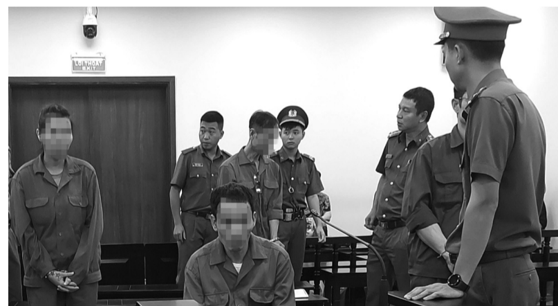
● Các bị cáo tại tòa.