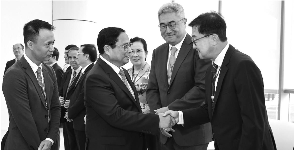
● Thủ tướng Chính phủ Phạm Minh Chính thăm hỏi, trò chuyện với các đại biểu dự buổi lễ.

Phát biểu tại Ngày hội đổi mới sáng tạo Việt Nam năm 2024 và Lễ kỷ niệm 5 năm thành lập Trung tâm Đổi mới sáng tạo Quốc gia (NIC), diễn ra ngày 1/10, Thủ tướng Phạm Minh Chính cho biết, Chính phủ sẽ tập trung chỉ đạo rà soát, hoàn thiện chiến lược, cơ chế, chính sách, giải pháp nhằm thúc đẩy mạnh mẽ đổi mới sáng tạo, khởi nghiệp.