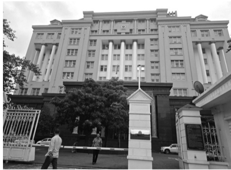
● Trụ sở TAND cấp cao tại Hà Nội.