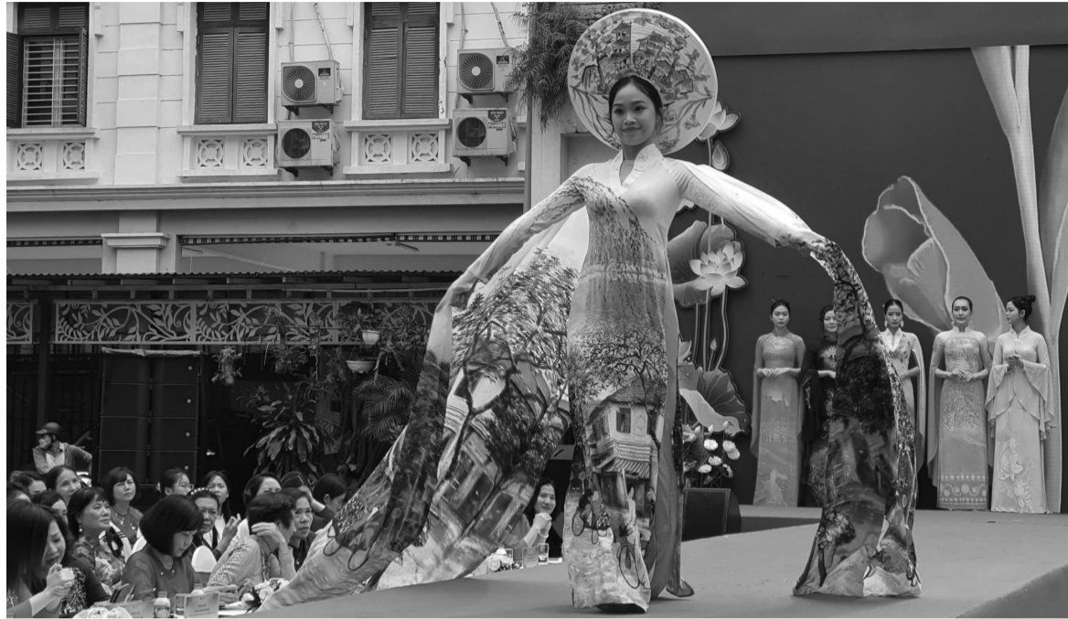
● Trình diễn áo dài tại Lễ phát động Tháng Áo dài Hà Nội năm 2024.

Tháng 10 hàng năm luôn là tháng đặc biệt với phụ nữ cả nước nói chung và phụ nữ Thủ đô nói riêng bởi có ngày thành lập Hội Liên hiệp Phụ nữ (LHPN) Việt Nam và Ngày Phụ nữ Việt Nam 20/10. Năm nay, tháng 10 lại càng đặc biệt hơn khi Thủ đô kỷ niệm 70 năm Giải phóng (10/10/1954 - 10/10/2024); kỷ niệm 94 năm thành lập Hội LHPN Việt Nam và Ngày Phụ nữ Việt Nam 20/10; UBND Thành phố Hà Nội tổ chức Lễ hội Áo dài Du lịch Hà Nội năm 2024... Mở đầu tháng 10, ngày 1/10 Hội LHPN Thành phố Hà Nội đã phát động Tháng Áo dài Hà Nội năm 2024.