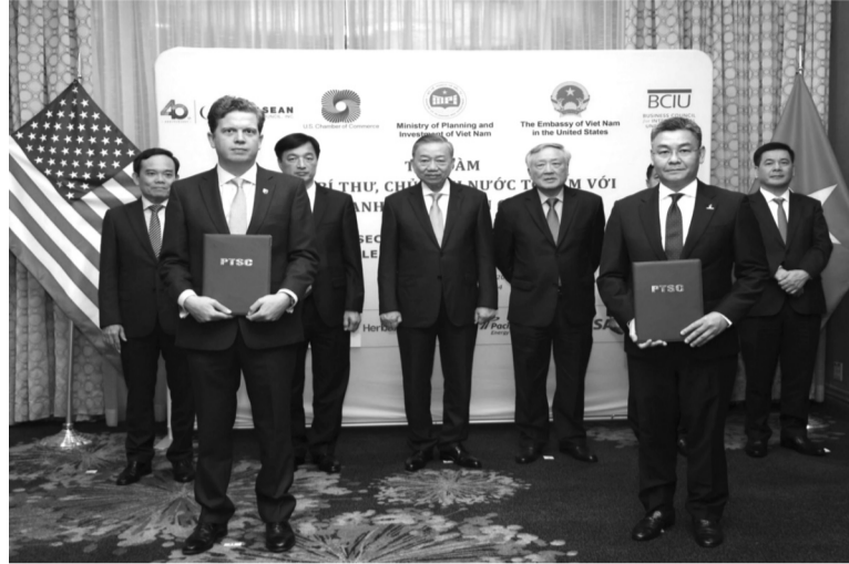
● Ngày 23/9/2024, tại Hoa Kỳ, Tổng Bí thư, Chủ tịch nước Tô Lâm đã chứng kiến Lễ trao thỏa thuận hợp tác giữa PTSC và Công ty Exceleerate Energy.

Petrovietnam và GE Digital International LLC ký kết MOU nhằm phát triển các giải pháp chuyển đổi số cho các hoạt động trong lĩnh vực điện và dầu khí. Đây là kết quả của những nỗ lực không ngừng từ cả hai phía, với mong muốn tạo ra bước đột phá