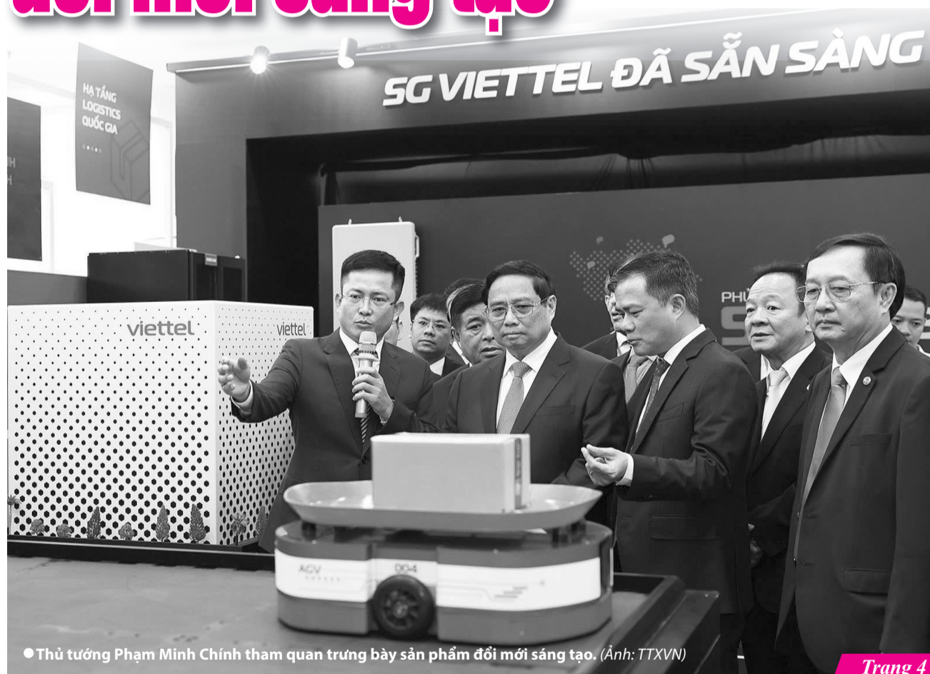
● Thủ tướng Phạm Minh Chính tham quan trưng bày sản phẩm đổi mới sáng tạo.