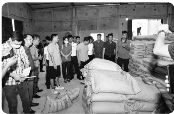
● Cục Cảnh sát điều tra tội phạm về ma túy phối hợp cùng các đơn vị chức năng khám phá đường dây mua bán, vận chuyển trái phép ma túy xuyên quốc gia, thu 1,3 tấn ketamin.

Ghi nhận thành tích của các tập thể trong vụ án nêu trên, ngày 16/10/2023, Thủ tướng Chính phủ Phạm Minh Chính có Thư khen Ban Chuyên án. Đồng thời, Bộ trưởng Bộ Công an có Quyết định thưởng cho các tập thể có thành tích đặc biệt xuất sắc trong đấu tranh chuyên án.