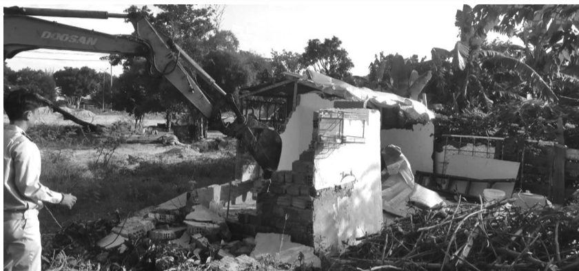
● Trung tâm phát triển quỹ đất Đà Nẵng phối hợp UBND cấp xã ra quân dọn dẹp mặt bằng đất công bị lấn chiếm.

Các địa phương, đơn vị liên quan tăng cường kiểm tra, giám sát việc thực hiện quy hoạch, kế hoạch sử dụng đất ở các cấp, đảm bảo sử dụng đất đúng mục đích, đúng quy hoạch. Kiên quyết