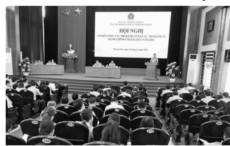
● Toàn cảnh Hội nghị sơ kết công tác THADS, THAHC 6 tháng đầu năm 2024 của tỉnh Thanh Hóa.