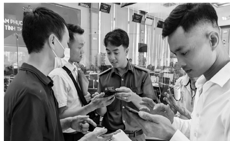
● Công an Thừa Thiên Huế hướng dẫn người dân thực hiện các bước kê khai lý lịch tư pháp trên ứng dụng VNeID.

Về 2 tiện ích thí điểm qua VNeID, Thủ tướng đánh giá, việc triển khai thí điểm 2 ứng dụng nêu trên thể hiện “3 phù hợp” và mang lại 3 lợi ích lớn. Đồng thời, chỉ ra những tồn tại, hạn chế, khó khăn, vướng mắc như dữ liệu chưa thực sự “đúng, đủ, sạch, sống”; tính liên thông, chia sẻ, đồng bộ hiệu quả chưa cao; ứng