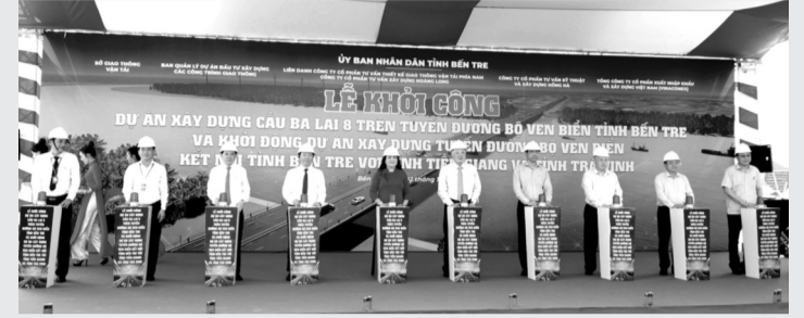
● Nghi thức khởi công cầu Ba Lai 8.

Ngày 2/10, Ủy viên Bộ Chính trị, Bí thư Trung ương Đảng, Phó Thủ tướng thường trực Chính phủ Nguyễn Hòa Bình đã đến dự lễ khởi công xây dựng cầu Ba Lai 8 trên tuyến đường bộ ven biển tỉnh Bến Tre và Hội thảo năng lượng mới và năng lượng tái tạo tiềm năng và nguồn lực đầu tư tại tỉnh Bến Tre.