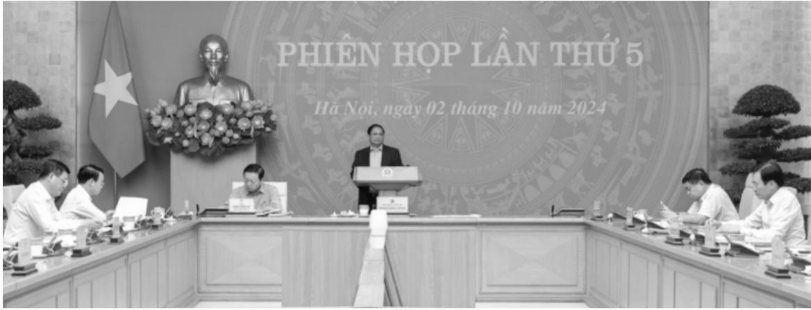
● Thủ tướng Phạm Minh Chính phát biểu chỉ đạo tại phiên họp.

Sáng 2/10, chủ trì Phiên họp lần thứ 5 của Ban Chỉ đạo quốc gia triển khai thực hiện cam kết của Việt Nam tại COP26 (Ban Chỉ đạo), Thủ tướng Chính phủ Phạm Minh Chính, Trưởng Ban Chỉ đạo nêu rõ, góp phần ứng phó biến đổi khí hậu, phát triển xanh, chuyển đổi năng lượng là việc không thể không làm, không thể đứng ngoài cuộc và làm phải có hiệu quả.