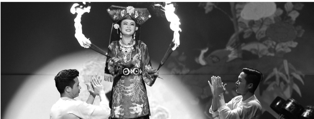
● Thực hành Tín ngưỡng thờ Mẫu Tam phủ - Nét văn hóa dân gian của người Việt.

Tiếp sau bài báo “Lộng ngôn” trong cộng đồng Tín ngưỡng thờ Mẫu: Đừng để di sản văn hóa bị ảnh hưởng” đăng báo in số 272 phát hành ngày 28/9/2024, Báo Pháp luật Việt Nam đã nhận được nhiều ý kiến phản hồi tích cực của bạn đọc và các chuyên gia văn hóa xung quanh vấn đề giải pháp để bảo vệ phát triển di sản “Thực hành Tín ngưỡng thờ Mẫu Tam phủ của người Việt” đã được UNESCO ghi danh tại danh sách Di sản văn hóa phi vật thể đại diện của nhân loại năm 2016.