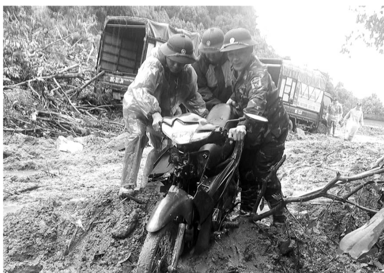
● CBCS Ban CHQS huyện Bắc Quang di chuyển tài sản giúp dân.

sạt lở, lũ ống, lũ quét “giao Bộ Quốc phòng chủ trì, phối hợp Bộ GTVT và địa phương triển khai ngay các flycam bay quét các điểm xung yếu, có nguy cơ sạt lở, kịp thời phát hiện các vết nứt để cảnh báo sớm và có biện pháp phòng ngừa, di dời dân cư, đảm bảo an toàn cho lực lượng cứu hộ”, BTTM yêu cầu Tập đoàn Công nghiệp - Viễn thông Quân đội (Viettel) cử lực lượng,