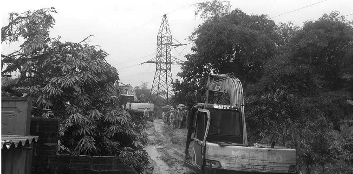
● QK2 phối hợp tìm kiếm người mất tích do sạt lở ở Hà Giang.

Không chỉ tiếp tục khắc phục hậu quả, tìm kiếm cứu nạn (TKCN), cứu hộ tại một số địa phương, trước tình hình thời tiết diễn biến bất thường, lực lượng vũ trang (LLVT) Quân khu (QK) 2 tiếp tục chủ động ứng phó nguy cơ sạt lở, lũ ống, lũ quét.