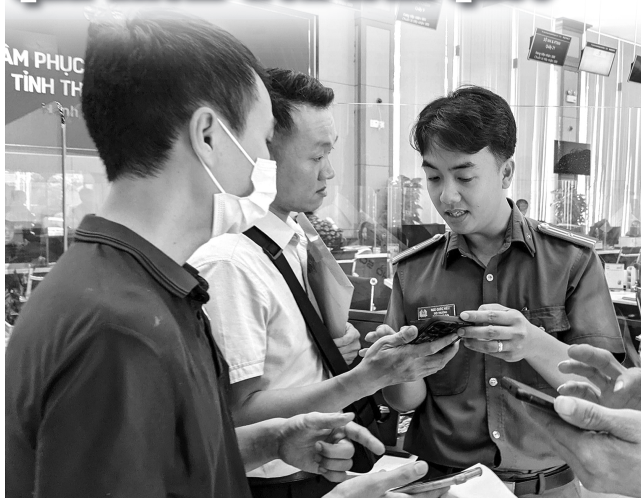
● Công an Thừa Thiên Huế hướng dẫn người dân thực hiện các bước kê khai lý lịch tư pháp trên ứng dụng VNeID.

Chiều 2/10, Thủ tướng Phạm Minh Chính, Chủ tịch Ủy ban Quốc gia về chuyển đổi số, chủ trì Hội nghị trực tuyến triển khai mở rộng thí điểm sổ sức khỏe điện tử và cấp Phiếu lý lịch tư pháp qua VNeID trên toàn quốc.