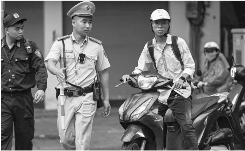
● Lực lượng CSGT Công an TP Hà Nội tăng cường kiểm tra, xử lý học sinh vi phạm TTATGT.

Trong tháng 10 này, lực lượng Cảnh sát giao thông toàn quốc triển khai kế hoạch cao điểm bảo đảm an toàn giao thông cho lứa tuổi học sinh.