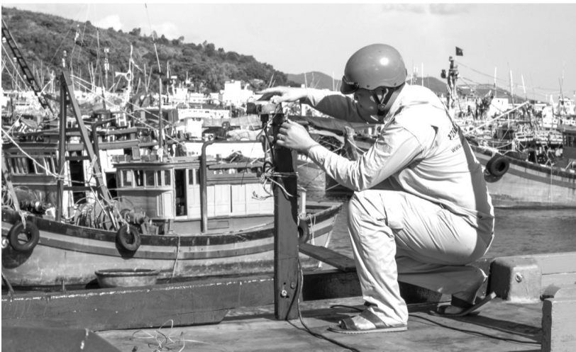
● Kỹ thuật viên Đài Thông tin duyên hải Nha Trang kiểm tra thiết bị giám sát hành trình trên tàu cá.

khai thác thủy sản cho 3.145/3.266 tàu (đạt 96%).