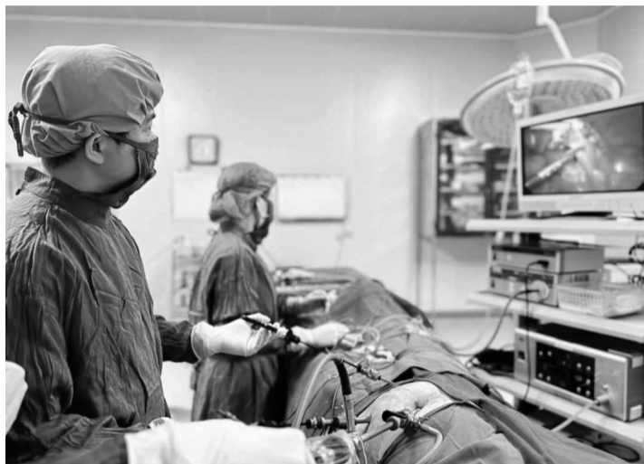
● Quy định tiêu chí phân loại, điều kiện thành lập, sáp nhập, hợp nhất, giải thể các đơn vị ngành Y từ ngày 15/11/2024.

Bộ Y tế vừa ký ban hành Thông tư 17/2024/TT-BYT quy định tiêu chí phân loại, điều kiện thành lập, sáp nhập, hợp nhất, giải thể các đơn vị sự nghiệp công lập thuộc ngành, lĩnh vực y tế.