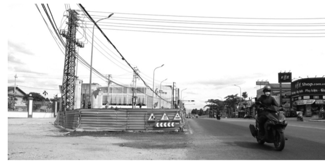
● Dự án nút giao thông đường 2 tháng 9 - đường Nguyễn Tất Thành phải rào lại.

Đoạn đi qua địa bàn tỉnh Thừa Thiên Huế đang diễn ra thực trạng một số dự án chỉnh trang, mở rộng các đường ngang đấu nối ra QL đã hoàn thành hoặc đang thi công dở dang, nhưng phải rào chắn lại, do không đáp ứng yêu cầu theo Thông tư 39/2021/TT-BGTVT.