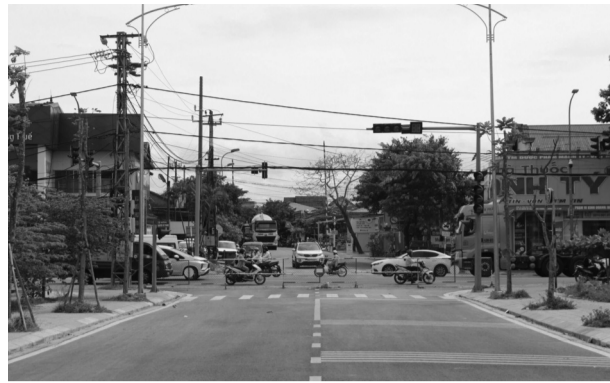
● Đoạn tỉnh lộ 7 ở phường Thủy Phương, TX Hương Thủy phải "khóa" ở vị trí đầu nối QL1A dù công trình đã hoàn thiện. (Ảnh: Nhung - Huy)