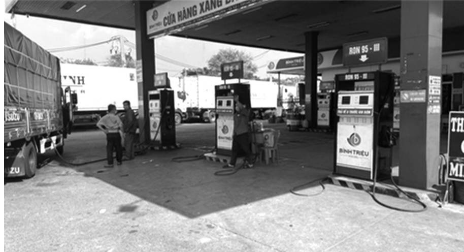
Doanh nghiệp bán lẻ và thương nhân phân phối xăng dầu tiếp tục kiến nghị về nội dung của dự thảo.

Dự thảo Nghị định về kinh doanh xăng dầu (thay thế hoàn toàn cho 3 nghị định về kinh doanh xăng dầu hiện hữu) đang tiếp tục được lấy ý kiến góp ý. Kiên trì đấu tranh để có được quyền cạnh tranh bình đẳng, đội ngũ thương nhân phân phối (TNPP) và doanh nghiệp bán lẻ (DNBL) xăng dầu đã tiếp tục gửi đơn kiến nghị đến Thủ tướng Chính phủ.