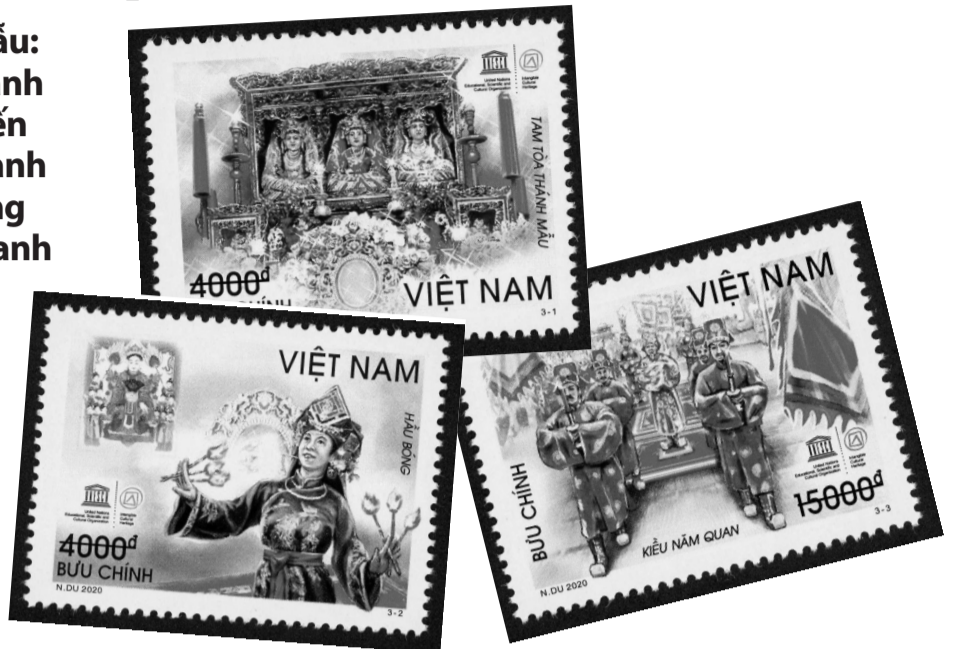
● Tháng 12/2020, bộ tem “Thực hành Tín ngưỡng thờ Mẫu Tam phủ của người Việt - Di sản văn hoá phi vật thể đại diện của nhân loại” đã được Bộ TT-TT phát hành nhằm góp phần lưu giữ lịch sử, di sản và bản sắc văn hóa của người Việt. (Nguồn: TCT Bưu điện Việt Nam)