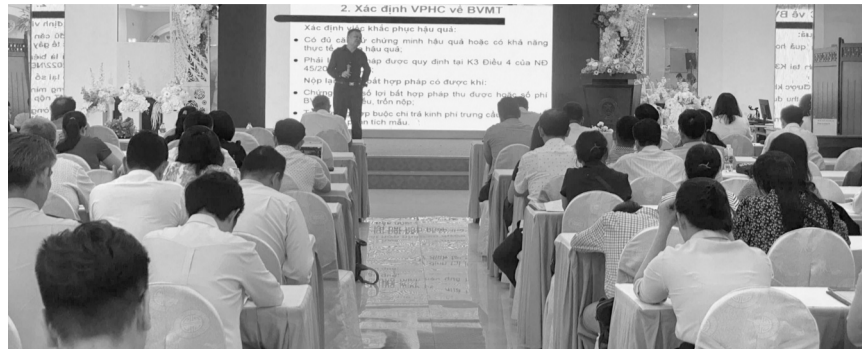
● Hội nghị tập huấn có sự tham gia đông đảo cán bộ, công chức công tác trong lĩnh vực môi trường.