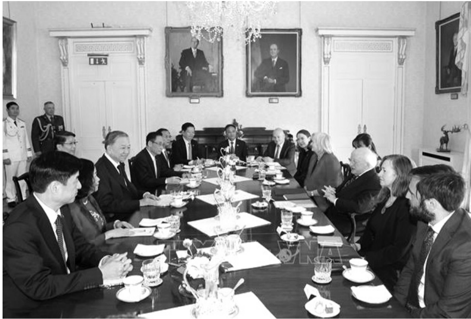
● Tổng Bí thư, Chủ tịch nước Tô Lâm hội đàm với Tổng thống Ireland Michael D. Higgins.

Nhằm tăng cường tin cậy chính trị và hiểu biết lẫn nhau, Tổng Bí thư, Chủ tịch nước Tô Lâm và Tổng thống Michael Higgins nhất trí đẩy mạnh trao đổi đoàn các cấp, đặc biệt là cấp cao, tích cực triển khai các cơ chế hợp tác hiện có. Nhân dịp này, Tổng Bí thư, Chủ tịch nước Tô Lâm vui mừng thông báo Chính phủ