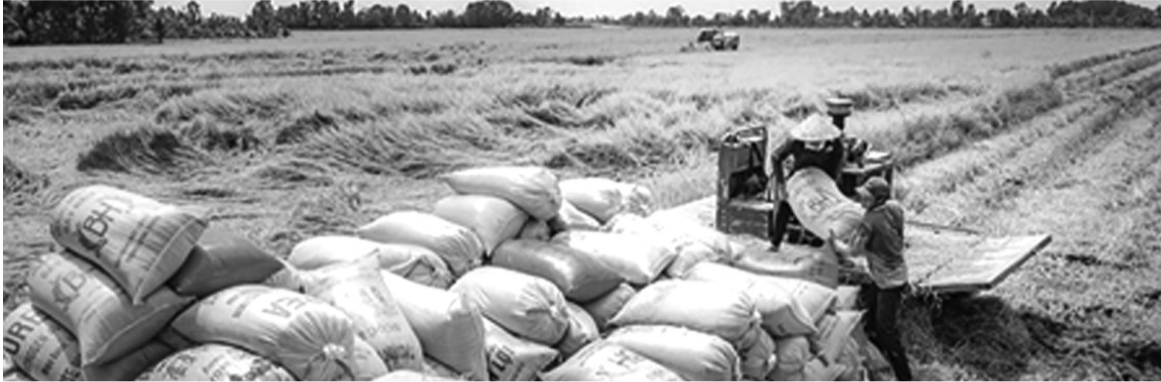
● Bộ NN&PTNT khuyến cáo vụ đông xuân 2024 - 2025 cần hạn chế phát triển sản xuất phân khúc lúa gạo chất lượng thấp.

Theo Bộ Nông nghiệp và Phát triển nông thôn (NN&PTNT), sau khi Ấn Độ dỡ bỏ lệnh cấm xuất khẩu gạo trắng non-basmati với mức giá sàn 490 USD/tấn, thị trường gạo toàn cầu đang có nhiều biến động. Việt Nam buộc phải điều chỉnh giá gạo để cạnh tranh và nguồn cung vẫn duy trì mức ổn định.