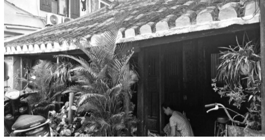
● Tại Hội An, trong hơn 1.000 di tích thuộc diện nhà ở thì có 36 di tích đã xuống cấp.

trình". Trước đây căn nhà là chỗ tránh nắng, che mưa của gia đình ông Võ Đẩu. Từ ngày ông Đẩu mất, các con của ông cũng khăn gói rời khỏi di tích, do không được tu sửa nên nhà đã bị đổ sập một phần.