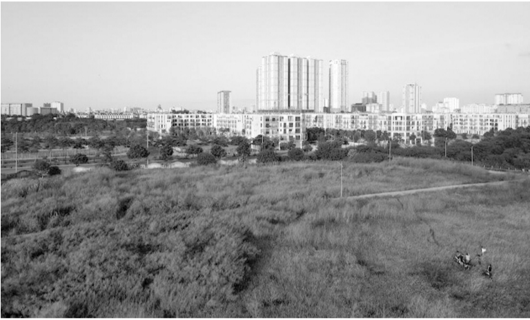
● Bộ Tài nguyên và Môi trường đề xuất xây dựng bảng giá đất đến từng thửa đất trên cơ sở vùng giá trị, thửa đất chuẩn.

Bộ Tài nguyên và Môi trường (TN&MT) đang dự thảo Thông tư quy định chi tiết về xây dựng, điều chỉnh, sửa đổi, bổ sung bảng giá đất đến từng thửa đất trên cơ sở vùng giá trị, thửa đất chuẩn.