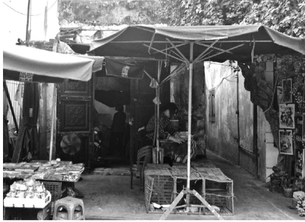
● Căn nhà số 34 Bạch Đằng đã sập một phần sau nhiều năm không được tu sửa.

Những ngôi nhà cổ kính với kiến trúc độc đáo là đặc trưng, niềm tự hào của phố cổ Hội An (Quảng Nam), nhưng một số đang xuống cấp nghiêm trọng.