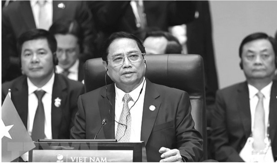
● Thủ tướng Chính phủ Phạm Minh Chính dự phiên toàn thể của Hội nghị Cấp cao ASEAN lần thứ 43 tại Thủ đô Jakarta, Indonesia.

Với chủ đề "Tăng cường kết nối và tự cường ASEAN", Hội nghị lần này gồm khoảng 20 hoạt động với sự tham dự của lãnh đạo các nước ASEAN và các đối tác, cùng nhiều khách mời là đại diện tổ chức quốc tế và khu vực. Dự kiến, khoảng 80 văn kiện sẽ được các lãnh đạo thông qua hoặc ghi nhận tại Hội nghị. Đây là chuỗi các Hội nghị cấp cao quan trọng nhất trong năm của ASEAN, cũng là dịp để lãnh đạo các nước ASEAN và đối tác trao đổi, đưa ra quyết sách chiến lược củng cố tiến trình xây dựng Cộng đồng, thúc đẩy quan hệ giữa ASEAN với các đối tác.