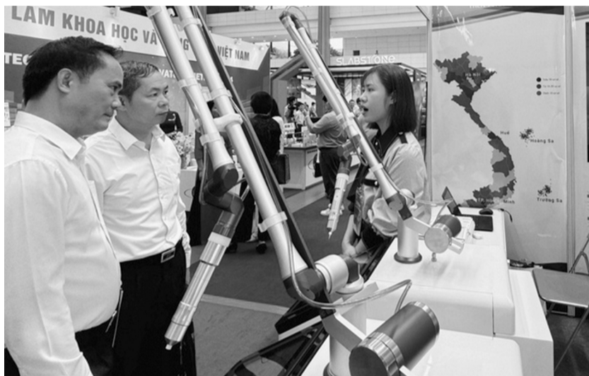
● Khách tham quan các gian hàng công nghệ tại Techconnect & Innovation 2024.

Trong khuôn khổ sự kiện “Kết nối công nghệ và Đổi mới sáng tạo Việt Nam” (Techconnect & Innovation) năm 2024, UBND TP Hà Nội phối hợp với Bộ Khoa học và Công nghệ (KH&CN) tổ chức Tọa đàm “Vai trò của đổi mới sáng tạo đối với doanh nghiệp Thủ đô”.