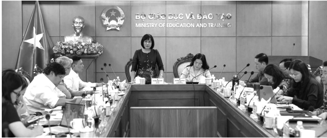
● Thủ trưởng Bộ Tư pháp Đặng Hoàng Oanh kết luận buổi kiểm tra tại Bộ Giáo dục và Đào tạo.

Ngày 03/10, Đoàn công tác liên ngành do Thủ trưởng Bộ Tư pháp Đặng Hoàng Oanh làm Trưởng đoàn đã tiến hành kiểm tra công tác thi hành pháp luật về xử lý vi phạm hành chính (XLVPHC) của Bộ Giáo dục và Đào tạo (GD&ĐT). Dự buổi kiểm tra có Thủ trưởng Bộ GD&ĐT Nguyễn Thị Kim Chi.