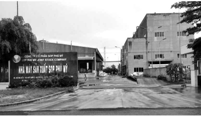
● Cty CP SOP Phú Mỹ là một trong những DN bị xác định có vi phạm.

Bằng thủ đoạn trên, từ tháng 3/2024 đến nay, Thái đã cướp giật 3 điện thoại di động, tổng trị giá khoảng 50 triệu đồng. VĂN SƠN