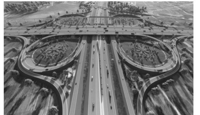
● Việc phát triển đường Vành đai 4 không chỉ giải quyết vấn đề của riêng Hà Nội mà sẽ giải quyết vấn đề liên vùng Thủ đô. (Ảnh minh họa)

Tại cuộc họp, Phó Chủ tịch UBND TP Hà Nội Dương Đức Tuấn cho biết, dự án đầu tư xây dựng đường Vành đai 4 - Vùng Thủ đô Hà Nội (dự án đường Vành đai 4) được Quốc hội thông qua chủ trương đầu tư tại Nghị quyết số 56/2022/QH15 ngày 16/6/2022 với quy mô chiều dài 112,8km đi qua địa bàn TP Hà Nội (58,2km), Hưng Yên (19,3km), Bắc Ninh (25,6km) và tuyến nối dài 9,7km.