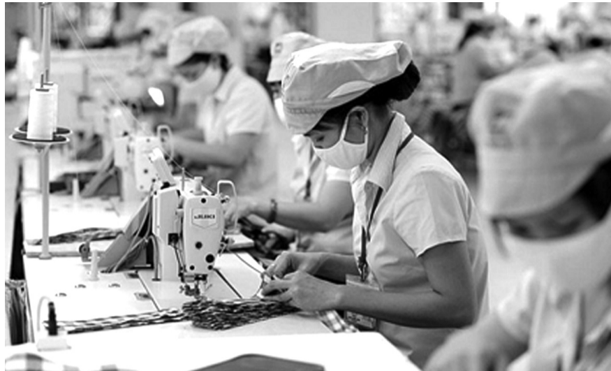
● Dệt may Việt Nam phải tiến tới phát triển bền vững để giữ được thị trường EU.

EU là thị trường lớn và hấp dẫn cho ngành dệt may với kim ngạch nhập khẩu từ các nước thứ ba năm 2023 là 115 tỷ Euro, trong đó, Việt Nam mới chỉ đạt 4,5 tỷ Euro. Do vậy, dư địa cho hàng Việt Nam mở rộng thị phần còn rất lớn. Vấn đề là doanh nghiệp Việt cần cập nhật và tuân thủ nhiều quy định của EU để giữ vững và phát triển thị trường lớn này.