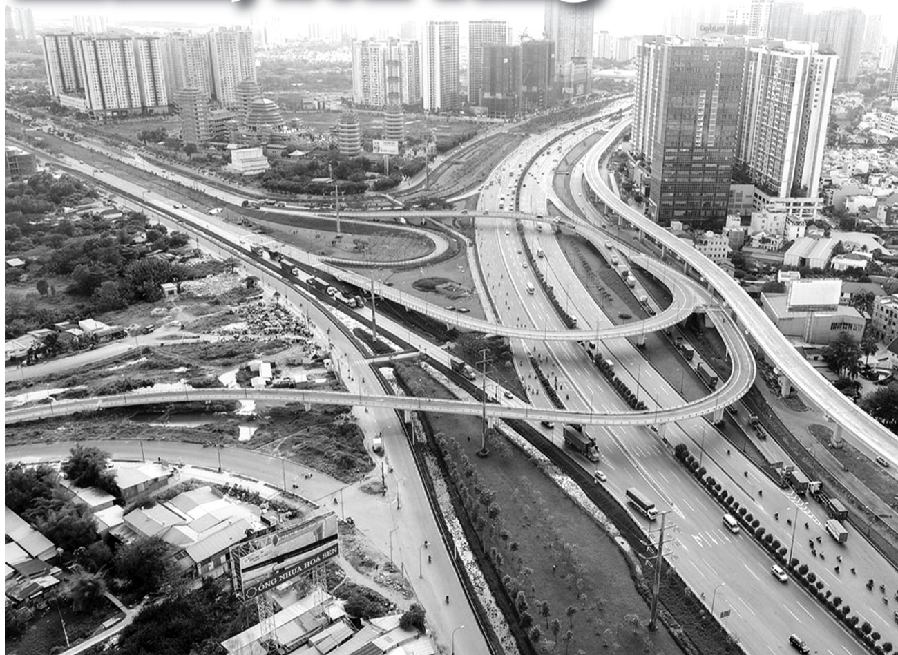
Thủ tướng Phạm Minh Chính yêu cầu các Bộ, ngành, địa phương tiếp tục phát huy tinh thần trách nhiệm cao nhất, nỗ lực đẩy nhanh tiến độ các công trình, dự án quan trọng quốc gia, trọng điểm ngành Giao thông vận tải.

Chiều 3/10, chủ trì cuộc làm việc giữa Thường trực Chính phủ với các hiệp hội, doanh nghiệp xây dựng nhằm tháo gỡ khó khăn, vướng mắc, thúc đẩy triển khai các công trình trọng điểm quốc gia, Thủ tướng Phạm Minh Chính yêu cầu các Bộ, ngành, địa phương luôn lắng nghe, thấu hiểu, chia sẻ những khó khăn, thách thức, kịp thời tháo gỡ để giúp doanh nghiệp cùng đất nước phát triển nhanh, bền vững.