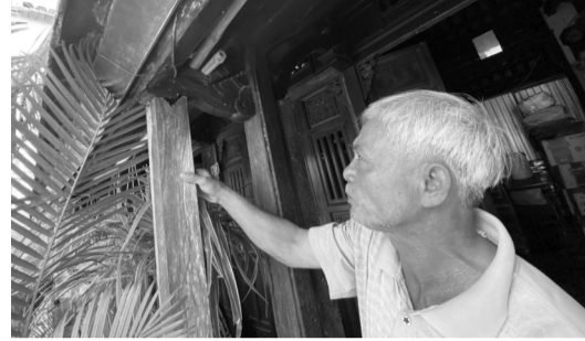
● Một căn nhà cổ đã xuống cấp nghiêm trọng.

Thực tế tại Hội An, với các di tích thuộc diện không còn khả năng chống đỡ thì giải pháp hạ giải cũng khó khả thi, ảnh hưởng đến cảnh quan chung của khu phố cổ. Tại phường Minh An, UBND phường đề xuất phương án liên hệ với chủ di tích, trước mắt đặt vấn đề di dời đi nơi khác mỗi khi có bão lụt xảy ra. Những nhà cổ thuộc sở hữu tư nhân, ngoài việc Nhà nước hỗ trợ kinh phí trùng tu, nếu chủ nhà gặp khó khăn không có tiền góp số còn lại, thì Nhà nước sẽ cho vay với phương thức 3 năm đầu tiên không lãi suất.