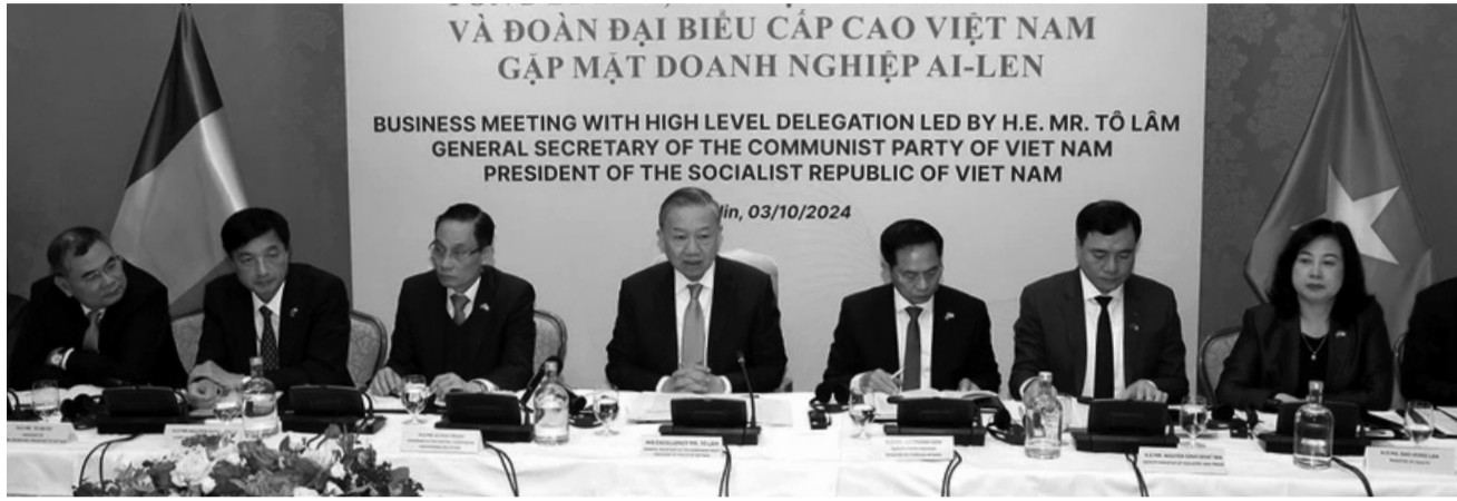
● Tổng Bí thư, Chủ tịch nước Tô Lâm phát biểu tại cuộc gặp.

Trong khuôn khổ chuyến thăm cấp Nhà nước tới Ireland, sáng 3/10, tại Thủ đô Dublin, Tổng Bí thư, Chủ tịch nước Tô Lâm và Đoàn đại biểu cấp cao Việt Nam đã gặp mặt các doanh nghiệp Ireland.