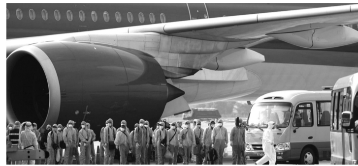
● Một chuyến bay đưa công dân Việt Nam bị mắc kẹt ở nước ngoài về nước trong giai đoạn Covid-19 hoành hành.

Cơ quan An ninh điều tra Bộ Công an vừa hoàn tất kết luận điều tra (KLĐT), đề nghị truy tố 17 bị can trong vụ án "Đưa hối lộ, Nhận hối lộ, Lợi dụng chức vụ, quyền hạn trong khi thi hành công vụ, Che giấu tội phạm" xảy ra tại Thái Nguyên và một số tỉnh, thành; thuộc giai đoạn 2 vụ án "chuyến bay giải cứu".