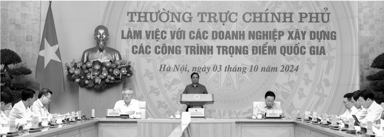
● Thủ tướng Phạm Minh Chính chủ trì và phát biểu khai mạc cuộc làm việc.

Chiều 3/10, chủ trì cuộc làm việc giữa Thường trực Chính phủ với các hiệp hội, doanh nghiệp xây dựng nhằm tháo gỡ khó khăn, vướng mắc, thúc đẩy triển khai các công trình trọng điểm quốc gia, Thủ tướng Phạm Minh Chính yêu cầu các Bộ, ngành, địa phương luôn lắng nghe, thấu hiểu, chia sẻ những khó khăn, thách thức, kịp thời tháo gỡ để giúp doanh nghiệp cùng đất nước phát triển nhanh, bền vững.