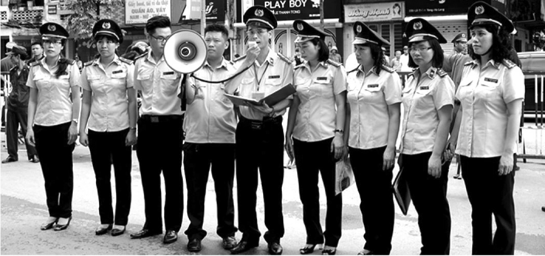
● Chấp hành viên Cục THADS Hà Nội làm nhiệm vụ.

Số tiền phải thi hành án cho các tổ chức tín dụng trên địa bàn TP Hà Nội chiếm tỷ trọng lớn trong tổng số thụ lý, tập trung vào một số tổ chức tín dụng lớn, có tính chất quyết định đến kết quả thu hồi nợ. Tuy nhiên, công tác thi hành án đối với loại việc này luôn phải đối mặt với không ít khó khăn.