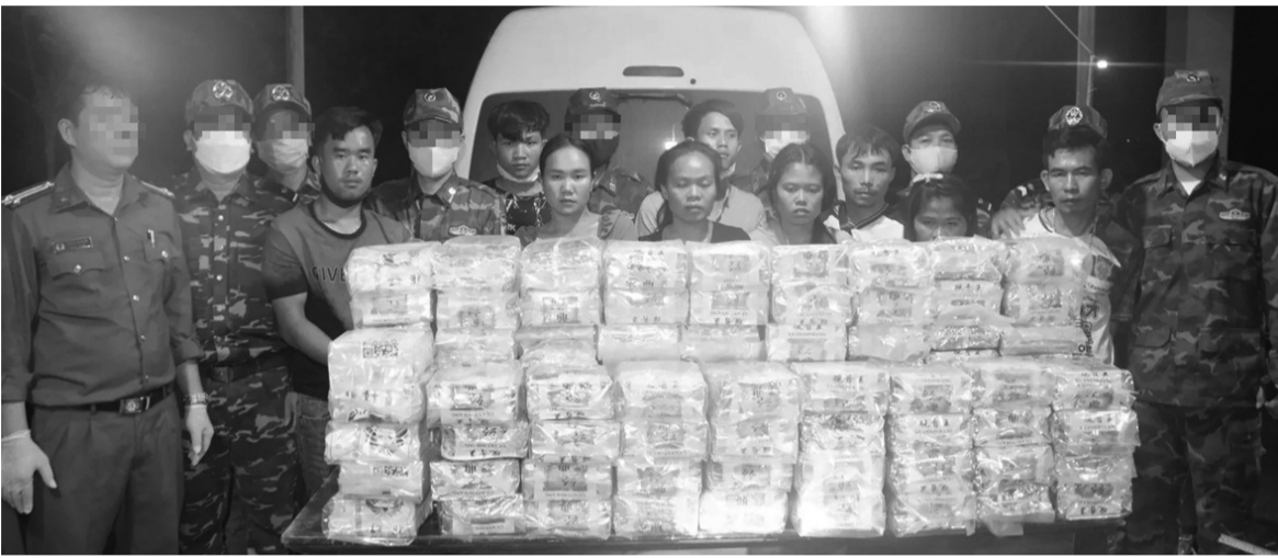
● Các đối tượng cùng tang vật 100kg ma túy tổng hợp bị lực lượng chức năng tỉnh Quảng Trị bắt giữ vào ngày 30/3/2024.

Cuộc chiến phòng, chống tội phạm ma túy trên khắp cả nước đang diễn ra hết sức khốc liệt. Máu đã đổ, nước mắt đã rơi, nhưng sự hy sinh trong cuộc chiến đầy cam go, quyết liệt này đã chứng minh bản chất, hình ảnh cao đẹp của người chiến sĩ Cảnh sát điều tra (CSĐT) tội phạm về ma túy, Bộ Công an kiên quyết đấu tranh không khoan nhượng với tội phạm ma túy, thấm nhuần sâu sắc và thực hiện nghiêm túc 6 điều Bác Hồ dạy Công an nhân dân; Nguyễn sắt son với 4 lời thề danh dự của lực lượng trực tiếp đấu tranh với tội phạm về ma túy.