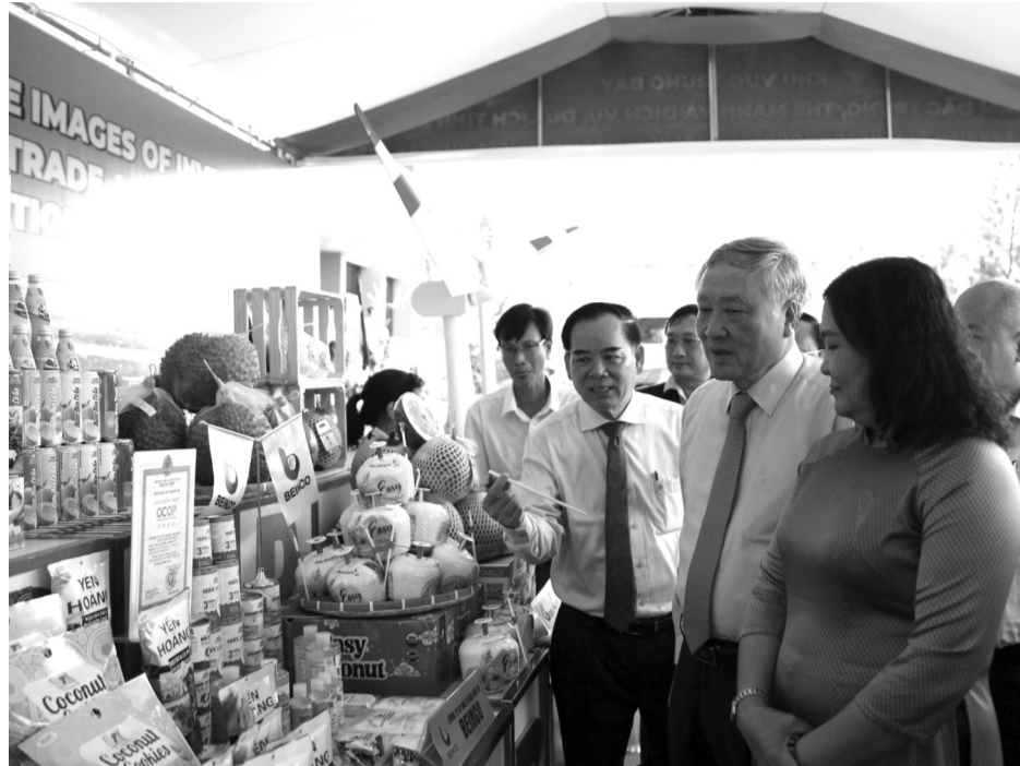
● Phó Thủ tướng Thường trực Chính phủ Nguyễn Hòa Bình thăm các gian hàng trưng bày các sản phẩm nông nghiệp của tỉnh Bến Tre.

Phó Thủ tướng Thường trực nhấn mạnh, thời gian tới, định hướng chiến lược, đường đi của Bến Tre đã rất rõ,