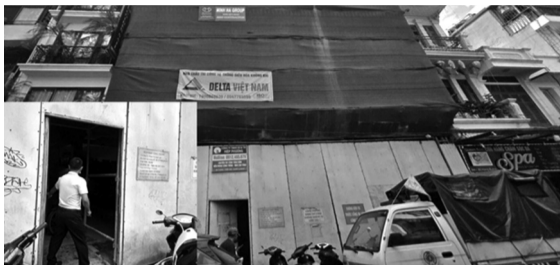
● Hiện trạng công trình số 57 - 59 - 61 Hàng Buồm.

Theo phản ánh của công dân và kết luận của UBND quận Hoàn Kiếm, công trình xây dựng tại số 57 - 59 - 61 Hàng Buồm đã thi công vượt tầng, vi phạm mật độ xây dựng và tự ý đào 2 tầng hầm dù không được cấp phép, có dấu hiệu gây lún nứt, ảnh hưởng đến các ngôi nhà liền kề.