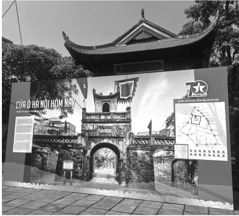
● Cửa ô Hà Nội hôm nay là một trong 3 chủ đề tại trưng bày "Hà Nội và những cửa ô". (Ảnh: Báo Châu)

Cửa ô - một kiến trúc rất nhỏ bé trong tổng thể các công trình kiến trúc nổi tiếng của Hà Nội qua nhiều thời kỳ lịch sử, nhưng lại lưu giữ trong mình một câu chuyện thật dài của Hà Nội. Đó là lịch sử, là chính trị, là văn hóa, là đời sống xã hội. Cửa ô gắn gũi, thân thương trong kí ức bao người, nhắc ta về quá khứ vàng son của cha ông, để ta thêm trân trọng hiện tại và dựng xây tương lai.