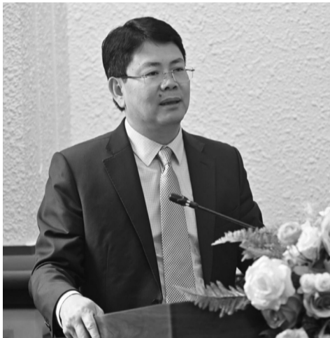
● Thứ trưởng Bộ Tư pháp Nguyễn Thanh Tịnh.

Hôm nay - 9/10 tại Hà Nội, Hội đồng Phối hợp phổ biến, giáo dục pháp luật Trung ương (PHBPGDPLTW) tổ chức Diễn đàn “Kinh doanh và Pháp luật” năm 2024 với chủ đề “Chung tay giải quyết các vấn đề pháp lý, góp phần tạo dựng môi trường đầu tư kinh doanh thuận lợi cho doanh nghiệp”. Mục tiêu của Diễn đàn là gì, Ban Tổ chức kỳ vọng như thế nào vào việc tổ chức Diễn đàn đó, Báo Pháp luật Việt Nam đã phỏng vấn Thứ trưởng Bộ Tư pháp Nguyễn Thanh Tịnh, Phó Chủ tịch Hội đồng PHBPGDPLTW, Trưởng Ban Tổ chức.