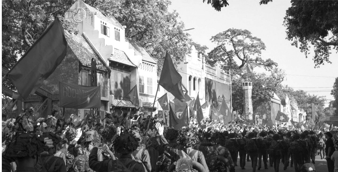
● Du lịch Hà Nội tháng 10 sôi động với nhiều hoạt động ý nghĩa, đậm đà bản sắc dân tộc.

Trong dịp kỷ niệm 70 năm Ngày Giải phóng Thủ đô (10/10/1954 - 10/10/2024), TP Hà Nội có nhiều hoạt động văn hóa, nghệ thuật đặc sắc thu hút hàng chục nghìn khách du lịch đến tham quan. Đây là “đòn bẩy” để Hà Nội tăng tốc bứt phá hoàn thành mục tiêu đón khoảng 26,5 triệu lượt khách trong năm 2024.