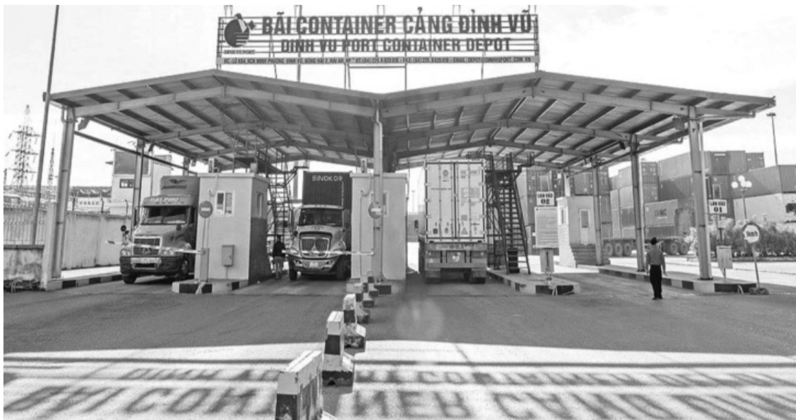
• Với ưu thế cảng biển, TP Hải Phòng đặc biệt quan tâm đến chuyển đổi số lĩnh vực cảng biển.

Chuyển đổi số được xác định là đòn bẩy, kiến tạo nền tảng vững chắc để đến năm 2030, Hải Phòng trở thành TP công nghiệp phát triển hiện đại, văn minh, bền vững, tầm cỡ khu vực Đông Nam Á theo đúng tinh thần Nghị quyết số 45-NQ/TW của Bộ Chính trị.