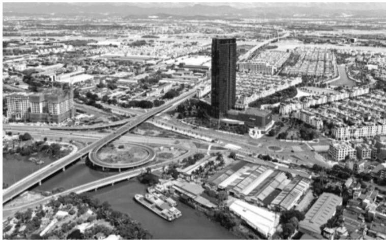
• Hải Phòng đang có những bước tiến trong công tác chuyển đổi số hướng tới TP thông minh.

có gần 1.000 doanh nghiệp công nghệ số hoạt động; gần 9.000 doanh nghiệp nhỏ và vừa sử dụng nền tảng số (đạt hơn 40%). Nhiều doanh nghiệp lớn như: Tập đoàn điện tử LG, Fuji Xerox, Haeng-sung Electronics, VinGroup... hoạt động trong lĩnh vực ICT, kinh tế số hiệu quả đã có nhiều đóng góp vào phát triển kinh tế Hải Phòng. Trong 8 tháng đầu năm 2024 đã thu hút thêm khoảng 1,5 tỷ USD đầu tư vào TP.