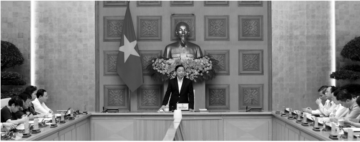
● Phó Thủ tướng Trần Hồng Hà đánh giá cao nỗ lực của các cơ quan trong triển khai thi hành 3 Luật.