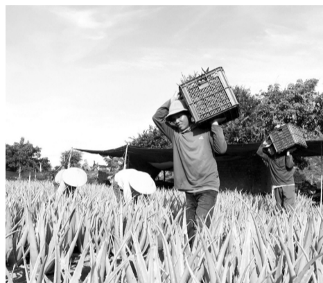
● GC Food đã xây dựng một chuỗi cung ứng khép kín với các HTX, bà con nông dân ở Ninh Thuận.

thế giới, doanh nhân này còn khát vọng tạo nên một “chuỗi thực phẩm hạnh phúc”, nơi mà sản phẩm không chỉ đơn thuần đáp ứng nhu cầu dinh dưỡng, mà còn là cầu nối giữa người tiêu dùng và nguồn nguyên liệu tự nhiên. “Chúng tôi muốn mọi người cảm nhận được giá trị từ sự bền vững, sự trân trọng mà chúng tôi dành cho môi trường và cộng đồng” ông Thứ nói.