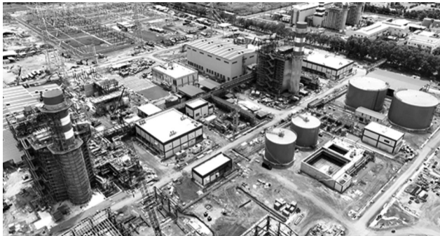
● Dự án Nhà máy điện Nhơn Trạch 3&4 sử dụng nhiên liệu khí LNG đầu tiên tại Việt Nam sắp hoàn thành.

Tập đoàn Dầu khí Việt Nam (Petrovietnam) cùng các đơn vị thành viên vừa ký kết hợp đồng mua bán điện (PPA) cho dự án Nhà máy điện Nhơn Trạch 3&4, biên bản ghi nhớ (MOU) cung cấp LNG cho dự án Nhà máy điện LNG Quảng Trạch II với Tập đoàn Điện lực Việt Nam (EVN). Đây là những hợp đồng, biên bản mang ý nghĩa quan trọng, "mở đường" cho việc đàm phán PPA các dự án điện sử dụng khí LNG khác trong Quy hoạch điện VIII.