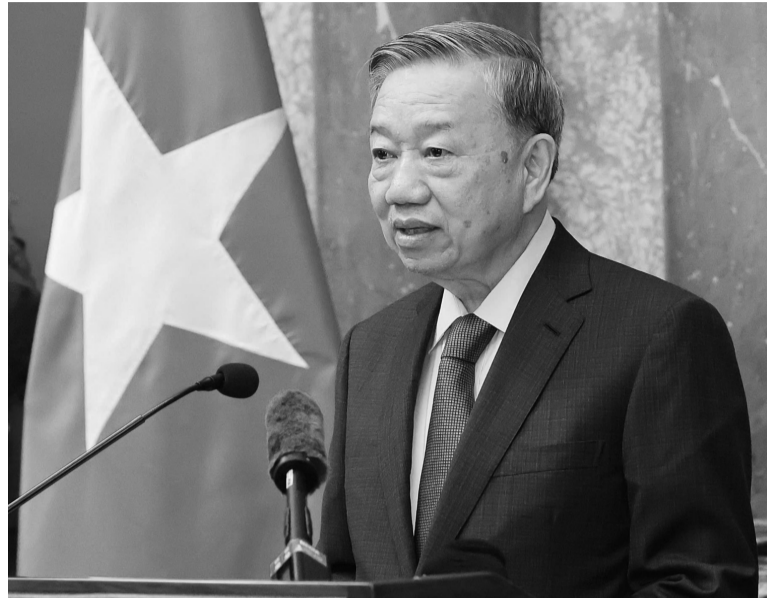
● Chiều 22/8/2024, gặp mặt Đoàn đại biểu Hiệp hội Doanh nghiệp nhỏ và vừa Việt Nam, Tổng Bí thư, Chủ tịch nước Tô Lâm đề nghị Hiệp hội thực hiện tốt chức năng của tổ chức xã hội nghề nghiệp, là cầu nối hiệu quả, đại diện cho tiếng nói, tâm tư, nguyện vọng của doanh nghiệp.