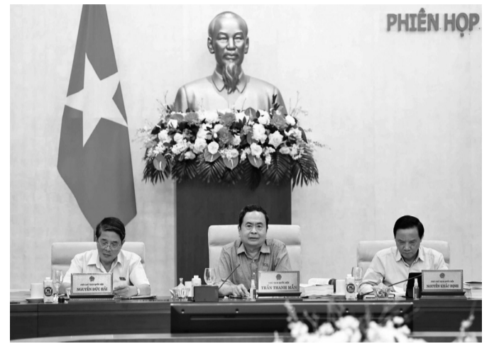
● Chủ tịch Quốc hội Trần Thanh Mẫn phát biểu tại phiên họp.