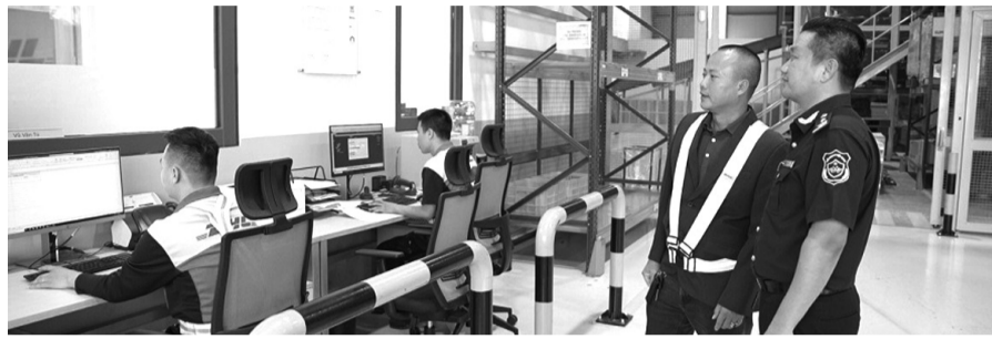
Ngành Hải quan đã triển khai nhiều giải pháp tích cực để hỗ trợ cho hoạt động của các doanh nghiệp trong lĩnh vực chuyển phát nhanh hàng hóa xuyên biên giới.