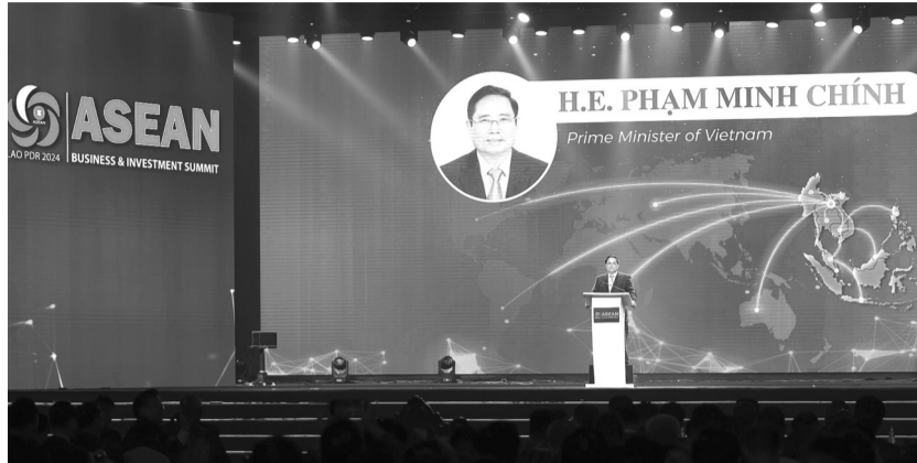
● Thủ tướng Phạm Minh Chính phát biểu tại Hội nghị Thượng đỉnh Kinh doanh và Đầu tư ASEAN 2024.

Thủ tướng Phạm Minh Chính đề nghị các doanh nghiệp, doanh nhân thực hiện “5 tiên phong”. Thứ nhất, tiên phong đóng góp cho một ASEAN tự cường, tham gia xử lý các vấn đề mới nổi, các vấn đề toàn cầu, toàn dân. Thứ hai, tiên phong thúc đẩy kết nối nền kinh tế; lấy người dân, doanh nghiệp làm trung tâm, làm chủ thể, là mục tiêu, nguồn lực, động lực phát triển. Thứ ba, tiên phong thúc đẩy phát triển khoa học công nghệ và đổi mới sáng tạo, khởi nghiệp. Thứ tư, tiên phong trong xây dựng hạ tầng chiến lược tại từng quốc gia và kết nối giữa các quốc