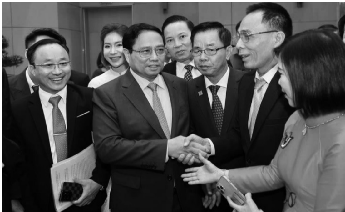
● Ngày 4/10/2024, Thủ tướng Phạm Minh Chính gặp mặt các doanh nhân nhân Ngày Doanh nhân Việt Nam.

lần Thủ tướng Phạm Minh Chính yêu cầu các thành viên Chính phủ, lãnh đạo các Bộ, ngành trong quá trình hoàn thiện các dự án luật phải xuất phát từ thực tiễn, lấy thực tiễn làm thước đo; đảm bảo hài hòa lợi ích giữa Nhà nước, người dân, DN. Gần đây, ngày