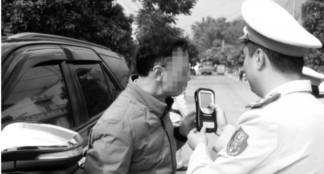
• Từ ngày 15/11/2024, bỏ quy định giám sát CSGT bằng thiết bị ghi âm, ghi hình.