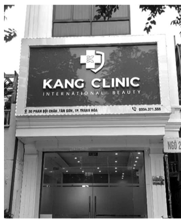
● Cơ sở Kang Clinic tại số 30 đường Phan Bội Châu, TP Thanh Hóa.

Sở Y tế cho biết, công dân xác nhận có đơn gửi đến Báo PLVN, tuy nhiên không có bản gốc tài liệu về quá trình sử dụng dịch vụ của mình tại Kang Clinic, các tài liệu nêu trong đơn được công dân chụp