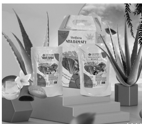
● Sản phẩm nha đam chế biến sẵn của GC Food tuân thủ tiêu chuẩn quốc tế, nên đã chinh phục nhiều thị trường khó tính.

khâu hiệu. Theo ông, khi mỗi người trong tổ chức cảm thấy có ý nghĩa và đóng góp, họ sẽ làm việc với sự sáng tạo và trách nhiệm cao hơn. Đội ngũ nhân sự của ông luôn được đào tạo và tạo cơ hội để phát triển bản thân, đồng thời nhận được sự quan tâm đặc biệt từ phía lãnh đạo. Kết quả là GC Food không chỉ duy trì được một môi trường làm việc tích cực mà còn tạo ra năng suất vượt trội trong quá trình sản xuất và kinh doanh.