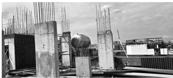
● Công trình đã xây đến mái tầng 6, có nhiều cột bê tông cốt thép chừa.