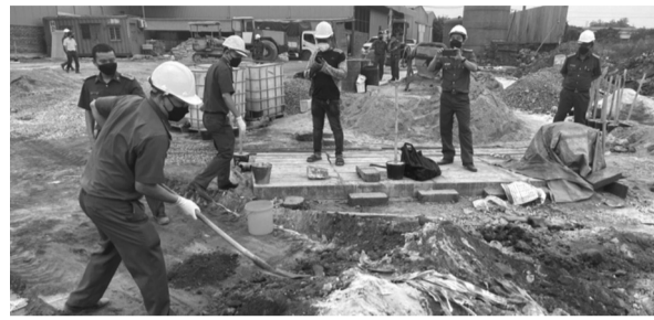
● Lực lượng công an lấy mẫu trong khuôn viên khu vực xử lý chất thải của Cty Thiên Thanh.

Cục Cảnh sát phòng, chống tội phạm về môi trường (CSPCTP/MT, Bộ Công an) phối hợp các cơ quan chức năng tỉnh Đồng Nai mới đây đã kiểm tra đột xuất, phát hiện Cty CP Môi trường Thiên Thanh (tổ 12, ấp 4, xã Vĩnh Tân, huyện Vĩnh Cửu) có hành vi chôn lấp nhiều tấn rác thải trái phép.