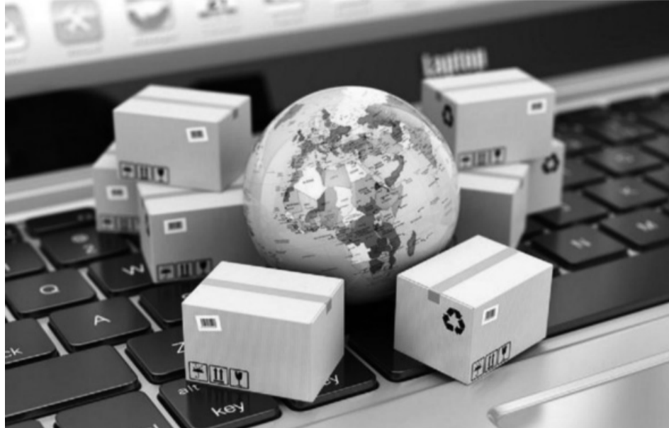
● Việt Nam có nhiều cơ hội để bứt tốc với TMĐT xuyên biên giới. (Ảnh minh họa)

Bên cạnh đó, số lượng các đối tác bán hàng Việt Nam tham gia chương trình đăng ký thương hiệu của Amazon tăng gấp 35 lần. Số lượng nhà bán hàng triệu đô đã tăng gấp 10 lần so với thời