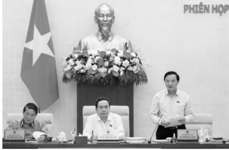
● Phó Chủ tịch Quốc hội Nguyễn Khắc Định phát biểu tại phiên họp.

Cùng ngày, UBTVQH cho ý kiến đối với Báo cáo của Chính phủ về tình hình thực hiện ngân sách nhà nước năm 2024, dự toán ngân sách nhà nước, phương án phân bổ ngân sách trung ương năm 2025; dự án Luật Đầu tư công; dự thảo Nghị quyết của QH về tổ chức chính quyền đô thị tại TP Hải Phòng.