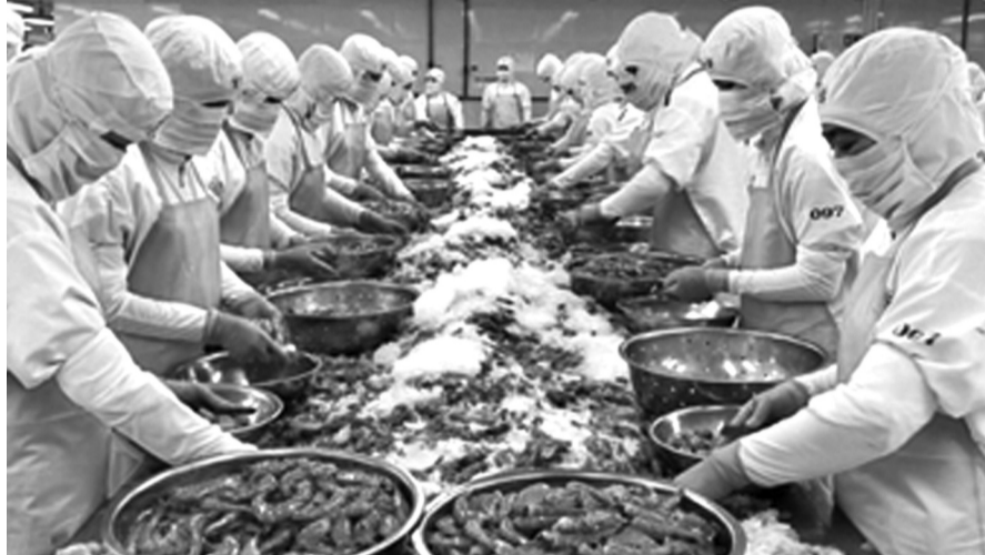
● Kiểm soát tốt dịch bệnh trong nuôi trồng thủy sản phục vụ cho xuất khẩu.