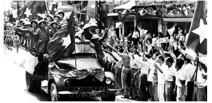
● Sáng 10/10/1954, các cánh quân của Quân đội nhân dân Việt Nam từ các cửa ô tiến vào tiếp quản Thủ đô được giải phóng trong rừng cờ hoa đón chào của 20 vạn người dân Hà Nội.

70 năm kể từ Ngày Giải phóng Thủ đô (10/10/1954), TP Hà Nội luôn phát huy truyền thống lịch sử, vươn lên mạnh mẽ, phát huy vai trò trung tâm chính trị - hành chính quốc gia, trung tâm lớn về văn hóa, khoa học, giáo dục, kinh tế và giao dịch quốc tế của cả nước, xứng đáng là Thủ đô Anh hùng của dân tộc Việt Nam Anh hùng.