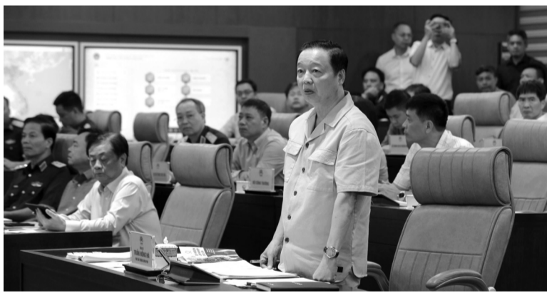
● Phó Thủ tướng Trần Hồng Hà yêu cầu tiếp tục đầu tư nâng cấp bảo đảm hệ thống thông tin chỉ đạo điều hành.

Từ diễn biến của cơn bão số 3 (Yagi) vừa qua, Phó Thủ tướng nhấn mạnh yêu cầu bảo đảm