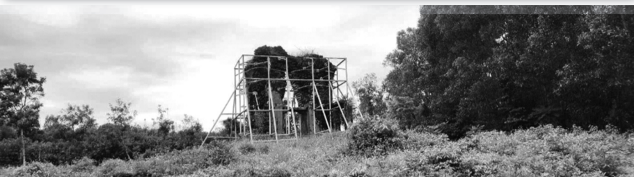
● Di tích quốc gia đặc biệt Phật viện Đồng Dương hiện chỉ còn tháp Sáng đang được chống đỡ, tránh đổ sập.

Theo đó, thực hiện nghị quyết của Quốc hội, Chính phủ, Bộ VH,TT&DL đã xây dựng Chương trình mục tiêu quốc gia về phát triển văn hóa giai đoạn 2025 - 2035. Bộ đã có Tờ trình 444 báo cáo Quốc hội xem xét, dự kiến thông qua tại Kỳ họp thứ 8. Trong đó có nội dung dự án thành phần về bảo tồn, phát huy các giá trị di sản văn hóa. Trong thời gian tới, sau khi chương trình được cấp có thẩm quyền phê duyệt, trên cơ sở đề xuất của các địa phương, Bộ VH,TT&DL sẽ phối hợp các Bộ KH&ĐT, Tài chính tổng hợp danh mục các dự án đầu tư để bảo tồn, phát huy giá trị các di sản văn hóa.