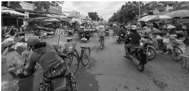
● Một chợ tự phát đông đúc vào giờ tan tầm gây ách tắc giao thông.

phát không chỉ làm mất mỹ quan đô thị mà còn tạo nên nhiều hệ lụy, như tình trạng ùn tắc giao thông, vệ sinh môi trường... Nhiều tuyến đường thành phố tắc nghẽn mỗi khi các chợ tự phát hình thành vào giờ tan tầm, người mua sắm dừng xe giữa đường để mua hàng khiến giao thông đình trệ. Không chỉ thế, hoạt động kinh doanh tự phát quanh chợ truyền thống còn tạo ra sự cạnh tranh không công bằng với những người kinh doanh hợp pháp bên trong chợ. Việc buôn bán không chịu sự kiểm soát của pháp luật khiến các mặt hàng tại chợ tự phát thường không rõ nguồn gốc, kém chất lượng, thậm chí vi phạm các quy định về an toàn thực phẩm.