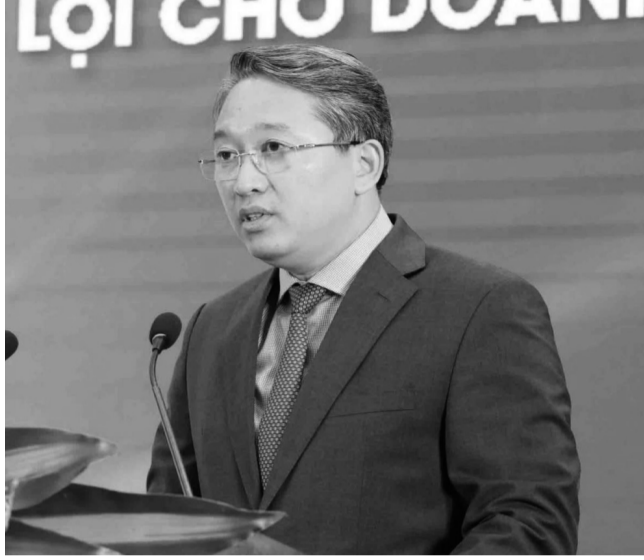
● Bộ trưởng Nguyễn Hải Ninh phát biểu khai mạc Diễn đàn.

Thay mặt Hội đồng phối hợp PBGDPL Trung ương, phát biểu khai mạc Diễn đàn Kinh doanh và Pháp luật năm 2024, Ủy viên Trung ương Đảng, Bộ trưởng Bộ Tư pháp Nguyễn Hải Ninh, Phó Chủ tịch Thường trực Hội đồng cho biết: Tại Diễn đàn năm nay, đã có 117 ý kiến về những vấn đề pháp lý đặt ra đối với DN. Trên cơ sở đó, các Bộ, ngành đã có báo cáo rà soát về việc giải quyết các vấn đề pháp lý mà DN đề cập.