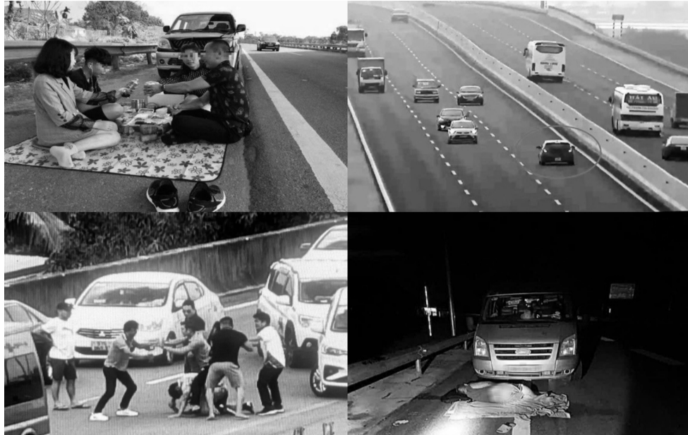
● Những hành vi thiếu ý thức, thiếu trách nhiệm của người điều khiển phương tiện.

Đội Tuần tra, kiểm soát giao thông đường bộ cao tốc số 6 ra quyết định xử phạt nam tài xế về lỗi không bằng lái ô tô, dừng xe không đúng quy định trên cao tốc