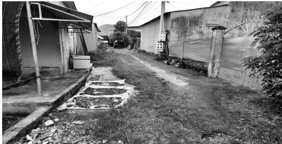
● UBND thị xã cho biết con đường có nguồn gốc do chủ đất trước đây làm đường đi chung cho các hộ dân, không phải đất công do Nhà nước quản lý.

Ngày 15/10/2021, TAND tỉnh đưa vụ kiện ra xét xử sơ thẩm. Theo HĐXX, cuối 2014, nhà bà Hương nhận chuyển nhượng 657m 2 đất. Đầu 2015, nhà bà Hương được cấp Sổ đỏ BX 971587. Phần đất này nằm đối diện đất của ông Thái. Năm 2016 nhà bà Hương xây nhà trên đất. Tháng 3/2017, Nhà nước thu hồi 186,8m 2 đất của nhà bà Hương làm đường. Vì phần thu hồi nằm giữa thửa đất nên phần đất hai bên còn lại của nhà bà Hương đổi thành thửa 394 và 395. Tháng 10/2017, nhà bà