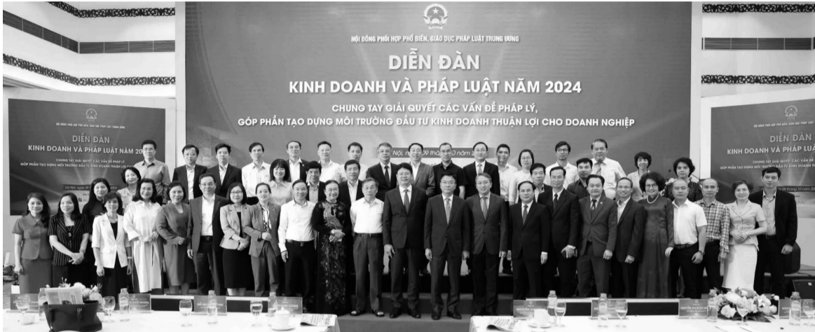
● Phó Thủ tướng Lê Thành Long và các đại biểu chụp ảnh lưu niệm.

Phát biểu chỉ đạo Diễn đàn Kinh doanh và Pháp luật 2024, Ủy viên Trung ương Đảng, Phó Thủ tướng Chính phủ Lê Thành Long khẳng định, chúng ta đã cố gắng thúc đẩy phát triển kinh tế - xã hội và chắc chắn trong thành tích này có sự đóng góp của thể chế.