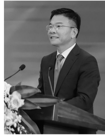
● Phó Thủ tướng Lê Thành Long phát biểu chỉ đạo Diễn đàn.

Nêu một số kết quả đạt được trong phát triển kinh tế - xã hội, Phó Thủ tướng cho biết, tăng trưởng GDP 9 tháng năm 2024 đạt 6,82%; cơ cấu kinh tế chuyển dịch tích cực, công nghiệp chế biến, chế tạo tăng 11,41%; thu ngân sách nhà nước tăng mạnh, tăng 17,9% so với cùng kỳ. Từ đó, có thể thấy rằng chúng ta đã cố gắng thúc đẩy phát triển kinh tế - xã hội và chắc chắn trong thành tích này có sự đóng góp của thể chế.