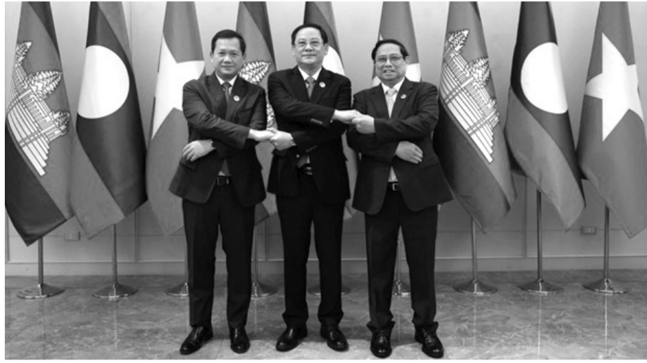
● Thủ tướng Campuchia Samdech Thipadei Hun Manet, Thủ tướng Lào Sonexay Siphandone và Thủ tướng Chính phủ Phạm Minh Chính.

Ba bên nhất trí chung tay tăng cường hợp tác đảm bảo an ninh, an toàn, trật tự ở khu vực biên giới, đặc biệt là vùng tiếp giáp ba nước; thúc đẩy hợp tác phát triển ở khu vực biên giới, trong đó chú trọng phát huy hiệu quả hệ thống cửa khẩu trên đất liền giữa ba nước; đẩy mạnh kết nối cơ sở hạ tầng, giao thông vận tải, liên kết kinh