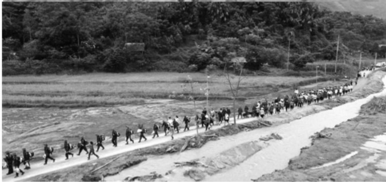
● Người dân Làng Nũ chia tay CBCS TD 98 về đơn vị.