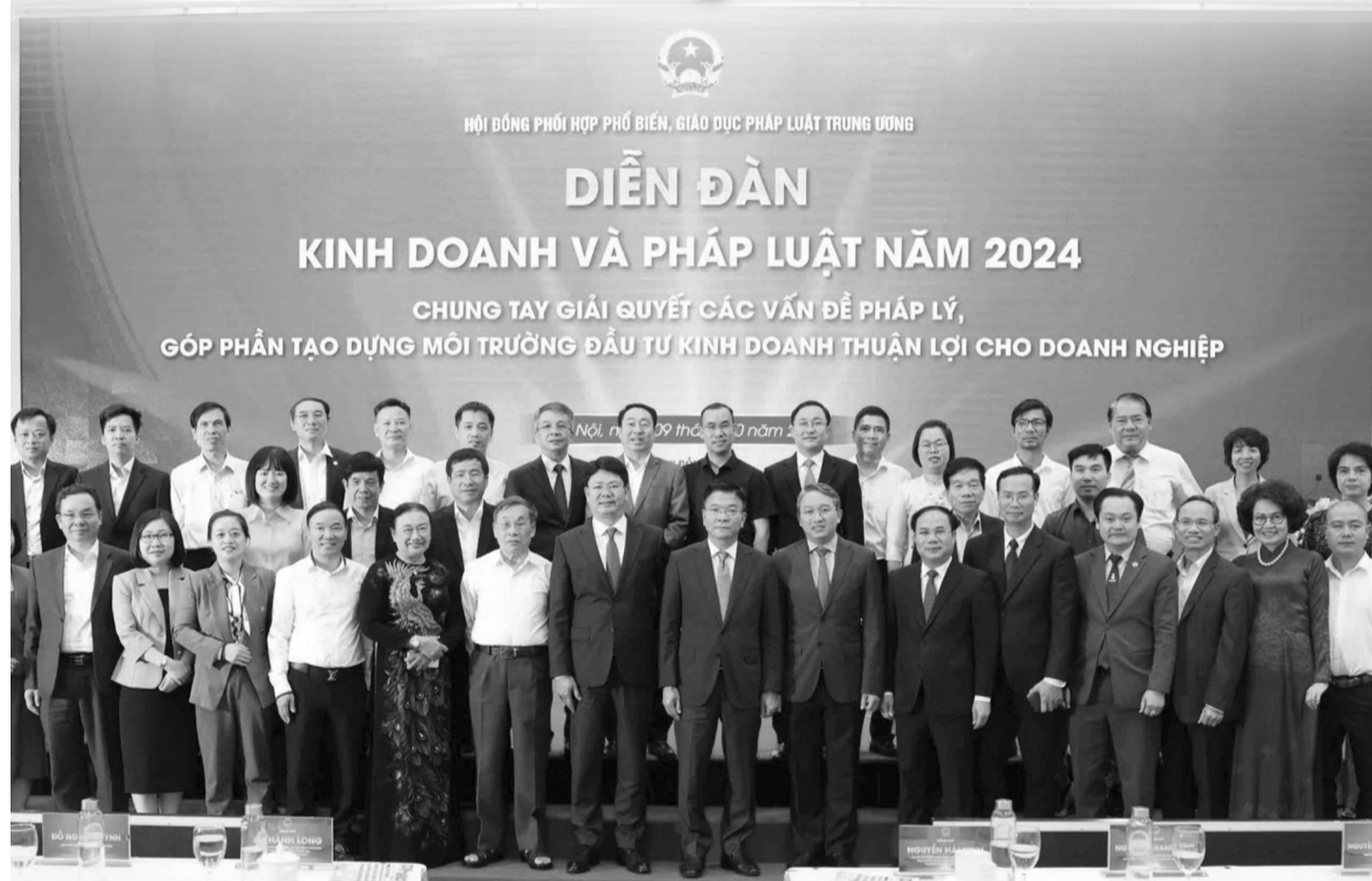
● Phó Thủ tướng Lê Thành Long và các đại biểu chụp ảnh lưu niệm.

Phát biểu chỉ đạo Diễn đàn Kinh doanh và Pháp luật 2024, Ủy viên Trung ương Đảng, Phó Thủ tướng Chính phủ Lê Thành Long khẳng định, chúng ta đã cố gắng thúc đẩy phát triển kinh tế - xã hội và chắc chắn trong thành tích này có sự đóng góp của thế chế.