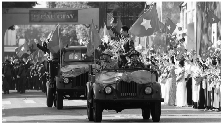
● Tái hiện hình ảnh Thị trưởng Hà Nội, bác sĩ Trần Duy Hưng trên xe dẫn đầu Đoàn quân Giải phóng tiến vào Hà Nội ngày 10/10/1954 trong sự hân hoan, chào đón của người dân Thủ đô tại chương trình "Ngày hội Văn hóa vì hòa bình" kỷ niệm 70 năm Giải phóng Thủ đô tại Hà Nội ngày 6/10 vừa qua.

Tốt nghiệp Đại học Y với thành tích xuất sắc, năm 1942, ở tuổi 30, ông cùng em gái mở một phòng khám tư tại số 6 phố Bông Nhộm. Phòng khám đông khách bởi không chỉ nổi tiếng về chuyên môn giỏi, bác sĩ Trần Duy Hưng còn được đồng nghiệp và Nhân dân yêu quý, kính trọng bởi đức độ của một người thầy thuốc sẵn sàng cứu mạng, chữa bệnh miễn phí cho những người nghèo. Phòng khám cũng là nơi cung cấp thuốc