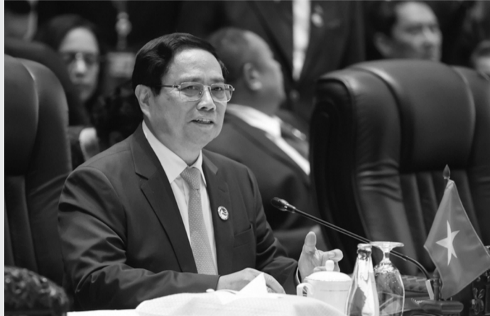
● Thủ tướng Phạm Minh Chính phát biểu tại phiên họp toàn thể Hội nghị Cấp cao ASEAN.

Sáng 9/10, Hội nghị Cấp cao ASEAN lần thứ 44, 45 và các Hội nghị liên quan đã khai mạc trọng thể tại Trung tâm Hội nghị Quốc gia, Thủ đô Vientiane, Cộng hòa Dân chủ Nhân dân Lào, với sự tham dự của Lãnh đạo các nước ASEAN, Timor-Leste cùng nhiều đại diện đối tác, tổ chức quốc tế và khu vực. Thủ tướng Phạm Minh Chính dẫn đầu Đoàn đại biểu cấp cao Việt Nam tham dự Lễ khai mạc.