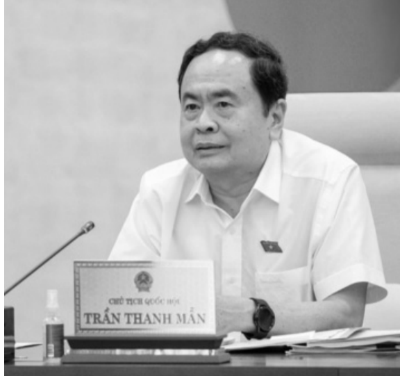
● Chủ tịch Quốc hội Trần Thanh Mẫn phát biểu tại phiên họp.

Chính phủ đề xuất bổ sung quy định về thủ tục đầu tư đặc biệt nhằm đơn giản hóa thủ tục đầu tư, rút ngắn thời gian triển khai dự án để tạo cơ chế thuận lợi, cạnh tranh nhằm thu hút các nhà đầu tư chiến lược.