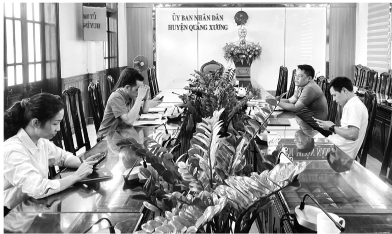
● PV PLVN làm việc với đại diện UBND huyện Quảng Xương.

Dự án được cấp giấy chứng nhận đầu tư đầu tiên vào 2008, đến nay sau nhiều lần điều chỉnh quy hoạch và gia hạn, vẫn gần như “án binh bất động”. Theo ghi nhận, nhiều khu vực của dự án mọc cỏ dại, nhiều ngôi nhà trong khuôn viên dự án chưa được giải phóng mặt bằng (GPMB). Dự án mới xây dựng một khu quảng trường, một số nhà hàng, nhà nghỉ.