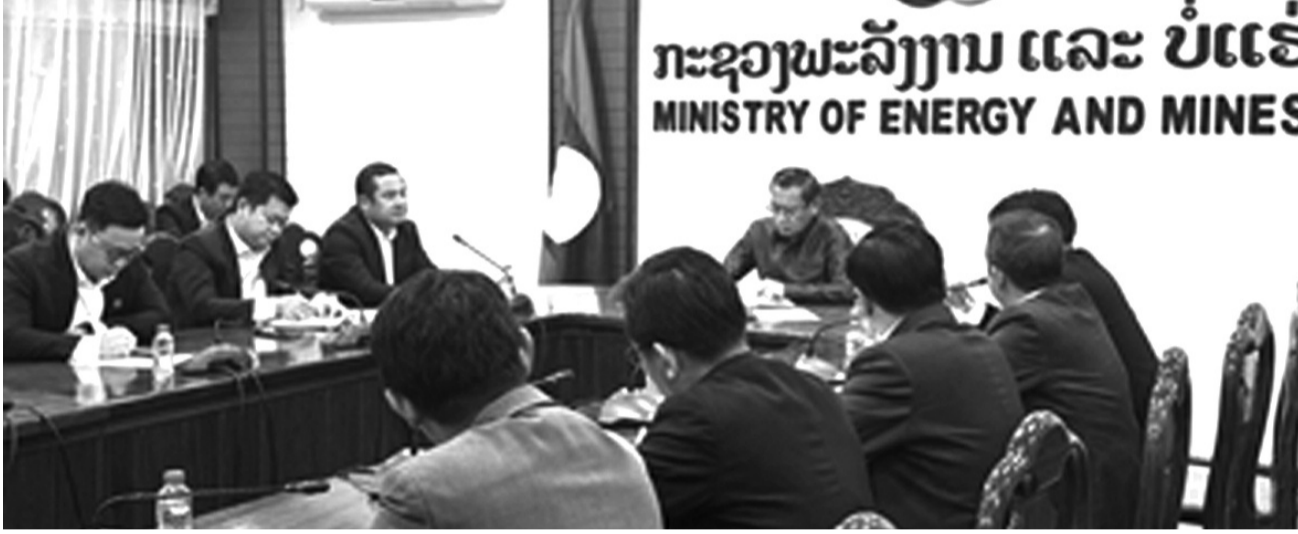
● Bộ trưởng Bộ Năng lượng và Mỏ Lào làm việc với Đoàn công tác của Vinachem.