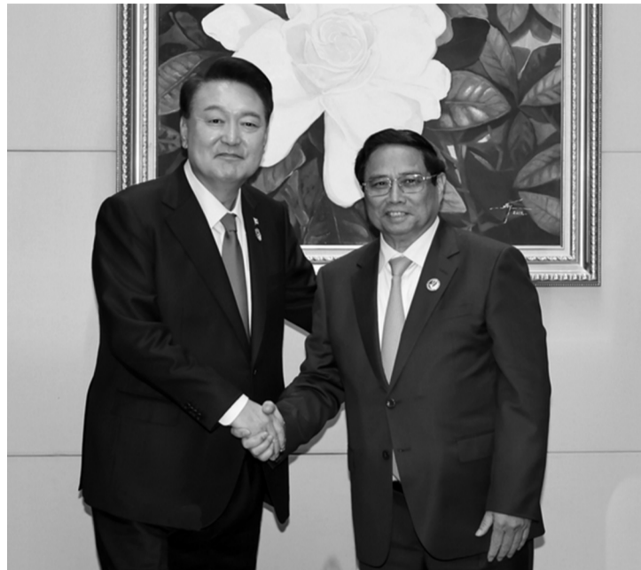
● Thủ tướng Phạm Minh Chính khẳng định, Việt Nam sẽ tiếp tục tạo điều kiện thuận lợi cho các nhà đầu tư Hàn Quốc làm ăn lâu dài ở Việt Nam.