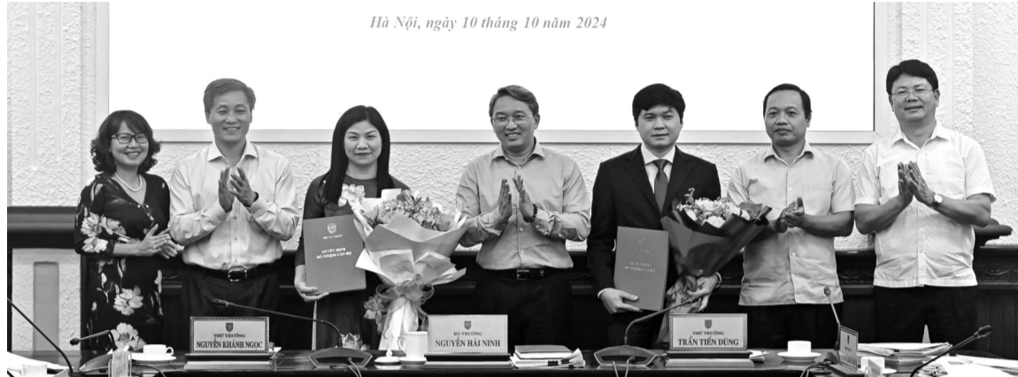
● Lãnh đạo Bộ Tư pháp chúc mừng 02 đồng chí vừa được bổ nhiệm.