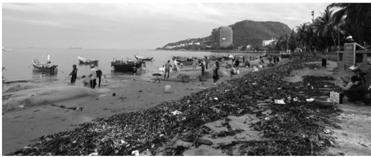
● Rác trôi dạt vào bờ biển Vũng Tàu.