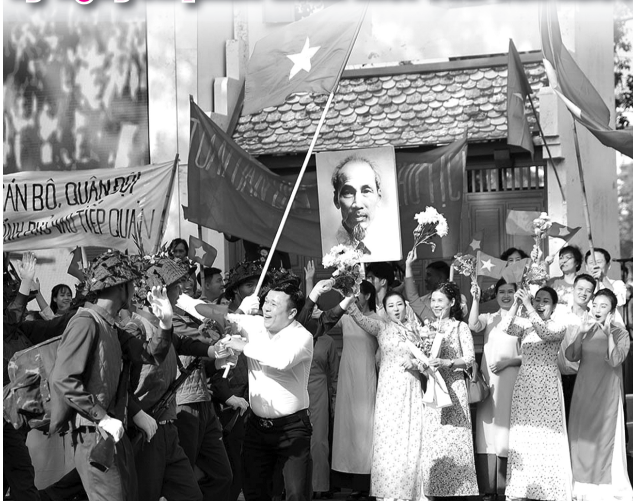
● Tái hiện cảnh các tầng lớp nhân dân chào đón đoàn quân chiến thắng trở về.

Sáng 10/10, Ban Chấp hành Trung ương Đảng Cộng sản Việt Nam, Quốc hội, Chủ tịch nước, Chính phủ nước Cộng hòa XHCN Việt Nam, Ủy ban Trung ương Mặt trận Tổ quốc Việt Nam và TP Hà Nội tổ chức trọng thể Lễ kỷ niệm cấp quốc gia 70 năm Ngày Giải phóng Thủ đô (10/10/1954 - 10/10/2024).