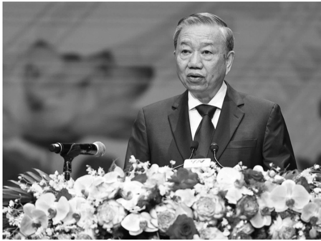
● Tổng Bí thư, Chủ tịch nước Tô Lâm đọc diễn văn tại Lễ kỷ niệm.

Sáng 10/10, Ban Chấp hành Trung ương Đảng Cộng sản Việt Nam, Quốc hội, Chủ tịch nước, Chính phủ nước Cộng hòa XHCN Việt Nam, Ủy ban Trung ương Mặt trận Tổ quốc Việt Nam và TP Hà Nội tổ chức trọng thể Lễ kỷ niệm cấp quốc gia 70 năm Ngày Giải phóng Thủ đô (10/10/1954 - 10/10/2024).