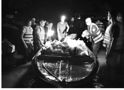
● Đường phố ngập sâu, lực lượng chức năng phải dùng thuyền vận chuyển nhu yếu phẩm.