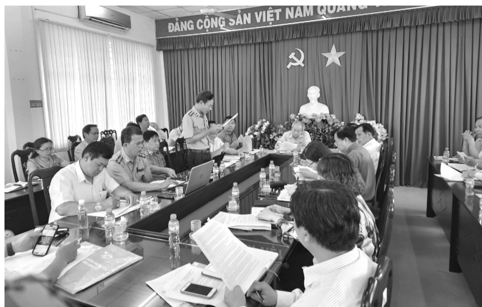
● Đoàn giám sát HĐND tỉnh Long An làm việc với Ban chỉ đạo THADS huyện Thủ Thừa.

Nguyên nhân là do phần lớn những bản án hành chính trên địa bàn chủ yếu liên quan đến đất đai, đây là lĩnh vực vốn phức