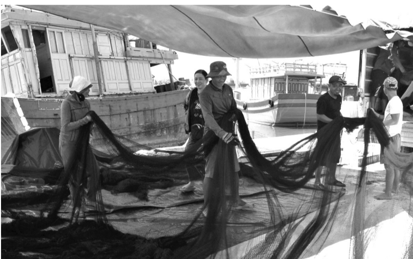
● Ngư dân Quảng Nam chuẩn bị ngư cụ để ra khơi.