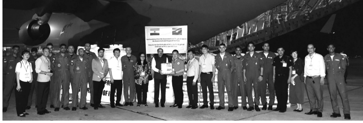
● Đại diện tỉnh Tuyên Quang tiếp nhận chuyển hàng viện trợ của Chính phủ Ấn Độ tại sân bay Nội Bài.