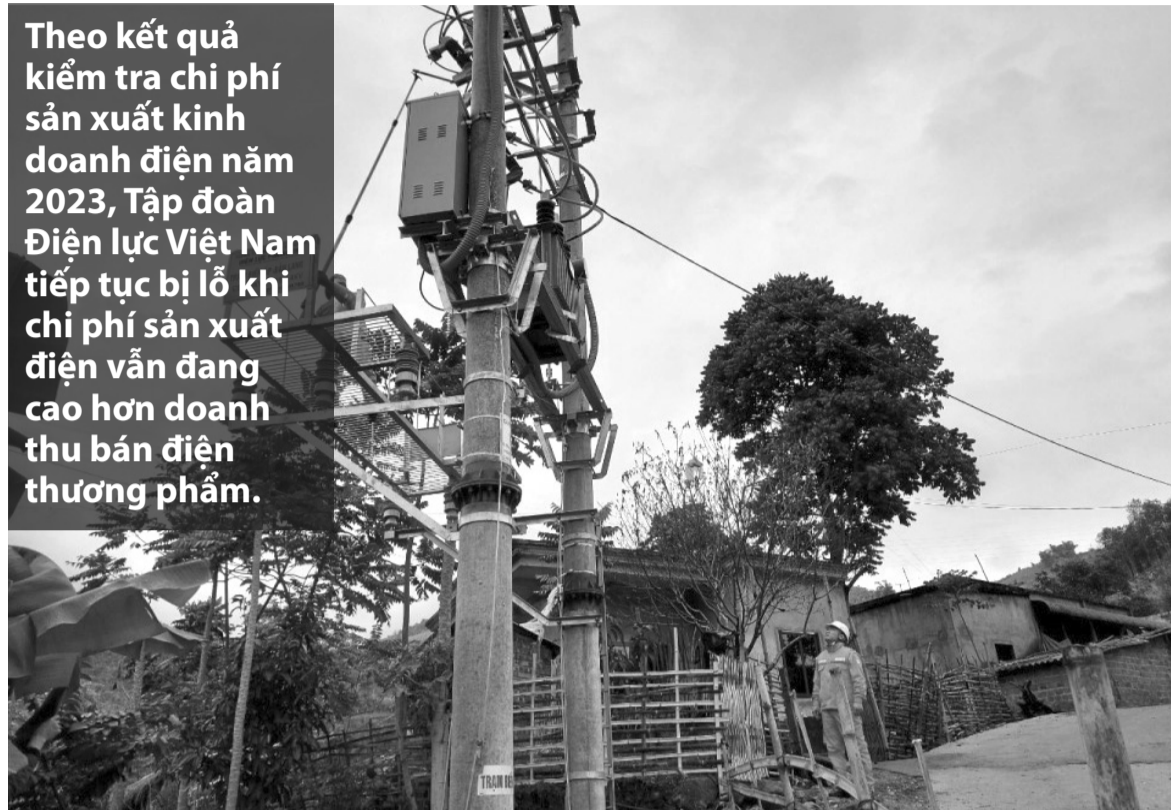
● Chi phí sản xuất điện tiếp tục tăng khiến EVN thua lỗ. (Ảnh: EVN)

Theo kết quả kiểm tra chi phí sản xuất kinh doanh điện năm 2023, Tập đoàn Điện lực Việt Nam tiếp tục bị lỗ khi chi phí sản xuất điện vẫn đang cao hơn doanh thu bán điện thương phẩm.