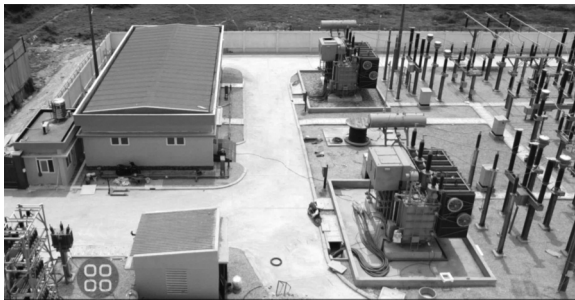
● Tân Uyên đã bàn giao khu đất cho đơn vị thi công xây dựng trạm biến áp 110kV Khánh Vân và đường dây đầu nối.