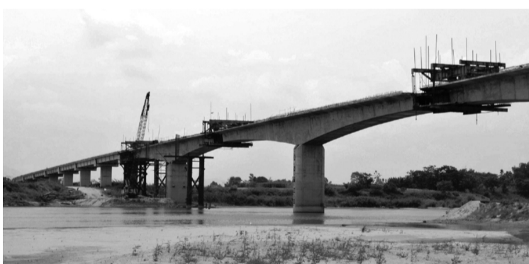
● Một số dự án chậm tiến độ khiến tỷ lệ giải ngân vốn đầu tư công ở Quảng Nam còn thấp.

phương. Đồng thời, kiểm tra, kiểm soát nghiêm ngặt chống đầu cơ, "thời giá", nâng giá với vật liệu xây dựng. Thời gian tới ngành chức năng vào cuộc nghiêm, nếu phát hiện Cty nào khai thác cát sỏi gian dối, mua bán hóa đơn, in hóa đơn giá thấp, bán giá cao, đề nghị UBND tỉnh thu hồi giấy phép.