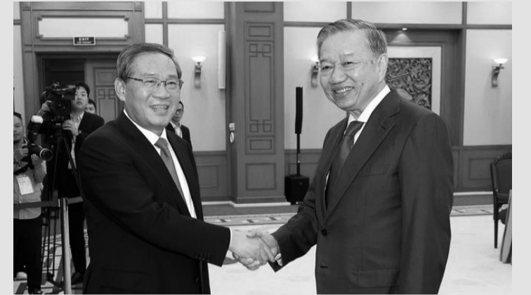
● Tổng Bí thư, Chủ tịch nước Tô Lâm hội kiến Thủ tướng Quốc vụ viện Trung Quốc Lý Cường.

Trước đó, tối 12/10, tại Trụ sở Trung ương Đảng, Tổng Bí thư, Chủ tịch nước Tô Lâm đã hội kiến với Thủ tướng Quốc vụ viện Trung Quốc Lý Cường, nhân dịp Thủ tướng Lý Cường sang thăm chính thức Việt Nam.