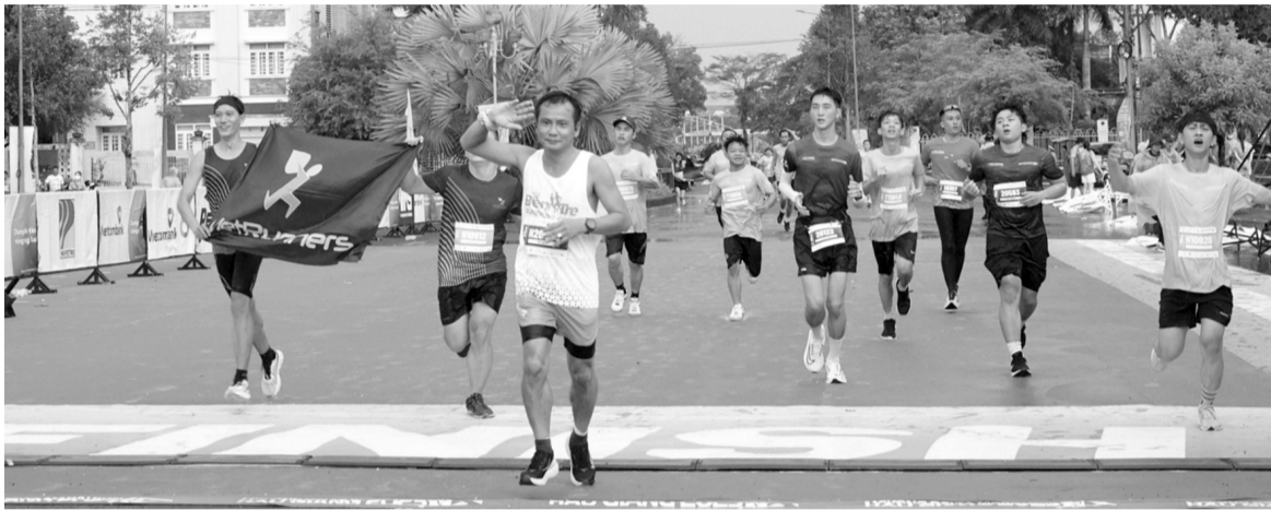
● Giải chạy thu hút hàng ngàn vận động viên trong nước và quốc tế tham gia.

Sau 5 lần tổ chức, Giải chạy Mekong Delta Marathon đã tạo dấu ấn riêng, điểm nhấn đặc biệt cho tỉnh Hậu Giang. Giải chạy vừa thúc đẩy tinh thần rèn luyện thể thao vừa góp phần quảng bá, giới thiệu hình ảnh Hậu Giang với đông đảo du khách. Qua đó, gợi mở nhiều cơ hội hợp tác, góp phần thúc đẩy Hậu Giang phát triển.