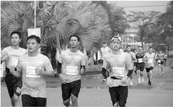
● Các cung đường chạy được chứng nhận đạt chuẩn quốc tế.