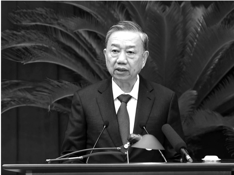
● Tổng Bí thư, Chủ tịch nước Tô Lâm.

Bên cạnh kết quả, lãng phí còn diễn ra khá phổ biến, dưới nhiều dạng thức khác nhau, đã và đang gây ra nhiều hệ lụy nghiêm trọng cho phát triển. Trong đó, gây suy giảm nguồn lực con người, nguồn lực tài chính, giảm hiệu quả sản xuất, tăng gánh nặng chi phí, gây cạn kiệt tài nguyên, gia tăng khoảng cách giàu - nghèo. Hơn thế, lãng phí còn gây suy giảm lòng tin của người dân với