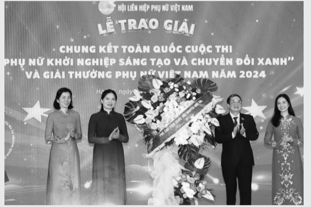
● Ủy viên TƯ Đảng, Phó Chủ tịch Quốc hội Nguyễn Đức Hải tặng hoa chúc mừng Đoàn Chủ tịch Trung ương Hội LHPN Việt Nam nhân Ngày Phụ nữ Việt Nam (20/10) và kỷ niệm 94 năm thành lập Hội LHPN Việt Nam (1930 - 2024).