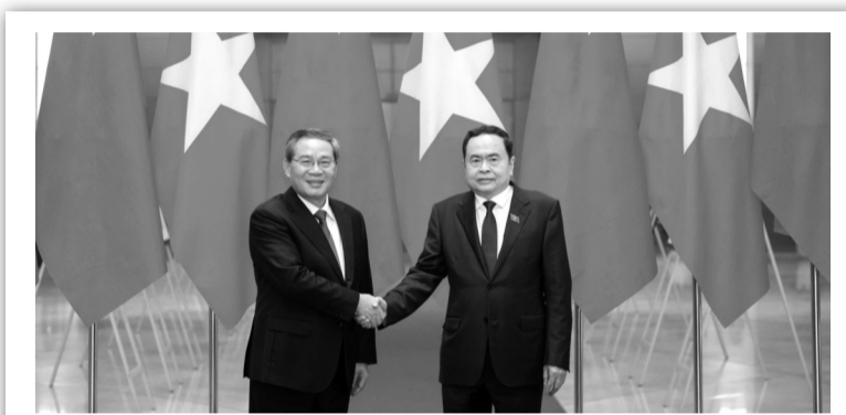
● Chủ tịch Quốc hội Trần Thanh Mẫn hội kiến Thủ tướng Quốc vụ viện Trung Quốc Lý Cường.

Về hợp tác trong thời gian tới, hai Thủ tướng nhất trí triển khai hiệu quả các nhận thức chung của Lãnh đạo cấp cao nhất của hai Đảng, hai nước; tiếp tục củng cố tin cậy chính trị, duy trì thường xuyên gặp gỡ cấp cao và các cấp; đẩy mạnh cơ chế giao lưu, hợp tác, nhất là trong lĩnh vực ngoại giao - quốc phòng - công an; thúc đẩy hợp tác thực chất trên các lĩnh vực trọng tâm, tăng cường giao lưu nhân dân, củng cố nền tảng xã hội vững chắc cho sự phát triển của quan hệ Việt - Trung. Đồng thời, tiếp tục hợp tác chặt chẽ và