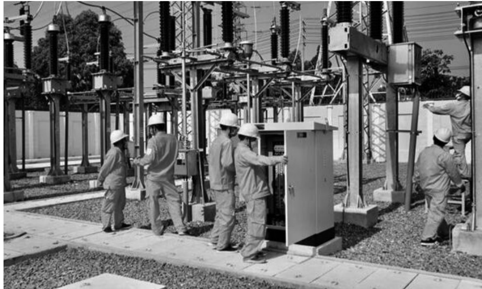
● Chi phí sản xuất điện tăng cao. (Ảnh minh họa: EVN)

Với khách hàng sử dụng điện từ 301 - 400kWh (chiếm khoảng 8,87%), mức tăng tiền điện khoảng 47.050 đồng/hộ/tháng. Mức tăng tiền điện cao