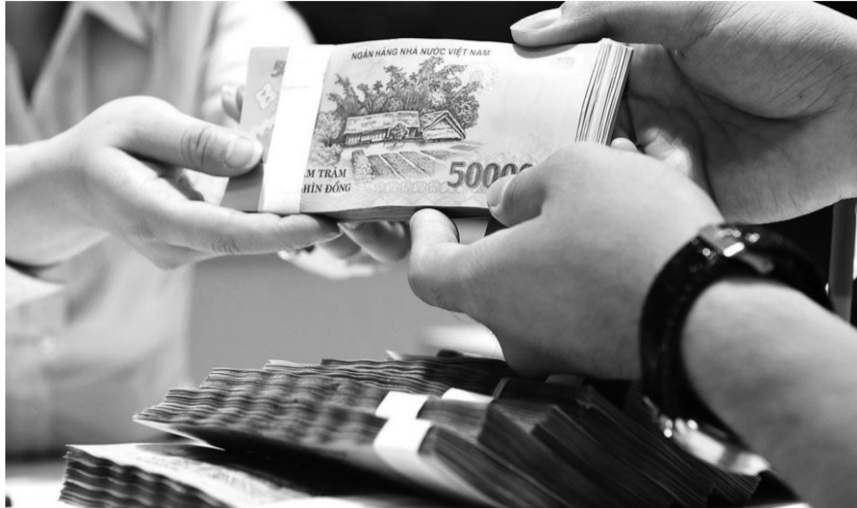
● Cần nhiều giải pháp để doanh nghiệp sớm tiếp cận được vốn vay. (Ảnh minh họa)

Theo phản ánh của hầu hết DN, vốn ưu đãi dành cho DN hiện rất khó tiếp cận. Chưa kể, DN trong nước rất khó cạnh tranh với DN nước ngoài. Bởi lợi