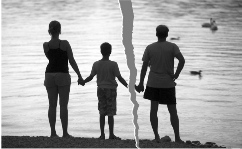
● Yêu nhanh, cưới vội, mang thai ngoài ý muốn để lại hệ quả khôn lường cho chính người trong cuộc và thế hệ sau. (Ảnh minh họa)

Mới đây, vụ việc bé trai 6 tuổi bị cha ruột tạt nước sôi, hành hạ khiến bé bị bỏng nặng, nhập viện với nhiều vết thương nghiêm trọng đã khiến dư luận phẫn nộ. Đằng sau câu chuyện bạo hành, còn có một góc khuất khác cần quan tâm đến, đó là sự thiếu trách nhiệm trong việc yêu đương, sinh con của một bộ phận người trẻ.