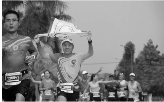
● Các vận động viên thích thú với những trải nghiệm mới mẻ, hấp dẫn khi tham gia giải chạy.

Với tinh thần “Đổi mới, đột phá, quyết tâm, khát vọng”, Hậu Giang đang tận dụng “thời kỳ vàng” phát huy nội lực, hiện thực hóa khát vọng đưa tỉnh nhà phát triển nhanh, bền vững, toàn diện. Nhiều năm qua, du khách và bạn bè quốc tế biết nhiều hơn về Hậu Giang thông qua giải chạy Mekong Delta Marathon. Với cách làm mới mẻ, sáng tạo, Hậu Giang đã tạo sân chơi cho các vận động viên, thúc đẩy phong trào tập luyện thể dục thể thao, đồng thời giới thiệu, quảng bá hình ảnh đất và người Hậu Giang đến bạn bè trong nước và quốc tế. Không dừng lại ở đó, thông qua Giải chạy còn truyền tải nhiều thông điệp tuyên truyền ý nghĩa, nâng cao nhận thức và ý thức của người dân. Mỗi mùa giải lại có thêm nhiều cây xanh được trồng trên “Tuyến đường xanh Mekong Delta Marathon”. Đến nay đã có 428 cây gồm các loại: Sao đen, Măng cụt, Còng Singapore (Me tây), Lộc Vừng, Lộc Vừng lá nhỏ... được trồng với thông điệp “Chống biến đổi khí hậu”.