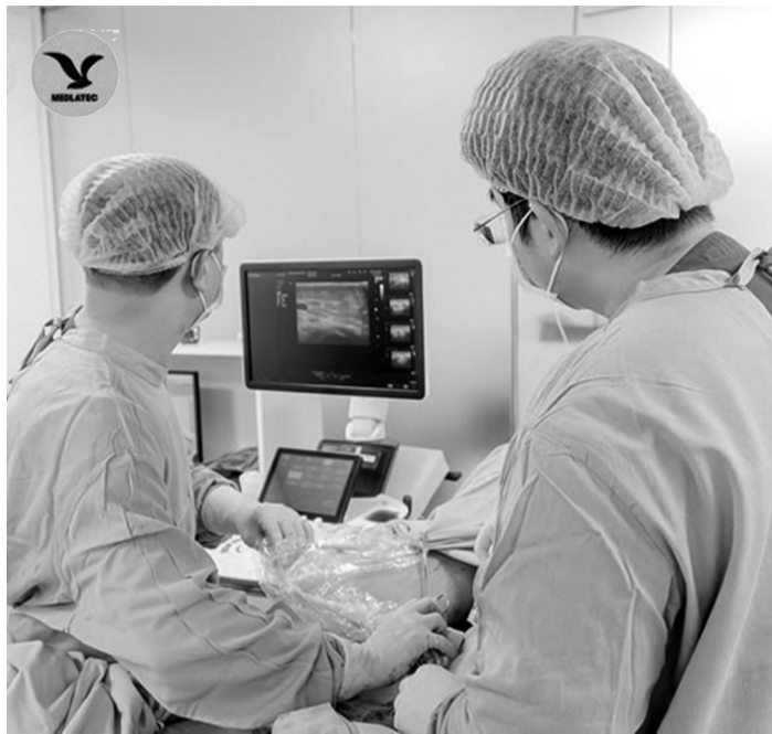
● Ekip bác sĩ thực hiện thủ thuật can thiệp 2 chi với đầu đốt laser.