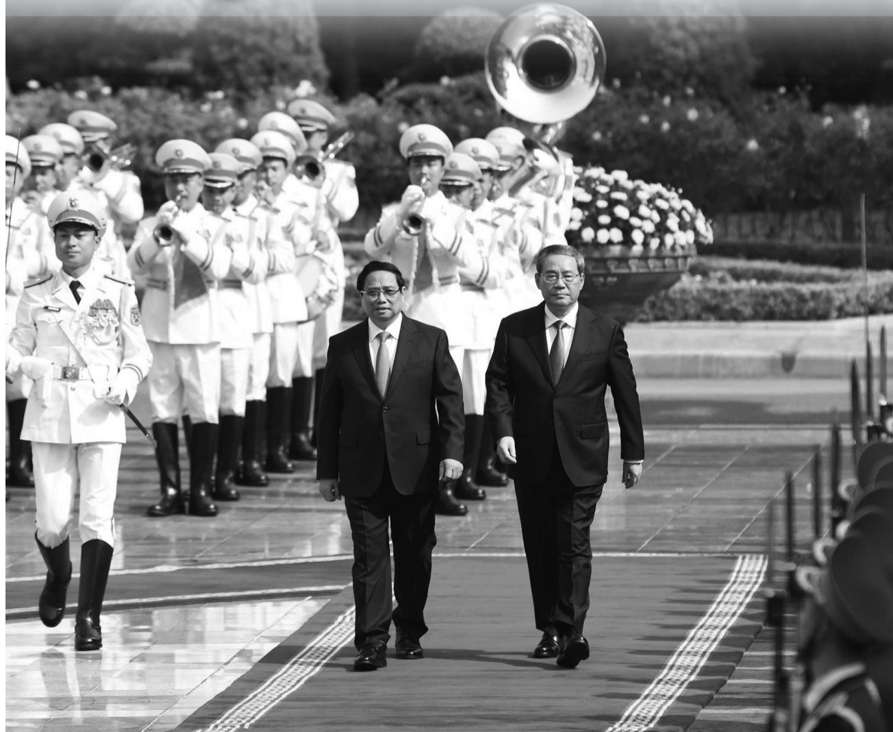
● Thủ tướng Phạm Minh Chính và Thủ tướng Trung Quốc Lý Cường duyệt Đội danh dự Quân đội nhân dân Việt Nam.