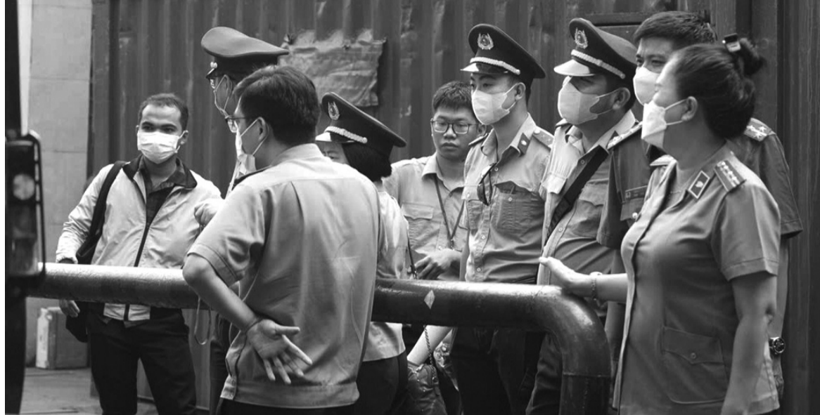
● Cưỡng chế THADS ở TP Hồ Chí Minh.

Xây dựng dự thảo Luật Thi hành án dân sự (sửa đổi), Bộ Tư pháp đề nghị chấp hành viên được áp dụng một hoặc nhiều biện pháp cưỡng chế nhằm tạo sự linh hoạt, chủ động cho chấp hành viên trong việc lựa chọn các biện pháp cưỡng chế phù hợp, nâng cao hiệu quả tổ chức thi hành án.