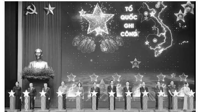
● Ngày 23/7/2024, Ngân hàng gene liệt sĩ chưa xác định thông tin đã được kích hoạt.

Đất nước đã thống nhất 50 năm nhưng cho đến nay vẫn có hàng nghìn gia đình liệt sĩ đau đầu nỗi niềm tìm kiếm và đưa người thân trở về quê nhà. Theo thông tin từ Công an TP Hà Nội, hiện nay, Hà Nội vẫn còn khoảng 87.000 hài cốt liệt sĩ chưa xác định được thông tin, danh tính. Việc thu mẫu ADN để "tra danh tính, nối người thân" đang là một yêu cầu khẩn trương, thể hiện sự tri ân, ý nghĩa nhân văn, tỏ lòng biết ơn với những người đã hy sinh cho Tổ quốc.