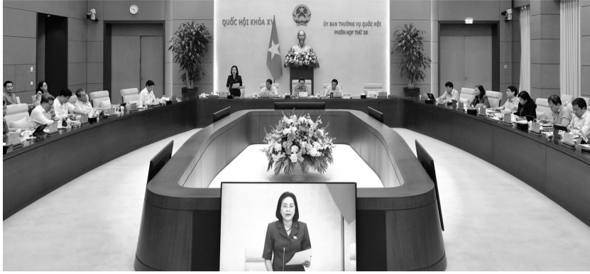
● Tại Phiên họp thứ 38 vừa qua, Ủy ban Thường vụ Quốc hội đã cho ý kiến (lần 2) về dự án Luật Nhà giáo. (Ảnh: quochoi.vn)

Kết luận nêu rõ, UBTVQH thống nhất về sự cần thiết xây dựng Luật Nhà giáo. Hồ sơ dự án Luật cơ bản đủ điều kiện trình Quốc hội xem xét cho ý kiến tại Kỳ họp thứ 8. Về các chính sách đối với nhà giáo, UBTVQH yêu cầu tiếp tục rà soát, hoàn thiện các chính sách đối với nhà giáo theo hướng thận trọng, nhất quán, khả thi, có sự đột phá; bảo đảm các khung chính sách của Nhà nước về nhà giáo được cụ thể hóa đầy đủ. Đánh giá kỹ lưỡng hơn tác động của những chính sách mới, nhất là việc bảo đảm các