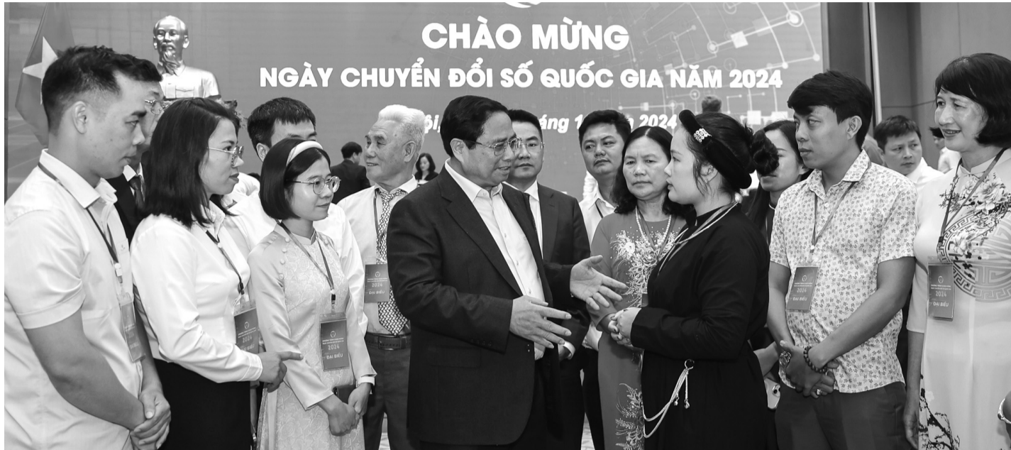
● Thủ tướng Phạm Minh Chính trao đổi với các đại biểu dự chương trình.

Vấn đề trên được Thủ tướng Phạm Minh Chính, Chủ tịch Ủy ban Quốc gia về chuyển đổi số nhấn mạnh khi chủ trì chương trình chào mừng Ngày Chuyển đổi số quốc gia năm 2024, diễn ra cuối tuần qua.