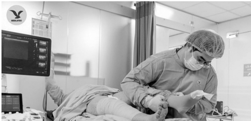
● Sau khi kết thúc quá trình đốt laser, bệnh nhân được bác sĩ đeo vớ tĩnh mạch.

Điều trị suy giãn tĩnh mạch bằng laser có ưu điểm như nhanh chóng, ít xâm lấn, không gây đau đớn, không để lại sẹo, tỷ lệ thành công cao, đặc biệt người bệnh có thể ra về ngay trong ngày mà không cần lưu viện... Bằng công nghệ hiện đại này, Bệnh viện Đa khoa MEDLATEC điều trị thành công ca suy giãn tĩnh mạch phức tạp.