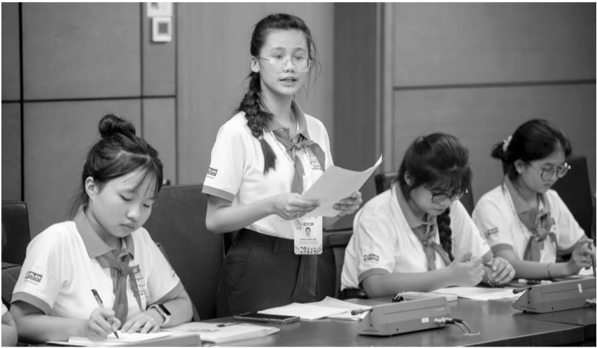
● Các đại biểu trẻ em tại phiên thảo luận Tổ.