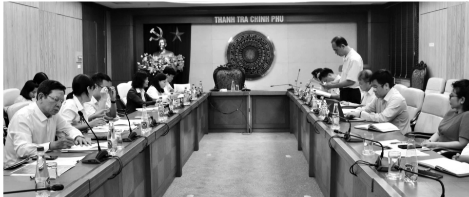
● Toàn cảnh buổi công bố KLTT.

Thanh tra Chính phủ (TTCP) vừa công bố công khai kết luận thanh tra (KLTT) việc chuyển đổi mục đích sử dụng đất (SDĐ) từ sản xuất, kinh doanh sang kinh doanh đất, xây dựng nhà ở giai đoạn 2011 - 2019 của DN nhà nước, DN cổ phần hoá; theo Quyết định 588/QĐ-TTCP ngày 27/10/2021 của Tổng Thanh tra Chính phủ.