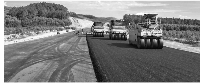
● Thi công cao tốc Bắc - Nam đoạn Bùng - Vạn Ninh.

Bộ trưởng Bộ Giao thông vận tải (GTVT) Nguyễn Văn Thắng vừa chủ trì cuộc họp trực tuyến kiểm điểm tiến độ triển khai các dự án đường bộ cao tốc hoàn thành năm 2025.