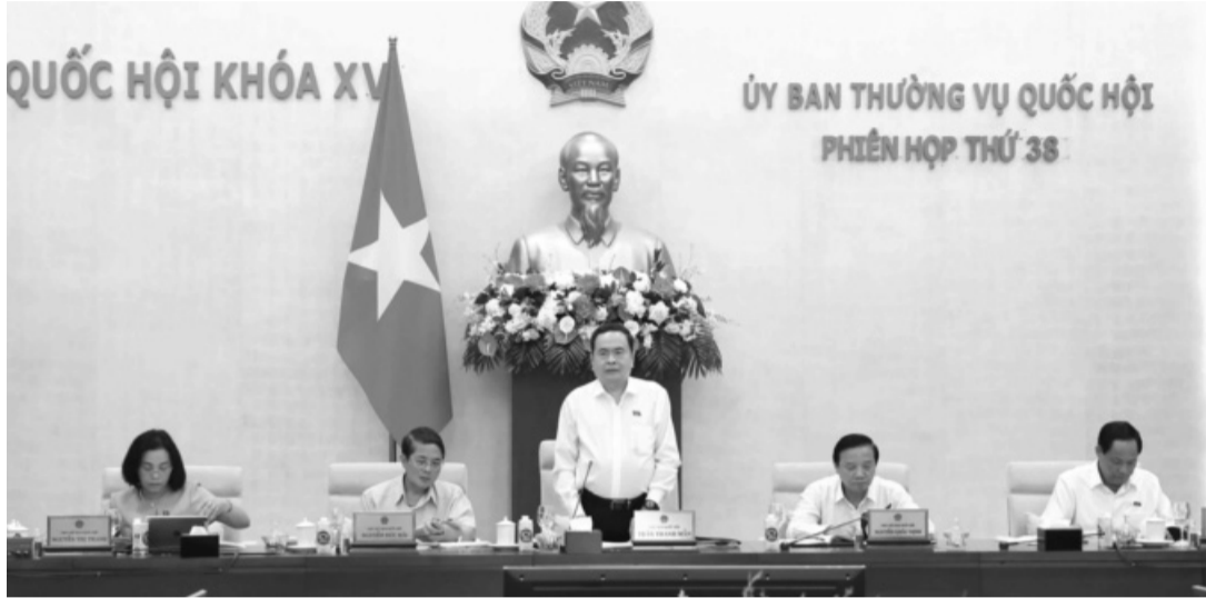
● Chủ tịch Quốc hội Trần Thanh Mẫn điều hành nội dung phiên họp.

Yêu cầu trên được Chủ tịch Quốc hội Trần Thanh Mẫn nhấn mạnh tại phiên họp sáng 14/10 của Ủy ban Thường vụ Quốc hội, cho ý kiến về việc chuẩn bị Kỳ họp thứ 8, Quốc hội khóa XV.