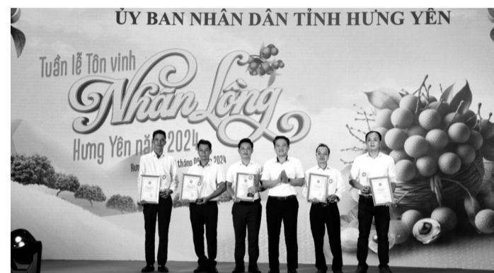
● Trao chứng nhận và cúp sản phẩm công nghiệp nông thôn tiêu biểu cấp tỉnh năm 2024 cho 5 sản phẩm, bộ sản phẩm của các cơ sở công nghiệp nông thôn trên địa bàn tỉnh.

Nhằm thúc đẩy sự phát triển bền vững và nâng cao giá trị cho các sản phẩm nông sản, làng nghề của địa phương, tỉnh Hưng Yên đã triển khai dự án “Hỗ trợ nâng cao khả năng nhận diện sản phẩm, kết nối kênh tiêu thụ nông sản đặc sản, sản phẩm OCOP và sản phẩm làng nghề” giai đoạn 2021 - 2025. Đây là một bước đi quan trọng trong việc hỗ trợ các doanh nghiệp, hợp tác xã (HTX), trang trại và các hộ sản xuất tăng cường khả năng tiếp cận thị trường hiện đại, nâng cao giá trị sản phẩm.