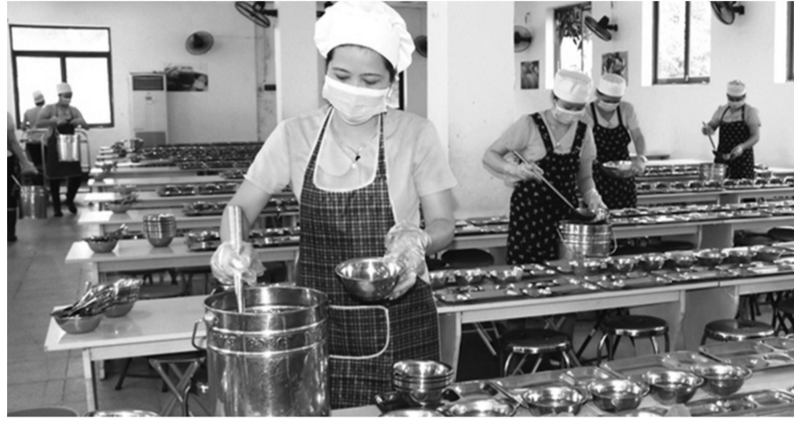
● Chú trọng an toàn thực phẩm bếp ăn tập thể, nhất là các căng tin, nhà ăn tại trường học. (Ảnh minh họa. Nguồn: VGP)

Những vụ ngộ độc thực phẩm liên tiếp xảy ra liên quan đến học sinh, sinh viên đã gióng lên hồi chuông cảnh báo về an toàn thực phẩm tại các bếp ăn tập thể, nhất là các căng tin, nhà ăn tại trường học. Tình trạng này không chỉ đe dọa sức khỏe của học sinh, sinh viên mà còn ảnh hưởng tiêu cực đến uy tín của các cơ sở giáo dục trên cả nước.