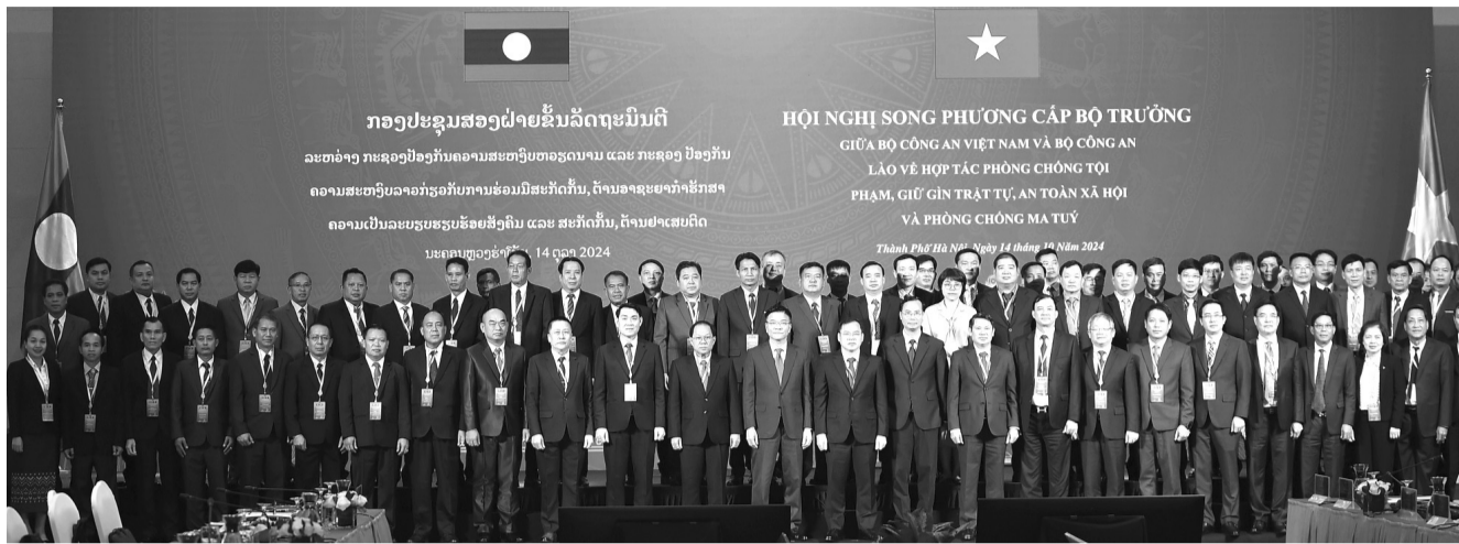
● Phó Thủ tướng Lê Thành Long và các đại biểu tham dự Hội nghị.

Ngày 14/10, Phó Thủ tướng Lê Thành Long, Chủ tịch Ủy ban quốc gia Phòng, chống AIDS, ma túy, mại dâm đã dự Hội nghị song phương cấp Bộ trưởng giữa Bộ Công an Việt Nam và Bộ Công an Lào về hợp tác phòng, chống tội phạm, giữ gìn trật tự, an toàn xã hội và phòng, chống ma túy.