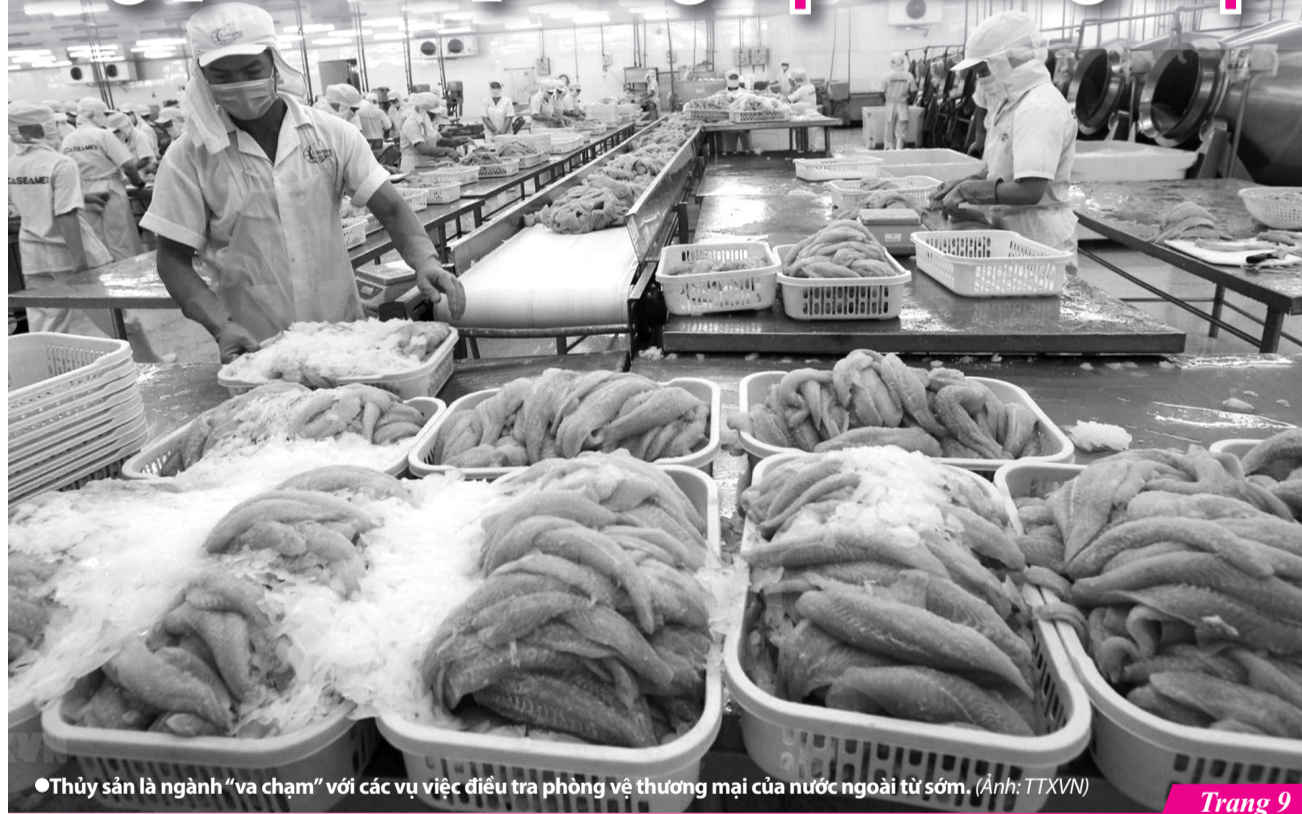
Thủy sản là ngành "va chạm" với các vụ việc điều tra phòng vệ thương mại của nước ngoài từ sớm.