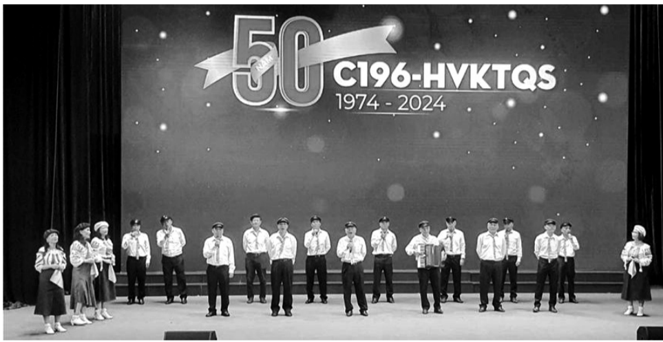
• Các thành viên C196 năm xưa thể hiện ca khúc "Chiều hải cảng" bằng tiếng Nga.

Tất cả trong số họ, có người là bộ đội đã qua huấn luyện chiến đấu, có người là học sinh các trường chuyên trong toàn miền Bắc như các Trường ĐH Tổng hợp Hà Nội, ĐH Sư phạm Hà Nội, ĐH Sư phạm Vinh, Trường Chu Văn An (Hà Nội), Trường Việt Đức (Hà Nội), có người là thành viên đội tuyển Toán quốc tế... Điềm chung, họ đều là những người có thành tích học tập xuất sắc, thi đại học từ