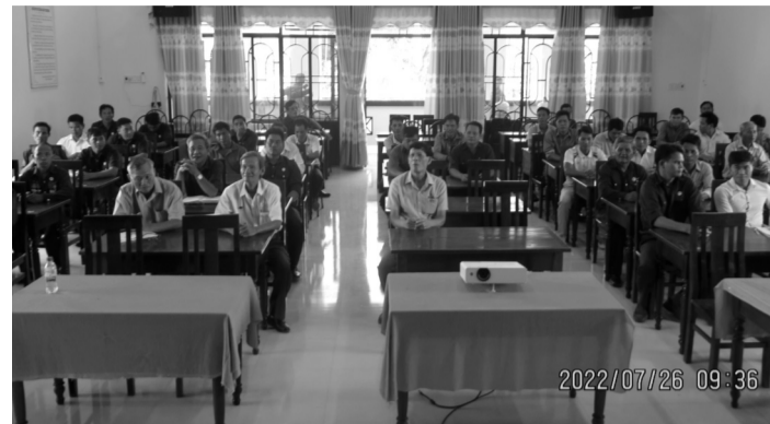
● Các buổi tuyên truyền, PBGDPL thu hút đông đảo CCB và bà con Nhân dân tham gia.