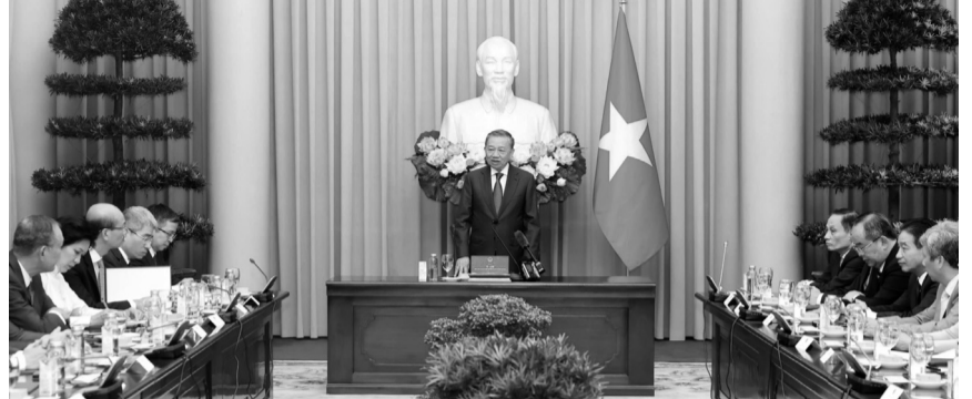
● Tổng Bí thư, Chủ tịch nước Tô Lâm phát biểu chỉ đạo.