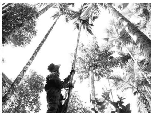
● Thu hoạch cau tươi.

Những ngày qua, giá cau tươi tăng mạnh, lên tới 80.000 - 90.000 đồng/kg, giúp nông dân Quảng Nam, Quảng Ngãi thu lợi cao.