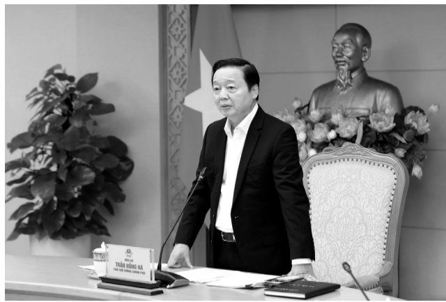
● Phó Thủ tướng Trần Hồng Hà nhấn mạnh công tác bảo đảm trật tự, an toàn giao thông là nhiệm vụ chính trị quan trọng, cấp bách.

Trong đó, các cấp ủy Đảng, chính quyền địa phương