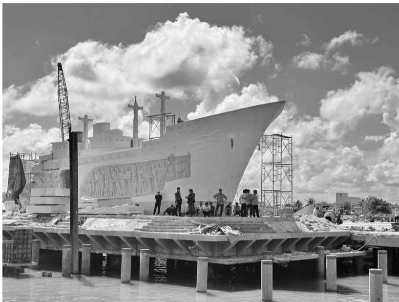
● Nỗ lực hoàn thành hạng mục chính công trình Chuyển tàu tập kết ra Bắc.

Trong khuôn khổ chuỗi sự kiện tập kết ra Bắc còn diễn ra các hoạt động kinh tế, văn hóa, văn nghệ, thể dục, thể thao, như: Hội chợ thương mại, lễ đón nhận Bằng xếp hạng di tích Quốc gia địa điểm tập kết ra Bắc cuối năm 1954 đầu năm 1955; tái hiện sự kiện 200 ngày tập kết ra