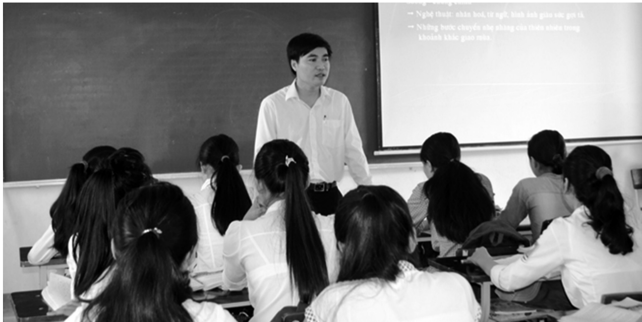
● Đừng đặt những áp lực ngoài chuyên môn lên vai thầy, cô giáo, để họ được toàn tâm, toàn ý vào sự nghiệp "trồng người". (Nguồn: S.T)

Tại nhiều trường học, các nhà giáo đang phải đối mặt với nhiều áp lực lớn khi ngoài truyền đạt kiến thức còn phải đáp ứng kỳ vọng ngày càng cao của phụ huynh, nhà trường và xã hội, thậm chí đôi lúc giáo viên còn phải kiêm thêm các nhiệm vụ ngoài lề không liên quan đến giáo dục.