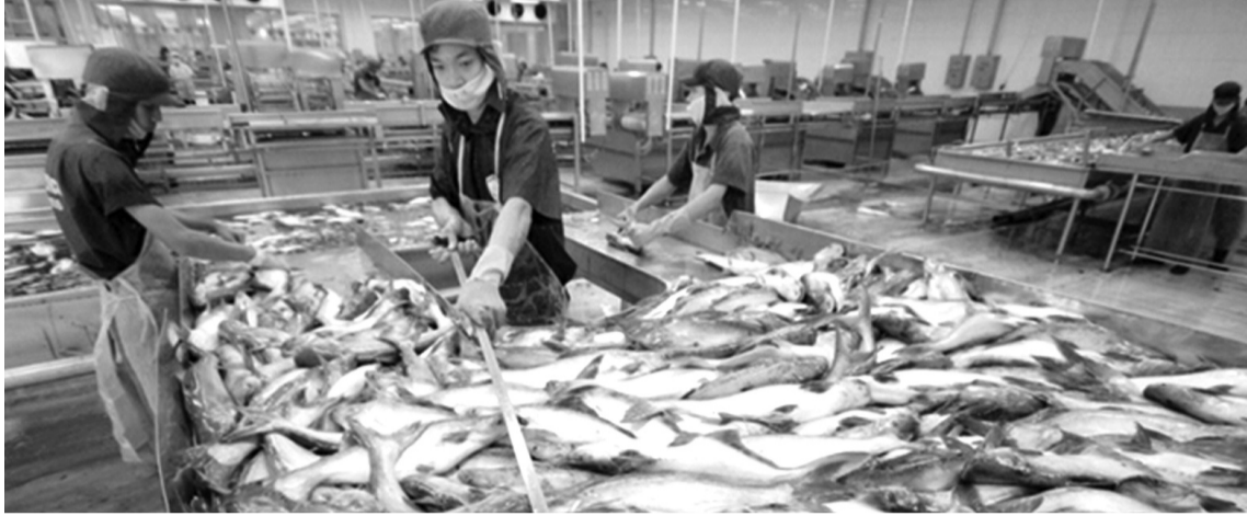
● Thủy sản là ngành "va chạm" với các vụ việc điều tra PVTM của nước ngoài từ sớm.

Ở cả 2 chiều xuất khẩu và nhập khẩu, công tác ứng phó với phòng vệ thương mại đều đã mang lại những kết quả tích cực khi doanh nghiệp chủ động ứng phó.