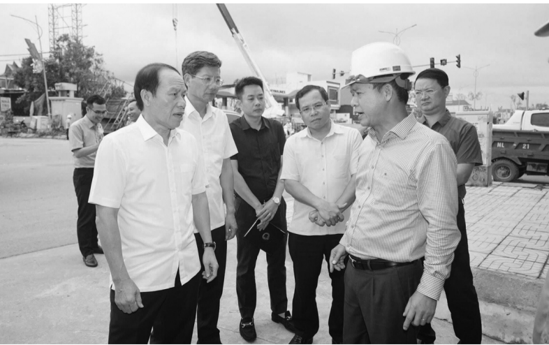
● Lãnh đạo TP Hải Phòng kiểm tra công tác khắc phục thiệt hại sau bão.