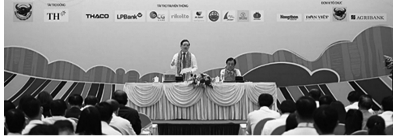
● Bộ trưởng Bộ NN&PTNT Lê Minh Hoan (người ngồi bên phải) và Chủ tịch Hội Nông dân Việt Nam Lương Quốc Đoàn chủ trì Diễn đàn.

Trong bối cảnh này, Bộ NN&PTNT mới đề xuất cách thức tiếp cận nông dân, nông thôn cho giai đoạn tới. Theo đó, sẽ tiếp tục đổi mới, phát triển và nâng cao hiệu quả kinh tế tập thể, hợp tác xã trong giai đoạn tới; Cải thiện tình hình tài chính, tín dụng trong lĩnh vực nông nghiệp, nông thôn; Hỗ trợ nâng cao năng lực cộng đồng ở nông thôn. Nhà nước cũng cần hỗ trợ nâng cao năng lực cộng đồng và tri thức hóa nông dân để nâng cao giá trị sản xuất đáp ứng yêu cầu của thị trường trong nước và quốc tế. GIA HỒNG