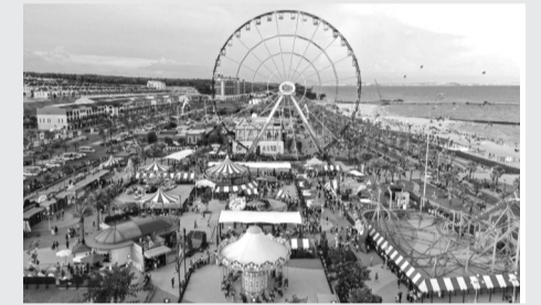
● Khu vực Quảng trường Novaworld Phan Thiết sẽ là nơi diễn ra Tuần lễ Du lịch Bình Thuận 2024.

Theo đó, Tuần lễ Du lịch Bình Thuận 2024 sẽ bao gồm các nội dung như: Hội thảo "Du lịch Bình Thuận: Lộ trình xanh hóa đến phát triển bền vững"; chương trình nghệ thuật chào mừng Tuần lễ Du lịch Bình Thuận 2024; tổ chức biểu diễn âm thực (dự kiến là món lẩu thả khổng lồ); chương trình biểu diễn nghệ thuật, hội thi "Món ngon Bình Thuận"... Ngoài ra, tại sự kiện này còn có "Không gian Hội chợ Du lịch, văn hóa và ẩm thực Bình Thuận" nhằm trưng bày, giới thiệu, quảng bá sản phẩm du lịch, văn hóa, ẩm thực đặc trưng của địa phương và tỉnh thành bạn.