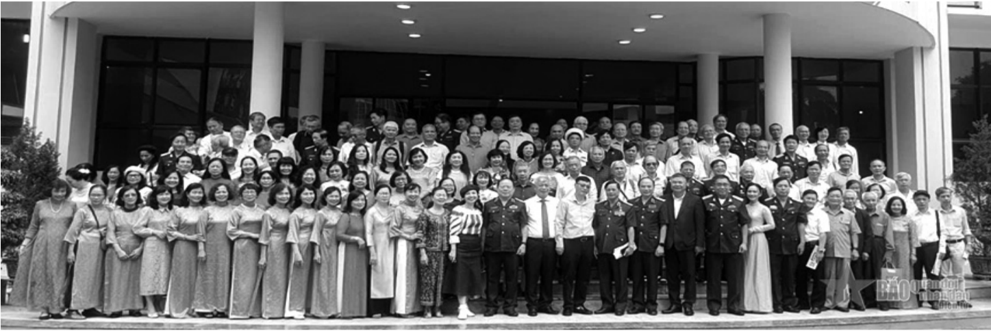
• Các thành viên C196 chụp ảnh lưu niệm.

Đầu những năm 1970, giữa lúc cuộc kháng chiến chống Mỹ, cứu nước còn khốc liệt, Đảng, Nhà nước, Quân đội ta đã chủ trương đưa những học sinh giỏi nhất ra nước ngoài đào tạo, chuẩn bị nguồn nhân lực chất lượng cao về khoa học và kỹ thuật (KH&KT) để về tái thiết đất nước, xây dựng Quân đội trong tương lai. Đề án đã "ra lò" nhiều tướng lĩnh, thành viên cấp Thứ trưởng hoặc tương đương của các Bộ, ngành.