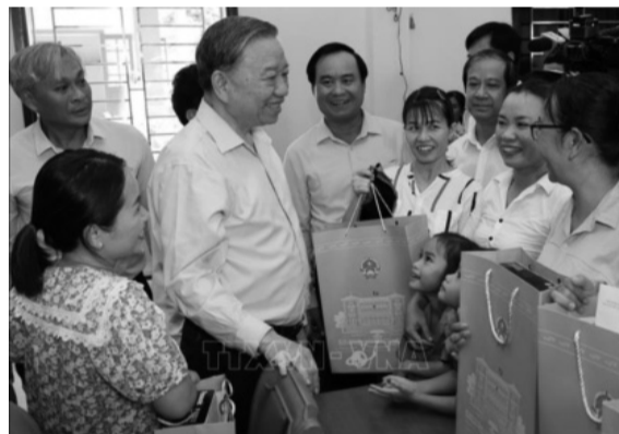
● Tổng Bí thư, Chủ tịch nước Tô Lâm tặng quà, động viên Nhân dân huyện đảo Côn Cỏ, tỉnh Quảng Trị.

Sáng ngày 16/10, Tổng Bí thư, Chủ tịch nước Tô Lâm đến thăm, làm việc, tặng quà đồng viên Đảng bộ, chính quyền, Nhân dân và lực lượng vũ trang tại huyện đảo Côn Cỏ, tỉnh Quảng Trị. Tổng Bí thư, Chủ tịch nước Tô Lâm và Đoàn công tác đã đến dâng hương tại Nhà lưu niệm Bác Hồ, thăm khảo sát cuộc sống bà con trên đảo; làm việc, trao quà, động viên Đảng bộ, chính quyền, lực lượng vũ trang huyện đảo Côn Cỏ.