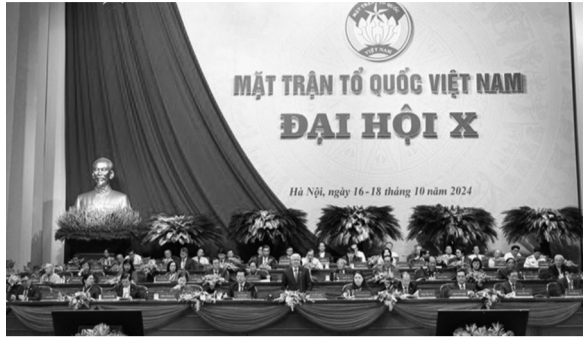
● Đoàn Chủ tịch điều hành Đại hội.

Đại hội đã lắng nghe dự thảo Báo cáo kiểm điểm hoạt động của UBUTU, Đoàn Chủ tịch và Ban Thường trực UBUTU MTTQ Việt Nam khóa IX, nhiệm kỳ 2019 - 2024. Báo cáo nhấn mạnh, nhiệm kỳ qua, Ủy ban, Đoàn Chủ tịch và Ban Thường trực đã bám sát chủ trương, đường lối, sự lãnh đạo của Đảng, chính sách, pháp luật của Nhà nước và những vấn đề Nhân dân quan tâm, những vấn đề phát sinh, thực tiễn đặt ra..., đạt được nhiều kết quả tích cực, nổi bật, trong đó có nhiều nhiệm vụ mang tính sáng tạo, mới, khó, chưa có tiền lệ, được Đảng, Nhà nước và Nhân dân ghi nhận, đánh giá cao.