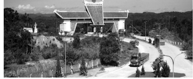
● Cửa khẩu quốc tế Nam Giang - Đắc Tà Oọc.