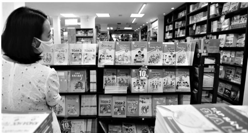
● Bộ GD&ĐT trả lời việc sử dụng bộ SGK do cơ sở giáo dục lựa chọn, đảm bảo phù hợp điều kiện địa phương và mục tiêu chương trình GDPT.

Bộ trưởng Bộ Giáo dục và Đào tạo (GD&ĐT) Nguyễn Kim Sơn vừa ký văn bản trả lời kiến nghị cử tri tỉnh An Giang gửi Kỳ họp thứ 7, Quốc hội khóa XV liên quan sách giáo khoa (SGK), học phí.