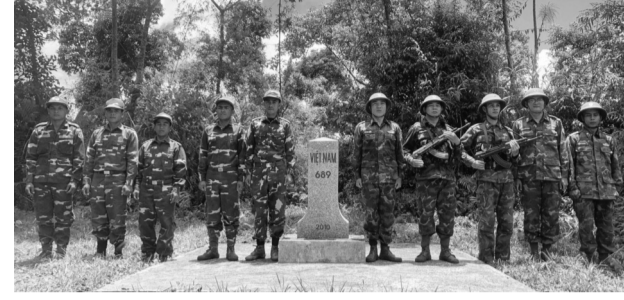
● Đồn Biên phòng A Xan (Việt Nam) và Đại đội Biên phòng 534 (Lào) thường xuyên kết hợp tuần tra song phương.