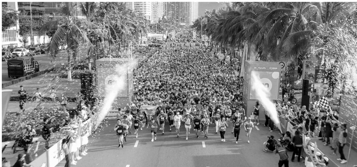
● Các cuộc thi chạy bộ ở Việt Nam cần được kiểm soát chặt chẽ hơn để đảm bảo quyền lợi cho các vận động viên tham dự và người dân. (Ảnh minh họa)

Cứ đến mùa thu - đông là bước vào thời gian "cao điểm" các giải chạy bộ. Hàng loạt cuộc thi diễn ra, từ những giải chạy ngắn với mục đích gây quỹ từ thiện, đến những giải chạy đêm, giải chạy mang tầm cỡ quốc tế. Đây là một dấu hiệu tích cực, cho thấy người dân đang hưởng ứng phong trào thể thao lành mạnh, nâng cao sức khỏe. Tuy nhiên, việc các giải chạy bộ liên tục diễn ra cũng đang tạo nên những bất cập.