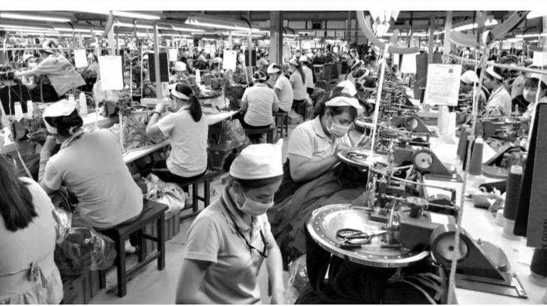
● Số doanh nghiệp đang hoạt động trên địa bàn tỉnh Lâm Đồng là 14.368.

Công an Lâm Đồng đẩy mạnh trấn áp tội phạm dịp cuối năm Tại họp báo, theo Công an tỉnh Lâm Đồng, từ đầu năm 2024 đến nay, công tác đấu tranh phòng, chống tội phạm được đẩy mạnh; tỷ lệ điều tra, khám phá tội phạm đạt tỷ lệ 92,79%. Công tác đấu tranh các loại tội phạm, vi phạm pháp luật về ma tuý, kinh tế, môi trường được chú trọng; tội phạm về trật tự quản lý kinh tế, môi trường bị khởi tố tăng 71 vụ; tội phạm về ma tuý bị khởi tố tăng 32 vụ. Công tác điều tra, xử lý tội phạm được đảm bảo theo quy định, không để xảy ra oan sai, bỏ lọt tội phạm. Công tác quản lý nhà nước về an ninh trật tự được phát huy, phục vụ hiệu quả cho công tác quản lý xã hội và phòng, chống tội phạm. Việc bảo đảm trật tự an toàn giao thông, phòng cháy, chữa cháy được tăng cường. Số người chết do tai nạn giao thông được kéo giảm gần 30%. Trong 3 tháng cuối năm, Công an Lâm Đồng quyết tâm bảo vệ an toàn các mục tiêu, công trình trọng điểm, các sự kiện chính trị, văn hoá - xã hội; hoạt động của lãnh đạo Đảng, Nhà nước, không để bị động, bất ngờ; nhất là dịp lễ Festival Hoa Đà Lạt, Tết Dương lịch 2025... Cùng với đó, lực lượng công an tiếp tục đẩy mạnh quản lý về an ninh trật tự; triển khai đồng bộ các giải pháp nhằm kéo giảm tai nạn giao thông ở cả 3 tiêu chí. Công an Lâm Đồng tiếp tục mở các đợt cao điểm tấn công, trấn áp quyết liệt các loại tội phạm hình sự, kinh tế, môi trường, ma tuý, tội phạm công nghệ cao và các tệ nạn xã hội.