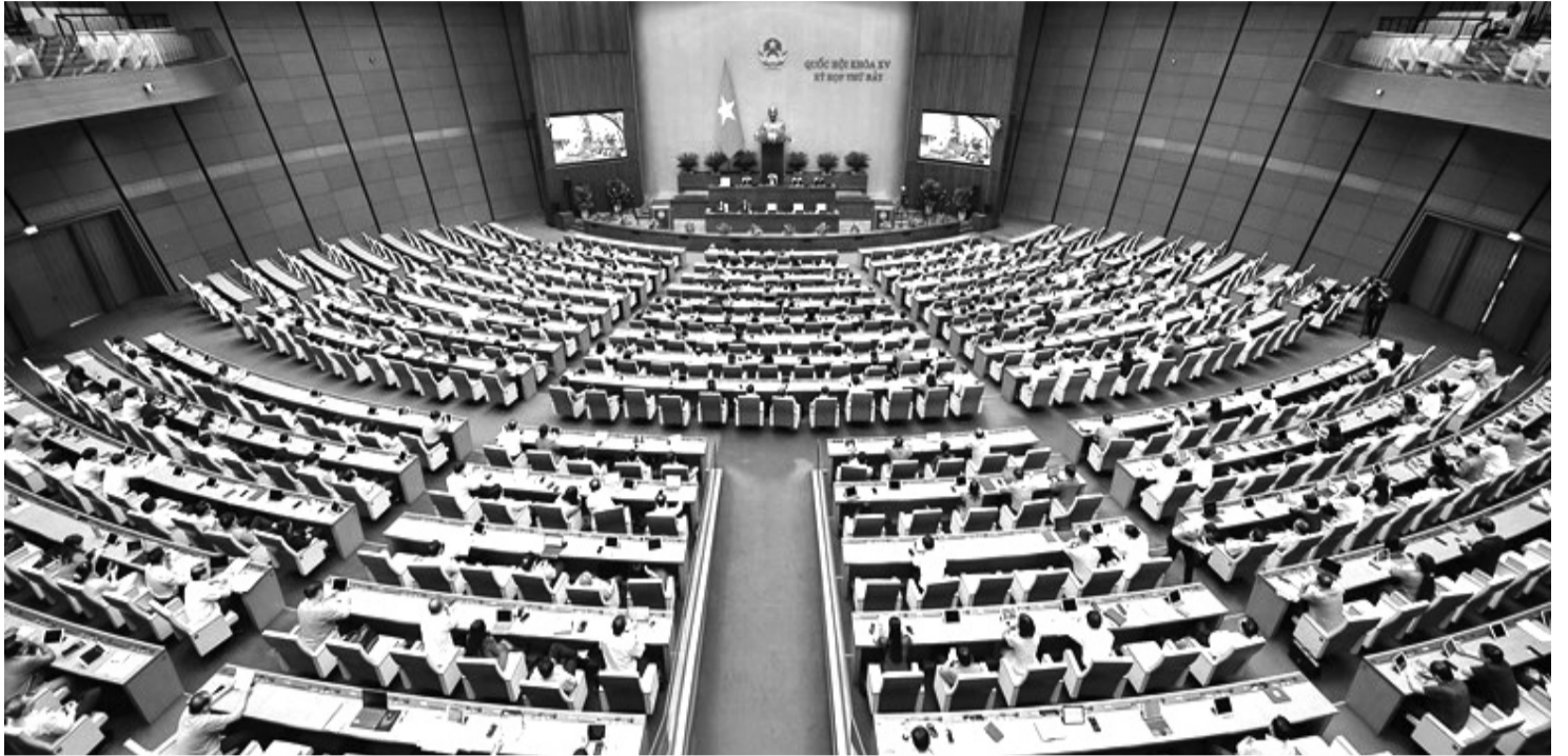
● Tại Kỳ họp thứ 7, Quốc hội khóa XV, Quốc hội giám sát tối cao việc thực hiện Nghị quyết số 43 về phục hồi, phát triển kinh tế - xã hội, một số dự án quan trọng quốc gia.