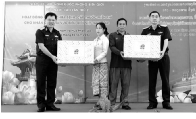
● Lãnh đạo Cục Quân y và BV Quân y 6 trao quà tặng Trung tâm Y tế huyện Sop Bao (Lào). (Ảnh trong bài: Văn Chiến)