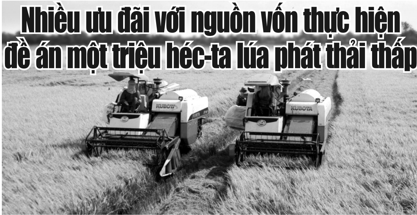
● Sẽ có thêm ưu đãi cho nguồn vốn thực hiện đề án.