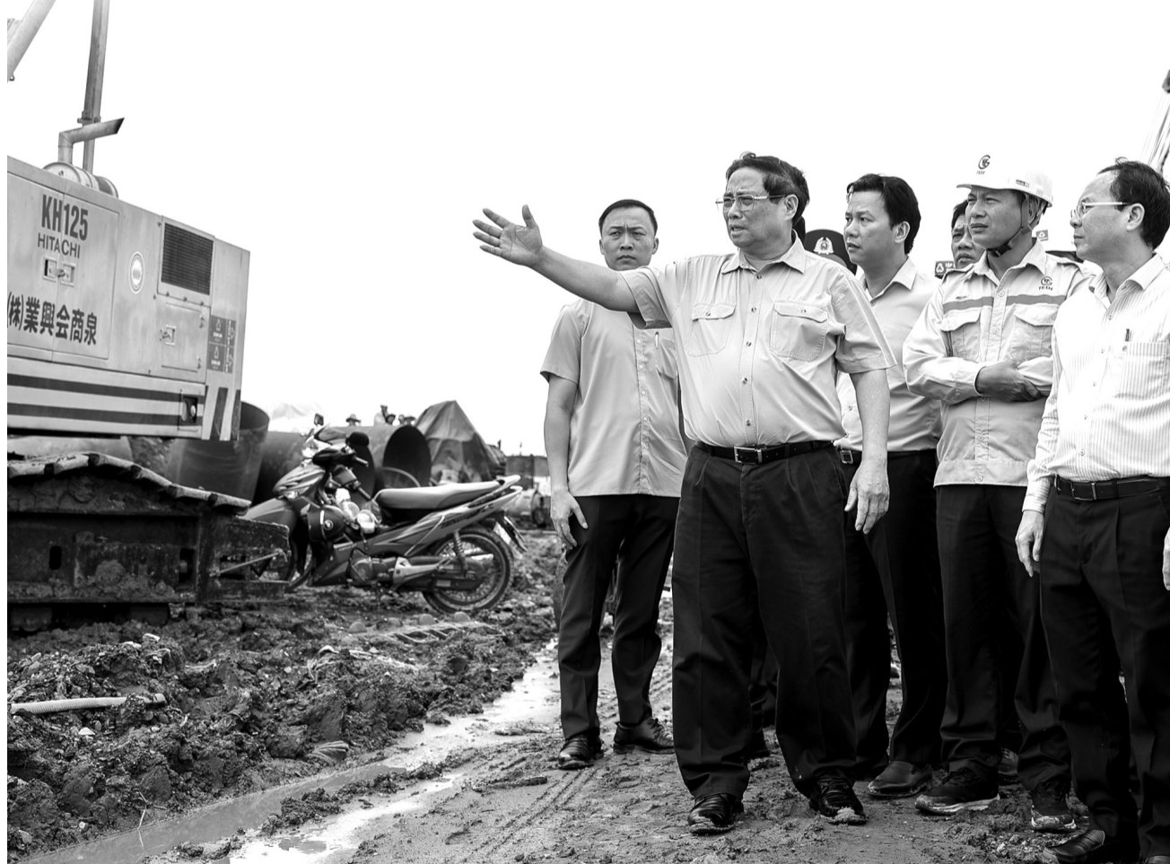
● Thủ tướng Phạm Minh Chính kiểm tra tình hình thi công dự án thành phần 2 tuyến cao tốc Châu Đốc - Cần Thơ - Sóc Trăng tại nút giao Lộ Tẻ - Rạch Sỏi (xã Thạnh Tiến, Vĩnh Thạnh, Cần Thơ), tháng 7/2024.

Ngày 16/10, tại TP Cần Thơ, Thủ tướng Chính phủ Phạm Minh Chính, Trưởng Ban Chỉ đạo Nhà nước các công trình, dự án quan trọng quốc gia, trọng điểm ngành Giao thông vận tải chủ trì Hội nghị bàn giải pháp tháo gỡ khó khăn, vướng mắc và thúc đẩy phát triển hạ tầng giao thông khu vực Đồng bằng sông Cửu Long.