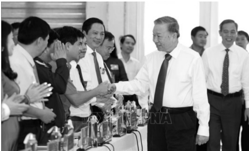
● Tổng Bí thư, Chủ tịch nước Tô Lâm với các đồng chí Ban Thường vụ Tỉnh ủy Quảng Trị.

Dù đạt nhiều kết quả tích cực nhưng Tổng Bí thư, Chủ tịch nước cũng đánh giá quá trình phát triển, tỉnh Quảng Trị còn gặp nhiều khó khăn, thách thức do nằm trong vùng đất khó khăn, đồi núi nhiều, thời tiết khắc nghiệt, thiên tai, hạn hán thường xuyên; chịu tác động lớn của biến đổi khí hậu và nước biển dâng. Quy mô kinh tế Quảng Trị còn nhỏ, sức cạnh tranh thấp, đa số doanh nghiệp