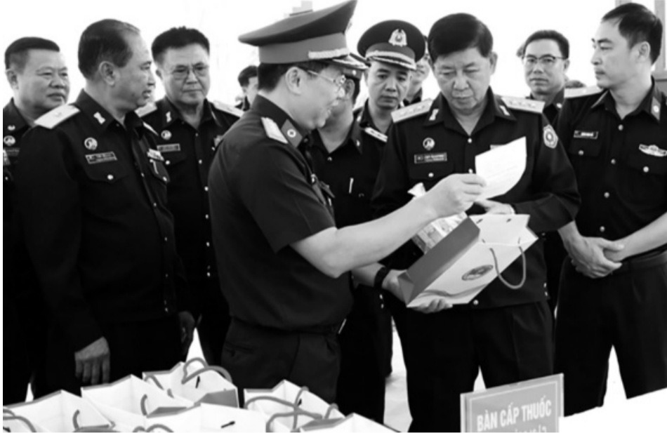
● Thượng tướng Vongkham Phommakone (thứ 2 từ phải sang), Thứ trưởng Bộ Quốc phòng Lào kiểm tra, động viên lực lượng thầy thuốc quân y hai nước.

Hoạt động khám, chữa bệnh chung, cấp thuốc miễn phí cho người dân khu vực biên giới Việt - Lào của lực lượng quân y hai nước đã góp phần chăm sóc, bảo vệ sức khỏe, phòng, chống dịch bệnh cho người dân khu vực biên giới; đồng thời là dịp để cán bộ, nhân viên quân y hai nước giao lưu, chia sẻ, học tập kinh nghiệm lẫn nhau về nghiệp vụ y học, góp phần củng cố tình đoàn kết, hữu nghị giữa Nhân dân, Quân đội và ngành quân y hai nước.