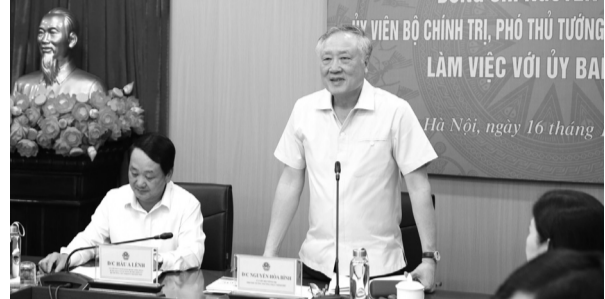
● Phó Thủ tướng Thường trực Nguyễn Hòa Bình nhấn mạnh, chủ trương xuyên suốt, nhất quán của Đảng và Nhà nước là đặc biệt quan tâm đến vùng đồng bào DTTS&MN.

Hôm qua (16/10), phát biểu chỉ đạo tại buổi làm việc với Ủy ban Dân tộc, Ủy viên Bộ Chính trị, Phó Thủ tướng Thường trực Chính phủ Nguyễn Hòa Bình nhấn mạnh, việc triển khai các đề án, chương trình phát triển khu vực vùng đồng bào dân tộc thiểu số và miền núi được thực hiện phải có trọng tâm, trọng điểm, tránh dàn trải; phải thực sự tạo được những đột phá, cú hích đối với khu vực và cả vùng.