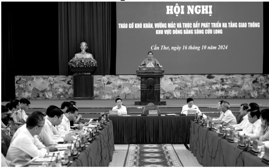
● Thủ tướng Chính phủ Phạm Minh Chính phát biểu tại Hội nghị tháo gỡ khó khăn, vướng mắc và thúc đẩy phát triển hạ tầng giao thông khu vực ĐBSCL.

Tại Hội nghị, đại diện các tỉnh, thành phố đã báo cáo với Thủ tướng về tiến độ thực hiện các dự án giao thông trọng điểm trên địa bàn, cũng như trình bày những khó khăn, vướng mắc trong quá trình thực hiện các dự