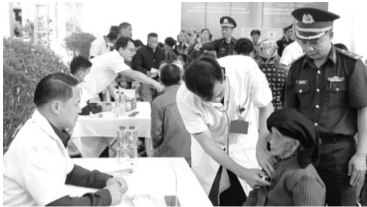
● Quân y hai nước khám, tư vấn sức khỏe, cấp thuốc miễn phí cho người dân khu vực biên giới Việt Nam - Lào.