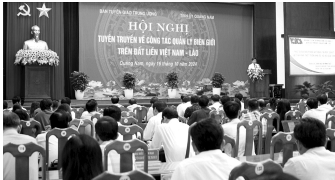
● Hội nghị được tổ chức tại Quảng Nam.