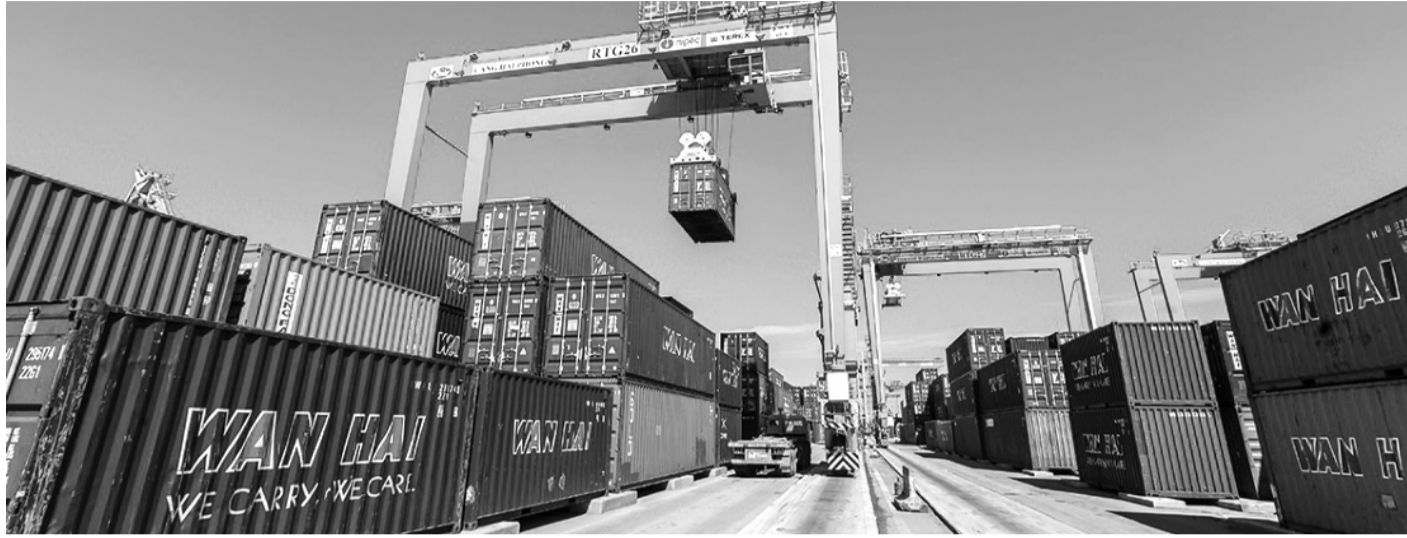
● Cơ hội xuất khẩu sang thị trường Mỹ Latinh rộng mở.

Thị trường Mỹ Latinh được xem là thị trường lớn của Việt Nam cho cả 2 chiều xuất - nhập khẩu, nhưng chưa khai thác được triệt để do những khó khăn về logistics.