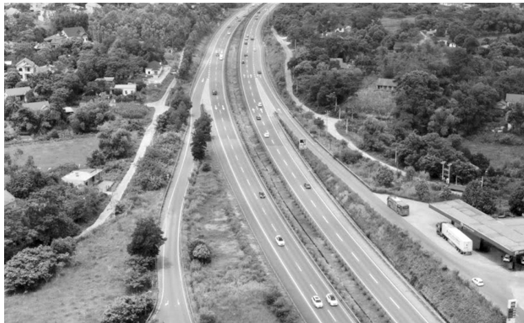
● Phí sử dụng đường bộ cao tốc từ 900 đồng/xe.km đến 5.200 đồng/xe.km.

Nhóm 4 gồm các loại phương tiện sau: xe tải có tải trọng từ 10 tấn đến dưới 18 tấn; xe chở hàng bằng container dưới 40 feet.