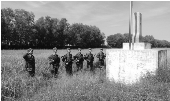
● BĐBP tuần tra, kiểm soát bảo vệ biên giới.

Không chỉ có biên giới giáp Campuchia, tỉnh Long An còn tiếp giáp Đồng Tháp, Tây Ninh, liền kề TP HCM; nên một số đối tượng đã tổ chức các đường dây ma túy, buôn lậu đưa vào sâu trong nội địa tiêu thụ. Trước thực tế này, Bộ đội Biên phòng (BĐBP) tỉnh Long An đã có những biện pháp quyết liệt phòng, chống tội phạm trên tuyến biên giới.