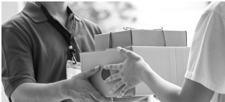
● Sẽ có chính sách hỗ trợ, khuyến khích việc làm phổ thông như giao hàng, bán hàng online. (Ảnh minh họa - Nguồn: Post)

vào các thị trường Nhật Bản, Đức, Hàn Quốc, Đài Loan (Trung Quốc), đưa tỷ lệ lao động có trình độ chuyên môn kỹ thuật đi xuất khẩu lao động lên 60%.