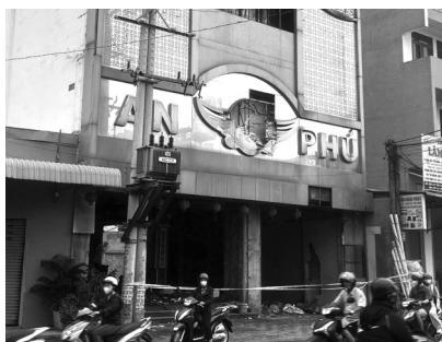
● Cơ quan chức năng khám nghiệm hiện trường.