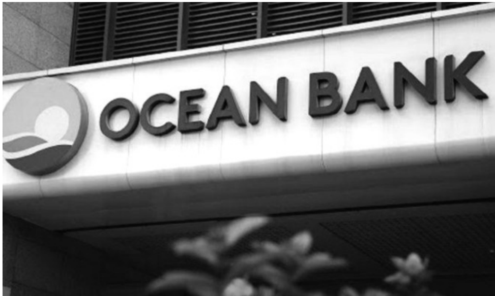
● Ngân hàng TNHH MTV Đại Dương (OceanBank) được chuyển giao bắt buộc cho MB.

tín dụng của nền kinh tế còn thấp; mức tăng trưởng tín dụng của các TCTD không đồng đều, có TCTD tăng thấp, thậm chí tăng trưởng âm trong khi một số TCTD tăng sát chỉ tiêu NHNN đã thông báo, ngày 28/8/2024, NHNN đã thông báo mức tăng trưởng tín dụng tăng thêm cho các TCTD đảm bảo công khai, minh bạch.