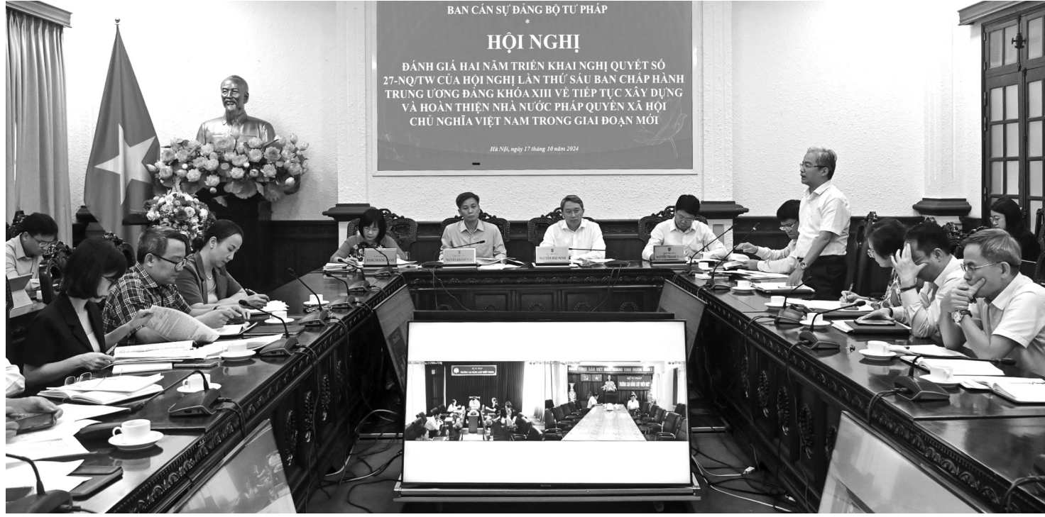
● Bí thư Ban Cán sự Đảng, Bộ trưởng Bộ Tư pháp Nguyễn Hải Ninh và các đồng chí lãnh đạo chủ trì Hội nghị.

Đánh giá báo cáo đã khá đầy đủ, song, Bộ trưởng yêu cầu Viện Chiến lược và Khoa học pháp lý cần rà soát, thống kê các chương trình, nhiệm vụ đã hoàn thành đến thời điểm hiện tại; các đề xuất, kiến nghị cần đi sâu để khắc phục những hạn chế, bất cập đã được chỉ ra.