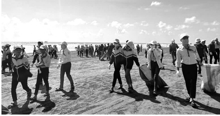
● Học sinh Nam Định tham gia nhặt rác ven biển hưởng ứng Ngày Pháp luật 2022.

Học sinh không chỉ thực hiện các hành động nhỏ như tiết kiệm điện, nước, hạn chế đồ nhựa, phân loại rác thải, trồng cây xanh, mà còn trở thành những tuyên truyền viên, thúc đẩy người lớn hành động vì môi trường.