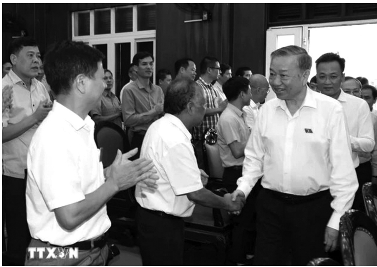
● Tổng Bí thư, Chủ tịch nước Tô Lâm với cử tri huyện Văn Giang, tỉnh Hưng Yên.

Liên quan đến một số vấn đề khác mà cử tri quan tâm, Tổng Bí thư, Chủ tịch nước đề nghị Đoàn đại biểu Quốc hội tỉnh Hưng Yên phối hợp với các cơ quan của tỉnh ghi nhận toàn bộ những ý kiến của cử tri, rà soát