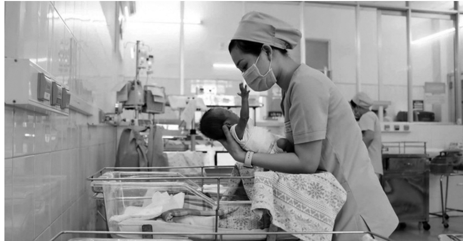
● Đứng trước tốc độ già hóa dân số nhanh, những nỗ lực khuyến sinh đã và đang được triển khai.

Theo đó, Đề án đề xuất ban hành chính sách hỗ trợ, khuyến khích các cặp vợ chồng sinh đủ hai con trên cơ sở phân tích, đánh giá tác động của chính sách về lao động, việc làm, nhà ở; phúc lợi xã hội, giáo dục, y tế... Đặc biệt các biện pháp khuyến sinh được chú trọng như hỗ trợ toàn bộ chi phí cho phụ nữ mang thai khi tham gia chương trình sàng lọc trước sinh, sàng lọc sơ sinh và hỗ trợ toàn bộ chi phí đồng chi trả (sau khi đã trừ chi phí được bảo hiểm y tế thanh toán) khi khám thai định kỳ và sinh con. Quy hoạch, xây dựng các điểm trông, giữ trẻ, nhà mẫu giáo phù hợp với điều kiện của bà mẹ, nhất là ở các khu chế xuất, khu công nghiệp, khu đô thị. Thí điểm các dịch vụ thân thiện với người lao động như điều chỉnh thời gian trông trẻ, hỗ trợ chi phí học bán trú ở cấp mầm non và tiểu học, nhân rộng phòng vắt và trữ sữa mẹ tại nơi làm việc. Thí điểm xây dựng ứng dụng về chăm sóc bà mẹ, trẻ em, theo dõi, quản lý, hỗ trợ bà mẹ trong quá trình mang thai và nuôi con. Đảm bảo cung cấp đầy đủ các dịch vụ