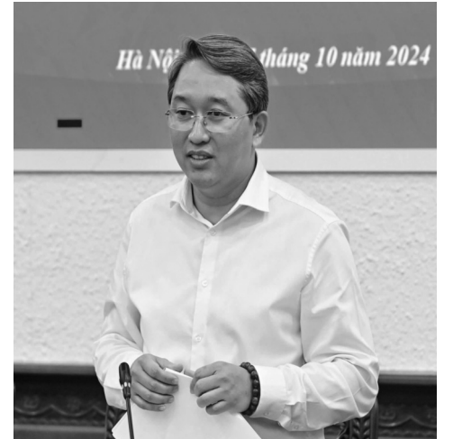
● Bí thư Ban Cán sự Đảng, Bộ trưởng Bộ Tư pháp Nguyễn Hải Ninh kết luận.

Đánh giá báo cáo đã khá đầy đủ, song, Bộ trưởng yêu cầu Viện Chiến lược và Khoa học pháp lý cần rà soát, thống kê các chương trình, nhiệm vụ đã hoàn thành đến thời điểm hiện tại; các đề xuất, kiến nghị cần đi sâu để khắc phục những hạn chế, bất cập đã được chỉ ra.