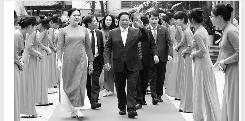
● Thủ tướng Chính phủ thăm Học viện Phụ nữ Việt Nam và gặp mặt các đại biểu nhân dịp 20/10.

Phát biểu tại buổi gặp mặt, thay mặt Tổng Bí thư, Chủ tịch nước Tô Lâm và lãnh đạo Đảng, Nhà nước, Thủ tướng Chính phủ Phạm Minh Chính