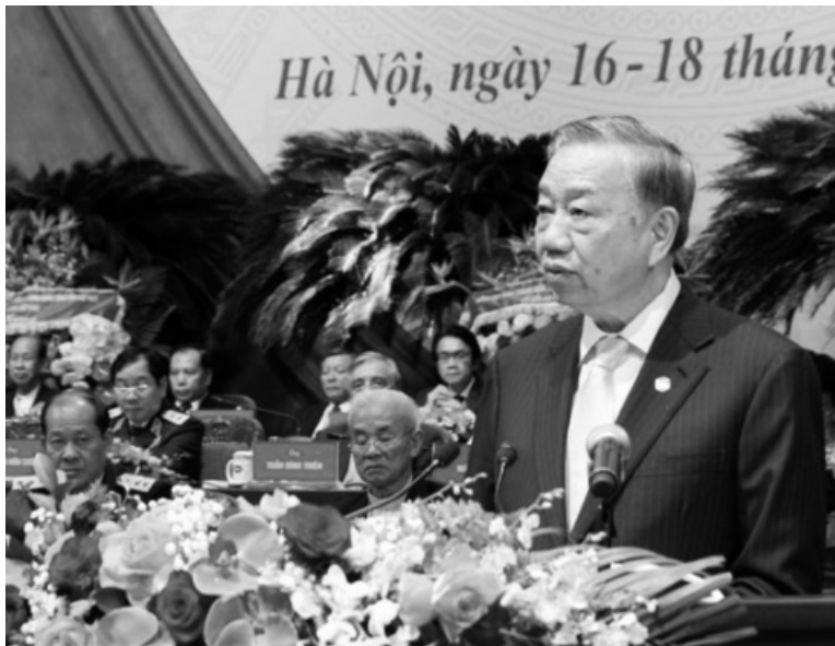
● Tổng Bí thư, Chủ tịch nước Tô Lâm phát biểu chỉ đạo tại Đại hội.

Phát biểu chỉ đạo tại Đại hội đại biểu toàn quốc Mặt trận Tổ quốc Việt Nam lần thứ X, nhiệm kỳ 2024 - 2029 (Đại hội), diễn ra ngày 17/10, Tổng Bí thư, Chủ tịch nước Tô Lâm nêu rõ, Mặt trận phải là hạt nhân trong bảo vệ nền tảng tư tưởng của Đảng, đấu tranh phản bác các quan điểm sai trái, thù địch.