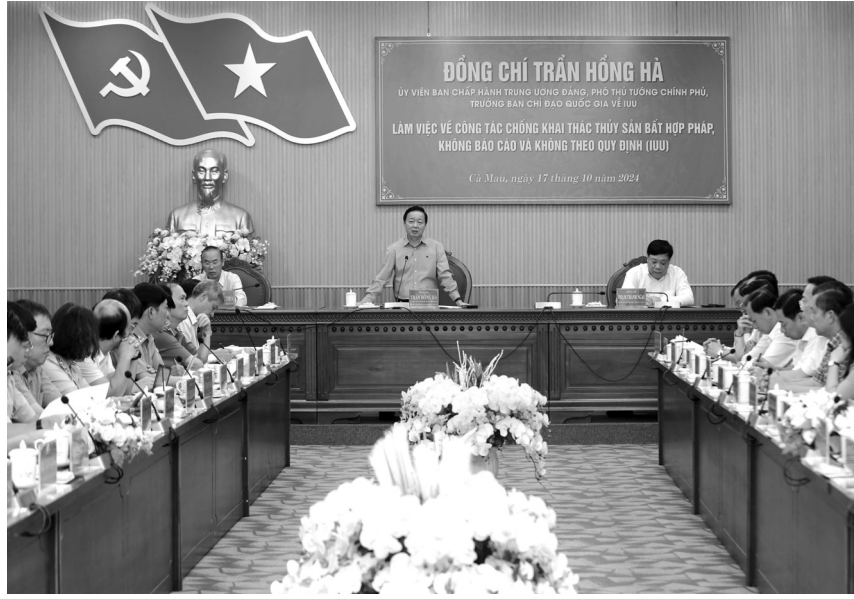
● Phó Thủ tướng Trần Hồng Hà đề nghị cần coi gỡ "thẻ vàng" IUU là nhiệm vụ chính trị ưu tiên.

Công tác thực thi pháp luật, xử lý vi phạm IUU còn rất thấp, chưa thống nhất, đồng đều giữa các địa phương; xảy ra tình trạng địa phương nào làm nghiêm thì tàu cá có dấu hiệu vi phạm IUU di chuyển sang những nơi thiếu sự kiểm soát, giám sát chặt chẽ của lực lượng chức năng để cập cảng bóc dỡ thủy