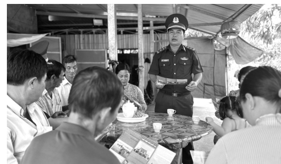
● BĐBP tuyên truyền pháp luật cho cư dân sống tại địa bàn biên giới.

Từ đầu năm 2023 đến nay, Bộ Chỉ huy BĐBP tỉnh đã chủ trì, phối hợp lực lượng chức năng xác lập và đấu tranh thành công 13 chuyên án, trong đó 3 chuyên án về ma túy, 9 chuyên án về buôn lậu, 1 chuyên án về mua bán người; 12 kế hoạch nghiệp vụ về đấu tranh phòng, chống các loại tội phạm, vi phạm pháp luật. Kết quả bắt giữ 51 đối tượng, thu giữ 58 bánh heroin,