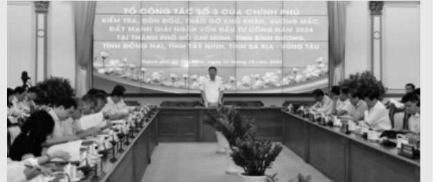
● Phó Thủ tướng Lê Thành Long nhấn mạnh vai trò của giải ngân vốn đầu tư công.

Hôm qua (17/10), tại TP Hồ Chí Minh, Phó Thủ tướng Lê Thành Long, Tổ trưởng Tổ công tác số 3 của Chính phủ về kiểm tra, đôn đốc, tháo gỡ khó khăn, vướng mắc, đẩy mạnh giải ngân vốn đầu tư công năm 2024 đã làm việc với các tỉnh, TP vùng Đông Nam Bộ là TP Hồ Chí Minh, Đồng Nai, Bình Dương, Tây Ninh, Bà Rịa - Vũng Tàu.