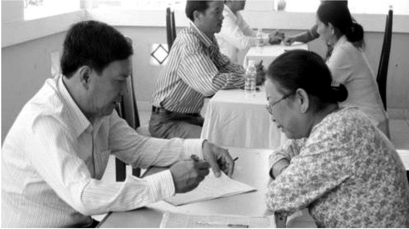
● Ảnh minh họa.