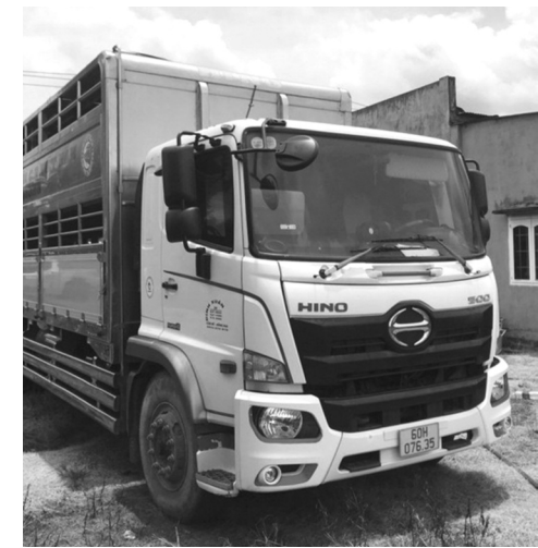
● Chiếc xe đứng tên cha nhưng ông Duy đã làm giả giấy tờ đứng tên mình để bán cho ông Quốc.

cà vẹt hợp lệ để tiếp tục thực hiện hợp đồng mua bán với ông Quốc. Tới hẹn, ông Quốc không liên lạc được với ông Duy nên làm đơn tố giác đến công an.