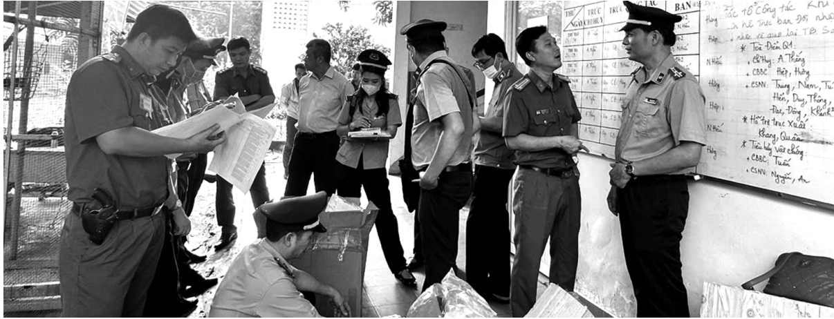
● Chấp hành viên và các lực lượng chức năng thi hành nhiệm vụ.

Bảo đảm việc thu hồi kịp thời, thu hồi tối đa tài sản bị thất thoát, chiếm đoạt cho ngân sách nhà nước trong các vụ án hình sự về kinh tế, tham nhũng, dự thảo Luật Thi hành án dân sự (THADS) sửa đổi, bổ sung đã đề xuất nhiều quy định mới.