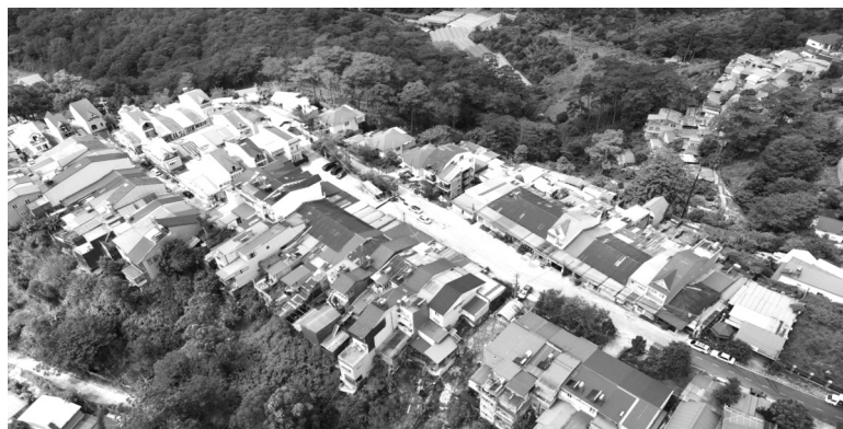
● Khu nhà ở Dinh 1 nhìn từ trên cao.

Sau đó, UBND TP Đà Lạt có báo cáo gửi Thanh tra tỉnh cho biết, qua rà soát có 9 trường hợp đã được cấp sổ đỏ không phù hợp quy hoạch tổng mặt bằng khu nhà ở Dinh 1 được phê duyệt tại Quyết định 2254/QĐ-UBND ngày 14/7/1999 của UBND tỉnh. Các sổ đỏ này được cấp lần đầu