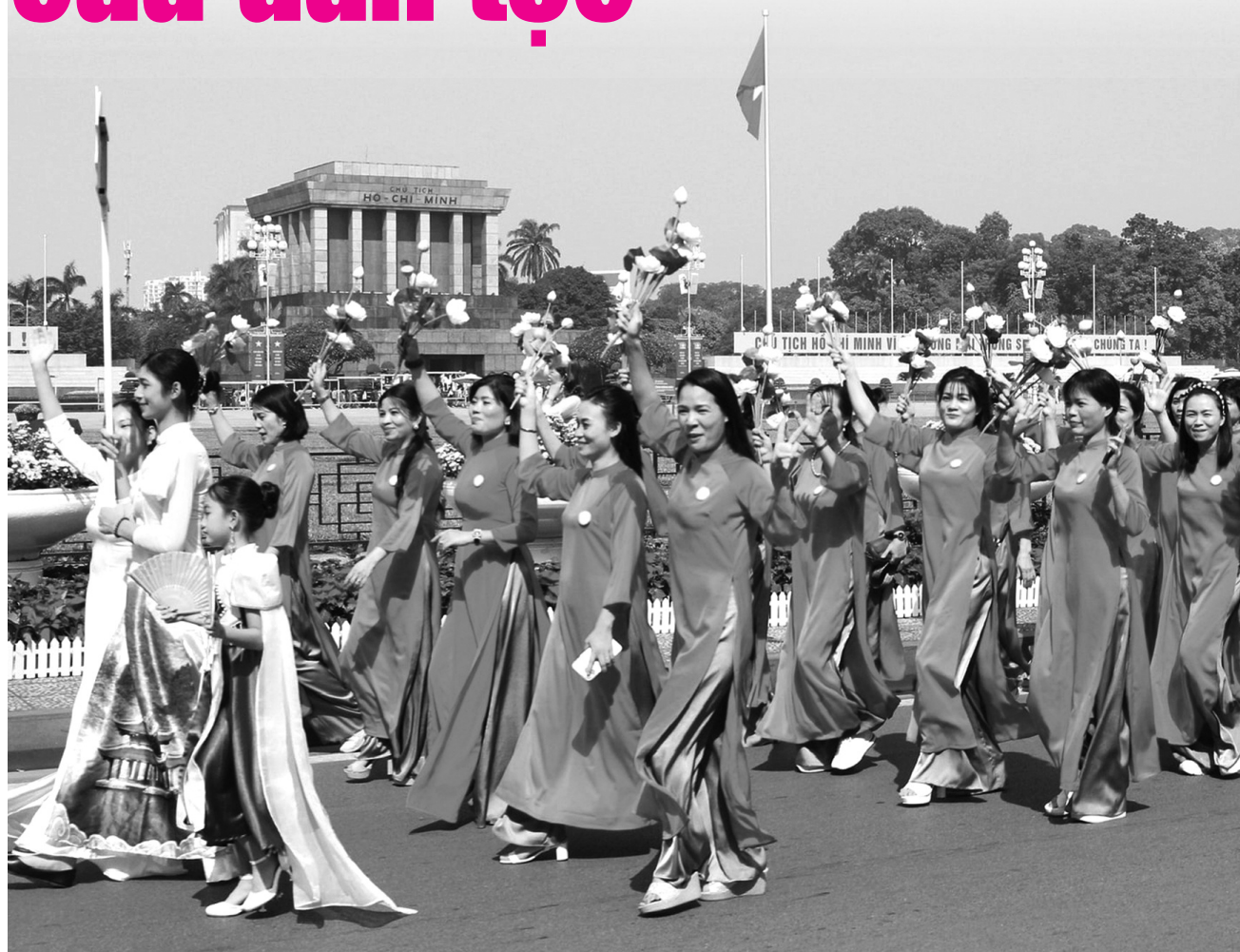
● Phụ nữ Việt Nam không ngừng phát huy truyền thống và phẩm chất tự tin, trung hậu, đảm đang, tinh thần tự lực, tự cường, khát vọng vươn lên.

Chiều 17/10, nhân kỷ niệm Ngày Phụ nữ Việt Nam (20/10), Thủ tướng Chính phủ Phạm Minh Chính đã thăm Học viện Phụ nữ Việt Nam, gặp mặt cán bộ Hội Liên hiệp Phụ nữ Việt Nam và giảng viên, sinh viên, học viên của Học viện.