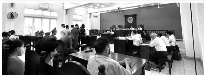
●HĐXX dự kiến sẽ tuyên án với các bị cáo vào hôm nay (25/10).

Gia đình Xuân đã bồi thường cho 31/32 gia đình nạn nhân tử vong và 3 người bị thương gần 3 tỷ đồng. Thân nhân 32 bị hại yêu cầu Xuân bồi thường thêm 27 tỷ đồng (tiền mai táng, tổn thất tinh thần, cấp dưỡng nuôi con, nuôi cha mẹ nạn nhân).