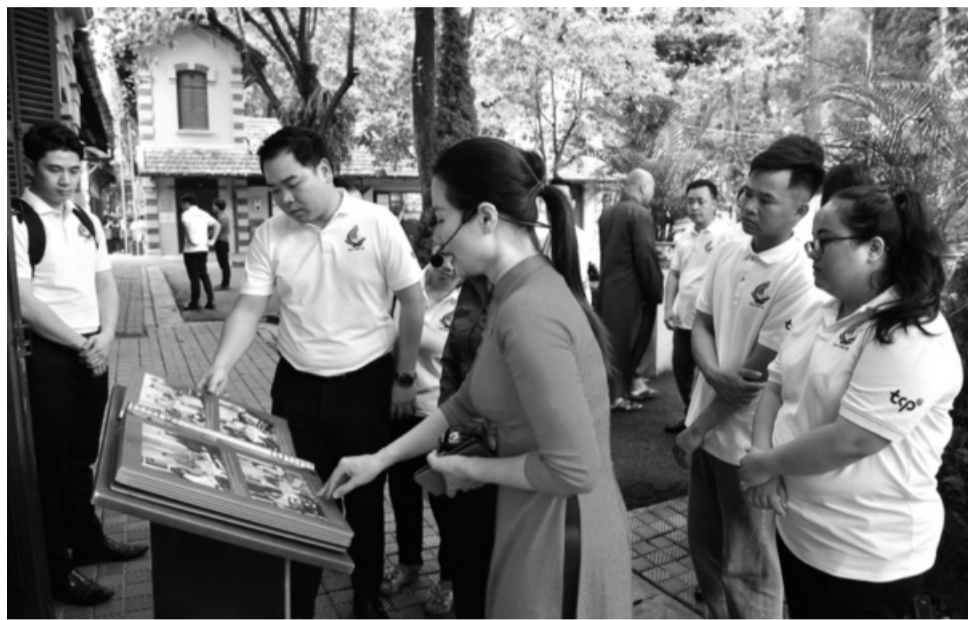
● 20 gương mặt Thanh niên sống đẹp 2024 cùng xem lại những hình ảnh quý giá của Chủ tịch Hồ Chí Minh lúc sinh thời.

Từ đổi mới năm 1986 đến nay, Đảng ta đã ban hành 03 Nghị quyết chuyên đề về CTTN. Ngày 09/02/1991, Bộ Chính trị ban hành Nghị quyết số 25-NQ/TW về đổi mới và tăng cường sự lãnh đạo của Đảng đối với CTTN. Nghị quyết có tầm quan trọng đặc biệt, là điểm khởi đầu cho đường lối đổi mới của Đảng về CTTN thời kỳ đổi mới. Nghị quyết số 04-NQ/HNTW ngày 14/01/1993 Hội nghị Trung ương lần thứ tư khóa VII về công tác thanh niên trong thời kỳ mới đã khẳng định “Công tác thanh