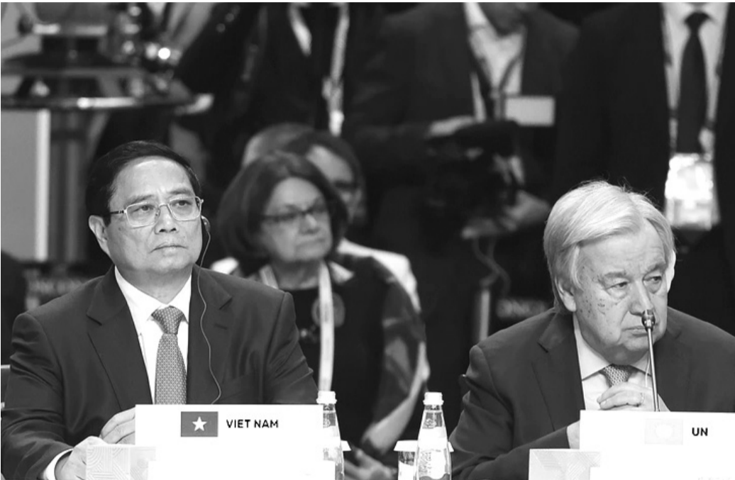
● Thủ tướng Phạm Minh Chính dự và phát biểu tại phiên toàn thể Hội nghị các nhà lãnh đạo nhóm BRICS mở rộng.

Sáng 24/10 (giờ địa phương, chiều cùng ngày theo giờ Hà Nội), tại Kazan, Nga, Thủ tướng Phạm Minh Chính tham dự và phát biểu tại Phiên toàn thể Hội nghị các Nhà lãnh đạo Nhóm các nền kinh tế mới nổi (BRICS) mở rộng.