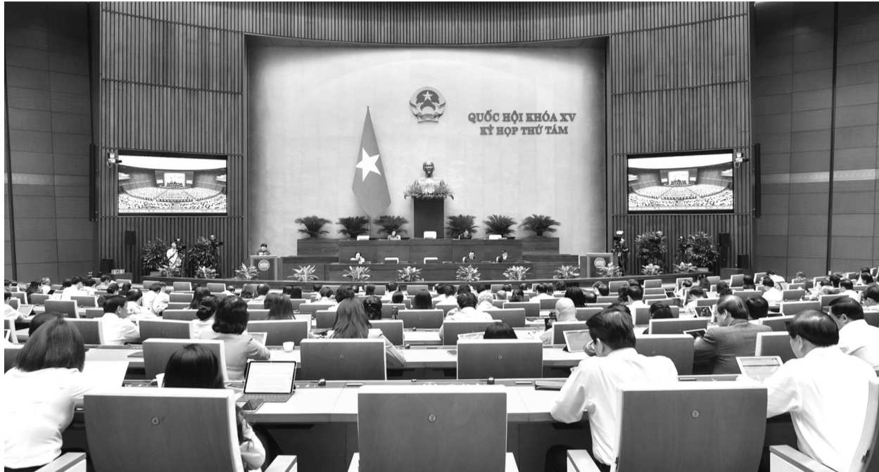
● Quang cảnh phiên họp. (Ảnh: Quochoi.vn)

Sáng 24/10, tại phiên thảo luận ở hội trường của Quốc hội về một số nội dung còn ý kiến khác nhau của dự thảo Luật Công đoàn (sửa đổi), đa số các đại biểu tán thành với quy định về việc gia nhập và hoạt động công đoàn của người lao động là người nước ngoài.