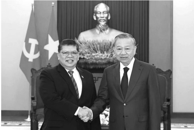
● Tổng Bí thư Tô Lâm tiếp Chủ tịch Hạ viện Malaysia Tan Sri Dato' Johari Bin Abdul.

Chủ tịch Hạ viện Malaysia đánh giá cao và ghi nhận các ý kiến của Tổng Bí thư Tô Lâm; đồng thời cho biết trên cương vị Chủ