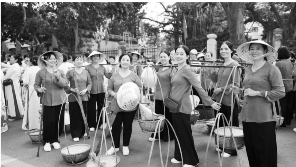
● Thanh niên hóa thân trở thành những cô gái Tiến về Hà Nội năm 1954.

niên là vấn đề sống còn của dân tộc, là một trong những nhân tố quyết định sự thành bại của cách mạng”. Đây là bước chuyển biến có tính đột phá, căn bản trong nhận thức, chủ trương của Đảng đối với CTTN. Và ngày 25/7/2008, Hội nghị Trung ương lần thứ bảy khóa X ban hành Nghị quyết số 25-NQ/TW về tăng cường sự lãnh đạo của Đảng đối với CTTN thời kỳ đẩy mạnh công nghiệp hóa, hiện đại hóa. Theo đó, Nghị quyết tiếp tục khẳng định vai trò to lớn và quan trọng của thanh niên đối với tương lai của dân tộc và tiền đồ của cách mạng Việt Nam: “Thanh niên là rường cột của nước nhà, chủ nhân tương lai của đất nước, là lực lượng xung kích trong xây dựng và bảo vệ Tổ quốc, một trong những nhân tố quyết định sự thành bại của sự nghiệp công nghiệp hóa, hiện đại hóa đất nước, hội nhập quốc tế và xây dựng chủ nghĩa xã hội.