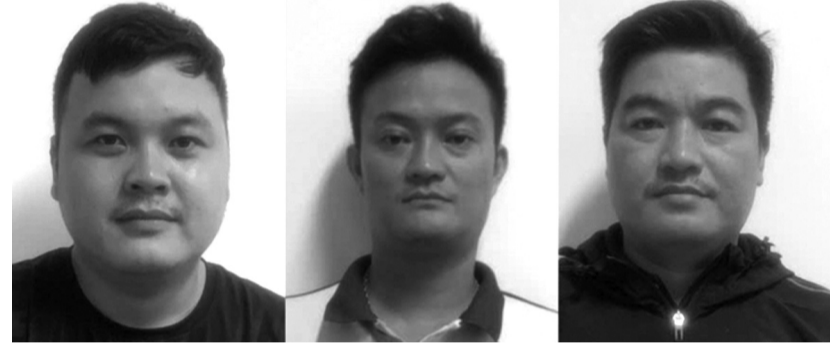
● Một số đối tượng đã bị bắt để điều tra hành vi "Mua bán, tàng trữ trái phép chất độc".

Công an đã thu gần 9.500kg xyanua, 315kg acid sulfuric, 105kg acid clorhidric cùng nhiều tang vật khác; khẩn trương truy xét các đầu mối tiêu thụ xyanua tại 11 tỉnh, thành để thu hồi hơn 318,5kg xyanua mua bán trái phép.