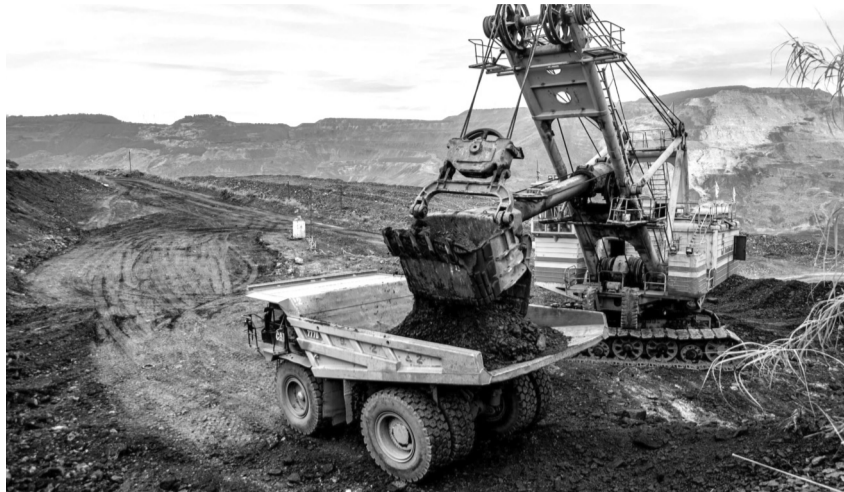
● Khai thác than tại khai trường của Cty Than Cao Sơn.

Ngay sau khi cơn bão số 3 (Yagi) đổ bộ trực tiếp vào Quảng Ninh gây thiệt hại và ảnh hưởng lớn đến việc thực hiện phương án tổ chức sản xuất của Cty và toàn Tập đoàn TKV; song song với việc tổ chức khắc phục hậu quả sau bão, Cty đã tập trung giúp