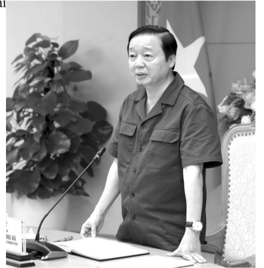
● Phó Thủ tướng Trần Hồng Hà yêu cầu nghiên cứu quyết sách mẫu chốt để khơi thông thị trường bất động sản.