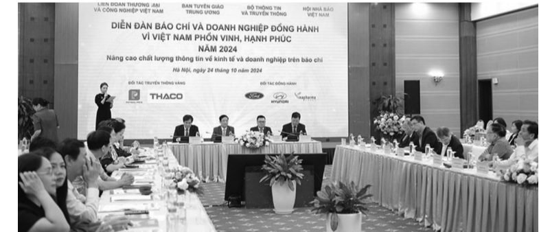
● Quang cảnh Diễn đàn.