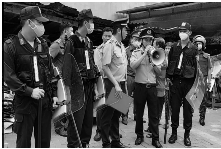
● Chấp hành viên Chi cục THADS huyện Long Điền, tỉnh Bà Rịa - Vũng Tàu phối hợp tổ chức cưỡng chế thi hành án.

Đối với công tác thi hành án hành chính (THAHC), tổng số vụ việc theo dõi là 187, trong đó đã thi hành xong 82 vụ việc, đang thi hành 105 vụ việc. Theo Cục THADS tỉnh, trong số 105 bản án, quyết định chưa được thi hành xong thuộc trách nhiệm thi hành của UBND, Chủ tịch UBND các cấp trên địa bàn vẫn còn có