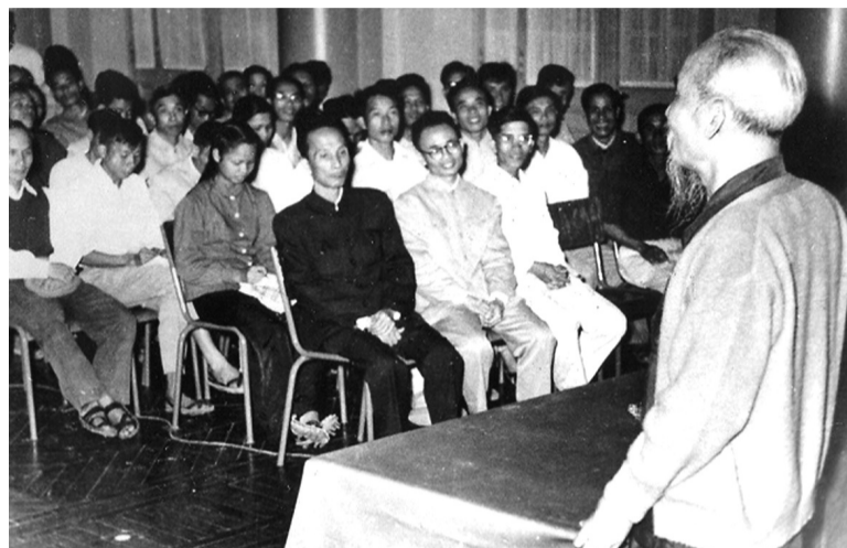
● Chủ tịch Hồ Chí Minh lúc sinh thời luôn chăm lo đến công tác xây dựng Đảng, trong đó đặc biệt là công tác giáo dục, rèn luyện phẩm chất đạo đức, lối sống của người cán bộ, đảng viên.

Những tác hại của tệ nạn tham nhũng gây ra như “giặc nội xâm” làm cản trở sự phát triển của đất nước, đã và đang làm xói mòn lòng tin của Nhân dân vào sự quản lý của Nhà nước. Thực vậy, Đại hội đại biểu toàn quốc lần thứ XIII của Đảng đã nhấn mạnh “tham nhũng vẫn là một trong những nguy cơ đe dọa sự tồn vong của Đảng và chế độ”. Trong cuộc đấu tranh này, mỗi đảng viên cần phát huy trách nhiệm tiên phong, gương mẫu và đặc biệt là “cái dưng” - sự dũng cảm, bản lĩnh và quyết tâm bảo vệ sự trong sạch, vững mạnh của Đảng và chế độ XHCN.