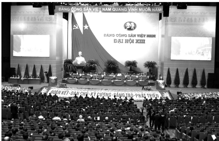
● Đại hội đại biểu toàn quốc lần thứ XIII của Đảng đã nhấn mạnh: “Tham nhũng vẫn là một trong những nguy cơ đe dọa sự tồn vong của Đảng và chế độ”.

Về văn hoá, tham nhũng là tệ nạn xã hội, là cái xấu nhiều khi được che đậy bằng những hình thức có vẻ “văn hoá” và công khai như quà tặng sinh nhật của cấp dưới dành cho cấp trên, lễ mừng tân gia của cán bộ, công chức được các doanh nghiệp tặng