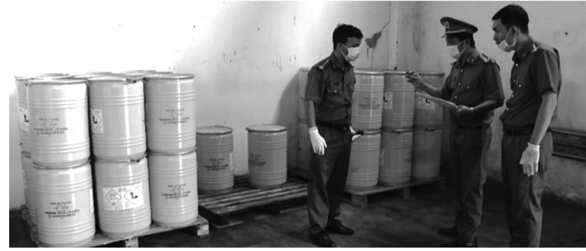
● Cảnh sát khám nghiệm một kho chứa độc chất.

Công an TP HCM cho biết, sau hơn 1 tháng triển khai thực hiện kế hoạch tăng cường đấu tranh, xử lý các hành vi vi phạm pháp luật liên quan kinh doanh hóa chất nguy hiểm độc hại (đặc biệt là xyanua) trên địa bàn, đơn vị đã khởi tố 5 vụ án với 17 bị can để điều tra hành vi "Mua bán, tàng trữ trái phép chất độc".