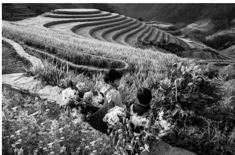
● Phát triển du lịch giúp người dân tộc thiểu số xóa đói giảm nghèo.

Du lịch cộng đồng hiện nay đang là ngành công nghiệp không khói giúp nhiều tỉnh, thành phố phát triển kinh tế - xã hội. Có không ít bản làng dân tộc thiểu số đã xóa đói giảm nghèo nhờ du lịch. Tuy nhiên, còn những nơi đang gặp khó khăn trong việc “đánh thức” tiềm năng này.