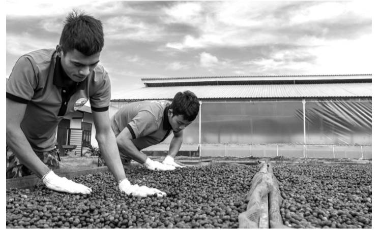
● Những hạt cà phê chín đỏ, căng đầy được sơ chế.