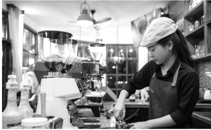
● Cà phê Ngon Avatar luôn cố gắng mang đến sản phẩm tốt nhất cho người tiêu dùng.

Nắm được nhu cầu thưởng thức cà phê của người Việt, Ngon Avatar mong muốn