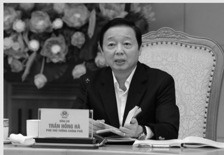
● Phó Thủ tướng Trần Hồng Hà yêu cầu đánh giá tác động của các văn bản pháp luật.

Theo báo cáo của Bộ Giao thông vận tải (GTVT), dự thảo Nghị định quy định chi tiết có 9 chương, 71 điều. Quan điểm đột phá trong dự thảo Nghị định này là đẩy mạnh phân quyền, phân cấp trong đầu tư phát triển kết cấu hạ tầng đường bộ và trong quản lý, khai thác, sử dụng, bảo trì kết cấu hạ tầng đường bộ. Cơ quan soạn thảo đã tiếp thu ý kiến về trình tự, thủ tục trình Thủ tướng Chính phủ giao UBND cấp tỉnh quản lý quốc lộ; làm rõ các trường hợp sử dụng tạm thời lòng đường, vỉa hè vào mục đích khác GTĐB. Bên cạnh đó, Bộ GTVT đã giải trình quy định về thẩm