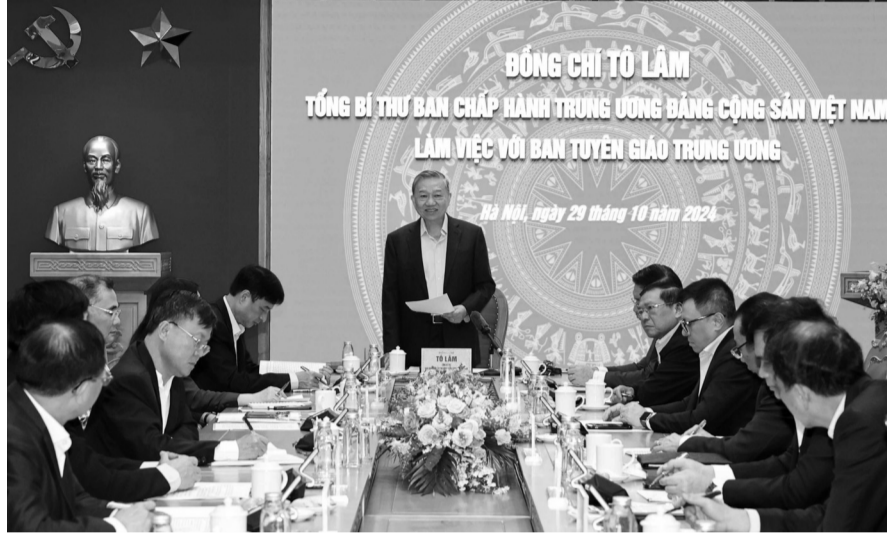
● Tổng Bí thư Tô Lâm phát biểu chỉ đạo tại cuộc làm việc với Ban Tuyên giáo Trung ương.

Định hướng nhiệm vụ trong thời gian tới, Tổng Bí thư Tô Lâm yêu cầu cần thống nhất nhận thức công tác tuyên giáo là công tác của Đảng, của các cấp ủy, tổ chức đảng, mỗi chi bộ,