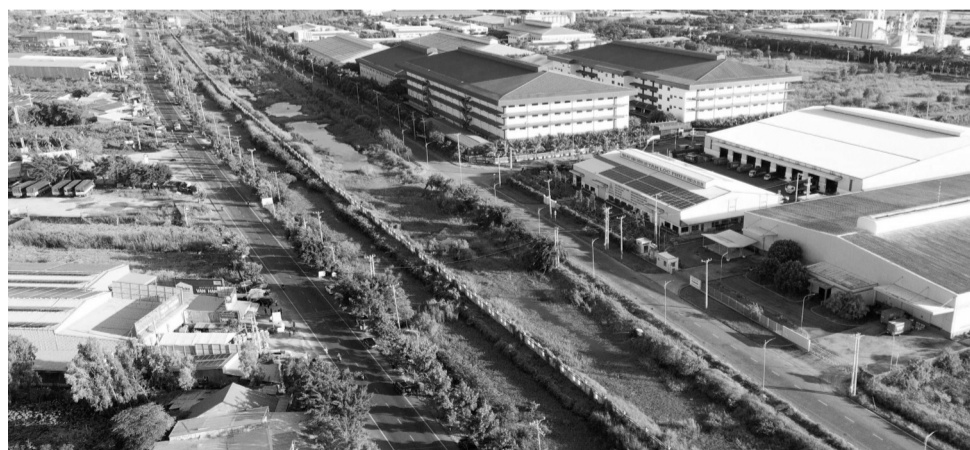
● Một góc Khu công nghiệp Thạnh Lộc (huyện Châu Thành, Kiên Giang).

Sở Kế hoạch và Đầu tư Kiên Giang cho biết, số lượng doanh nghiệp (DN) đăng ký thành lập mới trong tỉnh với số vốn đăng