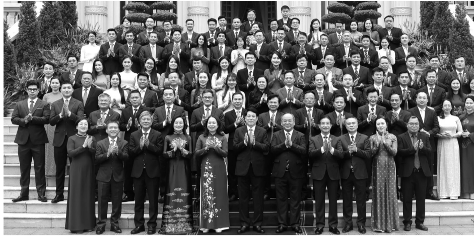
● Chủ tịch nước Lương Cường, Phó Chủ tịch nước Võ Thị Ánh Xuân với lãnh đạo, cán bộ, công chức, viên chức, người lao động Văn phòng Chủ tịch nước.

Phát biểu tại buổi gặp mặt, Chủ tịch nước Lương Cường bày tỏ vui mừng và xúc động được gặp gỡ toàn thể đội ngũ lãnh đạo, công chức, người lao động của Văn phòng Chủ tịch nước - cơ quan sẽ gắn bó, đồng hành và giúp Chủ tịch nước thực hiện nhiệm vụ trên cương vị mới được Đảng, Nhà nước và Quốc hội tin tưởng giao phó. Chủ tịch nước chỉ rõ, trải qua 75 năm xây dựng, phấn đấu và trưởng thành, đặc biệt là hơn 30 năm chính thức tái lập, các thể hệ cán bộ, công chức, người lao động Văn phòng Chủ tịch nước đã có nhiều cố gắng trong công tác tổ chức và hoạt động, tăng cường phối hợp với các cơ quan Trung ương và địa phương, không ngừng nâng cao chất lượng và hiệu quả công tác; phục vụ tốt các hoạt động đối nội, đối ngoại của Chủ tịch nước, Phó Chủ tịch nước theo quy định của Hiến pháp, pháp luật và các nhiệm vụ theo sự phân công của Bộ Chính trị, Ban Bí thư, Ban Chấp hành Trung ương.