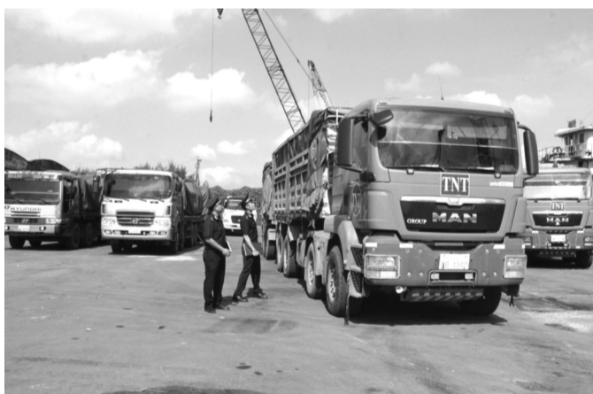
● Cán bộ Hải quan tỉnh Nghệ An giám sát hàng hóa XNK.

10 tháng đầu năm 2024 đạt 610,6 tỷ USD, tăng 12,5% (trương đương tăng 67,8 tỷ USD) so với cùng kỳ 2023. Trong đó, kim ngạch XK đạt 315,9 tỷ USD, tăng 8,2% và kim ngạch NK đạt 294,7 tỷ USD, tăng 17,5% so với cùng kỳ 2023.