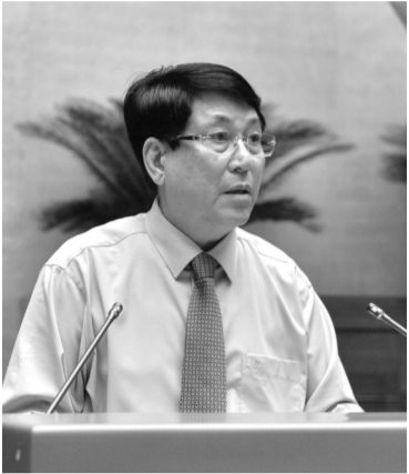
● Phát biểu chỉ đạo Hội nghị toàn quốc quán triệt Quy định số 144-QĐ/TW về chuẩn mực đạo đức cách mạng của cán bộ, đảng viên trong giai đoạn mới, Đồng chí Lương Cường (hiện là Chủ tịch nước, khi đó là Thường trực Ban Bí thư) yêu cầu cấp ủy, tổ chức đảng, cán bộ, đảng viên triển khai thực hiện nghiêm túc, hiệu quả, để tạo chuyển biến rõ rệt về nhận thức và hành động.