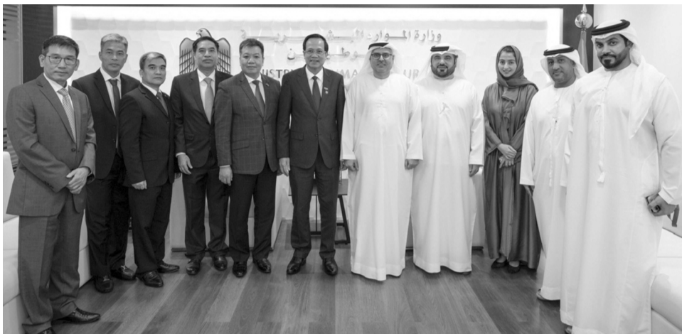
● Bộ Lao động - Thương binh và Xã hội Việt Nam và Bộ Nguồn nhân lực UAE đã có buổi làm việc song phương ngày 28/10/2024.

đúng trọng tâm, hai Bộ trưởng cùng nhìn nhận và đánh giá khách quan những kết quả đạt được và hạn chế trong việc hợp tác về LĐ giữa hai nước trong thời gian qua, trong đó số lượng LĐ Việt Nam sang làm việc tại UAE vẫn chưa đáp ứng được nhu cầu mong muốn và tiềm năng của hai bên.