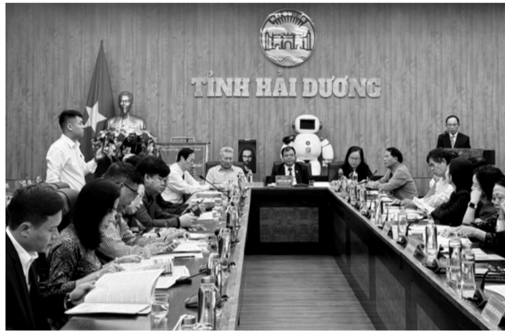
● Hội nghị được tổ chức tại Hải Dương.