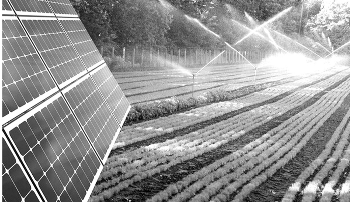
● Cần sớm ban hành danh mục dự án xanh để nhân rộng mô hình sản xuất xanh trong các lĩnh vực.

Chính sách về tín dụng xanh đã được ban hành. Nguồn vốn cho tín dụng xanh cũng đáng kể nhưng doanh nghiệp muốn tiếp cận vẫn còn khó khăn. Do đó, cần nhiều chính sách cụ thể để có thể “mở khóa” nhà băng.