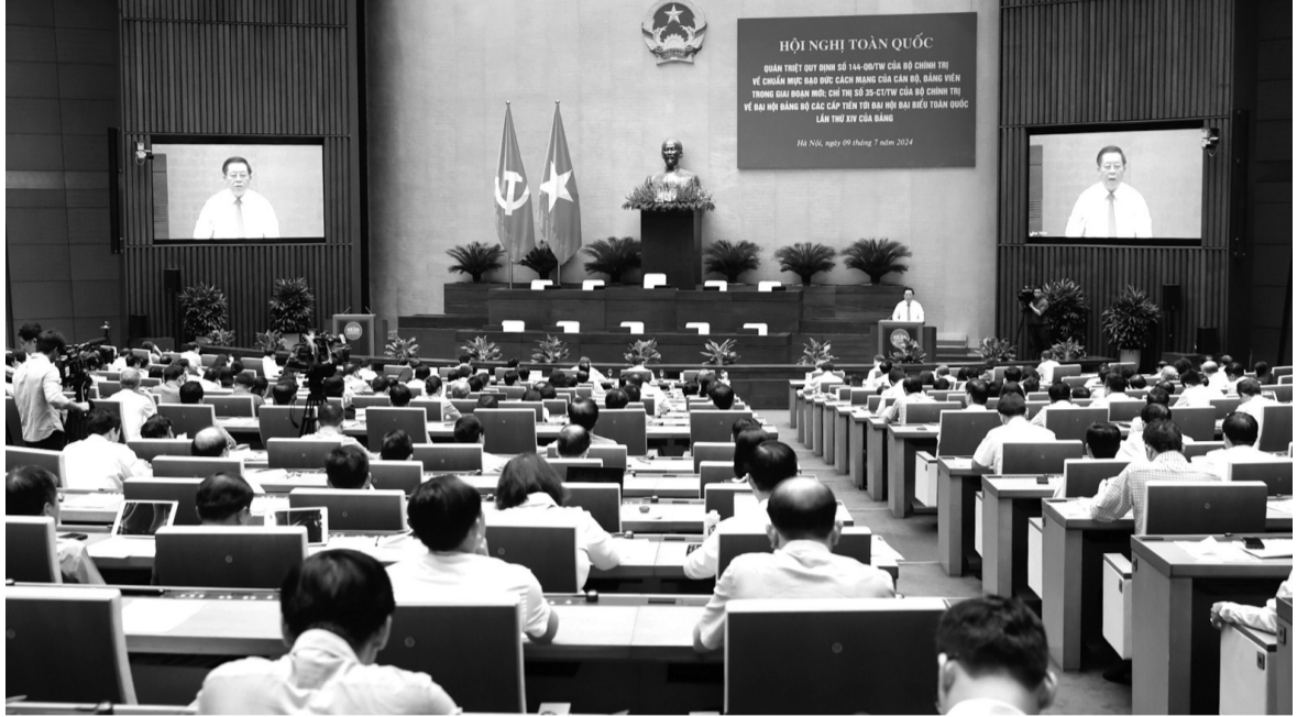
● Hội nghị toàn quốc quán triệt Quy định số 144-QĐ/TW và Chỉ thị số 35-CT/TW của Đảng được tổ chức bằng hình thức trực tiếp từ Hội trường Diên Hồng, Nhà Quốc hội và kết hợp trực tuyến tới 15.644 điểm cầu trong cả nước (tháng 7/2024).

Chủ tịch Hồ Chí Minh từng dạy, muốn “diệt cỏ dại phải trồng nhiều hoa”. Và muốn hoa tốt tươi, ngoài việc tưới tẩm, chăm bón mỗi ngày chúng ta còn phải siêng “nhặt cỏ”, “bắt sâu”. “Xây” hay “phòng” và “chống” như hai bánh của một cái xe vững chắc. “Chống” triệt để, bảo đảm cho công việc “xây” thành công. “Xây” phát triển mạnh mẽ thì đối tượng “chống” sẽ được xóa bỏ tận gốc. Vì vậy, để thực hiện nhiệm vụ nâng cao đạo đức cách mạng, chống chủ nghĩa cá nhân, nhất thiết phải triển khai đồng bộ trên cả hai mặt “xây” và “chống”. Đó là mỗi