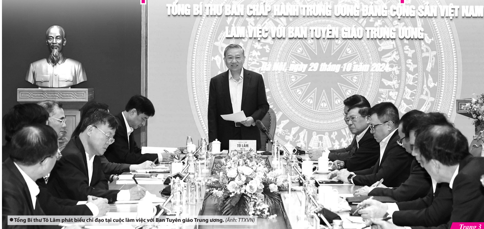
● Tổng Bí thư Tô Lâm phát biểu chỉ đạo tại cuộc làm việc với Ban Tuyên giáo Trung ương.