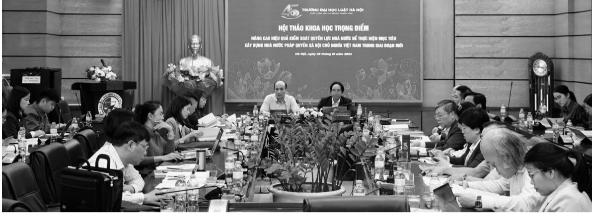
● Toàn cảnh Hội thảo.

Ngày 29/10, Trường Đại học Luật Hà Nội đã tổ chức Hội thảo khoa học trọng điểm với chủ đề “Nâng cao hiệu quả kiểm soát quyền lực nhà nước để thực hiện mục tiêu xây dựng Nhà nước pháp quyền xã hội chủ nghĩa Việt Nam trong giai đoạn mới”.