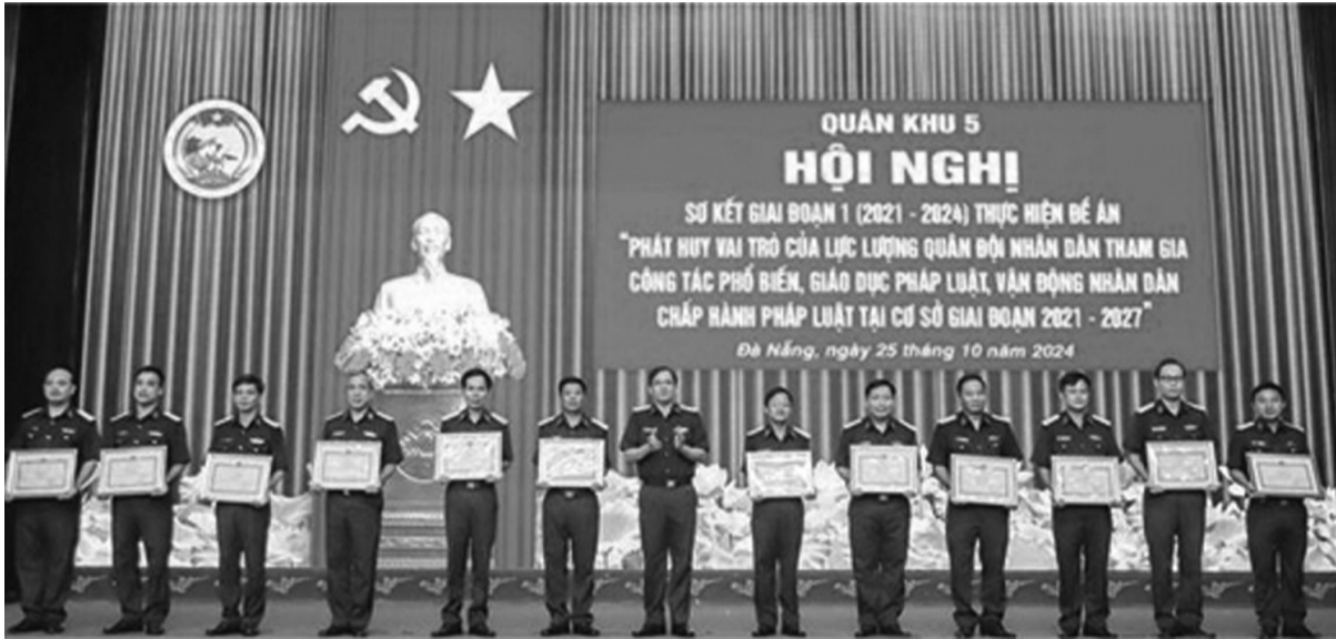
● Một số tập thể, cá nhân được tặng Bằng khen trong quá trình thực hiện Đề án 1371.

Nhằm nâng cao khả năng tiếp cận và hiệu quả tuyên truyền, phổ biến, giáo dục pháp luật (PBGDPL), Cục Chính trị Quân khu (QK) 5 đã chỉ đạo cơ quan chuyên môn ứng dụng trí tuệ nhân tạo (AI) vào xây dựng các video ngắn, tranh cổ động, tuyên truyền về pháp luật đăng trên các trang, nhóm Zalo, Facebook, Mocha của các cơ quan, đơn vị; chỉ đạo mở mục "Hỏi - đáp pháp luật" trên fanpage tài khoản Facebook "Đất và Người Khu 5" vào Chủ nhật hàng tuần, tạo được lượng tương tác lớn, hiệu quả.