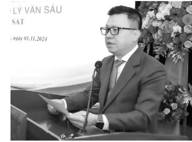
● Tổng Biên tập Báo Nhân Dân, Phó Trưởng Ban Tuyên giáo Trung ương, Chủ tịch Hội Nhà báo Việt Nam Lê Quốc Minh phát biểu tại Tọa đàm.