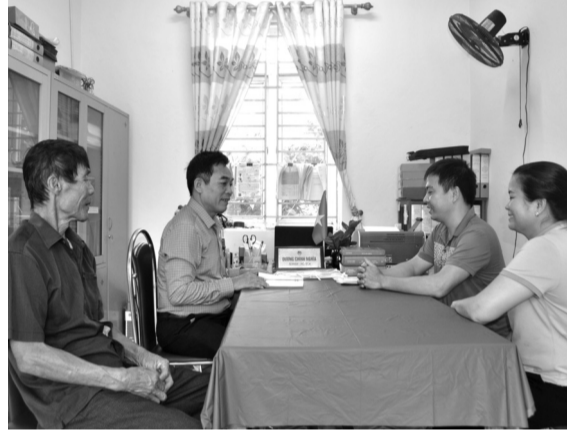
● Không kể trưa hay tối, người dân chưa xong việc là anh còn ở lại phòng làm việc giải quyết hồ sơ, thủ tục cũng như giải đáp những thắc mắc về pháp luật cho người dân.

nghiên cứu những nội dung văn bản pháp luật mới, đồng thời tự nghiên cứu sách báo để áp dụng cho công tác tuyên truyền, phổ biến pháp luật đến người dân sao cho ngắn gọn, súc tích, dễ hiểu nhất.