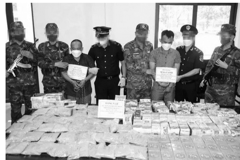
● Lực lượng chức năng Hà Tĩnh bắt nhóm đối tượng vận chuyển khoảng 70kg ma túy vào ngày 9/5/2024.

tiền chất, thuốc gây nghiện, thuốc hướng thần, thuốc thú y có chứa chất ma túy, tiền chất; xóa bỏ cơ bản và bền vững việc trồng và tái trồng cây có chứa chất ma túy.