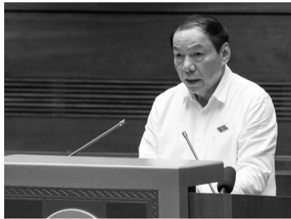
● Bộ trưởng Bộ Văn hóa, Thể thao và Du lịch Nguyễn Văn Hùng trình bày Tờ trình.

Lưu ý thời gian thực hiện Chương trình là 11 năm, được chia làm 3 giai đoạn với tổng kinh phí là hơn 256.000 tỷ đồng, Đại biểu đề nghị rà soát, đánh giá khả năng huy động, bố trí tài chính và việc giải ngân vốn của Chương trình, nhất là trong bối cảnh năm 2025, chúng ta dự kiến sẽ bố trí và thực hiện hoàn thành gói 400 tỷ đồng