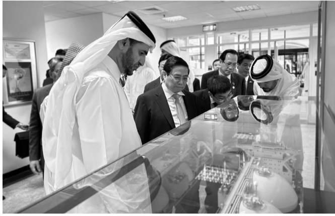
● Thủ tướng Phạm Minh Chính nghe giới thiệu khi tham quan khu liên hợp hóa dầu Ras Laffan.

Điểm lại những kết quả chính của chuyến thăm, Phó Thủ tướng, Bộ trưởng Bộ Ngoại giao Bùi Thanh Sơn nhấn mạnh, trong khuôn khổ chuyến thăm, nhiều văn kiện quan trọng đã được thông qua. Đó là Tuyên bố chung về nâng cấp quan hệ Việt Nam - UAE lên Đối tác Toàn diện, Thông cáo chung giữa Việt Nam