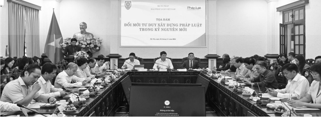
● Tọa đàm đã thu hút sự tham gia của đông đảo nhà quản lý và chuyên gia pháp luật hàng đầu.