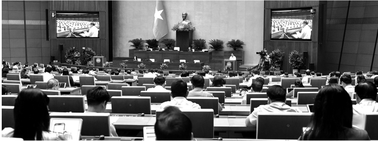
● Toàn cảnh phiên họp.

Sáng 1/11, Quốc hội thảo luận tại hội trường về chủ trương đầu tư Chương trình mục tiêu quốc gia về phát triển văn hóa giai đoạn 2025 - 2035 (Chương trình). Một số ý kiến đề nghị rà soát, đánh giá khả năng huy động, bố trí tài chính và việc giải ngân vốn để bảo đảm hiệu quả của Chương trình.