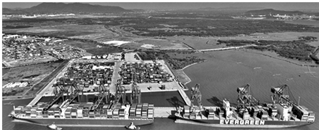
● Kỳ vọng sớm thành lập khu thương mại tự do gắn với cảng Cái Mép - Thị Vải.

Việt Nam đang tích cực nghiên cứu về các khu thương mại tự do trên thế giới. Đây là một loại hình khu kinh tế có thể mang lại nhiều lợi ích cho Việt Nam, góp phần thúc đẩy dịch vụ logistics.