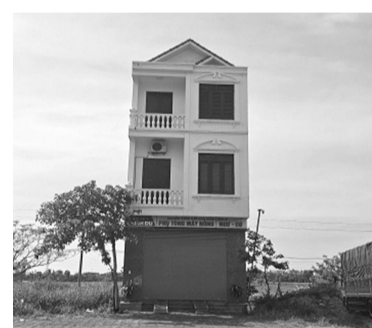
● Ngôi nhà 3 tầng xây trên đất của 2 nhà hàng xóm.

Sở TN&MT đề nghị UBND TP Chí Linh chỉ đạo tập trung làm