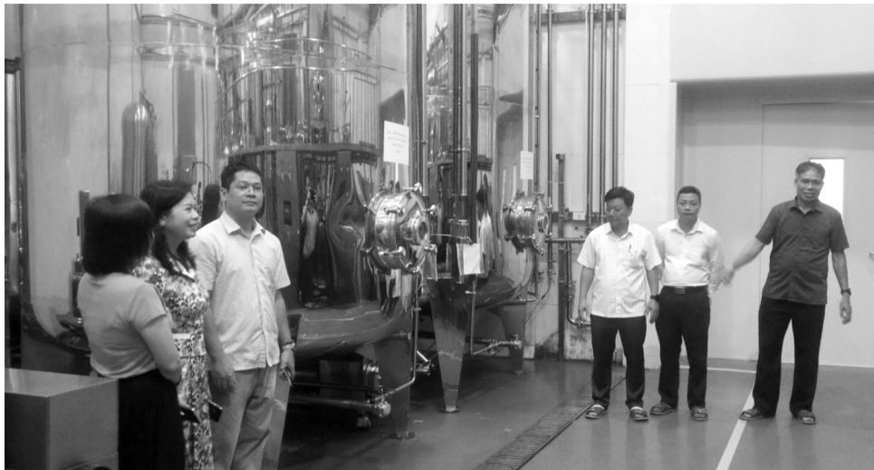
● Nghiệm thu Công ty CP Ong Tam Đảo.

Sau thời gian triển khai thực hiện hoàn thành các nội dung theo yêu cầu, Trung tâm Phát triển Công thương tỉnh Vĩnh Phúc tổ chức nghiệm thu cơ sở đề án “Hỗ trợ kinh phí đầu tư máy móc