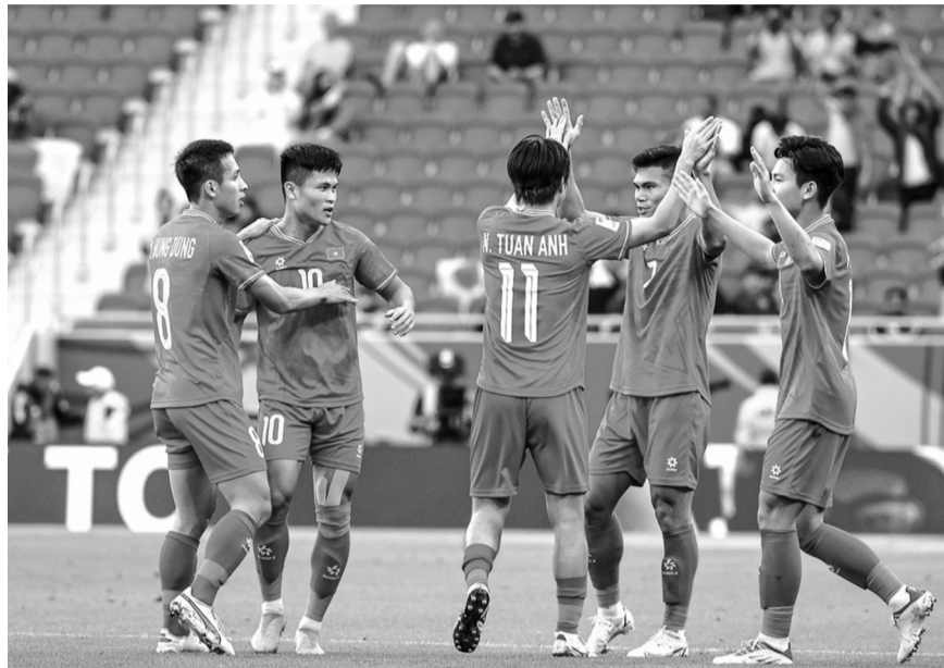
● Người hâm mộ chờ đón lối chơi mới thuyết phục hơn của đội tuyển Việt Nam.

Indonesia, đối thủ chung bảng với đội tuyển Việt Nam dù để thua Trung Quốc 1 - 2 tại Vòng loại thứ 3 World Cup 2026, nhưng vẫn là đối thủ trên tầm chúng ta ở hiện tại. Đây sẽ là trở ngại rất lớn cho tham vọng của ông