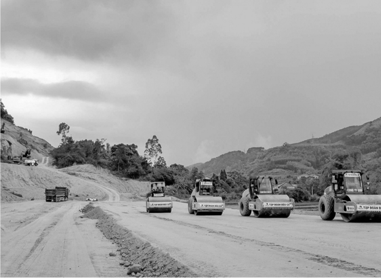
● Thi công cao tốc Hữu Nghị - Chi Lăng.

Dự án đường bộ cao tốc Hữu Nghị - Chi Lăng trên địa bàn tỉnh Lạng Sơn nằm trong danh sách các công trình, dự án quan trọng quốc gia, trọng điểm ngành Giao thông vận tải. Xác định rõ tầm quan trọng của dự án, các địa phương có dự án đi qua đang nỗ lực thực hiện công tác giải phóng mặt bằng (GPMB).