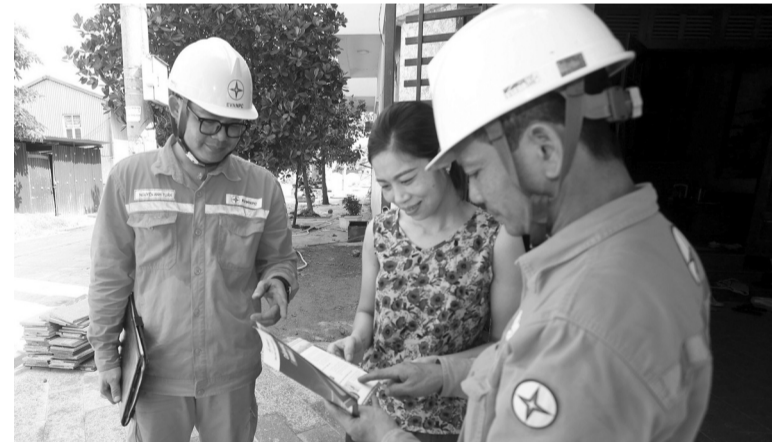
● Cán bộ Công ty Điện lực Vĩnh Phúc tuyên truyền, hướng dẫn người dân sử dụng điện tiết kiệm, tiết kiệm năng lượng.