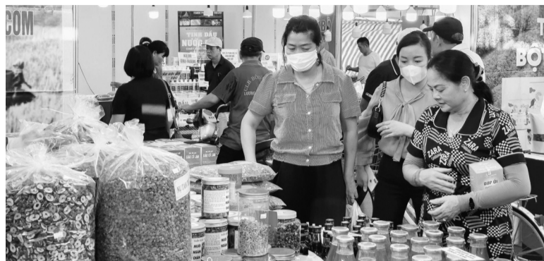
● Tại Hải Phòng, tổng mức bán lẻ hàng hóa và doanh thu dịch vụ 10 tháng năm 2024 ước đạt 185.559 tỷ đồng.

Vì vậy, trước, trong và sau bão số 3, hoạt động kinh doanh thương mại trên địa bàn TP ổn định, nguồn