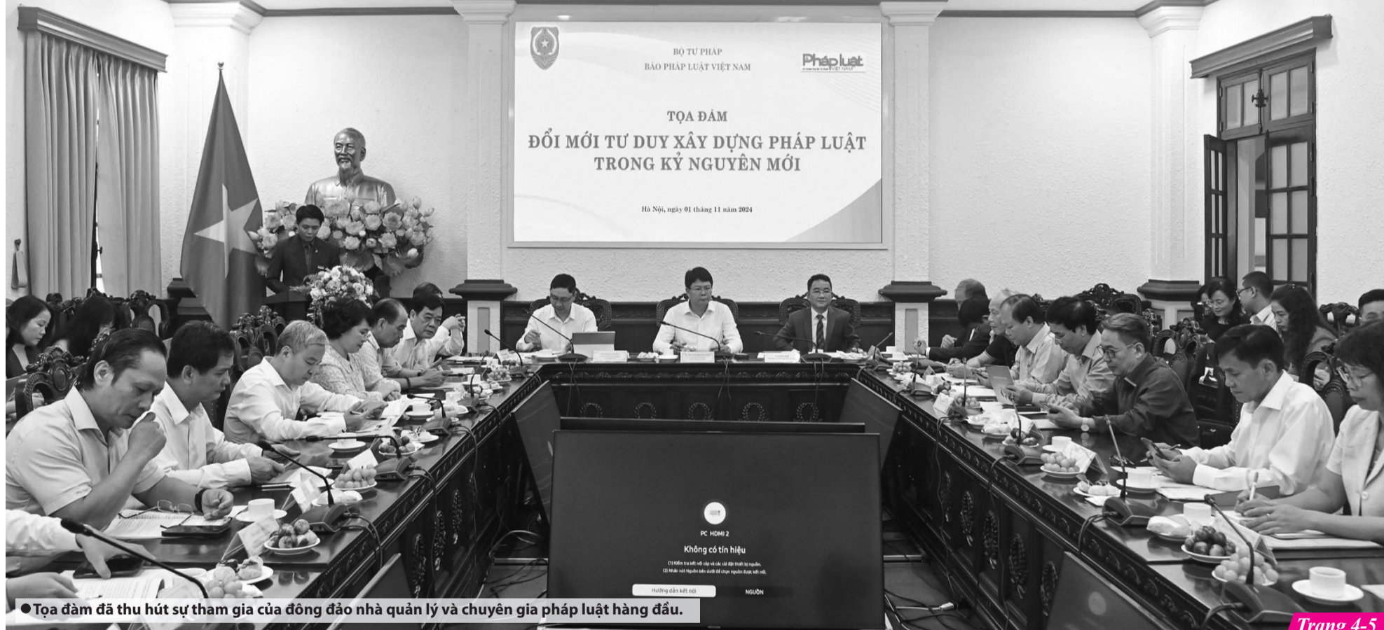
● Tọa đàm đã thu hút sự tham gia của đông đảo nhà quản lý và chuyên gia pháp luật hàng đầu.