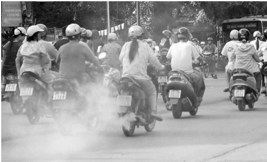
● Khí thải xe máy là vấn đề nhức nhối với ngành Giao thông và ngành Môi trường.

Tuy nhiên, VCCI cho rằng, bối cảnh hiện tại đã thay đổi, khi thị trường có nhiều loại xe máy điện và xe đạp điện có thể thay thế xe gắn máy dưới 50cc. Theo quy định, xe máy điện có vận tốc dưới 50km/h cũng không yêu