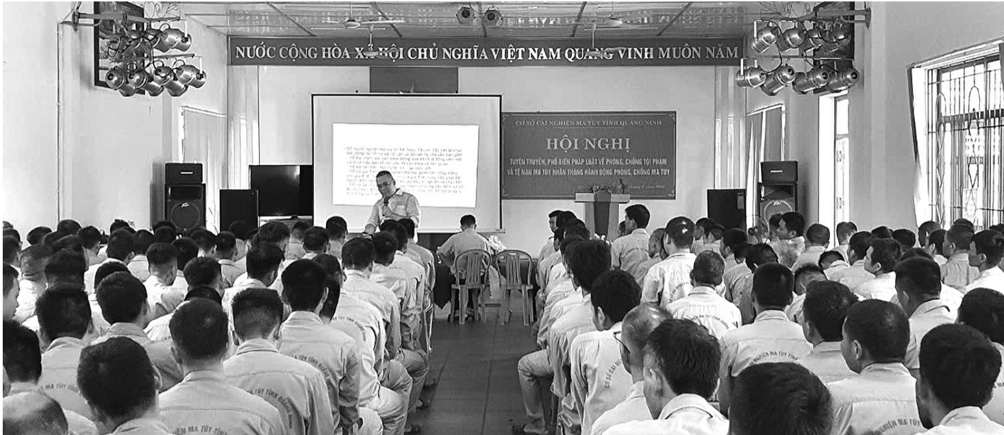
● Cơ sở Cai nghiện ma túy Quảng Ninh tổ chức các chuyên đề về bổ trợ kiến thức pháp luật cho các học viên, góp phần làm giảm tỷ lệ tội phạm và vi phạm pháp luật trong cộng đồng.