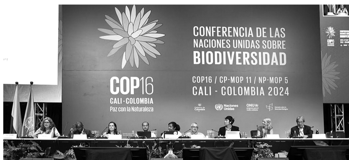
● Các chuyên gia toàn cầu khẳng định mối quan hệ chặt chẽ giữa hành động về khí hậu và ĐDSH.

Trước thềm COP16, trong thông điệp qua video gửi đến Hội nghị, Tổng Thư ký Liên hợp quốc Antonio Guterres cho rằng thế giới đang đi chệch hướng trong việc thực hiện các mục tiêu