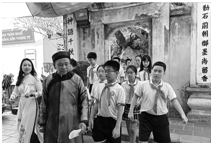
● Học sinh tham quan di tích đền Đông Cổ (Tây Hồ, Hà Nội).