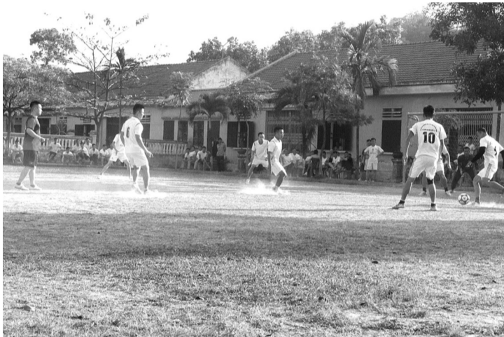
● Hào hứng với môn thể thao ưa thích.