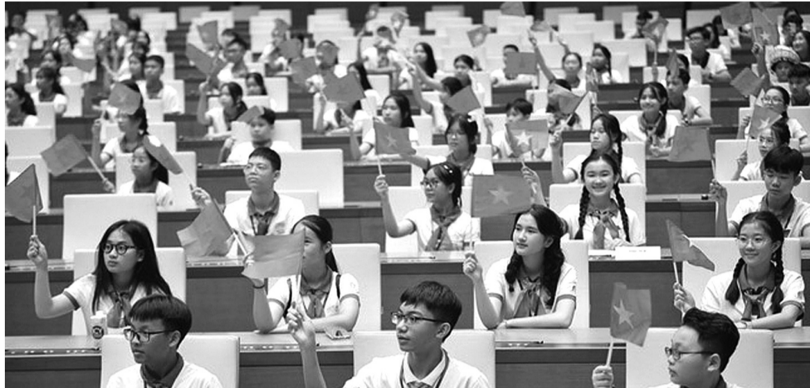
● Các đại biểu thiếu nhi tham gia Phiên họp gia đình Quốc hội trẻ em lần thứ 1 năm 2023.

Để trẻ em trở thành những công dân có trách nhiệm với đất nước và cộng đồng, đồng thời với việc phát hiện, đào tạo các tiềm năng của mỗi đứa trẻ, cần khuyến khích trẻ lên tiếng về mọi vấn đề mà trẻ nhận thức được. Chính vì thế, quyền tham gia của trẻ em là một trong 4 nhóm quyền cơ bản theo Công ước quốc tế về quyền trẻ em mà Việt Nam là thành viên và được quy định tại hệ thống pháp luật về trẻ em ở Việt Nam.