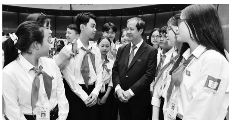
● Bộ trưởng Bộ GD&ĐT Nguyễn Kim Sơn trò chuyện với các em học sinh tham gia Phiên họp giả định Quốc hội trẻ em lần thứ 2 năm 2024.