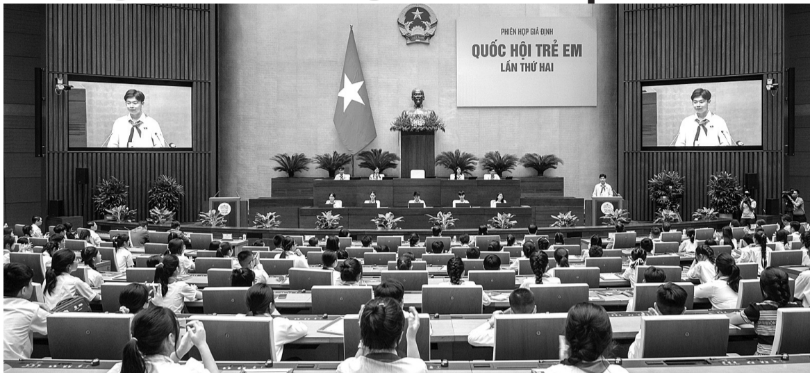
● Toàn cảnh Phiên họp giả định Quốc hội trẻ em lần thứ II năm 2024.