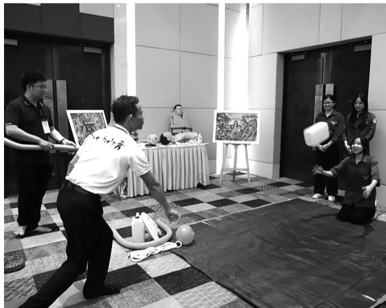
● Chuyên gia hướng dẫn các tình huống tại Hội nghị khoa học quốc gia lần thứ 4 về phòng, chống tai nạn thương tích.

Trên thực tế, công tác phòng, chống tai nạn thương tích tại nước ta đã đạt được một số kết quả nhất định. Từ năm 2012 đến nay, tỷ suất tử vong do tai nạn