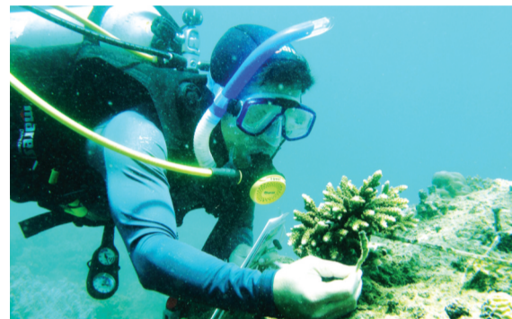
● Một hoạt động kiểm tra các rạn san hô ở Khu dự trữ sinh quyển thế giới Cù Lao Chàm.