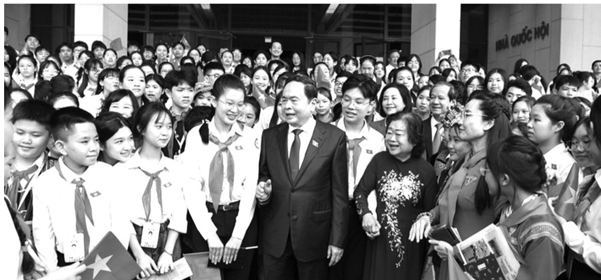
● Chủ tịch Quốc hội Trần Thanh Mẫn với các đại biểu.

Chủ tịch Quốc hội cho biết, sau Phiên họp thứ nhất năm 2023, một số kiến nghị của trẻ em đã được các Bộ, ngành quan tâm tổ chức thực hiện. Đảng, Nhà nước luôn dành sự quan tâm, chăm lo đặc biệt tới sự nghiệp bảo vệ, chăm sóc, giáo dục trẻ em. Tuy nhiên, bên cạnh những kết quả đạt được vẫn còn nhiều trở ngại khi trẻ em ở một số nơi còn gặp khó khăn trong tiếp cận những dịch vụ giáo dục, chăm sóc sức khỏe, đảm bảo dinh dưỡng; trẻ em bị bạo lực, bạo hành, xâm hại, tai nạn, thương tích còn xảy ra. Tình trạng bạo lực học đường, các loại thuốc lá thế hệ mới và chất kích thích đã và đang tác động tiêu cực tới sức khỏe thể chất, tinh thần của trẻ em. Vì vậy, Phiên họp giả định Quốc hội trẻ em lần thứ II đã lựa chọn hai chủ đề này là rất thiết thực, được dư luận xã hội quan tâm. Sau Phiên họp thứ nhất năm 2023, một số kiến nghị của trẻ em đã được các Bộ, ngành quan tâm tổ chức thực hiện.