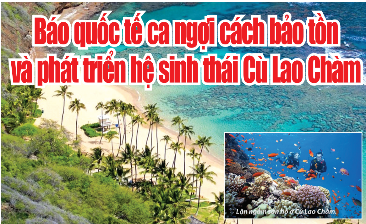
● Cù Lao Chàm được UNESCO công nhận là Khu dự trữ sinh quyển thế giới.

Các giá trị đặc trưng, nổi trội đó là: Khu Bảo tồn biển Cù