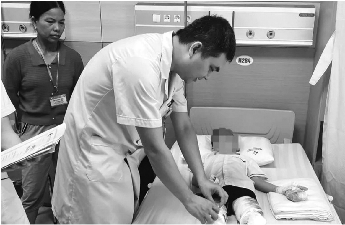
● Trẻ em - đối tượng rất dễ bị tai nạn thương tích. (Ảnh: BV Sản Nhi tỉnh Phú Thọ)

Tai nạn thương tích là một vấn đề y tế công cộng nghiêm trọng có ảnh hưởng đến sức khỏe và tính mạng của người dân trên toàn thế giới, đặc biệt tại các nước đang phát triển. Tại Việt Nam, số liệu thống kê từ các cơ sở y tế cho thấy, trung bình mỗi năm có khoảng hơn 1,1 triệu trường hợp bị tai nạn thương tích đến khám và điều trị tại cơ sở y tế.