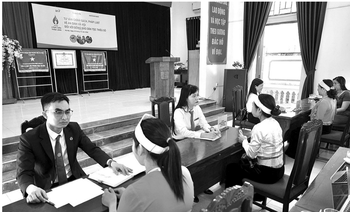
● Đoàn Luật sư Hà Nội tư vấn pháp lý miễn phí cho người dân.

Chính sách an sinh xã hội mang lại hạnh phúc, bảo đảm công bằng, tiến bộ và bình đẳng xã hội. Tuy nhiên, ở những vùng tập trung nhiều đồng bào dân tộc thiểu số, lượng người tham gia bảo hiểm xã hội còn hạn chế. Để giúp người dân hiểu về chính sách an sinh xã hội, Tổ chức ActionAid quốc tế tại Việt Nam, Báo Kinh tế & Đô thị phối hợp với UBND huyện Ba Vì, UBND xã Khánh Thượng tổ chức buổi tư vấn pháp lý miễn phí trên địa bàn xã.