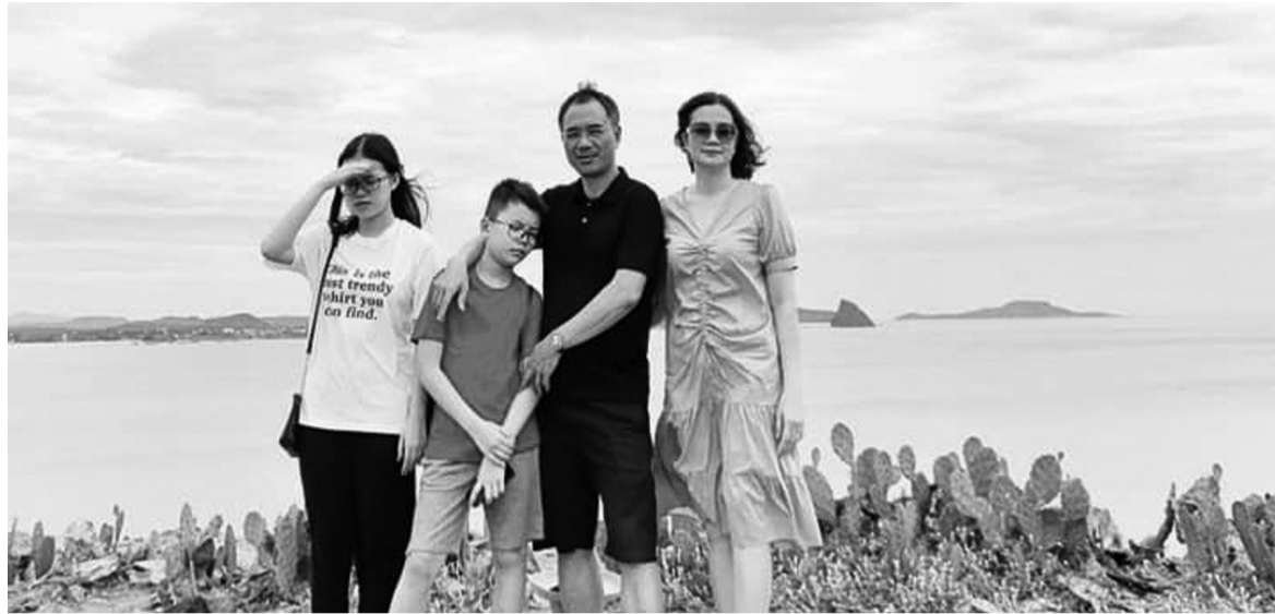
● Được cất lên tiếng nói sống với đúng năng lực, sở trường là niềm hạnh phúc của trẻ.