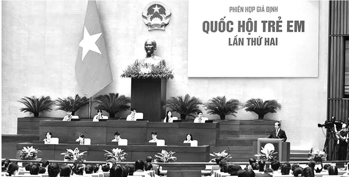
● Quang cảnh Phiên họp giả định Quốc hội trẻ em.

Cũng cần biết rằng, để tiến tới các Phiên họp giả định Quốc hội trẻ