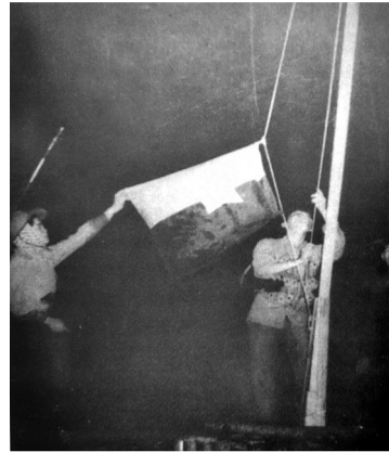
● Đồng chí Trần Nam Phú - Phó Bí thư Tỉnh ủy, Chính trị viên Tỉnh đội Cần Thơ kéo cờ Mặt trận Dân tộc giải phóng miền Nam trước Dinh tỉnh trưởng Chương Thiện, ngày 1/5/1975.