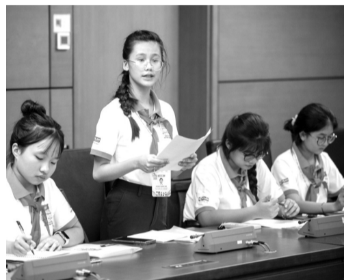
● Các đại biểu trẻ em tại phiên thảo luận Tổ. (Ảnh: PV)