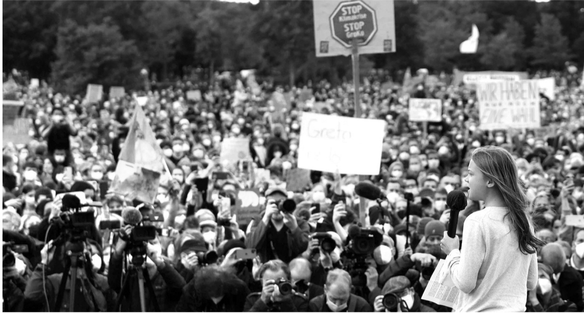
● Thế hệ trẻ như nhà hoạt động môi trường Greta Thunberg (SN 2003) đang có sức ảnh hưởng mạnh hơn đến các chính sách khí hậu toàn cầu.