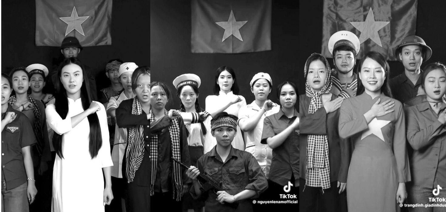
● Trào lưu thể hiện lòng yêu nước trên nền tảng mạng xã hội TikTok.

Trong những năm qua, mạng xã hội luôn bị gắn với cái mác “độc hại”, “nguy hiểm” khi nhiều người cho rằng nó tạo ra một môi trường ảo tiềm ẩn những hệ lụy như nguy cơ bị bắt nạt, lừa đảo, tin giả,... Để thay đổi quan điểm đó, giới trẻ - nhóm người sử dụng mạng xã hội thường xuyên nhất đang tích cực lan tỏa những thông tin tích cực trên mạng xã hội với phương châm “lấy cái đẹp dẹp cái xấu”.