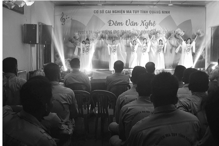
● Các học viên được thưởng thức các chương trình văn nghệ.

Cơ sở Cai nghiện ma túy Quảng Ninh (Sở LĐ-TB&XH Quảng Ninh) có không gian thoáng đãng, cây xanh bao phủ, ao cá, vườn trồng rau xanh tốt tạo cho các học viên cảm giác thoải mái, thanh bình. Ở đó có cán bộ, thầy, cô giáo, y, bác sĩ luôn âm thầm, hết lòng giúp đỡ, chỉ bảo, động viên các học viên, giúp họ sớm đoạn tuyệt ma túy, tìm lại chính mình, trở thành người hữu ích.