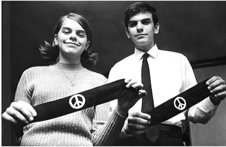
● Phán quyết trong vụ “Tinker v. Des Moines” (1969) đã khẳng định quyền tự do ngôn luận của trẻ em tại các trường học Hoa Kỳ.