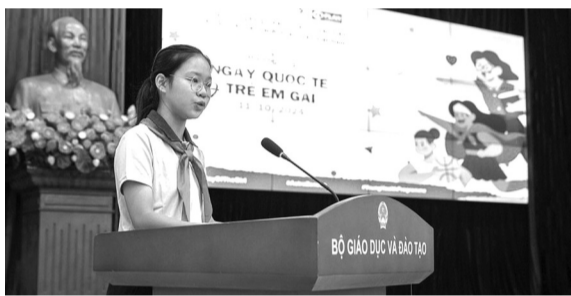
● Trong khuôn khổ kỷ niệm ngày Quốc tế Trẻ em gái 11.10, Bộ GD&ĐT đã phối hợp cùng Tổ chức Plan International Việt Nam tổ chức buổi họp giả định Trao cơ hội để trẻ em gái thể hiện vai trò lãnh đạo.