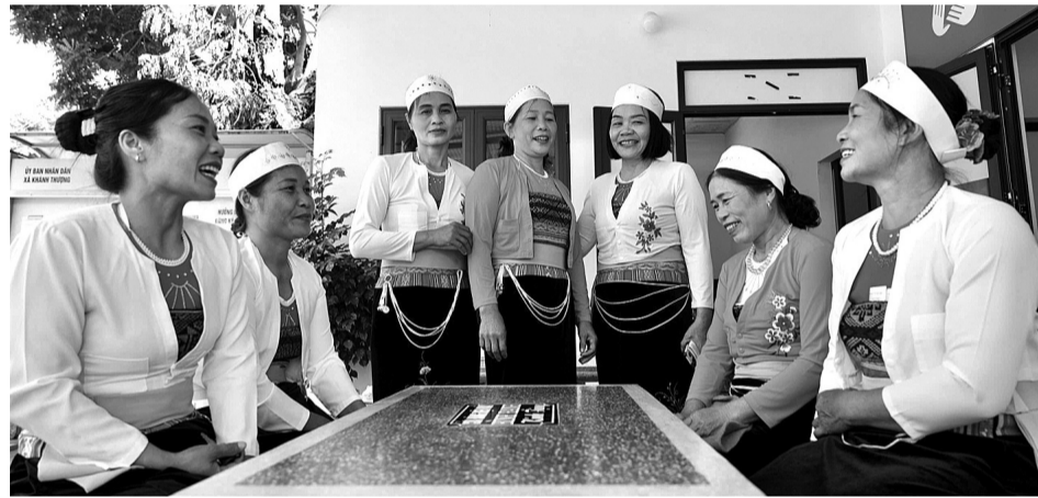
● Người lao động dân tộc thiểu số gặp nhiều rào cản tham gia BHXH tự nguyện.