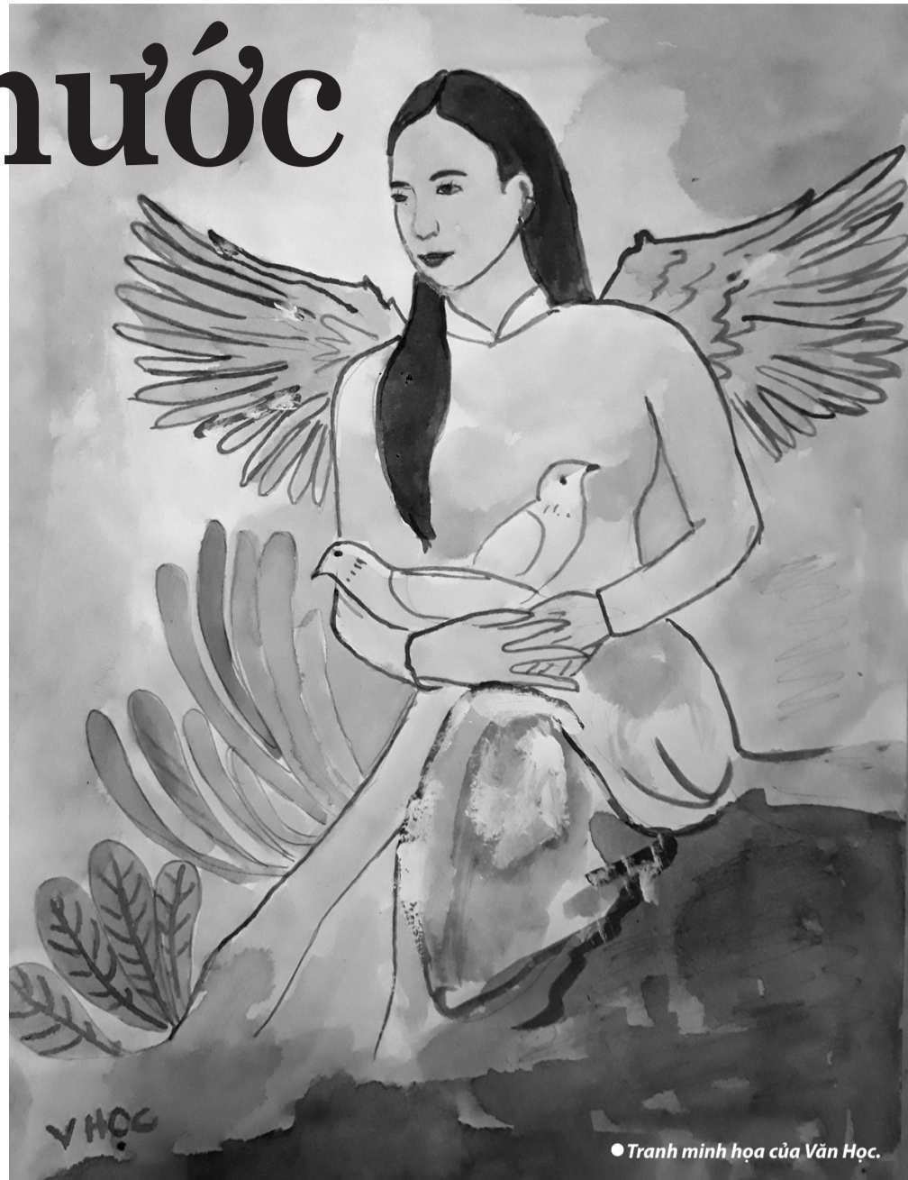
Tranh minh họa của Văn Học.

3. Làng rộn rạo đồn đoán. Khắp xóm trên, xóm dưới, ngoài xã, người ta xôn xao bàn tán. Chuyện Diệp Vân mọc ra đôi cánh không còn là bí mật. Nhiều bà con, họ hàng đã đến hỏi han, dò la. Bọn săn chim