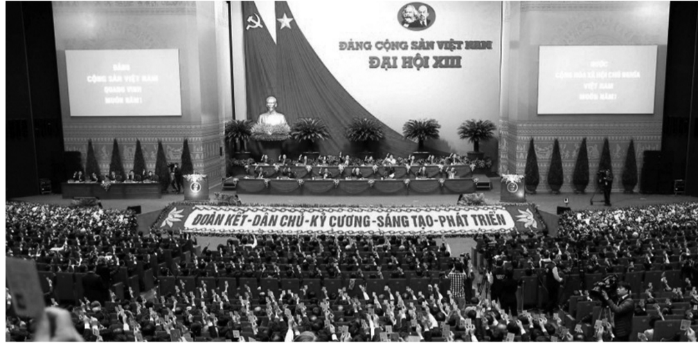
Để phát huy vai trò của xã hội, Đại hội XIII của Đảng yêu cầu tiếp tục thể chế hóa cơ chế dân biết, dân bàn, dân làm, dân kiểm tra, dân giám sát, dân thụ hưởng. (Ảnh: TTXVN)

Thị trường trong mối quan hệ với Nhà nước và xã hội: Thị trường “đóng vai trò quyết định trong xác định giá cả hàng hóa, dịch vụ; tạo động lực huy động, phân bổ hiệu quả các nguồn lực; điều tiết sản xuất và lưu thông; điều tiết hoạt động của doanh nghiệp, thanh lọc những doanh nghiệp yếu kém”, qua đó cung cấp