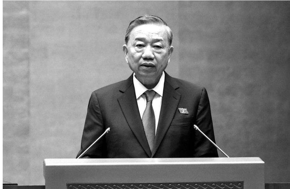
● Tổng Bí thư Tô Lâm.

Bước vào thời kỳ đầy mạnh công cuộc đổi mới, công nghiệp hóa, hiện đại hóa đất nước, xuất phát từ tầm quan trọng đặc biệt và đòi hỏi cấp thiết từ thực tiễn phát triển nóng bỏng của đất nước, qua nhiều kỳ đại hội, nhất là trong các đại hội gần đây, trong Văn kiện Đại hội Đảng lần thứ IX, XII, XIII đều nhấn mạnh các nhiệm vụ cụ thể về tinh gọn tổ chức bộ máy hoặc nghiên cứu xây dựng mô hình tổng thể tổ chức bộ máy hệ thống chính trị trong giai đoạn mới. Từ Đại hội VII đến nay, Đảng ta liên tục ban hành nhiều Nghị quyết, Kết luận để lãnh đạo thực hiện chủ trương đổi mới, sắp xếp tổ chức bộ máy của hệ thống chính trị tinh gọn, tổ chức bộ máy hoạt động hiệu lực, hiệu quả, như: Nghị quyết Hội nghị Trung ương 8 khóa VII về tiếp tục xây dựng và hoàn thiện Nhà nước Cộng hòa xã hội chủ nghĩa Việt Nam; Nghị quyết số 10-NQ/TW, ngày 09/2/2007 Ban Chấp hành Trung ương khóa X về đổi mới, kiện toàn tổ chức bộ máy các cơ quan Đảng, định hướng đổi mới tổ chức bộ máy nhà nước, Mặt trận Tổ quốc và các đoàn thể chính trị - xã hội; Nghị quyết số 17-NQ/TW, ngày 01/8/2007 của Ban Chấp hành Trung ương khóa X về đẩy mạnh cải cách hành chính, nâng cao hiệu lực, hiệu quả quản lý của bộ máy nhà nước; Nghị quyết số 22-NQ/TW, ngày 02/2/2008 Ban Chấp hành Trung