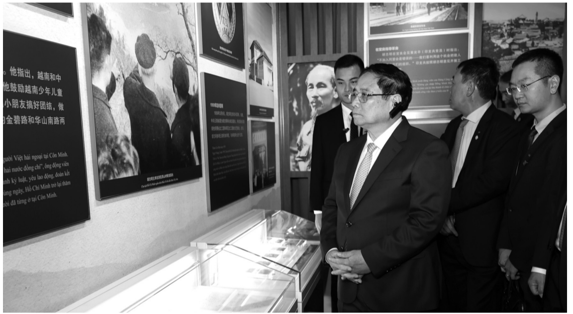
● Thủ tướng Phạm Minh Chính thăm Khu di tích lịch sử Chủ tịch Hồ Chí Minh tại thành phố Côn Minh.

Cũng trong chiều 5/11, tại TP Côn Minh, Thủ tướng Phạm Minh Chính đã gặp gỡ cán bộ, nhân viên Cơ quan đại diện Việt Nam tại Trung Quốc và cộng đồng người Việt Nam tại tỉnh Vân Nam, Trung Quốc. Điềm lại bước phát triển trong quan hệ Việt Nam - Trung Quốc, Thủ tướng nhấn mạnh, mối quan hệ Việt Nam - Trung Quốc là yêu cầu khách quan, là lựa chọn chiến lược và là ưu tiên hàng đầu. Do đó, Thủ tướng Phạm Minh Chính mong cộng đồng người Việt Nam