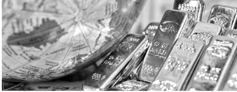
● Giá vàng thế giới đang “hạ nhiệt”.