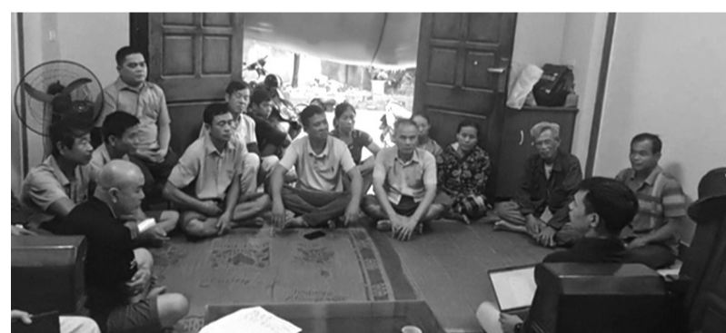
● Một số hộ dân phản ánh sự việc với PV PLVN.

Ngày 14/4/2022, UBND TP ra Thông báo 72/TB-UBND thu hồi đất để thực hiện một dự án. Quá trình