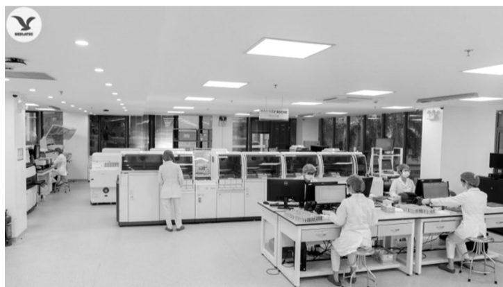
● Hệ thống máy xét nghiệm hiện đại cho kết quả chính xác, tin cậy. Ảnh: Một góc của Trung tâm Xét nghiệm MEDLATEC.

Chất lượng xét nghiệm của MEDLATEC từ lâu đã