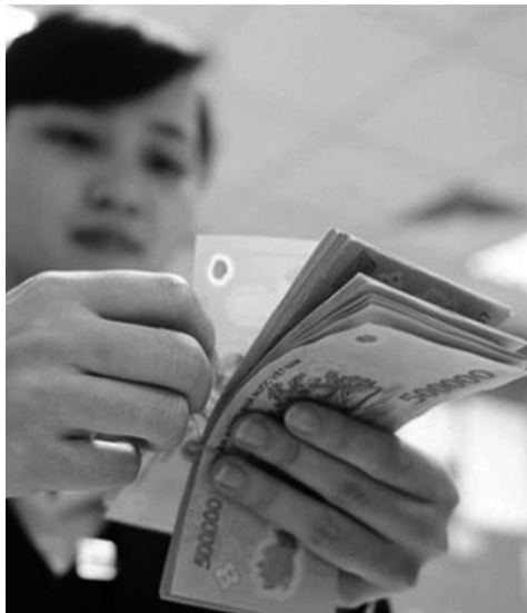
● Luật BHXH năm 2024 hướng tới việc tăng cường tính tuân thủ pháp luật, bảo vệ quyền, lợi ích hợp pháp của người lao động. (Ảnh minh họa - Nguồn: ITN)

chương để nhằm tăng cường tính tuân thủ pháp luật, bảo vệ quyền, lợi ích hợp pháp của NLĐ là rất cần thiết.