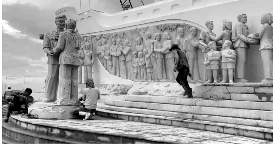
● Đơn vị thi công khẩn trương hoàn tất các tiểu mục còn lại để bàn giao.

Bí thư Tỉnh ủy Cà Mau cũng khảo sát điểm tổ chức hội chợ tại Khu đô thị khóm 9, thị trấn Sông Đốc. Tại khu vực này, dự kiến có khoảng 150 gian hàng thương mại, ẩm thực; 12 gian hàng giới thiệu sản phẩm đặc sản, OCOP của các huyện, TP và các tỉnh, thành, đáp ứng nhu cầu mua sắm, giải