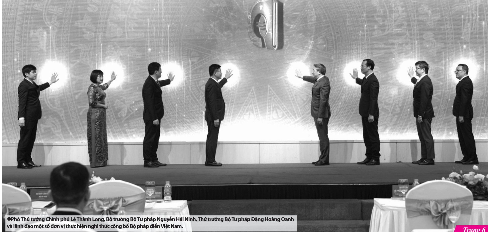
●Phó Thủ tướng Chính phủ Lê Thành Long, Bộ trưởng Bộ Tư pháp Nguyễn Hải Ninh, Thứ trưởng Bộ Tư pháp Đặng Hoàng Oanh và lãnh đạo một số đơn vị thực hiện nghi thức công bố Bộ pháp điển Việt Nam.