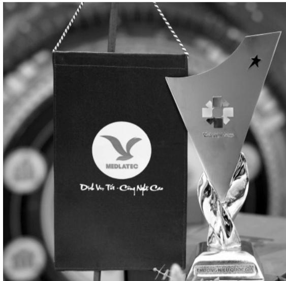
● Chiếc cúp danh giá ghi nhận hành trình nỗ lực vì sức khỏe người dân của Hệ thống Y tế MEDLATEC.

Dịch vụ xét nghiệm MEDLATEC được vinh danh là Thương hiệu Quốc gia Việt Nam tại "Lễ công bố sản phẩm đạt Thương hiệu Quốc gia năm 2024", diễn ra ngày 4/11, do Cục Xúc tiến thương mại, Bộ Công Thương tổ chức. Đây là đơn vị y tế đầu tiên sở hữu dịch vụ xét nghiệm đạt danh hiệu này.