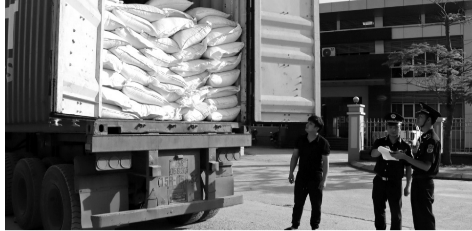
● Cán bộ Hải quan kiểm tra hàng hóa xuất nhập khẩu.

Theo thống kê của Viện Chiến lược và Chính sách tài chính, việc thực thi các cam kết tại các FTA đã khiến tỷ trọng thu thuế nhập khẩu giảm từ 6,1% năm 2011 xuống còn 2,5% vào năm 2023. Tỷ trọng thu từ