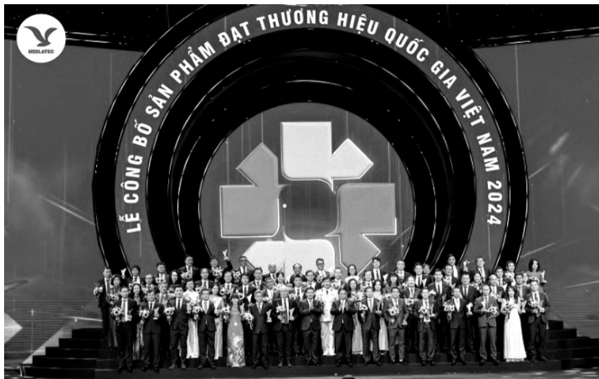
● Tại sự kiện, Ban Tổ chức công bố và trao danh hiệu Thương hiệu Quốc gia năm 2024 cho 359 sản phẩm của 190 doanh nghiệp. MEDLATEC là đơn vị y tế đầu tiên có sản phẩm dịch vụ xét nghiệm được công nhận lần này.