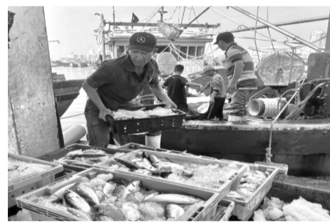
● TP Đà Nẵng quyết liệt thực hiện các giải pháp chống khai thác hải sản bất hợp pháp.

Cụ thể, đưa ra khỏi danh sách 281 tàu; hỗ trợ hướng dẫn thủ tục cấp giấy phép khai thác thủy sản (GPKTTS) cho 93 tàu, cấp Giấy chứng nhận an toàn kỹ thuật cho 19 tàu để bảo đảm khai thác theo quy định. Riêng đối với các tàu cá chưa đủ điều kiện để cấp các loại giấy tờ trên thì thực hiện lập