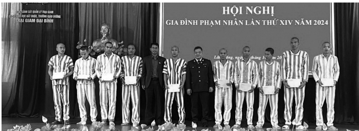
● Cục THADS Lâm Đồng phối hợp tuyên truyền, tặng quà cho các phạm nhân có thành tích tốt tại Trại giam Đại Bình tháng 10/2024.

Ngoài ra, ngành THADS Lâm Đồng đã ra hơn 12.700 quyết định thi hành án bảo đảm đúng quy định của pháp luật. Công tác xác minh, phân loại án được thực hiện đúng theo quy định