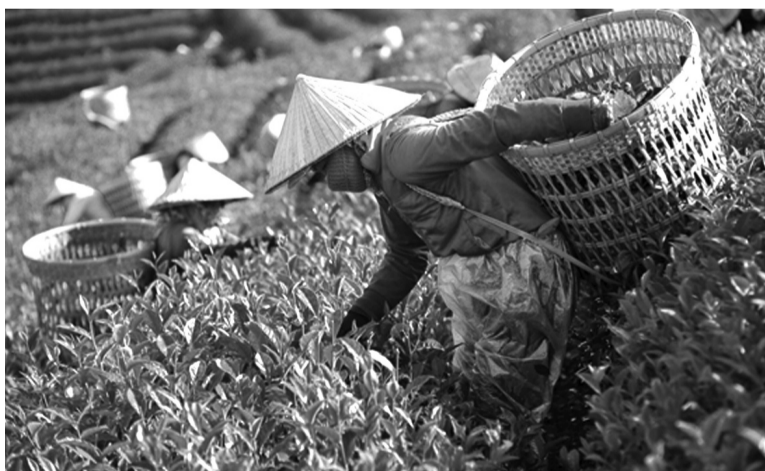
● Cán liên kết sản xuất, hình thành vùng nguyên liệu chất lượng để nâng cao giá bán sản phẩm chè.