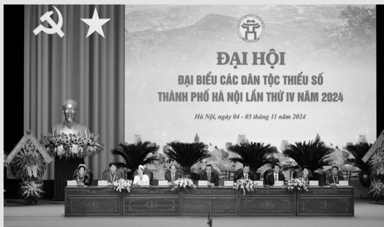
● Quang cảnh Đại hội.

Sáng 5/11, tại Cung Văn hóa Lao động hữu nghị Việt - Xô, UBND TP Hà Nội long trọng tổ chức Đại hội đại biểu các dân tộc thiểu số TP lần thứ IV năm 2024.