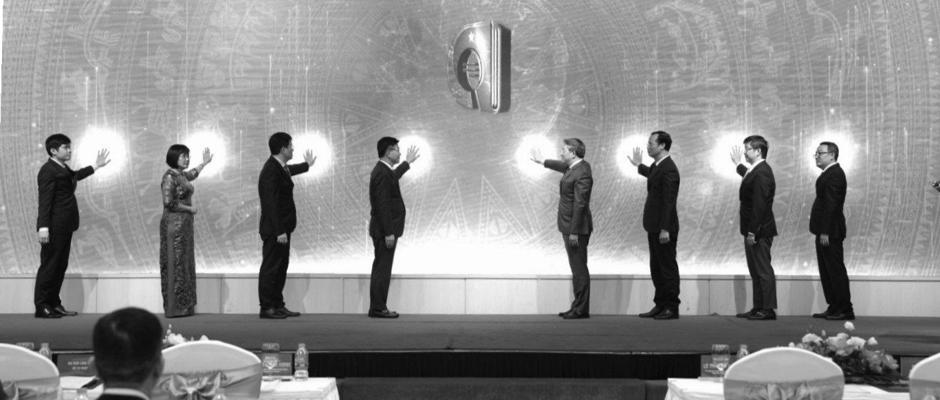
Ngày 5/11 Bộ pháp điển Việt Nam - công cụ tra cứu pháp luật chính thống, toàn diện, khoa học đã chính thức được công bố.