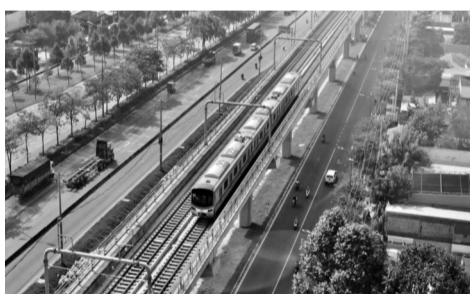
● Đoàn tàu metro Bến Thành - Suối Tiên di chuyển qua đoạn trên cao dài 17,1km.

Hiện, tuyến metro đã bước vào giai đoạn chạy thử (trial run), mô phỏng tương tự như cách vận hành thương mại, với thời gian mỗi chuyến tàu chạy giãn cách khoảng 4 phút 30 giây. Các nhân viên sẽ tham gia thử nghiệm 47 kịch bản khác nhau, bao gồm các tình huống khẩn cấp như cháy, nổ, mất điện, ngập nước, mất tín hiệu... Giai đoạn thử nghiệm này dự kiến kết thúc ngày 17/11, song song với công tác đánh giá an toàn hệ thống, nghiệm thu để vận hành chính thức. MỘC ĐỨC