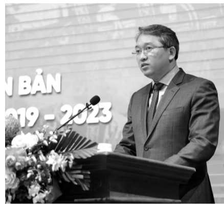
● Bộ trưởng Bộ Tư pháp Nguyễn Hải Ninh phát biểu tại Hội nghị.

Bộ pháp điển được xây dựng, hình thành từ gần 9 nghìn VBQPPL đang còn hiệu lực của cấp Trung ương và được sắp xếp, cấu trúc vào 45 chủ đề, trong mỗi chủ đề có một hoặc nhiều đề mục (có 271 đề mục thuộc 45 chủ đề). Bộ pháp điển là sản phẩm chính thức của Nhà nước được các Bộ, ngành thực hiện một cách nghiêm túc, trách nhiệm theo một quy trình, trình tự chặt chẽ góp phần bảo đảm tính đầy đủ, chính xác, kịp thời các QPPL đang còn hiệu lực có trong Bộ pháp điển. Các QPPL được sắp xếp theo một trật tự logic, khoa học, có hệ thống giúp cho việc tra cứu, tìm kiếm các quy định pháp luật được dễ dàng, thuận tiện. Qua đó, Bộ pháp điển góp phần bảo đảm tính công khai, minh bạch của hệ thống pháp luật cũng như góp phần nâng cao sự tin tưởng của người dân vào hệ thống pháp luật.