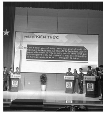
● Phần thi kiến thức.