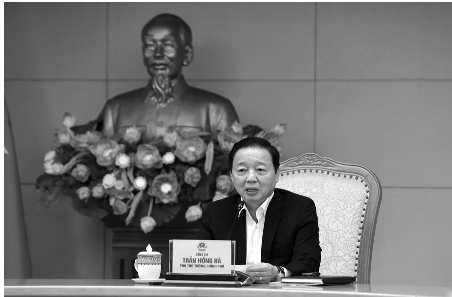
● Phó Thủ tướng Trần Hồng Hà yêu cầu xử lý nghiêm từ hành vi vi phạm nhỏ nhất.

Từ thực tế các vụ tai nạn giao thông thương tâm đối với người đi bộ, Phó