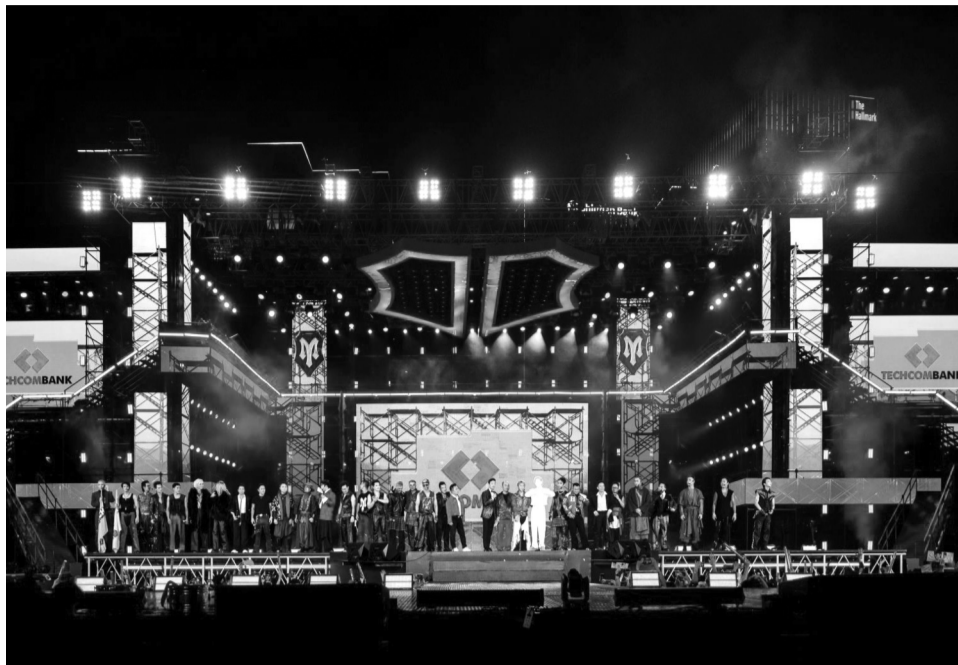
● Du lịch âm nhạc Việt Nam bùng nổ mạnh mẽ vào những tháng cuối năm.

Hiện tại, Việt Nam đang có những concert “thuần Việt” thu hút hàng chục nghìn khán giả đến tham dự. Chất lượng, quy mô các show diễn này đang ngày càng được nâng cao. Lấy ví dụ trước đây, chỉ có một số show diễn của các ca sĩ Việt như Mỹ Tâm, Trung Quân Idol, Hà Anh Tuấn bán từ 10 nghìn đến 30 nghìn vé và được tổ chức ở các sân vận động lớn.