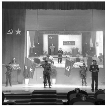
● Một màn thi trong Hội thi.