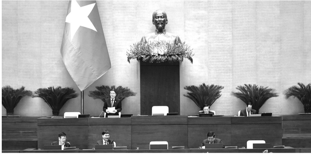
● Quang cảnh phiên làm việc chiều 6/11.

Chiều 6/11, tiếp tục chương trình Kỳ họp thứ 8, Quốc hội tiến hành thảo luận tại hội trường về dự án Luật sửa đổi, bổ sung một số điều của Luật Quy hoạch, Luật Đầu tư, Luật Đầu tư theo phương thức đối tác công - tư và Luật Đấu thầu.