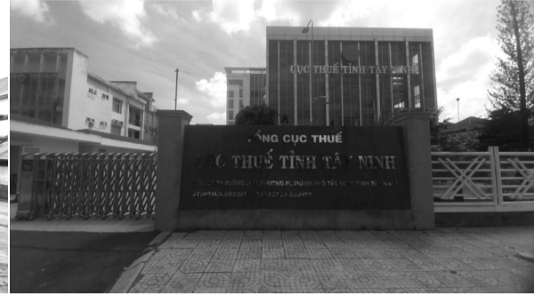
● LS Hiệp cho rằng, trong trường hợp này, theo quy định, Cục Thuế Tây Ninh mới có thẩm quyền ra quyết định thanh tra chuyên ngành.

Diễn biến sự việc liên quan Cty TNHH Sản xuất Thương mại Tinh bột khoai mì Nhựt Phát - Chi nhánh Tây Ninh mà PLVN đã có bài phản ánh, DN này vừa có văn bản gửi Thanh tra Chính phủ (TTCP), khiếu nại Kết luận thanh tra 987/KL-UBND (KLTT) của Chủ tịch UBND tỉnh Tây Ninh.