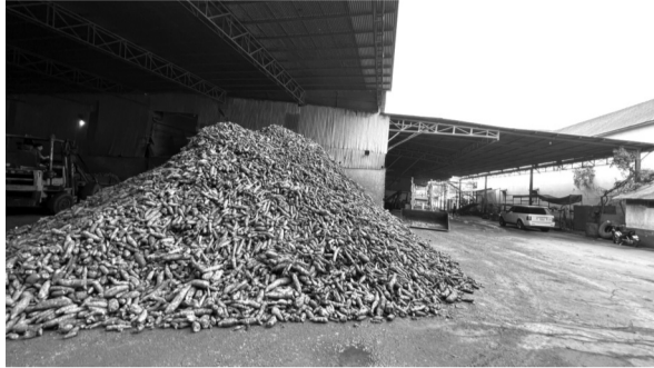
● Nơi Cty Nhựt Phát - Tây Ninh đặt nhà máy sản xuất.