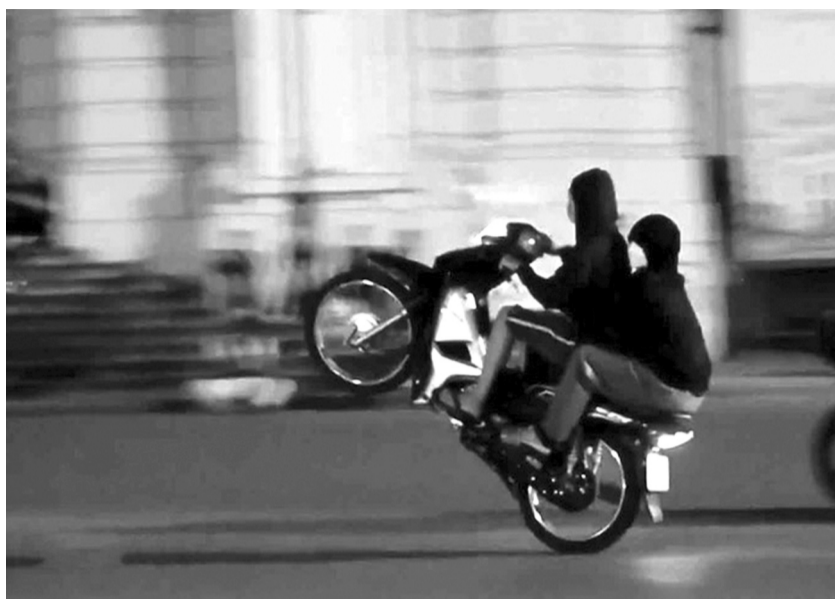
● “Quái xế” ngang nhiên cản quấy đường phố Hà Nội.

Trên thực tế, đây không phải là vụ việc thương tâm đầu tiên do các “quái xế” gây ra. Trong nhiều năm qua, đặc biệt là tại các tuyến phố trung tâm như Trần Hưng Đạo, Trần