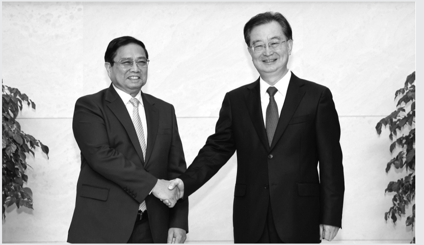
● Thủ tướng Chính phủ Phạm Minh Chính và Bí thư Tỉnh ủy tỉnh Vân Nam Vương Ninh.

Theo tin từ Bộ Ngoại giao, trong khuôn khổ dự Hội nghị Thượng đỉnh Hợp tác tiểu vùng Mekong mở rộng lần thứ 8 và công tác tại Trung Quốc, ngày 6/11, tại TP Côn Minh, Thủ tướng Phạm Minh Chính đã tiếp Ủy viên Ban Chấp hành Trung ương Đảng Cộng sản Trung Quốc, Bí thư Tỉnh ủy tỉnh Vân Nam Vương Ninh.