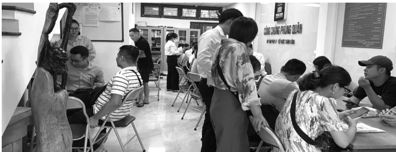
● Làm thủ tục công chứng.