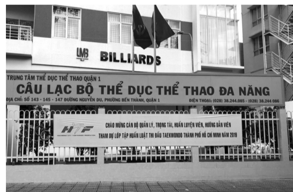
● Trung tâm TDTT quận 1 có nhiều sai phạm trong quản lý, sử dụng nhà đất công.

Với thủ đoạn trên, từ tháng 12/2021 - 26/4/2022, Tường An đã chiếm đoạt hơn 7,1 tỷ đồng từ nhiều tài khoản khác nhau. NGUYỄN HẠNH