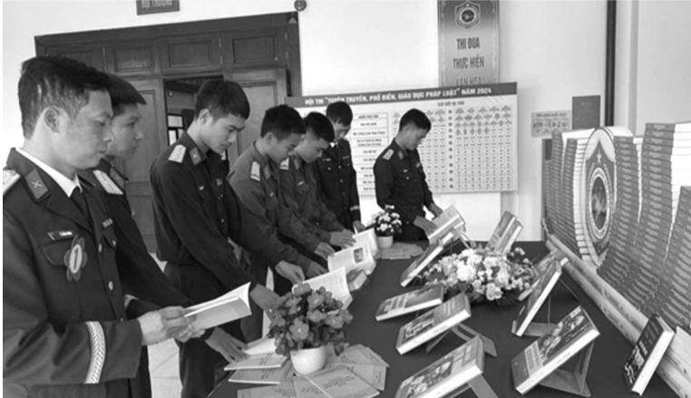
● Cán bộ, chiến sĩ Lễ đoàn 84 tại gian trưng bày các ấn phẩm pháp luật.

Các màn thi đấu sôi nổi, hấp dẫn tại Hội thi phổ biến, giáo dục pháp luật (PBGDPL) năm 2024 của Lễ đoàn (LD) 84 Cục Tác chiến điện tử (TCĐT) Bộ Tổng Tham mưu (BTTM) tổ chức chiều qua (6/11); đã góp phần nâng cao kiến thức, năng lực xử lý tình huống trao đổi kinh nghiệm, cách làm hay, sáng tạo, hiệu quả trong tiến hành công tác tuyên truyền, PBGDPL, vận động chấp hành pháp luật Nhà nước.