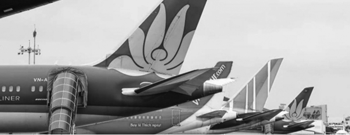
● Giá dịch vụ hàng không tăng 32,75% tác động đến chỉ số giá tiêu dùng tháng 10/2024.

Ngoại trừ tháng có Tết Nguyên đán Giáp Thìn, chỉ số giá năm 2024 đang có xu hướng tăng dần về cuối năm, đặc biệt chỉ số giá tháng 10 tăng mạnh do các yếu tố thời tiết gây ảnh hưởng đến các nhóm hàng hóa.