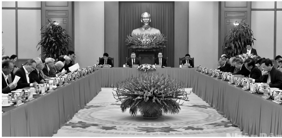
● Bộ Chính trị, Ban Bí thư tổ chức Hội nghị các đồng chí nguyên lãnh đạo Đảng, Nhà nước góp ý kiến vào các dự thảo văn kiện trình Đại hội XIV của Đảng.

nước tạo dựng được qua giai đoạn lịch sử gần 40 năm đổi mới có đóng góp to lớn của các đồng chí lãnh đạo đi trước, trong đó có các bác, các anh, các chị tham dự Hội nghị ngày hôm nay. Thế hệ chúng tôi nhận thức rất rõ trách nhiệm tiếp tục phát huy những thành tựu có ý nghĩa lịch sử này để đưa đất nước vào giai đoạn phát triển mới. Đây không chỉ là khẩu hiệu chính trị mà là vấn đề rất thực tế đòi hỏi cấp thiết của cuộc sống” - Tổng Bí thư Tô Lâm khẳng định.