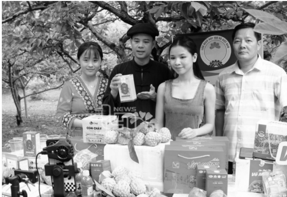
● Tiêu thụ sản phẩm địa phương qua thương mại điện tử đang được thúc đẩy mạnh mẽ.