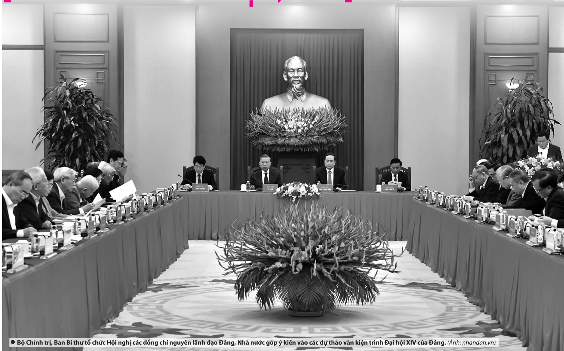
• Bộ Chính trị, Ban Bí thư tổ chức Hội nghị các đồng chí nguyên lãnh đạo Đảng, Nhà nước góp ý kiến vào các dự thảo văn kiện trình Đại hội XIV của Đảng.

Sáng qua (6/11) tại Trụ sở Trung ương Đảng, dưới sự chủ trì của Tổng Bí thư Tô Lâm, Bộ Chính trị, Ban Bí thư tổ chức Hội nghị các đồng chí nguyên lãnh đạo Đảng và Nhà nước góp ý vào các dự thảo văn kiện trình Đại hội XIV của Đảng.