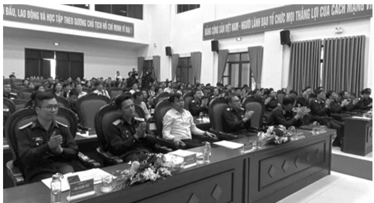
● Khán giả xem các đội thi tài.

Những năm qua, LD 84 luôn hoàn thành xuất sắc nhiệm vụ bảo vệ các sự kiện chính trị trọng đại của Đảng, Nhà nước, Quân đội; các mục tiêu trọng yếu; các đối tượng cảnh vệ và các hội nghị quốc tế diễn ra ở Việt Nam; tham gia xử trí những tình huống phức tạp ở các địa bàn trọng điểm; tham gia hoàn thành tốt nhiều cuộc diễn tập hiệp đồng quân binh chủng, diễn tập đối kháng. Kỷ niệm 40 năm Ngày truyền thống, tháng 9/2024, LD vinh dự đón nhận Huân chương Bảo vệ Tổ quốc hạng Ba.