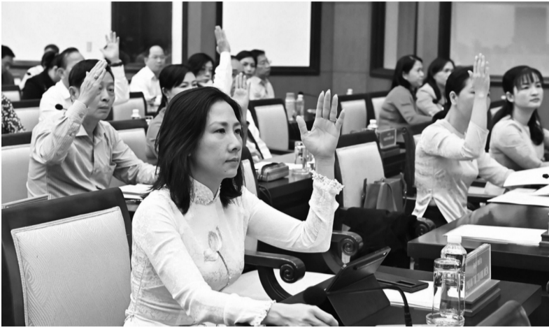
Đại biểu biểu quyết tại Kỳ họp thứ 19 (kỳ họp chuyên đề) của HỖND TP HCM khóa X.

Kỳ họp thứ 19 (kỳ họp chuyên đề) của HỖND TP HCM khóa X vừa biểu quyết thông qua nghị quyết quy định các tiêu chí, lĩnh vực, nội dung hỗ trợ thử nghiệm có kiểm soát giải pháp công nghệ mới trong phạm vi khu công nghệ cao, khu công nghệ thông tin tập trung trên địa bàn TP HCM. Đây là nội dung cụ thể hóa triển khai Nghị quyết 98/2023/QH15 của Quốc hội về thí điểm các cơ chế, chính sách đặc thù phát triển TP HCM.