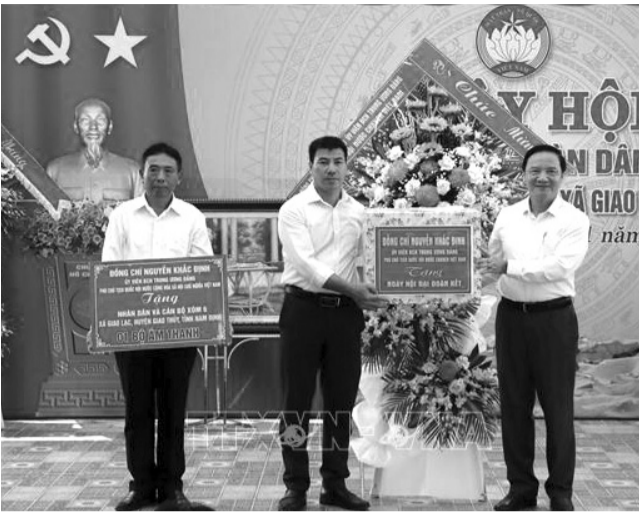
● Phó Chủ tịch Quốc hội Nguyễn Khắc Định tặng quà khu dân cư xóm 6, xã Giao Lạc.

Ngày 17/11, nhân kỷ niệm 94 năm Ngày truyền thống Mặt trận Tổ quốc Việt Nam (18/11/1930 - 18/11/2024), Phó Chủ tịch Quốc hội Nguyễn Khắc Định cùng lãnh đạo tỉnh Nam Định dự Ngày hội Đại đoàn kết toàn dân tộc tại khu dân cư xóm 6, xã Giao Lạc, huyện Giao Thủy (Nam Định).