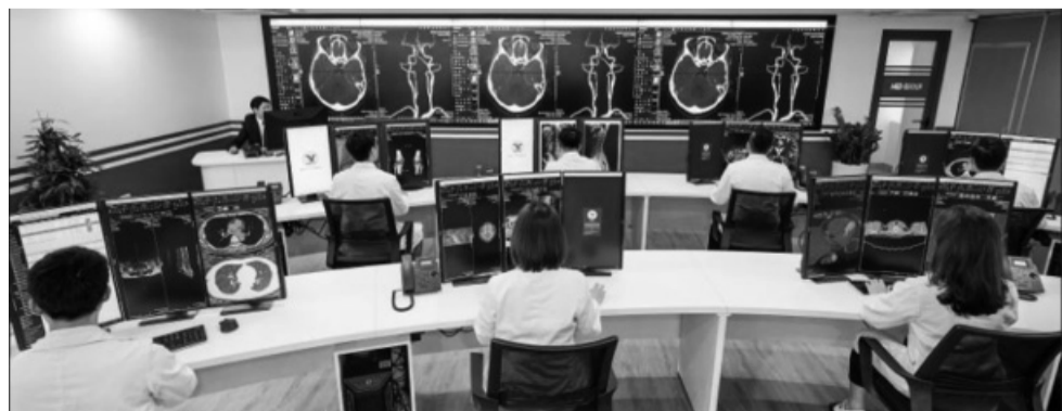
● Vị “thuyền trưởng” lan tỏa trái tim say mê nhiệt huyết với nghề đến tất cả “thuyền viên” trên hành trình kiến tạo vị thế và tầm vóc Trung tâm Chẩn đoán hình ảnh MEDLATEC.