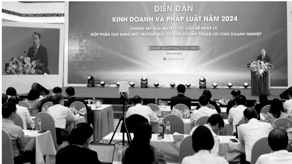
● Bộ trưởng Bộ Tư pháp Nguyễn Hải Ninh nhấn mạnh, Hội đồng Phối hợp phổ biến, giáo dục pháp luật Trung ương, các Bộ, ngành, địa phương sẵn sàng tháo gỡ đến cùng các khó khăn, vấn đề pháp lý mà cộng đồng DN gặp phải.

Quán triệt tinh thần này, Bộ Tư pháp đã tham mưu ban hành Quyết định 407-QĐ/TTg của Thủ tướng Chính phủ phê duyệt Đề án “Tổ chức truyền thông chính sách có tác động lớn đến xã hội trong quá trình xây dựng văn bản quy phạm pháp luật giai đoạn 2022 - 2027”. Đề án này khẳng định công tác phổ biến, giáo dục pháp luật không chỉ phổ biến những văn bản đã ban hành mà còn