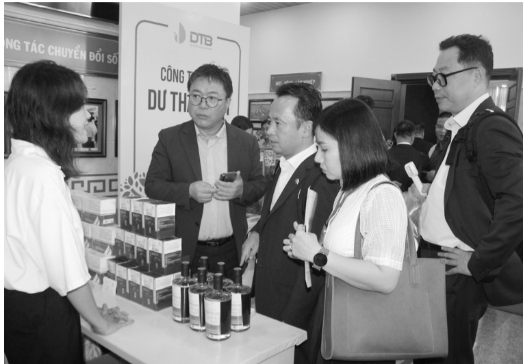
● Đại diện lãnh đạo Thương vụ các nước tại Việt Nam và Thương vụ Việt Nam tại các nước; các doanh nghiệp đã trao đổi, thảo luận và kết nối trực tiếp cũng như trực tuyến tại Hội nghị.