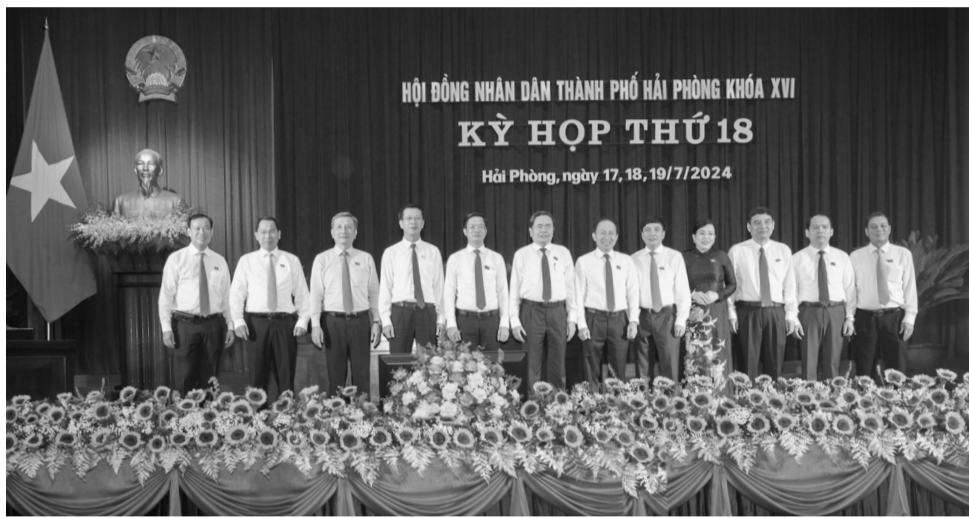
● Chủ tịch Quốc hội Trần Thanh Mẫn cùng các Ủy viên Ủy ban Thường vụ Quốc hội chụp hình lưu niệm với lãnh đạo TP Hải Phòng.