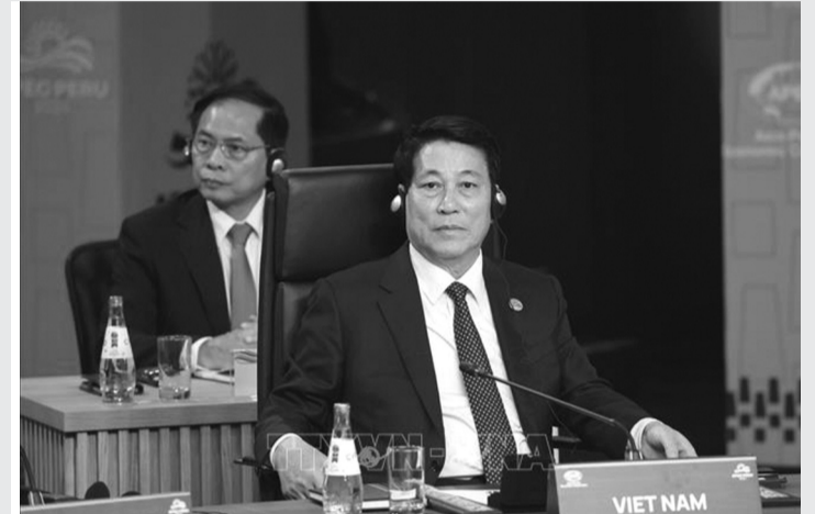
● Chủ tịch nước Lương Cường dự Hội nghị Cấp cao APEC lần thứ 31.

Chiều 16/11 theo giờ địa phương (sáng 17/11 giờ Việt Nam), Chủ tịch nước Lương Cường và Đoàn đại biểu cấp cao Việt Nam đã rời Lima, kết thúc tốt đẹp chuyến thăm chính thức Cộng hòa Chile và Cộng hòa Peru, cũng như tham dự Tuần lễ Cấp cao Diễn đàn Hợp tác Kinh tế châu Á - Thái Bình Dương (APEC) 2024.