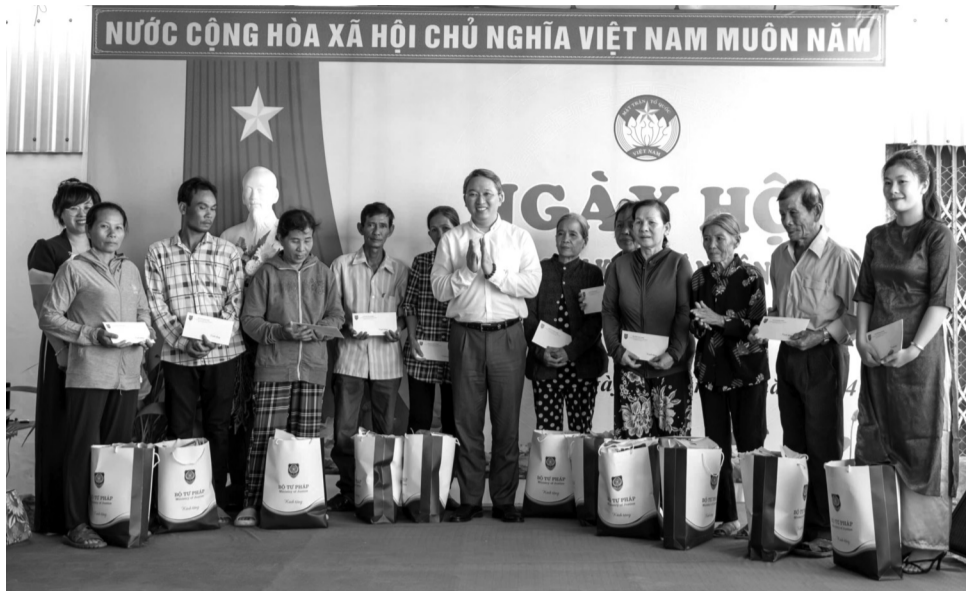
● Bộ trưởng Nguyễn Hải Ninh tặng quà cho các hộ gia đình thôn Phong Ấp.

Đặc biệt, những người có uy tín, các cá nhân tiêu biểu trong khu dân cư đã phát huy vai trò nòng cốt, hỗ trợ chính quyền cơ