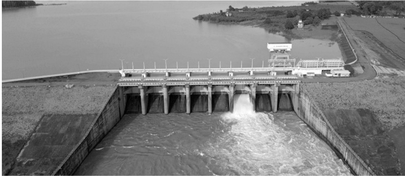
● Quản lý nước là một trong những dự án được ưu tiên cho vay để bảo vệ môi trường.

Ngân hàng Thương mại Cổ phần Ngoại thương Việt Nam (Vietcombank) vừa phát hành thành công 2.000 tỷ đồng trái phiếu xanh để cho vay các dự án thuộc lĩnh vực bảo vệ môi trường và dự án mang lại lợi ích về môi trường. Điều này cho thấy nhu cầu về trái phiếu xanh là rất lớn và là tín hiệu tích cực về tiềm năng trong việc huy động dòng vốn từ khối tư nhân cho quá trình chuyển đổi hướng đến phát thải ròng bằng 0 của Việt Nam.