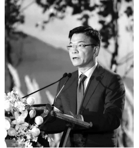
● Phó Thủ tướng Lê Thành Long phát biểu tại chương trình.

Theo Phó Thủ tướng Lê Thành Long, Tuần "Đại đoàn kết các dân tộc - Di sản văn hóa Việt Nam" và Liên hoan nghệ thuật hát Then, đàn Tính các dân tộc Tày, Nùng, Thái lần thứ VII - năm 2024 là dịp để chúng ta tiếp tục tôn vinh, giới thiệu, quảng bá những nét đẹp, giá trị văn hóa đặc sắc của các dân tộc Việt Nam; biểu dương các tấm gương tiêu biểu từ đồng bào các dân tộc trong cả nước; thiết thực chào mừng Ngày Di sản văn hóa Việt Nam 23/11. Đồng thời, tiếp tục