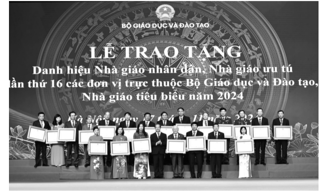
● Bộ trưởng Bộ Giáo dục và Đào tạo Nguyễn Kim Sơn và các Nhà giáo được vinh danh năm 2024.

Sáng 17/11, tại Hà Nội, Bộ Giáo dục và Đào tạo, Công đoàn Giáo dục Việt Nam tổ chức Lễ trao tặng danh hiệu Nhà giáo Nhân dân, Nhà giáo Ưu tú lần thứ 16 và tuyên dương Nhà giáo tiêu biểu năm 2024.