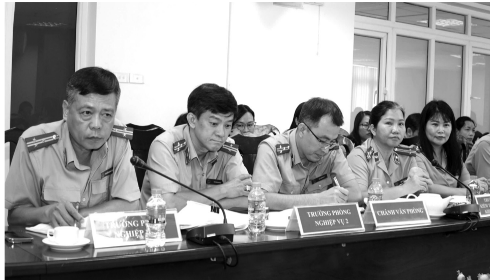
● Chấp hành viên Cục THADS TP Hồ Chí Minh.

Về tiến độ, kết quả thu hồi, xử lý tài sản bị chiếm đoạt, thất thoát trong các vụ án