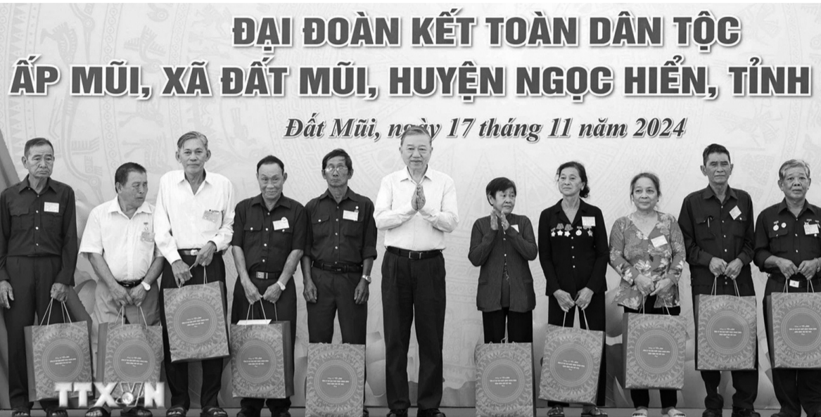
● Tổng Bí thư Tô Lâm trao quà cho các gia đình chính sách.

Sáng 17/11, Tổng Bí thư Tô Lâm đã đến dự Ngày hội Đại đoàn kết toàn dân tộc tại Ấp Mũi, xã Đất Mũi, huyện Ngọc Hiển, tỉnh Cà Mau. Phát biểu tại đây, Tổng Bí thư lưu ý: “Cần thực hiện mạnh mẽ, quyết liệt các công việc, mục tiêu được đặt ra ngay từ bây giờ với tinh thần bước vào kỷ nguyên vươn mình phát triển giàu mạnh của đất nước”.