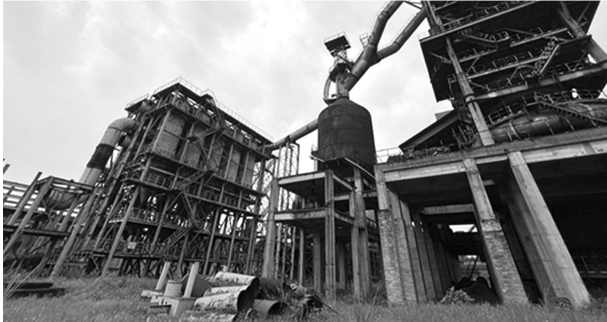
● Dự án TISCO2 tạm dừng thi công từ năm 2013 đến nay.