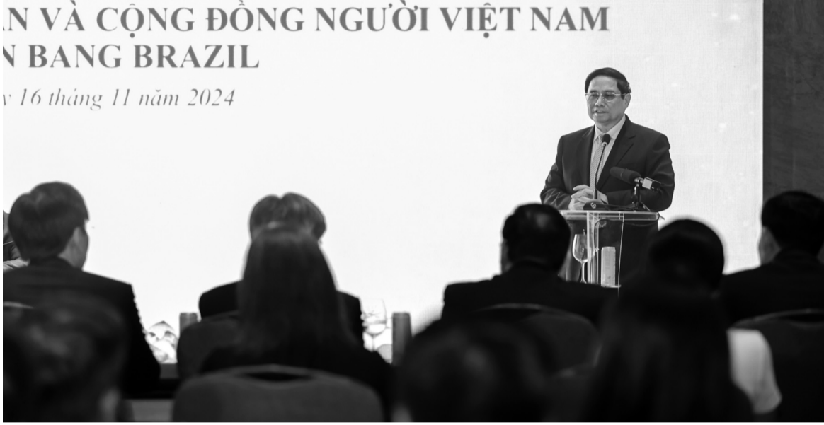
● Thủ tướng Phạm Minh Chính phát biểu tại buổi gặp gỡ cán bộ, nhân viên Đại sứ quán và cộng đồng người Việt Nam tại Brazil.

Chiều tối 16/11 theo giờ địa phương, ngay sau khi tới Rio de Janeiro, Thủ tướng Chính phủ Phạm Minh Chính và Phu nhân có buổi gặp gỡ cán bộ, nhân viên Đại sứ quán và cộng đồng người Việt Nam tại Cộng hòa Liên bang Brazil.