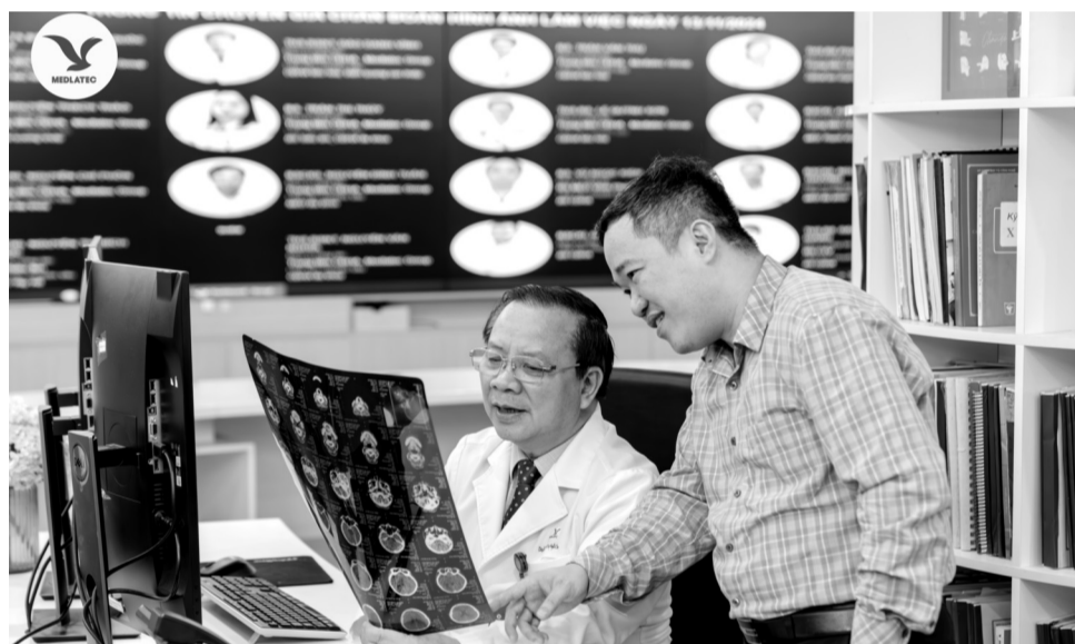
● Nhiều thế hệ học trò luôn biết ơn công lao được thầy chỉ bảo, hướng dẫn nghiêm khắc, tận tâm.

trong kỷ nguyên khoa học - công nghệ phát triển như vũ bão hiện nay, ắt bản thân mỗi người sẽ phải tự vận động”.