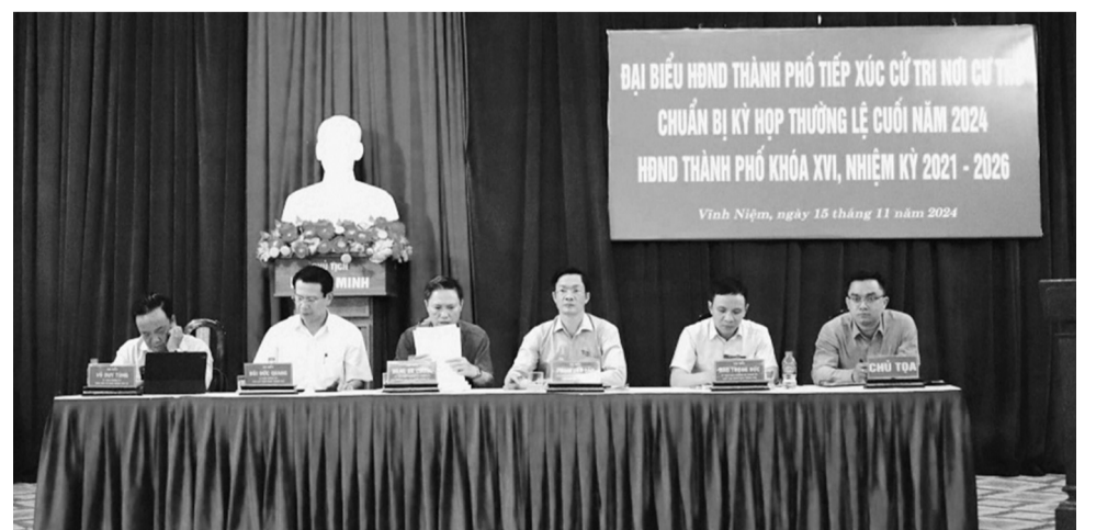
● Tổ đại biểu HĐND TP tiếp xúc cử tri tại các quận, huyện chuẩn bị Kỳ họp thường lệ cuối năm.