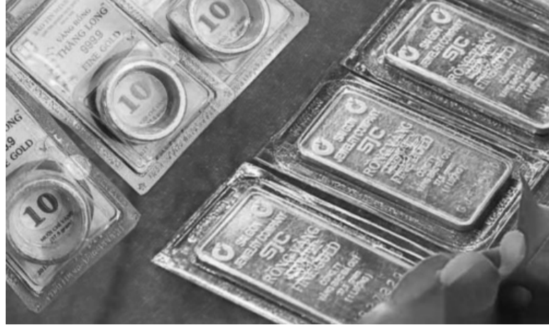
● Giá vàng trong nước luôn duy trì mức chênh lệch từ 3 - 5 triệu đồng/lượng so với thế giới.

Trả lời chất vấn trước Quốc hội, Thống đốc NHNN Nguyễn