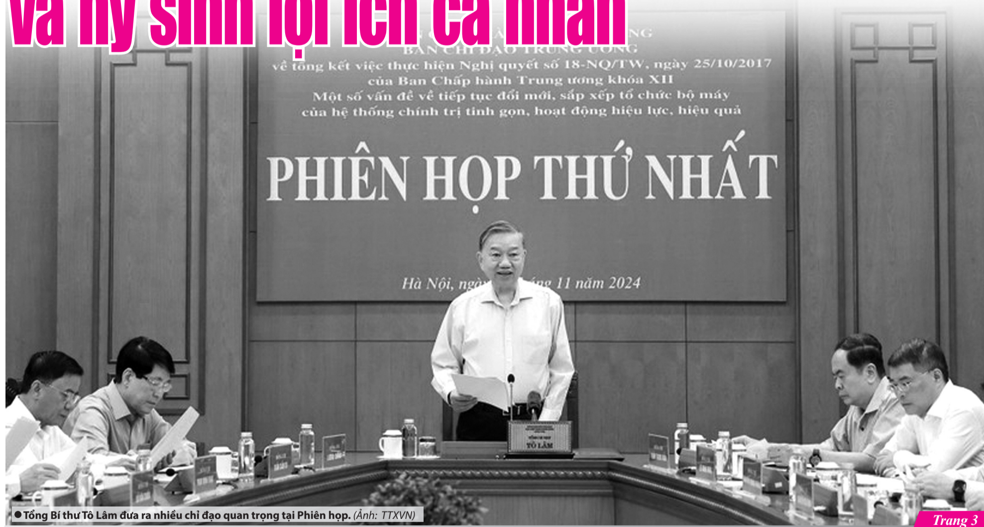
● Tổng Bí thư Tô Lâm đưa ra nhiều chỉ đạo quan trọng tại Phiên họp.

Cần đoàn kết, quyết tâm cao, dũng cảm và hy sinh lợi ích cá nhân