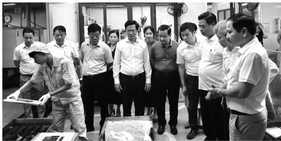
● Đoàn Giám sát chuyên đề HĐND TP giám sát tại Công ty TNHH Cơ khí đúc Thành Phương, huyện Thủy Nguyên. (Ảnh trong bài: PV)

Cụ thể, trong lĩnh vực giáo dục đào tạo đã ban hành Nghị quyết về miễn giảm 100% học phí cho học sinh từ bậc học mầm non đến THPT; Nghị quyết về thường cho các giáo viên, học sinh đạt