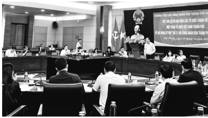
● Công tác tiếp xúc cử tri của HĐND TP được đổi mới theo hướng mở rộng dân chủ, đa dạng hóa hình thức tiếp xúc, đối tượng tiếp xúc.