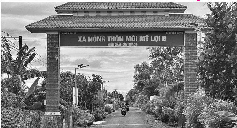
● Cổng chào xã Mỹ Lợi B.