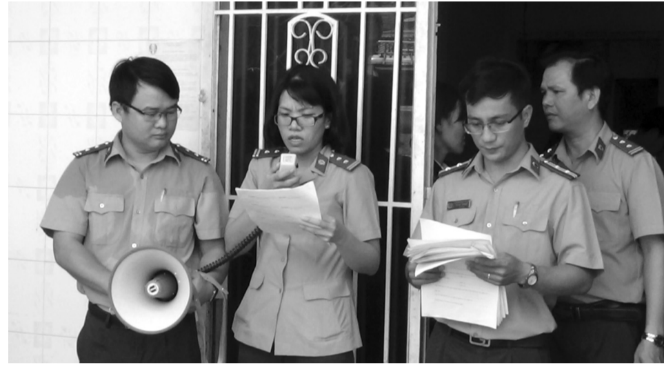
● Cường chế THADS ở Bình Thuận.

Theo đó, tiếp tục phát huy vai trò thành viên Hội đồng Phổ biến, giáo dục pháp luật cấp huyện, tích cực tuyên truyền về chủ