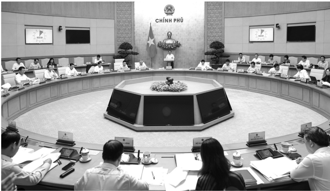
Thủ tướng Phạm Minh Chính chủ trì phiên họp Chính phủ chuyên đề về xây dựng pháp luật tháng 9/2024.