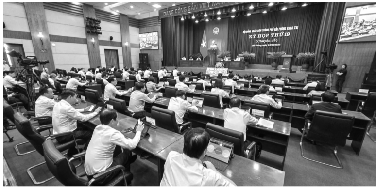
● Các đại biểu bấm nút thông qua Nghị quyết.