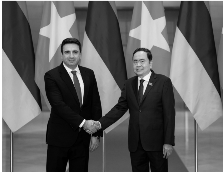
● Chủ tịch Quốc hội Trần Thanh Mẫn đón Chủ tịch Quốc hội Armenia Alen Simonyan.

Để tăng cường hơn nữa trong quan hệ giữa hai QH trong thời gian tới, hai Chủ tịch QH nhất trí tăng cường tiếp xúc, trao đổi Đoàn giữa Lãnh đạo QH, các cơ quan của QH và các Đại biểu QH hai nước, trao đổi kinh nghiệm xây dựng pháp luật, hoàn