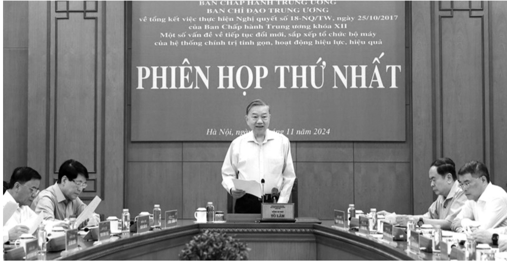
● Tổng Bí thư Tô Lâm đưa ra nhiều chỉ đạo quan trọng tại Phiên họp.

Ngày 19/11, tại Trụ sở Trung ương Đảng, Ban Chỉ đạo Trung ương về tổng kết việc thực hiện Nghị quyết số 18-NQ/TW ngày 25/10/2017 của Ban Chấp hành Trung ương khóa XII “Một số vấn đề về tiếp tục đổi mới, sắp xếp tổ chức bộ máy của hệ thống chính trị tinh gọn, hoạt động hiệu lực, hiệu quả” (Ban Chỉ đạo) đã tổ chức Phiên họp thứ nhất. Tổng Bí thư Tô Lâm, Trưởng Ban Chỉ đạo chủ trì Phiên họp.