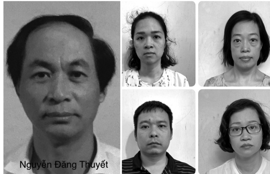
● Một số bị can trong vụ án.