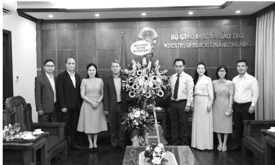
● Bộ trưởng Bộ Tư pháp Nguyễn Hải Ninh chúc mừng Bộ Giáo dục và Đào tạo nhân dịp Ngày Nhà giáo Việt Nam 20/11.