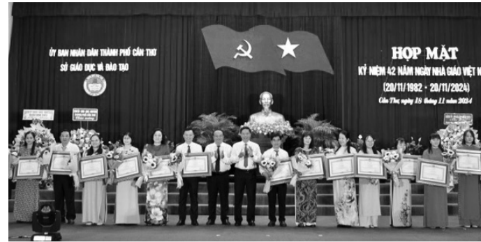
● Các nhà giáo nhận Bằng khen tại buổi họp mặt.

Sở GD&ĐT TP Cần Thơ vừa tổ chức buổi họp mặt kỷ niệm 42 năm Ngày Nhà giáo Việt Nam (20/11/1982 - 20/11/2024). Dịp này, TP có 18 nhà giáo được nhận Bằng khen của Thủ tướng Chính phủ.