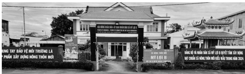
● Xã Mỹ Lợi B đã được UBND tỉnh Tiền Giang công nhận danh hiệu xã đạt chuẩn NTMKM năm 2024.

Đề bảo vệ môi trường, UBND xã phối hợp Đoàn Thanh niên tổ chức hoạt động "Đổi chất thải nhựa lấy quà tặng" và triển khai mô hình "phân loại, thu gom rác thải nhựa". Xã đã có mô hình thu gom chất thải nhựa ở các điểm trường, UBND xã, khu dân cư, chợ Kênh Kho.