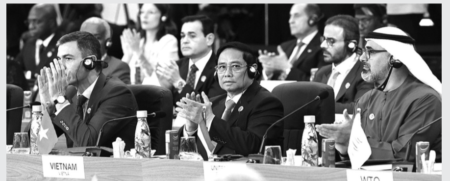
● Thủ tướng Phạm Minh Chính dự và phát biểu tại Phiên thảo luận Cuộc chiến chống đói nghèo.

Sáng 18/11 (theo giờ địa phương), tại Rio de Janeiro, Brazil, Hội nghị Thượng đỉnh Nhóm Các nền kinh tế phát triển và mới nổi hàng đầu thế giới (G20) năm 2024 đã khai mạc với chủ đề “Xây dựng một thế giới công bằng và một hành tinh bền vững”, dưới sự chủ trì của Tổng thống Brazil Lula da Silva, Chủ tịch G20 năm 2024.