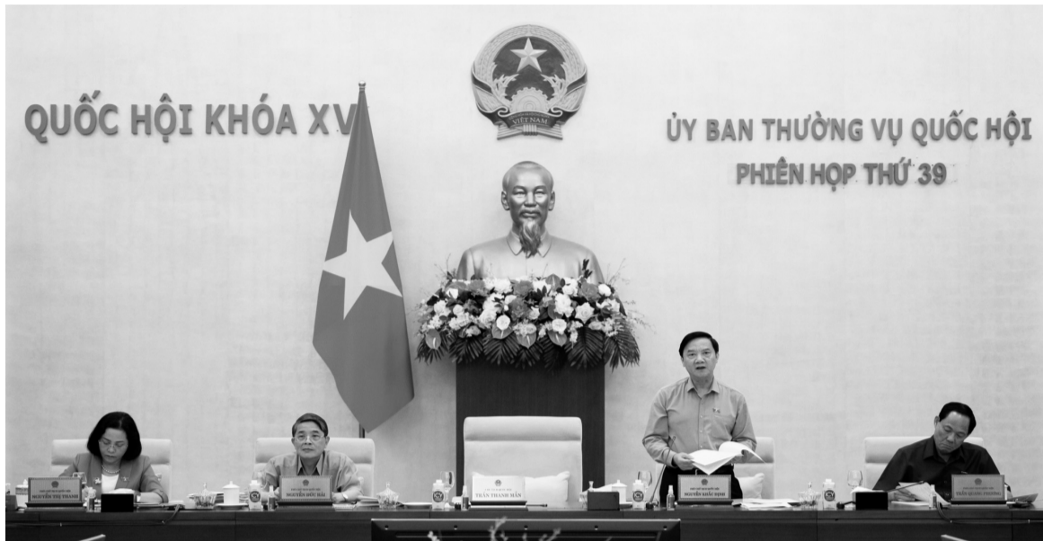
● Phó Chủ tịch Quốc hội Nguyễn Khắc Định phát biểu bế mạc Phiên họp thứ 39.

với các dự thảo Luật, dự thảo Nghị quyết không được thảo luận tại Phiên họp thứ 39 và đã được UBTVQH cho ý kiến bằng văn bản, Phó Chủ tịch QH đề nghị các Ủy ban của QH tiếp tục phối hợp chặt chẽ với các cơ quan của Chính phủ, các cơ quan có liên quan tiếp thu, hoàn chỉnh toàn diện cả về kỹ thuật và nội dung, bảo đảm chất lượng cao nhất khi trình QH xem xét, thông qua.