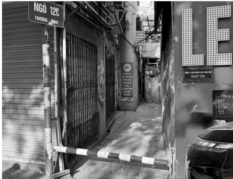
● Barrie chắn đầu ngõ 126 Thượng Đình giờ cao điểm.

Trong giờ cao điểm, nhiều người tận dụng những ngõ nhỏ giao cắt làm đường tắt để rút ngắn thời gian di chuyển nhưng chính hành động này không chỉ gây phiền toái cho người dân sống trong các ngõ nhỏ mà còn trực tiếp gây ùn tắc giao thông, gia tăng khó khăn cho lực lượng Cảnh sát giao thông làm nhiệm vụ phân luồng, điều tiết.