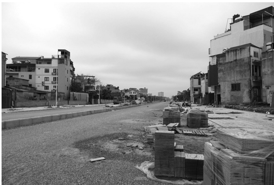
●Đắk Lắk, Đắk Nông, Gia Lai có tỷ lệ giải ngân cao hơn mức trung bình cả nước.

Theo các địa phương, còn có nguyên nhân vướng mắc của các dự án thuộc chương trình mục tiêu quốc gia: văn bản hướng dẫn còn thiếu, chưa đồng bộ, một số văn bản còn khó thực hiện.