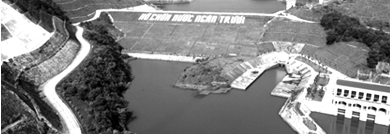
● Các hồ, đập của Việt Nam đang đối mặt với nhiều thách thức về biến đổi khí hậu và tình trạng xuống cấp công trình.