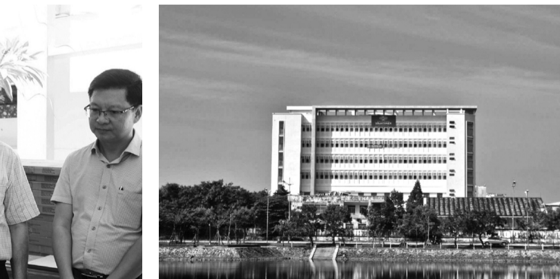
● Khu điều trị kỹ thuật cao của BV đa khoa tỉnh Quảng Nam chưa thể đưa vào hoạt động vì thiếu thiết bị y tế.

Dự án khu điều trị kỹ thuật cao của BV Đa khoa tỉnh Quảng Nam được phê duyệt năm 2020 với tổng mức đầu tư hơn 165 tỷ đồng từ nguồn ngân sách tỉnh. Dự án do Ban Quản lý (BQL) dự án đầu tư xây dựng tỉnh làm chủ đầu tư với quy mô