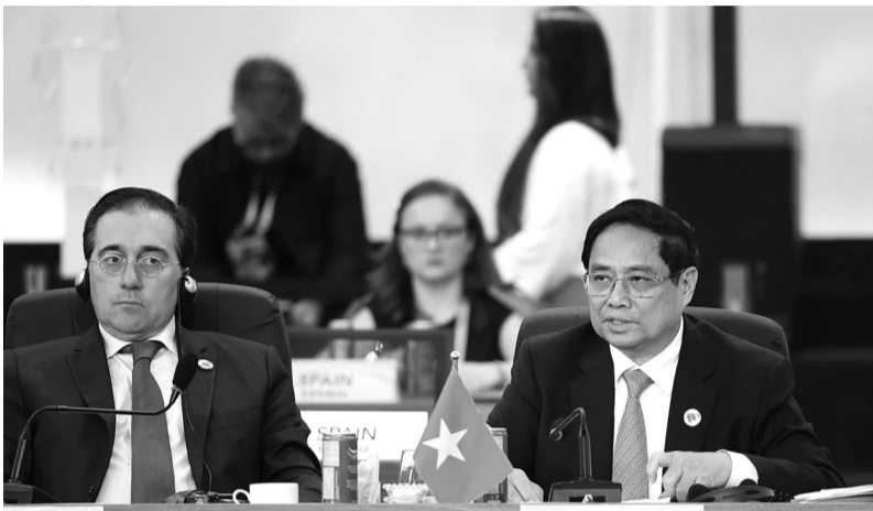
● Thủ tướng Phạm Minh Chính phát biểu tại phiên thảo luận phát triển bền vững và chuyển đổi năng lượng.

Trong phát biểu của mình, Thủ tướng Chính phủ Phạm Minh Chính tái khẳng định chủ trương nhất quán, xuyên suốt về phát triển bền vững và cam kết của Việt Nam là không hy sinh an sinh, tiên bộ, công bằng xã hội và bảo vệ môi trường để chạy theo tăng trưởng kinh tế đơn thuần. Trích dẫn câu ngạn ngữ nổi tiếng: “Chúng ta không thừa hưởng Trái Đất từ tổ tiên, chúng ta vay mượn nó từ các thế hệ tương lai”, Thủ tướng nhấn mạnh, mỗi hành động của chúng ta hôm nay đều sẽ quyết định vận mệnh của các thế hệ tương lai. Với quan điểm ấy, Việt Nam cam kết sẽ nỗ lực hết sức mình cùng các quốc gia, đối tác, cộng đồng quốc tế cam kết phấn đấu thực hiện mục tiêu phát thải ròng bằng 0 trước 2050, đóng góp cho sự phát triển của một thế giới xanh, sạch, đẹp, bền vững, vì tương lai của các thế hệ mai sau. Để góp phần đưa tiến trình thực hiện các mục tiêu phát triển bền vững trở lại đường ray, tăng tốc và về đích đúng hạn, Thủ tướng Chính phủ chia sẻ với Hội nghị ba đề xuất: