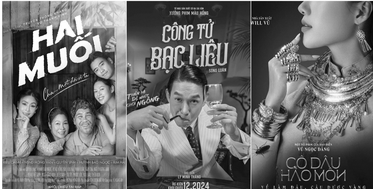
Thị trường phim Việt Nam đang gồng gánh muôn tầng "sóng gió" mang tên chi phí. (Ảnh minh họa.)

Những năm qua, điện ảnh Việt Nam đã có những bước tiến, tăng trưởng hàng năm và có những tác phẩm "ăn khách". Tuy nhiên, bên cạnh những thành tích đáng ghi nhận, ngành điện ảnh vẫn đang đối mặt với những khó khăn, rào cản về chi phí, đặc biệt vấn đề dự thảo Luật Thuế giá trị gia tăng - GTGT (sửa đổi) sắp tới.