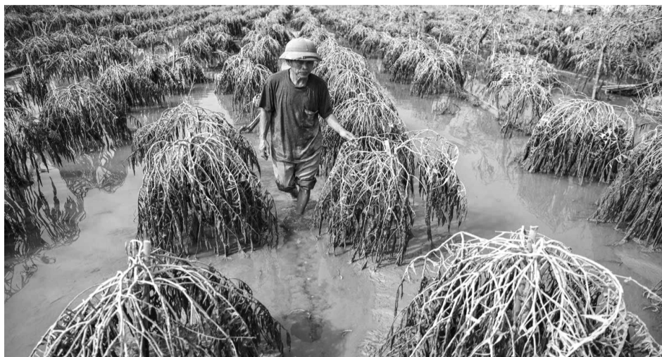
● Một hộ trồng đào tại Hà Nội bị ảnh hưởng do bão số 3.

HĐND TP đã ban hành Nghị quyết 38/NQ-HĐND ngày 4/10/2024 về một số nội dung sử dụng ngân sách Hà Nội năm 2024, trong đó có nội dung hỗ trợ phát triển sản xuất cây vụ Đông góp phần khắc