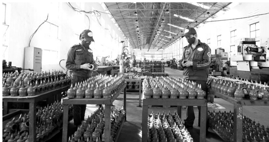
● Một loại sản phẩm của Nhà máy. (Ảnh trong bài: Lâm Minh)