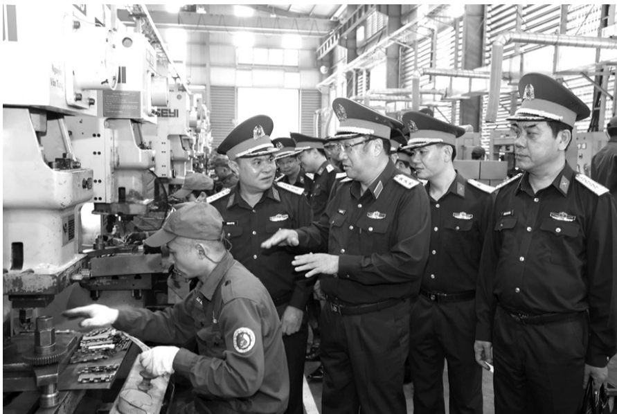
● Thượng tướng Phạm Hoài Nam và Đoàn công tác kiểm tra hoạt động sản xuất của Z183.

sản xuất của Nhà máy đạt 961 tỷ đồng; doanh thu đạt 950 tỷ đồng; giá trị tăng thêm đạt 259 tỷ đồng; thu nhập bình quân người lao động hơn 17 triệu đồng/người/tháng.