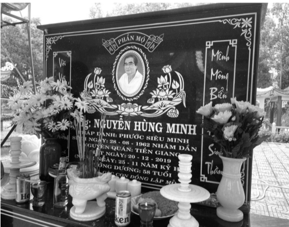
● Theo cáo phó, bia mộ ghi ông Minh chết ngày 20/12/2019 nhưng ngày 23/12/2019 vẫn xuất hiện chữ ký của ông Minh trong hồ sơ chuyển nhượng tài sản từ ông Minh sang người khác.

Phiên tòa sơ thẩm vừa qua đã phải hoãn do bị cáo bị ốm, không bảo đảm sức khỏe. HỒNG MÂY