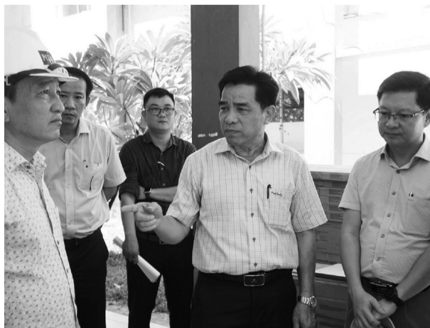
● Lãnh đạo UBND tỉnh Quảng Nam kiểm tra dự án.

Được xem là dự án quan trọng, mang tính cấp thiết với thực tế của Bệnh viện (BV) Đa khoa tỉnh Quảng Nam, nhưng khu điều trị kỹ thuật cao với tổng mức đầu tư hơn 165 tỷ đồng xây xong lại phải bỏ đó vì thiếu thiết bị y tế.