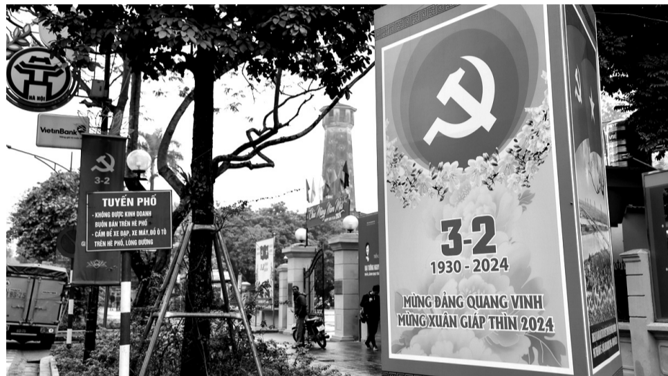
● Hà Nội có 97 tác phẩm xuất sắc được trao giải trong Cuộc thi chính luận bảo vệ nền tảng tư tưởng của Đảng lần thứ 4 năm 2024. (Ảnh: CTV)

“Tôi đã từng theo những đoàn quân trên đường Trường Sơn huyền thoại. Những nghệ sĩ như chúng tôi cho dù phải đối mặt với muôn vàn gian khổ mà trước