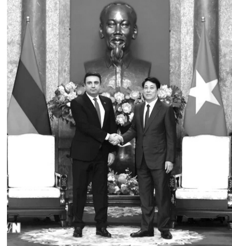
● Chủ tịch nước Lương Cường tiếp Chủ tịch Quốc hội Cộng hòa Armenia Alen Simonyan.

Thông báo về tình hình phát triển kinh tế - xã hội Việt Nam và đánh giá cao kết quả cuộc hội đàm giữa Chủ tịch QH Việt Nam Trần Thanh Mẫn và Chủ tịch QH Armenia, Chủ tịch nước mong muốn cơ quan lập pháp hai nước tiếp tục cùng