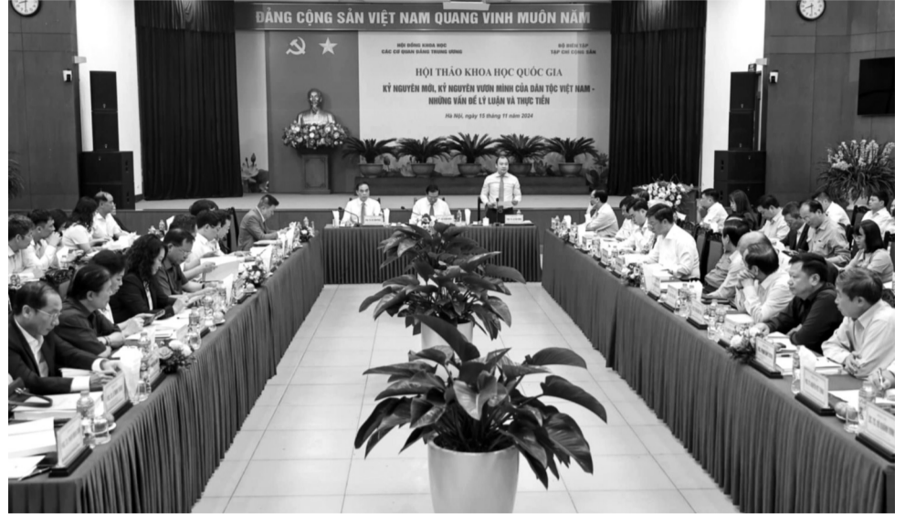
● Quang cảnh Hội thảo.

Kỷ nguyên mới đòi hỏi phải tạo chuyển biến căn bản về nhận thức, hành động của toàn Đảng, toàn xã hội trong việc giữ gìn, nuôi dưỡng, sử dụng hiệu quả nhất các nguồn lực của đất nước. Từng đồng tiền, bát gạo; từng mét vuông đất rừng, ngư trường, biên cương; từng via quặng; từng giờ, từng ngày lao động và khả năng của mỗi con người... cần phải được quý trọng, bồi đắp, khai phóng để tạo thành của cải, vật chất. Tiết kiệm, chống lãng phí, thất thoát, cần, kiệm xây