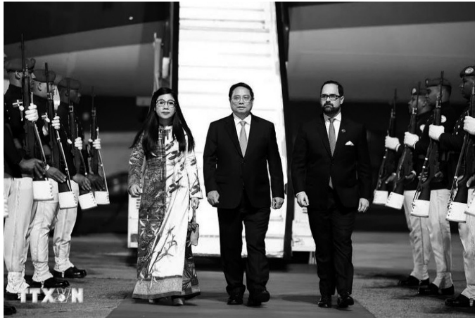
● Lễ đón Thủ tướng Phạm Minh Chính và Phu nhân đến Thủ đô Santo Domingo bắt đầu chuyến thăm chính thức Cộng hòa Dominicana.

Chuyến thăm tới Dominicana lần này của Thủ tướng Chính phủ Phạm Minh