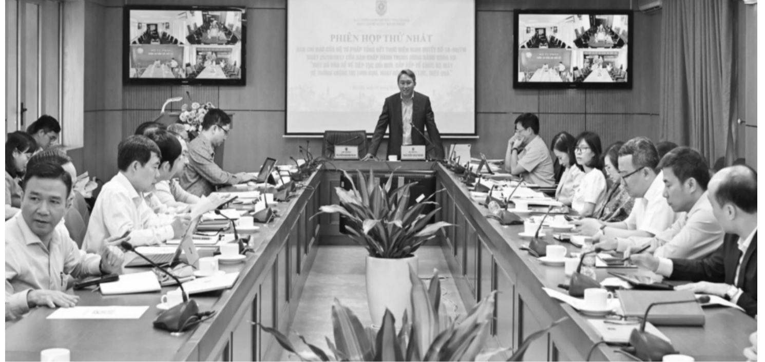
● Bộ trưởng Bộ Tư pháp Nguyễn Hải Ninh phát biểu tại Hội nghị.