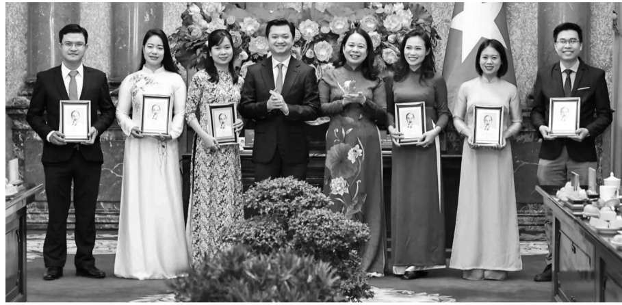
● Phó Chủ tịch nước Võ Thị Ánh Xuân trao tặng quà cho các nhà khoa học trẻ được nhận Giải thưởng Khuê Văn Các lần thứ nhất.

Khẳng định vai trò quan trọng của lĩnh vực khoa học xã hội và nhân văn, Phó Chủ tịch nước bày tỏ ấn tượng trước những nghiên cứu mang tính ứng dụng cao của các nhà khoa học trẻ, đóng góp thiết thực trong giải quyết vấn đề