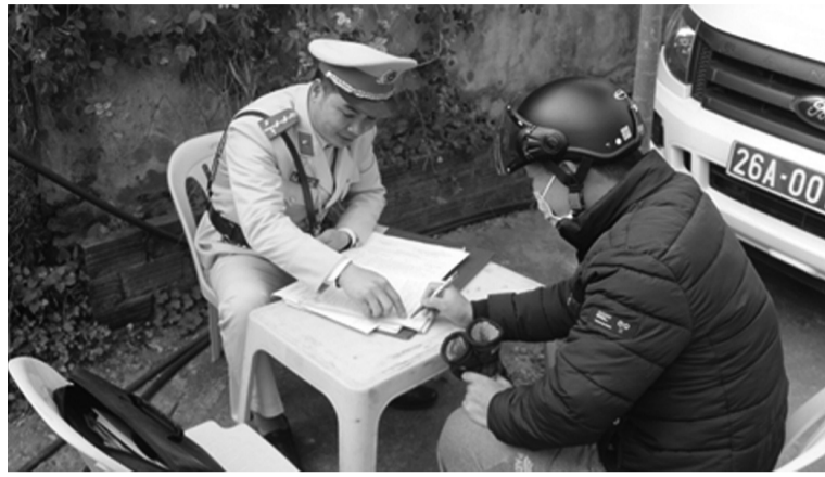
● Cảnh sát giao thông Sơn La lập biên bản vi phạm hành chính đối với người điều khiển phương tiện vi phạm trật tự, an toàn giao thông.

Kiểm tra kiến thức pháp luật về trật tự, an toàn giao thông đường