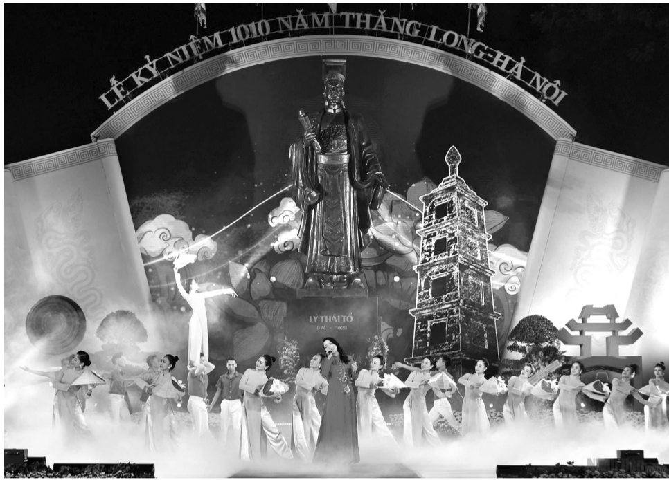
● Chương trình biểu diễn nghệ thuật chào mừng kỷ niệm 1010 năm Thăng Long - Hà Nội.

“Văn hóa nghệ thuật có những đặc thù, nên ngoài những phương pháp lãnh đạo chung, phương thức lãnh đạo của Đảng đối với lĩnh vực văn hóa nghệ thuật cũng cần có những cách thức lãnh đạo chuyên biệt, giữ vững nguyên tắc tổ chức, hoạt động của Đảng, đồng thời thành tâm, tôn trọng, linh hoạt, cốt sao tập hợp, đoàn kết đông đảo lực lượng văn hóa, nghệ thuật quy tụ bên Đảng, tạo những điều kiện thuận lợi, môi trường tự do sáng tạo, khơi dậy những tiềm năng sáng tạo để cho ra đời ngày càng nhiều tác phẩm văn hóa nghệ thuật lớn, nuôi dưỡng và làm phong phú đời sống tinh thần xã hội, xứng tầm với sự nghiệp đổi mới, phát triển đất nước dưới sự lãnh đạo của Đảng ta” (Trích bài viết “Đổi mới phương thức lãnh đạo của Đảng đối với lĩnh vực văn hóa văn nghệ” của PGS. TS Nguyễn Thế Kỷ - Chủ tịch Hội đồng Lý luận, phê bình văn học nghệ thuật Trung ương đăng tải trên Tạp chí Cộng sản tháng 6/2023).