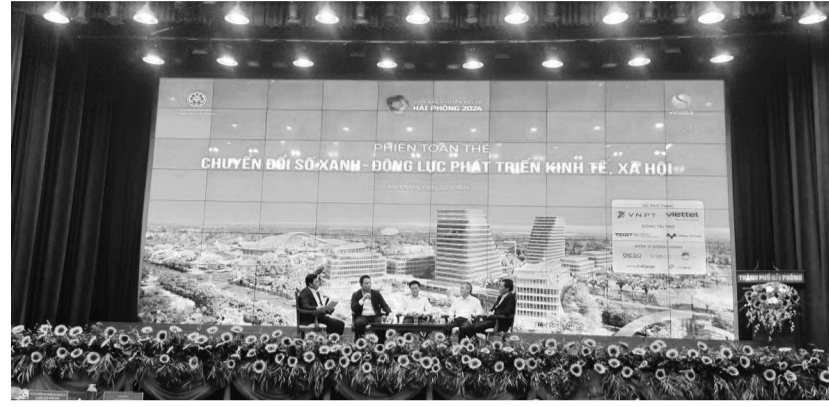
● Diễn đàn có chủ đề "CDS xanh - Động lực phát triển kinh tế, xã hội".

Kho dữ liệu dùng chung được hình thành, đã cập nhật 1941 trường thông tin và hơn 437.000 bản ghi dữ liệu. Công dữ liệu mở đã công bố 50/98 bộ dữ liệu mở do 7/20 sở, ngành cung cấp. Tích hợp