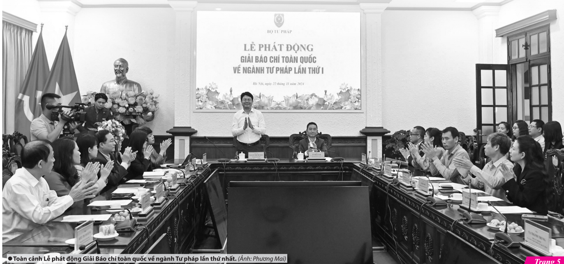
● Toàn cảnh Lễ phát động Giải Báo chí toàn quốc về ngành Tư pháp lần thứ nhất.