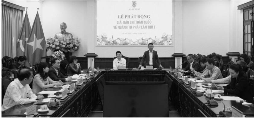
● Toàn cảnh Lễ phát động Giải Báo chí toàn quốc về ngành Tư pháp lần thứ nhất.