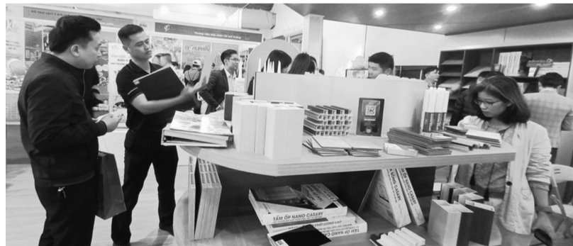
● DN ủng hộ việc tăng cường quản lý để phát triển bền vững thị trường VLXD, nhưng đề xuất có lộ trình phù hợp.

Ủng hộ việc tăng cường quản lý nhà nước để phát triển bền vững, ổn định thị trường vật liệu xây dựng (VLXD), song một số doanh nghiệp (DN) cho rằng quy định của Bộ Xây dựng về quản lý chất lượng sản phẩm, hàng hóa VLXD vừa ban hành sẽ có hiệu lực từ 16/12/2024 là hơi gấp gáp, DN nêu ý kiến cần thêm thời gian để chuẩn bị; do thực hiện chứng nhận hợp quy đối với hàng nhập khẩu phải qua nhiều bước, mất nhiều thời gian.