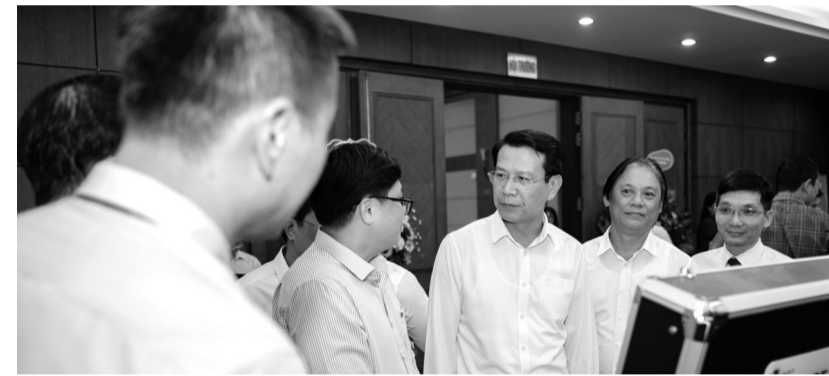
● Các đại biểu tham quan gian trưng bày thành tựu CDS của Hải Phòng.

1.579/1.937 dịch vụ công trực tuyến lên Cổng quốc gia đạt tỷ lệ 81.51%; Tỷ lệ hồ sơ trực tuyến toàn trình đạt trên 90%.