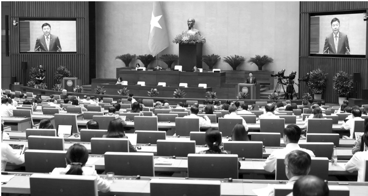
● Phó Thủ tướng Lê Thành Long trình bày Tờ trình về Dự án Luật Thuế thu nhập doanh nghiệp (sửa đổi).

Ngày 22/11, Quốc hội họp tại hội trường nghe Tờ trình, Báo cáo thẩm tra và họp tại tổ thảo luận Dự án Luật Thuế tiêu thụ đặc biệt (sửa đổi) và Dự án Luật Thuế thu nhập doanh nghiệp (sửa đổi).