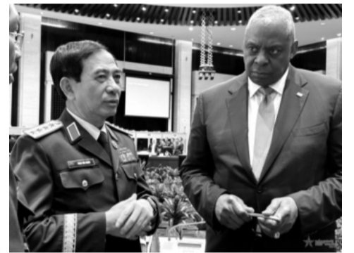
● Bộ trưởng Phan Văn Giang tiếp xúc bên lề với Bộ trưởng Quốc phòng Hoa Kỳ Lloyd Austin.

Tại cuộc tiếp xúc với Bộ trưởng Quốc phòng Hoa Kỳ Lloyd Austin, hai bên nhất trí tiếp tục tăng cường hợp tác quốc phòng song phương, phù hợp với khuôn khổ quan hệ đối tác chiến lược toàn diện vì hòa bình, hợp tác và phát triển bền vững. Đại tướng Phan Văn Giang khẳng định việc hợp tác khắc phục hậu quả chiến tranh tại Việt Nam có ý nghĩa rất quan trọng đối với quan hệ song phương.