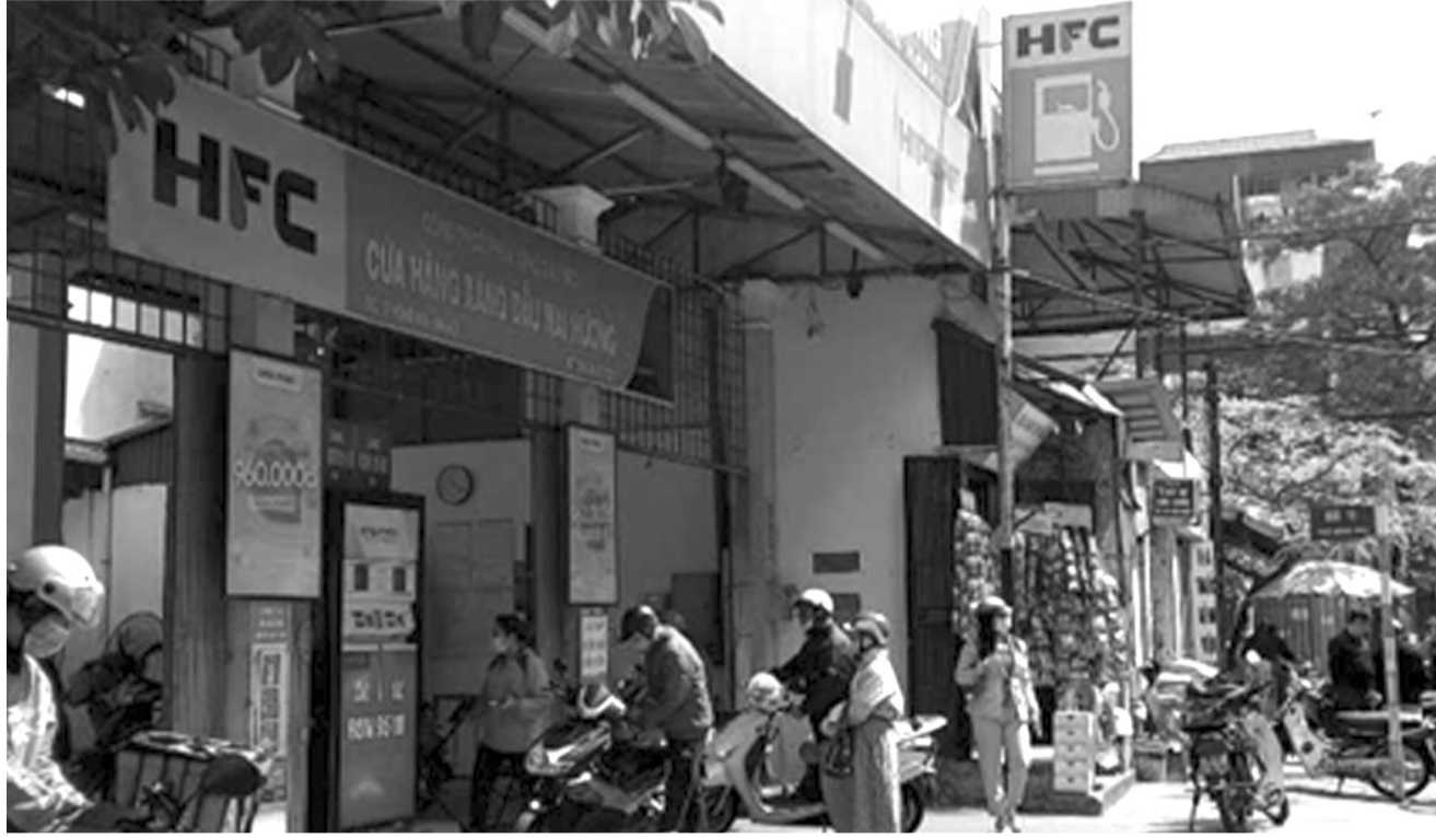
● Thương nhân phân phối xăng dầu sẽ được mua bán lẫn nhau theo nội dung dự thảo mới của Bộ Công Thương.