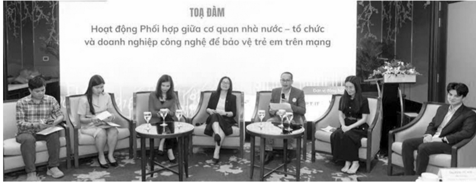
● Toạ đàm trong khuôn khổ hội thảo “Đẩy mạnh hợp tác bảo vệ trẻ em trên môi trường mạng”.

Tại Hội thảo, các chuyên gia đã nhấn mạnh hai hình thức lừa đảo trực tuyến nhắm vào trẻ em phổ biến hiện nay.