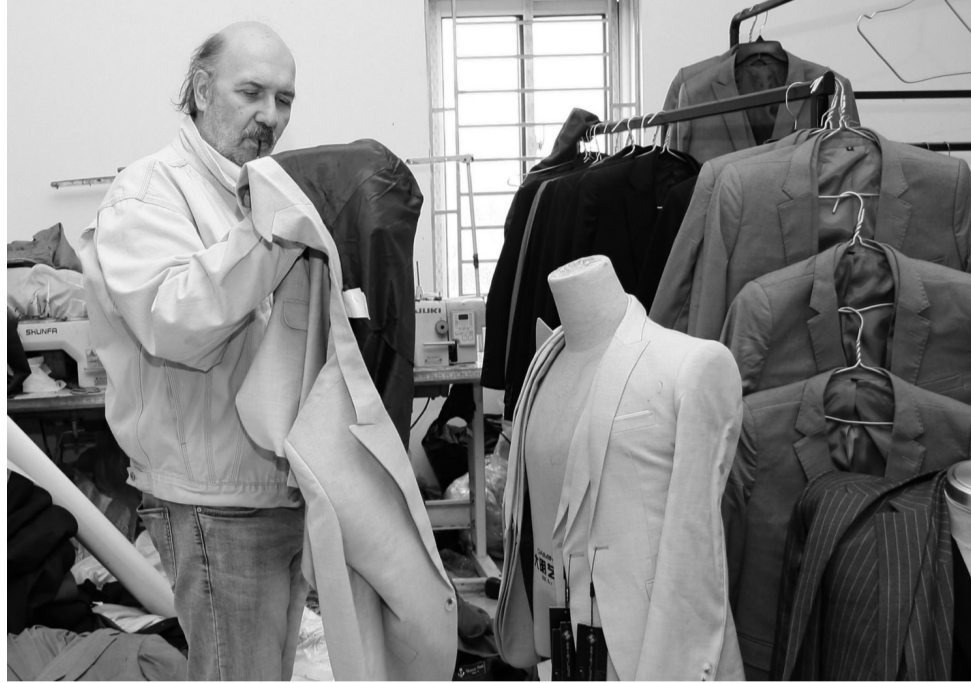
● Sản phẩm từ nghề may của người làng Cựu.

Ngày nay, làng Cựu vẫn còn giữ được hơn 49 biệt thự cổ, những công trình tín ngưỡng như đình làng, giếng làng và không gian cộng đồng đặc trưng của vùng Đồng bằng sông Hồng. Những ngôi nhà ba gian hai chái với sân vườn, nổi bật với hoa văn được chạm trổ tinh xảo trên mái nhà, trên các cột trụ gỗ lim, hình hoa sen, hình đắp nổi tinh tế cùng những hoa văn Pháp trên cửa sắt, cửa sổ hoà hợp với nhau thành một tổng thể đẹp mắt.