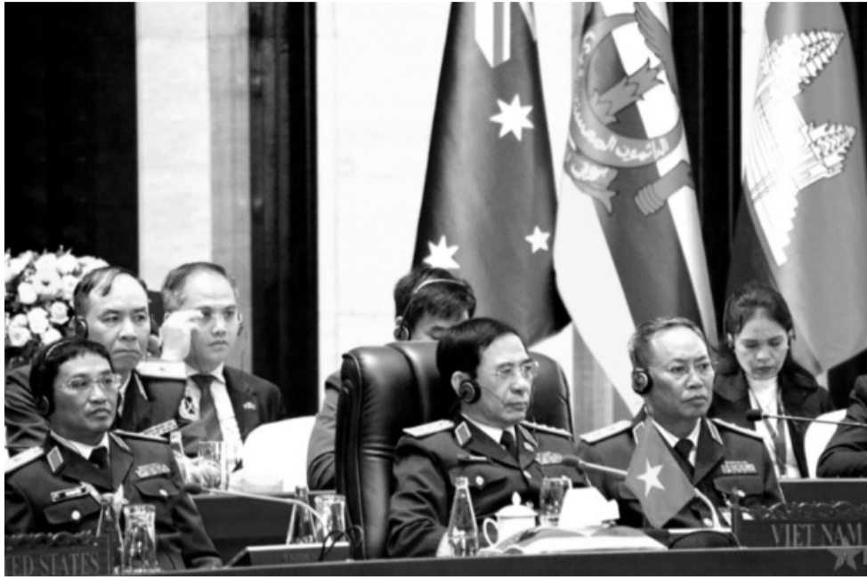
● Đại tướng Phan Văn Giang tại Hội nghị ADMM+ lần thứ 11.

Đại tướng Phan Văn Giang đề nghị hợp tác quốc phòng giữa ASEAN với các đối tác cần gắn với định hướng chiến lược của ASEAN, đặc biệt là Tầm nhìn Cộng đồng ASEAN 2045; tiếp tục đề cao vai trò trung tâm, khả năng dẫn dắt và tự chủ chiến lược