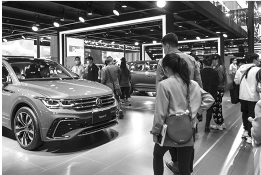
● Thị trường ô tô khởi sắc trong giai đoạn giảm lệ phí trước bạ.

Đại diện VAMA phân tích, số liệu bán hàng cho thấy, thị trường ô tô, đặc biệt ô tô lắp ráp trong nước liên tục có những bước tăng trưởng trong 2 tháng gần đây. Trong đó, riêng trong tháng 9/2024 - tháng đầu tiên chính sách giảm 50% lệ phí trước bạ có hiệu lực, doanh số bán hàng của các thành viên VAMA tăng vọt, từ mức trung bình khoảng hơn 25.000 xe trong những tháng trước đó lên hơn 36.000 xe. Trong đó, doanh số bán của xe lắp ráp trong nước tháng 9 đạt 19.500 xe, tăng 62% so với tháng trước và doanh số xe nhập