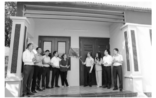
● Lễ khánh thành và bàn giao nhà đại đoàn kết cho hộ người có công ở huyện Lục Nam, Bắc Giang.

Hiện nay, Bộ LĐ-TB&XH đang xây dựng dự thảo Nghị định sửa đổi, bổ sung một số điều của Nghị định số 131/2021/NĐ-CP ngày 30/12/2021 của Chính phủ quy định chi tiết và biện pháp thi hành Pháp lệnh Ưu đãi người có công với cách mạng. Dự thảo Nghị định và Tờ trình Chính phủ đã đăng tải trên Cổng thông tin điện tử Chính phủ để lấy ý kiến các Bộ, ngành, địa phương. HỒNG MINH