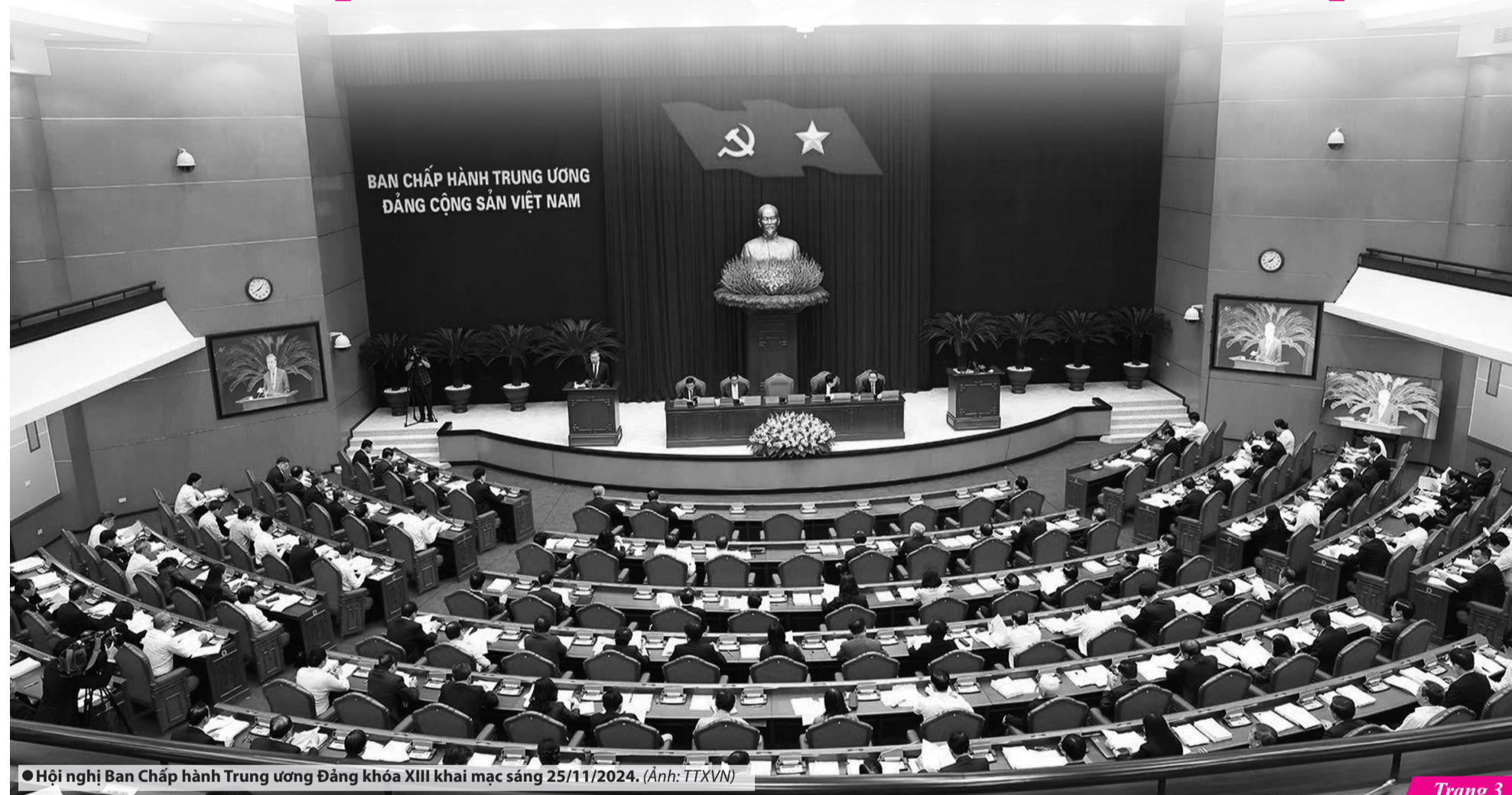
● Hội nghị Ban Chấp hành Trung ương Đảng khóa XIII khai mạc sáng 25/11/2024. (Ảnh: TTXVN)