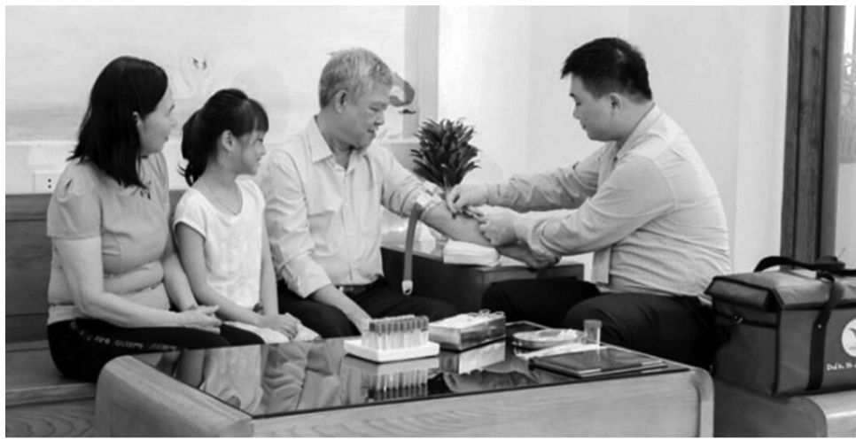
● Xét nghiệm máu tổng quát định kỳ giúp kiểm soát sức khỏe và kịp thời phát hiện nguy cơ bệnh tật.

Không có thời gian tới cơ sở y tế thăm khám khi xuất hiện các triệu chứng bệnh, hay tâm lý sợ bệnh viện đã hình thành thói quen "tự làm bác sĩ" của nhiều người dân, gây ra những hậu quả đáng tiếc. Trước thực tế đó, dịch vụ xét nghiệm tổng quát tại nhà đã trở thành công cụ đắc lực trong quá trình theo dõi và chăm sóc sức khỏe toàn diện của mọi nhà.