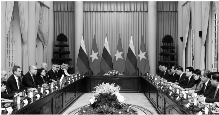
● Chủ tịch nước Lương Cường và Tổng thống Bulgaria Rumen Radev hội đàm.

Nhận lời mời của Chủ tịch nước Lương Cường, Tổng thống Cộng hòa Bulgaria Rumen Radev và Phu nhân cùng Đoàn đại biểu cấp cao Nhà nước Bulgaria tiến hành chuyến thăm chính thức Việt Nam từ ngày 24 - 28/11/2024. Sáng 25/11, tại Phủ Chủ tịch, sau Lễ đón chính thức trọng thể, Chủ tịch nước Lương Cường đã hội đàm với Tổng thống Rumen Radev.