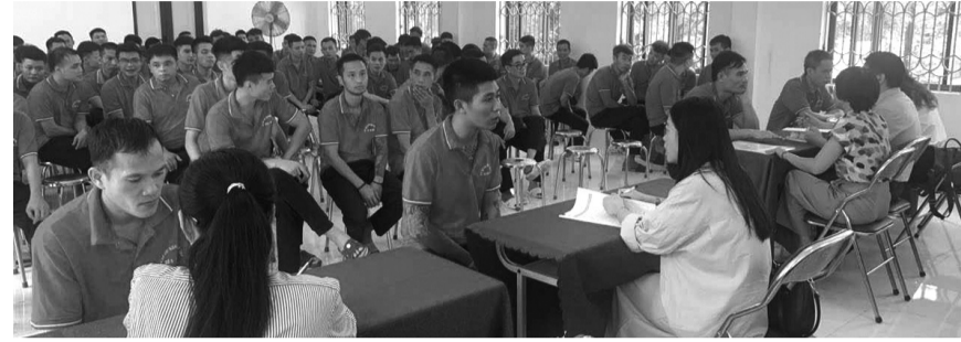
● Cơ sở cai nghiện ma túy số 5 Hà Nội phối hợp Trung tâm Dịch vụ việc làm Hà Nội tổ chức tư vấn, hướng nghiệp học nghề, giới thiệu việc làm cho học viên cai nghiện.