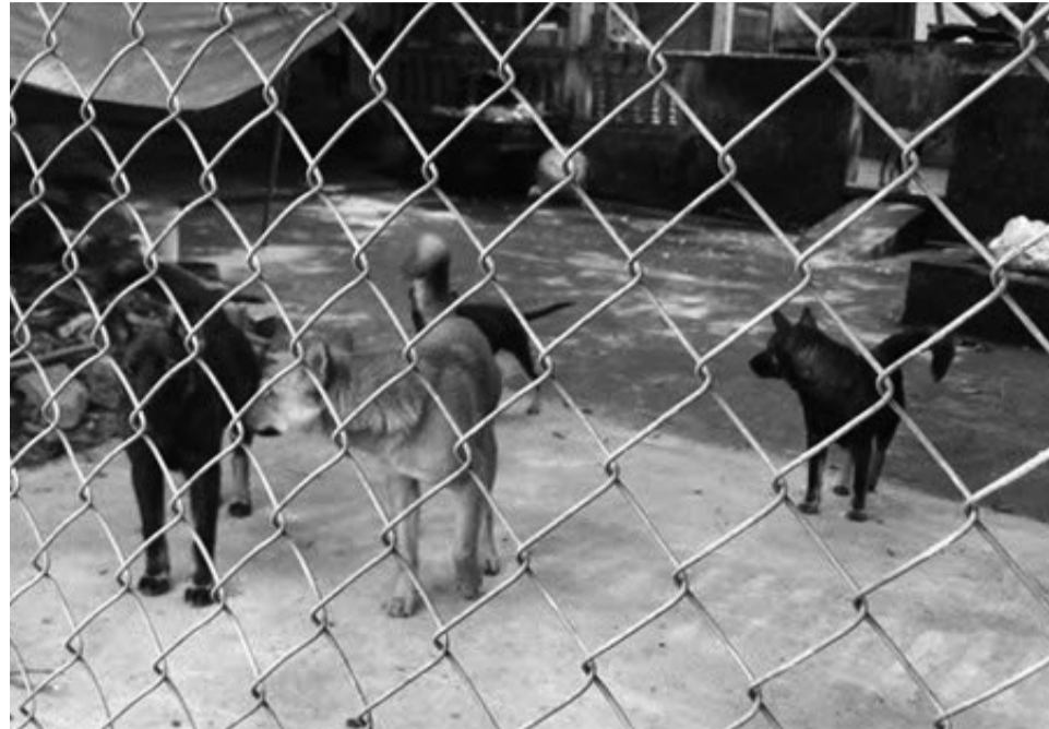
● Cần quản lý, kiểm soát nghiêm ngặt việc nuôi giống chó dữ.

Ở nhiều nơi, chó vẫn được thả rông, không rọ mõm trong khu dân cư, tại những nơi đông người qua lại như đường phố, công viên, thậm chí đối với những giống chó nổi tiếng hung dữ như Pitbull, Rottweiler, Doberman... Một số người nuôi còn có thái độ bất hợp tác khi được nhắc nhở, hoặc xem nhẹ hậu quả, dẫn đến những tình huống khó lường.