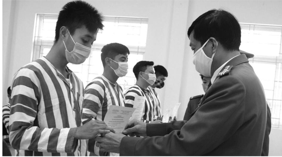
● Dự thảo Luật Chuyển giao người đang chấp hành án phạt tù có nhiều quy định nhằm hạn chế lãng phí nguồn lực trong chuyển giao người đang chấp hành án phạt tù.

Dự thảo Luật quy định người đang chấp hành án phạt tù chỉ có quyền rút lại nguyện