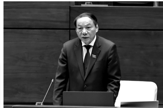
● Bộ trưởng Bộ Văn hóa, Thể thao và Du lịch Nguyễn Văn Hùng giải trình, làm rõ một số vấn đề đại biểu Quốc hội nêu.