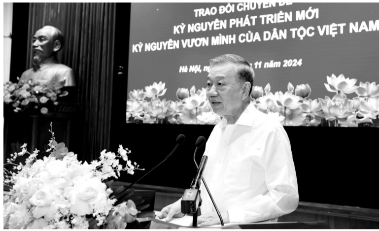
● Tổng Bí thư Tô Lâm trao đổi chuyên đề “Kỷ nguyên phát triển mới - Kỷ nguyên vươn mình của dân tộc Việt Nam”.

Về một số nhận thức cơ bản về kỷ nguyên mới, kỷ nguyên vươn mình của dân tộc, Tổng Bí thư Tô Lâm nhấn mạnh, đó là kỷ nguyên phát triển, kỷ nguyên giàu mạnh, kỷ nguyên thịnh vượng dưới sự lãnh đạo, cầm quyền của Đảng Cộng sản, xây dựng thành công nước Việt Nam XHCN, dân giàu, nước mạnh, dân chủ, công bằng, văn minh. Mọi người dân đều có cuộc sống ấm no, hạnh phúc, được hỗ trợ phát triển, làm giàu; đóng góp ngày càng nhiều cho hòa bình, ổn định, phát triển của khu vực và thế giới, cho hạnh phúc của nhân loại và văn minh toàn cầu. Đích đến của kỷ nguyên vươn mình là dân giàu, nước mạnh, dân chủ, công bằng, văn minh, phát triển theo chế độ xã hội XHCN, sánh vai với các cường quốc năm châu. Ưu tiên hàng đầu trong kỷ nguyên mới là thực hiện thắng lợi các mục tiêu chiến lược đến năm 2030, Việt Nam trở thành nước đang phát triển, có công nghiệp hiện đại, thu