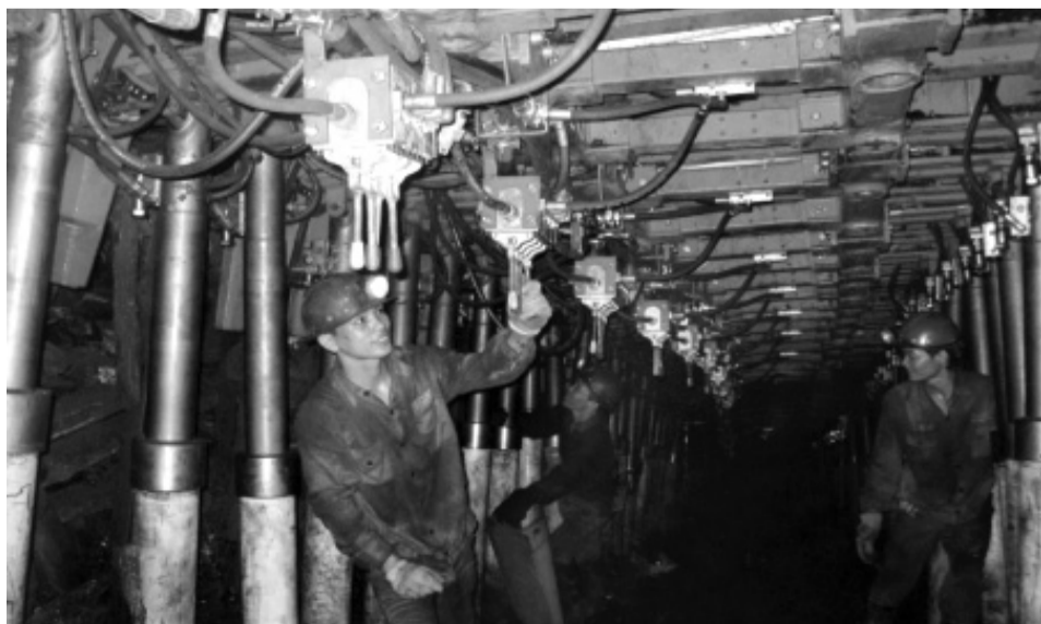
● T Cty Đông Bắc sử dụng công nghệ chống bằng giá khung thủy lực ZH trong khai thác than hầm lò.