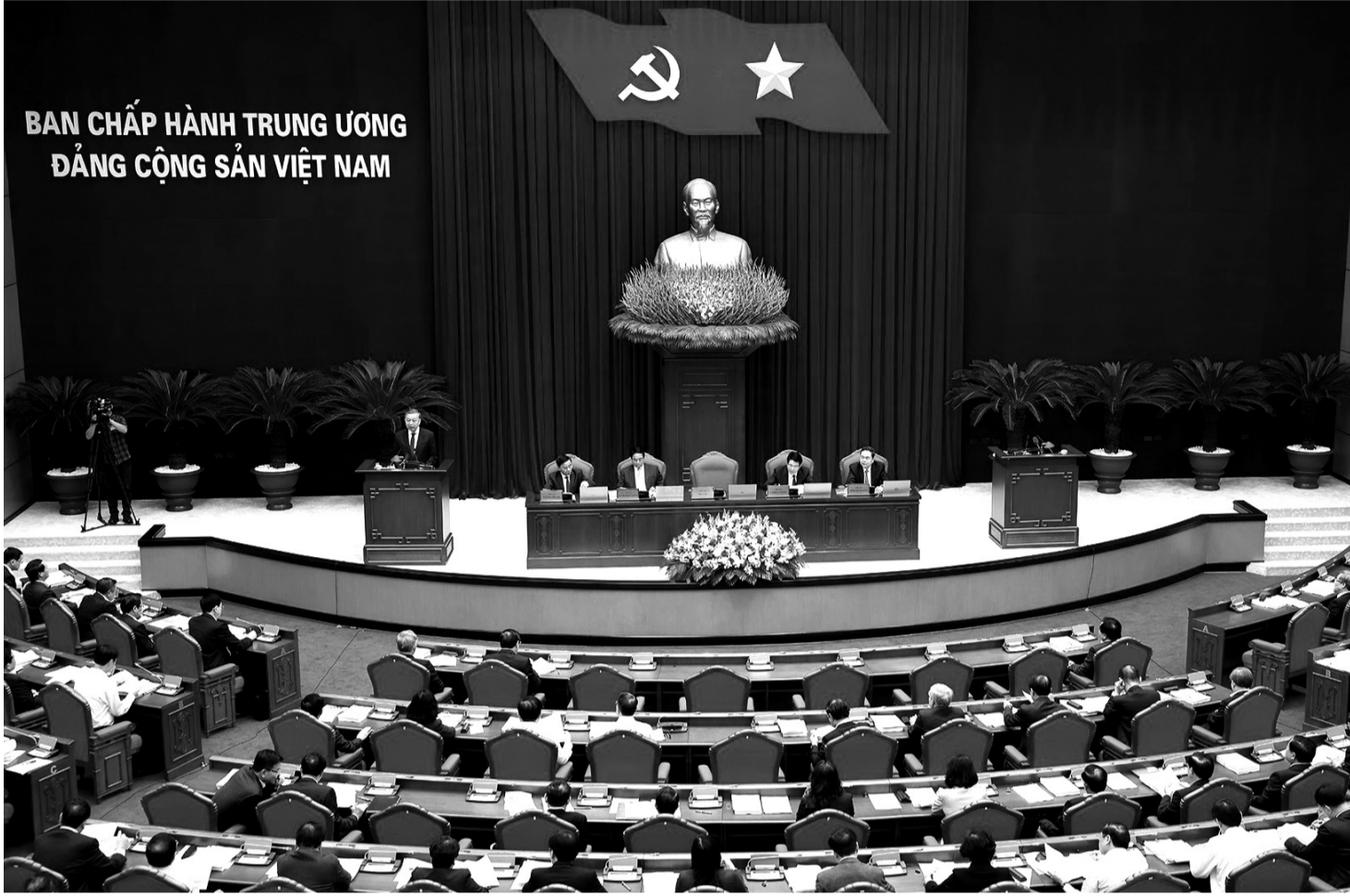
● Hội nghị Ban Chấp hành Trung ương Đảng khóa XIII khai mạc sáng 25/11/2024.

Ngày 25/11, tại Thủ đô Hà Nội, Hội nghị Ban Chấp hành Trung ương Đảng khóa XIII đã hoàn thành nhiều nội dung công việc. Với tinh thần làm việc khẩn trương, trách nhiệm cao, Trung ương đã thảo luận thống nhất các vấn đề quan trọng.