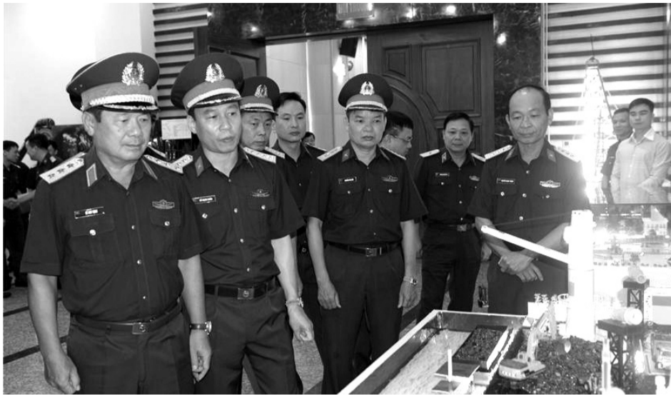
● Lãnh đạo BQP và các đại biểu tham quan các mô hình, sáng kiến trong thực hiện nhiệm vụ sản xuất, kinh doanh của T Cty Đông Bắc.

T Cty đã linh hoạt điều chỉnh chính sách tiền lương gắn với chức danh, vị trí việc làm, năng suất, chất lượng, hiệu quả