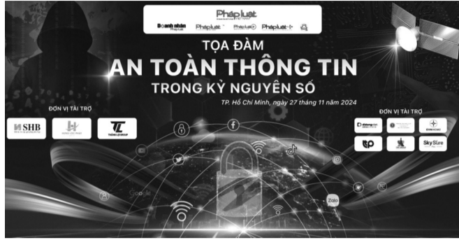
● Tọa đàm “An toàn thông tin trong kỷ nguyên số” sẽ được tổ chức ngày 27/11 tại Khách sạn Mường Thanh (TP HCM).

Tại Tọa đàm “Xây dựng chính sách pháp luật về bảo vệ dữ liệu cá nhân” diễn ra mới đây, lãnh đạo Bộ Công an nhận định, cuộc Cách mạng lần thứ 4 phát triển với quy mô và tốc độ chưa từng có. Dữ liệu đã trở thành nguồn tài nguyên mới, động lực phát triển mới của các quốc gia, của kỷ nguyên số. Nhưng dữ liệu đồng thời cũng là đối tượng mà tội phạm hướng đến để thực hiện hành vi phạm tội; xâm phạm quyền con người, quyền công dân, vi phạm pháp luật, an ninh, trật tự.