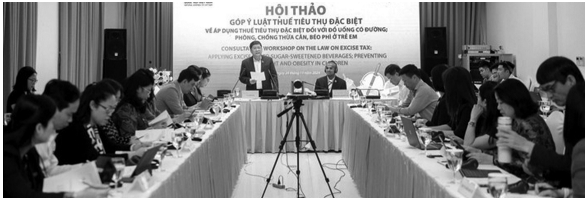
● Hội thảo "Góp ý Luật Thuế tiêu thụ đặc biệt về áp dụng thuế tiêu thụ đặc biệt đối với đồ uống có đường, phòng, chống thừa cân, béo phì ở trẻ em" ngày 24/11.

Theo các chuyên gia y tế, hạn chế đồ uống có đường bằng cách đánh thuế tiêu thụ đặc biệt với sản phẩm này là một trong những biện pháp hiệu quả để ngăn chặn thừa cân, béo phì ở trẻ em.