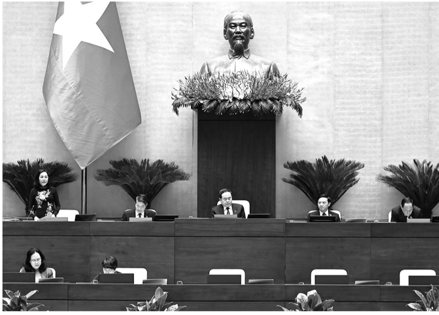
● Quốc hội tiến hành thảo luận ở hội trường chiều ngày 27/11/2024.

Về thuế TTĐB đối với thuốc lá, Phó Thủ tướng Chính phủ, Bộ trưởng Bộ Tài chính cho biết, thuốc lá gây ra hậu quả nghiêm trọng, mỗi năm có khoảng 40.000 người tử vong do hút thuốc lá và Việt Nam phải tốn khoảng 1 tỷ USD để chữa trị các bệnh liên