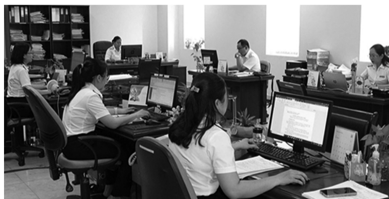
● Nhiều nội dung của Luật Thuế TNCN hiện hành không còn phù hợp cần sửa đổi, bổ sung.

Theo đó, tỷ trọng số thu từ thuế TNCN trong tổng thu ngân sách nhà nước (NSNN) đã tăng từ mức 5,33% năm 2011 lên hơn 9% năm 2023, phù hợp với xu