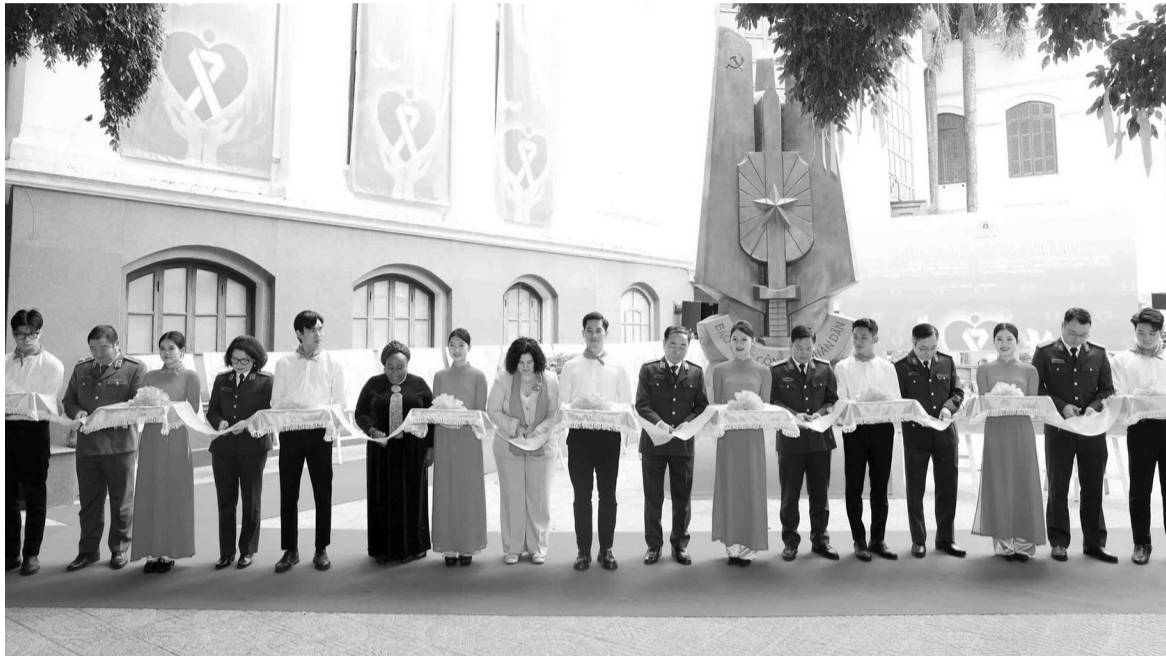
● Các đại biểu thực hiện nghi thức cắt băng khai mạc triển lãm.

Ngày 15/11 đến ngày 15/12 hàng năm được Chính phủ Việt Nam chọn làm Tháng hành động vì bình đẳng giới và phòng ngừa, ứng phó với bạo lực trên cơ sở giới. Đây là tháng hành động cao