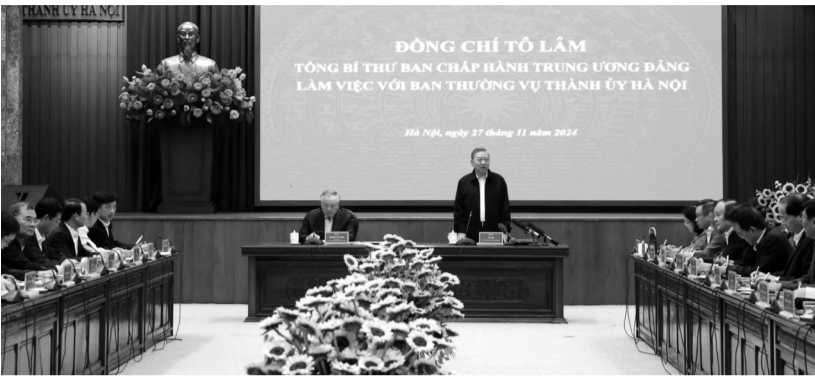
● Tổng Bí thư Tô Lâm phát biểu chỉ đạo tại buổi làm việc.

Sáng 27/11, tại Trụ sở Thành ủy Hà Nội, Tổng Bí thư Tô Lâm làm việc với Ban Thường vụ Thành ủy Hà Nội để nghe báo cáo kết quả về công tác xây dựng Đảng, xây dựng hệ thống chính trị, phát triển kinh tế - xã hội, quốc phòng - an ninh, đối ngoại của TP năm 2024 và kế hoạch năm 2025, giai đoạn 2025 - 2030.