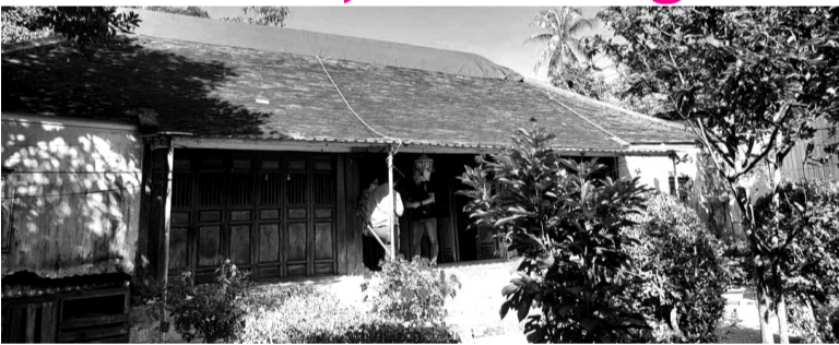
● Một số nhà vườn, nhà rường cổ ở Thừa Thiên Huế đang được trùng tu. (Ảnh: Thùy Nhung)

Hệ thống nhà vườn, nhà rường cổ là tài sản quý giá góp phần tạo nên đặc trưng văn hóa Huế. Trải qua hàng trăm năm chịu tác động từ thời tiết, thiên tai; kiến trúc một số nhà vườn, nhà rường cổ xuống cấp nghiêm trọng. Trước thực trạng này, nhiều giải pháp bảo tồn đang được triển khai.