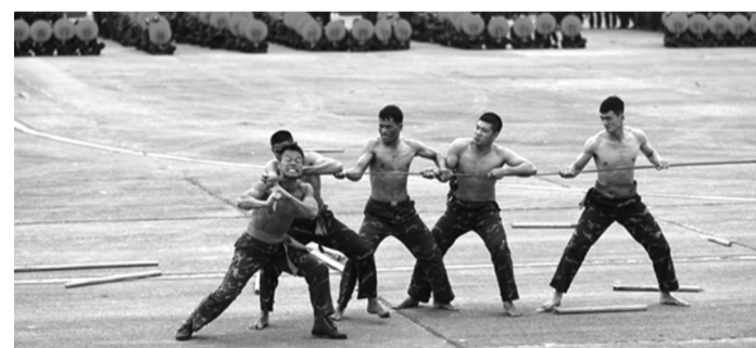
Một màn biểu diễn của bộ đội đặc công.

Triển lãm QPQTVN lần thứ 2 năm 2024 diễn ra ngày 19 - 22/12 tại sân bay Gia Lâm, Hà Nội. Quân đội dự kiến có 1,5 ngày mở cửa miễn phí cho người dân tham quan. Thời gian mở cửa từ 13h30 ngày 21/12 đến hết 22/12. LAM HẠNH