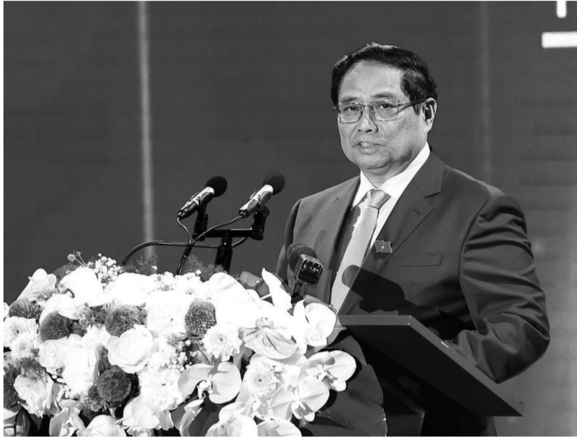
● Thủ tướng Phạm Minh Chính phát biểu tại Ngày hội Khởi nghiệp đổi mới sáng tạo Quốc gia 2024.

Chiều 27/11, tại TP Hải Phòng, Thủ tướng Chính phủ Phạm Minh Chính dự khai mạc TECHFEST Việt Nam 2024 thuộc chuỗi chương trình Ngày hội Khởi nghiệp Đổi mới sáng tạo Quốc gia. Chương trình do Bộ Khoa học và Công nghệ (KH&CN) cùng UBND TP Hải Phòng chủ trì tổ chức.