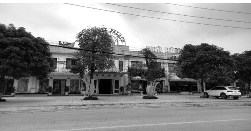
● Công trình xây dựng vi phạm tại BVYHCT tỉnh Hải Dương.

Sau đó, ngày 12/3/2024, cơ quan chức năng Hải Dương nhận được văn bản của Cty Đại Sơn đề nghị "tặng toàn bộ tài sản là các công trình xây dựng vi phạm cho BVYHCT để quản lý, sử dụng".