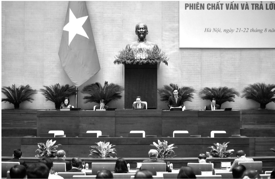
● Quang cảnh phiên chất vấn và trả lời chất vấn tháng 8 năm 2024 tại Phiên họp thứ 36 của UBTVQH.

Báo cáo tổng hợp nội dung thẩm tra của Hội đồng Dân tộc, các Ủy ban của QH, Báo cáo ý kiến của Ban Dân nguyện về việc thực hiện các nghị quyết của UBTVQH về giám sát chuyên đề và chất vấn từ đầu nhiệm kỳ QH khóa XV đến hết năm 2023 đã chỉ rõ những kết quả đạt được đối với lĩnh vực nội vụ. Theo đó, việc sắp xếp đơn vị hành chính (ĐVHC) cấp huyện, cấp xã giai đoạn 2019 - 2021 đã cơ bản hoàn thành. Đến hết năm 2021, 45 tỉnh, TP