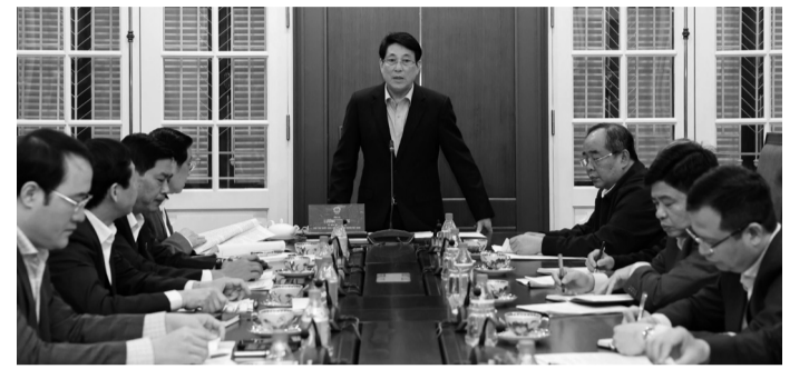
● Chủ tịch nước Lương Cường làm việc với Ban Nội chính Trung ương - Cơ quan Thường trực của Ban Chỉ đạo Cải cách tư pháp Trung ương.

Ngày 27/11, tại Hà Nội, Chủ tịch nước Lương Cường đã chủ trì buổi làm việc với Ban Nội chính Trung ương - Cơ quan Thường trực của Ban Chỉ đạo Cải cách tư pháp Trung ương để cho ý kiến về một số phương hướng, nhiệm vụ trọng tâm công tác cải cách tư pháp trong thời gian tới, hoàn thiện các Quy định về chức năng, nhiệm vụ, quyền hạn, chế độ làm việc, quan hệ công tác của Ban Chỉ đạo.