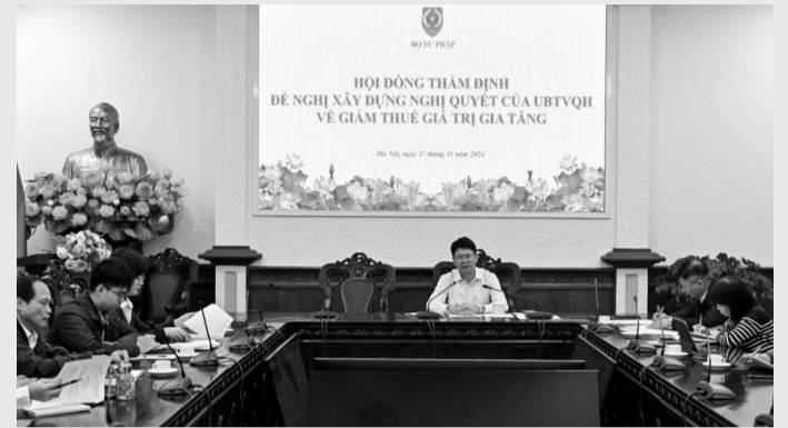
● Toàn cảnh phiên họp.