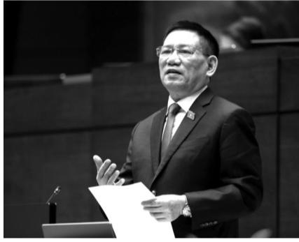
● Phó Thủ tướng, Bộ trưởng Bộ Tài chính Hồ Đức Phớc giải trình.

Cùng ngày, QH đã biểu quyết thông qua Luật Phòng không nhân dân; Luật Công đoàn (sửa đổi); Luật sửa đổi, bổ sung một số điều của Luật Bảo hiểm y tế; Nghị quyết về chủ trương đầu tư Chương trình mục tiêu quốc gia về phát triển văn hóa giai đoạn 2025 - 2035; Nghị quyết về chủ trương đầu tư Chương trình mục tiêu quốc gia phòng, chống ma túy đến năm 2030; nghe Tờ trình và Báo cáo thẩm tra về việc tiếp tục chủ trương đầu tư dự án điện hạt nhân Ninh Thuận.