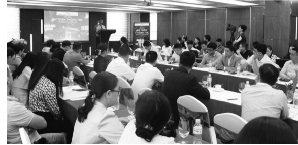
● Toàn cảnh Tọa đàm.