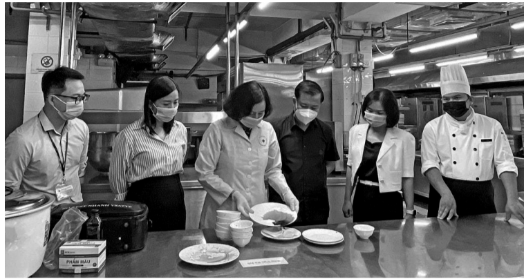
● Chi cục ATVSTP Hà Nội kiểm tra ATTP.

Trước thực tế đó, để chủ động phòng, chống ngộ độc thực phẩm, từ 2016, Hà Nội đã triển khai thí điểm mô hình kiểm soát ATTP bữa cỗ tập trung đông