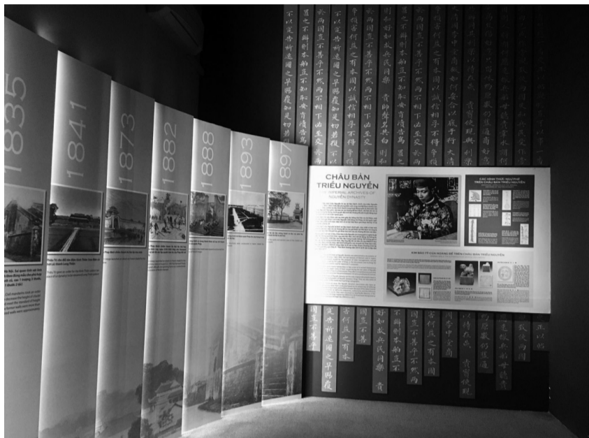
● Hiện nay, việc áp dụng công nghệ hiện đại, cách bài trí nghệ thuật đã và đang được nhiều bảo tàng, di tích áp dụng thành công. (Ảnh: PV)

Trong những năm gần đây, các bảo tàng, di tích lịch sử đã trở thành một điểm hẹn mới đầy hấp dẫn của nhiều người, đặc biệt là giới trẻ. Điều này cho thấy dấu hiệu tích cực sau các nỗ lực đổi mới, áp dụng công nghệ kỹ thuật của các bảo tàng, khu di tích.