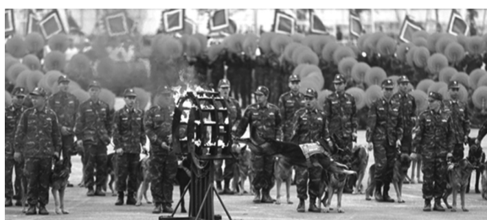
Chó nghiệp vụ biên phòng nhảy qua vòng lửa.