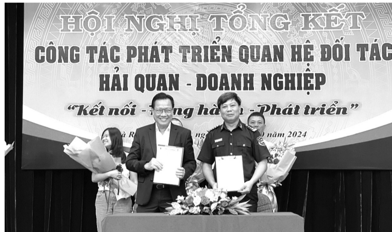
● Cơ quan Hải quan và doanh nghiệp ký kết thỏa thuận hợp tác.