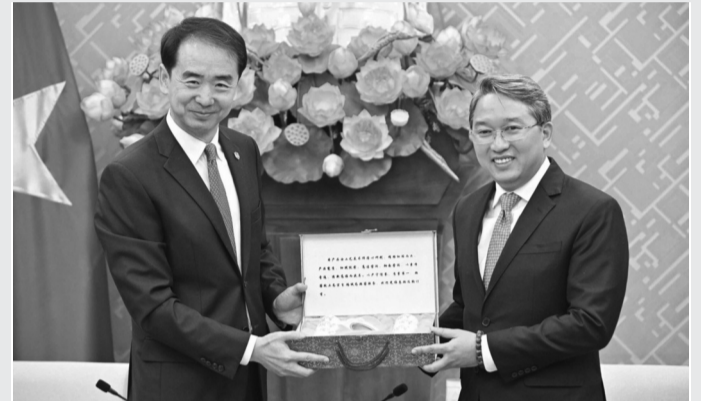
● Đồng chí Hà Vĩ, tân Đại sứ đặc mệnh toàn quyền CHND Trung Hoa tại Việt Nam (bên trái) tặng quà lưu niệm cho Bộ trưởng Bộ Tư pháp Nguyễn Hải Ninh.

Tại buổi tiếp, Bộ trưởng Nguyễn Hải Ninh bày tỏ vui mừng về sự phát triển mạnh mẽ trong quan hệ giữa hai Đảng, hai Nhà nước Việt Nam - Trung Quốc ngày càng phát triển đi vào chiều sâu, hợp tác trên các lĩnh vực đạt nhiều tiến triển tích cực, sâu sắc, thực chất và toàn diện, đặc biệt là sau các chuyến thăm mang tính lịch sử của Lãnh đạo cấp cao hai nước từ năm 2022 đến nay, thể hiện rõ nét trong các Tuyên bố chung Việt Nam - Trung Quốc năm 2022, 2023.