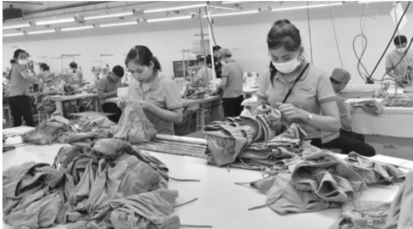
● Dệt may đang từng bước chuyển đổi sản xuất phù hợp với nhu cầu thị trường.

Kế hoạch nền kinh tế tuần hoàn (CEAP) sẽ có tác động đến 7 nhóm lĩnh vực xuất khẩu chính của Việt Nam, trong đó có thiết bị điện tử, công nghệ thông tin, nhóm về pin; nhóm về bao bì, nhóm về nhựa, dệt may, da giày và một số lĩnh vực khác... cũng sẽ bị ảnh hưởng.