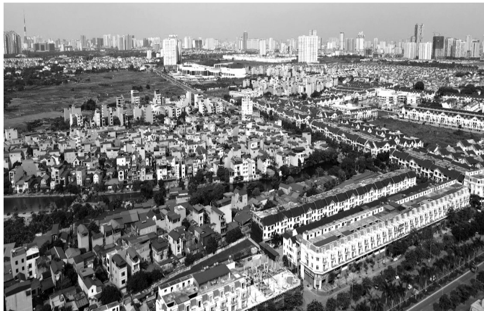
● Quy định mới về bảo lãnh nhà ở hình thành trong tương lai. (Ảnh: Hồng Thương)

Chính phủ đã ban hành Nghị định 147/2024/NĐ-CP, quy định chi tiết các điều kiện đối với trang thông tin điện tử và mạng xã hội trong nước. Theo đó, tại điểm e khoản 3 Điều 23 Nghị định 147/2024/NĐ-CP quy định thực hiện xác