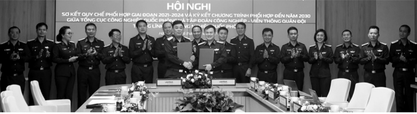
● Lãnh đạo Tổng cục CNQP và Viettel trao biên bản phối hợp, hợp tác giai đoạn 2025 - 2030.

Sau 4 năm triển khai Quy chế phối hợp, các cơ quan, đơn vị của Tổng cục Công nghiệp Quốc phòng (CNQP) và Tập đoàn Công nghiệp - Viễn thông Quân đội (Viettel) đã tích cực, thường xuyên trao đổi, triển khai hiệu quả các nội dung.