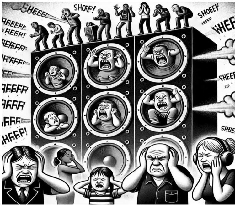
● Cản "tấy chay" các sản phẩm âm nhạc thiếu chất lượng nghệ thuật.

Đại diện Thanh tra Bộ VH,TT&DL cho biết, trong Bộ quy tắc ứng xử chung dành cho nghệ sĩ có nội dung về việc "không sáng tác, sản xuất sản phẩm có nội dung vi phạm các chuẩn mực đạo đức xã hội, vi phạm pháp luật". Bên cạnh đó là việc áp dụng với những quy định pháp luật hiện hành để xử lý. Các tác phẩm âm nhạc, nếu có sai phạm đều phải chịu xử lý theo quy định của pháp luật, cụ thể là Nghị định 38/2021/NĐ-CP về xử phạt vi phạm hành chính trong lĩnh vực văn hóa, quảng cáo có sửa đổi theo Nghị định