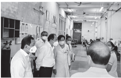
● Lãnh đạo Sở Y tế gặp gỡ, nghe ý kiến của bác sĩ trưởng khoa và điều dưỡng trưởng khoa cấp cứu BV Phạm Ngọc Thạch.

Để giải quyết tình trạng trên, BV đã triển khai các hoạt động như giảm tải bệnh nhân từ tuyến trước bằng cách chuyển giao khoa học kỹ thuật cho các BV tỉnh, thành tại khu vực phía Nam; chuyển bệnh nhân lao ổn định về y tế địa phương; tăng cường điều trị ngoại trú, giảm áp lực khoa nội trú; xét nghiệm tiền phẫu ngoại trú