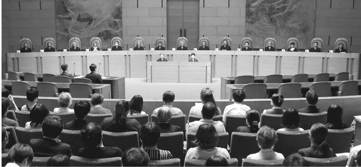
● Một phiên tòa ở Nhật Bản.

hưởng của pháp luật Hoa Kỳ, Nhật Bản áp dụng mô hình tập trung quản lý dịch vụ pháp lý cung cấp cho các cơ quan nhà nước. Các vụ kiện liên quan đến Chính phủ phần lớn được quản lý tập trung bởi một nhóm các công tố viên trực thuộc Bộ Tư pháp, một số công chức làm việc tại các cơ quan liên quan, các chính quyền địa phương và các luật sư thuê ngoài.