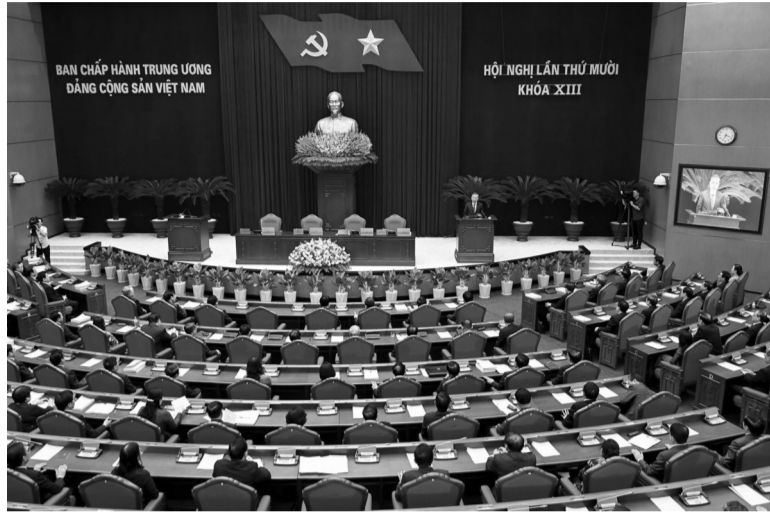
● Tổng Bí thư Tô Lâm phát biểu tại Hội nghị lần thứ 10 Ban Chấp hành Trung ương Đảng khóa XIII.

Tuy nhiên, chúng ta cũng phải nhìn nhận những thách thức phải đối mặt. Đó là nền kinh tế phát triển nhưng chưa bền vững; quy mô nền kinh tế còn nhỏ, năm 2023 mới đạt hơn 430 tỷ USD; thu nhập bình quân đầu người cũng còn thấp, dự báo đạt khoảng 4.500 USD vào cuối năm 2024. Trong khi đó, muốn đạt tới mức thu nhập trung bình cao là phải trên 10.000 USD vào năm 2030, còn thu nhập cao vào năm 2045 là phải đạt 50.000 USD. Đó là