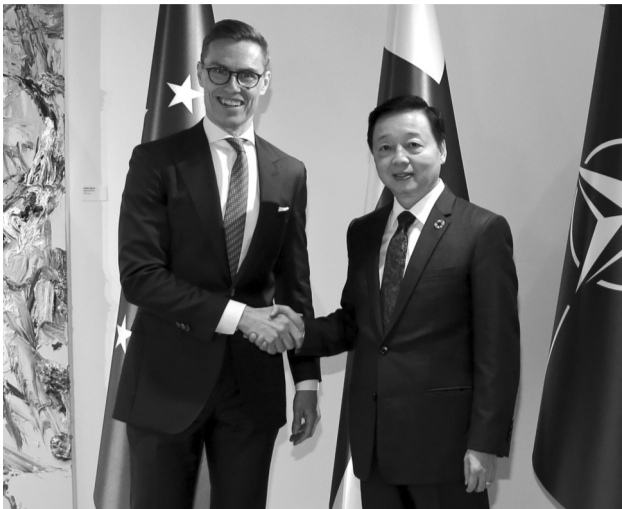
● Tổng thống Phần Lan đón Phó Thủ tướng Trần Hồng Hà.

Trong cuộc hội đàm với Phó Thủ tướng, Bộ trưởng Tài chính Phần Lan Rikka Purra, Phó Thủ tướng Trần Hồng Hà đề nghị Chính phủ Phần Lan quan tâm, khuyến khích các doanh nghiệp Phần Lan đầu tư vào Việt Nam trong các lĩnh vực Phần Lan có thế mạnh như môi