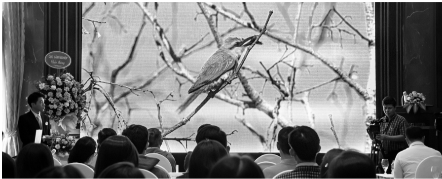
● Rất đông người trẻ quan tâm đến sáng kiến "Trung tâm Thiên nhiên lưu động" nhằm nâng cao nhận thức cộng đồng về bảo vệ ĐVHD.

Sự thờ ơ và hạn chế nhận thức của một bộ phận xã hội về việc sử dụng ĐVHD trái phép không chỉ đẩy các loài quý hiếm vào bờ vực tuyệt chủng mà còn làm tổn thương nghiêm trọng đến hệ sinh thái. Những hành vi tiêu thụ bất chấp này góp phần kích thích chuỗi cung ứng buôn bán ĐVHD, dẫn đến tình trạng săn bắt tàn nhẫn và phá hủy môi trường sống tự nhiên. Một minh chứng là vào ngày 18/11/2024, Trung tâm Bảo tồn ĐVHD tại Việt Nam (SVW) phối hợp