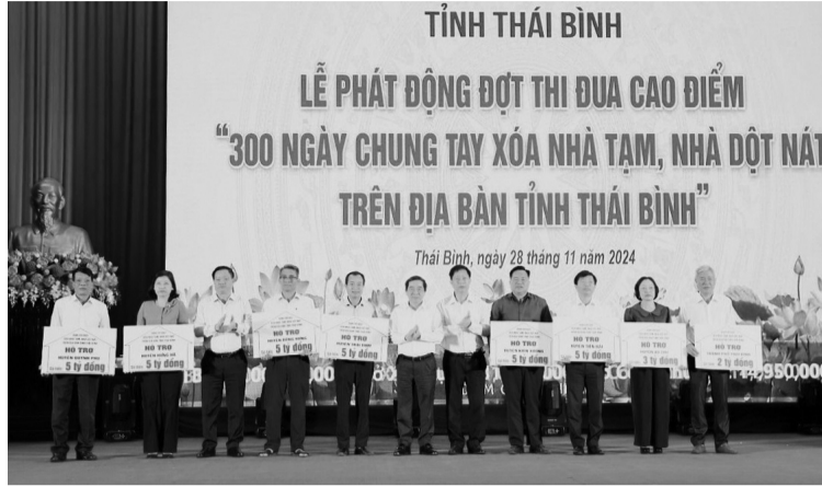
● Tại buổi lễ, có 103 cơ quan, tổ chức, DN, nhà hảo tâm ủng hộ số tiền 45 tỷ đồng.