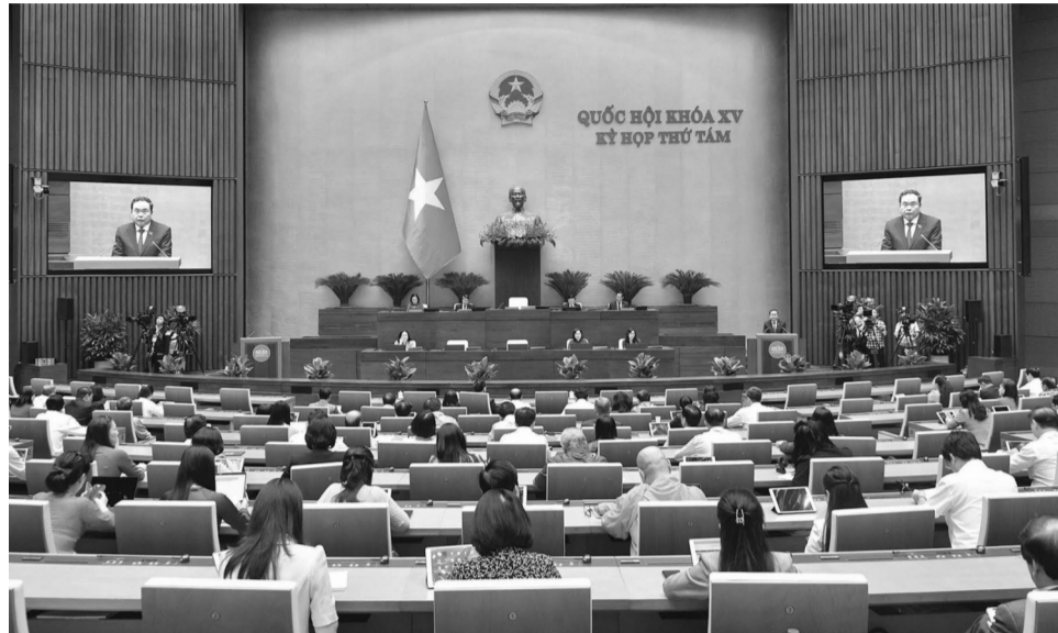
● Quang cảnh phiên chất vấn và trả lời chất vấn.

thuốc lá thế hệ mới chủ yếu là hàng nhập lậu. Do vậy, theo các chuyên gia, chính việc bỏ trống khung pháp lý trong thời gian dài đã tạo điều kiện cho vấn nạn này ngày càng biến tướng, tinh vi, gây ra chuỗi hệ lụy lên xã hội như tấn công vào học đường hay ma túy trá hình trong TLĐT.