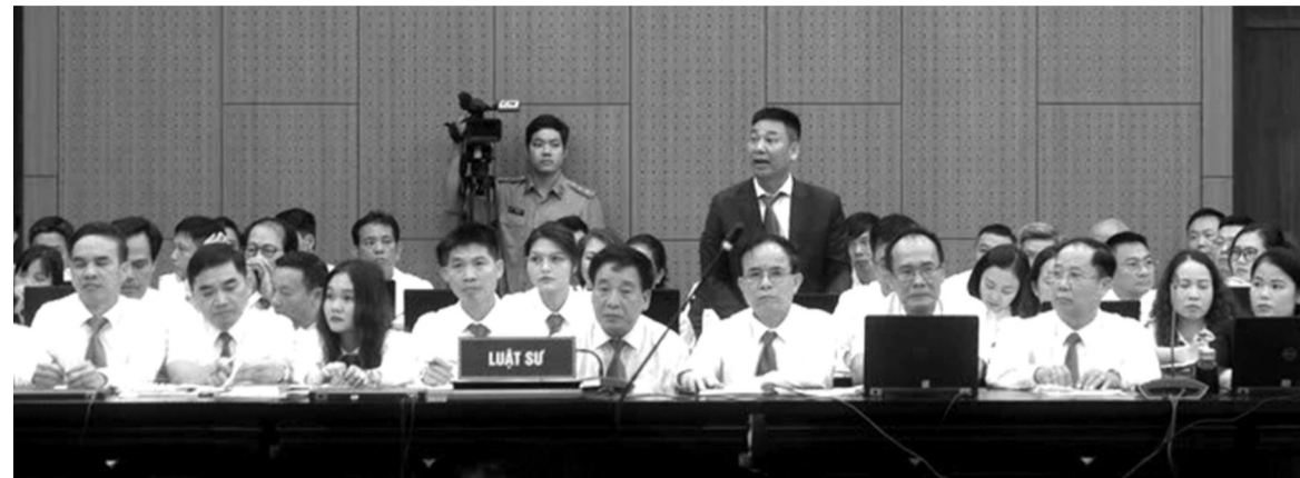
● Các luật sư tham gia bào chữa tại một phiên tòa ở Tòa án nhân dân TP Hà Nội.

Bộ Tư pháp cho biết, tính đến ngày 31/12/2023, trong cả nước đã có hơn 18.200 luật sư hoạt động trong hơn 5.400 tổ chức hành nghề luật sư (tăng khoảng 14.000 luật sư so với năm 2006) đã dần đáp ứng nhu cầu dịch vụ pháp lý ngày càng cao của cá nhân, tổ chức. Đồng thời, với số lượng tổ chức hành nghề luật sư như hiện nay đã tạo điều kiện cho cá nhân, tổ chức thuận lợi hơn trong việc tiếp cận với dịch vụ của luật sư. Một số