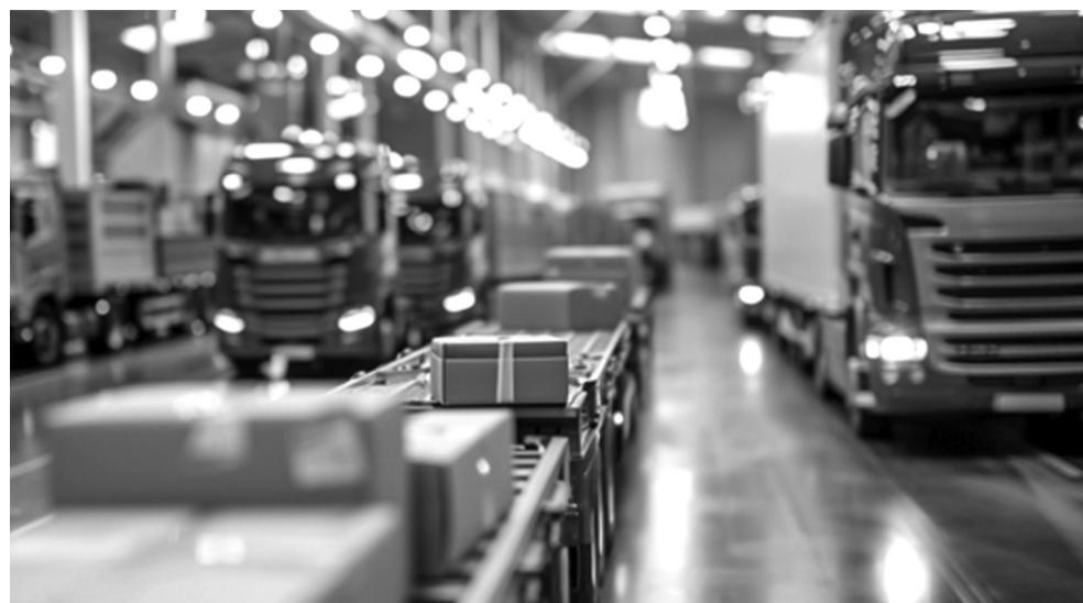
● Thuế vận chuyển và kho bãi là 2 phương thức được nhiều DN áp dụng để giảm chi phí logistics. (Ảnh minh họa: VGP)

Chi phí logistics Việt Nam được nhận diện cao gần gấp đôi chi phí bình quân của thế giới, có giai đoạn chiếm đến 20% GDP (trung bình trên thế giới là 10,6%). Do đó, tối ưu hóa quy trình logistics là một trong những giải pháp quan trọng để giảm chi phí, từ đó giúp hàng hóa Việt Nam tăng thêm sức cạnh tranh trên toàn cầu.