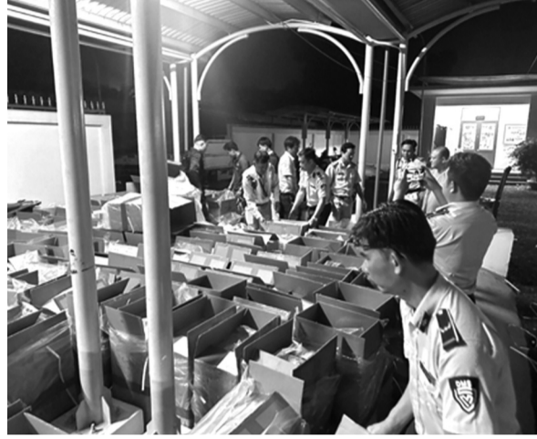
● Lực lượng QLTT thu giữ 12.000 bao thuốc lá nhập lậu.