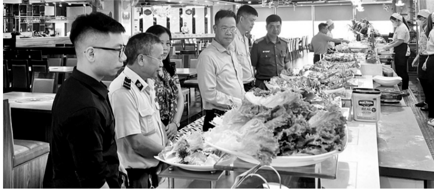
● Đoàn kiểm tra liên ngành kiểm tra một cơ sở chế biến thực phẩm trên địa bàn.