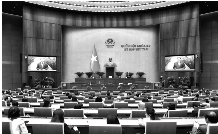
● Quang cảnh phiên họp ngày 29/11.