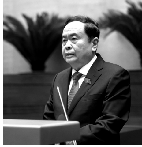
● Chủ tịch Quốc hội Trần Thanh Mẫn phát biểu bế mạc Kỳ họp thứ 8.

Chiều 30/11, sau 29,5 ngày làm việc nghiêm túc, khoa học, dân chủ, trách nhiệm cao, với tinh thần đổi mới, kịp thời tháo gỡ khó khăn, vướng mắc, khắc phục các “điểm nghẽn”, khơi thông nguồn lực, tập trung cao độ phục vụ phát triển kinh tế - xã hội, bảo đảm quốc phòng, an ninh và nâng cao đời sống của Nhân dân, Kỳ họp thứ 8, Quốc hội khóa XV đã hoàn thành toàn bộ nội dung chương trình đề ra và bế mạc.