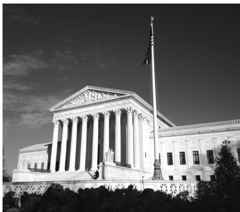
● Trụ sở Tòa án tối cao Mỹ.

Tại bang Missouri, Cơ quan bào chữa công ở bang được thành lập vào năm 1982 trên cơ sở dự thảo sửa đổi lần thứ 6 Hiến pháp Liên bang Mỹ: "Không người nào bị