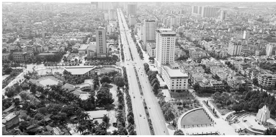
● Bắc Ninh lấy lại đà tăng trưởng kinh tế.

Kết thúc năm 2023, GRDP của tỉnh Bắc Ninh giảm 9,28% so với cùng kỳ. Đây là mức giảm GRDP sâu nhất từ trước đến nay và Bắc Ninh cũng là tỉnh có mức giảm sâu nhất trong 63 tỉnh/thành. Nhưng sau hơn một năm tăng trưởng âm, kinh tế của Bắc Ninh đã ‘thoát đáy’, với tổng sản phẩm trên địa bàn tỉnh (GRDP) 9 tháng đầu năm 2024 tăng 5,52% so cùng kỳ.