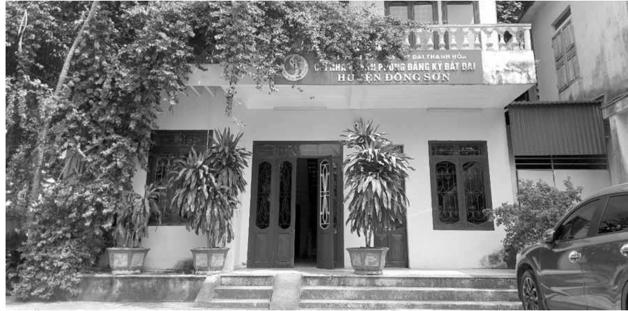
● Chi nhánh VPĐKĐĐ huyện Đông Sơn.

Căn cứ hồ sơ đăng ký cấp GCN thửa đất của bà Bích, kết quả xác minh tại UBND xã, quá trình đo đạc ông Thiệu Sỹ Việt Hưng thực hiện bảo đảm quy định tại điểm 1.1 khoản 1 Điều 11 Thông tư 25/2014/TT-BTNMT về bản