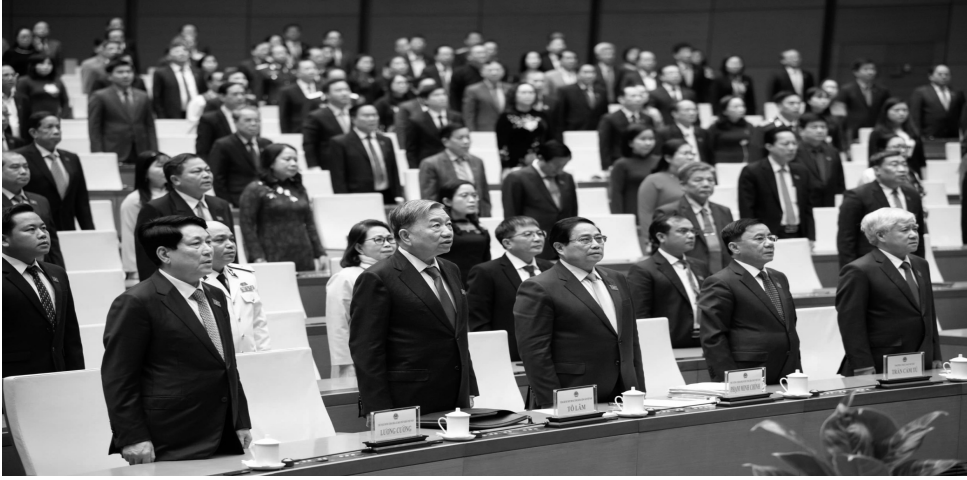
● Các lãnh đạo Đảng, Nhà nước và các đại biểu thực hiện nghi thức chào cờ tại phiên bế mạc.