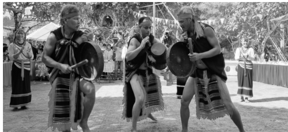
● Tỉnh Quảng Ngãi có hơn 200.000 người đồng bào DTTS, trong đó người Hrê và Co chiếm đa số.

Tuy nhiên, bên cạnh những kết quả đạt được, Thứ trưởng Nông Thị Hà cũng yêu cầu Quảng Ngãi thẳng thắn nhìn nhận một số vấn đề còn tồn tại để kịp thời khắc phục. Trong đó, tỷ lệ hộ nghèo, cận nghèo và nguy cơ tái nghèo còn cao; khả năng tiếp cận dịch vụ còn thấp; tình hình an ninh chính trị, trật tự, an toàn xã hội ở một số địa bàn còn tiềm ẩn yếu tố mất ổn định; việc triển khai chính sách dân tộc có lúc, có nơi chưa thật hiệu quả. Đây chính là vấn đề đặt ra cần được tập trung, quan tâm giải quyết của các cấp, các ngành, của cả hệ thống chính trị. ANH HUY