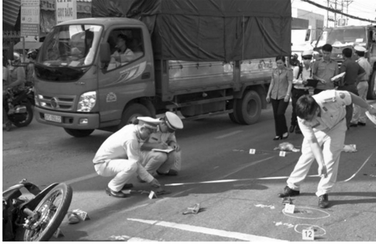
● Quy định mới về dựng lại hiện trường, giải quyết vụ TNGT đường bộ có hiệu lực từ ngày 1/1/2025.

Bộ Công an đã ban hành Thông tư 72/2024/TT-BCA quy định quy trình điều tra, giải quyết tai nạn giao thông (TNGT) đường bộ của Cảnh sát giao thông (CSGT); trong đó, một trong những nội dung đáng chú ý là quy định dựng lại hiện trường vụ TNGT đường bộ và giải quyết vụ việc theo thủ tục hành chính.