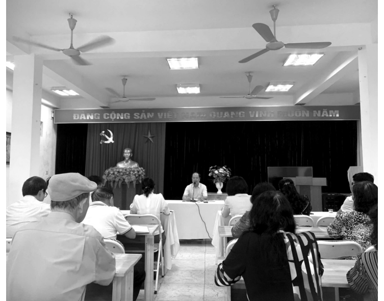
● Ban Thường vụ Thành ủy TP Hà Nội đã ban hành Đề án số 11-ĐA/TU ngày 6/12/2021 về “Nâng cao chất lượng sinh hoạt chi bộ thuộc Đảng bộ TP Hà Nội trong tình hình mới”. Ảnh: một buổi sinh hoạt tại Chi bộ 4, phường Bưởi, quận Tây Hồ.