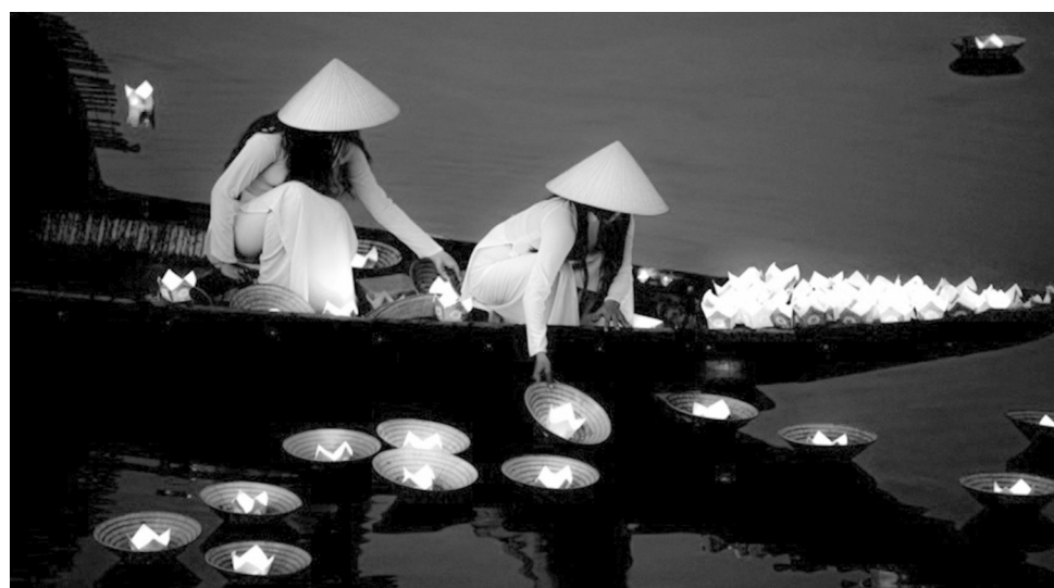
● Thành phố Huế phát triển đô thị "di sản, văn hóa, sinh thái, cảnh quan và thân thiện với môi trường".