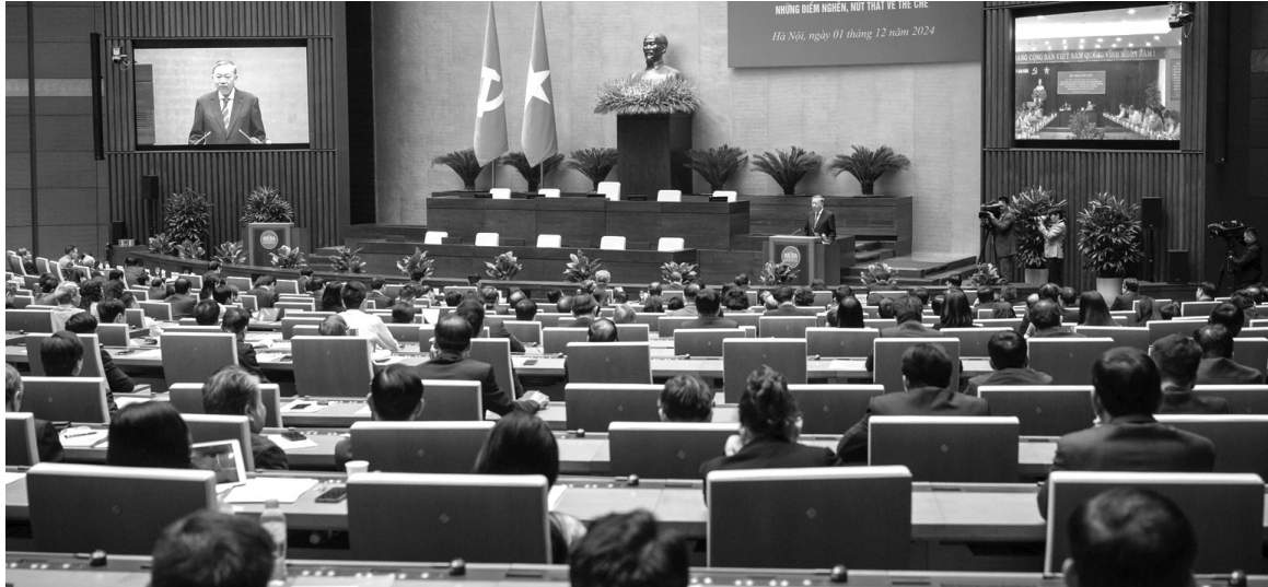
● Tổng Bí thư Tô Lâm cho biết, để đạt mục tiêu phát triển kinh tế - xã hội mà Nghị quyết Đại hội XIII đã đề ra, chúng ta phải đổi mới tư duy, phải quyết đoán, phải bút phá, phải vượt lên chính mình.