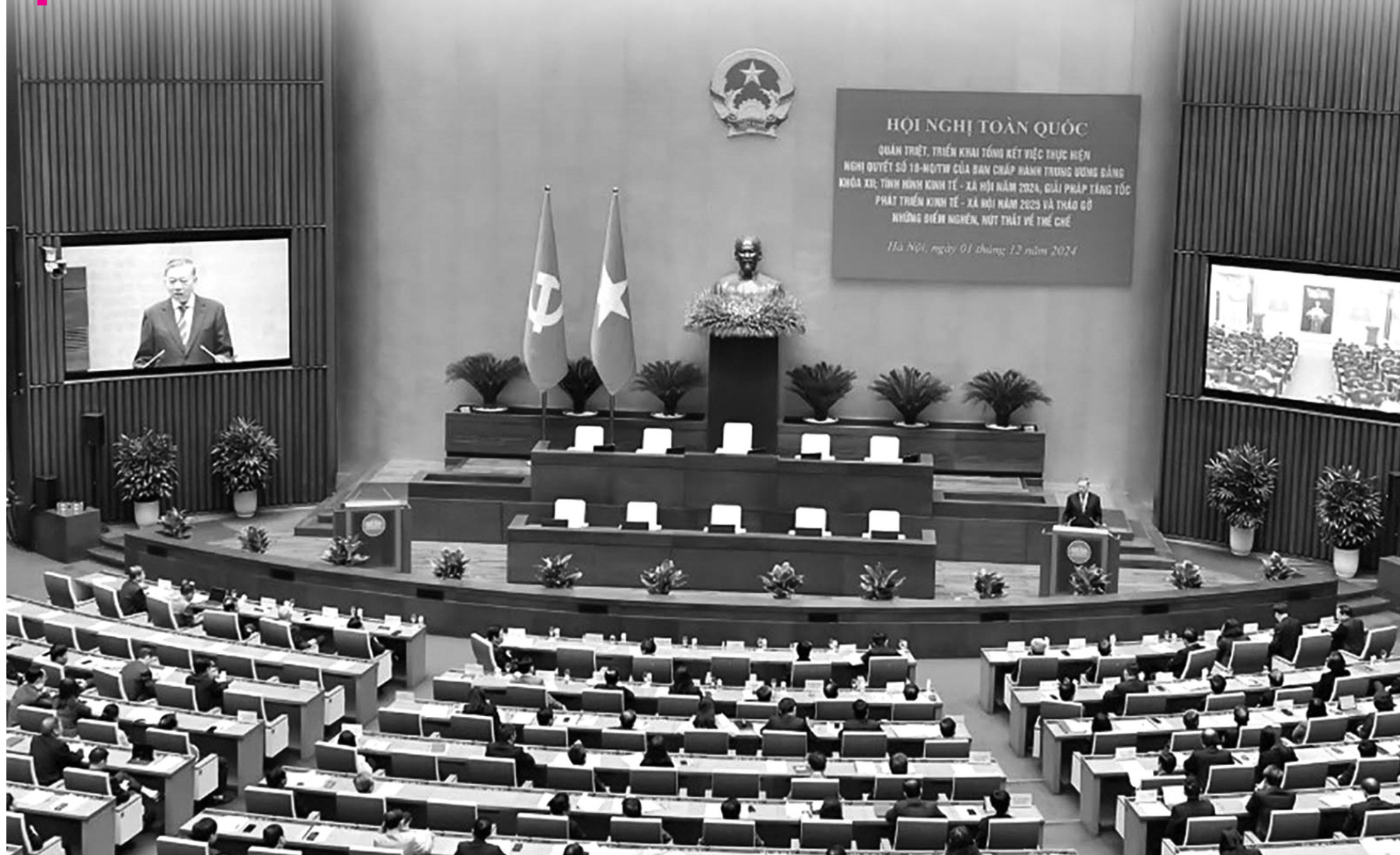
● Bộ Chính trị, Ban Bí thư Trung ương Đảng tổ chức Hội nghị toàn quốc quán triệt, triển khai tổng kết việc thực hiện Nghị quyết số 18-NQ/TW ngày 25/10/2017 của Ban Chấp hành Trung ương Đảng khóa XII về “Một số vấn đề về tiếp tục đổi mới, sắp xếp tổ chức bộ máy của hệ thống chính trị tinh gọn, hoạt động hiệu lực, hiệu quả”; báo cáo tình hình kinh tế - xã hội 11 tháng của năm 2024, giải pháp tăng tốc phát triển kinh tế - xã hội năm 2025; các giải pháp tháo gỡ “điểm nghẽn”, “nút thắt” về thể chế để phát triển.