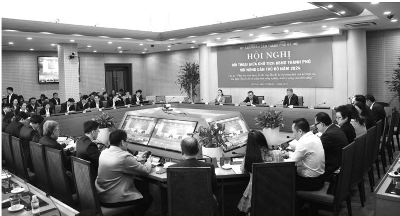
● Tại cuộc đối thoại, có 35 ý kiến, kiến nghị liên quan nông nghiệp, nông thôn được đưa ra. (Ảnh: Minh Anh)

khoảng 10 triệu dân của Thủ đô mà còn hướng tới thị trường toàn cầu".