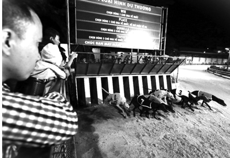
● Một trường đua chó từng hoạt động ở TP Vũng Tàu, tỉnh Bà Rịa - Vũng Tàu.

Sau hơn 7 năm triển khai Nghị định 06/2017/NĐ-CP về kinh doanh đặt cược đua ngựa, đua chó và bóng đá quốc tế, đến nay mới chỉ có một nhà đầu tư kinh doanh đặt cược đua chó được cấp phép. Có quá nhiều vướng mắc liên quan đến pháp lý xung quanh vấn đề đang được xã hội quan tâm này.