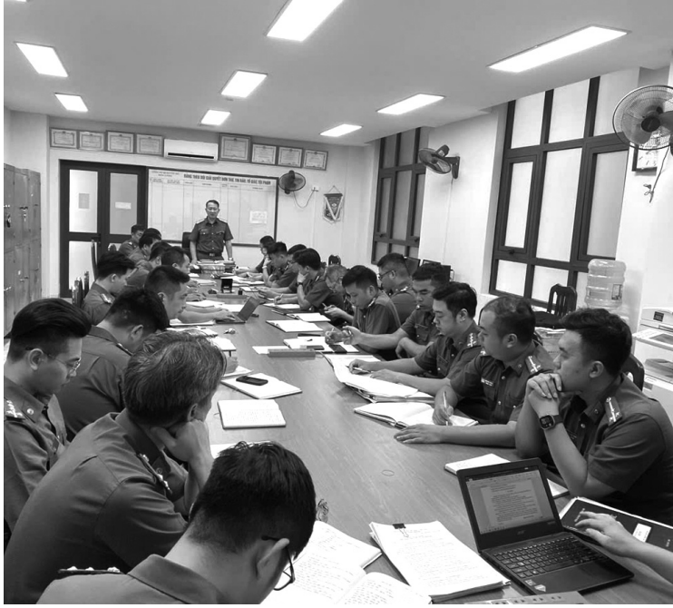
● Năm 2024, 100% đảng viên trong Chi bộ Cảnh sát hình sự, Đảng bộ Công an quận Tây Hồ đăng ký phấn đấu đạt “Đảng viên 4 tốt”.

Sinh thời, Chủ tịch Hồ Chí Minh từng khẳng định: “Chi bộ là gốc rễ của Đảng ở trong quần chúng. Chi bộ tốt thì mọi chính sách của Đảng đều được thi hành tốt”, “Chi bộ mạnh tức là Đảng mạnh”. Thời gian qua, các chi bộ cơ sở thuộc Đảng bộ TP Hà Nội đã và đang triển khai nhiều giải pháp thiết thực, hiệu quả nhằm đổi mới, nâng cao chất lượng sinh hoạt chi bộ, hướng tới mục tiêu chung là xây dựng Đảng vững mạnh.