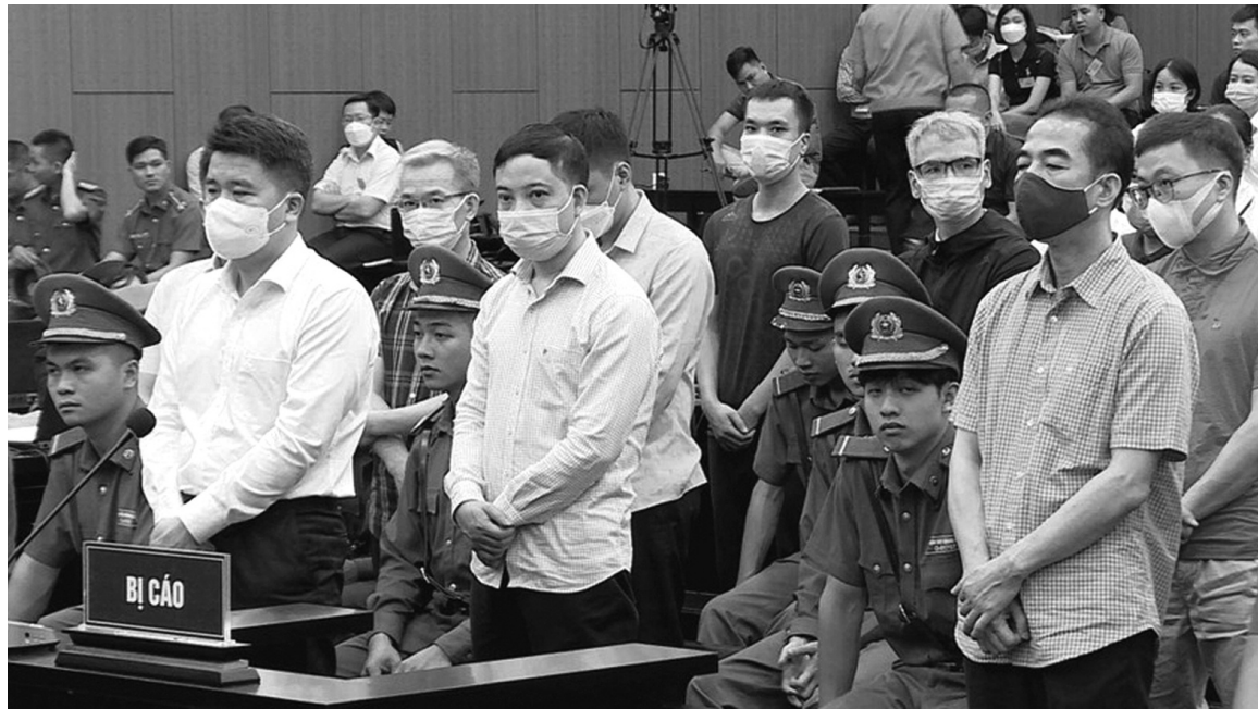
● Các bị cáo tại phiên tòa Chuyển bay giải cứu tháng 7/2023.

Bên cạnh những kết quả đạt được tích cực, Bộ Tư pháp cho biết, công tác thi hành án thu hồi tài sản bị thất thoát, chiếm đoạt trong các vụ án hình sự về tham nhũng, kinh tế thời gian gần đây và đặc biệt trong thời gian tới đây đã và đang phải đối mặt với rất nhiều khó khăn, vướng mắc, thách thức, do phát sinh các vụ án tham nhũng, kinh tế với giá trị phải xử lý lớn, khối lượng đương sự đông. Vụ Tân Hoàng Minh: giá trị phải thi hành hơn 8.600 tỷ