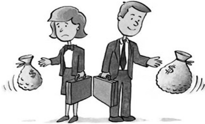
● Gánh nặng việc chăm sóc không lương là một trong những nguyên nhân khiến phụ nữ phải chịu bất bình đẳng trong thu nhập. (Ảnh minh họa: LDG)

Hoặc có quan niệm cho rằng, phụ nữ tham gia thị trường lao động ít hiệu